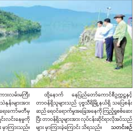
နေပြည်တော်ကောင်စီဥက္ကဋ္ဌနှင့် ပေါ်တွင် တင်ကျန်နေသည့် သဲနုန်းများအား တာဝန်ရှိသူများသည် ပုဗ္ဗသီရိမြို့နယ်ရှိ သပြေစန်နီ နေပြည်တော် စည်ပင်သာယာရေးကော်မတီမှ ဆည် ရောင်ရောက်မှုအခြေအနေကို ကြည့်ရှုစစ်ဆေး စက်ယန္တရားများဖြင့် ဖယ်ရှားရှင်းလင်းနေမှုကို ကြည့်ရှုစစ်ဆေးပြီး လိုအပ်သည်များ မှာကြားသည်။ များ မှာကြားခဲ့ကြောင်း သိရသည်။