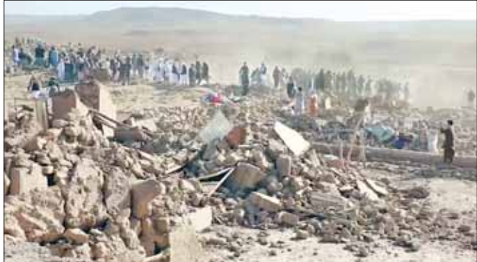
ငလျင်ကြောင့်ဖြစ်ပေါ်ခဲ့သော အပျက်အစီးများကို တွေ့ရစဉ်။