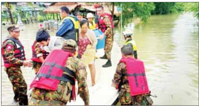
များသို့ ကူညီကယ်ဆယ်ရေး လုပ်ငန်းများ ဆောင်ရွက်ပေးနေမှုများကို ယနေ့တွင် တိုက်ကြီးတပ်နယ်မှ တာဝန်ရှိသူများက သွားရောက်ကြည့်ရှု အားပေးပြီး စားသောက်ဖွယ်ရာများပေးအပ်ကာ လိုအပ်သည့်များ ညှိနှိုင်း ဆောင်ရွက်ပေးခဲ့ကြောင်း သတင်းရရှိသည်။ သတင်းစဉ်

ဖွယ်ရာများ ပေးအပ်ကာ လိုအပ်သည့်များ ညှိနှိုင်းဆောင်ရွက်ပေးသည်။ အလားတူ ရန်ကုန်တိုင်းဒေသကြီး တိုက်ကြီးမြို့နယ် ဥက္ကံမြို့၌ အောက်တိုဘာ ၈ ရက်တွင် မိုးသည်းထန်စွာ ရွာသွန်းခဲ့သဖြင့် ဥက္ကံချောင်းရေများ မြင့်တက်လာမှုကြောင့် အဆိုပါမြို့ရှိ ဥက္ကံရွာမ ကျေးရွာအုပ်စု၊ ရင်းတိုက်လေးပင် ကျေးရွာအုပ်စုနှင့် မင်းရဲကျော်စွာ ရပ်ကွက်တို့မှ ရေဘေးသင့်ပြည်သူများအား ရန်ကုန်တိုင်းစစ်ဌာနချုပ် တိုက်ကြီးတပ်နယ်မှ နယ်မြေခံတပ်မတော်သားများက ရေဘေးကင်းလွတ်သည့် နေရာ