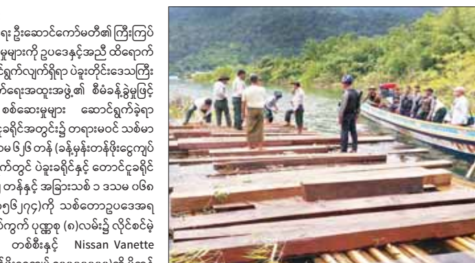
ရန်လင်းအောင်ကားဂိတ် ပိုဒေါင်နှင့် ကားဂိတ်၌ ရပ်တန့်ထားသည့် မော်တော်ယာဉ် နှစ်စီးအား စစ်ဆေးမှုများဆောင်ရွက်ခဲ့ရာ တရားဝင်စာရွက်စာတမ်း အထောက်အထား တင်ပြနိုင်ခြင်းမရှိသည့် Justus Beer ဘူး ၃၂၂၀၊ Esse ဆေးလိပ်ဘူး ၁၆၀၀၀၊ ဆေးရွေး(Shikhar) ၁၇၆၀ ကီလိုဂရမ်၊ High Commissioner ဝီစကီ ပုလင်း ၉၆၀၊ Neem

နေပြည်တော် အောက်တိုဘာ ၉ တရားမဝင်ကုန်သွယ်မှုတိုက်ဖျက်ရေး ဦးဆောင်ကော်မတီ၏ ကြီးကြပ်ကွပ်ကဲမှုဖြင့် တရားမဝင်ကုန်သွယ်မှုများကို ဥပဒေနှင့်အညီ ထိရောက်စွာ တားဆီးအရေးယူနိုင်ရေး ဆောင်ရွက်လျက်ရှိရာ ပဲခူးတိုင်းဒေသကြီး တရားမဝင်ကုန်သွယ်မှု တိုက်ဖျက်ရေးအထူးအဖွဲ့၏ စီမံခန့်ခွဲမှုဖြင့် တာဝန်ကျ ပူးပေါင်းအဖွဲ့က စစ်ဆေးမှုများ ဆောင်ရွက်ခဲ့ရာ အောက်တိုဘာ ၇ ရက်က တောင်ငူခရိုင်အတွင်း၌ တရားမဝင် သစ်မာ ၄ ဒဿမ ၉၀၈ တန်၊ အခြားသစ် ၀ ဒဿမ ၆၂၆ တန် (ခန့်မှန်းတန်ဖိုးငွေကျပ် ၂၅၂၇၅၂၂)နှင့် အောက်တိုဘာ ၈ ရက်တွင် ပဲခူးခရိုင်နှင့် တောင်ငူခရိုင် အတွင်း၌ ကျွန်းသစ် ၇ ဒဿမ ၆၈၂ တန်နှင့် အခြားသစ် ၁ ဒဿမ ၀၆၈ တန် (ခန့်မှန်းတန်ဖိုးငွေကျပ် ၃၈၅၆၂၇၄)ကို သစ်တောဥပဒေအရ လည်းကောင်း၊ ပဲခူးမြို့ ပုဏ္ဏားစုရပ်ကွက် ပုဏ္ဏ (၈)လမ်း၌ လိုင်စင်မဲ့ Mazda Bongo မော်တော်ယာဉ် တစ်စီးနှင့် Nissan Vanette မော်တော်ယာဉ် တစ်စီး(ခန့်မှန်းတန်ဖိုးငွေကျပ် ၄၀၀၀၀၀၀)ကို ပို့ကုန် သွင်းကုန်ဥပဒေအရလည်းကောင်း စုစုပေါင်း ခန့်မှန်းတန်ဖိုးငွေကျပ် ၁၀၃၈၁၉၉၆ကို ဖမ်းဆီးအရေးယူဆောင်ရွက်လျက်ရှိသည်။ အောက်တိုဘာ ၈ ရက်က မန္တလေးတိုင်းဒေသကြီး တရားမဝင်ကုန်သွယ်မှုတိုက်ဖျက်ရေးအထူးအဖွဲ့၏ စီမံခန့်ခွဲမှုဖြင့် တာဝန်ကျ ပူးပေါင်းအဖွဲ့က မန္တလေးမြို့ ၆၇ လမ်း၊ ၁၄၅ လမ်း နှင့် ၁၄၆ လမ်းကြားရှိ