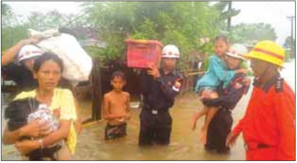
မိုးသည်းထန်စွာ ရွာသွန်းမှုကြောင့် အောက်တိုဘာ ၉ ရက် နံနက်ပိုင်းတွင် သတိုမြို့နယ် သုဝဏ္ဏဝတီမြို့ ကျိုက္ကော်ရပ်ကွက် မြို့မဈေးအရှေ့မှ စတင်၍ ပေ ၃၀၀၀ ကျော်အထိ ရန်ကုန်-မော်လမြိုင် အဝေးပြေးလမ်းမကြီးပေါ်တွင် ရေကျော်ရေလှမ်းမိုးမှုများ ဖြစ်ပေါ်နေသည်ကို တွေ့မြင်ရစဉ်။ ခွန်(ဝင်း/ပ)