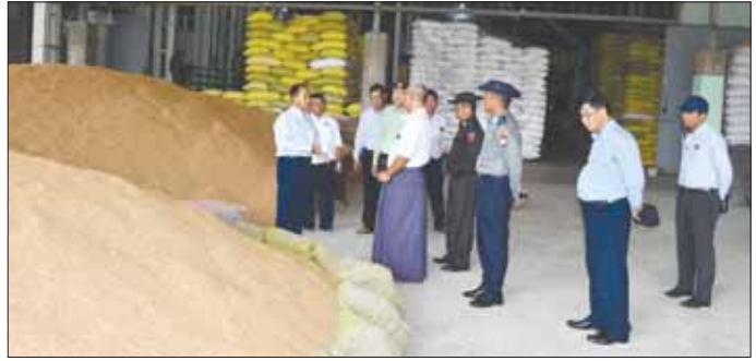
ရှင်းလင်းဆောင်ရွက်ပေးရန် အဆောက်အအုံ ပျက်စီး နေမှုကို လိုက်လံကြည့်ရှုစစ်ဆေးပြီး နန်းတော် တာဝန်ခံနှင့် တည်ဆောက်ရေးတာဝန်ခံတို့မှ ရှင်းလင်းဆောင်ရွက်ပေးရန် အလျား ၆၅ ပေ၊ အနံ ၃၈ ပေ အာရုံစိုက်ထပ်အဆောက်အအုံသစ် ဆောက်လုပ်မည့် လုပ်ငန်းအခြေအနေများကို ရှင်းလင်းတင်ပြကြသည်။ တိုင်းဒေသကြီး(ပြန်/ဆက်)

အရည်အသွေးမြင့်မားစေရန် ကြိုးပမ်းဆောင်ရွက်မှု နှင့် နိုင်ငံစီးပွားဖြစ်တင်ရေးရန်ပုံငွေမှ ချေးငွေများ ရရှိကာ လုပ်ငန်းများတိုးချဲ့လုပ်ကိုင်၍ ဈေးကွက်သို့ ကုန်ပစ္စည်းလုံလောက်အောင် ထုတ်လုပ်တင်ပို့ ရောင်းချနေမှု၊ လျှပ်စစ်ဓာတ်အားနှင့် လုပ်သားရရှိမှု၊ သဘာဝပတ်ဝန်းကျင် မထိခိုက်စေရေးအတွက် ထိန်းသိမ်းဆောင်ရွက်နေမှု အခြေအနေများနှင့် တိုင်းဒေသကြီးအစိုးရအဖွဲ့မှ ပံ့ပိုးဆောင်ရွက်ပေးရန် လိုအပ်သည်များကို တင်ပြကြရာ တိုင်းဒေသကြီး ဝန်ကြီးချုပ်က ဆောင်ရွက်နေသည့် လုပ်ငန်းများနှင့် တင်ပြချက်များအပေါ် လိုအပ်သည်များကို တာဝန် ရှိသူများနှင့်ဖြည့်ဆည်းပေးစီမံဆောင်ရွက်ပေးကာ စက်ရုံများအတွင်း လိုက်လံကြည့်ရှုစစ်ဆေးသည်။ ဆက်လက်၍ တိုင်းဒေသကြီးဝန်ကြီးချုပ်နှင့် တာဝန်ရှိသူများသည် ရွှေဘိုမြို့ ရွှေဘိုရတနာမင်္ဂလာ နန်းတော်သို့ရောက်ရှိရာ နန်းတော်အတွင်းရှိ