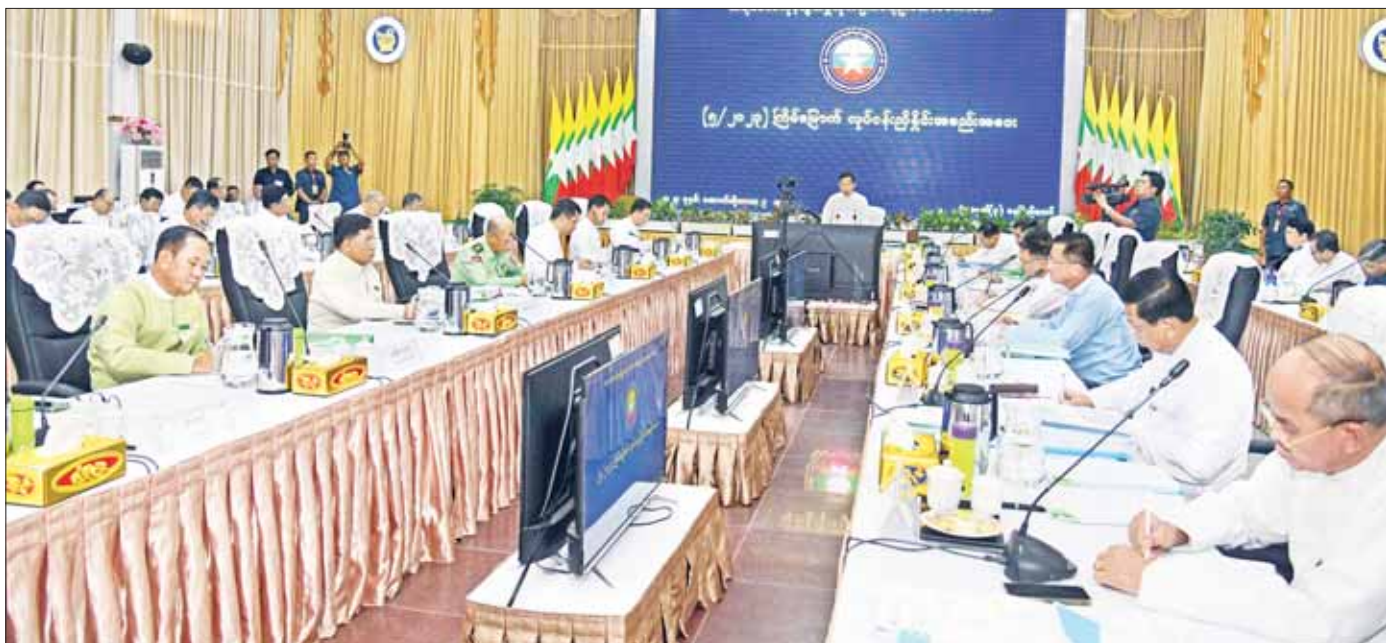
တရားမဝင်ကုန်သွယ်မှုတိုက်ဖျက်ရေး ဦးဆောင်ကော်မတီဥက္ကဋ္ဌ နိုင်ငံတော်စီမံအုပ်ချုပ်ရေးကောင်စီ ဒုတိယဥက္ကဋ္ဌ ဒုတိယဝန်ကြီးချုပ် ဒုတိယဗိုလ်ချုပ်မှူးကြီး စိုးဝင်း တရားမဝင်ကုန်သွယ်မှုတိုက်ဖျက်ရေး ဦးဆောင် ကော်မတီလုပ်ငန်းညှိနှိုင်းအစည်းအဝေး (၅/၂၀၂၃) တွင် အမှာစကားပြောကြားစဉ်။