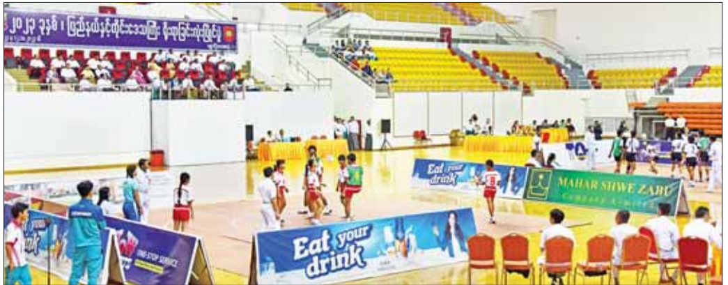
နိုင်ငံတော်စီမံအုပ်ချုပ်ရေးကောင်စီအဖွဲ့ဝင်များနှင့် ပြည်ထောင်စုဝန်ကြီးများ ရန်ကုန်တိုင်းဒေသကြီးနှင့် ဧရာဝတီတိုင်းဒေသကြီးအသင်းတို့၏ ယှဉ်ပြိုင်နေမှု ကို ကြည့်ရှုအားပေးစဉ်။

အခမ်းအနားတွင် အားကစားနှင့် လူငယ်ရေးရာ ဝန်ကြီးဌာန ပြည်ထောင်စုဝန်ကြီး ဦးမင်းသိန်းဇံ က ပြိုင်ပွဲဝင်ရောက်ယှဉ်ပြိုင်ကြမည့် ပြည်နယ်နှင့် တိုင်းဒေသကြီးအသီးသီးမှ ခြင်းလုံးအားကစားသမား