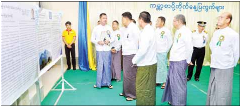
နိုင်ငံတော်စီမံအုပ်ချုပ်ရေးကောင်စီအဖွဲ့ဝင်၊ ဒုတိယဝန်ကြီးချုပ်နှင့် ပြည်ထောင်စုဝန်ကြီး ဗိုလ်ချုပ်ကြီး မြထွန်းဦးနှင့်အဖွဲ့ဝင်များ (၁၄၉)နှစ်မြောက် ကမ္ဘာ့စာပို့တိုက်နေ့အထိမ်းအမှတ် ပြခန်းအတွင်း ပြသထားသည်များကို ကြည့်ရှုအားပေးစဉ်။

အခမ်းအနားတွင် နိုင်ငံတော်စီမံအုပ်ချုပ်ရေးကောင်စီအဖွဲ့ဝင်၊ ဒုတိယဝန်ကြီးချုပ်နှင့် ပြည်ထောင်စုဝန်ကြီး ဗိုလ်ချုပ်ကြီး မြထွန်းဦးက ယနေ့ကျင်းပသည့်အခမ်းအနားသည် ကမ္ဘာ့စာပို့တိုက်သမဂ္ဂ (Universal Postal Union-UPU) ၏ (၁၄၉) နှစ်ပြည့် အခမ်းအနားဖြစ်ကြောင်း၊ ကမ္ဘာ့စာပို့တိုက်သမဂ္ဂ (UPU) တွင် အဖွဲ့ဝင် ၁၉၂ နိုင်ငံရှိပြီး အဖွဲ့ဝင်နိုင်ငံများအတွက် လိုအပ်သည့်နည်းပညာအကူအညီများ၊ စာပို့လုပ်ငန်းဆောင်ရွက်ရာတွင် လိုက်နာရမည့် စည်းမျဉ်း၊ စည်းကမ်းများကို ထုတ်ပြန်၍ အဖွဲ့ဝင်နိုင်ငံများအကြား ပူးပေါင်းဆောင်ရွက်ရေးကို ဦးတည်ဆောင်ရွက်ပေးသည့် A Truly Universal Network အဖြစ် ရပ်တည်နေသည့် အဖွဲ့အစည်းဖြစ်ကြောင်း၊ ကိုစစ် ၁၉ ကပ်ရောဂါကာလအတွင်း စာပို့ကွန်ရက်များ ပုံမှန်မလည်ပတ်နိုင်သော်လည်း ဒစ်ဂျစ်တယ်နှင့် အိုင်စီတီနည်းပညာများကို စာပို့တိုက်ဝန်ဆောင်မှုလုပ်ငန်းများတွင် အကျိုးရှိအသုံးပြုနိုင်သည့်အတွက် အများပြည်သူကို ဝန်ဆောင်မှုများ ဆက်လက်ဆောင်ရွက်ပေးနိုင်ခဲ့သည်ကို တွေ့ရှိရကြောင်း၊ စာပို့တိုက်ဝန်ဆောင်မှုအပါအဝင် ဝန်ဆောင်မှုလုပ်ငန်းများ၏