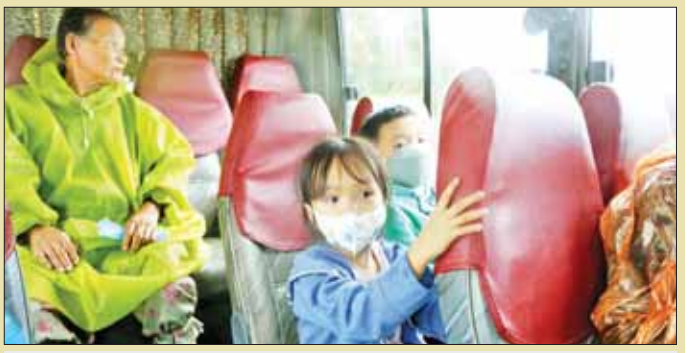
ဗီယက်နမ်နိုင်ငံအလယ်ပိုင်း ကောင်နမ်ပြည်နယ်တွင် မုန်တိုင်းကြောင့် သက်ကြီးရွယ်အိုနှင့်အတူ ကလေးငယ်နှစ်ဦးအား ဘတ်စ်ကားဖြင့် ဘေးလွတ်ရာသို့ ပြောင်းရွှေ့နေမှုကို တွေ့ရစဉ်။

သိရသည်။ ဗီယက်နမ်နိုင်ငံတွင် ဖြစ်ပွားသော သဘာဝ ဘေးအန္တရာယ်တစ်ခုစီတိုင်းက ကလေးငယ်များ၏ ကျန်းမာရေးကိုသာမက ၎င်းတို့၏ ဖွံ့ဖြိုးတိုးတက်မှု များကိုပါ သက်ရောက်မှုရှိသောကြောင့် ဆိုးရွားသော ရာသီဥတုအကျပ်အတည်းကို ကလေးငယ်များ အနေဖြင့် ပြင်းပြင်းထန်ထန် ထိတွေ့ခံစားနေရ ကြောင်း ဗီယက်နမ်နိုင်ငံဆိုင်ရာ ယူနီဆက်စ် ကိုယ်စားလှယ် ရာနာဖလောင်းဝါးစံက ပြောသည်။ ဆင်ယွာ