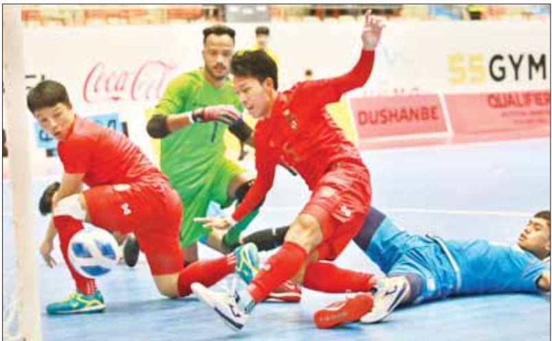
အာရှဖလားဖူဆယ်ပြိုင်ပွဲတွင် မြန်မာနှင့် အိန္ဒိယအသင်းတို့ ယှဉ်ပြိုင်ကစားစဉ်။

ရန်ကုန် အောက်တိုဘာ ၉ ၂၀၂၄ အာရှဖလား ဖူဆယ်ခြေစစ်ပွဲ အုပ်စု (E) ဒုတိယနေ့ကို အောက်တိုဘာ ၉ ရက်က တာဂျစ်ကစွတန် နိုင်ငံ၌ ဆက်လက်ကျင်းပရာ မြန်မာအသင်းက အိန္ဒိယအသင်းကို ငါးဂိုး - နှစ်ဂိုးဖြင့် အနိုင်ရပြီး နိုင်ပွဲဆက်ခဲ့သည်။ မြန်မာအသင်းသည် ယခုပွဲအနိုင်ရခဲ့သဖြင့် နှစ်ပွဲဆက်အနိုင်ရလဒ်နှင့်အတူ ခြေစစ်ပွဲအောင်မြင်ရန် နီးစပ်လာခဲ့သည်။ ပထမပွဲတွင် တာဂျစ်ကစွတန်ကို ဂိုးပြတ်အရေးနိမ့်ထားသည့် အိန္ဒိယအသင်းသည် ရလဒ်ကောင်းရယူနိုင်ရန် ကြိုးပမ်းသော်လည်း ရှုံးပွဲဆက်ခဲ့ခြင်းဖြစ်သည်။ မြန်မာအသင်းအတွက် အနိုင်ဂိုးများကို မျိုးသက်အောင်က စာမျက်နှာ ၉ ကော်လံ ၁ ဖ