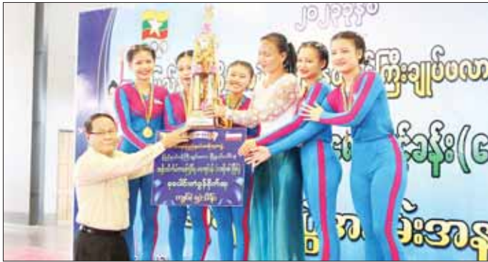
တို့တွင် ဆုရရှိကြသည့်အသင်းများကို တစ်ဦးချင်း အသင်းအား စုပေါင်းတံခွန်စိုက်ဆုပေးလားနှင့် ငွေသား လည်းဆွဲဆု၊ ငွေသားဆုနှင့် ဆုပေးလားများပေးအပ် ချီးမြှင့်ကြကာ ပြည်နယ်ဝန်ကြီးချုပ် ဦးစောမြင့်ဦးက စုပေါင်းတံခွန်စိုက်ဆုရရှိသော ဘားအံမြို့နယ် စောမျိုးမင်းသိန်း(ပြန်/ဆက်)

တရားသူကြီးချုပ်ဒေါ်ခင်ဆွေထွန်း၊ ပြည်နယ်အစိုးရ အဖွဲ့ဝင်များနှင့် ၎င်းတို့၏ဇနီးများ၊ ကျောင်းသား ကျောင်းသူများ၊ အားကစားဝါသနာရှင်များက ကြည့်ရှုအားပေးကြသည်။ ထို့နောက် ဆုချီးမြှင့်ပွဲအခမ်းအနားကိုဆက်လက် ကျင်းပရာ ပြည်နယ်အားကစားနှင့် ကာယ ပညာဦးစီးဌာန ညွှန်ကြားရေးမှူးဦးစိုးနိုင်က ပြိုင်ပွဲ တွင် အားဖြည့်ကူညီဆောင်ရွက်ပေးသောကြက်ခြေနီ သူနာပြုတပ်ဖွဲ့နှင့် ဦးစွာအဖွဲ့တို့ကို ဂုဏ်ပြုဆုများ ပေးအပ်ချီးမြှင့်ပြီး ပြည်နယ်တရားလွှတ်တော်တရား သူကြီးချုပ်၊ ပြည်နယ်ဝန်ကြီးချုပ်၏ဇနီးနှင့် ပြည်နယ် အစိုးရအဖွဲ့ဝင်များ၏ ဇနီးများက ကိုးယောက်တွဲ ပြိုင်ပွဲ၊ သုံးယောက်တွဲပြိုင်ပွဲနှင့် တစ်ဦးချင်းပြိုင်ပွဲ