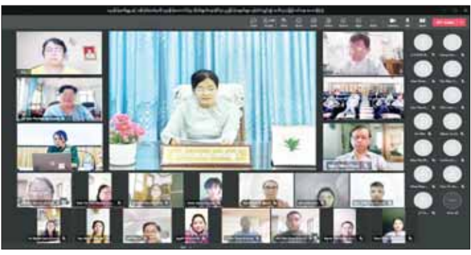
ဦးစွာ ဒုတိယစာရင်းစစ်ချုပ် မြန်မာနိုင်ငံစာရင်း ကောင်စီ ဒုတိယဥက္ကဋ္ဌ(၁) ဒေါ်နိုင်သက်ဦးက Video Message ပေးပို့၍ အဖွင့်အမှာစကားပြောကြားရာတွင် ယနေ့ဟောပြောပွဲတွင် ငွေကြေးဆိုင်ရာ စုံစမ်း ထောက်လှမ်းရေးအဖွဲ့နှင့် မြန်မာနိုင်ငံစာရင်း ကောင်စီတို့မှထုတ်ပြန်ထားသည့် ငွေရေးကြေးရေး မဟုတ်သော စီးပွားရေးလုပ်ငန်းများနှင့် ကျွမ်းကျင်မှု ဆိုင်ရာ အသင်းမှူးဝမ်းကျောင်းလုပ်ငန်းများ၊ စာရင်းလုပ်ငန်း လုပ်ကိုင်သူများအတွက် AML/ CFT ဆိုင်ရာညွှန်ကြားချက်များကို မြန်မာနိုင်ငံစာရင်း ကောင်စီရုံး တာဝန်ခံအရာရှိက ဟောပြောပို့ချသွား မည်ဖြစ်ကြောင်း၊ စာရင်းလုပ်ငန်း လုပ်ကိုင်သူများ

မြန်မာနိုင်ငံစာရင်းကောင်စီနှင့် မြန်မာနိုင်ငံလက်မှတ် ရ ပြည်သူ့စာရင်းကိုင်များအသင်းတို့ ပူးပေါင်း၍ ငွေကြေးခဝါချမှုတိုက်ဖျက်ရေး (Anti-Money Laundering- AML) နှင့် အကြမ်းဖက်မှုကို ငွေကြေး ထောက်ပံ့မှုတိုက်ဖျက်ရေး (Combating Financing of Terrorism-CFT) ဆိုင်ရာ ညွှန်ကြားချက်များနှင့် စပ်လျဉ်းသည့် အသိပညာမြှင့်တင်ရေး ဟောပြောပွဲကို ယနေ့ နံနက် ၈ နာရီတွင် ရန်ကုန်မြို့ရှိ အဆင့်မြင့် စာရင်းကိုင်နှင့် စာရင်းစစ်သင်တန်းကျောင်း နဝဒေး ခန်းမ၌ ကျင်းပသည်။