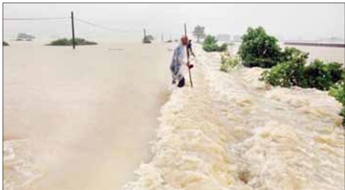
ပဲခူးမြို့နယ် ပဲခူးဘူတာနှင့် ရွှေလှေဘူတာကြား မိုင်တိုင်အမှတ် (၅၀/၃-၇)တွင် ရထားလမ်းပေါ် ရေကျော်နေစဉ်။

ပျဉ်ပုံကြီးဘူတာ၌ နံနက် ၈ နာရီတွင်လည်းကောင်း၊ ပဲခူး-မော်လမြိုင်လမ်းပိုင်းရှိ မော်လမြိုင်မှ ထွက်ခွာလာသော အမှတ် (၈၂)အစုန် လူစီးအမြန်ရထားသည် ဝေါဘူတာ၌ မွန်းလွဲ ၂ နာရီခွဲတွင်လည်းကောင်း၊ ရောက်ရှိနေပြီး ရေပြန်လည် ကျဆင်းမည့် အချိန်ကို စောင့်ဆိုင်းလျက်ရှိသည်။ ရထားလမ်းရေကျော်တက်မှု ကြာမြင့်နိုင်မည့် အခြေအနေကြောင့် မြန်မာ့မီးရထား တာဝန်ရှိသူများက ပျဉ်ပုံကြီးဘူတာတွင်ရှိနေသော အမှတ် (၄)အစုန် လူစီးအမြန်ရထားမှ ခရီးသည် ၃၀၀ ခန့်ကို နေ့လယ်စာထမင်းဘူးများ၊ သောက်ရေ သုံးရေများ စီစဉ်ဆောင်ရွက်ပေးခဲ့သည်။ ထို့ပြင် ပဲခူးတိုင်းဒေသကြီးအစိုးရ၏ စီစဉ်