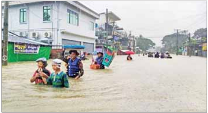
နယ်မြေခံတပ်မတော်သားများ၊ မြန်မာနိုင်ငံ ရဲတပ်ဖွဲ့ဝင်များ၊ မီးသတ်တပ်ဖွဲ့ဝင်များ၊ လူမှုရေးအသင်းအဖွဲ့များက ပဲခူးမြို့ပေါ်ရပ်ကွက်များမှ ရေဘေးသင့်ပြည်သူများအား ယာယီကယ်ဆယ်ရေးစခန်းများသို့ ရွှေ့ပြောင်းကူညီပေးစဉ်။

စောင့်ရှောက်မှုလုပ်ငန်းများ ဆောင်ရွက်ပေးသည်။ ထိုသို့ဆောင်ရွက်နေမှုများကို ပဲခူးတိုင်းဒေသကြီး ဝန်ကြီးချုပ် ဦးမျိုးဆွေဝင်း၊ တိုင်းစစ်ဌာနချုပ်ကွပ်ကဲမှု အောက် ပဲခူးတပ်နယ်မှ တာဝန်ရှိသူများက သွားရောက်ကြည့်ရှုအားပေးပြီး ထမင်းဘူးများနှင့် ထောက်ပံ့ငွေများ ပေးအပ်ကာ လိုအပ်သည်များ ညှိနှိုင်းဆောင်ရွက်ပေးခဲ့ကြောင်း သတင်းရရှိသည်။ သတင်းစဉ်