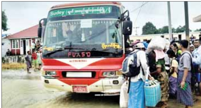
အမှတ် (၄)အစုန်ရထားစီးခရီးသည်များအား ပျဉ်ပုံကြီးဘူတာမှ ရန်ကုန်ဘူတာကြီးသို့ မော်တော်ယာဉ်ဖြင့် ရွှေ့ပြောင်းသယ်ယူပို့ဆောင်ပေးစဉ်။

ကြီးကြပ်မှုဖြင့် မွန်းလွဲ ၂ နာရီတွင် အဆိုပါရထားပေါ်၌ရှိနေသော ရန်ကုန်သို့ သွားရောက်မည့် ခရီးသည် ၂၂၅ ဦးကို မော်တော်ယာဉ် ငါးစီးဖြင့် ပျဉ်ပုံကြီးမှ ရန်ကုန်ဘူတာကြီးအထိ ဆက်လက်ရွှေ့ပြောင်းပို့ဆောင်ပေးလျက်ရှိသည်။ ထို့အတူ အမှတ် (၈၂)အစုန် အမြန်ရထားတွဲ ဆိုင်းအား ကလီဘူတာသို့ ရွှေ့ပြောင်းပြီးနောက် ခရီးသည် ၅၇၀ ကို မော်တော်ယာဉ် ၁၀ စီးဖြင့် ရန်ကုန်ဘူတာကြီးသို့ ရွှေ့ပြောင်းပို့ဆောင်ပေးနိုင်ရေး စီစဉ်ဆောင်ရွက်လျက်ရှိကြောင်း သိရသည်။ အဆိုပါရထားလမ်းရေကျော်တက်မှု အခြေအနေအရ ရထားများ ဖြတ်သန်းသွားလာနိုင်ခြင်း မရှိသောကြောင့် မြန်မာ့မီးရထားအနေဖြင့် ယနေ့ညနေပိုင်း