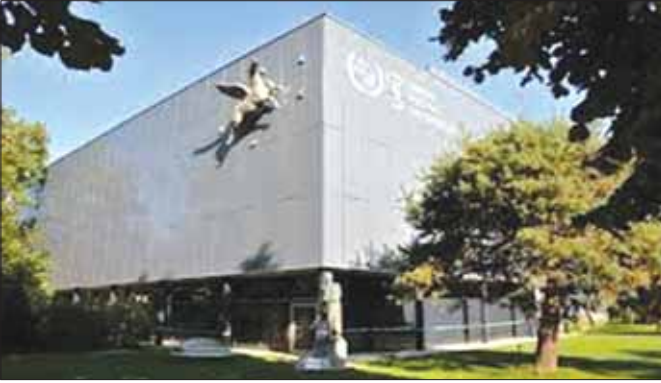
ဆွစ်ဇာလန်နိုင်ငံ ဘန်းမြို့ရှိ ကမ္ဘာ့စာပို့တိုက်သမဂ္ဂဌာနချုပ်ရုံးကို တွေ့ရစဉ်။

UPU သည် ကမ္ဘာ့နိုင်ငံအသီးသီး၏ လိပ်စာ တပ်ညွှန်းရာတွင် စည်းစနစ်တကျရှိစေရေး နိုင်ငံ အသီးသီး၏ စာရေးသားပုံအလေ့အထများအလိုက် နည်းစနစ်များ သတ်မှတ်ကာ အသိအမှတ်ပြု လက်မှတ်များ ပေးအပ်လျက်ရှိပါသည်။ မြန်မာ့ စာပို့တိုက်လုပ်ငန်းမှလည်း ယင်းအသိအမှတ်ပြု