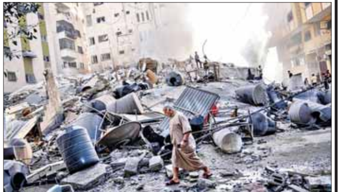
လည်းအစ္စရေးဘက်မှ ဒရုန်းများဖြင့် ပြန်လည်တိုက်ခိုက်ခဲ့သည်။ ဟစ်ဇ်ဘိုလာအုပ်စုမှသတ်မှတ်ထားသည့် အစ္စရေးနိုင်ငံတောင်ပိုင်းနှင့် မြောက်ပိုင်း နှစ်ခုစလုံး တိုက်ခိုက်ခံရမည်ဖြစ်သည်။ ဒေသတွင်း တင်းမာမှုများပို၍ အရှိန်ကောင်းလာမည်ကို စိုးရိမ်နေကြသည်။

အစ္စရေးနိုင်ငံ မြောက်ပိုင်း အိမ်နီးချင်း လက်ဘနွန်တွင် အခြေစိုက်သည့် ဟစ်ဇ်ဘိုလာအုပ်စုသည်လည်း အစ္စရေးနိုင်ငံ မြောက်ပိုင်းရှိ စစ်ဘက်နေရာများကို ခုံးကျည်များဖြင့် ပစ်ခတ်ခဲ့ကြောင်း အောက်တိုဘာ ၈ ရက်တွင် ကြေညာခဲ့သည်။ ဟစ်ဇ်ဘိုလာအုပ်စု အခြေစိုက်ရာနေရာသို့