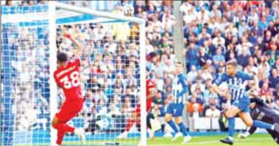
ဘရိတ်တန်အသင်းဘက်သို့ လီဗာပူးကစားသမား ဂရာဗင်ဘာဂ်၏ ကန်သွင်းချက် တိုင်ထိထွက်သွားစဉ်။

ပရိမိယာလိဂ်ပွဲစဉ် (၈) ပွဲစဉ်များတွင် အောက်တိုဘာ ၈ ရက် ည ၇ နာရီခွဲက တစ်ချိန်တည်း ယှဉ်ပြိုင်ကစားခဲ့သည့် လီဗာပူး၊ နယူးကာဆယ်နှင့် အက်စ်တွန်ဗီလာအသင်းတို့ သရေကျခဲ့သည်။ ဘရိတ်တန်နှင့် လီဗာပူးအသင်းပွဲစဉ်မှာ ခြေစွမ်းထက်မြက်သည့် အသင်းနှစ်သင်း တွေ့ဆုံမှုအပြင် နှစ်သင်းကြား ရမှတ်ကွာဟမှုမှာလည်း ကျဉ်းမြောင်းသည့်အတွက် ပွဲစသည်နှင့် တစ်ပြိုင်နက် စာမျက်နှာ ၁၅ ကော်လံ ၁ ○