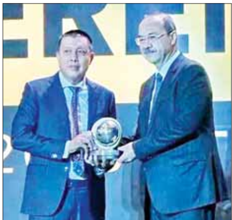
ဥဘောက်ကစူတန်နိုင်ငံ ဝန်ကြီးချုပ် Abdulla Aripov အာရှဘောလုံးအဖွဲ့ချုပ် စီနီယာဒုက္ကဋ္ဌ၊ မြန်မာနိုင်ငံဘောလုံးအဖွဲ့ချုပ် ဒုက္ကဋ္ဌ ဦးစော်စော်ကို အမှတ်တရလက်ဆောင်ပေးအပ်စဉ်။