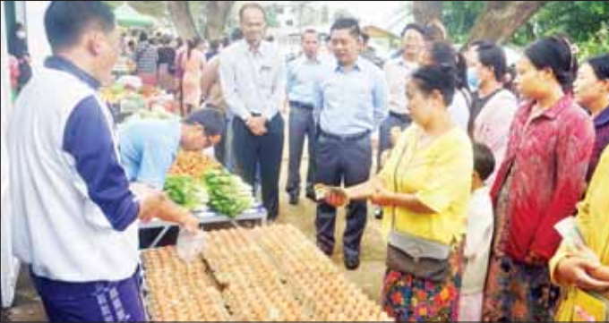
လွတ်ဈေးသို့ ယနေ့ နံနက်ပိုင်းက တွင် ပြည်နယ်ဝန်ကြီးချုပ်က ဝေးရောက်ကြည့်ရှုအားပေးသည်။ အခွန်လွတ်ဈေး၌ ရောင်းချလျက် ရှိသည့် ဆန်နှင့်ဆီများကို ပြင်ပ ဈေးနှုန်းနှင့် နှိုင်းကာလ ပေါက်ဈေးထက် သက်သာသော နှုန်းထားဖြင့် ရောင်းချပေးစေလို

လှိုင်ကော် အောက်တိုဘာ ၈ ကယားပြည်နယ် ဝန်ကြီးချုပ် ဦးစောမျိုးတင်သည် ဒေသခံ ပြည်သူများ၊ ဌာနဆိုင်ရာဝန်ထမ်း များ၏ စားသောက်ရေးအဆင်ပြေ စေရန်၊ ပြည်နယ်အတွင်း ကုန် ဈေးနှုန်း၊ တည်ငြိမ်မှုရှိစေရန်နှင့် အခြေခံ စားသောက်ကုန်ပစ္စည်း များကို သက်သာသောဈေးနှုန်း များဖြင့် ဝယ်ယူစားသုံးနိုင်ရေး အတွက် ကယားပြည်နယ်အစိုးရ အဖွဲ့၏ ညွှန်ကြားမှုဖြင့် အကောင် အထည်ဖော် ဆောင်ရွက်လျက် ရှိသည့် လှိုင်ကော်မြို့ ဒေါ်ဥဉှာ ရပ်ကွက်ရှိ ကိုယ်တိုင်ထုတ်၊ ကိုယ်တိုင်ရောင်းသူများ အခွန်