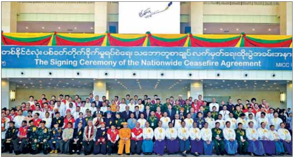
၂၀၁၅ အောက်တိုဘာ ၁၅ ရက်က နေပြည်တော်၌ ကျင်းပသည့် NCA လက်မှတ်ရေးထိုးပွဲတွင် နိုင်ငံတော်သမ္မတ ဦးသိန်းစိန်၊ တပ်မတော်ခေါင်းဆောင်များနှင့် တိုင်းရင်းသားခေါင်းဆောင်များ အတူတကွ မှတ်တမ်းတင်ပုံရိပ်ကူးစဉ်။

❖ ၁၉၈၈ ခုနှစ်နောက်ပိုင်း တပ်မတော်အစိုးရလက်ထက်တွင် မြန်မာ့ ငြိမ်းချမ်းရေးလုပ်ငန်းစဉ်များသည် ထူးထူးကဲကဲ အောင်မြင်မှုများ ရရှိလာ သည်။ ၁၉၈၉ ခုနှစ်တွင် ကိုးကန့်တိုင်းရင်းသား လက်နက်ကိုင်အဖွဲ့မှ ခေါင်းဆောင်များသည် ဗမာပ လက်အောက်မှ ခွဲထွက်ပြီး ကိုးကန့်ဒေသဖွံ့ဖြိုးရေး၊ ကိုးကန့်တိုင်းရင်းသားလူမျိုးများ၏ စားဝတ်နေရေး ချောင်လည်ရေးတို့အတွက် တပ်မတော်နှင့်လက်တွဲ ရှိဆောင်ရွက်လိုသည်ဟူသော ကမ်းလှမ်းမှုနှင့်အတူ ပဏာမတွေ့ဆုံဆွေးနွေးမှုများကို စတင်နိုင်ခဲ့ကြသည်။ ကိုးကန့်ဒေသ၏ ငြိမ်းချမ်းရေးဖြစ်စဉ်ကို အားကျလာကြသော 'ဝ'တိုင်းရင်းသားခေါင်းဆောင် များကလည်း တပ်မတော်အစိုးရနှင့်ငြိမ်းချမ်းရေး ဆွေးနွေးလိုကြောင်း ဆက်သွယ်မှုများအရ ပဏာမ ဆွေးနွေးမှုများကို စတင်နိုင်ခဲ့ပြန်သည်။ တစ်ဖန် ကိုးကန့်ဒေသနှင့် 'ဝ'ဒေသတို့မှ တိုင်းရင်းသားခေါင်းဆောင်များသည် နိုင်ငံတော် အစိုးရနှင့် ငြိမ်းချမ်းရေးရယူပြီး ဒေသဖွံ့ဖြိုးရေး လုပ်ငန်းများဆောင်ရွက်လာမှုကို အခြားသော တိုင်းရင်းသား လက်နက်ကိုင်အဖွဲ့အစည်းများက လည်း အားကျလာပြီး ကမ်းလှမ်းလာခဲ့ကြရာ -