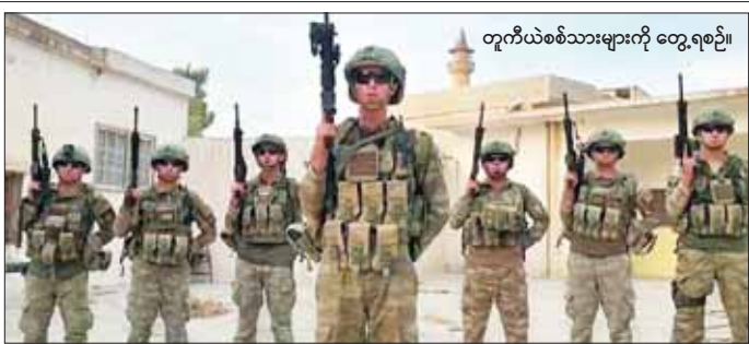
တူကီယံစစ်သားများကို တွေ့ရစဉ်။

၁၀ မိနစ်က မြောက်ပိုင်း မိုဆူးလ် မြို့အရှေ့တောင်ဘက် ၆၀ ကီလိုမီတာခန့်အကွာ မက်ဟ်မွန်မြို့အနီး တူကီယံ ကာဒ်ဒုက္ခသည်စခန်းတစ်ခုတွင် တူကီယံက ပီကော စစ်သွေးကြွအုပ်စုကို ဒရန်းဖြင့် တိုက်ခိုက်ခဲ့ကြောင်း ထုတ်ပြန်ချက်တွင် ဖော်ပြထားသည်။ တူကီယံတပ်ဖွဲ့သည် အထူးဆင်ဟွာ