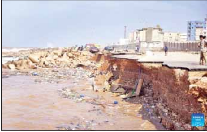
နိုင်ငံအရှေ့ပိုင်း ဒါနာမြို့၌ ရေကြီးမှုဖြစ်ပွားခြင်းကြောင့် ထိခိုက်ပျက်စီးမှုများကို စက်တင်ဘာ ၁၁ ရက်က တွေ့ရစဉ်။

အခက်အခဲများနှင့် ရင်ဆိုင်ခဲ့ရ ကလေးပေါင်း ၁၆၀၀၀ ကျော် နေရာပြောင်းရွှေ့ခဲ့ရကြောင်း ကုလသမဂ္ဂကလေးများ ရန်ပုံငွေအဖွဲ့ (ယူနီဆက်စ်)က ပြောသည်။ ကျန်းမာရေး၊ ကျောင်းပညာရေးနှင့် ဘေးကင်းသည့်နေထောက်ပံ့မှုကဲ့သို့သော မရှိမဖြစ်လိုအပ်သည့် ဝန်ဆောင်မှုများ မရှိခြင်းကြောင့် နောက်ထပ်ကလေး အများအပြားမှာလည်း အခက်အခဲများနှင့် ရင်ဆိုင်ခဲ့ရသည်။ သဘာဝဘေးကြောင့် ပြောင်းရွှေ့မိသားစုအချို့မှာ ကျောင်းအတွင်း နေထိုင်ခြင်းတို့ ပြုလုပ်ခဲ့ရသည်။ ယူနီဆက်စ်သည် ဘေးသင့်ဒေသများရှိ ကလေးများနှင့် မိသားစုဝင်များ၏ အရေးပေါ်လိုအပ်ချက်များကို မုန်တိုင်းတိုက်ခတ်ပြီး ရေကြီးမှုစတင်ဖြစ်ပွားသည့်အချိန်မှစကာ အာဏာပိုင်များနှင့် လုပ်ဖော်ကိုင်ဖက်များနှင့်အတူ ကူညီရေးလုပ်ငန်းများ လုပ်ဆောင်ခဲ့သည်။ ကလေးများမှာ ထိခိုက်အလွယ်ဆုံးဖြစ် သဘာဝဘေးဖြစ်ပေါ်သည့်အချိန်တွင် ကလေး