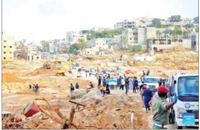
ရေကြီးမှုဖြစ်ပွားပြီးနောက် စက်တင်ဘာ ၁၆ ရက်က ကယ်ဆယ်ရေးလုပ်ငန်းများ လုပ်ဆောင်နေသည်ကို တွေ့ရစဉ်။

ဆိုဆာ၊ အယ်လ်မာဂျီ၊ ရှာဟက်၊ တက်နစ်၊ ဘူတ၊ တိုမတ၊ ဘာဆစ်၊ တော့ခါရာနှင့် အယ်လ်-အဘီယာမြို့တို့တစ်ဝန်း ရေကြီးရေလျှံမှုများကြောင့် ကြီးကြီးမားမားပျက်စီးဆုံးရှုံးမှုများနှင့် ကြုံတွေ့ခဲ့ရသည်။ ကယ်ဆယ်ရေးလုပ်ငန်းများလုပ်ဆောင် ကယ်ဆယ်ရေးလုပ်ငန်းများကို တူကီယံ၊ အီဂျစ်၊ တူနီးရှား၊ အယ်လ်ဂျီးရီးယားနှင့် မောလီတာနိုင်ငံတို့မှ ကယ်ဆယ်ရေးသမားများသည် လစ်ဗျားစစ်သားများ၊ လစ်ဗျားလခြမ်းနီအဖွဲ့မှ ဝန်ထမ်းများနှင့် ဒေသအဖွဲ့များက အရှေ့ပိုင်း ဒါနာမြို့တွင် ကယ်ဆယ်ရေးလုပ်ငန်းများ လုပ်ဆောင်ခဲ့သည်။