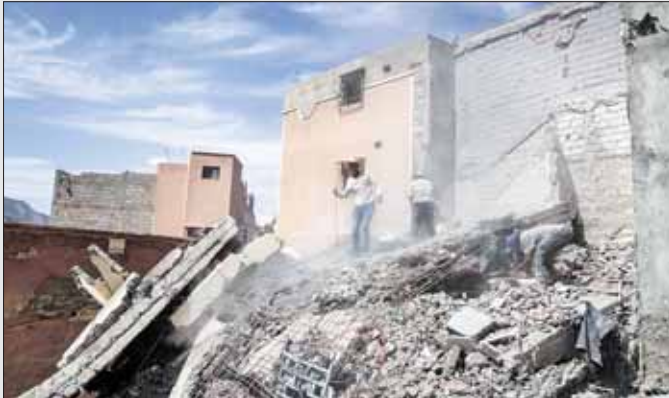
ငလျင်လှုပ်ခတ်ပြီးနောက် အဆောက်အအုံပျက်စီးမှုများကို တွေ့ရစဉ်။