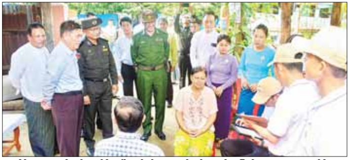
ပူးပေါင်း ဆောင်ရွက်လျက်ရှိ မြို့နယ်ခန်းမဆောက်လုပ်နေမှုကို ပြည်သူများအား မျက်စိအခမဲ့ ကြောင်း သိရသည်။ သွားရောက်ကြည့်ရှု စစ်ဆေးပြီး နောက် မောင်တောခရိုင် ပြည်သူ့ ကြည့်ရှုအားပေးခဲ့ကြောင်း သိရ ချုပ်နှင့်အဖွဲ့သည် မောင်တောမြို့ ဆေးရုံ၌ မောင်တောမြို့နယ်မှ သည်။ တင်ထွန်း(ပြန်/ဆက်)

ဦးစွာ ပြည်နယ်ဝန်ကြီးချုပ်နှင့် လူ့အခွင့်အရေးဦးစီးဌာနမှ အဖွဲ့သည် ရသေ့တောင်မြို့နယ် ပေးအပ်လှူဒါန်းကြသည်။ ဦးပိုင်ကျေးရွာ ဘုန်းတော်ကြီး ထိုနောက် ပြည်နယ်ဝန်ကြီး ကျောင်းသို့ သွားရောက်ပြီး ချုပ်နှင့်အဖွဲ့သည် မောင်တောမြို့ မြို့မ အနောက်ရပ်ကွက်တွင် ပျံလွန်တော်မူသွားသော သက်တော်ရည် ဦးပိုင်ဆရာတော် ကြီး၏ ဥက္ကဋ္ဌဇနီးကလောင်တော် အားဖူးမြော်ကြည့်ညှိပြီး ဈာပနပွဲ တော် ကျင်းပနိုင်ရန်အတွက် ရခိုင်ပြည်နယ် အစိုးရအဖွဲ့မှ