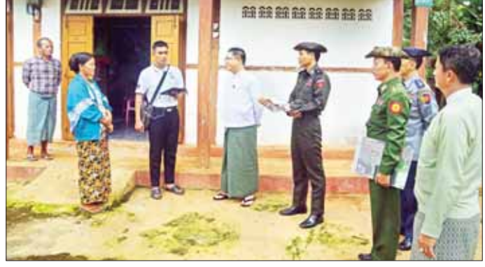
ပြည်နယ်(ပြန်/ဆက်)

၂၀၂၄ ခုနှစ် စမ်းသပ်သန်းခေါင်စာရင်းကောက်ယူခြင်းသည် ၂၀၂၄ ခုနှစ် ပြည်လုံးကျွတ်လူဦးရေနှင့် အိမ်အကြောင်းအရာ သန်းခေါင်စာရင်းကောက်ယူခြင်းလုပ်ငန်း မဆောင်ရွက်မီ တစ်နှစ်အလိုဖြစ်သည့် ၂၀၂၃ ခုနှစ် အောက်တိုဘာ ၃ ရက်မှ အောက်တိုဘာ ၁၅ ရက်အတွင်း စမ်းသပ်သန်းခေါင်စာရင်းကောက်ယူခြင်းကို ကယားပြည်နယ် သန်းခေါင်စာရင်းကြီးကြပ်မှုကော်မတီ၏ ကြီးကြပ်မှုဖြင့် လှိုင်ကော်မြို့နယ်၌ စာရင်းကောက်ကွက် နှစ်ခုဖြစ်သည့် ဒေါ်ဆော်ဘီးကျေးရွာနှင့် ရွှေတောင်ရပ်ကွက် တို့၌ လူဦးရေနှင့် အိမ်အကြောင်းရာသန်းခေါင်စာရင်းအား Mobile Tablet များ အသုံးပြုပြီး CAPI နည်းစနစ်ဖြင့် တစ်အိမ်တက် တစ်အိမ်ဆင်း စာရင်းကောက်ယူလျက်ရှိကြောင်း သိရသည်။