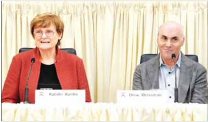
ကင်ဆာနှင့် အသက်ဆုံးရှုံးနိုင်သော များကို ကာကွယ်ဟန့်တားရာတွင်လည်း ကူညီပေး အခြားရောဂါများကို ကာကွယ်နိုင်မည်ဟုမျှော်လင့် နိုင်မည်ဟု မျှော်လင့်ကြောင်း ၎င်းတို့က ပြော တစ်ချိန်ချိန်တွင် ထိုကဲ့သို့ ကာကွယ်ဆေးများက သည်။ အင်န်အိတ်ချီကေ ကင်ဆာနှင့် အသက်ဆုံးရှုံးနိုင်သော အခြားရောဂါ

messenger RNA မော်လီကျူးများကို ဖန်တီးနိုင်ခဲ့ ကာတာလင် ကာရီနှင့် ဒရူး ဝစ်မန်းတို့သည် messenger RNA ကာကွယ်ဆေးဟု လူသိများကြ သော မော်လီကျူးများကိုလည်း ဖန်တီးနိုင်ခဲ့ကြောင်း နှင့် ထိုကဲ့သို့ မော်လီကျူးများက ရောဂါကူးစက် ဖြစ်ပွားမှုကို ကာကွယ်ရာတွင် ဆဲလ်များကို ပံ့ပိုး ပေးကြောင်း သိရသည်။