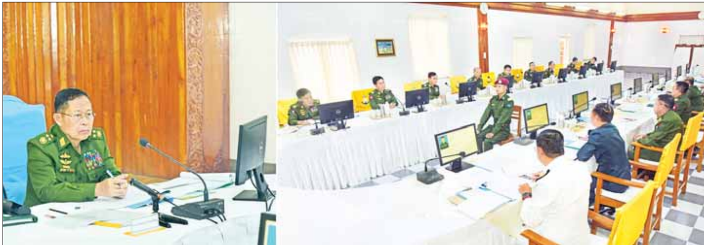
နိုင်ငံတော်စီမံအုပ်ချုပ်ရေးကောင်စီ ဒုတိယဥက္ကဋ္ဌ ဒုတိယတပ်မတော်ကာကွယ်ရေးဦးစီးချုပ် ကာကွယ်ရေးဦးစီးချုပ်(ကြည်း) ဒုတိယဗိုလ်ချုပ်မှူးကြီး စိုးဝင်း ပြင်ဦးလွင်မြို့ စစ်တက္ကသိုလ်ဗိုလ်လောင်းသင်တန်း အမှတ်စဉ် (၆၆) စစ်လက်ရုံးရွေးချယ်ပွဲတွင် ဗိုလ်လောင်းများအား တစ်ဦးချင်း တွေ့ဆုံမေးမြန်းစဉ်။