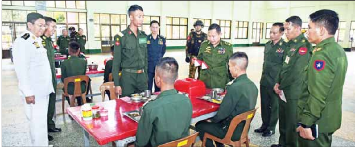
နိုင်ငံတော်စီမံအုပ်ချုပ်ရေးကောင်စီ ဒုတိယဥက္ကဋ္ဌ ဒုတိယတပ်မတော်ကာကွယ်ရေးဦးစီးချုပ် ကာကွယ်ရေးဦးစီးချုပ်(ကြည်း) ဒုတိယဗိုလ်ချုပ်မှူးကြီး စိုးဝင်း ဗိုလ်လောင်းများအား ရင်းရင်းနှီးနှီး လိုက်လံနှုတ်ဆက်၍ အားပေးစကားပြောကြားစဉ်။

နိုင်ငံတော် စီမံအုပ်ချုပ်ရေး ကောင်စီ ဒုတိယဥက္ကဋ္ဌ ဒုတိယ တပ်မတော် ကာကွယ်ရေးဦးစီး ချုပ် ကာကွယ်ရေးဦးစီးချုပ် (ကြည်း)ဒုတိယဗိုလ်ချုပ်မှူးကြီး စိုးဝင်း သင်တန်းသား ဗိုလ် လောင်းများနှင့်အတူ နေ့လယ် စာ အတူတကွ သုံးဆောင်စဉ်။