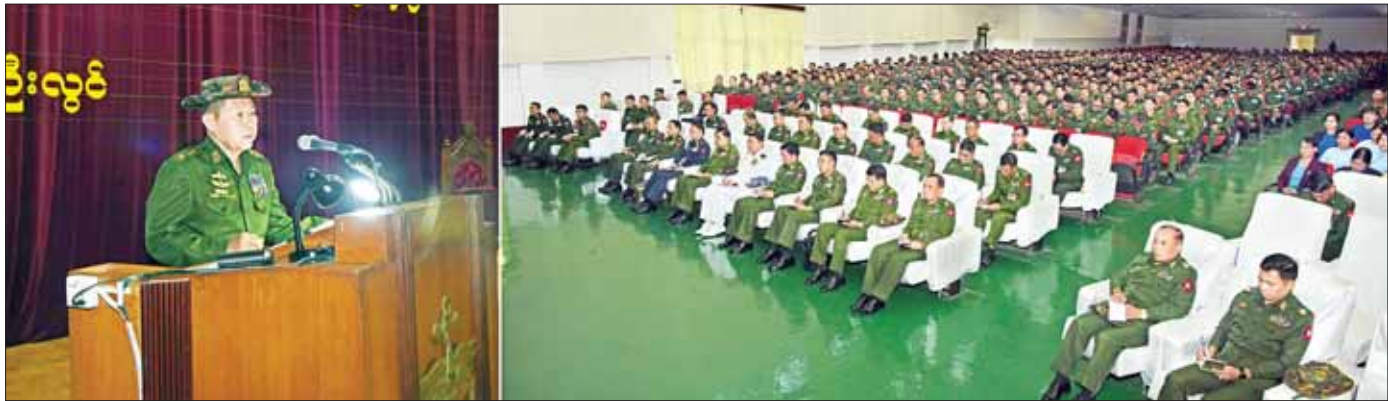
နိုင်ငံတော်စီမံအုပ်ချုပ်ရေးကောင်စီ ဒုတိယဥက္ကဋ္ဌ ဒုတိယတပ်မတော်ကာကွယ်ရေးဦးစီးချုပ် ကာကွယ်ရေးဦးစီးချုပ်(ကြည်း) ဒုတိယဗိုလ်ချုပ်မှူးကြီးစိုးဝင်း စစ်တက္ကသိုလ်ရှိ နည်းပြအရာရှိများ၊ နည်းပြဆရာ၊ ဆရာမများနှင့် သင်တန်းသား ဗိုလ်လောင်းများအား တွေ့ဆုံအမှာစကားပြောကြားစဉ်။