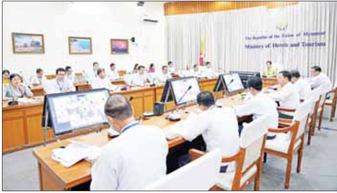
အပတ်စဉ် ဆွေးနွေးချက်များကို ကောက်နုတ်တင်ပြပြီး အမြဲတမ်း အတွင်းဝန် ဦးလှိုင်ဦးက ရှေ့ဆက် လက်ဆောင်ရွက်ရမည့် ကိစ္စရပ် များအပေါ် ဆွေးနွေးပြောကြား ကာ ညွှန်ကြားရေးမှူးချုပ် ဦးမောင်မောင်ကျော်က ဖြည့်စွက် ဆွေးနွေးသည်။ ယင်းနေ့က ပုဂ္ဂလိက များ working group အဖွဲ့ ငါးဖွဲ့မှ ကိုယ်စားလှယ်များက ဆွေးနွေး တင်ပြကြပြီး ပြည်ထောင်စုဝန်ကြီး က နိဂုံးချုပ်အမှာစကား ပြော ကြားခဲ့ကြောင်း သိရသည်။ သတင်းစဉ်

ဆွေးနွေး ထိုနေ့က ဒုတိယညွှန်ကြား ရေးမှူးချုပ် ဦးဇေယျာမျိုးအောင် က working group အဖွဲ့များ၏