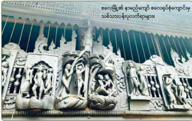
စလေမြို့၏ နာမည်ကျော် စလေရုပ်စုံကျောင်းမှ သစ်သားပန်းပုလက်ရာများ။