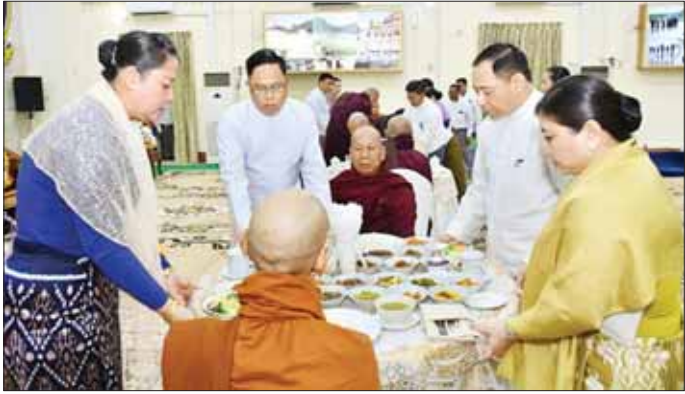
ရဲတပ်ဖွဲ့ရဲချုပ်နှင့် အခမ်းအနားတက်ရောက်လာကြသူများသည် မင်္ဂလာကန်တော်တွင် ကျင်းပသည့် (၅၉)နှစ်မြောက် မြန်မာနိုင်ငံ ငါးမြစ်ချင်းငါးမျိုးစိတ် ငါးသား နေပြည်တော် မေ့ဿီရီမြို့နယ် ရဲတပ်ဖွဲ့နေ့ကို ကြိုဆိုရုဏ်ပြုသော အားဖြင့် ဇီဝိတဒါနငါးလွှတ်ပွဲ အခမ်းအနားသို့ တက်ရောက်ကြ ကျောင်း သိရသည်။ သတင်းစဉ်

ဝန်ကြီးနှင့် အခမ်းအနားတက်ရောက်လာကြသူများက ဆရာတော် သံဃာတော်အရှင်သုမြတ်တို့အား လှူဖွယ်ဝတ္ထုပစ္စည်းများ ဆက်ကပ်လှူဒါန်းကာ ရေစက်က ဖျန်းဆန်းပေးပြီး အနုမောဒနာ တရားနှာကြား၍ “ဗုဒ္ဓသာသနာစိရိတိဋ္ဌတ” သုံး ကြိမ်ရွတ်ဆို ဆုတောင်းကာ အခမ်းအနားရပ်သိမ်းပြီး ဆရာတော် သံဃာတော်များအား အရုဏ်ဆွမ်းဆက်ကပ် လှူဒါန်းကြသည်။ (အပေါ်ယာပုံ) ဆက်လက်၍ ပြည်ထောင်စုဝန်ကြီး ဒုတိယဝန်ကြီးမြန်မာနိုင်ငံ