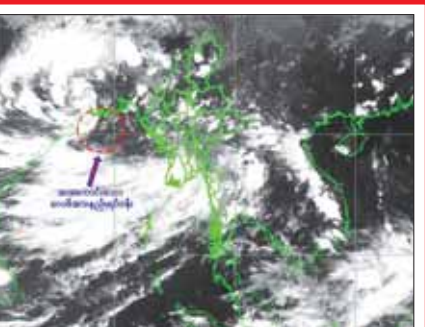
အားကောင်းသောလေဖိအားနည်းရပ်ဝန်း အခြေအနေ

ပြည်ထောင်စုသမ္မတမြန်မာနိုင်ငံတော် ကိုဗစ်-၁၉ ကာကွယ်၊ ထိန်းချုပ်၊ ကုသရေးဗဟိုကော်မတီမှ အသိပေးကြေညာချက် ၁၃၈၅ ခုနှစ်၊ တော်သလင်းလပြည့်ကျော် ၁ ရက် (၂၀၂၃ ခုနှစ်၊ စက်တင်ဘာလ ၃၀ ရက်) ကိုဗစ်-၁၉ ရောဂါပိုး ကူးစက်ပျံ့နှံ့မှုကို ဆက်လက်ထိန်းချုပ်ဆောင်ရွက်ရန် လိုအပ်ပါသဖြင့် ပြည်ထောင်စုအဆင့်အဖွဲ့အစည်းများ၊ ပြည်ထောင်စုဝန်ကြီးဌာနများမှ ကိုဗစ်-၁၉ ရောဂါ ကာကွယ်၊ ထိန်းချုပ်၊ တားဆီးရေးအတွက် ၂၀၂၃ ခုနှစ်၊ စက်တင်ဘာလ ၃၀ ရက်နေ့အထိ ထုတ်ပြန်ထားသော ပြည်သူ့ပန်ကြားချက်၊ အမိန့်၊ အမိန့်ကြော်ငြာစာ၊ ညွှန်ကြားချက်များ (ဧပြီလျှော့ပေးမည့်ကိစ္စရပ်များ မပါ) အား ၂၀၂၃ ခုနှစ်၊ အောက်တိုဘာလ ၃၀ ရက်နေ့အထိ ရက်တိုးဖြင့် သတ်မှတ်ဆောင်ရွက်ထားပါကြောင်း အသိပေးကြေညာအပ်ပါသည်။