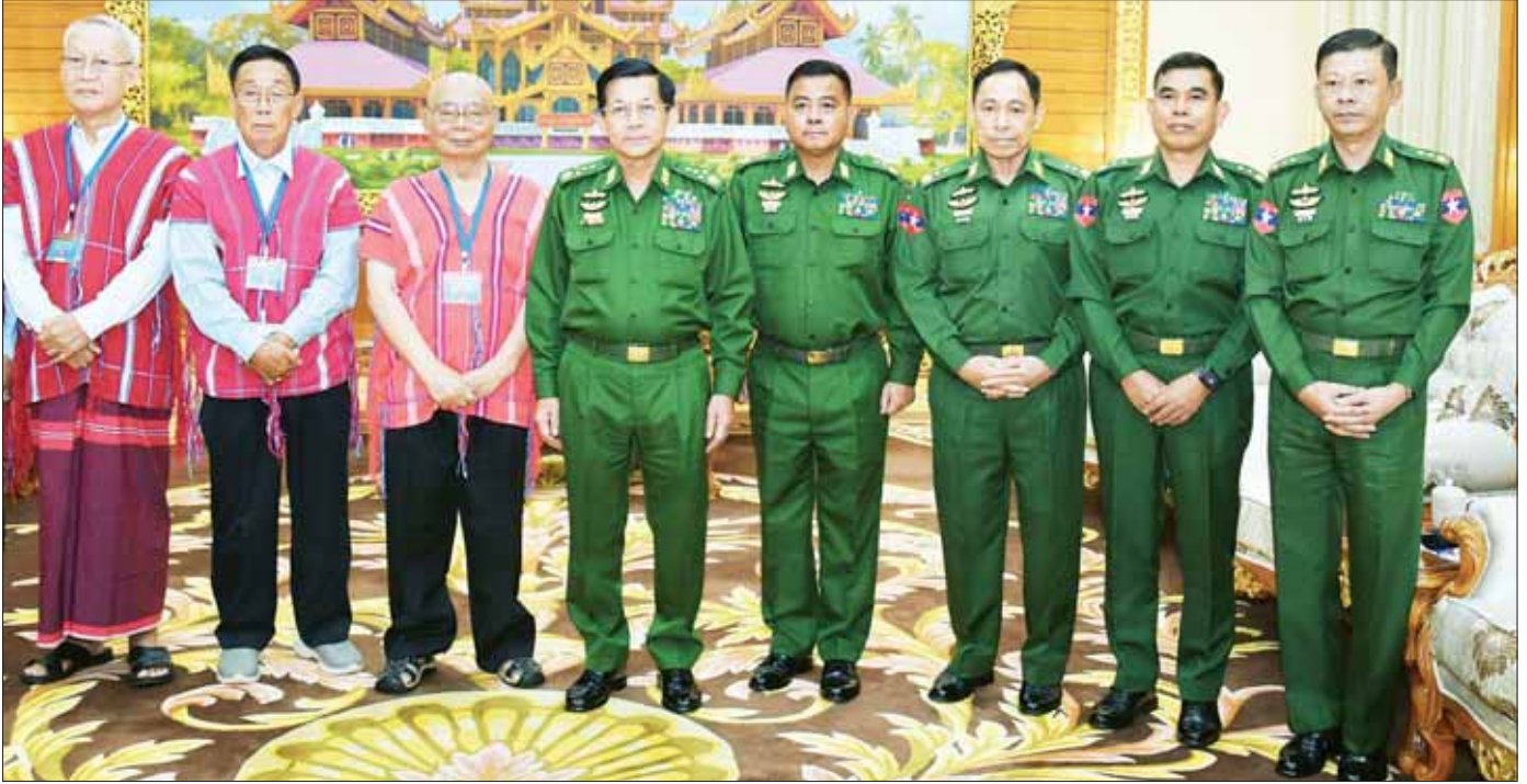
နိုင်ငံတော်စီမံအုပ်ချုပ်ရေးကောင်စီဥက္ကဋ္ဌ တပ်မတော်ကာကွယ်ရေးဦးစီးချုပ် ဗိုလ်ချုပ်မှူးကြီး မင်းအောင်လှိုင်နှင့်အဖွဲ့ ကရင်တိုင်းရင်းသားခေါင်းဆောင် စောမူတူးစေးဖိုး၊ ဦးဆောင်သည့်အဖွဲ့နှင့် စုပေါင်းမှတ်တမ်းတင် ဓာတ်ပုံရိုက်စဉ်။