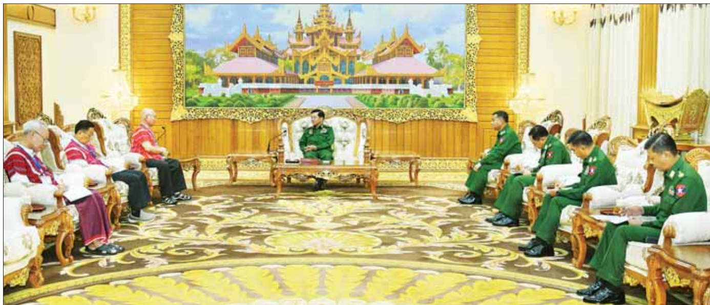
နိုင်ငံတော်စီမံအုပ်ချုပ်ရေးကောင်စီဥက္ကဋ္ဌ တပ်မတော်ကာကွယ်ရေးဦးစီးချုပ် ဗိုလ်ချုပ်မှူးကြီး မင်းအောင်လှိုင် ကရင်တိုင်းရင်းသားခေါင်းဆောင် စောမူတူးစေးဖိုး ဦးဆောင်သည့်အဖွဲ့အား လက်ခံတွေ့ဆုံပြီး ငြိမ်းချမ်းရေးဆိုင်ရာကိစ္စရပ်များ ဆွေးနွေးစဉ်။