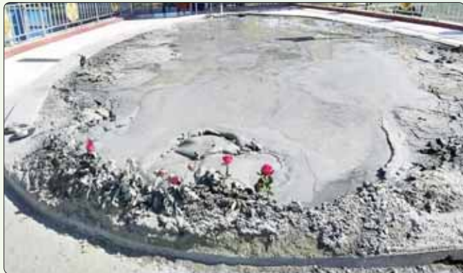
မကွေးတိုင်းဒေသကြီးအတွင်းမှ ခရီးသွားများ စိတ်ဝင်စားသော နေရာများဖြစ်သည့် ကွေ့ချောင်းခံတပ်နှင့် မင်းဘူးနဂါးပွက်တောင်။