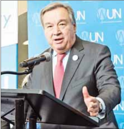
ကုလသမဂ္ဂ အထွေထွေအတွင်းရေးမှူးချုပ် အန်တိုနီယိုဂူတာရက်စ်

စက်တင်ဘာ ၂၉ ရက်ကလည်း အနောက်မြောက်ပိုင်းပြည်နယ် ခိုင်ဘာပတ်ထွန်ခါပြည်နယ်၌ ဘာသာရေးအဆောက်အအုံတွင် အသေခံဖောက်ခွဲမှုကြောင့် ငါးဦး သေဆုံးကာ ၁၀ ဦး ဒဏ်ရာရရှိခဲ့သည်။ ဆင်ဟွာ