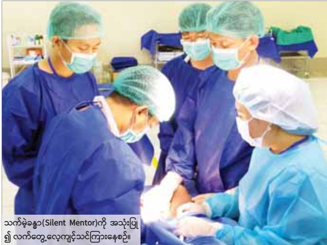
သက်ခဲခန္ဓာ(Silent Mentor)ကို အသုံးပြု၍ လက်တွေ့လေ့ကျင့်သင်ကြားနေစဉ်။

ရှေးခေတ် ဆေးပညာလောကတွင် ဂရိသမားတော် ဂေလင် (Galen) သည် ဦးနှောက်ခွဲစိတ်ခြင်း၊ မျက်စိခွဲစိတ်ခြင်းနှင့် အခြားသော ခွဲစိတ်မှုတို့ဖြင့် ရောမခေတ်တွင် ခွဲစိတ်ဆရာဝန်တစ်ဦးအဖြစ် နာမည်ကြီးခဲ့သည်။ ရောမခေတ်တွင် ခွဲစိတ်ကုသသူ ကို နတ်တရားသဖွယ် အလေးအမြတ် သူကောင်းပြုခဲ့ကြသည်။ ဆေးပညာယူဆချက်များသည် အတွေ့အကြုံပေါ်တွင်အခြေခံသည့် ဆေးပညာအဖြစ် ရာစုအလိုက် အသွင်ကူးပြောင်းခဲ့ပြီး ကမ္ဘာတစ်ဝန်းတွင် စမ်းသပ်လုပ်ဆောင်မှုနှင့် သုတေသနလုပ်ငန်းများသည် လူသားတို့၏အသက်ကို ကယ်ဆယ်ရန်၊ ကျန်းမာရေးစောင့်ရှောက်မှုနှင့် ရောဂါကြိုတင်ကာကွယ်ရေးအတွက် ဆေးပညာရပ်များ ပိုမိုဖွံ့ဖြိုးတိုးတက်ကောင်းမွန်ရန် အပြိုင်အဆိုင် စမ်းသပ်ဖော်ထုတ်ခဲ့ကြသည်။ ထိုသို့ စမ်းသပ်ဖော်ထုတ်မှုဖြင့် ခန္ဓာကိုယ်အတွင်းနှင့် အရိုးပိုင်းဆိုင်ရာ အစားထိုးခွဲစိတ်ကုသမှုသည် နိုင်ငံတစ်နိုင်ငံ၏ ဆေးပညာရပ်ဆိုင်ရာ ဖွံ့ဖြိုးတိုးတက်မှု သက်တေတစ်ခုအဖြစ် ဂုဏ်ယူဝင့်ကြားစွာ ထုတ်ဖော်ပြသကြလေ့ရှိပါသည်။