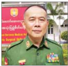
ဗိုလ်မှူးချုပ်ခင်အောင်ထွန်း

အကြိမ်(၃၀)မြောက် တပ်မတော်ဆေးပညာနိုးနှောဖလှယ်ပွဲကြီးကို ပြည်တွင်း၊ ပြည်ပမှဆေးပညာရှင်များ၊ ပါရဂူများဖြင့် ပြင်ပလွှဲလွှဲဖြင့် အမှတ်(၁) တပ်မတော်ဆေးရုံကြီး(မှတင် - ၇၀၀)တွင် အောက်တိုဘာ ၃ ရက်မှ ၅ ရက်အထိ စည်ကားသိုက်မြိုက်စွာ ကျင်းပပြုလုပ်သွားမည်ဖြစ်သည်။ အဆိုပါကွန်ပရက်အကြို အလုပ်ရုံဆွေးနွေးပွဲကို ရန်ကင်းမြို့၊ မင်္ဂလာဒုံမြို့နယ် တပ်မတော်ဆေးတက္ကသိုလ် သက်မွဲ့ခန္ဓာအသုံးပြုခွဲစိတ်လေ့ကျင့်ရေး ခန်းမဆောင်၌ စက်တင်ဘာ ၂၆ ရက်နှင့် ၂၇ ရက်တို့တွင် ပြည်တွင်း၊ ပြည်ပမှ အရိုးရောဂါဆိုင်ရာ ပါမောက္ခများ၊ စစ်ဘက်နှင့်အရပ်ဘက် အရိုးအထူးကုဆရာဝန်များ၊ အိန္ဒိယနိုင်ငံမှ ထူးရှားကျော်ကြားသော လက်ပိုင်းဆိုင်ရာ ခွဲစိတ်အထူးကုဆရာဝန်ကြီး၊ ကျန်းမာရေးဝန်ကြီးဌာန ဆေးတက္ကသိုလ် တိုက်ပါမောက္ခများနှင့် ဘွဲ့လွန်ကျောင်းသားများ တက်ရောက်ခဲ့ကြပြီး သက်မွဲ့ခန္ဓာကို အသုံးပြု၍ လက်တွေ့ လေ့ကျင့်သင်ကြား ဆွေးနွေးခွင့်ရရှိခဲ့သည့် အလုပ်ရုံဆွေးနွေးပွဲမှ ဝမ်းမြောက်ဂုဏ်ယူဖွယ်စကားသံတို့ကို ဖော်ပြလိုက်ပါသည်။