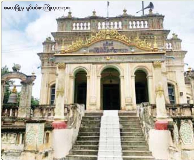
စလေမြို့မှ ရှင်ပင်စာကြိုလှဘုရား။

နောက်ခံ ဧရာဝတီမြစ်နဲ့ ပန်သင့်လှပနေပါတယ်။ ရှေးတုန်းက မြန်မာဘုရင်တွေ တည်ဆောက်ထား တဲ့ ခံတပ်စခန်းတွေဟာ နာမည်ကျော်ခံတပ်များ ဖြစ်ပြီး နှောင်းလူတို့အတွက်တော့ လေ့လာစရာ နေရာတွေ ဖြစ်လာခဲ့ကြပါတယ်။