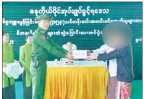
ခရိုင်၊ မြို့နယ်စီမံအုပ်ချုပ်ရေးအဖွဲ့များ၊ တပ်စခန်းများနှင့် ရဲစခန်းများ သို့ အမြန်ဆက်သွယ်သတင်းပေးပို့လာပါက ကြိုဆိုလက်ခံပေးသွားမည် ဖြစ်ကြောင်း သတင်းရရှိသည်။ သတင်းစဉ်

တာဝန်ရှိသူများ၊ ဌာနဆိုင်ရာတာဝန်ရှိသူများ၊ ဥပဒေဘောင်အတွင်း ဝင်ရောက်လာသူများနှင့် ၎င်းတို့၏ မိဘအုပ်ထိန်းသူများ တက်ရောက် ကြသည်။ ဦးစွာ ဓနကိုယ်ပိုင်အုပ်ချုပ်ခွင့်ရဒေသ ဦးစီးအဖွဲ့ဥက္ကဋ္ဌက အမှာ စကားပြောကြားပြီး ဥပဒေဘောင်အတွင်း ပြန်လည်ဝင်ရောက်ခဲ့သည့် ပြစ်မှုကျူးလွန်ခြင်းမရှိခဲ့သော ရှမ်းပြည်နယ်(တောင်ပိုင်း)အတွင်းမှ PDF အဖွဲ့ဝင် အမျိုးသား တစ်ဦးနှင့် အမျိုးသမီး တစ်ဦးတို့ကို ဝန်ခံကတိ လက်မှတ်ရေးထိုးစေကာ ထောက်ပံ့ငွေများပေးအပ်ပြီး ၎င်းတို့၏ မိဘအုပ်ထိန်းသူများထံသို့ လွှဲပြောင်းပေးအပ်သည်။ ထိုသို့ နိုင်ငံတော်စီမံအုပ်ချုပ်ရေးကောင်စီမှ ဥပဒေဘောင်အတွင်း ဝင်ရောက်လာသူများအား ပြန်လည်ကြိုဆိုလက်ခံ၍ လိုအပ်သည့်ကူညီ ပံ့ပိုးမှုများ ဆောင်ရွက်ပေးလျက်ရှိခြင်းကြောင့် ဥပဒေဘောင်အတွင်းသို့ ပြန်လည်ဝင်ရောက်ရန် ဆန္ဒရှိသူများ ကျန်ရှိနေသေးကြောင်း သိရှိရပြီး ဥပဒေဘောင်အတွင်း ပြန်လည်ဝင်ရောက်လိုသူများအနေဖြင့် နီးစပ်ရာ