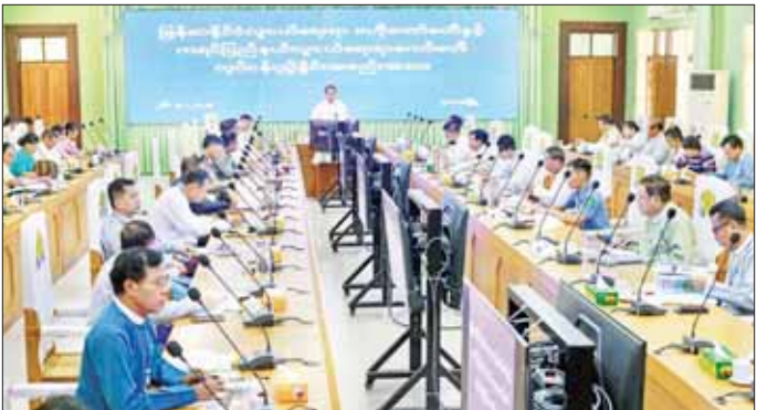
ဖော်ဆောင်ပေးနိုင်သောအင်အားစုများ၊ လူ့စွမ်းအား အရင်းအမြစ်များဖြစ်သည့်အတွက် နယ်ပယ်ပေါင်းစုံတွင် လူငယ်များပါဝင်ဆောင်ရွက်နိုင်သည့် အခွင့်အလမ်းများကို ဖန်တီးပုံဖော်ရေးမည်ဖြစ်ကြောင်း၊ သို့မှသာ လူငယ်များပူးပေါင်းဆောင်ရွက်မှု ခိုင်မာအားကောင်းလာမည်ဖြစ်ပြီး စဉ်ဆက်မပြတ်ဖွဲ့စည်းတိုးတက်သည့် သဟဇာတဖြစ်သည့် လူမှုအသိုင်းအဝိုင်းကို တည်ထောင်နိုင်ကာ ဒေသတွင်း ဖွံ့ဖြိုးတိုးတက်မှုကွာဟချက်များကို လျှော့ချနိုင်မည်ဖြစ်ကြောင်း ပြောကြားသည်။

ဘားအံ စက်တင်ဘာ ၂၆ လူငယ်များ ဘက်စုံဖွံ့ဖြိုးတိုးတက်ရေးအတွက် လူငယ်ရေးရာကော်မတီများကို စနစ်တကျ ထိထိရောက်ရောက် အကောင်အထည်ဖော်ဆောင်ရွက်နိုင်ရေး မြန်မာနိုင်ငံ လူငယ်ရေးရာဗဟိုကော်မတီနှင့် ကရင်ပြည်နယ် လူငယ်ရေးရာကော်မတီတို့၏ လုပ်ငန်းညှိနှိုင်းအစည်းအဝေးကို စက်တင်ဘာ ၂၆ ရက် နံနက် ၁၀ နာရီက ကရင်ပြည်နယ်အစိုးရအဖွဲ့ရုံး အစည်းအဝေးခန်းမ(၂)၌ ကျင်းပသည်။ ဦးစွာ ကရင်ပြည်နယ် လူငယ်ရေးရာကော်မတီ ဥက္ကဋ္ဌ ပြည်နယ်ဝန်ကြီးချုပ် ဦးစောမြင့်ဦးက လူငယ်ကဏ္ဍ(၁၆) ရပ်ကို ပြည်နယ်အဆင့်သာမက ခရိုင်၊ မြို့နယ်အဆင့်ထိပါ အကောင်အထည်ဖော် ဆောင်ရွက်နိုင်ရေး ခရိုင်၊ မြို့နယ် လူငယ်ကော်မတီများ ဖွဲ့စည်းဆောင်ရွက်ပြီးဖြစ်ကြောင်း၊ လူငယ်များသည် အနာဂတ်နိုင်ငံခေါင်းဆောင်များ၊ နည်းပညာဆိုင်ရာ တီထွင်ဖန်တီးသူများ၊ ငြိမ်းချမ်းရေးဖော်ဆောင်သူများ၊ စွန့်စားတီထွင်သူများ၊ ဖွံ့ဖြိုးတိုးတက်မှုကို