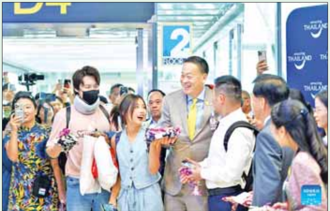
ထိုင်းဝန်ကြီးချုပ် ဆရာဝန် သာဗီဆင်က တရုတ်နိုင်ငံမှ ရောက်ရှိလာသူများကို ထိုင်းနိုင်ငံ သုဝဏ္ဏ လေဆိပ်၌ စက်တင်ဘာ ၂၅ ရက်က ကြိုဆိုနှုတ်ဆက်စဉ်။

ဆရာဝန် သာဗီဆင်ကြိုဆိုရေး အခမ်းအနား တွင် မိန့်ခွန်းပြောကြားခဲ့သည်။ ထိုင်းနိုင်ငံသည် စက်တင်ဘာ ၂၅ ရက်မှ ၂၀၂၄ ခုနှစ် ဖေဖော်ဝါရီ လကုန်အထိ တရုတ်ခရီးသွားများကို ဗီဇကင်းလွတ် ခွင့်ပြုခဲ့သည်။ ယခုအစီအစဉ်သည် နိုင်ငံ၏ စီးပွားရေးကို သိသိသာသာ ဖွံ့ဖြိုးတိုးတက်စေမည်ဖြစ်ကြောင်း ထိုင်းဝန်ကြီးချုပ်က ပြောကြားခဲ့သည်။ ထိုင်းနိုင်ငံ ခရီးသွားအာဏာပိုင်အဖွဲ့၏ ထုတ်ပြန်လိုက်သော ၂၀၂၃ ခုနှစ် ဇန်နဝါရီ ၁ ရက်မှ ၁၇ ရက်အထိ နောက်ဆုံးအချက်အလက်များအရ ထိုင်းနိုင်ငံသည် တရုတ်ခရီးသွား ၂ ဒသမ ၃၄ သန်းကျော် ဝင်ရောက် ခဲ့ကြောင်း မှတ်တမ်းတင်ခဲ့သည်။ အဆိုပါအစီအစဉ် ကြောင့် ထိုင်းနိုင်ငံသို့ လာရောက်သောခရီးသွား အရေအတွက် နှစ်ဆမြင့်တက်လာမည်ဟု အာဏာ ပိုင်များက ခန့်မှန်းထားသည်။ ဆင်ဟွာ