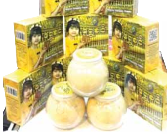
အရာတော်မှ သနပ်ခါးတန်ဖိုးမြင့် ထုတ်ကုန်များ။

အသေးစားလုပ်ငန်းများကို အားထားနေရသော မြန်မာနိုင်ငံသည် သနပ်ခါးကို အခြေခံသော အဆင့်မြင့်ကျန်းမာရေး၊ လူသုံးကုန်ပစ္စည်းများအား ပြည်တွင်းမှတစ်ဆင့် ပြည်ပအထိ ထုတ်လုပ်ဖြန့်ဖြူးခြင်းဖြင့် နိုင်ငံခြားဝင်ငွေရရှိနိုင်မည်ဖြစ်ကာ မြန်မာစီးပွားရေး တိုးတက်မြှင့်တင်ရေးကို အထောက်အကူပြုနိုင်ပြီး ကမ္ဘာ့အလယ်တွင် မြန်မာတို့ ဂုဏ်ထည်ဝင်ကြားနိုင်စေရန် ဓာတုဆေးဝါးများဖြင့် ပြုပြင်ဖော်စပ်ထားသည့် အလှူကုန်ပစ္စည်းများကို လိမ်းမည့်အစား ရှေးထုံးမပျက် မြန်မာ့ရိုးရာ သနပ်ခါးအေးအေးမွှေးမွှေးလေးကို လိမ်းခြယ်ပြီး အလှဆင်သင့်ကြောင်း ရေးသားတင်ပြလိုပါသည်။