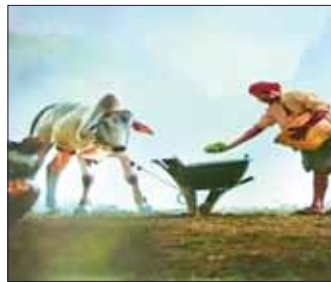
တိုက်တွန်းခရီးသွားညွှန်ကြားမှုဦးစီးဌာနက ကြီးမား၍ ယခုလအတွင်း ကျင်းပပြီးစီးခဲ့သော “Tourism & Green Investments” ရောင်စုံဓာတ်ပုံပြိုင်ပွဲမှ ပြိုင်ပွဲဝင်ဓာတ်ပုံတစ်ပုံ (အပေါ်ပုံ) နှင့် ပြိုင်ပွဲဝင်ဓာတ်ပုံများ (ယာဝါ)။

ဖြေရှင်းပေးနိုင်မည့်ကဏ္ဍတစ်ခုအဖြစ် ဖော်ဆောင်ရမည်ဖြစ်သည်။ ထို့ကြောင့် ခရီးသွားလုပ်ငန်းကဏ္ဍ၏ အစီမံအကောင်အထည်ဖော်ရေးသည် ကမ္ဘာ့မြေအတွက်နှင့် ခရီးသွားလုပ်ငန်းအတွက် သာမက ယှဉ်ပြိုင်နိုင်စွမ်းကို မြှင့်တင်ရန်၊ ကြံ့ကြံခံနိုင်ရည်ရှိစေရေး တည်ဆောက်ရန်နှင့် အစီမံအကောင်အထည်ဖော်ရေးများ မြှင့်တင်ရန်တို့တွင် အလွန်လိုအပ်လာပေသည်။ ထို့အပြင် ခရီးသွားလုပ်ငန်းကဏ္ဍသည် တီထွင်ဆန်းသစ်မှုများနှင့်အတူ စဉ်ဆက်မပြတ် ဖွံ့ဖြိုးမှုပန်းတိုင်များ (SDGs) ၏ အစီမံအကောင်အထည်ဖော်ရေးတို့ကို အကောင်အထည်ဖော်ရာတွင် ပံ့ပိုးကူညီရန် ဦးဆောင်အခန်းကဏ္ဍမှ ပါဝင်ရန်လိုအပ်လာမည် ဖြစ်သည်။