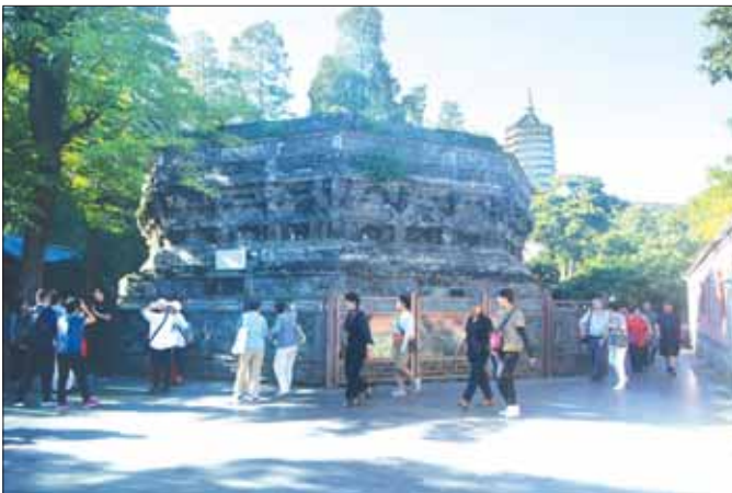
ပြိုကျသွားသော စွယ်တော်တိုက်စေတီကို တွေ့ရစဉ်။

စေတီအတွင်းမှာရှိတဲ့ စွယ်တော်ကိုတော့ လူတိုင်းဖူးခွင့်ရပုံမပေါ်ပါဘူး။ အထူးစဉ်သည့်တွေနဲ့ နေ့ကြီးရက်ကြီးအခါလောက်သာ ဖူးခွင့်ရရှိကြတယ်လို့ သိရပါတယ်။ စွယ်တော်တိုက်အတွင်း ဝင်ရောက်ရာမှာလည်း အလွန်စနစ်ကျပါတယ်။ လူတစ်ယောက်ချင်းစီ တန်းစီဝင်ရပါတယ်။ ခြေထောက်တွေကိုဝတ်ဆင်ဖို့ အစွဲမတွေ့ပေးပါဘူး။ ဖိနပ်ချွတ်စရာမလိုပါ။ မေးတဲ့အစွဲကို ဖိနပ်ပိရောစွဲပေးပြီး တန်းစီတက်သွားရပါတယ်။ အထဲရောက်တော့ အနက်ရောင်ဝတ်ဆင်ထားတဲ့ ဘုရားအစောင့်အကြပ်တွေက လူတိုင်းကို စောင့်ကြည့်