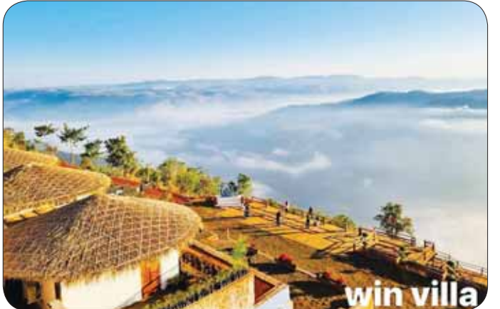
နောင်ချိုကြီးကျေးရွာ၌ ဖွင့်လှစ်ထားသည့် Win Villa တိမ်ပင်လယ်စခန်းမှ အလှအပရှုခင်းများ။