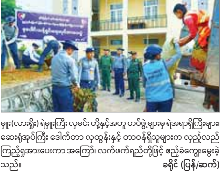
မှူး (လားရှိုး) ရဲမှူးကြီး လှမင်း တို့နှင့်အတူ တပ်ဖွဲ့များမှ အရာရှိကြီးများ ဆေးရုံအုပ်ကြီး ဒေါက်တာ လှထွန်းနှင့် တာဝန်ရှိသူများက လှည့်လည် ကြည့်ရှုအေးပေးကာ အကြော် လက်ဖက်ရည်တို့ဖြင့် စဉ်ခံကျွေးမွေးခဲ့ သည်။

လားရှိုး စက်တင်ဘာ ၂၃ (၅၅)နှစ်မြောက် မြန်မာနိုင်ငံရဲတပ်ဖွဲ့နေ့ကို ကြိုဆိုဂုဏ်ပြုသောအားဖြင့် ယနေ့ နံနက်ပိုင်းက လားရှိုးပြည်သူ့ဆေးရုံကြီး၌ ရဲတပ်ဖွဲ့ဝင်များက စုပေါင်းသန့်ရှင်းရေး ဆောင်ရွက်သည်။ စုပေါင်းသန့်ရှင်းရေး လုပ်အားပေးဆောင်ရွက်ပွဲတွင် အရှေ့မြောက် တိုင်းစစ်ဌာနချုပ်မှ တပ်မတော်သား ၂၀၊ လားရှိုးမြို့ပေါ်တာဝန်ကျ ရုံး/ရဲစခန်းတပ်ဖွဲ့များမှ တပ်ဖွဲ့ဝင် စုစုပေါင်း ၁၆၅ ဦးတို့က ဆေးရုံကြီးဝင်း အတွင်း/ အပြင် သန့်ရှင်းသယံဇာတလှပရေးအတွက် ဆောင်ရွက်ခြင်း၊ ဆေးရုံ အဆောက်အအုံများပေါ်ရှိ အမှိုက်များ၊ သစ်ရွက်ခြောက်များကို ဖယ်ရှားရှင်းလင်းခြင်း ဆောင်ရွက်ကြသည်။ အဆိုပါ (၅၅)နှစ်မြောက် မြန်မာနိုင်ငံရဲတပ်ဖွဲ့နေ့ ဂုဏ်ပြုပူပေါင်း သန့်ရှင်းရေးဆောင်ရွက်ရာတွင် အရှေ့မြောက်တိုင်းစစ်ဌာနချုပ်မှ တိုင်းဦးစီးချုပ် ဗိုလ်မှူးချုပ် ထွန်းထွန်းမြင့်၊ ပြည်နယ်ဒုတိယရဲတပ်ဖွဲ့