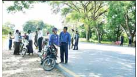
ပြည်ထောင်စုနယ်မြေ တပ်ကုန်းမြို့နယ် ရန်ကုန်-မန္တလေး ကားလမ်း မိုင်တိုင် အမှတ် ၂၄၈/၅ ၌ ယာဉ်စည်းကမ်း၊ လမ်းမညှိကမ်းဆိုင်ရာ Quick Win အစီအစဉ်(၅)ရပ်ကို ပြည်သူများ ကျယ်ပြန့်စွာလိုက်နာ စေရန် ရှောင်တစ်ခင်စစ်ဆေးခြင်းကို ဌာနဆိုင်ရာပူးပေါင်းအဖွဲ့က စက်တင်ဘာ ၂၃ ရက်တွင် ဆောင်ရွက်စဉ်။ တင်စိုးလွင်