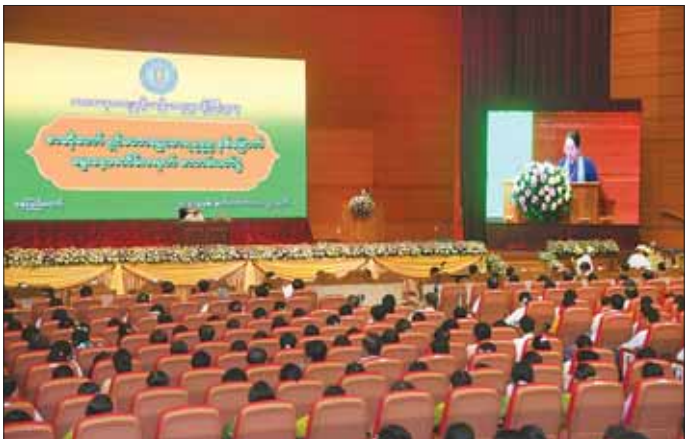
စာဆိုတော် ရှင်မဟာရဋ္ဌသာရ ၅၅၅ နှစ်မြောက်မွေးနေ့အထိမ်းအမှတ် စာတမ်းဖတ်ပွဲ ကျင်းပစဉ်။