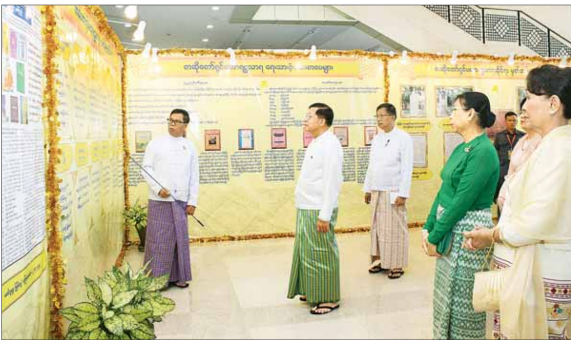
နိုင်ငံတော်စီမံအုပ်ချုပ်ရေးကောင်စီဥက္ကဋ္ဌ နိုင်ငံတော်ဝန်ကြီးချုပ် ဗိုလ်ချုပ်မှူးကြီး မင်းအောင်လှိုင် စာဆိုတော်ရှင်မဟာရဋ္ဌသာရ ၅၅၅ နှစ်မြောက် မွေးနေ့အထိမ်းအမှတ်ပြခန်းအတွင်း ခင်းကျင်းပြသထားသည့်များကို ကြည့်ရှုလေ့လာစဉ်။

နေပြည်တော် စက်တင်ဘာ ၂၃ စာဆိုတော်ရှင်မဟာရဋ္ဌသာရ ၅၅၅ နှစ်မြောက် မွေးနေ့အထိမ်းအမှတ်စာတမ်းဖတ်ပွဲ ဖွင့်ပွဲအခမ်းအနားကို ယနေ့ နံနက်ပိုင်းတွင် နေပြည်တော်ရှိ မြန်မာအပြည်ပြည်ဆိုင်ရာ ကွန်ဗင်းရှင်းဗဟိုဌာန-၂ ၌ ကျင်းပပြုလုပ်ရာ နိုင်ငံတော် စီမံအုပ်ချုပ်ရေးကောင်စီဥက္ကဋ္ဌ နိုင်ငံတော်ဝန်ကြီးချုပ် ဗိုလ်ချုပ်မှူးကြီး မင်းအောင်လှိုင်နှင့် ဇော်ကြာကြာလှတို့ တက်ရောက်ကြသည်။ အဆိုပါ အခမ်းအနားသို့ နိုင်ငံတော်စီမံအုပ်ချုပ်ရေးကောင်စီဥက္ကဋ္ဌ နိုင်ငံတော်ဝန်ကြီးချုပ်နှင့် ဇနီးတို့နှင့်အတူ ကောင်စီတွဲဖက်အတွင်းရေးမှူးနှင့် ဇနီး၊ ကောင်စီဝင်များနှင့် ဇနီးများ၊ ပြည်ထောင်စုဝန်ကြီးများ၊ ပြည်ထောင်စုအဆင့်ပုဂ္ဂိုလ်များနှင့် ဇနီးများ၊ ကာကွယ်ရေးဦးစီးချုပ်ရုံးမှ အဆင့်မြင့်တပ်မတော် အရာရှိကြီးများနှင့် ဇနီးများ၊ နေပြည်တော်တိုင်းစစ်ဌာနချုပ်တိုင်းမှူး၊ ဒုတိယဝန်ကြီးများ၊ စာတမ်းဖတ်ပွဲတွင် စာမျက်နှာ ၃ ကော်လံ ၁ *