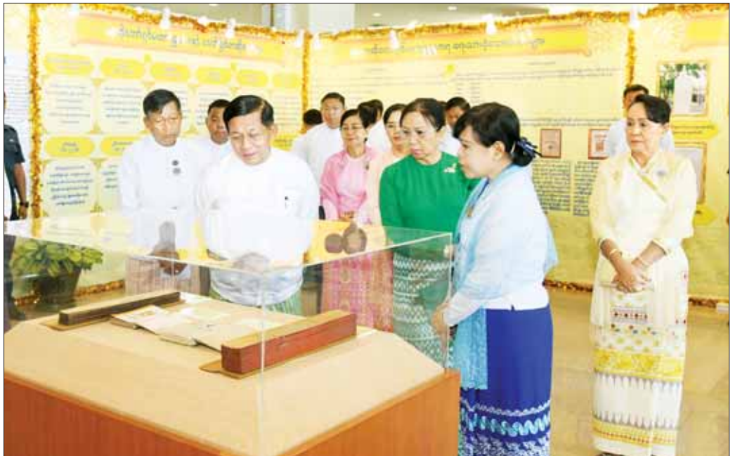
နိုင်ငံတော်စီမံအုပ်ချုပ်ရေးကောင်စီဥက္ကဋ္ဌ နိုင်ငံတော်ဝန်ကြီးချုပ် ဗိုလ်ချုပ်မှူးကြီး မင်းအောင်လှိုင် စာဆိုတော် ရှင်မဟာရဋ္ဌသာရ ၅၅၅ နှစ်မြောက် မွေးနေ့အထိမ်းအမှတ်ပြခန်းအတွင်း ကြည့်ရှုလေ့လာစဉ်။

ထို့နောက် စာဆိုတော် ရှင်မဟာရဋ္ဌသာရ ၅၅၅ နှစ်မြောက် မွေးနေ့အထိမ်းအမှတ် စာတမ်းဖတ်ပွဲ ဖွင့်ပွဲအခမ်းအနားကို ကျင်းပရာ သာသနာရေးနှင့် ယဉ်ကျေးမှုဝန်ကြီးဌာန ပြည်ထောင်စုဝန်ကြီး ဦးတင်ဦးလွင် က စာဆိုတော် ရှင်မဟာရဋ္ဌသာရ ၅၅၅ နှစ်မြောက် မွေးနေ့အထိမ်းအမှတ်အခမ်းအနားကျင်းပရခြင်းနှင့် စပ်လျဉ်း၍ ရှင်းလင်းတင်ပြသည်။