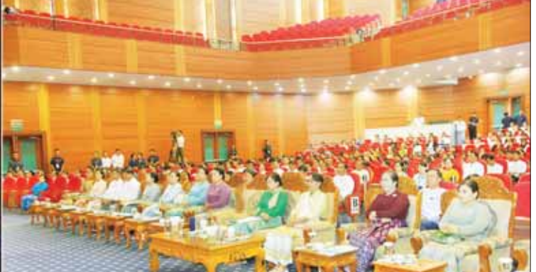
နိုင်ငံတော်စီမံအုပ်ချုပ်ရေးကောင်စီဥက္ကဋ္ဌ နိုင်ငံတော်ဝန်ကြီးချုပ် ဗိုလ်ချုပ်မှူးကြီး မင်းအောင်လှိုင်၏ ဇနီး ဒေါ်ကြူကြူလှနှင့် အခမ်းအနားတက်ရောက်လာကြသူများ၊ အနုပညာဦးစီးဌာနမှ အနုပညာရှင်များက “ကျေးဇူးသစ္စာ ပန်းအလင်္ကာ” ဂုဏ်ပြုတေးဂီတ ကဇာတ် (ဒုတိယပိုင်း) ဆက်လက်ကပြဖျော်ဖြေတင်ဆက်မှုကို ကြည့်ရှုအားပေးကြစဉ်။