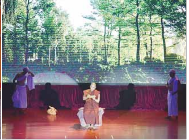
နိုင်ငံတော်စီမံအုပ်ချုပ်ရေးကောင်စီဥက္ကဋ္ဌ နိုင်ငံတော်ဝန်ကြီးချုပ် ဗိုလ်ချုပ်မှူးကြီး မင်းအောင်လှိုင်နှင့်ဇနီး ဒေါ်ကြူကြူလှနှင့် အခမ်းအနားတက်ရောက်လာကြသူများ အနုပညာဦးစီးဌာနမှ အနုပညာရှင်များက ကပြဖျော်ဖြေတင်ဆက်ကြသည့် “ကျေးဇူးသစ္စာ ပန်းအလင်္ကာ” ဂုဏ်ပြုတေးဂီတ ကဇာတ်(ပထမပိုင်း) ကို ကြည့်ရှုအားပေးကြစဉ်။