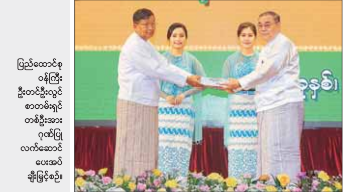
ပြည်ထောင်စု ဝန်ကြီး ဦးတင်ဦးလွင် စာတမ်းရှင် တစ်ဦးအား ဂုဏ်ပြု လက်ဆောင် ပေးအပ် ချီးမြှင့်စဉ်။