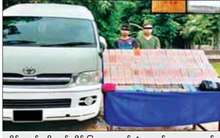
သိမ်းဆည်းရမိသည့် ဘိန်းဖြူဘလောက်တုံးများနှင့်အတူ တွေ့ရစဉ်။

နေပြည်တော် စက်တင်ဘာ ၂၃ သိန်း ၆၁၀၀ ကျော် တန်ဖိုးရှိ ရှမ်းပြည်နယ် (တောင်ပိုင်း) ဘိန်းဖြူဘလောက်တုံး ၁၁၇ တုံး၊ ပင်လောင်းမြို့နယ်၌ ငွေကျပ် အလေးချိန် ၄၀ ဒသမ ၉၅ ကီလို