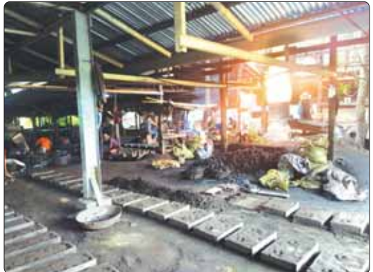
ရွာသစ်တိုင်းတောကျေးရွာ အေးမြကြည် သံရည်ကျို၊ သံနန်းဆွဲနှင့် တွင်အချောကိုင်လုပ်ငန်းမှ လူသုံးကုန်ပစ္စည်းများ ထုတ်လုပ်နေမှုကို တွေ့ရစဉ်။

အားပေးမြှင့်တင် ဆောင်ရွက် မြန်မာနိုင်ငံတွင် အသေးစား၊ အငယ်စားနှင့် အလတ်စား (MSME) စီးပွားရေးလုပ်ငန်း လေးသောင်းကျော်ရှိရာ ၂၀၁၅ ခုနှစ် မြန်မာစီးပွားရေးလုပ်ငန်း စစ်တမ်းအရ စီးပွားရေးလုပ်ငန်းအရေအတွက် အများဆုံးသည် ကုန်ထုတ်လုပ်မှုကဏ္ဍ ခွဲကြိမ် ဈုစုပေါင်းလုပ်ငန်းများ၏ ၄၀ ရာခိုင်နှုန်းရှိသည်။ မြန်မာနိုင်ငံ၏ စီးပွားရေးလုပ်ငန်းရာခိုင်နှုန်း ၉၀ ကျော်သည် လုပ်ငန်းငယ်များသာဖြစ်သည်။ ထို့ကြောင့် နိုင်ငံတော်အစိုးရအနေဖြင့် အသေးစား၊ အငယ်စား နှင့် အလတ်စား (MSME) စီးပွားရေးလုပ်ငန်းဖွံ့ဖြိုးရေးကို အားပေးမြှင့်တင် ဆောင်ရွက်လျက်ရှိသည်။