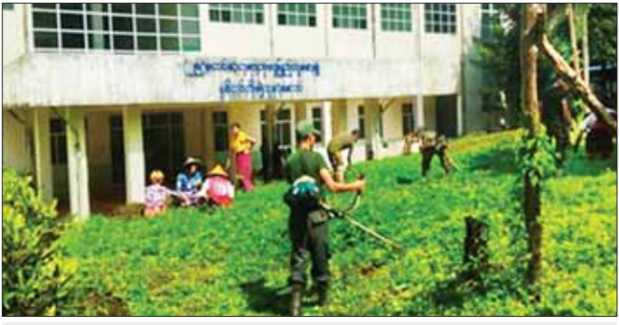
(၂၅)ခုတင်ဆုံ ဘုရားသုံးဆူ ပြည်သူ့ဆေးရုံ၌ စုပေါင်းသန့်ရှင်းရေးလုပ်ငန်းများ ဆောင်ရွက်နေစဉ်။

နေပြည်တော် စက်တင်ဘာ ၂၃ ယခုအချိန်အခါတွင် နိုင်ငံတော်စီမံအုပ်ချုပ်ရေးကောင်စီ၏ ဦးဆောင်မှုနှင့်အတူ နိုင်ငံတစ်ဝန်းလုံး၌ တပ်မတော်သားများ၊ ဌာနဆိုင်ရာအဖွဲ့အစည်းများ၊ ဒေသခံပြည်သူအားလုံးတို့က နိုင်ငံတော်ဖွံ့ဖြိုးတိုးတက်ရေးလုပ်ငန်းများကို ညီညီညွတ်ညွတ်ဖြင့် ဆောင်ရွက်လျက်ရှိကြပြီး အပတ်စဉ် စနေနေ့တိုင်းတွင်လည်း မိမိတို့၏ မြို့၊ ရွာ၊ စာသင်ကျောင်းများ သန့်ရှင်းသာယာလှပရေးကို ဆောင်ရွက်လျက်ရှိသည့် အပြင် ဆေးရုံ၊ ဆေးခန်းများ၌ ခြံ၊ ယင်း၊ ပေါက်ဖွားမှု မရှိစေရေးနှင့် ဆေးရုံတက်ရောက်ကုသနေသော လူနာများအား လေကောင်းလေသန့်ရှိုစေရန် ချို့ရွယ်၊ ပေါင်းမြက်များ ခုတ်ထွင်ရှင်းလင်းခြင်းများ ဆောင်ရွက်ပေးလျက်ရှိပါသည်။ ထိုသို့ဆောင်ရွက်လျက်ရှိရာ ယနေ့တွင် နေပြည်တော်ကောင်စီနယ်မြေအတွင်းရှိ မြို့နယ်ရှစ်မြို့နယ် တို့၌ လည်းကောင်း၊ ကချင်ပြည်နယ်အတွင်းရှိ မြို့နယ် ခြောက်မြို့နယ်တို့၌ လည်းကောင်း၊ ရှမ်းပြည်နယ် (မြောက်ပိုင်း) အတွင်းရှိ မြို့နယ် ၁၁ မြို့နယ် တို့၌ လည်းကောင်း၊ ရှမ်းပြည်နယ် (တောင်ပိုင်း) အတွင်းရှိ မြို့နယ် ခြောက်မြို့နယ်တို့၌ လည်းကောင်း၊ ရှမ်းပြည်နယ် (အရှေ့ပိုင်း) အတွင်းရှိ မြို့နယ် ၁၃