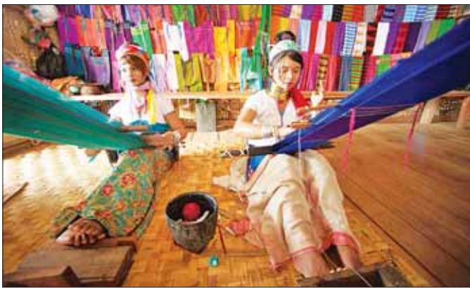
ရိုးရာအဝတ်အထည်နှင့် အသုံးအဆောင်များ ရက်လုပ်နေသည့် ကယန်းအမျိုးသမီးနှစ်ဦးကို တွေ့ရစဉ်။

အဓိကမဏ္ဍိုင်ကြီး (၃) ရပ် ထိုရည်မှန်းချက်များ အောင်မြင်စေရန်အတွက် ခရီးသွားလုပ်ငန်းမှ ပင်မမဏ္ဍိုင်အဖြစ် ပံ့ပိုးပြီး အကောင်အထည်ဖော်လျက်ရှိရာမှ ကိုဗစ်-၁၉ ကမ္ဘာ့ကပ်ရောဂါ၏ ရိုက်ခတ်မှုများကြောင့် အရှိန်အဟုန်များ ရပ်တန့်ခဲ့ရပါသည်။ ထို့ကြောင့် ကမ္ဘာ့ခရီးသွားလုပ်ငန်းအဖွဲ့ချုပ်မှ ခရီးသွားလုပ်ငန်း၏ ယခင်မောင်းနှင်အား အရှိန်အဟုန်နှင့် ဖွံ့ဖြိုးမှုကို ပြန်လည်ရရှိရန်အတွက် ပညာရေးနှင့်ကျွမ်းကျင်မှု ဖွံ့ဖြိုးရေးကဏ္ဍ၊ သဘာဝပတ်ဝန်းကျင်နှင့် အခြေခံအဆောက်အအုံကဏ္ဍ၊ နည်းပညာ၊ ဆန်းသစ်မှုနှင့် စွန့်ခွာတီထွင်မှုကဏ္ဍ စသောကဏ္ဍကြီး (၃) ရပ်တွင် ရင်းနှီးမြှုပ်နှံမှုများကို မြှင့်တင်ကြရန် အကြံပြု တိုက်တွန်းလျက်ရှိပါသည်။ ယခင်ဖွံ့ဖြိုးမှုအခြေအနေသို့ ၂၀၂၄ ခုနှစ်တွင် ပြန်လည်ရောက်ရှိမည်