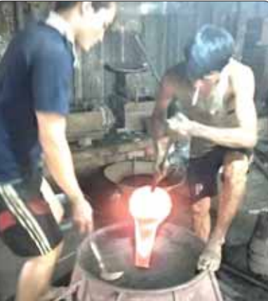
သပြေကျေးရွာရှိ သံရည်ကျို၊ သတ္တုရည်ကျိုပုံလောင်း လူသုံးကုန်ပစ္စည်း ထုတ်လုပ်မှုလုပ်ငန်းခွင်ကို တွေ့ရစဉ်။

ထိုသို့သော လူသုံးကုန်ပစ္စည်းနှင့် သံရည်ကျိုပုံလောင်း လူသုံးကုန်ပစ္စည်းအမည်များစွာကို ကျေးရွာမှ ထုတ်လုပ်ကာ အိုးမကွာအိမ်မကွာ ဝင်ငွေရလုပ်ငန်း အဖြစ် ရပ်တည်လာခဲ့သည်မှာ နှစ်တစ်ရာကျော် တိုင်ခဲ့ပြီဖြစ်သည်။ သပြေကျေးရွာ၏ မိရိုးဖလာအသက်မွေးမှု အိမ်တွင်း တစ်နိုင်တစ်ပိုင် စီးပွားရေးလုပ်ငန်းဖြစ်သော်လည်း ဈေးကွက်လိုအပ်ချက်နှင့် ကိုက်ညီနေသည့်ထုတ်ကုန်များဖြစ်သည်။ ထို့ကြောင့် ကျေးရွာထုတ်ကုန်များကို နည်းပညာပေါင်းစပ် အဆင့်မြှင့်တင်ကာ တန်ဖိုးရှိသော၊ အရည်အသွေးရှိသော ပြည်တွင်းထုတ်ကုန်များမှ သည် ကြီးမားသည့် ပြည်ပဈေးကွက်ဝန်းကျင်အတွင်း ထိုးဖောက်ရပ်တည်သွားနိုင်ရန် တိုင်းဒေသကြီးအစိုးရအနေဖြင့် ကူညီကြိုးပမ်းပေးလျက်ရှိသည်။