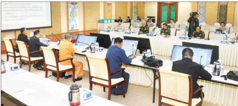
ရှမ်းပြည်ပြန်လည်ထူထောင်ရေးကောင်စီ(RCSS) အတွင်းရေးမှူး (၁) စစ်ဗိုင်းငင်၊ ဗဟိုအလုပ်အမှုဆောင်ကော်မတီဝင် စစ်ဗိုင်းဟန်နှင့် စစ်ဗိုင်းလျန်းတို့ တက်ရောက်ကြည့်ရှုနေသည့် အမျိုးသားစည်းလုံးညီညွတ်ရေးနှင့် ငြိမ်းချမ်းရေးဖော်ဆောင်မှု ဗဟိုဌာန၌ ကျင်းပနေသည့် တွေ့ဆုံဆွေးနွေးပွဲတွင် ပထမနေ့ ဆွေးနွေးပွဲ၌ မပြီးသတ်သေးသည့်ကိစ္စရပ်များ၊ ငြိမ်းချမ်းရေး ညီလာခံကျင်းပရေးကိစ္စ သတင်းစဉ်

နေပြည်တော် စက်တင်ဘာ ၂၂ အမျိုးသားစည်းလုံးညီညွတ်ရေးနှင့် ငြိမ်းချမ်းရေးဖော်ဆောင်မှုညှိနှိုင်းရေးကော်မတီနှင့် ရှမ်းပြည်ပြန်လည်ထူထောင်ရေးကောင်စီ (RCSS) ကိုယ်စားလှယ်အဖွဲ့တို့ ဒုတိယနေ့ ငြိမ်းချမ်းရေးတွေ့ဆုံဆွေးနွေးပွဲကို ယနေ့မနက် ၉ နာရီခွဲတွင် နေပြည်တော်ရှိ အမျိုးသားစည်းလုံးညီညွတ်ရေးနှင့် ငြိမ်းချမ်းရေးဖော်ဆောင်မှု ဗဟိုဌာန၌ ကျင်းပပြုလုပ်သည်။