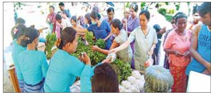
အိမ်ဆောက်ပစ္စည်းများကို လည်း ကောင်း ပြင်ပေါက်ဈေးထက် သက်သာသော ဈေးနှုန်းများဖြင့် ဆက်လက် ရောင်းချပေးရာ ဒေသခံပြည်သူများနှင့် ဌာန ဆိုင်ရာ ဝန်ထမ်းမိသားစုများက ဝမ်းသာအားရဝယ်ယူအားပေးကြ ကြောင်းနှင့် ယခုကဲ့သို့ စားရေး အခက်အခဲ ဖြစ်ပေါ်နေချိန်တွင် သတင်းရရှိ သတင်းစဉ်

စည်သွတ်ဘူးများဖြစ်သည့် အခဲ သားဘူး၊ မျှစ်စားတော်ပဲဘူး၊ ကြက်ဘူး၊ အလူးဘူး၊ ငါးတန် အချိုပေါင်းဘူး၊ ငါးသလောက်ဘူး၊ ငါးပိကြော်ဘူး၊ ပဲထောပတ်ဘူး၊ ပဲခရမ်းဘူး၊ သရက်သီးသနပ်ဘူး စသည့် စားသောက်ကုန်များကို လည်းကောင်း၊ မြန်မာ့စီးပွားရေး ဦးပိုင်အများနှင့် သက်ဆိုင်သော ကုမ္ပဏီလီမိတက် အရောင်းဆိုင် များ၏ စားသောက်ကုန်ပစ္စည်း များ၊ လျှပ်စစ်ပစ္စည်းများနှင့်