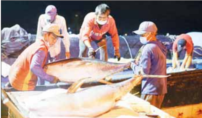
ဒါနန်းမြို့၌ တူနာငါးများကို သယ်ယူလာသည့် ရေလုပ်သားများအား တွေ့ရစဉ်။

ဗီယက်နမ်နိုင်ငံ၏ တူနာငါးတင်ပို့မှုတန်ဖိုးသည် ဩဂုတ်လတွင် ကန့်သတ်လာရာ သန်းအထိ ရောက်ရှိခဲ့ပြီး ယခုနှစ်တွင် အမြင့်ဆုံးဖြစ်ကြောင်း ဗီယက်နမ်ပင်လယ်စာ တင်ပို့သူများနှင့် ထုတ်လုပ်သူများ အသင်း၏ နောက်ဆုံး အချက်အလက်များအရ သိရသည်။