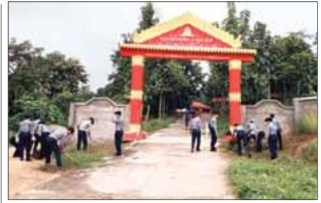
(၅၉) နှစ်မြောက် မြန်မာနိုင်ငံ ရဲတပ်ဖွဲ့နေ့ကို ကြိုဆိုရက်ပြုသော အားဖြင့် ငွေကြေးဆိုင်ရာ မူခင်းတားဆီးနှိမ်နင်းရေးရဲတပ်ဖွဲ့မှ တပ်ဖွဲ့ဝင်များသည် စက်တင်ဘာလတတိယပတ်က ဥဏ္ဍိကသိဒ္ဓိ ရပ်ကွက် ဗုဒ္ဓရတနာပရဟိတကျောင်းတိုက်၌ စုပေါင်းသန့်ရှင်းရေး ဆောင်ရွက်ကြစဉ်။ ရဲခြံကြား