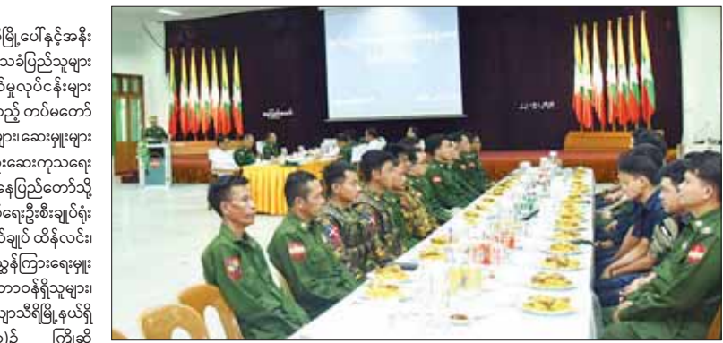
ဗေဒပါရဂူ၊ ဓာတ်မှန်ပါရဂူ၊ ပြည်သူ့ကျန်းမာရေး ပါရဂူ များ၊ ဆေးမှူးများနှင့် သူနာပြု အရာရှိ၊ စစ်သည်များ ပါဝင်ပြီး အဆိုပါအဖွဲ့နှင့်အတူ ရွှေလျားခွဲစိတ်ကုသ ယာဉ်၊ ရွှေလျားဓာတ်မှန်ရိုက်ယာဉ် ပါဝင်ပြီး စစ်ကိုင်း တိုင်းဒေသကြီးအတွင်းရှိ ရွှေဘိုမြို့ပေါ်နှင့် ကျေးလက် နေ ဒေသခံပြည်သူ ၅၅၈၀ တို့အား စက်တင်ဘာ ၁၃ ရက်မှ ၁၉ ရက်အထိလိုအပ်သည့် ကျန်းမာရေးစောင့် ရှောက်မှုလုပ်ငန်းများ ဆောင်ရွက်ပေးခဲ့သည့်အပြင် ကိုဗစ်-၁၉ ရောဂါကာကွယ်ဆေး ထပ်ဆောင်းထိုးနှံ ရန် လိုအပ်သူ ၃၄၂၅၅ အား ကိုဗစ်-၁၉ ရောဂါကာကွယ်

နေပြည်တော် စက်တင်ဘာ ၂၂ စစ်ကိုင်းတိုင်းဒေသကြီး ရွှေဘိုမြို့ပေါ်နှင့်အနီး ပတ်ဝန်းကျင်မှ ကျေးလက်နေ ဒေသခံပြည်သူများ အား ကျန်းမာရေးစောင့်ရှောက်မှုလုပ်ငန်းများ ဆောင်ရွက်ပေးရန် သွားရောက်ခဲ့သည့် တပ်မတော် နှင့် ကျန်းမာရေးဝန်ကြီးဌာနမှ ပါရဂူများ၊ ဆေးမှူးများ နှင့် သူနာပြုများ ပါဝင်သော အထူးဆေးကုသရေး အဖွဲ့သည် ယနေ့နံနက်ပိုင်းက နေပြည်တော်သို့ ပြန်လည်ရောက်ရှိကြရာ ကာကွယ်ရေးဦးစီးချုပ်ရုံး (ကြည်း)မှ တွဲဖက်စစ်ရေးချုပ် ဗိုလ်ချုပ် ထိန်လင်း၊ ဆေးဝန်ထမ်းညွှန်ကြားရေးမှူးရုံး၊ ညွှန်ကြားရေးမှူး နှင့် ကျန်းမာရေးဝန်ကြီးဌာနမှ တာဝန်ရှိသူများ၊ တပ်မတော်အရာရှိကြီးများက ဇေယျာသီရိမြို့နယ်ရှိ တပ်မတော်ဆေးရုံ (ခုတင်-၁၀၀၀)၌ ကြိုဆို နှုတ်ဆက်ကြသည်။ ထို့နောက် နယ်လှည့်အထူးဆေးကုသရေးအဖွဲ့ အား တိုက်စစ်ရေးချုပ်နှင့် ဆေးဝန်ထမ်းညွှန်ကြား ရေးမှူးရုံး၊ ညွှန်ကြားရေးမှူးရုံးတို့က ဂုဏ်ပြုအမှာစကား များ ပြောကြားပြီး ဂုဏ်ပြုမှတ်တမ်းပေးအပ်ကာ နေ့လယ်စာဖြင့် တည်ခင်းစဉ်ခံခဲ့ရသည်။ (ယာဝု) အဆိုပါ နယ်လှည့်အထူးဆေးကုသရေးအဖွဲ့တွင် ဆေးကုသမှုပါရဂူ၊ ခွဲစိတ်ပါရဂူ၊ သားဖွားမီးယပ်ပါရဂူ၊ ကလေးပါရဂူ၊ အရိုးပါရဂူ၊ မျက်စိပါရဂူ၊ နား၊ နှာခေါင်း၊ လည်ချောင်းပါရဂူ၊ သွားပါရဂူ၊ မေ့ဆေးပါရဂူ၊ ရောဂါ