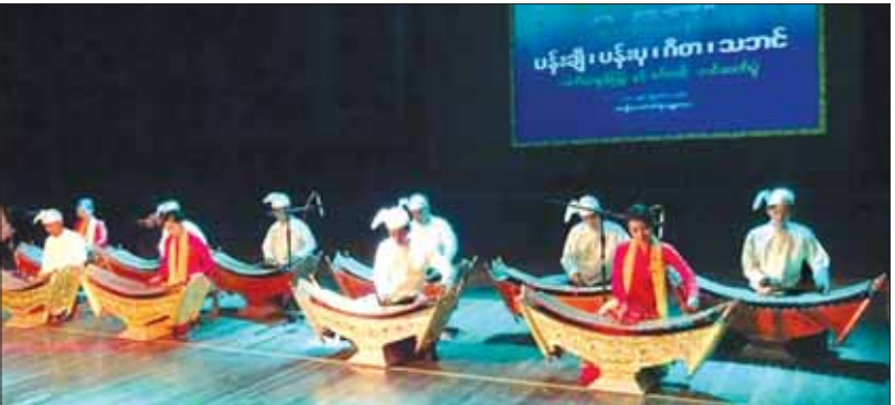
တက္ကသိုလ် ကျောင်းသား ကျောင်းသူများ၏ ပတ္တလားတီးပညာတင်ဆက်မှု အစီအစဉ်တစ်ခု။

လှပပြည့်စုံ တက္ကသိုလ်ပရိဝုဏ် တက္ကသိုလ် နှစ် ၃၀ ခရီးတွင် ကျောင်း၏ဥပဓိရုပ်သည် တစ်နှစ်ထက် တစ်နှစ် ပိုမိုသစ်လွင်တောက်ပလာသည်။ ဒဂုံမြို့သစ်တောင်ပိုင်း မြို့နယ်အဝင်၊ ၁/၅၊ အောင်ဇေယျလမ်း၊ (၂၆) ရပ်ကွက် ရှိ ခြေရေယာ ၅၅ ဒဿ ၀၇၂ ဧက ပေါ်တွင် စိမ်းလန်းစိုပြည်သော သစ်ပင် ပန်းမန်များ၊ အရွက်ဖားဖား ပင်စည် မြင့်မြင့်မားမားဖြင့် ကျွန်းစိုက်ခင်း၊ သရက်စိုက်ခင်းများ၊ လမ်းအချိုးအကျ များ၌ လှပသောပန်းပုရုပ်တုများ၊ ခုံညားသော ရုပ်ရှင်စတူဒီယိုကြီးနှင့်