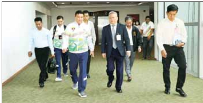
၂၆ ရက်တွင် မြန်မာE-Sports(Dota-2) အသင်း၊ တိုက်ဆက်လက်ထွက်ခွာသွားမည်ဖြစ်ကြောင်း သတင်းစက်တင်ဘာ ၂၄ ရက်တွင် မြားပစ်နှင့် ပိုက်ကျော်ခြင်း ရရှိသည်။ အသင်း၊ အောက်တိုဘာ ၂ ရက်တွင် လှေလှော်အသင်း သတင်းစဉ်

ဒေသကြီးအစိုးရအဖွဲ့ ဥပဒေချုပ် ဦးဌေးအောင်နှင့် အားကစားနှင့် ကာယပညာဦးစီးဌာနမှ တာဝန်ရှိပုဂ္ဂိုလ်များက ရန်ကုန်အပြည်ပြည်ဆိုင်ရာ လေဆိပ်၌ လိုက်လံပို့ဆောင် နှုတ်ဆက်ကြသည်။ (ယာဝု) (၁၉)ကြိမ်မြောက် အာရှအားကစားပြိုင်ပွဲတွင် မြန်မာအားကစားအဖွဲ့အနေဖြင့် အမျိုးသားဘောလုံး/ အမျိုးသမီးဘောလုံး၊ ဝုဂျူး၊ တိုက်ကွမ်ဒို၊ လှေလှော်၊ E-Sports ၂ မြားပစ်၊ ပိုက်ကျော်ခြင်းအားကစားနည်း ခုနစ်မျိုး ဝင်ရောက်ယှဉ်ပြိုင်သွားမည်ဖြစ်ပြီး စက်တင်ဘာ ၁၆ ရက်က အမျိုးသားဘောလုံးအသင်း၊ စက်တင်ဘာ ၁၉ ရက်က အမျိုးသမီးဘောလုံးအသင်း၊ စက်တင်ဘာ ၂၁ ရက်က မြန်မာ E-Sports(AOV) အသင်းတို့ ထွက်ခွာသွားခဲ့ကြပြီး ဆက်လက်၍ စက်တင်ဘာ ၂၄ ရက်တွင် မြန်မာE-Sports(PUBGM) အသင်း၊ စက်တင်ဘာ