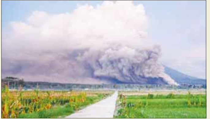
၂၀၂၂ ခုနှစ် ဆိပ်မရွှမ်းတောင်ပေါက်ကွဲမှုကို တွေ့ရစဉ်။

နှင့် နောက်ထပ်ပေါက်ကွဲမှုမှ ရှောင်ရှားနိုင်ရန် အတွက်လည်း သတိပေးထားသည်။ ဆိပ်မရွှမ်းတောင်သည် ပင်လယ်ရေမျက်နှာပြင်အထက် ၃၆၇၆ မီတာတွင်ရှိပြီး တတိယအဆင့်အန္တရာယ်ပေးနိုင်သည့် မီးတောင်လည်းဖြစ်သည်။ ၂၀၂၁ ခုနှစ် ဒီဇင်ဘာလအတွင်း မီးတောင်ပေါက်ကွဲမှုဖြစ်ပွားခဲ့ပြီး လူပေါင်းထောင်နှင့်ချီ၍ နေအိမ်များကို စွန့်ခွာခဲ့ရကာ လူ ၅၀ အသက်ဆုံးရှုံးခဲ့ကြောင်း သိရသည်။ ဆင်ဟွာ