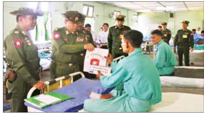
မူ အခြေအနေများအား ရင်းရင်း ထောက်ပံ့ငွေများ ပေးအပ်သည်။ အတွင်း လှည့်လည်ကြည့်ရှု နီးနီး လိုက်လံမေးမြန်း အေးပေး လှည့်လည်ကြည့်ရှု လိုအပ်သည်များ ပေါင်းစပ်ညှိနှိုင်း စကားပြောကြားပြီး အာဟာရ ထို့နောက် တိုင်းမှူးများနှင့် ဆောင်ရွက်ပေးခဲ့ ကြကြောင်း တာဝန်ရှိသူများက ဆေးရုံများ သတင်းရရှိသည်။ သတင်းစဉ်

ဆေးရုံကြီး (ခုတင်-၅၀၀)၊ စစ်ကိုင်းတိုင်းဒေသကြီး ကလေး မြို့ရှိ တပ်မတော်ဆေးရုံနှင့် မန္တလေးတိုင်းဒေသကြီး မန္တလေး မြို့ နန်းမြို့တွင်းရှိ တပ်မတော် ဆေးရုံတို့၌ တက်ရောက် ဆေးကုသမှုခံယူနေသော အရာရှိ၊ စစ်သည်၊ မိသားစုဝင်များ၊ မြန်မာနိုင်ငံ ရတပ်ပွဲဝင်များ၊ ပြည်သူ့စစ်(ဌာနေ)တပ်ပွဲဝင်များ၊ စစ်မှုထမ်းဟောင်း အဖွဲ့ဝင်များနှင့် ဒေသခံပြည်သူများအား ယနေ့ တွင် သက်ဆိုင်ရာ တိုင်းစစ်ဌာန ချုပ် အသီးသီးမှ တိုင်းမှူးများနှင့် တာဝန်ရှိသူများက သွားရောက် ကြည့်ရှု၍ တစ်ဦးချင်း၏ ရောဂါ ဖြစ်ပွားမှုဆေးဝါးကုသပေးထားမှု၊ ကျန်းမာရေး တိုးတက်ကောင်းမွန်