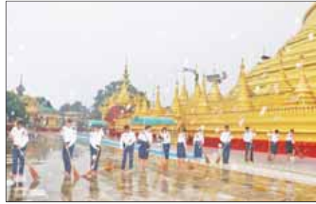
(၅၅)နှစ်မြောက် မြန်မာနိုင်ငံရဲတပ်ဖွဲ့နေ့ကို ကြိုဆိုရက်ပြုသောအားဖြင့် စက်တင်ဘာ ၁၈ ရက်က အမှတ်(၃) ယာဉ်ထိန်းရဲတပ်ဖွဲ့ခွဲ (ဝဲခူး) တပ်ဖွဲ့ခွဲမှူး ရဲမှူး ဖုန်းမြင့် ဦးဆောင်သည့် တပ်ဖွဲ့ဝင်များ ပဲခူးမြို့ ဆုတောင်းပြည့်ရွှေမော်မောစေတီတော်မြတ်ကြီး ရင်ပြင်တွင် စုပေါင်းသန့်ရှင်းရေး ပြုလုပ်စဉ်။

ယင်းနောက် တက်ရောက်လာကြသော မြို့မမြို့ဖွဲ့များနှင့် ဒေသခံပြည်သူများက မြို့နယ်၏ လမ်းပန်းဆက်သွယ်ရေးကောင်းမွန်ရေးနှင့် ဒေသဖွံ့ဖြိုးတိုးတက်ရေးအတွက် လိုအပ်ချက်များကို ဆွေးနွေးတင်ပြကြရာ ရခိုင်ပြည်နယ်ဝန်ကြီးချုပ် ဦးထိန်လင်းက တင်ပြချက်များအပေါ် ပြန်လည်ရှင်းလင်းပြောကြားပြီး တက်ရောက်လာကြသူများကို ရင်းရင်းနှီးနှီး တွေ့ဆုံနှုတ်ဆက်ခဲ့ကြောင်း သတင်းရရှိသည်။ (အပေါ်ပုံ) သတင်းစဉ်