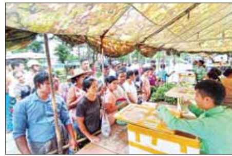
စသည် စားသောက်ကုန်များကို စည်းကောင်း၊ မြန်မာစီးပွားရေး ဦးပိုင် အများနှင့်သက်ဆိုင်သော ကုမ္ပဏီလီမိတက် အရောင်းဆိုင် များ၏ စားသောက်ကုန်ပစ္စည်း များ၊ လျှပ်စစ်ပစ္စည်းများနှင့်

ကောင်း၊ တပ်မတော်စက်ရုံများ နှင့် မြန်မာစီးပွားရေးကော်ပို ရေးရှင်းတို့မှ ထုတ်လုပ်သည့် ခေါက်ဆွဲခြောက်၊ ဘီစကွတ်နှင့် စည်သွတ်ဘူးများဖြစ်သည့် အမဲ သားဘူး၊ မျှစ်စားတော်ပဲဘူး၊ ကြက်သားအာလူးဘူး၊ ငါးတန် အချိုပေါင်းဘူး၊ ငါးသလောက်ဘူး၊ ငါးပိကြော့ဘူး၊ ပဲခရမ်းဘူး၊ သရက်သီးသနပ်ဘူး