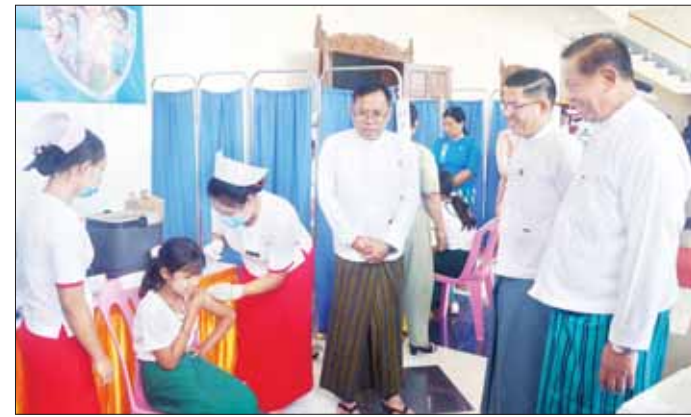
(HPV) ထိုးနှံခြင်း အထိမ်းအမှတ် Video Clip ကိုပြသပြီး နိုင်ငံတော် စီမံအုပ်ချုပ်ရေးကောင်စီအဖွဲ့ဝင်၊ ပြည်နယ်ဝန်ကြီးချုပ်နှင့် တာဝန် ရှိသူများက စုပေါင်းဖွဲ့စည်းတမ်းတင် ဇာတ်ပုံရိုက်ကြသည်။

ဤအသက် ၉ နှစ်နှင့် ၁၀ နှစ် ပြည့်ပြီးသော မိန်းကလေးများကို ထိုးနှံပေးခဲ့ပြီး ၂၀၂၃ ခုနှစ် စက်တင်ဘာလတွင် ကျောင်း အခြေပြုထိုးနှံခြင်းနှင့် အောက်တိုဘာလတွင် ပြည်သူ့လူထုအခြေပြု ကာကွယ်ဆေးထိုးနှံခြင်းအစီအစဉ် များဖြင့် ထိုးနှံပေးလျက်ရှိကြောင်း၊ ပြည်နယ်အတွင်းရှိကျောင်းသူများ၊ ကျောင်းပြင်ပမိန်းကလေးငယ်များ အားလုံး သားအိမ်ခေါင်းကင်ဆာ ရောဂါ ကာကွယ်ဆေး (HPV) ထိုးနှံနိုင်ရေးအတွက် ဌာနဆိုင်ရာ တာဝန်ရှိသူများ၊ လူမှုရေးအသင်း အဖွဲ့များက ဒေသခံပြည်သူများနှင့် အတူ တက်ညီလက်ညီ ပူးပေါင်း ဆောင်ရွက်သွားကြရန် လိုကြောင်း ပြောကြားသည်။