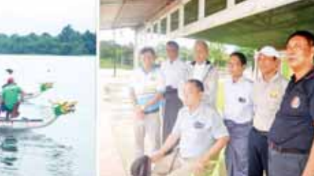
အာကာရီး၊ ဓာတ်ပုံ - တင်စိုး

များ ဝင်ရောက်ယှဉ်ပြိုင်ကြမည် ဖြစ်သည်။(၁၉)ကြိမ်မြောက် အာရှ အားကစားပြိုင်ပွဲ၌ မြန်မာနိုင်ငံ ကိုယ်စားပြု ဝင်ရောက်ယှဉ်ပြိုင် မည့် အားကစားနည်းများမှာ အမျိုးသား၊ အမျိုးသမီးဘောလုံး၊ ယှဉ်ပြိုင်သွားမည့် ဖြစ်ကြောင်း လေ့လှော်ပုဂ္ဂိုလ်များဖြားပစ်၊ E-sports၊ သိရသည်။ ပိုက်ကျော်ခြင်း၊ တိုက်ကွမ်ဒို အာကာရီး၊ ဓာတ်ပုံ - တင်စိုး