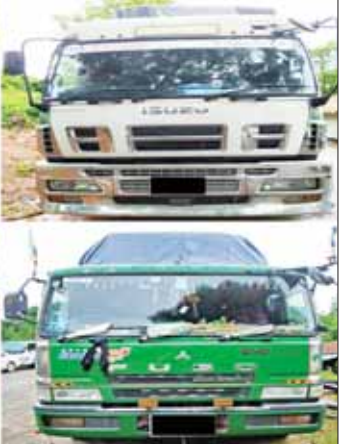
စာမျက်နှာ ၉ ကော်လံ ၂ င

နေပြည်တော် စက်တင်ဘာ ၁၈ တရားမဝင်ကုန်သွယ်မှုတိုက်ဖျက် ရေးဦးဆောင်ကော်မတီ၏ ကြိုးကြပ် ကွပ်ကဲမှုဖြင့် တရားမဝင်ကုန်သွယ် မှုများကို ဥပဒေနှင့်အညီ ထိရောက်စွာ တားဆီးအရေးယူနိုင် ရေး ဆောင်ရွက်လျက်ရှိရာ စက်တင်ဘာ ၁၅ ရက်တွင် မွန် ပြည်နယ် တရားမဝင်ကုန်သွယ်မှု တိုက်ဖျက်ရေးအထူးအဖွဲ့၏ စီမံ ခန့်ခွဲမှုဖြင့် တာဝန်ကျူးပေါင်း အဖွဲ့က စစ်ဆေးမှုများ ဆောင်ရွက်ခဲ့ ရာ မော်လမြိုင်တက္ကသိုလ်ပတ်လမ်း စမ်းကြိုးစီးပွိုင့်အနီး၌ မော်တော် ယာဉ် တစ်စီးပေါ်မှ တရားဝင် စာမျက်နှာ ၉ ကော်လံ ၂ င