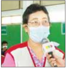
ဆေးကုသမှုခံယူသည့် ဒေသခံပြည်သူများ။

လေးဦးနှင့် မျက်စိခွဲစိတ်လူနာ လေးဦးတို့ကို ရွှေလျားခွဲစိတ်ယာဉ်ဖြင့် ခွဲစိတ်ကုသမှုများ ဆောင်ရွက်ပေးသည်။ ထို့ပြင် ဓာတ်မှန်ရိုက် လူနာ ၃၈ ဦး၊ Ultrasound ဖြင့် စမ်းသပ်စစ်ဆေးလူနာ ၄၉ ဦး၊ ECG စက်ဖြင့် နှလုံးစမ်းသပ် လူနာ ၂၉ ဦးနှင့် ဓာတ်ခွဲစစ်ဆေး လူနာ ၅၅ ဦးတို့ကို ရွှေလျား ဓာတ်မှန်ရိုက်ယာဉ်ဖြင့်ဖြင့် ရောဂါရှာဖွေစစ်ဆေးသပ် စစ်ဆေးပေးခြင်း များ ဆောင်ရွက်ပေးသည့်အပြင် ကျန်းမာရေးဝန်ကြီးဌာန အစီအစဉ်ဖြင့် ကိုဗစ်-၁၉ ရောဂါကာကွယ်ဆေး ထပ်ဆောင်းထိုးနှံရန် လိုအပ်သူ ၂၃ ဦးကို ကာကွယ်