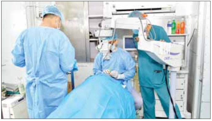
မြို့ အမှတ် (၁) ရပ်ကွက်ကနေ လာရောက်ပြီး ဆေးကုသခြင်း ဖြစ်ပါတယ်။ ကျွန်တော် ခံစားနေ

ပြီး ဆေးကုမှု ခံယူတာပါ။ ကျွန်ုပ်အခုလာကတောက ဒုတိယအကြိမ် လာရောက်ကုသခြင်း ဖြစ်ပါတယ်။ ပထမအကြိမ်တုန်းက နှလုံးရောဂါကုသခဲ့တာပါ။ သက်သာပါတယ်။ အခုဒုတိယအကြိမ်က မျက်စိလာရောက်ကုသခြင်းဖြစ်ပါတယ်။ မျက်စိက ခွဲရမယ်လို့ ပြောပါတယ်။ အခုလို့ လာရောက်ကုသဖို့အတွက် စီစဉ်ပေးတဲ့ ဗိုလ်ချုပ်မှူးကြီး မင်းအောင်လှိုင်ကိုလည်း