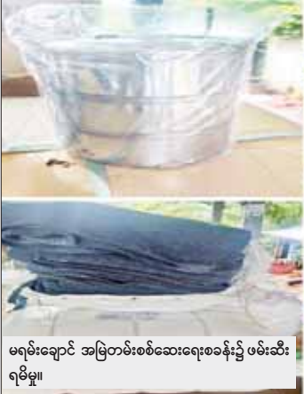
မရမ်းချောင်း အမြဲတမ်းစစ်ဆေးရေးစခန်း၌ ဖမ်းဆီး ရမိမှု။