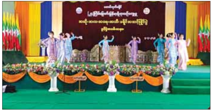
တောင်ကုတ်ခရိုင် အဆို၊ အက၊ အရေး၊ အတီး ပြိုင်ပွဲဖွင့်ပွဲကို စက်တင်ဘာ ၅ ရက်က ပြုလုပ်စဉ်။

စာမျက်နှာ ၁၁ မှ ဦးစားပေးရွှေပြောင်းပြီး ကျန်သူများကိုပါ အသုတ် လိုက် ပြောင်းရွှေ့ပေးခဲ့ရာ IDP စခန်း ၁၇ ခုမှ ရွှေပြောင်းရန်လိုအပ်သော လူဦးရေ ၆၃၃၀၂ ဦးကို ဘေးလွတ်ရာ နေရာဒေသများသို့ ရွှေပြောင်းပေး ခဲ့ကြသည်။ မုန်တိုင်းဝင်ရောက် တိုက်ခတ်ပြီးချိန်မှာ လည်း ထိုနေရာများအတွက် ရိက္ခာနှင့် တည်ဆောက် ရေးလုပ်ငန်းသုံးပစ္စည်းများ ထောက်ပံ့ပေးခဲ့ပါသည်။