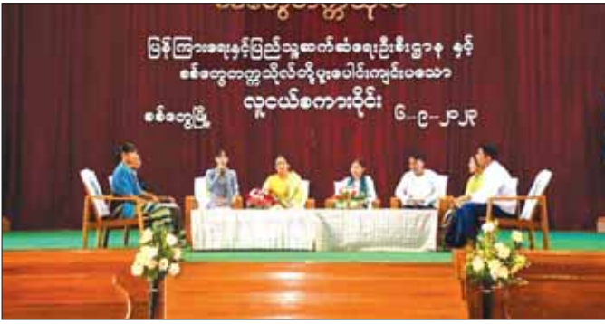
လူငယ်ကမ္ဘာ့မြိုင်တင်ရေးအတွက် ရည်ရွယ်ကျင်းပခဲ့သော စစ်တွေတက္ကသိုလ် လူငယ်စကားပိုင်း။