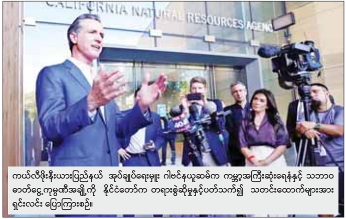
ကယ်လီဖိုးနီးယားပြည်နယ် အုပ်ချုပ်ရေးမှူး၊ ဂါဗင်နယူဆစ်က ကမ္ဘာ့အကြီးဆုံးရေနံနှင့် သဘာဝ ဓာတ်ငွေ့ကုမ္ပဏီအချို့ကို နိုင်ငံတော်က တရားစွဲဆိုမှုနှင့်ပတ်သက်၍ သတင်းထောက်များအား ရှင်းလင်း ပြောကြားစဉ်။

ရေနံကုမ္ပဏီများ အနေဖြင့် ရာသီဥတု ဖောက်ပြန်မှုကြောင့် ဖြစ်ပေါ်လာသော အင်အားပြင်း မှန်တိုင်းတိုက်ခတ်မှု၊ တောမီးလောင်မှုများ၊ အပူလှိုင်းကူးမှု၊ မိုးခေါင်မှုနှင့် ရေကြီးရေလျှံမှုတို့ကြောင့် ထိခိုက်မှုများကို ပြန်လည် ထုထောင်ရေး ကြိုးပမ်းမှုများအတွက် သင့်တင့်မျှတသော ထောက်ပံ့မှုများ ဆောင်ရွက်ပေးရန် တောင်းဆိုထားသည်။ ကော်ပိုရေးရှင်းကြီးများ ကို တာဝန်ခံရန် နောက်ထပ် လုပ်ဆောင်မှုတစ်ခုအနေဖြင့် ကယ်လီဖိုးနီးယားပြည်နယ် လွှတ်တော် အစည်းအဝေးသည် ရေနံနှင့် သဘာဝ ဓာတ်ငွေ့ကုမ္ပဏီများနှင့် ပတ်သက်၍ ကော်ပိုရေးရှင်းကြီးများမှ လက်လီရောင်းချသည့် ကုမ္ပဏီများအထိ ၎င်းတို့၏ မှန်လုံအိမ် ဓာတ်ငွေ့ထုတ်လွှတ်မှုကို ဖော်ထုတ်ရန်လိုအပ်သည့် ဥပဒေကြမ်း တစ်ရပ်ကို ငြီးခဲ့သည့်တစ်ပတ်က အတည်ပြုခဲ့သည်။ ဆင်ဟွာ