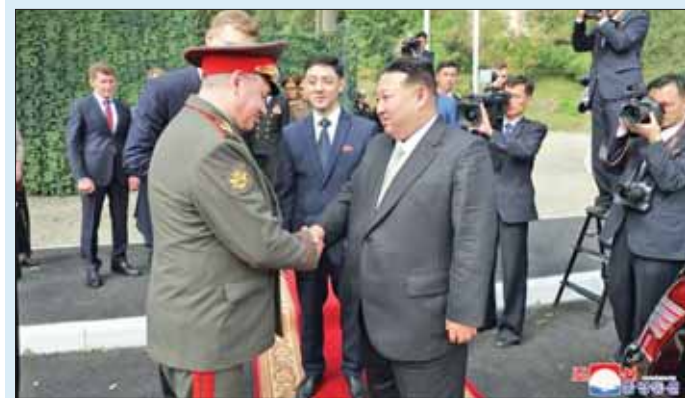
ရှာား ကာကွယ်ရေးဝန်ကြီး ဆာဂျီ ရှိဂူနှင့် မြောက်ကိုရီးယားခေါင်းဆောင် ကင်ဂျူအန်း။

ပြီယမ်း၊ စက်တင်ဘာ ၁၇ မြောက်ကိုရီးယားခေါင်းဆောင် ကင်ဂျူအန်းသည် ရှာားပစ်ဖိတ်ရေတပ်အခြေစိုက်စခန်းကို ကြည့်ရှုရန်နှင့် ရှာားကာကွယ်ရေးဝန်ကြီး ဆာဂျီ ရှိဂူကို တွေ့ဆုံရန်အတွက် ရှာားနိုင်ငံ အရှေ့ဖျားဒေသရှိ ဗလာဒီဗော့စတော့သို့ သွားရောက်ခဲ့ကြောင်း သိရသည်။