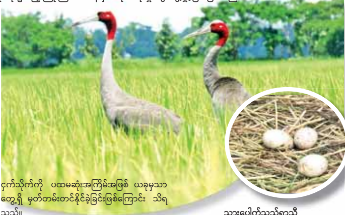
ငှက်သိုက်ကို ပထမဆုံးအကြိမ်အဖြစ် ယခုမှသာ တွေ့ရှိ မှတ်တမ်းတင်နိုင်ခဲ့ခြင်းဖြစ်ကြောင်း သိရသည်။

သုံးလုံးဥသည့်ဖြစ်စဉ် ရှားပါး ကြိုးကြာခေါင်းနီငှက် (Sarus Crane Grus antigone) သည် အပြည်ပြည်ဆိုင်ရာ သဘာဝ ထိန်းသိမ်းရေးအဖွဲ့ (IUCN) ၏ အနီရောင်စာရင်းအရ မျိုးသုဉ်းအန္တရာယ် ကျရောက်သွားနိုင်သောအဆင့် (Vulnerable) အဖြစ် သတ်မှတ်ခြင်းခံထားရသည်။ ယင်းငှက်ကို တွေ့ရှိနိုင်သော အခြားနိုင်ငံများ၏ လေ့လာတွေ့ရှိချက်မှတ်တမ်းများအရ ၎င်းတို့သည် ဥနှစ်လုံးမှ သုံးလုံးအထိ ဥလေ့ရှိကြကာ သုံးလုံးဥ သည့်ဖြစ်စဉ်မှာ ရှားပါးကြောင်း၊ မှတ်တမ်းများအရ ၁၉၇၃ ခုနှစ်တွင် အိန္ဒိယနိုင်ငံ၌ ဥသုံးလုံးဥသည့်အသိုက် တစ်ခုနှင့် ၂၀၀၇ ခုနှစ်တွင်လည်း တစ်ခုကို ထပ်မံ တွေ့ရှိခဲ့သည်။ အလားတူ ၂၀၀၉ ခုနှစ်တွင် ကမ္ဘောဒီးယားနိုင်ငံ၌ ဥသုံးလုံးဥသည့် အသိုက်နှစ်ခုကို တွေ့ရှိခဲ့ပြီး မြန်မာနိုင်ငံတွင်မူ ဥသုံးလုံးဥသည့်