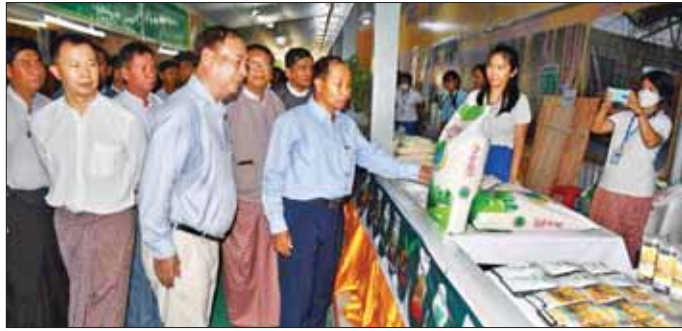
MSME များသည်ပြည်သူလူထု၏အလုပ်အကိုင်အခွင့်အလမ်းများစွာကို ဖန်တီးပေးနိုင်စွမ်းရှိခြင်းကြောင့် ရေရှည်တည်တံ့ခိုင်မြဲလာစေရေးနှင့် လုပ်သားကိုင်သား ရှိသည့် စီးပွားရေးဝန်းကျင်ကောင်းများ ဖြစ်ထွန်းလာပြီး ဘက်စုံဖွံ့ဖြိုးတိုးတက်လာရန် လိုအပ်လျက်ရှိပါကြောင်း ပြောကြားသည်။

ရှေးဦးစွာတိုင်းဒေသကြီးဝန်ကြီးချုပ်ဦးမြတ်ကျော် က အသေးစား၊ အငယ်စားနှင့် အလတ်စား စီးပွား ရေးလုပ်ငန်းများသည် နိုင်ငံစီးပွားရေးဖွံ့ဖြိုးတိုးတက် မှု၏ အဓိကအသက်သွေးကြောပင်ဖြစ်ကြောင်း၊ နိုင်ငံစီးပွားရေး၏ ၉၀ ရာခိုင်နှုန်းကျော်သည် MSME လုပ်ငန်းများဖြစ်သည်အတွက် လုပ်ငန်းများ ပိုမို ရှင်သန်လာစေရန် ချေးငွေရရှိရေး၊ ကုန်ကြမ်းရရှိရေး နှင့် လျှပ်စစ်ရရှိရေး လိုအပ်ချက်များအား ဖြေလျှော့၊ ဖြည့်ဆည်းပေးမှုများ ဆောင်ရွက်လျက်ရှိကြောင်း၊