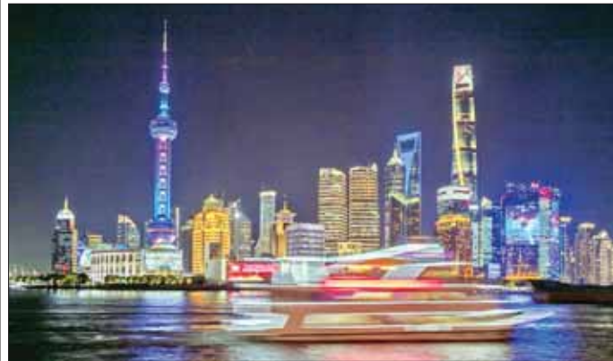
ရှန်ဟိုင်းမြို့အရှေ့ပိုင်း ညအလှကို တွေ့ရစဉ်။

ရှန်ဟိုင်းမြို့အတွင်း ခရိုင် ၁၆ ခုတွင်လည်း ယဉ်ကျေးမှုနှင့် ခရီးသွားလာမှုဆိုင်ရာ လုပ်ငန်းများ ပြုလုပ်သွားမည်ဖြစ်သည်။ ၂၀၂၃ ခုနှစ် ပထမနှစ်ဝက် ကာလအတွင်း ရှန်ဟိုင်းသို့ ပြည်တွင်းခရီးသွား ၁၃၉ သန်းကျော် လာရောက်လည်ပတ်ခဲ့ပြီး အခွန်ငွေ ယွမ် ၁၅၅ ဘီလီယံ ရှာဖွေပေးနိုင်ခဲ့သည်ဟု ရှန်ဟိုင်း ယဉ်ကျေးမှုနှင့် ခရီးသွားလာမှုဆိုင်ရာ မြို့နယ်ပယ် စီမံအုပ်ချုပ်ရေးရုံး၏ အချက်အလက်များအရ သိရသည်။ နှစ်စဉ်ကျင်းပမြဲဖြစ်သည့် ရှန်ဟိုင်းခရီးသွားပွဲတော်ကို ၁၉၉၀ ပြည့်နှစ်မှ စတင်ကာ ကျင်းပခဲ့ခြင်းဖြစ်သည်။ ဆင်ဟွာ