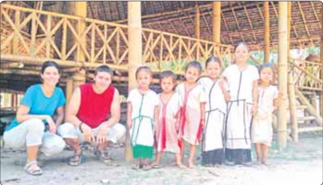
ယခင်က လာရောက်လည်ပတ်ကြသည့် နိုင်ငံခြားသားများနှင့် တလာဂုဏ်လူမျိုးကလေးငယ်များ။