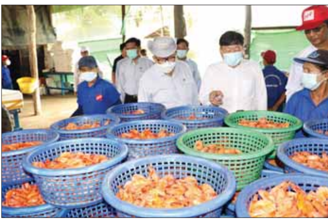
ဒုတိယဝန်ကြီး ခေါက်တာအောင်ကြီးနှင့် အဖွဲ့ဝင်များ ပြည်ပသို့တင်ပို့မည့် ပုစွန်ပြုတ်ခြောက်များကို ကြည့်ရှုစစ်ဆေးစဉ်။

“အဲဒါ ငါသိပါတယ်ကွာ။ ငါက မင်းထက်အရင် ထမင်းစားတာပါ။”