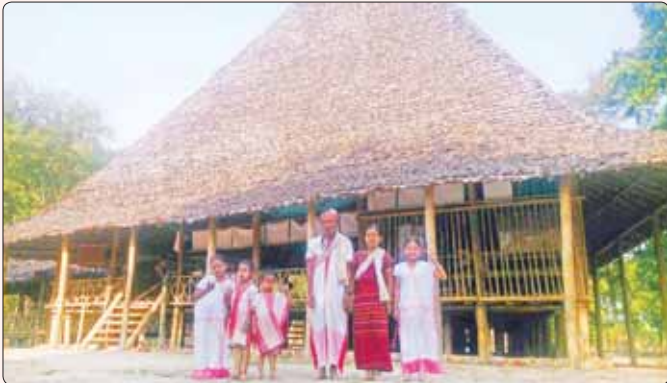
သုံးမြောင့်ဇရပ်ရှေ့၌တွေ့ရသည့် တလာဂုဏ်လူမျိုး မိသားစုတစ်စု။

ဒါပေမယ့် စိတ်မကောင်းစရာကတော့ အခုဆိုရင် သုံးမြောင့်ဇရပ်က မရှိတော့ပါဘူး။ သုံးမြောင့်ဇရပ်ကို ဝါး၊ ကြိမ်၊ နှီးတွေနဲ့ပဲ ပြုလုပ်ထားပြီး သံတစ်ချောင်းမှ မသုံးထားပါဘူး။ သုံးမြောင့်ဓမ္မာရုံလို့လည်း သုံးနှုန်းပါတယ်။ ကရင်၊ ပအိုဝ်း၊ မြောက်လူမျိုးစုသုံးစုကို ကိုယ်စားပြုထားတာဖြစ်တယ်လို့ ဒေသခံတစ်ဦးက စာရေးသူကို ပြောပြပါတယ်။ အဲဒီနေ့မှာ ရွာခံတွေစုပေါင်းပြီး ဇရပ်မှာ ထမင်း