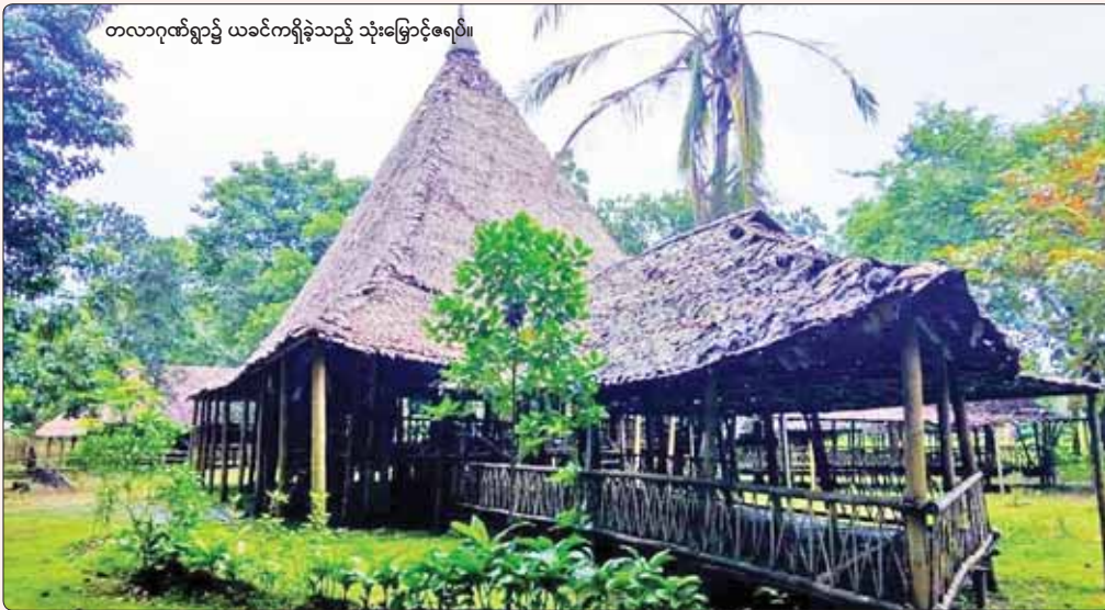
တလာဂုဏ်ရွာ၌ ယခင်ကရှိခဲ့သည့် သုံးမြောင့်ဇရပ်။

လက်ဆုံစားကြတယ်။ ဧည့်သည်တွေကိုလည်း အတူတူဖိတ်ခေါ်ပြီး အတူတူစားကြတယ်။ ဟင်းကတော့ သက်သတ်လွတ်ဟင်းပါ။ ဆီနဲ့အချိုမှုန့်၊ သိပ်မသုံးဘူးလို့ သိရပါတယ်။