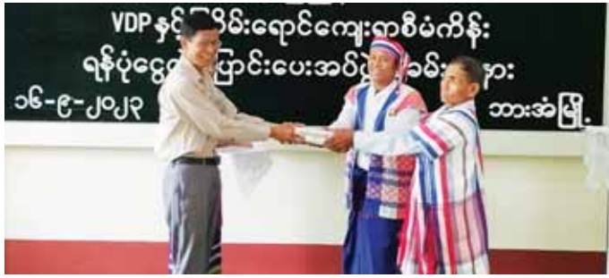
အဝတ်အထည်ရက်လုပ်နေမှုများကို ကြည့်ရှုအားပေး ပြီး သင်တန်းသားအိပ်ဆောင်နှင့် စားရိပ်သာတို့ကို ကြည့်ရှုစစ်ဆေးကာ လုပ်ငန်းလုံခြုံရေးအချက်များအပေါ် ညှိနှိုင်းပေါင်းစပ် ဆောင်ရွက်ပေးသည်။

ဆက်လက်၍ ဒုတိယဝန်ကြီးနှင့် အဖွဲ့သည် ဘားအံမြို့ ကျေးလက်ဒေသ ဖွံ့ဖြိုးတိုးတက်ရေးဦးစီး