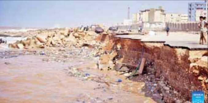
လစ်ဗျားနိုင်ငံ ဒါနာမြို့၌ ရေကြီးရေလျှံမှုဖြစ်ပွားသော နေရာတစ်ခုကို စက်တင်ဘာ ၁၁ ရက်က တွေ့ရစဉ်။

နိုင်ငံရပ်ခြားခရီးစဉ်မှာ အာဆီယံထိပ်သီးအစည်း အဝေး ဖြစ်သည်။ ဝန်ကြီးချုပ်သည် လာမည့်လတွင် ပေကျင်းမြို့၌ ကျင်းပမည့် ရုပ်ဝန်းနှင့် ပိုးလမ်းမထိပ်သီးအစည်း အဝေးသို့ တက်ရောက်ရန်လည်း စီစဉ်ထားသည်။ အင်န်အိတ်ချီကေ