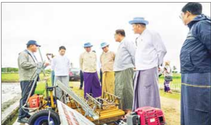
ကျယ်ပြန့်ပြန့် အသုံးပြုလာ ကိရိယာ စက်ရုံ (အင်းကုန်း) မှ ထုတ်လုပ်နိုင်ခဲ့ကြောင်း သိရ နိုင်စေရေး စက်မူလယ်ယာဦးစီး ခြောက်တန်းသွား လက်ဆွဲ သရုပ် ပြသခြင်း ဖြစ်ပြီး မြန်မာ့လယ်ယာသုံး စက် ကောက်စိုက်စက်ကို စမ်းသပ် သတင်းစဉ်

သရုပ်ပြသချိန်တွင် ပြည့်စုံ ကောင်းမွန်သောအင်ဂျင်နီယာများရရှိ ရန် လိုအပ်ချက်များကို ဆွေးနွေး မှာကြားသည်။ စမ်းသပ်ထုတ်လုပ်နိုင် စက်မူလယ်ယာ ဦးစီးဌာန အနေဖြင့် တောင်သူများလယ်ယာ လုပ်ငန်းတွင် စရိတ်သက်သာစွာ ဖြင့် အလုပ်တွင်ကျယ်စွာ ဆောင်ရွက်နိုင်စေမည့် လယ်ယာသုံး စက်ကိရိယာများ အသုံးပြုနိုင်ရေး အတွက် သုတေသနပြုလုပ်ခြင်း၊ စမ်းသပ်တီထွင်ခြင်း လုပ်ငန်းများ ကို စဉ်ဆက်မပြတ် ဆောင်ရွက် လျက်ရှိပြီး လယ်ယာလုပ်သား များပါးပြုပြင်သွားရန်ကို ကျော်လွှားနိုင်ရန်နှင့် တန်ဖိုးနည်း ကောက်စိုက်စက်များကို ကျယ်