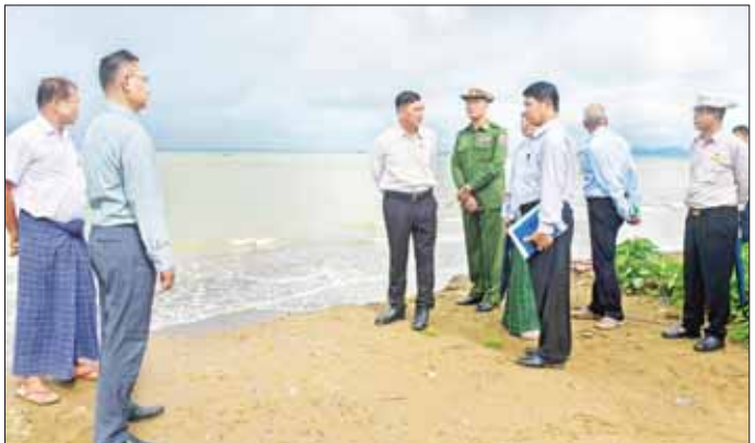
မူ အခြေအနေတို့ကို လှည့်လည် ကြည့်ရှုစစ်ဆေးကြသည်။ မွန်းလွှဲပိုင်းတွင် ပြည်နယ် ဝန်ကြီးချုပ်နှင့်အဖွဲ့သည် ရခိုင် ပြည်နယ်အစိုးရအဖွဲ့၊ ရုံး၌ သဘာဝဘေး ပြန်လည်ထူထောင်ရေး အစည်းအဝေး ဆုံးဖြတ်ချက် ဆိုင်ရာ လုပ်ငန်းညှိနှိုင်း အစည်းအဝေးသို့ တက်ရောက်ကြပြီး ပြည်နယ် ထူထောင်ရေးဆိုင်ရာ လုပ်ငန်းများနှင့် စပ်လျဉ်း၍ တင်ထွန်း(ပြန်/ဆက်)

တွေ့ဆုံစဉ် ပြည်နယ်ဝန်ကြီးချုပ် ဦးထိန်လင်းက ပလ္လင်ပြင် ကျေးရွာသို့ မိုခါမုန့်တိုင်း မတိုက်ခတ်မီက နိုင်ငံစီးပွားမတည်ရန်ပုံ ငွေ ထုတ်ချေးပေးရန် တစ်ကြိမ် ရောက်ရှိခဲ့ပါကြောင်း၊ ပလ္လင်ပြင် ကျေးရွာသည် ပင်လယ်နှင့် နီးကပ်ပြီး မုန့်တိုင်းဒဏ်ကြောင့် ထိခိုက် ဖြစ်ကြောင်း ပြောကြားသည်။ ထို့နောက် ပြည်နယ်ဝန်ကြီးချုပ်နှင့်အဖွဲ့သည် ကျေးရွာအတွင်း သောက်သုံးရေ ကောင်းမွန်စွာ ရရှိရေး၊ ရွာတွင်းလမ်းများ ကောင်းမွန်ရေးနှင့် ပင်လယ်ဒီရေတိုက်စား ကြီးစားဆောင်ရွက်ပေးသွားမည် ဖြစ်ကြောင်း ပြောကြားသည်။