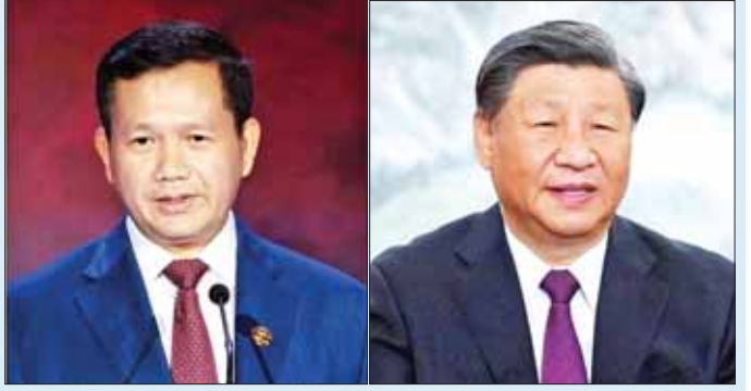
ကမ္ဘောဒီးယားဝန်ကြီးချုပ် ဟွန်မာနက် (ဝဲ)နှင့် တရုတ်သမ္မတ ရှီကျင့်ဖျင်။

တရုတ်နိုင်ငံခြားရေးဝန်ကြီးဌာနသည် စက်တင် ဘာ ၁၁ ရက်တွင် ပုံမှန်သတင်းစာ ရှင်းလင်းပြောပြလုပ် ခဲ့ပြီး တရုတ်ဝန်ကြီးချုပ် လီချန်း၏ ဖိတ်ကြားချက် အရ ဟွန်မာနက်အနေဖြင့် တရုတ်နိုင်ငံသို့ စက်တင် ဘာ ၁၄ ရက်တွင် ရောက်ရှိမည်ဖြစ်ကြောင်း သိရသည်။ ထို့အပြင် ၎င်းတရုတ်နိုင်ငံ၌ ရှိနေစဉ် အတွင်း သမ္မတ ရှီကျင့်ဖျင်သည် ကမ္ဘောဒီးယား ဝန်ကြီးချုပ်ကို တွေ့ဆုံသွားမည်ဖြစ်ကြောင်း အဆိုပါ ဝန်ကြီးဌာနက ပြောသည်။