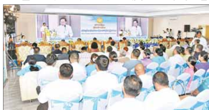
ကျန်းမာရေးဝန်ကြီးဌာန ပဟိုကာကွယ်ဆေး သို့လှောင်အအေးခန်း လေးထပ်ဆောင်အဆောက်အဦးသစ်ကို ဖွင့်ပွဲကျင်းပခြင်းဖြစ်ပြီး ဖွင့်ပွဲလှည့်ပေးသည်။

နေပြည်တော် စက်တင်ဘာ ၁၂ - ကျန်းမာရေးဝန်ကြီးဌာန ပြည်သူ့ကျန်းမာရေးဦးစီးဌာန ပဟိုကာကွယ်ဆေး သို့လှောင်အအေးခန်းရှိ လေးထပ်ဆောင် အဆောက်အဦးသစ် ဖွင့်ပွဲအခမ်းအနားကို ယနေ့ ဖွန်းလွှဲ ၁ နာရီက ရန်ကုန်တိုင်းဒေသကြီး မရမ်းကုန်းမြို့နယ် မင်းဓမ္မလမ်း ပဟိုကာကွယ်ဆေး သို့လှောင်အအေးခန်း (ရန်ကုန်)၌ ကျင်းပသည်။