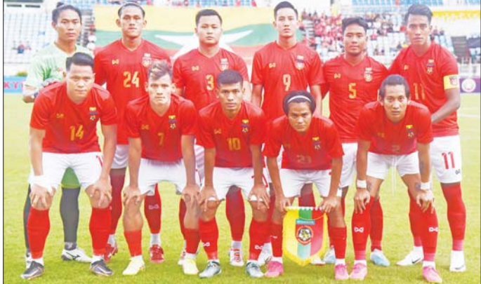
စာမျက်နှာ ၁၇ ကော်လံ ၁ ❖

ရန်ကုန် စက်တင်ဘာ ၁၀ မြန်မာ့လက်ရွေးစင် အသင်းနှင့် နီပေါလက်ရွေးစင် အသင်းတို့၏ ခြေစမ်းပွဲ ဒုတိယပွဲစဉ်ကို စက်တင်ဘာ ၁၁ ရက် (ယနေ့) ညနေ ၅ နာရီတွင် သုဝဏ္ဏကွင်း၌ ဆက်လက် ကျင်းပမည်ဖြစ်ပါသည်။ စက်တင်ဘာ နိုင်ငံတကာ ရက်သတ္တပတ်တွင် မြန်မာအသင်းနှင့် နီပေါအသင်းသည် ခြေစမ်းပွဲနှစ်ပွဲကစားခြင်းဖြစ်ပြီး စက်တင်ဘာ ၈ ရက်တွင် ကစားသည့် ပထမခြေစမ်းပွဲတွင် ရိုးမရှိသရေကျခဲ့ပါသည်။