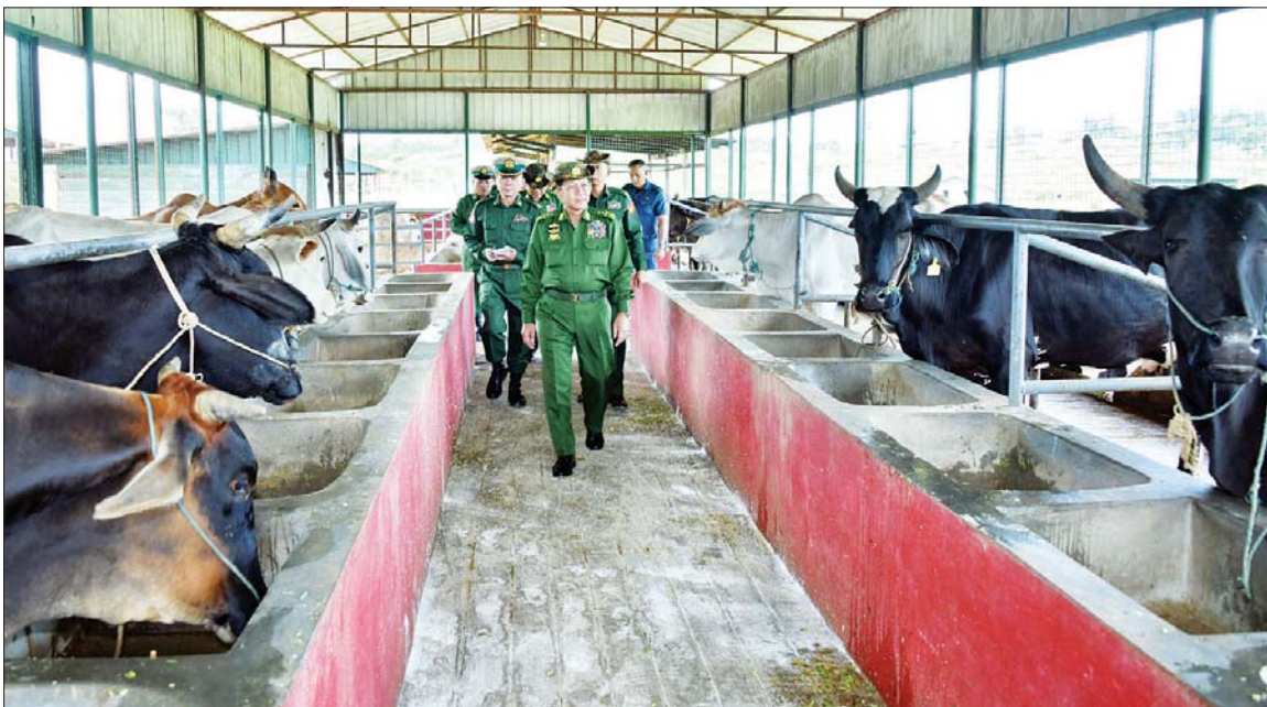
နိုင်ငံတော်စီမံအုပ်ချုပ်ရေးကောင်စီဥက္ကဋ္ဌ တပ်မတော်ကာကွယ်ရေးဦးစီးချုပ် ဗိုလ်ချုပ်မှူးကြီး မင်းအောင်လှိုင်နှင့် အဖွဲ့ဝင်များ တိုင်းစစ်ဌာနချုပ် စိုက်ပျိုးမွေးမြူရေးစခန်းသို့ နို့စားနွား၊ အသားစားနွားနှင့် ဒေသနွားများ မွေးမြူထားရှိမှုကို ကြည့်ရှုစစ်ဆေးစဉ်။

နေပြည်တော် စက်တင်ဘာ ၁၀ နိုင်ငံတော်စီမံအုပ်ချုပ်ရေးကောင်စီ ဥက္ကဋ္ဌ တပ်မတော်ကာကွယ်ရေးဦးစီးချုပ် ဗိုလ်ချုပ်မှူးကြီး မင်းအောင်လှိုင်သည် ခရီးစဉ်တွင် လိုက်ပါလာသည့် အဖွဲ့ဝင်များ၊ ရှမ်းပြည်နယ်ဝန်ကြီးချုပ်၊ အရှေ့မြောက်တိုင်းစစ်ဌာနချုပ် တိုင်းမှူးနှင့် တာဝန်ရှိသူများ လိုက်ပါ၍ ယနေ့နံနက်ပိုင်းတွင် အရှေ့မြောက်တိုင်းစစ်ဌာနချုပ် ကုန်းမြင့်(၁) စိုက်ပျိုး မွေးမြူရေးစခန်းသို့ သွားရောက်ကြည့်ရှု စစ်ဆေးသည်။