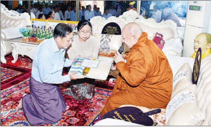
နိုင်ငံတော်စီမံအုပ်ချုပ်ရေးကောင်စီဥက္ကဋ္ဌ နိုင်ငံတော်ဝန်ကြီးချုပ် ဗိုလ်ချုပ်မှူးကြီး မင်းအောင်လှိုင်နှင့် ဇနီး ဒေါ်ကြူကြူလှ သီရိမင်္ဂလာမန်ဆူရှမ်းကျောင်းတိုက် ဆရာတော်ကြီးအား လှူဖွယ်ပစ္စည်းများ ဆက်ကပ်လှူဒါန်းစဉ်။