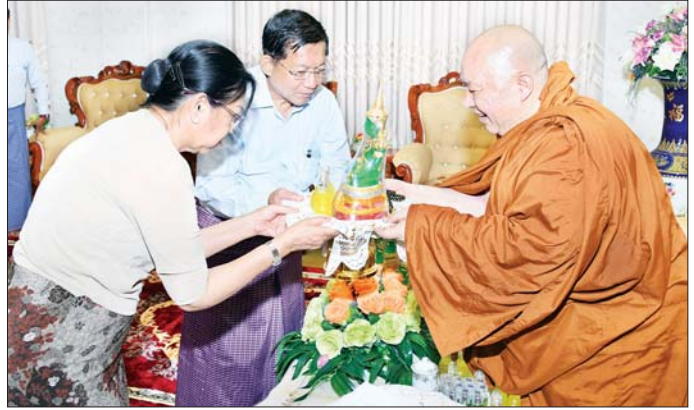
နိုင်ငံတော်စီမံအုပ်ချုပ်ရေးကောင်စီဥက္ကဋ္ဌ နိုင်ငံတော်ဝန်ကြီးချုပ် ဗိုလ်ချုပ်မှူးကြီး မင်းအောင်လှိုင်နှင့် ဇနီး ဒေါ်ကြူကြူလှ အား သီရိမင်္ဂလာမန်ဆူရှမ်းကျောင်းတိုက် ဆရာတော်က ဓမ္မလက်ဆောင်များ ပေးအပ်စဉ်။