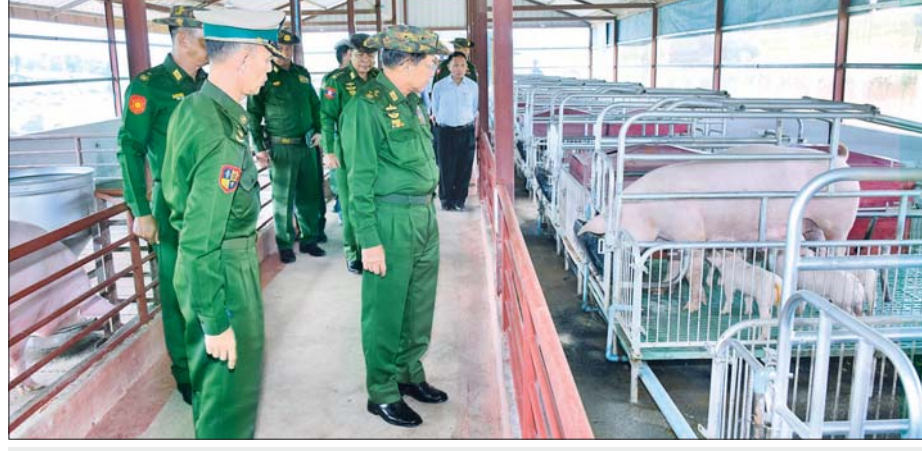
နိုင်ငံတော်စီမံအုပ်ချုပ်ရေးကောင်စီဥက္ကဋ္ဌ တပ်မတော်ကာကွယ်ရေးဦးစီးချုပ် ဗိုလ်ချုပ်မှူးကြီး မင်းအောင်လှိုင်နှင့် အဖွဲ့ဝင်များ တိုင်းစစ်ဌာနချုပ် စိုက်ပျိုးမွေးမြူရေးစခန်း၌ DYL ဝက်များ မွေးမြူထားရှိမှုကို ကြည့်ရှုစစ်ဆေးစဉ်။

နို့စားနွား၊ အသားစားနွား၊ ဒေသ နွား၊ DYL ဝက်၊ ဥစားကြက်၊ အသားစားကြက်နှင့် ငါးများကို စနစ်တကျဖြင့် အောင်မြင်ဖြစ်ထွန်း အောင် မွေးမြူရန်လိုကြောင်း၊ ထွက်ရှိလာသည့်အသား၊ ငါးနှင့် ဥများကို တပ်မတော်သားမိသားစု ဝင်များကို သက်သာသောဈေးနှုန်းဖြင့် ရောင်းချပေးသည့် ဝိသေ့ သည့်အသား၊ ငါးနှင့် ဥများကို ဌာနဆိုင်ရာ ဝန်ထမ်းများနှင့် ဒေသခံပြည်သူထုကို ရောင်းချ ပေးခြင်းဖြင့် ကုန်ဈေးနှုန်းမြင့်တက် မှုကို အထိုက်အလျောက်လျှော့ချ နိုင်မည်ဖြစ်ကြောင်း၊ တိုင်းစစ် ဌာနချုပ် အစာစပ်လုပ်ငန်းများမှ ထွက်ရှိသည့် တိရစ္ဆာန်အစာများကို လည်း ဝိသေ့များရှိပါက ဒေသခံမွေးမြူရေး လုပ်ငန်းများ သို့ ရောင်းချပေးရန်လိုကြောင်း၊ အရှေ့မြောက်တိုင်းစစ်ဌာနချုပ်၏ စိုက်ပျိုးမွေးမြူရေး လုပ်ငန်းများ