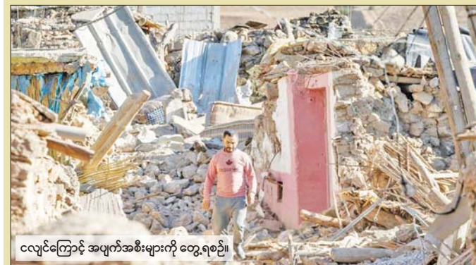
ငလျင်ကြောင့် အပျက်အစီးများကို တွေ့ရစဉ်။

ဒဏ်ရာရရှိသူနှစ်ဦးမှာ လတ် တလောတွင် ဆေးကုသမှုခံယူနေ သည်။ ရထားလမ်းချော်မှု ဖြစ်ပွား ခဲ့သည့်နေရာမှာ ခရီးသွားများ သွားလာမှုများသည် အော်ဂျပ် ကယ်လီယန်တီမြို့သို့ အမြန် မန်နေဂျာဖြစ်ပြီး ဒဏ်ရာရရှိသူ သွားရောက်နိုင်သည့် လမ်းလည်း ဖြစ်သည်။