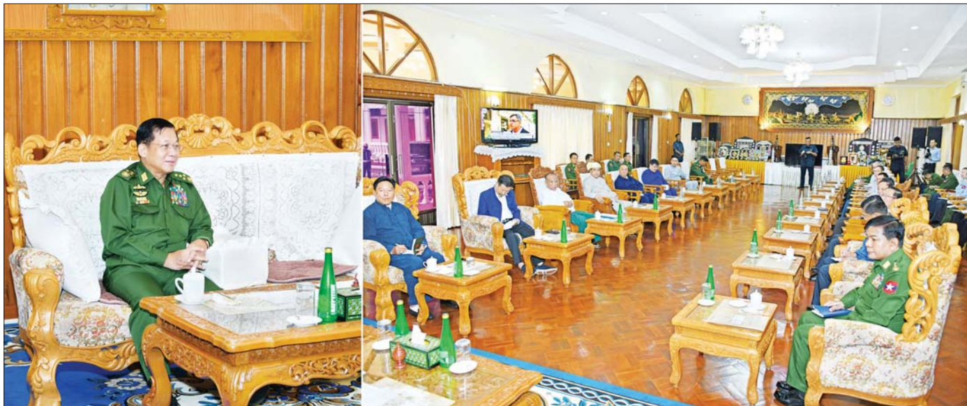
နိုင်ငံတော်စီမံအုပ်ချုပ်ရေးကောင်စီဥက္ကဋ္ဌ တပ်မတော်ကာကွယ်ရေးဦးစီးချုပ် ဗိုလ်ချုပ်မှူးကြီး မင်းအောင်လှိုင် ရှမ်းပြည်နယ်(မြောက်ပိုင်း)အတွင်းရှိ ပြည်သူ့စစ်ဌာနတပ်ဖွဲ့ဝင်များနှင့် တွေ့ဆုံဆွေးနွေးစဉ်။