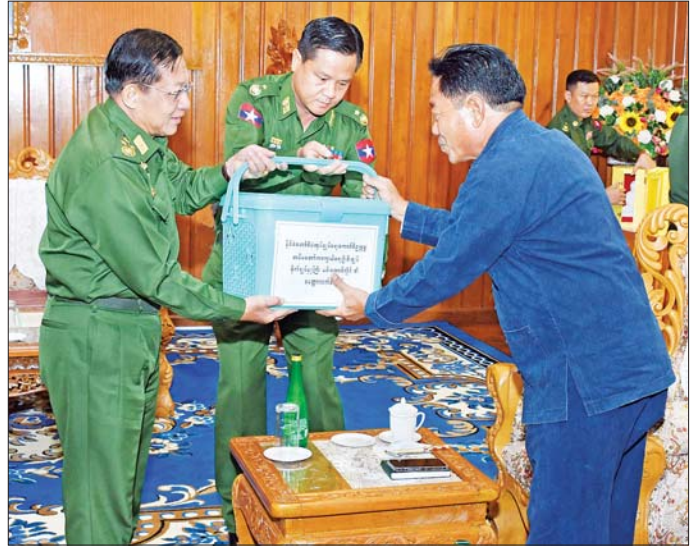
နိုင်ငံတော်စီမံအုပ်ချုပ်ရေးကောင်စီဥက္ကဋ္ဌ တပ်မတော်ကာကွယ်ရေးဦးစီးချုပ် ဗိုလ်ချုပ်မှူးကြီး မင်းအောင်လှိုင် (ဝဲဘက်) ပြည်သူ့စစ်ဌာနတပ်ဖွဲ့ဝင်များအား မာရဝိဇယဗုဒ္ဓရုပ်ပွားတော်မြတ်ပုံစံတူ ကျောက်ဆစ်ဗုဒ္ဓရုပ်ပွားတော်မြတ်များကို မွေလက်ဆောင်အဖြစ်နှင့် စားသောက်ဖွယ်ရာပစ္စည်းများ ပေးအပ်ပုံ။