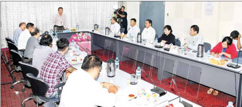
ပြည်ထောင်စုဝန်ကြီး ဦးမောင်မောင်အုန်း မြန်မာနိုင်ငံဂီတအစည်းအရုံး (ဗဟို) ယာယီအမှုဆောင်အဖွဲ့ဝင်များနှင့် တွေ့ဆုံမှာကြားစဉ်။

ရန်ကုန် စက်တင်ဘာ ၁၀ ပြန်ကြားရေးဝန်ကြီးဌာန ပြည်ထောင်စုဝန်ကြီး ဦးမောင်မောင်အုန်းသည် ယနေ့နံနက်ပိုင်းက ရန်ကုန်မြို့ ပြည်လမ်းရှိ မြန်မာ့အသံနှင့် ရုပ်မြင်သံကြား၌ မြန်မာနိုင်ငံ ဂီတအစည်းအရုံး (ဗဟို) ယာယီအမှုဆောင် အဖွဲ့ဝင်များနှင့် တွေ့ဆုံ၍ ဂီတလောက ဖွံ့ဖြိုးတိုးတက်ရေးဆိုင်ရာများ ညှိနှိုင်းဆွေးနွေးပြီး နိုင်ငံတော်သံစုံတီးဝိုင်းမှ တာဝန်ရှိသူများအား တွေ့ဆုံမှာကြားကာ ရိုက်ကူးရေးလုပ်ငန်းများကို ကြည့်ရှုအားပေးသည်။