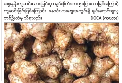
DOCA(စစ်ကိုင်း)