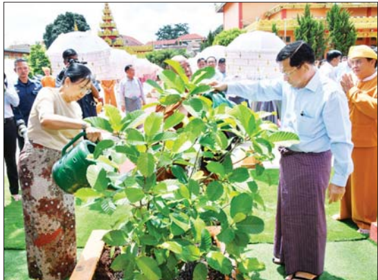
နိုင်ငံတော်စီမံအုပ်ချုပ်ရေးကောင်စီဥက္ကဋ္ဌ နိုင်ငံတော်ဝန်ကြီးချုပ် ဗိုလ်ချုပ်မှူးကြီး မင်းအောင်လှိုင်နှင့် ဇနီး ဒေါ်ကြူကြူလှ လုမ္ဗိနီအင်ကြင်းပင်ကို အမှတ်တရ စိုက်ပျိုးပေးစဉ်။

ကောင်စီဥက္ကဋ္ဌ နိုင်ငံတော်ဝန်ကြီးချုပ်နှင့် ဇနီးတို့သည် သီရိမင်္ဂလာမန်ဆူရှမ်းကျောင်းတိုက်ဆရာတော်ကြီးအား ဖူးမြော်ကြည့်ညိပြီး မာရဝါဏီယုဒ္ဓရုပ်ပွားတော် မြတ်ပုံစံတူ ကျောက်ဆစ်ဗုဒ္ဓရုပ်ပွားတော်ဖြင့် ဆွမ်းဆန်တော်နှင့် လှူဖွယ်ပစ္စည်းများကို ဆက်ကပ်လှူဒါန်းသည်။ ယင်းနောက် နိုင်ငံတော်စီမံအုပ်ချုပ်ရေးကောင်စီဥက္ကဋ္ဌ နိုင်ငံတော်ဝန်ကြီးချုပ်နှင့် ဇနီးတို့သည် သီရိမင်္ဂလာမန်ဆူရှမ်းကျောင်းတိုက် ဆရာတော်ကြီးအား သုံးထပ်ကျောင်းဆောင်သစ်ရေ၌ လုမ္ဗိနီ