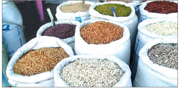
၄၃၀၊ မြေပဲလုံးဆန် (နီ) အိတ် ၁၇၀၊ မြေပဲတောင့် (အစို) တင်း ၃၇၀၀ ခန့် အရောင်းအဝယ်ဖြစ်ခဲ့ကြောင်း၊ နှမ်းနှင့် ပဲမျိုးစုံသီးနှံများကို ရန်ကုန်မြို့နှင့် မန္တလေး DOCA (မကွေး)

ပဲကြီးတစ်တင်းလျှင် ကျပ် ၉၅၀၀၀ - ၁၀၀၀၀၀၊ ကုလားပဲ (မြကြေး) တစ်တင်းလျှင် ကျပ် ၉၂၀၀၀၊ ပဲတီစိမ်းတစ်တင်းလျှင် ကျပ် ၄၃၀၀၀-၅၃၀၀၀၊ ပဲစင်းငုံ (နီ) တစ်တင်းလျှင် ကျပ် ၁၁၀၀၀၊ မြေပဲလုံးဆန် (ဖြူ) တစ်ပိဿာလျှင် ကျပ် ၆၉၀၀ မှ ၇၀၀၀၊ မြေပဲလုံးဆန် (နီ) တစ်ပိဿာလျှင် ကျပ် ၉၀၀၀ နှင့် မြေပဲတောင့် (အစို) တစ်တင်းလျှင် ကျပ် ၁၈၀၀၀ မှ ၁၉၀၀၀ ဖြစ်ကြောင်း သိရသည်။ အရောင်းအဝယ်ဖြစ်မှုအနေဖြင့် တစ်ပတ်အတွင်း ပိဿာ ၃၀ ဝင် အိတ်များဖြင့် မတ်ပဲ အိတ် ၂၂၀၊ ကုလားပဲ (H-L) အိတ် ၄၀၀၊ ပဲကြီး အိတ် ၃၆၀၊ ကုလားပဲ (မြကြေး) အိတ် ၃၃၀၊ ပဲတီစိမ်း အိတ် ၉၀၀၊ ပဲစင်းငုံ (နီ) အိတ် ၃၂၀၊ မြေပဲလုံးဆန် (ဖြူ) အိတ်