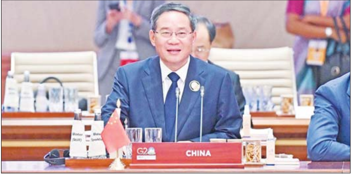
တရုတ်နိုင်ငံဝန်ကြီးချုပ် လီချန်။

အစီအစဉ်ဟု အမေရိကန်သမ္မတက ပြောကြားခဲ့ပြီး သန့်ရှင်းသောစွမ်းအင်ဖြင့် ကုန်သွယ်တင်ပို့မှုများ ပိုမိုလုပ်ဆောင်နိုင်လိမ့်မည်ဟုလည်း ၎င်းက ဆက်ပြောသည်။ အရှေ့အလယ်ပိုင်းဒေသ ပိုမို တည်ငြိမ်ပြီး ပိုမိုသယံဇာတပြုစေရေး အထောက် အကူဖြစ်စေမည်ဟုလည်း ၎င်းကဆက်ပြောသည်။ ပါဝင်သည့်နိုင်ငံများသည် ဘဏ္ဍာရေးဆိုင်ရာ ယန္တရားတည်ဆောက်မှုတွင် ပါဝင်မည်ဟု အိမ်ဖြူ တော်မှ အဆင့်မြင့်အရာရှိတစ်ဦးက ရှင်းလင်း ပြောကြားသည်။ အစွမ်းသတ္တိလည်း အဆိုပါ စီမံကိန်းသစ်၏ လမ်းကြောင်းပေါ်တွင်ရှိနေပြီး ဆော်ဒီနှင့်အစွမ်းတို့ ပိုမိုကောင်းမွန်သည့် ဆက်ဆံ ရေးကို အထောက်အကူပြုမပြု စိတ်ဝင်စားနေ ကြသည်။ အင်န်အိတ်ချ်က