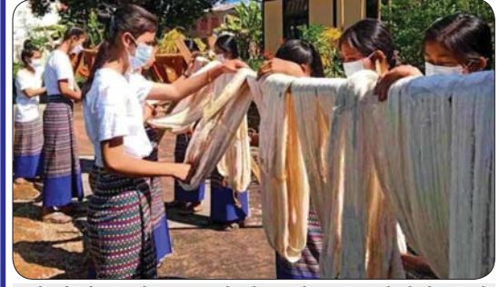
ရက်ကန်းနှင့် အသက်မွေးပညာသင်တန်းကျောင်း (မုဒုံ)မှ ချည်မျှင်နှင့် အထည် အလိပ်ကျွမ်းကျင်မှုသင်တန်းသူများ (အပေါ်ပုံ) နှင့် လက်ရက်ကန်းသင်တန်းသူ တစ်ဦး (ယာဝုံ)။