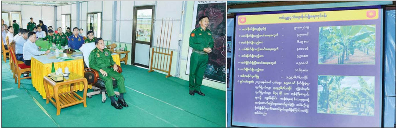
နိုင်ငံတော်စီမံအုပ်ချုပ်ရေးကောင်စီဥက္ကဋ္ဌ တပ်မတော်ကာကွယ်ရေးဦးစီးချုပ် ဗိုလ်ချုပ်မှူးကြီး မင်းအောင်လှိုင်နှင့် အဖွဲ့ဝင်များအား တိုင်းမှူး ဗိုလ်ချုပ် နိုင်နိုင်ဦးက ရှင်းလင်းတင်ပြစဉ်။