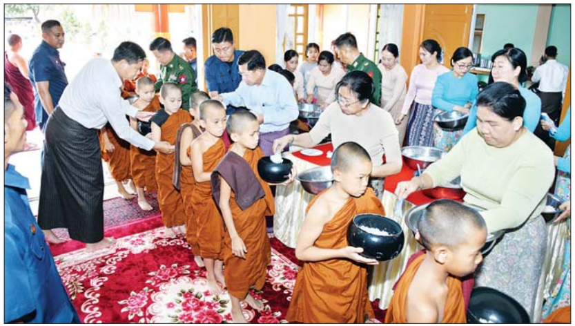
နိုင်ငံတော်စီမံအုပ်ချုပ်ရေးကောင်စီဥက္ကဋ္ဌ နိုင်ငံတော်ဝန်ကြီးချုပ် ဗိုလ်ချုပ်မှူးကြီး မင်းအောင်လှိုင်နှင့် ဇနီး ဒေါ်ကြူကြူလှ စာသင်သား သံဃာတော်များနှင့် သာမဏေများအား နေ့ဆွမ်းလောင်းလှူစဉ်။

၀၈ ဒေါက်တာ ဘဒ္ဒန္တ ပုညနန္ဒ အား သွားရောက်ဖူးမြော်ကြည့်ညိပြီး လှူဖွယ်ပစ္စည်းများ ဆက်ကပ်လှူဒါန်းသည်။ လှိုက်လှဲနွေးထွေးစွာ ခရီးဦးကြိုဦးစွာ နိုင်ငံတော်စီမံအုပ်ချုပ်ရေးကောင်စီဥက္ကဋ္ဌ နိုင်ငံတော်ဝန်ကြီးချုပ်နှင့် ဇနီးတို့သည် အဖွဲ့ဝင်များနှင့်အတူ လားရှိုးမြို့ သီရိမင်္ဂလာမန်ဆူရှမ်းကျောင်းတိုက်သို့ ရောက်ရှိကြရာ ဒေသခံပြည်သူများက ရိုးရာအကအလှများဖြင့် လှိုက်လှဲနွေးထွေးစွာ ခရီးဦးကြိုနှုတ်ဆက်ကြသည်။ ထိုနောက် နိုင်ငံတော်စီမံအုပ်ချုပ်ရေး