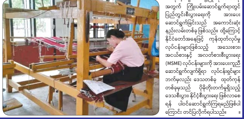
ရက်ကန်းနှင့် အသက်မွေးပညာသင်တန်းကျောင်း (မုဒုံ)မှ ချည်မျှင်နှင့် အထည် အလိပ်ကျွမ်းကျင်မှုသင်တန်းသူများ (အပေါ်ပုံ) နှင့် လက်ရက်ကန်းသင်တန်းသူ တစ်ဦး (ယာဝုံ)။

မွန်ပြည်နယ် အသေးစား စက်မှု လက်မှုလုပ်ငန်း ဦးစီးဌာနအနေဖြင့် ရက်ကန်းလုပ်ငန်း ဖွံ့ဖြိုးတိုးတက်ရေး အတွက် ရက်ကန်းနှင့်အသက်မွေးပညာ သင်တန်းကျောင်း (မုဒုံ)ကို ဖွင့်လှစ်ပြီး အသေးစား စက်မှုလက်မှုလုပ်ငန်း ဦးစီးဌာနအနေဖြင့် ရက်ကန်းသင်တန်း များကို ရိုးရာယဉ်ကျေးမှု အမွေအနှစ် များ မတိမ်ကော မပျောက်အောင် ဆက်လက်ထိန်းသိမ်းစောင့်ရှောက်ရန်၊ ရက်ကန်းလုပ်ငန်းဆိုင်ရာ နည်းပညာ အတတ်ပညာများ ဖြန့်ဖြူးပေးရန်၊ ခေတ်စနစ်နှင့်အညီ ဖွံ့ဖြိုးတိုးတက်လာ သော အထည်ထုတ်လုပ်ငန်းများကို တီထွင်နိုင်သည့် အတတ်ပညာများ လေ့ကျင့်သင်ကြားပေးရန် ရည်ရွယ် ဖွင့်လှစ်ခြင်း ဖြစ်သည်။