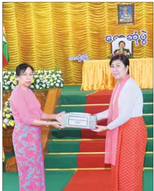
နိုင်ငံတော်စီမံအုပ်ချုပ်ရေးကောင်စီဥက္ကဋ္ဌ တပ်မတော်ကာကွယ်ရေးဦးစီးချုပ် ဗိုလ်ချုပ်မှူးကြီး မင်းအောင်လှိုင်၏ဇနီး ဒေါ်ကြူကြူလှ တပ်နယ်မိခင်နှင့် ကလေးစောင့်ရှောက်ရေးအသင်းအတွက် ချီးမြှင့်ငွေများ ပေးအပ်စဉ်။