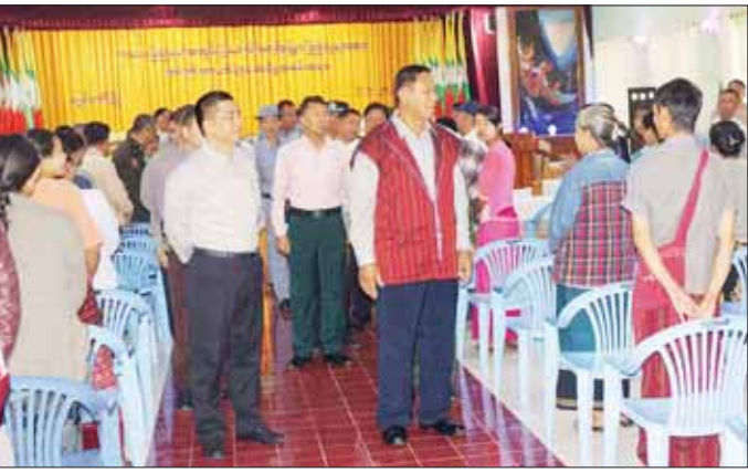
နိုင်ငံတော်စီမံအုပ်ချုပ်ရေးကောင်စီအဖွဲ့ဝင် ပိုးရယ်အောင်သိန်း ကယားပြည်နယ်အတွင်းရှိ ယာယီနေရပ် စွန့်ခွာပြည်သူများအား ရင်းရင်းနှီးနှီး တွေ့ဆုံနှုတ်ဆက်စဉ်။

နှင့် အူလမ်းကြောင်း ကြည့်မှန် ပြောင်းမော်ဒီတာ Medical Grade SONY (LMD-2435MD) စက် ပစ္စည်းတို့ကို ထောက်ပံ့ပေးအပ် လှူဒါန်းကြပြီး ပြည်နယ်ပြည်သူ့ ဆေးရုံကြီးရှိလူနာဆောင်များအား လှည့်လည်ကြည့်ရှုကာ လူနာများ ကို အားပေးစကား ပြောကြား၍ အာဟာရပြည့်စားသောက်ဖွယ်ရာ များနှင့် ယာယီနေရပ်စွန့်ခွာ စီးပွား လူနာအား ထောက်ပံ့ငွေများ ပေးအပ်ကြသည်။ ဆက်လက်၍ နိုင်ငံတော်စီမံ အုပ်ချုပ်ရေးကောင်စီ အဖွဲ့ဝင် သည် ပြည်နယ်ပညာရေးမှူးရုံး ပညာဗိမာန်ခန်းမ၌ ကျင်းပသည့် အခြေခံပညာကျောင်းများမှ ဆရာ ဆရာမများနှင့် တွေ့ဆုံအခမ်း အနားသို့တက်ရောက်အမှာစကား ပြောကြားသည်။ တွေ့ဆုံပွဲတွင် ပြည်နယ်ပညာ ရေးမှူးက ပြည်နယ်အတွင်း ပညာရေးဆိုင်ရာ ဆောင်ရွက် နေမှုကို ရှင်းလင်းတင်ပြသည်။ ထောက်ပံ့ငွေပေးအပ် ထို့နောက် နိုင်ငံတော်စီမံ အုပ်ချုပ်ရေးကောင်စီ အဖွဲ့ဝင်က ပြည်နယ်အတွင်း ပညာရေးဖွံ့ဖြိုး