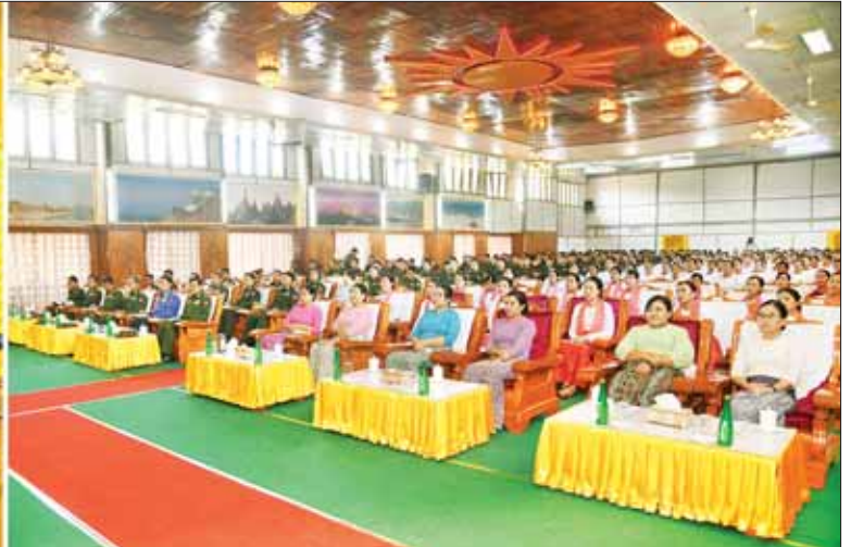
နိုင်ငံတော်စီမံအုပ်ချုပ်ရေးကောင်စီဥက္ကဋ္ဌ တပ်မတော်ကာကွယ်ရေးဦးစီးချုပ် ဗိုလ်ချုပ်မှူးကြီး မင်းအောင်လှိုင် အရှေ့မြောက်တိုင်းစစ်ဌာနချုပ် လားရှိုးတပ်နယ်မှ အရာရှိ၊ စစ်သည်၊ မိသားစုဝင်များအား တွေ့ဆုံအမှာစကားပြောကြားစဉ်။