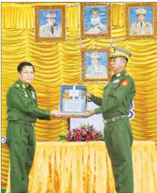
နိုင်ငံတော်စီမံအုပ်ချုပ်ရေးကောင်စီဥက္ကဋ္ဌ တပ်မတော်ကာကွယ်ရေးဦးစီးချုပ် ဗိုလ်ချုပ်မှူးကြီး မင်းအောင်လှိုင် အရှေ့မြောက် တိုင်းစစ်ဌာနချုပ် လားရှိုးတပ်နယ်မှ အရာရှိ၊ စစ်သည်၊ မိသားစုများအတွက် စားသောက်ဖွယ်ရာပစ္စည်းများ ပေးအပ်စဉ်။

နေပြည်တော် စက်တင်ဘာ ၉ နိုင်ငံတော်၌ တစ်ဦးတစ်ယောက်ချင်းစီ၏ လူမှုစီးပွား ဘဝတိုးတက်လာခြင်းဖြင့် နိုင်ငံ၏ လူမှုစီးပွားဘဝများ ဖွံ့ဖြိုးတိုးတက်လာမည်ဖြစ်ကြောင်း၊ ထိုသို့ နိုင်ငံလူမှု စီးပွားတိုးတက်လာမည်ဆိုပါက နိုင်ငံတော်၏တာဝန် များကို ထမ်းဆောင်နေကြသည့်ဝန်ထမ်းများ၏ခံစား ခွင့်များသည်လည်း တိုးတက်လာမည်ဖြစ်ကြောင်း၊ ဒေသအလိုက် ဖွံ့ဖြိုးတိုးတက်အောင် ဆောင်ရွက်နိုင် မည်ဆိုပါက တိုင်းပြည်တိုးတက်လာမည် ဖြစ်သဖြင့် မိမိတို့ ဒေသဖွံ့ဖြိုးတိုးတက်စေရေး ဒေသအလိုက် တာဝန်ထမ်းဆောင်လျက်ရှိသည့် အုပ်ချုပ်ရေးဆိုင်ရာ တာဝန်ရှိသူများ၊ ဌာနဆိုင်ရာဝန်ထမ်းများ၊ ဒေသခံ ပြည်သူများအားလုံး အတူတကွဝိုင်းဝန်းကြိုးပမ်း၍ စီးပွားရေးဖွံ့ဖြိုးတိုးတက်အောင် ဆောင်ရွက်ရမည် ဖြစ်ကြောင်း နိုင်ငံတော်စီမံအုပ်ချုပ်ရေးကောင်စီ ဥက္ကဋ္ဌ တပ်မတော်ကာကွယ်ရေးဦးစီးချုပ် ဗိုလ်ချုပ် မှူးကြီး မင်းအောင်လှိုင်က ယနေ့စွန်းလွဲပိုင်းတွင် အရှေ့မြောက်တိုင်းစစ်ဌာနချုပ် လားရှိုးတပ်နယ်မှ အရာရှိ၊ စစ်သည်၊ မိသားစုဝင်များအား တွေ့ဆုံအမှာ စကားပြောကြားစဉ် ထည့်သွင်းပြောကြားသည်။ အဆိုပါ တွေ့ဆုံပွဲသို့ နိုင်ငံတော်စီမံအုပ်ချုပ်ရေး ကောင်စီဥက္ကဋ္ဌ တပ်မတော်ကာကွယ်ရေးဦးစီးချုပ် နှင့်အတူ ဇနီး ဒေါ်ကြူကြူလှ၊ ညီနှိုင်းကွဲဝက်ရေးမှူး (ကြည်း၊ ရေ လေ) ဗိုလ်ချုပ်ကြီး မောင်မောင်အေးနှင့် ဇနီး၊ ကာကွယ်ရေးဦးစီးချုပ် (ရေ) ဗိုလ်ချုပ်ကြီး မိုးအောင်နှင့် ဇနီး၊ ကာကွယ်ရေးဦးစီးချုပ်ရုံးမှ