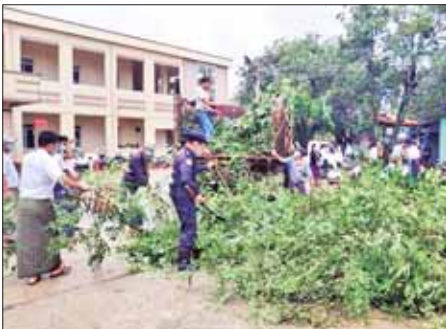
ပဲခူးတိုင်းဒေသကြီး ဝေါမြို့နယ် စီမံအုပ်ချုပ်ရေးအဖွဲ့ ဦးဆောင်ကာ မြို့နယ်ပြည်သူ့ဆေးရုံကြီးနှင့် တိုက်နယ်ဆေးရုံများ သန့်ရှင်းသာယာလှပစေရေးအတွက် မြို့နယ်အဆင့် ဌာနဆိုင်ရာများ၊ လူမှုရေး အသင်းအဖွဲ့များနှင့် ပြည်သူများ ပူးပေါင်းပြီး စက်တင်ဘာ ၉ ရက်က ဝေါမြို့ပြည်သူ့ဆေးရုံကြီး၌ စုပေါင်းသန့်ရှင်းရေးဆောင်ရွက်စဉ်။ စိုးမိုး(ပြန်/ဆက်)