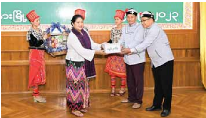
နိုင်ငံတော်စီမံအုပ်ချုပ်ရေးကောင်စီအဖွဲ့ဝင် ဒေါ်ခွဲဘူ စာပေနှင့် ယဉ်ကျေးမှုအသင်းများအား ထောက်ပံ့ငွေ များ ပေးအပ်စဉ်။

မြစ်ကြီးနား စက်တင်ဘာ ၉ နိုင်ငံတော်စီမံအုပ်ချုပ်ရေးကောင်စီအဖွဲ့ဝင် ဒေါ်ခွဲဘူ သည် ပြည်နယ်ဝန်ကြီးချုပ် ဦးခက်ထိန်နန်၊ ပြည်နယ် အစိုးရအဖွဲ့ဝင်များ၊ ဌာနဆိုင်ရာတာဝန်ရှိသူများနှင့် အတူ ယနေ့ နံနက် ၉ နာရီက မြစ်ကြီးနားမြို့ ခုတင် (၅၀၀)ဆုံ ပြည်သူ့ဆေးရုံကြီးသို့ သွားရောက်ပြီး ဆေးဝါးကုသမှုခံယူနေသော လူနာများကို တွေ့ဆုံ အားပေးသည်။ ဦးစွာ နိုင်ငံတော်စီမံအုပ်ချုပ်ရေးကောင်စီအဖွဲ့ဝင် နှင့်အဖွဲ့သည် ပြည်သူ့ဆေးရုံကြီးအတွင်း ဆေးဝါး ကုသမှုခံယူနေသော လူနာများကို ရင်းရင်းနှီးနှီး လိုက်လံတွေ့ဆုံအားပေးစကား ပြောကြားကာ ထောက်ပံ့ပေးအပ်ကြပြီး ဆေးရုံအတွက် ဆေးပဒေသပင်ထောက်ပံ့ပေးအပ် ပေးအပ် သည်။