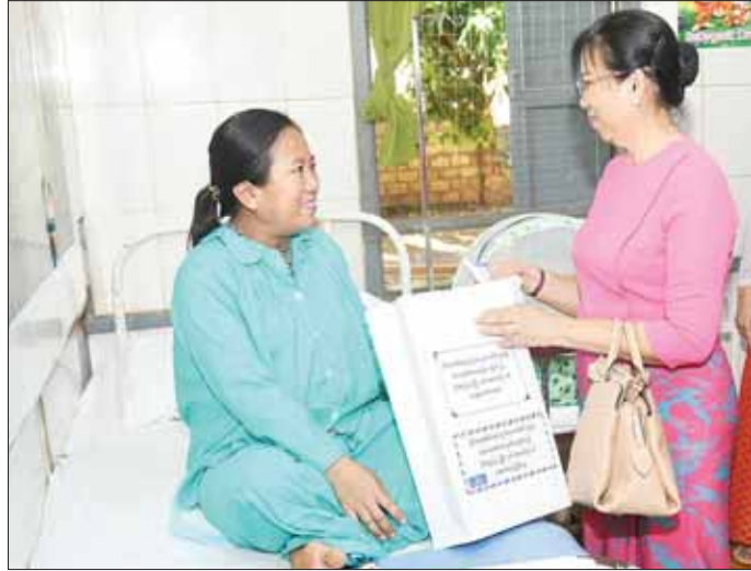
နိုင်ငံတော်စီမံအုပ်ချုပ်ရေးကောင်စီဥက္ကဋ္ဌ တပ်မတော်ကာကွယ်ရေးဦးစီးချုပ် ဗိုလ်ချုပ်မှူးကြီး မင်းအောင်လှိုင်နှင့် ဇနီး ဒေါ်ကြူကြူလှ လာရှိုးမြို့ရှိ နယ်မြေခံတပ်မတော်ဆေးရုံတွင် တက်ရောက်ဆေးကုသမှု ခံယူလျက်ရှိသူများအား ကျန်းမာရေးအခြေအနေများ မေးမြန်းအားပေးစကားပြောကြားကာ လက်ဆောင်ပစ္စည်းများ ထောက်ပံ့ပေးအပ်စဉ်။