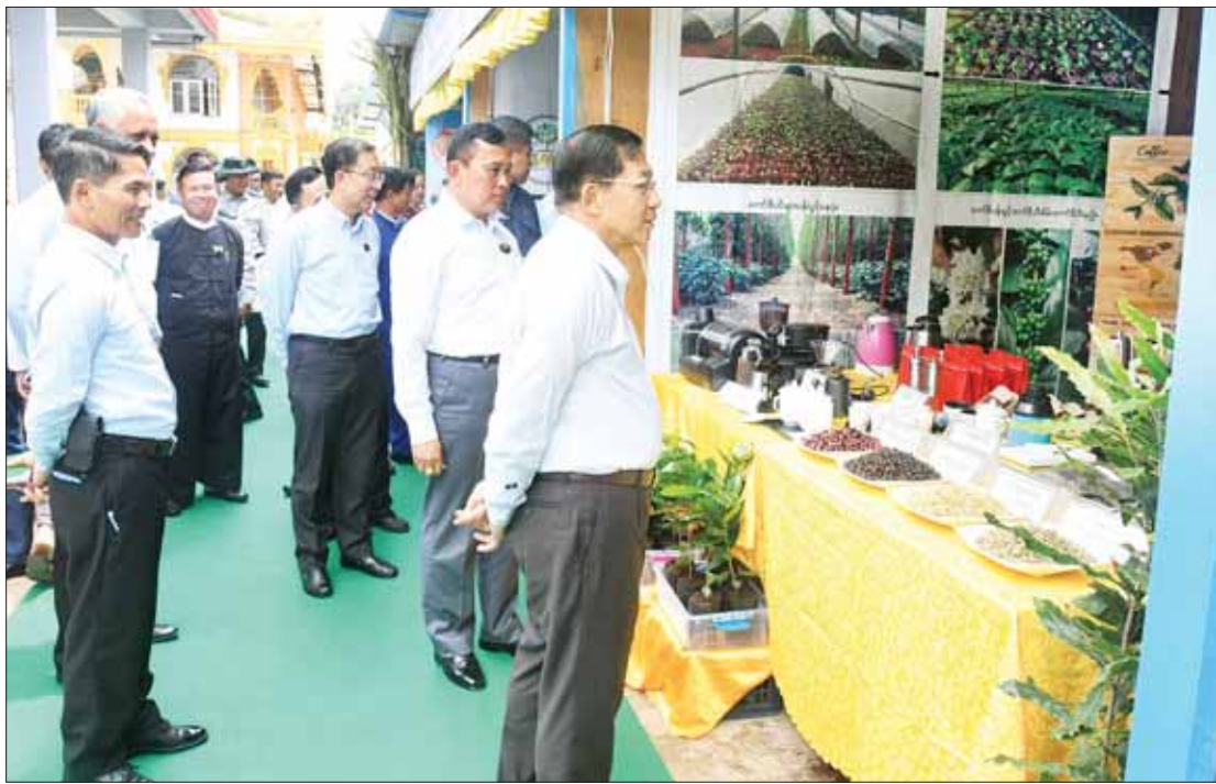
နိုင်ငံတော်စီမံအုပ်ချုပ်ရေးကောင်စီဥက္ကဋ္ဌ နိုင်ငံတော်ဝန်ကြီးချုပ် ဗိုလ်ချုပ်မှူးကြီး မင်းအောင်လှိုင် ဒေသထွက် ထုတ်ကုန်ပစ္စည်းများ ခင်းကျင်းပြသထားရှိမှုကို ကြည့်ရှု လေ့လာစဉ်။

နေပြည်တော် စက်တင်ဘာ ၉ နိုင်ငံတော်စီမံအုပ်ချုပ်ရေးကောင်စီ ဥက္ကဋ္ဌ နိုင်ငံတော်ဝန်ကြီးချုပ် ဗိုလ်ချုပ် မှူးကြီး မင်းအောင်လှိုင်သည် ယနေ့ နံနက်ပိုင်းတွင် ရှမ်းပြည်နယ် (မြောက် ပိုင်း)အတွင်းရှိ ပြည်နယ်၊ ခရိုင်၊ မြို့နယ် အဆင့် ဌာနဆိုင်ရာ တာဝန်ရှိသူများ၊ မြို့မ၊ မြို့ဖများ၊ အသေးစား၊ အငယ်စားနှင့် အလတ်စားစီးပွားရေး (MSME)လုပ်ငန်း ရှင်များအား လားရှိုးမြို့ မြို့တော်ခန်းမ ၌ တွေ့ဆုံ၍ ဒေသဖွံ့ဖြိုးတိုးတက်ရေး ဆိုင်ရာများကို ဆွေးနွေးပြောကြားသည်။ အဆိုပါ တွေ့ဆုံပွဲသို့ နိုင်ငံတော်စီမံ အုပ်ချုပ်ရေးကောင်စီဥက္ကဋ္ဌ နိုင်ငံတော် ဝန်ကြီးချုပ်နှင့်အတူ ကောင်စီဝင်များ ဖြစ်ကြသည့် ဦးရွှေကြမ်း၊ ဦးရန်ကျော်၊ ပြည်ထောင်စုဝန်ကြီးများ ဖြစ်ကြသည့် ဦးဝင်းရှိန်၊ ဦးမင်းနောင်၊ ဦးလှမိုး၊ ဦးခင် မောင်ရှိ၊ ဦးအောင်နိုင်ဦး၊ ရှမ်းပြည်နယ် ဝန်ကြီးချုပ် ဦးအောင်ဇော်အေး၊ ညွှန်ကြား ကွပ်ကဲရေးမှူး(ကြည်း)၊ ရေ(လေ) ဗိုလ်ချုပ် ကြီး မောင်မောင်အေးနှင့် ကာကွယ်ရေး ဦးစီးချုပ်ရုံးမှ အဆင့်မြင့်တပ်မတော် အရာရှိကြီးများ၊ ဒုတိယဝန်ကြီးများ၊ အရှေ့မြောက်တိုင်း စစ်ဌာနချုပ် တိုင်းမှူး၊ ရှမ်းပြည်နယ် (မြောက်ပိုင်း) ပြည်နယ်၊ ခရိုင်၊ မြို့နယ်အဆင့်ဌာနဆိုင်ရာ စာမျက်နှာ ၃ ကော်လံ ၁ ◆