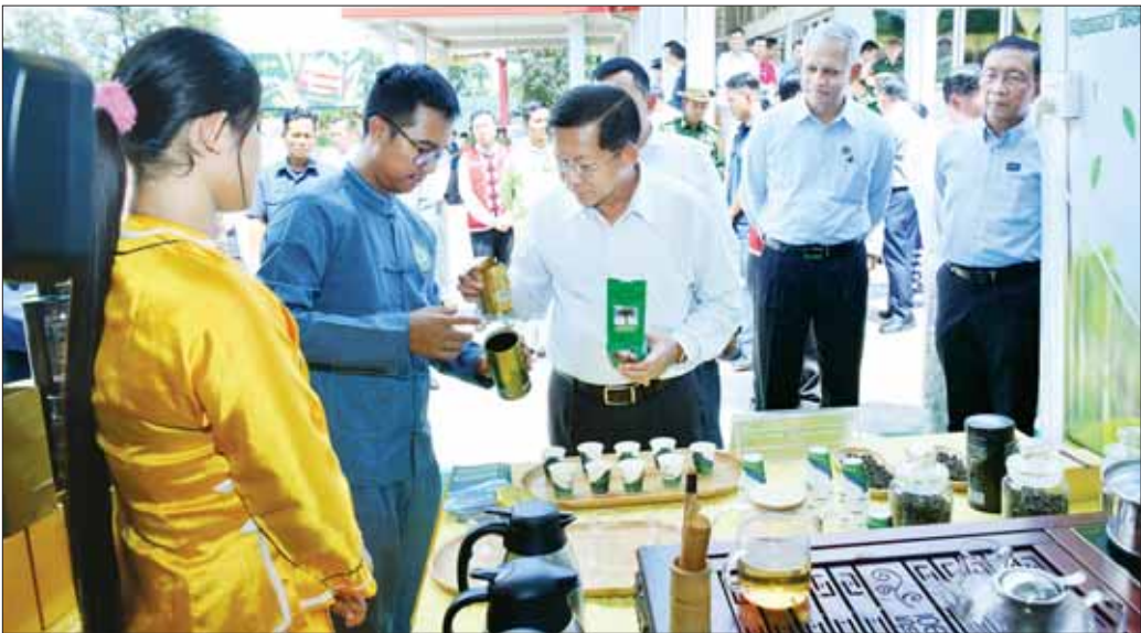
နိုင်ငံတော်စီမံအုပ်ချုပ်ရေးကောင်စီဥက္ကဋ္ဌ နိုင်ငံတော်ဝန်ကြီးချုပ် ဗိုလ်ချုပ်မှူးကြီး မင်းအောင်လှိုင် ဒေသထွက်ထုတ်ကုန်ပစ္စည်းများ ခင်းကျင်းပြသထားရှိမှုကို ကြည့်ရှုလေ့လာစဉ်။

နိုင်ငံရေးအရ သဘောထားကွဲလွဲမှုများနှင့် ပတ်သက်၍ ကမ္ဘာပေါ်ရှိ နိုင်ငံတိုင်းသည် တစ်နိုင်ငံ နှင့်တစ်နိုင်ငံ ဖွဲ့စည်းအုပ်ချုပ်ပုံနှင့် နိုင်ငံရေးစနစ်များ တူညီမှုမရှိကြောင်း၊ မိမိတို့နိုင်ငံတွင် လွတ်လပ်ရေး ရရှိပြီးကာလတွင် ပါလီမန်ဒီမိုကရေစီစနစ်ကို ကျင့်သုံးခဲ့ကြောင်း၊ လွတ်လပ်ရေးကြိုးပမ်းခဲ့စဉ် ကတည်းက လွတ်လပ်ရေးသည် ပထမ၊ ဒီမိုကရေစီ ရေးသည် ဒုတိယ၊ ဆိုရှယ်လစ်ရေးသည် တတိယ ဟူ၍ ကြေးကြော်ဆောင်ရွက်ခဲ့သည်ကို တွေ့ရှိရမည် ဖြစ်ကြောင်း၊ လွတ်လပ်ရေးမရမီကာလနှင့် လွတ်လပ် ရေးရပြီးကာလတွင် ဆိုရှယ်လစ်စနစ်နှင့် အရင်းရှင် စနစ်တို့၏ အားပြိုင်ခဲ့မှု၊ အယူဝါဒ ကွဲပြားမှုများကြောင့် ၁၉၄၈ ခုနှစ် မတ်လတွင် ကွန်မြူနစ်ပါတီ တောခိုခဲ့ ကြောင်း၊ ထို့နောက် KNDO ကဲ့သို့ တိုင်းရင်းသား လက်နက်ကိုင်အဖွဲ့များ ပေါ်ပေါက်လာခဲ့ကြောင်း၊ ၁၉၆၂ ခုနှစ်မှ ၁၉၈၈ ခုနှစ်အထိ တော်လှန်ရေးကောင်စီ နှင့် မြန်မာ့ဆိုရှယ်လစ်လမ်းစဉ်ပါတီတို့က အုပ်ချုပ် ဆောင်ရွက်ခဲ့ပြီး စီမံခန့်ခွဲမှုအဖွဲ့ချုပ်ကြောင့် စီးပွားရေးကျဆင်းခဲ့ကာ ၁၉၈၈ ခုနှစ် အရေးအခင်း ဖြစ်ပေါ်လာခဲ့ကြောင်း၊ ၁၉၈၈ ခုနှစ် အရေးအခင်းကို