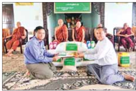
သံဃာတော်များနှင့် ရှင်သာမဏေ လှူဖွယ်ပစ္စည်းများ ဆက်ကပ် များအတွက် ဆွမ်းဆန်တော်၊ ဆီ၊ လှူဒါန်းခဲ့ကြောင်း သတင်းရရှိ ဆား၊ ကုလားပဲ၊ ကြက်ဥနှင့် အခြား သတင်းစဉ်

နေပြည်တော် စက်တင်ဘာ ၉ ထိုသို့ လှူဒါန်းလျက်ရှိရာ နယ်စပ်ရေးရာ ဝန်ကြီးဌာနသည် ယမန်နေ့နံနက်ပိုင်းက နေပြည်တော်ကောင်စီနယ်မြေ နေပြည်တော် ကောင်စီနယ်မြေ အပါအဝင်ပြည်နယ်နှင့် တိုင်းဒေသ ကြီးအသီးသီးရှိ ဘုန်းတော်ကြီး နေပြည်တော်များသို့ ဆွမ်းဆန်တော်၊ ဆီ၊ ဆား၊ ကုလားပဲနှင့် လှူဖွယ် ပစ္စည်းများကို ဆက်ကပ်လှူဒါန်း လျက်ရှိသည်။