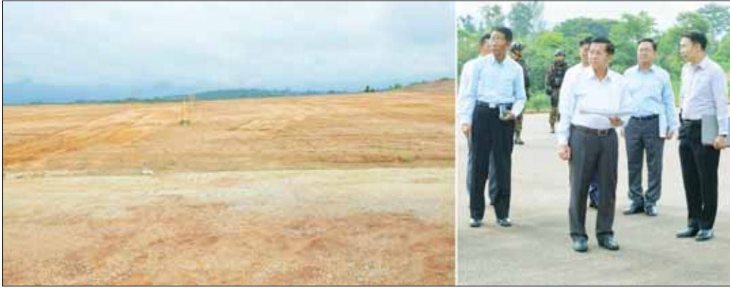
နိုင်ငံတော်စီမံအုပ်ချုပ်ရေးကောင်စီဥက္ကဋ္ဌ နိုင်ငံတော်ဝန်ကြီးချုပ် ဗိုလ်ချုပ်မှူးကြီး မင်းအောင်လှိုင် လားရှိုးလေဆိပ် လေယာဉ်ပြေးလမ်း အဆင့်မြှင့်တင်ဆောင်ရွက်နေမှုအခြေအနေများ ကြည့်ရှုစစ်ဆေးစဉ်။

စိုက်ပျိုးမွေးမြူရေးလုပ်ငန်းများကို ဆောင်ရွက်ပြီး တန်ဖိုးမြင့်ထုတ်ကုန်များ ထုတ်လုပ်နိုင်ရန်အတွက် ကျွမ်းကျင်လုပ်သား လူသားအရင်းအမြစ်များလိုအပ်ကြောင်း၊ ထို့ကြောင့် အတန်းပညာများ မြှင့်မားစေရေး ပညာရေးကို အားပေးဆောင်ရွက်ရန်လိုကြောင်း၊ စိုက်ပျိုးမွေးမြူရေးနှင့် နည်းပညာ