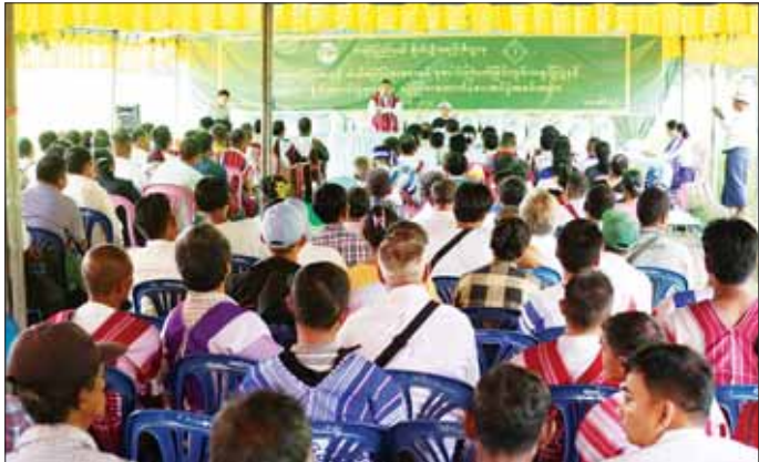
နိုင်ငံတော်စီမံအုပ်ချုပ်ရေးကောင်စီအဖွဲ့ဝင် မန်းငြိမ်းမောင် မိုးစပါးစိုက်တောင်သူများအား မြေဩဇာ ထောက်ပံ့ပေးအပ်ပွဲတွင် အမှာစကားပြောကြားစဉ်။

ထောက်ပံ့ပေးအပ် ထိုနောက် နိုင်ငံတော်စီမံအုပ်ချုပ်ရေးကောင်စီ အဖွဲ့ဝင် မန်းငြိမ်းမောင်၊ ခွန်စံလွင်၊ ပြည်နယ်ဝန်ကြီး ချုပ်နှင့် တာဝန်ရှိသူများသည် တရုတ်လှ၊ ထောင်စိုက်၊ ရဲသား၊ ဘားကပ်၊ မြိုင်ကလေး၊ ကော့ထမလိနံ၊ ကော့ လှိုက်၊ ရသေ့ပျံ၊ တောပုံကျေးရွာတို့မှ မိုးစပါးစိုက် တောင်သူများကို ယူရီးယားဓာတ်မြေဩဇာအိတ် ၁၀၀ နှင့် သဘာဝမြေဩဇာအိတ် ၁၀၀ တို့ကို ထောက်ပံ့ ပေးအပ်ရာ တောင်သူတိုင်းစားလှယ်တစ်ဦးက လက်ခံ