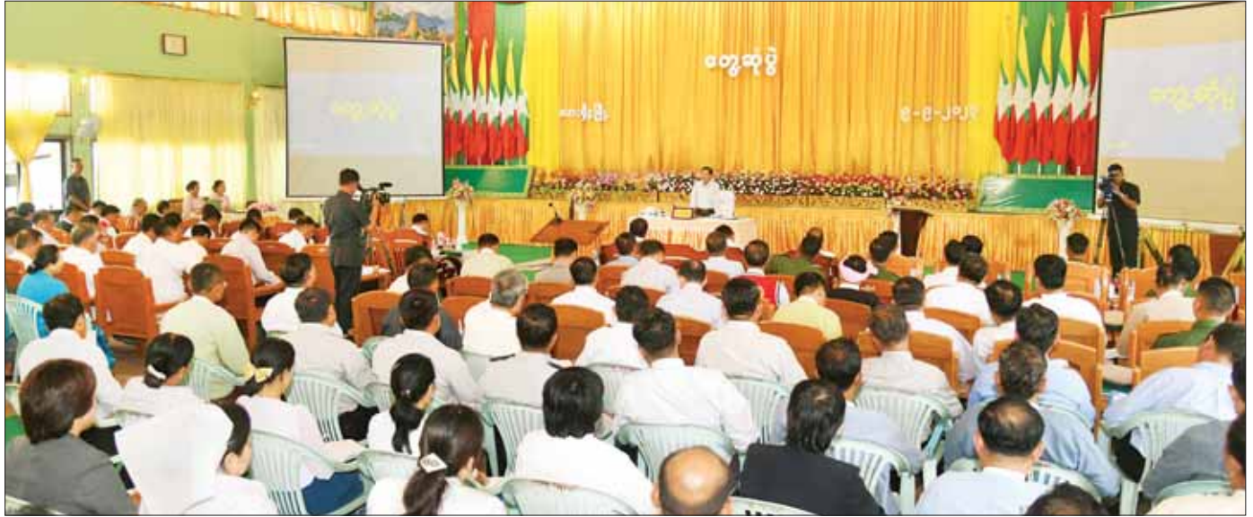
နိုင်ငံတော်စီမံအုပ်ချုပ်ရေးကောင်စီဥက္ကဋ္ဌ နိုင်ငံတော်ဝန်ကြီးချုပ် ဗိုလ်ချုပ်မှူးကြီး မင်းအောင်လှိုင် ရှမ်းပြည်နယ်(မြောက်ပိုင်း)အတွင်းရှိ ပြည်နယ်၊ ခရိုင်၊ မြို့နယ်အဆင့်ဌာနဆိုင်ရာ တာဝန်ရှိသူများ၊ မြို့မ၊ မြို့ဖများ၊ အသေးစား၊ အငယ်စားနှင့် အလတ်စား စီးပွားရေး(MSME) လုပ်ငန်းရှင်များနှင့် တွေ့ဆုံ၍ ဒေသဖွံ့ဖြိုးတိုးတက်ရေးဆိုင်ရာများ ဆွေးနွေးပြောကြားစဉ်။

◆ ရှေ့ဖွံ့ဖြိုးမှု တာဝန်ရှိသူများ၊ မြို့မ၊ မြို့ဖများ၊ ဒေသခံတိုင်းရင်းသားပြည်သူများ၊ အသေးစား၊ အငယ်စားနှင့် အလတ်စား စီးပွားရေး (MSME) လုပ်ငန်းရှင်များနှင့် တာဝန်ရှိသူများ တက်ရောက်ကြသည်။