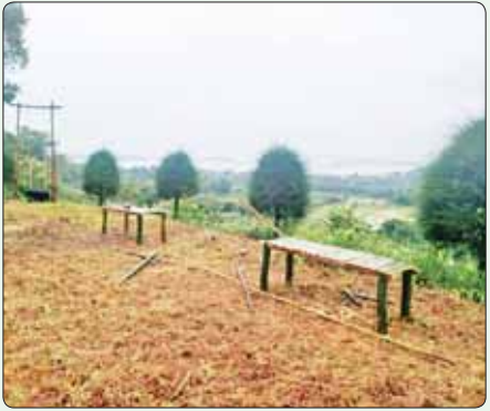
အဘဲရွာတွင်ဖော်ဆောင်မည့် Camping Site အတွက် ပြင်ဆင်မှုများ ဆောင်ရွက်နေသည်ကို တွေ့ရစဉ်။