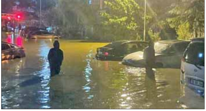
တူကီယို သောင်တင်လျက်ရှိသည်။ အိမ်ဆောင်များတွင် နေရာချ ထားပေးမည်ဖြစ်ကြောင်း သိရ သည်။ တူကီယို အနောက်မြောက်

အန်ကာရာ စက်တင်ဘာ ၆ တူကီယိုမြို့တော် အစွတန်ဘူလ်တွင် မိုးသက် မုန်တိုင်းကျရောက်ရာ နှစ်ဦး သေဆုံးခဲ့ပြီး ၁၂ ဦး ဒဏ်ရာရရှိခဲ့ ကြောင်းအစိုးရရုံးက စက်တင်ဘာ ၆ ရက်က ကြေညာချက် ထုတ်ပြန် လိုက်သည်။