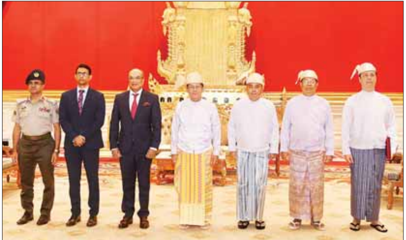
နိုင်ငံတော်စီမံအုပ်ချုပ်ရေးကောင်စီဥက္ကဋ္ဌ နိုင်ငံတော်ဝန်ကြီးချုပ် ဗိုလ်ချုပ်မှူးကြီး မင်းအောင်လှိုင်နှင့် အဖွဲ့ဝင်များ မြန်မာနိုင်ငံဆိုင်ရာ ဘင်္ဂလားဒေ့ရှ်နိုင်ငံ သံအမတ်ကြီး H.E. Dr. Md. Monwar Hossain ဦးဆောင်သောအဖွဲ့နှင့်အတူ စုပေါင်းမှတ်တမ်းတင်ဓာတ်ပုံရိုက်စဉ်။