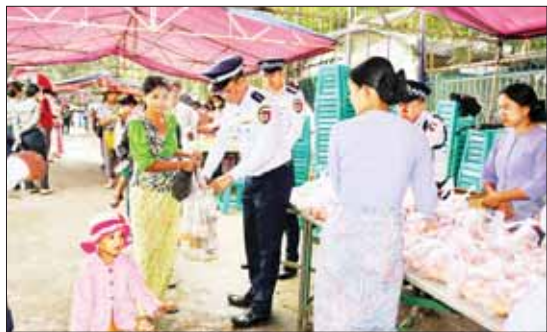
အိမ်ပြင်ပ၌ထွန်းသော မီးများကို နေ့အလင်းရောင်ရှိချိန်တွင် ပိတ်ထားခြင်းဖြင့် လျှပ်စစ်ကို ချွေတာပါ