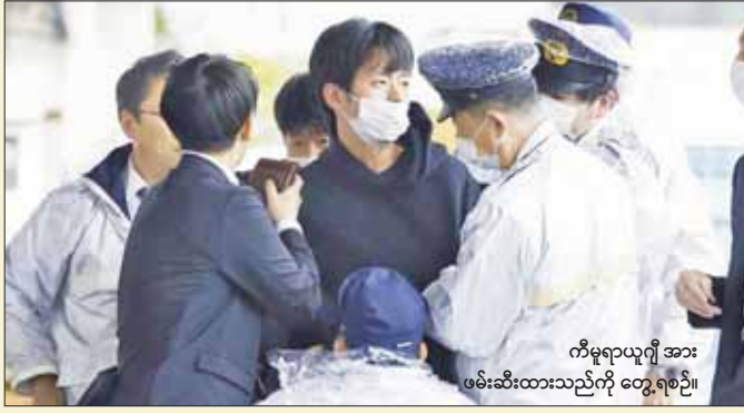
ကီရိုဒါအား ဖမ်းဆီးထားသည်ကို တွေ့ရစဉ်။

တိုကျို စက်တင်ဘာ ၆ ဖြေလအတွင်းက ဂျပန်ဝန်ကြီးချုပ် ဖူမိယိုကီရိုဒါ အနီးသို့ ပေါက်ကွဲစေတတ်သည့် ဖောက်ခွဲရေး ပစ္စည်းကို ဖမ်းဆီးခဲ့သည့် သံသယရှိသူ အမျိုးသားကို အစိုးရရှေ့နေများက စွဲချက်တင်ခဲ့သည်ဟု သိရသည်။ ဝါကာယာမာရိုင် အစိုးရရှေ့နေရုံးက အသက် ၂၄ နှစ်အရွယ် ကီရိုဒါအား စက်တင်ဘာ ၅ ရက်တွင် စွဲချက်တင်ခဲ့သည်။ ကီရိုဒါအား ဂျပန်နိုင်ငံအနောက်ပိုင်း ဝါကာယာမာရိုင် ငါးဖမ်းဆိပ်ကမ်း၌ ဂျပန်ဝန်ကြီးချုပ် ကီရိုဒါ၏အနီးသို့ ဖောက်ခွဲရေးပစ္စည်း ပစ်ခတ်ခဲ့သည်ဟု ရှေ့နေများက စွပ်စွဲထားသည်။ ကီရိုဒါသည် ကြားဖြတ်ရွေးကောက်ပွဲ မဲဆွယ်စဉ်အတွင်း