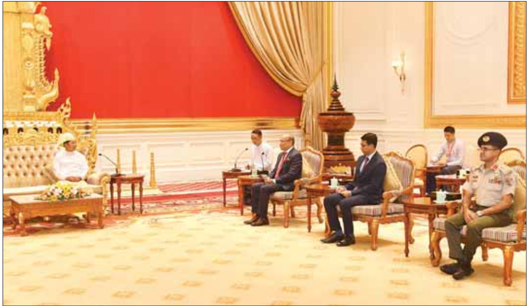
နိုင်ငံတော်စီမံအုပ်ချုပ်ရေးကောင်စီဥက္ကဋ္ဌ နိုင်ငံတော်ဝန်ကြီးချုပ် ဗိုလ်ချုပ်မှူးကြီး မင်းအောင်လှိုင် မြန်မာနိုင်ငံဆိုင်ရာ ဘင်္ဂလားဒေ့ရှ်နိုင်ငံ သံအမတ်ကြီး H.E. Dr. Md. Monwar Hossain အား လက်ခံတွေ့ဆုံစဉ်။

ရင်းရင်းနှီးနှီး ဆွေးနွေးခဲ့ကြသည်။ တွေ့ဆုံပွဲအပြီးတွင် နိုင်ငံတော်စီမံအုပ်ချုပ်ရေးကောင်စီဥက္ကဋ္ဌ နိုင်ငံတော်ဝန်ကြီးချုပ်နှင့် မြန်မာနိုင်ငံဆိုင်ရာ ဘင်္ဂလားဒေ့ရှ်နိုင်ငံ သံအမတ်ကြီးတို့သည် စုပေါင်းမှတ်တမ်းတင်ဓာတ်ပုံရိုက်ကြသည်။ အဆိုပါ သံအမတ်ခန့်အပ်လွှာပေးအပ်ပွဲသို့ ကောင်စီတွဲဖက်အတွင်းရေးမှူး ဒုတိယဝန်ကြီးကြီးရဲဝင်းဦး၊ ဒုတိယဝန်ကြီးချုပ်နှင့် နိုင်ငံခြားရေးဝန်ကြီးဌာန ပြည်ထောင်စုဝန်ကြီးဦးသန်းဆွေနှင့် သံတမန်ရေးရာဦးစီးဌာန ညွှန်ကြားရေးမှူးချုပ် ဦးဝဏ္ဏဟန်တို့ တက်ရောက်ခဲ့ကြကြောင်း သတင်းရရှိသည်။ သတင်းစဉ်