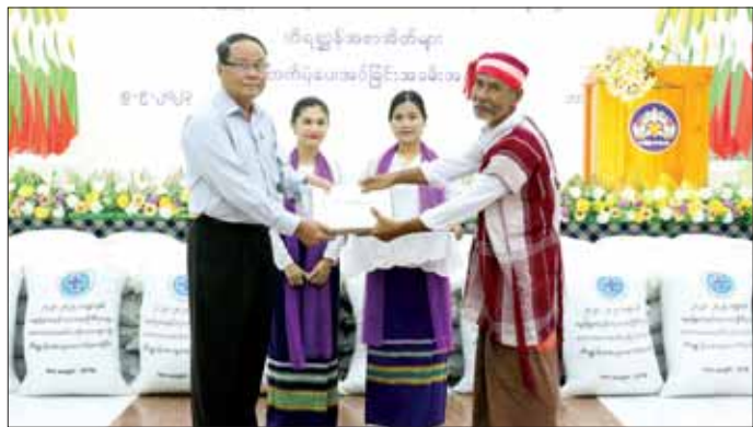
ကျွဲ၊ နွားအစာအိတ် ၆၀၊ ကော့ကရိတ်မြို့နယ်ရှိ အိတ် ၄၀ တို့ကို မွေးမြူရေးတောင်သူများထံ ကျေးရွာအုပ်စု လေးအုပ်စုအတွက် အစာအိတ် ၄၀၊ ထောက်ပံ့ပေးအပ်ကြောင်း သိရသည်။ မြဝတီမြို့နယ်ရှိ ကျေးရွာအုပ်စုစုစုအတွက် အစာအိတ် ၄၀ ဖြစ်ပြီး ဖမ်းဆီးသိန်း(ပြန်/ဆက်)

ထို့နောက် ပြည်နယ်ဝန်ကြီးချုပ်၊ ပြည်နယ်တရားလွှတ်တော်တရားသူကြီးချုပ်၊ ပြည်နယ်အစိုးရအဖွဲ့ဝင်များနှင့် မွေးမြူရေးနှင့် ကုသရေးဦးစီးဌာန ပြည်နယ်ဦးစီးမှူးတို့က ဘားအံမြို့နယ်ရှိ ကျေးရွာအုပ်စု ရှစ်အုပ်စုအတွက် ကျွဲ၊ နွား အစာအိတ် ၁၆၀၊ လှိုင်ဘွဲ့မြို့နယ်ရှိ ကျေးရွာအုပ်စု လေးအုပ်စုအတွက်