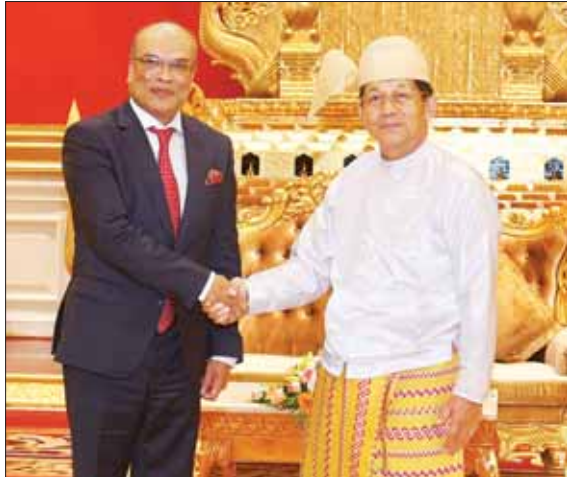
နိုင်ငံတော်စီမံအုပ်ချုပ်ရေးကောင်စီဥက္ကဋ္ဌ နိုင်ငံတော်ဝန်ကြီးချုပ် ဗိုလ်ချုပ်မှူးကြီး မင်းအောင်လှိုင် မြန်မာနိုင်ငံဆိုင်ရာ ဘင်္ဂလားဒေ့ရှ်နိုင်ငံ သံအမတ်ကြီး H.E. Dr. Md. Monwar Hossain အား ရင်းရင်းနှီးနှီးနှုတ်ဆက်စဉ်။