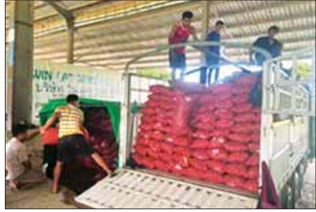
ငွေချေးနှုန်းအနေဖြင့် ယခုအပတ်တွင် တစ်ဘတ်လျှင် ၁၀၃ ဒသမ ၀၉ ကျပ် ဖြစ်သဖြင့် ဘတ်ချေး အနည်းငယ် ကျဆင်းခဲ့ကြောင်း သိရသည်။

ဆောက်လုပ်ရေးလုပ်ငန်းသုံးပစ္စည်း၊ ဆိုင်ကယ်အပိုပစ္စည်း၊ စက်ဆီ/ချောဆီ၊ အိမ်သုံးဆေး၊ လျှပ်စစ်ပစ္စည်း၊ စားသောက်ကုန်၊ အလှကုန်ပစ္စည်း၊ အထည်ချုပ်လုပ်ငန်း၊ ဆေးဝါးများ၊ ဖိနပ်၊ သစ်သီးမျိုးစုံ၊ အိမ်သုံးပစ္စည်း၊ လူသုံးကုန်ပစ္စည်း၊ စက်ရုံသုံးပစ္စည်း၊ စက်နှင့် စက်ပစ္စည်းကိရိယာများ၊ ဓာတ်မြေဩဇာနှင့် ငါးဖမ်းပစ္စည်းတို့ကို တင်သွင်းနိုင်ခဲ့သည်။