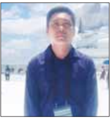
ကိုသူရိန်