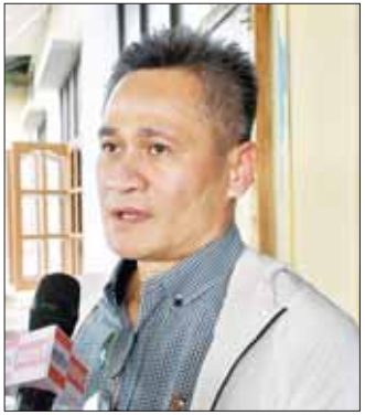
မစ္စတာ မုံခွန်းဝိစစ်စတန်

မွေးမြူရေးကိစ္စရပ်တွေမှာ မိုးကြောင့် ဆုံးရှုံး နစ်နာမှုတွေ ရှိပါတယ်။ ဒီအတွက် နိုင်ငံတော်ရဲ့ အထောက်အပံ့အကူအညီနဲ့ ဆောင်ရွက်ပေးနေတာ တွေလည်း ရှိပါတယ်။ ဒီလိုဆောင်ရွက်တဲ့အခါမှာ လမ်းညွှန်မှာကြားထားတာ ရှိပါတယ်။ ဒါကတော့ လုပ်နိုင်ခြေကောင်းတဲ့၊ အလားအလာကောင်းတဲ့ မွေးမြူရေးသမားတွေကို ပျိုးထောင်ပေးတာဖြစ်ပါ