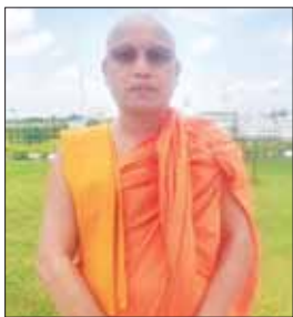
အရှင်အဂ္ဂဓဇ

ပြည်ထောင်စုနယ်မြေ နေပြည်တော် ဒက္ခိဏသီရိမြို့နယ်ရှိ ဗုဒ္ဓဥယျာဉ်ဝတ္ထုကတော်အတွင်း တည်ထားသော ကမ္ဘာ့ဥယျာဉ်တော်အဖြစ်ဆုံး ထိုင်တော်မူဗုဒ္ဓရုပ်ပွားတော် မြတ်ကြီးဖြစ်သည့် မာရဝိဇယဗုဒ္ဓရုပ်ပွားတော်မြတ်ကြီးအား ဩဂုတ် ၈ ရက်မှစတင်၍ ရဟန်း၊ ရှင်လူအများပြည်သူတို့ အခမဲ့လာရောက်ဖူးမြော်နိုင်ရန် ဖွင့်လှစ်ထားရှိခဲ့ပြီး ယနေ့ စက်တင်ဘာ ၄ ရက်တွင် ဘုရားဖူးပြည်သူများ အခမဲ့ဖူးမြော်နိုင်ပြီး ကင်မရာပေါ်ရှိသည့် လက်ကိုင်ဖုန်းများကို ဘုရားကြီးဘက်စုံ ပြုပြင်မွမ်းမံရန်အတွက် အလှူတော်ငွေ ၁၀၀၀ ကျပ်ဖြင့် ဝင်ခွင့်ပြုခဲ့ရာ လာရောက်ဖူးမြော်ကြည့်ညိုကြသူများ စည်ကားလျက်ရှိသည်ကို မြင်တွေ့ရသည်။