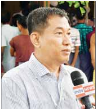
အမြဲတမ်းအတွင်းဝန် ခေါက်တာကိုကိုနိုင်

စောစောက ကျွန်တော်ပြောခဲ့သလို မည်သူမျှ ချန်ထားခြင်းမရှိစေရဆိုတာအပြင် ထိခိုက်လွယ်တဲ့ အုပ်စုတွေ ကလေးသူငယ်တွေ၊ အမျိုးသမီးတွေ၊ မာန်ခွမ်းတွေ၊ သက်ကြီးရွယ်အိုတွေ ဒါမျိုးတွေကိုပါ ကြည့်ရတယ်။ ပေါင်းလိုက်ရင်တော့ မည်သူ့ကိုမှ လည်း ချန်မထားဘူး။ IDP Camp တွေမှာဆိုရင် လည်း သက်ကြီးရွယ်အိုတွေပါ။ အမျိုးသမီးတွေ ပါတယ်။ ပြီးတော့ IDP Camp တွေမှာဆိုရင် သီးခြား လိုအပ်ချက်တွေလည်း ရှိသေးတယ်။ ဒါတွေကိုလည်း