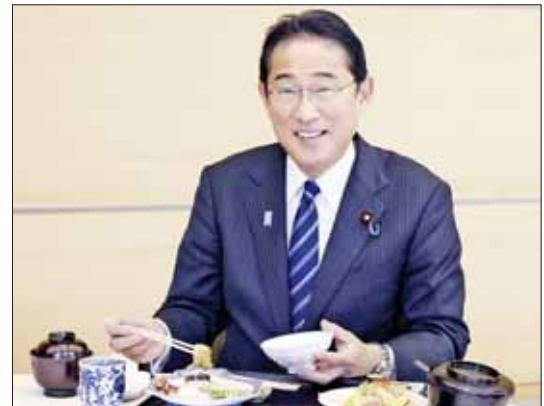
ဖူကူရှီးမားဒေသမှထွက်ရှိသည့် ပင်လယ်ရေထွက်ကုန် အစားအစာများသည် အန္တရာယ်ကင်းရှင်းကြောင်းပြသနိုင်ရန် ဝန်ကြီးချုပ် ကိုဒါအိက နေ့လယ်စာ သုံးဆောင်ပြနေစဉ်။

သန့်စင်ပြီးရေတွေ ပင်လယ်ထဲ စတင်စွန့်ပစ်ခဲ့တဲ့ ဩဂုတ်လ ၂၄ ရက်နေ့မှာတော့ တရုတ်နိုင်ငံဟာ ဂျပန်နိုင်ငံ တစ်ဝန်းလုံးက ရေထွက်ပစ္စည်းအားလုံး ပိတ်ပင်မှုကို ပိတ်ပင်ခဲ့ပါတယ်။ ဟောင်ကောင်ဒေသကတော့ ဂျပန်နိုင်ငံရဲ့ ပြည်နယ် ၁၀ ခုက တင်သွင်းလာတဲ့ ရေထွက်ပစ္စည်းတွေကို ပိတ်ပင်ခဲ့ပါတယ်။ ဒီလိုပိတ်ပင်မှုတွေဟာ ဂျပန်နိုင်ငံ အစိုးရအတွက်ရော ရေထွက်ပစ္စည်း တင်ပို့သူတွေအတွက်ပါ စိတ်ပူပင်စရာဖြစ်ပါတယ်။ ၂၀၂၂ ခုနှစ် စာရင်းတွေအရ ဂျပန်နိုင်ငံက တင်ပို့ခဲ့တဲ့ ရေထွက်ပစ္စည်း ပမာဏစုစုပေါင်းရဲ့ ၂၂ ဒဿ ၅ ရာခိုင်နှုန်း (ဒေါ်လာ