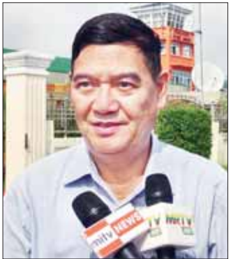
ရခိုင်ပြည်နယ်ဝန်ကြီးချုပ် ဦးထိန်လင်း

အခု သံတမန်ခရီးစဉ်ကို စီစဉ်ရတဲ့ အဓိက ရည်ရွယ်ချက် နှစ်ခုရှိပါတယ်။ တစ်ခုကတော့ ဆိုင်ကလုန်းမိုးခေါင်ဖြစ်ပေါ်ပြီးတဲ့နောက်ပိုင်းမှာ စစ်တွေ မြို့ဟာ တော်တော်လေးကို ထိခိုက်ခံစားခဲ့ရတယ်။ အဲဒီကနေ ပြန်လည်ရုန်းထပြီးတော့ ပြန်လည် တည်ဆောက်ရေးလုပ်ငန်းတွေ လုပ်ကြရတယ်။ လုပ်ကြတဲ့အခါ နိုင်ငံတော်အကြီးအကဲရဲ့ မူဝါဒအရ ပြည်သူ့လူထုကို အဓိက ထိခိုက်စေခဲ့တဲ့ နေရာတွေ ဖြစ်တဲ့ ကျွန်းမာရေ၊ ပညာရေးတို့မှာ ဘယ်လိုလုပ် နေသလဲ။ ဘာသာရေး၊ ယဉ်ကျေးမှုနဲ့ ပတ်သက်ပြီး တော့ ဘယ်လိုပြန်လည်ပြုပြင်ပေးနေသလဲ။ ဒီလို လုပ်တဲ့အခါ ဘယ်သူ့ကိုမှချွန်မထားဘဲ အားလုံးကို ဂရုစိုက်တယ်ဆိုတာက ကျွန်တော်တို့ရဲ့ မူဝါဒဖြစ် တဲ့အတွက် မြို့ထဲမှာရော၊ မြို့ပြင်မှာရော လူ့အဖွဲ့ အစည်းအကုန်လုံးကို တတ်နိုင်သလောက် စောင့်ရှောက်ပေးနေပါတယ်။