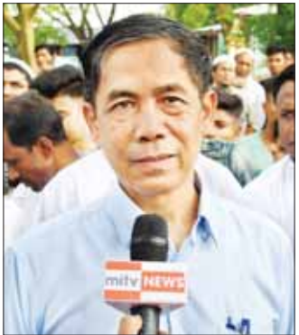
ပြည်ထောင်စုဝန်ကြီး ဦးကိုကိုလှိုင်

အဆိုပါ လေ့လာရေးခရီးစဉ်နှင့်စပ်လျဉ်း၍ ပြည်ထောင်စုဝန်ကြီး၊ ပြည်နယ်ဝန်ကြီးချုပ်နှင့် မြန်မာနိုင်ငံအခြေစိုက်သံရုံးများမှ တာဝန်ရှိသူများ၏ စကားသံများကို စုစည်းဖော်ပြလိုက်ရပါသည်- ပြည်ထောင်စုဝန်ကြီး ဦးကိုကိုလှိုင် ပြည်ထောင်စုအစိုးရအဖွဲ့ဝင်ကြီးဌာန(၂) ဒုတိယဥက္ကဋ္ဌ(၁) ရခိုင်ပြည်နယ်တည်ငြိမ်အေးချမ်းရေးနှင့် ဖွံ့ဖြိုးတိုးတက်ရေးအဖွဲ့ဝင်များ လုပ်ငန်းများ ညှိနှိုင်းပေါင်းစပ်ရေးကော်မတီ