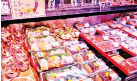
ဟောင်ကောင်ဈေးဝယ်စင်တာတစ်ခုတွင် ဂျပန်နိုင်ငံမှ တင်သွင်းလာသည့် ပင်လယ်စာများ ခင်းကျင်းပြသရောင်းချနေစဉ်။

ဂျပန်နိုင်ငံကတော့ လက်ရှိမှာ အဝေးကနေ ထိန်းချုပ်မောင်းနှင်နိုင်တဲ့ အဆင့်မြင့်စက်ရုပ်တွေ အသုံးပြုပြီး အဏုမြူဓာတ်ပေါင်းဖို့ အတွင်းပိုင်းနေရာတွေကို လေ့လာနိုင်ဖို့ ကြိုးပမ်းနေပါတယ်။ ဒီလောင်စာတောင့်တွေ ရှင်းလင်း သန့်ရှင်းရေးပြုလုပ်နိုင်ဖို့ကိစ္စကို အပြုသဘောအမြင်နဲ့ စဉ်းစားရင်တောင် နှစ်ပေါင်း ၃၀ ကနေ ၄၀ အထိ ကြာမြင့်စာမျက်နှာ ၁၇ သို့