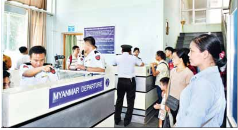
မူဆယ်မြို့ နယ်စပ်လူဝင်ထွက် ဂိတ်တွင် ယာယီနယ်စပ်ဖြတ်သန်းခွင့်ကတ်ပြား (TBP) - တစ်ခါသုံးကတ်များ ဆောင်ရွက်ပေးစဉ်။

မူဆယ် စက်တင်ဘာ ၄ ရှမ်းပြည်နယ် (မြောက်ပိုင်း) မူဆယ်မြို့ရှိ နယ်စပ်လူဝင်ထွက်ဂိတ်များနှင့် ကူးသန်းရောင်းဝယ်ရေး နယ်စပ်ကုန်သွယ်ရေးဂိတ်များကို ကိုဗစ်-၁၉ ရောဂါ ပြန့်ပွားမှုကြောင့် ၂၀၂၁ ခုနှစ် မတ်လကုန်ပိုင်းမှစ၍ နှစ်နိုင်ငံလူဝင်ထွက်နှင့် ကူးသန်းရောင်းဝယ်မှုတို့ကို ခေတ္တယာယီပိတ်ထားခဲ့ပြီး ၂၀၂၃ ခုနှစ် ဇန်နဝါရီလမှစ၍ ကူးသန်းရောင်းဝယ်ခြင်းနှင့် လူဝင်ထွက်ဂိတ်များကို နှစ်နိုင်ငံ ဝင်ထွက်စာအုပ် (BP) စာအုပ်များကို စတင်ပြုလုပ်ပေးခဲ့ကာ ဝင်ထွက် သွားလာနိုင်ခဲ့သည်ဖြစ်ရာ ယနေ့ မွန်းတည့် ၁၂ နာရီမှစ၍ စာမျက်နှာ ၈ ကော်လံ ၁ *