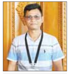
ဦးကျော်ဇေယျ

ပိုပြီး ဝမ်းသာပီတိဖြစ်ရပါတယ်။ ကမ္ဘာမှာ ထင်ထင်ရှားရှား ဘုရားတစ်ဆူအဖြစ် တည်ရှိလာမှာဖြစ်တဲ့အတွက် ပိုပြီးကြည်နူးမိပါတယ်။ နောင်တစ်ချိန်မှာ မာရဝိဇယဘုရားကြီးက ဗုဒ္ဓသာသနာထွန်းကားပြန်ပွားတဲ့ ပြယုဒတစ်ခုအဖြစ် တွေ့ရှိရမှာ ဖြစ်ပါတယ်။