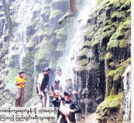
ဂဏန်းကျရေတံခွန်သို့ လာရောက် ကြည့်ရှု ပြည်တွင်းခရီးသွားများ။

တဲ့ မြင်းကျဦးကျေးရွာအုပ်စုထဲမှာ အထင် ရှားဆုံးရေတံခွန်ကတော့ ပေ ၁၀၀၀ ကျော်မြင့်တဲ့ ဆည်ကြီးကျရေတံခွန် ဖြစ်ပြီး အလွန်လှပတဲ့ ရေတံခွန်တစ်ခု လည်းဖြစ်ပါတယ်။ မိုးရာသီကာလမှာ ရွာငံဒေသကို သွားရောက်လည်ပတ်ရင် လှပတဲ့ ရေတံခွန်များစွာကို တွေ့မြင်ရ မှာ ဖြစ်ပါတယ်။ မြင်းကျဦးကျေးရွာထဲက ဆည်ကြီးကျရေတံခွန်၊ ရေပြာစမ်း၊ မိန်းမရဲသခင်မတောင်၊ ရေပြာဆိုင်တို့ဟာ ခရီးသွားဧည့်သည်တွေကြား ထင်ရှားတဲ့ ခရီးသွားနေရာတွေဖြစ်တယ်လို့ မြင်းကျ ဦးကျေးရွာအုပ်စုရဲ့ ဥက္ကဋ္ဌက စာရေးသူကို ပြောပါတယ်။ ဒါ့အပြင် မြဒါးလင်းဂူနဲ့ ညောင်ကျပ် ဆည်၊ ပန်းလောင်မြဒါးလင်းဂူ သဘာဝ ထိန်းသိမ်းရေး ဘေးမဲ့တောစခန်း၊ ကျောက်ငှက်ခတ်တွင်းဂူ၊ သဘာဝဆင်လည် ရေဝင်ဂူ၊ ပလောင်ရွာ၊ လင်းဝေးဂူ၊ လင်းဝေးနဂါးအင်းဂူ၊ နတ်တမီး ရက်ကန်းစင်တောင်ရှုခင်းသာ၊ မြသပိတ် ရေပြာအိုင်၊ သဘာဝရေမြစ်စမ်း ရေချိုး ကန်၊ ကျောက်ခေါင်းဂူနဲ့ ဇော်ဂျီမြစ်