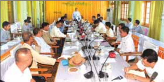
ကျောင်းဆက် ကျောင်း (၁) အခြေခံပညာ အထက်တန်းကျောင်း(မြစ်ကြီးနား) အနေ ဖြင့် ပြည်နယ်အထက်တန်းအဆင့် ပထမ အမျိုးသားအဆင့်သန့်ရှင်း၍ စီမံလန်း စိုပြည်သော ကျောင်းအစီအစဉ် (အထက်

အဖွဲ့ဝင်များက ယခင်အစည်းအဝေး ဆုံးဖြတ်ချက်များအပေါ် ဆောင်ရွက်ပြီးစီး မှုနှင့် ဆက်လက်ဆောင်ရွက်သွားမည့် လုပ်ငန်းများနှင့်စပ်လျဉ်း၍ ဆွေးနွေးသည်။ ကချင်ပြည်နယ် ပတ်ဝန်းကျင်စီမံ ခန့်ခွဲမှုဆိုင်ရာ ကြီးကြပ်မှုကော်မတီ အနေဖြင့် ပြည်နယ်အတွင်း ၂၀၂၂-၂၀၂၃ ဘဏ္ဍာနှစ်တွင် အသိပညာပေးလုပ်ငန်း များကို ၁၇၃ ကြိမ် ဆောင်ရွက်နိုင်ခဲ့ပြီး ယခုနှစ် ဩဂုတ်လအထိ ၁၁ ကြိမ် ဆောင်ရွက်နိုင်ခဲ့ကြောင်း သိရှိရသည်။ သန့်ရှင်း၍ စီမံလန်းစိုပြည်သောကျောင်း