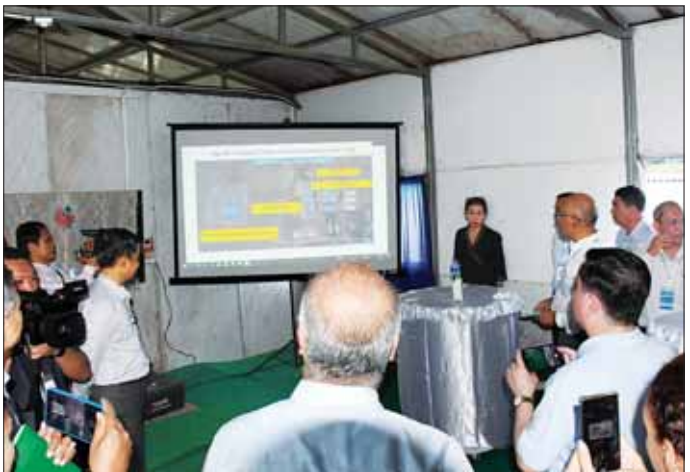
ပြည်ထောင်စုဝန်ကြီး ဦးကိုကိုလှိုင်နှင့် သံတမန်အဖွဲ့ လှဖိုးခေါင် ယာယီနေရာချထားရေးစခန်း၌ ပြန်လည်ဝင်ရောက်လာမည့်သူများအတွက် ပြင်ဆင်ထားမှုအခြေအနေများ လေ့လာကြည့်ရှုကြစဉ်။