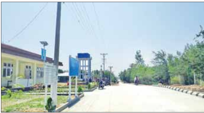
အရှေ့အာရှ ဆင်းရဲမှုလျှော့ချရေးဆိုင်ရာ ပူးပေါင်းဆောင်ရွက်မှုစံပြုစီမံကိန်း အကောင်အထည်ဖော်ထားသော ကျေးရွာတစ်ရွာ။

ယခုကဲ့သို့ ကျေးလက်ဒေသဖွံ့ဖြိုးရေးကို ဆောင်ရွက်ရာတွင် အဓိကအခြေခံအဆောက်အအုံ ဖြစ်သည့် ကျေးလက်အခြေခံအဆောက်အအုံ ဖွံ့ဖြိုးရေးတစ်ခုတည်း ဆောင်ရွက်ခြင်းမဟုတ်ဘဲ ကျေးလက်နေပြည်သူများ၏ လူမှုစီးပွားဘဝများ ဟန်ချက်ညီစွာ ဖွံ့ဖြိုးတိုးတက်စေရေးအတွက် အသက်မွေးဝမ်းကျောင်းလုပ်ငန်းများ အထောက်အကူပြုရေးအတွက်ပါ ယှဉ်တွဲဆောင်ရွက်နိုင်ရန် ရေရှည်ဖွံ့ဖြိုးတိုးတက်မှုကို အထောက်အပံ့ဖြစ်စေ နိုင်မည့် ဖြစ်ပါသည်။