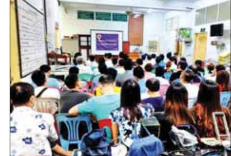
ဇွေဇော်(ထားဝယ်)

အခွန်အမှတ်တံဆိပ် ကပ်နှံခြင်း ဆိုင်ရာ သိကောင်းစရာများကို အပြန်အလှန် ဆွေးနွေးခဲ့ကြ ကြောင်း သိရသည်။