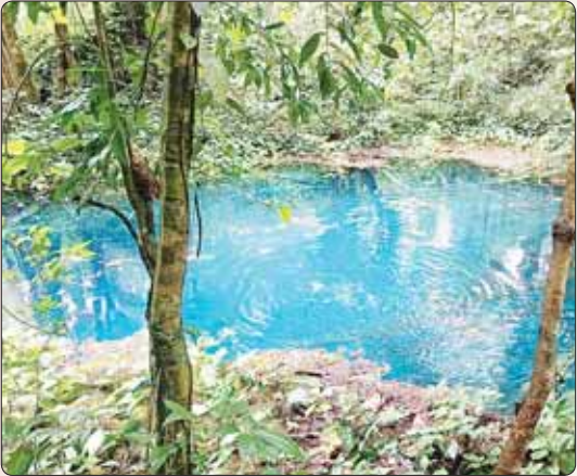
ပြည်တွင်းခရီးသွားများအား ဆွဲဆောင်နိုင်သောနေရာတစ်ခုဖြစ်သည့် ရေပြာအိုင်။