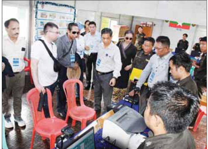
ပြည်ထောင်စုဝန်ကြီး ဦးကိုကိုလှိုင်နှင့် သံတမန်အဖွဲ့ တောင်ပြိုလက်ဝဲပြန်လည်လက်ခံရေးစခန်း၌ လုပ်ငန်းဆောင်ရွက်မှုအခြေအနေများ လေ့လာကြည့်ရှုကြစဉ်။

ညနေပိုင်းတွင် ပြည်ထောင်စုဝန်ကြီးနှင့် သံတမန်အဖွဲ့သည် လေကြောင်းခရီးဖြင့် စစ်တွေမြို့မှ ပြန်လည်ထွက်ခွာကြပြီး နေပြည်တော်သို့ ပြန်လည်ရောက်ရှိကြသည်။ သတင်းစဉ်