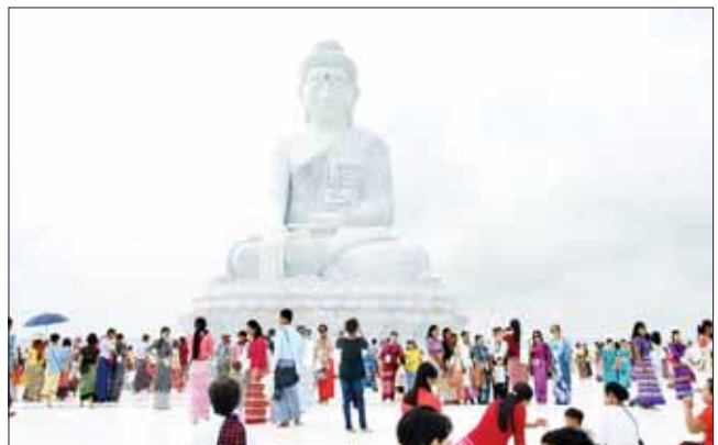
မာရဝိဇယပုဒ္ဒရုပ်ပွားတော်မြတ်ကြီးအား ရန်ကုန်တိုင်းဒေသကြီးအစိုးရအဖွဲ့ ဌာနဆိုင်ရာဝန်ထမ်းများနှင့် အနယ်နယ်အရပ်ရပ်မှ ရဟန်း၊ ရှင်လူဘုရားဖူးလာ ပြည်သူများ လာရောက်ဖူးမြော်ကြည့်၍