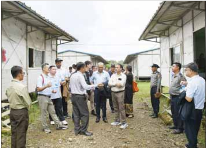
ပြည်ထောင်စုဝန်ကြီး ဦးကိုကိုလှိုင်နှင့် သံတမန်အဖွဲ့ တောင်ပြိုလက်ဝဲပြန်လည်လက်ခံရေး စခန်းအတွင်း လေ့လာကြည့်ရှုကြစဉ်။