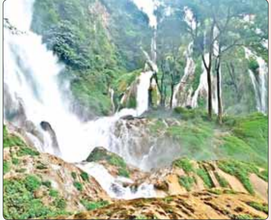
မြင်းကျဦးကျေးရွာအုပ်စုမှ ပေ ၁၀၀၀ ကျော်မြင့်သည့် ဆည်ကြီးကျရေတံခွန်။

သွားရောက်လည်ပတ်ကြတဲ့နေရာတွေ ဖြစ်ပါတယ်။ မင်းပလောင်ရေပူစမ်းနဲ့ ပန်းလောင်မြစ်၊ ရန်ရေတံခွန်နဲ့ ကမ်းပါးနီ ကျောက်လုံးကြီးစခန်းက ကျောက်ခေတ် လူသားတို့ရဲ့ ဆေးရေးပန်းချီလက်ရာ များကိုလည်း ပြည်တွင်းခရီးသွားတွေ လည်ပတ်ကြည့်ရှုကြလေ့ရှိပါတယ်။ သဘာဝကိုအမြော်ထားတဲ့တောတွင်း ခရီးကြမ်း Trekking ကိုလည်း ခရီး သွားဧည့်သည်တွေက စိတ်ဝင်တစား သွားရောက် လည်ပတ်ကြပါသေးတယ်။ ဒီလိုသဘာဝတရားရဲ့ လက်ဆောင်မွန် ကောင်းများကို ရရှိပိုင်ဆိုင်ထားတဲ့ ကိုယ်ပိုင်အုပ်ချုပ်ခွင့်ရဒေသ ဓနမြေမှ ရွာငံဒေသရဲ့ ရေတံခွန်မြို့တော် ခရီးသွား လုပ်ငန်းဟာ ပြည်တွင်းခရီးသွားဧည့်သည် တွေကို ဆွဲဆောင်နိုင်ရုံသာမက ပြည်ပ ဧည့်သည်တွေရဲ့ စိတ်နှလုံးကိုပါ ဆွဲသိမ်း လှူနိုင်တဲ့ ခရီးသွားဒေသတစ်ခုအဖြစ် ကျော်ကြားလာမှာကတော့ အမှန်ပင် ဖြစ်ပါတော့တယ်။ ။