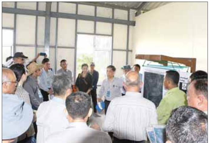
ပြည်ထောင်စုဝန်ကြီး ဦးကိုကိုလှိုင်နှင့် သံတမန်အဖွဲ့ ကြိမ်ချောင်း(တောင်) ကျေးရွာ၌ နေရပ်စွန့်ခွာသူများအား ပြန်လည်နေရာချထားမှုအခြေအနေများနှင့်ပတ်သက်၍ လေ့လာကြည့်ရှုကြစဉ်။