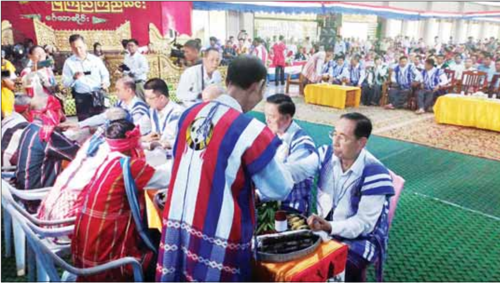
ကရင်တိုင်းရင်းသားမောင်မယ်များက နိုင်ငံတော်စီမံအုပ်ချုပ်ရေးကောင်စီအဖွဲ့ဝင် မန်းငြိမ်းမောင်နှင့် တာဝန်ရှိသူများ၊ ဧည့်သည်တော်များအား ချည်ဖြူဖွဲ့ပေးကြစဉ်။

မြောင်းမြ ဩဂုတ် ၂၈ ကရင်တိုင်းရင်းသားရိုးရာ ဝါခေါင်လချည်ဖြူဖွဲ့ မင်္ဂလာအခမ်းအနားကို ယနေ့ နံနက် ၈ နာရီခွဲတွင် ဧရာဝတီတိုင်းဒေသကြီး မြောင်းမြမြို့၌ ကျင်းပသည်။ အခမ်းအနားသို့ နိုင်ငံတော်စီမံအုပ်ချုပ်ရေးကောင်စီအဖွဲ့ဝင် မန်းငြိမ်းမောင်၊ ဧရာဝတီတိုင်းဒေသကြီး ဝန်ကြီးချုပ် ဦးတင်မောင်ဝင်း၊ နိုင်ငံတော်စီမံအုပ်ချုပ်ရေးကောင်စီ ဗဟိုအကြံပေးအဖွဲ့ ခေါင်းဆောင် ဦးစောထွန်းအောင်မြင့်၊ စိုက်ပျိုးရေး၊ မွေးမြူရေးနှင့် ဆည်မြောင်းဝန်ကြီးဌာန ဒုတိယဝန်ကြီး ဒေါက်တာတင်ထွဋ်၊ နိုင်ငံတော်စီမံအုပ်ချုပ်ရေးကောင်စီ ဗဟိုအကြံပေးအဖွဲ့ဝင် ဦးစောဒန်နီရယ်၊ စာမျက်နှာ ၃ ကော်လံ ၁ □