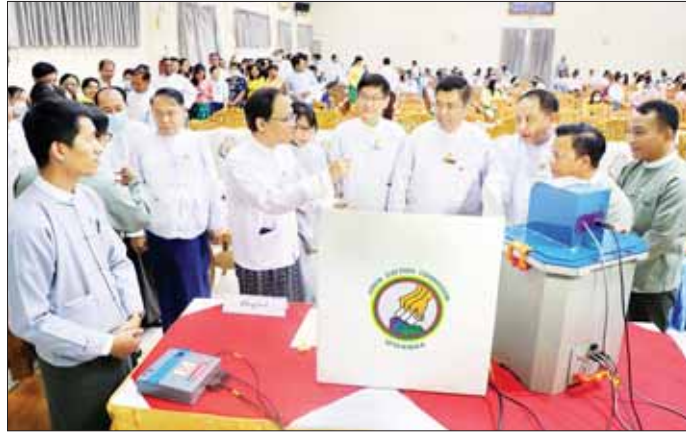
အမှုထမ်းပေါင်း ၂၅၄ ဦး စမ်းသပ်မဲပေးပြီး အရန်ဘက်ထရီဖြင့် အလွယ်တကူလဲလှယ်အသုံးပြုသော်လည်း ဆက်လက်အသုံးပြုနိုင်သေးကြောင်း၊ နိုင်ကြောင်း သိရသည်။ အကြောင်းအမျိုးမျိုးကြောင့် အားကုန်ခဲ့ပါကလည်း သတင်းစဉ်

စက်အသုံးပြုရန် လျှပ်စစ်မီးမလိုအပ်ဘဲ 12 V 7.0 Ah ဘက်ထရီနစ်လုံးကိုသာ ထည့်သွင်းအသုံးပြုရခြင်းဖြစ်ပြီး ဝန်ကြီးဌာနများ၌ လက်ရှိဆောင်ရွက်လျက်ရှိသော ရှင်းလင်းဆွေးနွေးခြင်းနှင့် သရုပ်ပြပွဲများတွင် အသုံးပြုလျက်ရှိသော MEVM စက်အတွင်း ထည့်သွင်းအသုံးပြုထားသည့် ဘက်ထရီသည် အားအပြည့်ဖြည့်သွင်းထားပါက ရက်သတ္တတစ်ပတ်အတွင်း ဝန်ကြီးဌာန ၁၀ ခုမှ အရာထမ်း/