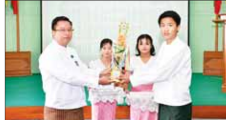
တော် မော်တော်ယာဉ်လုပ်ငန်းပေါင်းစုံ ထိန်းသိမ်းရေးကော်မတီ(အဝေးပြေး)၏ ကွပ်ကဲမှုအောက်ရှိ မော်တော်ယာဉ်အသင်းများမှ ဝန်ထမ်းများနှင့် သားသမီး၊ ကျောင်းသား ကျောင်းသူများအား ပညာသင်ထောက်ပံ့စရိတ်နှင့် ကျောင်းသုံးပစ္စည်းစာအုပ်များကို ထောက်ပံ့ပေးအပ်ခဲ့ကြောင်း သိရသည်။ မျိုးသီဟ(ပြန်/ဆက်)

ဦးဇေယျာလင်းက ကျောင်းသား ကျောင်းသူများအနေဖြင့် မိမိတို့၏ နိုင်ငံဖွံ့ဖြိုးတိုးတက်ရေးအတွက် ပညာခေတ်၏စိန်ခေါ်မှုများကို ရင်ဆိုင် ကျော်လွှားနိုင်ရေးအတွက် ကြိုးပမ်းဆောင်ရွက်ကြရမည်ဖြစ်ကြောင်း ပြောကြားသည်။ ဆက်လက်၍ နေပြည်တော်ယာဉ်လုပ်ငန်းပေါင်းစုံထိန်းသိမ်းရေးကော်မတီ(အဝေးပြေး) ပညာရေး၊ ကျန်းမာရေးနှင့် လူမှုရေးဆိုင်ရာ လုပ်ငန်းကော်မတီဥက္ကဋ္ဌ ဦးမြတ်မိုးက ပညာသင်စရိတ်ထောက်ပံ့မှု အခြေအနေကို ရှင်းလင်းတင်ပြသည်။ ထို့နောက် နေပြည်တော်ကောင်စီအဖွဲ့ဝင်၊ နေပြည်တော်ကုန်းလမ်း သယ်ယူပို့ဆောင်ရေးလုပ်ငန်းများ ကြီးကြပ်ကွပ်ကဲရေးအဖွဲ့ဥက္ကဋ္ဌက တက္ကသိုလ်ဝင်တန်းတွင် ထူးချွန်စွာ အောင်မြင်ခဲ့ကြသည့် ကျောင်းသား ကျောင်းသူများအား ဂုဏ်ပြုဆုတံဆိပ်နှင့် ဆုချီးမြှင့်ငွေများ ပေးအပ်သည်။ (အပေါ်ယာပုံ) ယင်းနောက် နေပြည်တော် မထာ(အဝေးပြေး)ရုံးချုပ်၊ နေပြည်