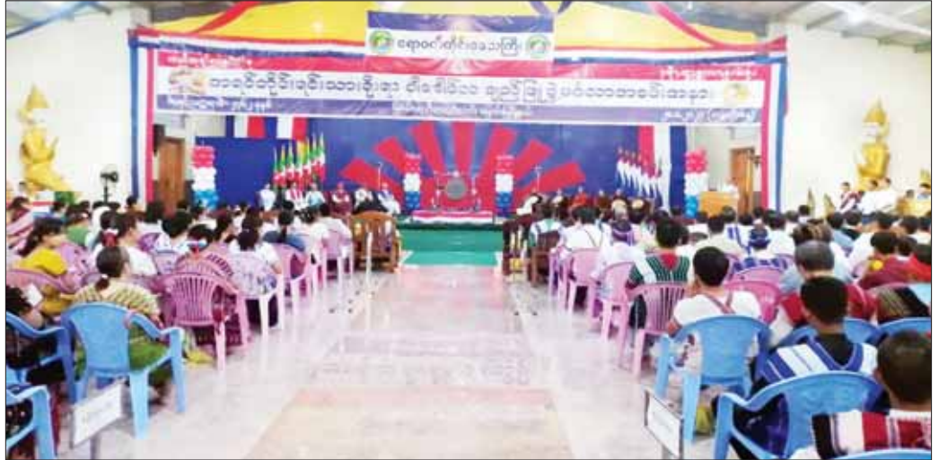
ကရင်တိုင်းရင်းသားမောင်မယ်များက ချည်ဖြူဖွဲ့ပစ္စည်းများ သယ်ဆောင်နေရာချထားပေးပြီး နိုင်ငံတော်စီမံအုပ်ချုပ်ရေးကောင်စီအဖွဲ့ဝင် မန်းငြိမ်းမောင်

ဆက်လက်၍ ကရင်တိုင်းရင်းသားရိုးရာ ချည်ဖြူဖွဲ့ မင်္ဂလာအခမ်းအနားကို ဆက်လက်ကျင်းပရာ