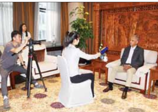
ပြည်ထောင်စုဝန်ကြီး ဦးအောင်နိုင်ဦး CRI Myanmar သတင်းဌာနမှ တွေ့ဆုံ မေးမြန်းမှုများကို ဖြေကြားစဉ်။

တယ်။ တရုတ်နိုင်ငံလည်း လာတယ်။ အခုလည်း ထပ်ပြီးတော့ လုပ်ငန်းတွေ ထပ်မံတိုးချဲ့ပြီး လုပ်နိုင်ဖို့ လျှောက်ထားတာတွေ အများကြီးရှိပါတယ်။ အဲဒီတော့ ဒါက မြန်မာနိုင်ငံရဲ့ ဖွံ့ဖြိုးတိုးတက်မှု ဖြစ်တယ်။ နောက်တစ်ခုက RCEP မပေါ်ခင်ကတည်းက အာဆီယံနဲ့ ဂျပန်၊ အာဆီယံနဲ့ ကိုရီးယား၊ အာဆီယံနဲ့ တရုတ်၊ အာဆီယံနဲ့ ဩစတြေးလျ၊ နယူးဇီလန် စတဲ့ သဘောတူညီချက်တွေ ရှိထားခဲ့ပြီးသား၊ အဲဒီကတည်းက မြန်မာနိုင်ငံရဲ့ အထည်တွေက အာဆီယံနဲ့ ပူးပေါင်းဆောင်ရွက်တဲ့ နိုင်ငံတွေကို လွတ်လွတ်လပ်လပ်နဲ့ အရေအတွက်များများစားစား တင်ပို့တာ တွေ့ရပါတယ်။ ကျွန်တော်တို့ အထည်ချုပ်ကဏ္ဍက တော်တော်လေးလေး ကြီးထွားလာတယ်။ မနှစ်က ကျွန်တော်တို့ရဲ့ မြန်မာနိုင်ငံရဲ့ အထည်ချုပ်ကနေ ပြီးတော့မှ နိုင်ငံခြားကိုတင်ပို့တဲ့ တန်ဖိုး ပမာဏစုစုပေါင်း အမေရိကန်ဒေါ်လာ သန်း ၅၀၀ လောက် ရှိပါတယ်။ အဲဒီတော့ အထည်ချုပ်ကဏ္ဍအများကြီး အလားအလာကောင်းပါတယ်။ မေး။ ။ သမ္မတရှီကျင့်ဖွင့်ကဏ္ဍလုံး ဆိုင်ရာ ဖွံ့ဖြိုးတိုးတက်မှု အဆိုပြုချက်ထဲမှာ ဖွံ့ဖြိုးတိုးတက်မှု ဦးစားပေးခြင်းကို ဆွဲကိုင်ထားတဲ့ ပြည်သူလူထုဗဟိုပြုခြင်းကို ဆွဲကိုင်ထားခြင်း၊ လူသားနှင့်သဘာဝ သဟဇာတဖြစ်စွာ အတူယှဉ်တွဲနေထိုင်ရေးကို ဆွဲကိုင်ထားခြင်း၊ အဲဒီမှာထည့်သွင်း ပြောကြားခဲ့တယ်။ အဆိုပါ ဆွဲကိုင်ထားခြင်းသုံးရပ်ပေါ် ဘယ်လိုယူဆပါ သလဲ။ ပြီးတော့ တရုတ်နိုင်ငံက အဆက် မပြတ် ဖွံ့ဖြိုးတိုးတက်ရေးအပိုင်းမှာ ဆောင်ရွက်ချက်တွေအပေါ် ဘယ်လို ယူဆပါသလဲ။ မြန်မာနိုင်ငံအနာဂတ် ဖွံ့ဖြိုးတိုးတက်ရာမှာ ပတ်ဝန်းကျင် မထိခိုက်ဖို့ ဘယ်လိုဆောင်ရွက်ချက်တွေ ရှိပါသလဲ။ ဖြေ။ ။ ပထမဆုံး သမ္မတကြီးရှီကျင့်ဖွင့် ရဲ့ Global Development Initiative ဒါလည်း ကုလသမဂ္ဂအပေါ် အင်အားစုတော်တော်များများ လက်ခံထားတဲ့ အလှူကောင်းတဲ့ အစီအစဉ်