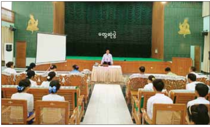
ပူးပေါင်းချိတ်ဆက်ဆောင်ရွက်ကြရန် မှာကြားသည်။ ယင်းနေ့က ပြည်ထောင်စုဝန်ကြီးသည် ဌာန အပေါ် ပေါင်းစပ်ဖြည့်ဆည်း ဆောင်ရွက်ပေးသည်။ ဆိုင်ရာဝန်ထမ်းများ၊ သင်တန်းသား သင်တန်းသူများ သတင်းစဉ်

မွေးဝမ်းကျောင်းသင်တန်းများ ဖွင့်လှစ်ပို့ချပေးလျက် ရှိကြောင်း၊ ယွန်းပညာကောလိပ်(ပုဂံ)သည် မြန်မာ့ ယဉ်ကျေးမှုအမွေအနှစ်များ မပျက်ပျက်အောင် ထိန်းသိမ်းစောင့်ရှောက်ပြီး မြန်မာ့ရိုးရာယွန်းထည် နည်းစနစ်များ မပျက်ယွင်းစေဘဲ ခေတ်မီနည်းစနစ် များဖြင့် တိုးတက်တီထွင်ဆောင်ရွက်ရမည်ဖြစ် ကြောင်း၊ ထိုသို့ဆောင်ရွက်ခြင်းမှ ရရှိလာသည့် နည်းပညာများကို ပြန်လည်မျှဝေဖြန့်ဖြူးပေးရမည် ဖြစ်ကြောင်း၊ သင်တန်းသား သင်တန်းသူများအနေ ဖြင့် ပညာရေးဆုံးခန်းတိုင်အောင် လေ့လာဆည်းပူးပြီး ကိုယ့်ဒေသဖွံ့ဖြိုးရေးအတွက် တက်ကြွစွာပါဝင် ဆောင်ရွက်ကြရန်မှာကြားလိုကြောင်း၊ Grade-9 နှင့် အထက်လူငယ်များအနေဖြင့် သမဝါယမစာရင်းရေး စာရင်းကိုင် သက်မွေးပညာသင်တန်းကျောင်းများ တွင် တက်ရောက်နိုင်ပြီး ထူးချွန်သူများက သမဝါယမ နှင့် စီမံခန့်ခွဲမှုပညာတက္ကသိုလ်များသို့ တက်ရောက် ခွင့်ရှိပါကြောင်း၊ ဦးစီးဌာနများကလည်း တက်ညီ လက်ညီဖြင့် နိုင်ငံစီးပွားဖွံ့ဖြိုးတိုးတက်ရေးအတွက်