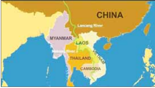
မဲခေါင် - လန်ချန်း ဒေသပြေမြေပုံ။

ဆိုက်ဘာလုံခြုံရေး စီနီဆီမိုက်ပါ နောက်ဆက်တွဲ ရင်ဆိုင်ရလျက်ရှိပါ သည်။ အင်တာနက် နည်းပညာအား နည်းလမ်းမျိုးစုံဖြင့် အသုံးချလျက်ရှိရာ တွင် အီလက်ထရွန်နစ်စွမ်းအား ဖြစ်ပေါ် လာသည့် အန္တရာယ်လောင်းကစားများ နှင့် လိမ်လည်မှုများကို ကျူးလွန်လျက် တစ်လွဲ အသုံးချနေခြင်းများကိုလည်း ရင်ဆိုင်ကြရလျက်ရှိပါသည်။