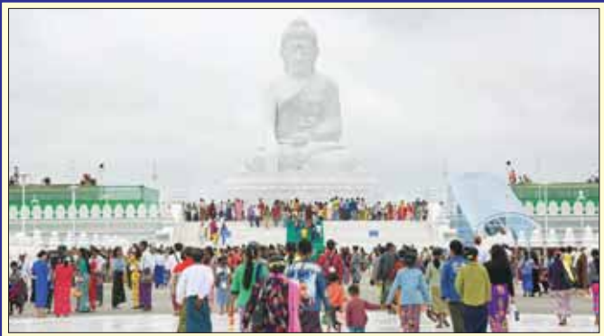
ဗာရာဏသီလူထုပွဲများတော်မြတ်ကြီးသို့ ယနေ့ရုံးပိတ်ရက်တွင် အနယ်နယ်အရပ်ရပ်မှ လာရောက်ဖူးမြော်ကြည်ညိုကြသည့် ရဟန်းရှင်လူ ဘုရားဖူးပြည်သူများဖြင့် စည်ကားလျက်ရှိ ပြည်တွင်းသတင်း ၈၁ ၅