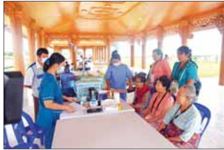
ဘုရားဖူးလာအဘိုးအဘွားများအား ကျန်းမာရေးစောင့်ရှောက်မှုလုပ်ငန်းများ ဆောင်ရွက်ပေးစဉ်။

ကျွေးမွေးလှူဒါန်းကြသည်။ အဆိုပါ မာရဝိဇယဗုဒ္ဓရုပ်ပွားတော်မြတ်ကြီးသို့ လာရောက်ဖူးမြော် ကြည်ညိုကြသည့် ဘိုးဘွားများအား ကျန်းမာရေးဝန်ထမ်းများက လိုအပ်သည့် ကျန်းမာရေး စောင့်ရှောက်မှုလုပ်ငန်းများ ဆောင်ရွက်ပေးလျက်ရှိပြီး မြန်မာနိုင်ငံကြက်ခြေနီအဖွဲ့နှင့် မီးသတ်တပ်ဖွဲ့ဝင်များကလည်း လမ်းလျှောက်ရန် အခက်အခဲဖြစ်သည့် ဘိုးဘွားများအား အဆင်ပြေစွာဖြင့် ဘုရားဖူးမြော်ကြည်ညိုနိုင်ရန် Wheel Chair များဖြင့် လိုက်လံပို့ဆောင်ပေးကာ လိုအပ်သည်များ ကူညီဆောင်ရွက်ပေးလျက်ရှိသည်။ အဆိုပါ မာရဝိဇယဗုဒ္ဓရုပ်ပွားတော်မြတ်ကြီးအား ရဟန်းရှင်လူအများပြည်သူများ အခမဲ့လာရောက်ဖူးမြော် ကြည်ညိုနိုင်ရန် စက်တင်ဘာ ၃ ရက်အထိ နံနက် ၆ နာရီမှ ည ၈ နာရီအတွင်း ဖွင့်လှစ်ထားရှိကြောင်း သတင်းရရှိသည်။