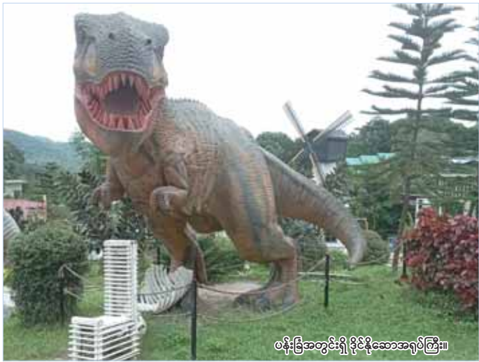
ပန်းခြံအတွင်းရှိ ဒိုင်နိုဆော့အရုပ်ကြီး။

ဒိုင်နိုဆော့ပန်းခြံကိုတော့ မြေအကျယ် သုံးဧက နီးပါးပေါ်မှာ My house garden (PinyinOoLwin) လို့ အမည်ပေးထားပြီး စားသောက်ဆိုင်နဲ့ အတူ Mini Zoo ပုံစံသဖွယ် တွဲဖက်ဆောက်လုပ်ထားတာဖြစ်ပါတယ်။ ရုပ်ရှင်တွေထဲမှာသာမြင်ဖူးကြတဲ့ ဒိုင်နိုဆော့