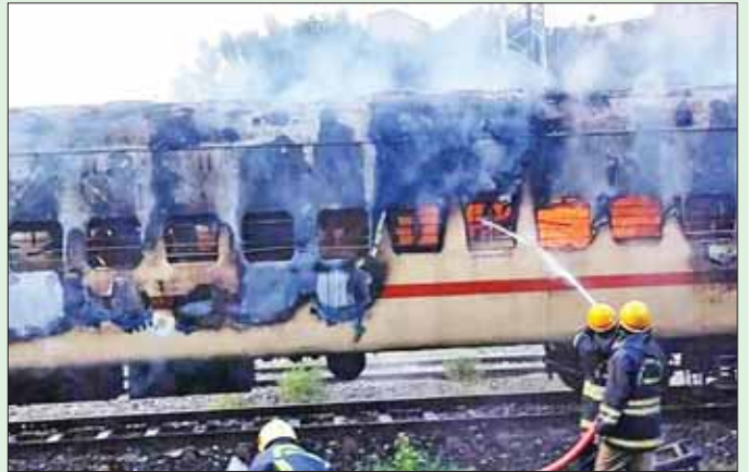
ရထားတွဲ မီးငြိမ်းသတ်နေမှုကို တွေ့ရစဉ်။