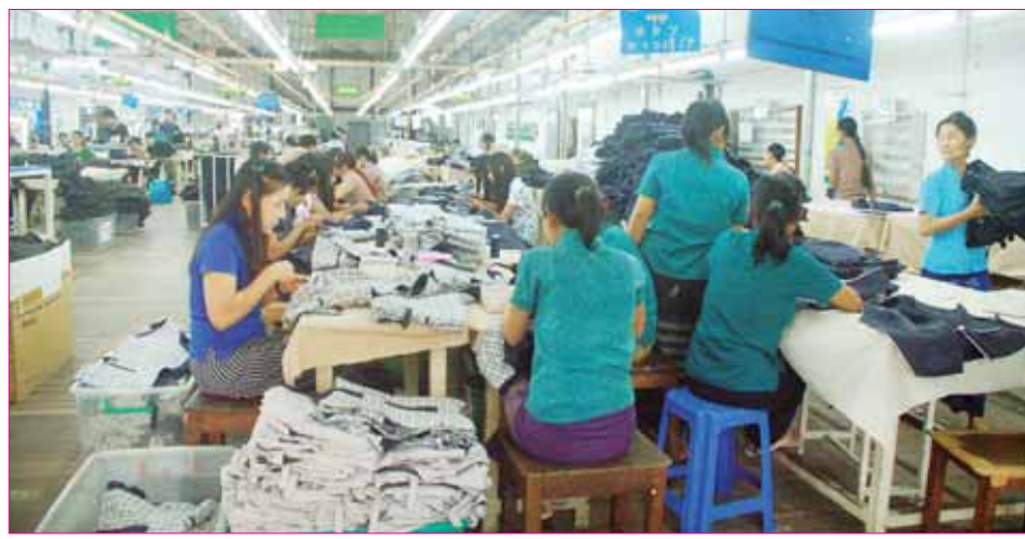
ရန်ကုန်မြို့ရှိ အထည်ချုပ်စက်ရုံတစ်ရုံ၌ အထည်ချုပ်လုပ်ငန်းများဆောင်ရွက်နေမှုကို တွေ့ရစဉ်။