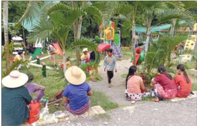
ဒိုင်နိုဆော့ပန်းခြံအတွင်း လည်ပတ်ကြည့်ရှုနေကြသည့် ပြည်တွင်းခရီးသွားများ။

ဒိုင်နိုဆော့ပန်းခြံဟာ မန္တလေး-လားရှိုးလမ်းမကြီး ပေါ်မှာတည်ရှိပြီး ပန်းခြံပွင့်ရတဲ့ ရည်ရွယ်ချက်က တော့ ဒေသခံတွေ အလုပ်အကိုင်အခွင့်အလမ်းတွေ ရရှိစေရန်ရည်ရွယ်ပြီး ဒိုင်နိုဆော့ပန်းခြံကို စိတ်ကူး ပုံဖော်ကာ ဆောင်ရွက်ခဲ့တာ ဖြစ်ပါတယ်။ မိသားစုနဲ့အတူ ချစ်သူနဲ့အတူ မိတ်ဆွေတွေနဲ့ အတူ ပြင်ဦးလွင်မြို့ကို ရောက်ဖြစ်ခဲ့ရင် ပြင်ဦးလွင် မြို့တော်က ခရီးသွားဧည့်သည်တွေ မဖြစ်မနေ သွားရောက်လည်ပတ်ကြတဲ့ နေရာတစ်ခုဖြစ်တဲ့ ဒိုင်နိုဆော့ပန်းခြံကို သွားရောက်လည်ပတ်နိုင်စေဖို့ ရေးသားဖော်ပြပေးလိုက်ရပါတယ်။ ။