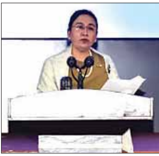
ရင်းနှီးမြှုပ်နှံမှုနှင့် နိုင်ငံခြားစီးပွား ဆက်သွယ်ရေး ဝန်ကြီးဌာန ဒုတိယဝန်ကြီး ခေါက်တာ ဝါဝါမောင် ရှင်းလင်း ပြောကြားစဉ်။

ဆက်လက်၍ ရင်းနှီးမြှုပ်နှံမှုနှင့် နိုင်ငံခြားစီးပွားဆက်သွယ်ရေး ဝန်ကြီးဌာန ဒုတိယဝန်ကြီး ခေါက်တာဝါဝါမောင်က မိမိတို့ဝန်ကြီးဌာန အနေဖြင့် နိုင်ငံခြားသုံးငွေ ကြီးကြပ်ရေးကော်မတီ Foreign Exchange Supervisory Committee (FESC)ကို အတွင်းရေးမှူးရုံးအနေဖြင့် ဆောင်ရွက်နေသည့် ဝန်ကြီးဌာနဖြစ်ကြောင်း၊ နိုင်ငံခြားသုံးငွေ ကြီးကြပ်မှုကော်မတီ (FESC) ကို နိုင်ငံတော်စီမံအုပ်ချုပ်ရေးကောင်စီ အမိန့်အမှတ် ၂၈/၂၀၂၂ နှင့်အတူ ၂၀၂၂ ခုနှစ် ဧပြီ ၄ ရက်နေ့တွင် စတင်ဖွဲ့စည်းခဲ့ကြောင်း၊ ရည်ရွယ်ချက်မှာ မြန်မာနိုင်ငံ၏ စီးပွားရေး ဖွံ့ဖြိုးတိုးတက်မှုအတွက် နိုင်ငံခြားငွေလဲလှယ်နှုန်း တည်ငြိမ်စေရေးနှင့် နိုင်ငံခြားငွေကို ထိရောက်စွာအသုံးပြုနိုင်ရေးအတွက်၊ လိုအပ်သည့် လုပ်ငန်းတာဝန်များကို အကောင်အထည်ဖော်ဆောင်ရွက်နိုင်ရန် အတွက် ရည်ရွယ်၍ ဖွဲ့စည်းခဲ့ခြင်းဖြစ်ကြောင်း၊ ဈေးကွက်(Market) မပြည့်ဝသည့်အခါ အစိုးရအနေဖြင့် မူဝါဒအရဆောင်ရွက်ရသည့် အခြေအနေမျိုးဖြစ်ကြောင်း ပြောကြားသည်။