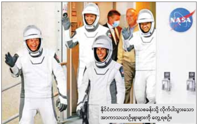
နိုင်ငံတကာအာကာသစခန်းသို့ လိုက်ပါသွားသော အာကာသယာဉ်များကို တွေ့ရစဉ်။