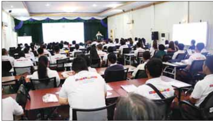
ရေးအစီအစဉ်ကို အသေးစား၊ အငယ်စားနှင့် အလတ်စားစီးပွား ထုတ်ကုန်များအတိုင်း ထုတ်ကုန် သစ်များ တိုးမြှင့်ထုတ်လုပ်နိုင်ရန် နှင့် အမျိုးသားအဆင့် အရည် အသွေးဆိုင်ရာ အခြေခံအဆောက် အအုံ ခိုင်ခံ့အားကောင်းစေရန် ရည်ရွယ်ဆောင်ရွက်ခဲ့ခြင်းဖြစ်ပြီး ရန်ကုန်တိုင်းဒေသကြီး၊ ပဲခူးတိုင်း ဒေသကြီး၊ ဧရာဝတီတိုင်းဒေသ

ရန်ကုန် ဩဂုတ် ၂၆ မဲခေါင် - လန်ချန်း ပူးပေါင်း ဆောင်ရွက်မှု အထူးရန်ပုံငွေစီမံ ကိန်း ၂၀၂၀ ဖြင့် MSMEများအား စားသောက်ကုန် ထုတ်လုပ်မှု နည်းပညာများပြန်လည်ဖြန့်ဝေရေး အစီအစဉ်(၂) ဒုတိယနေ့ကို ယမန် နေ့နံနက်ပိုင်းတွင် သုတေသနနှင့် တီထွင်ဆန်းသစ်မှု ဦးစီးဌာန၌ ကျင်းပရာ သိပ္ပံနှင့်နည်းပညာ ဝန်ကြီးဌာန ဒုတိယဝန်ကြီး ဒေါက်တာအောင်ဇေယျာ၊ သုတေ သနနှင့် တီထွင်ဆန်းသစ်မှုဦးစီး ဌာန ညွှန်ကြားရေးမှူးချုပ်၊ ပါမောက္ခချုပ်များ၊ ဆက်စပ်ဌာန များမှ တာဝန်ရှိသူများ၊ မြန်မာ နိုင်ငံ ကုန်သည်များနှင့် စက်မှု လက်မှုလုပ်ငန်းရှင်များ အသင်း ချုပ်မှ ကိုယ်စားလှယ်များ၊ MSME လုပ်ငန်းရှင်များ တက်ရောက်ကြ သည်။ စားသောက်ကုန်ထုတ်လုပ်မှု နည်းပညာများ ပြန်လည်ဖြန့်ဝေ