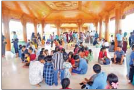
ဘုရားဖူးလာပြည်သူများ သုဗ္ဗမ္မာဇရပ်များပေါ်တွင် အနားယူအပန်းဖြေနေကြစဉ်။