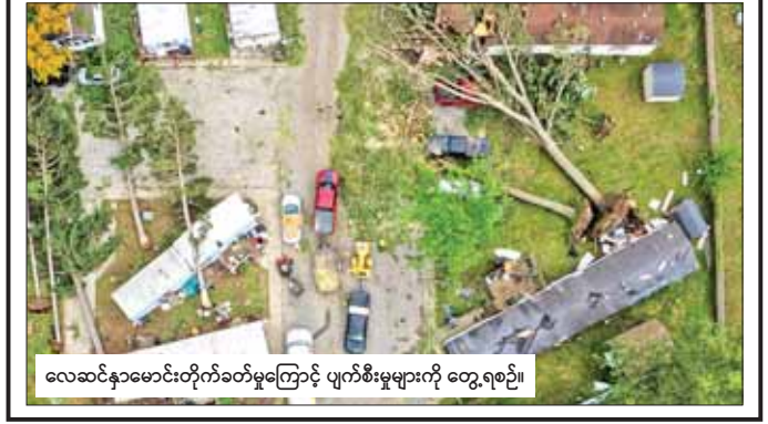
လေဆင်နှာမောင်းတိုက်ခတ်မှုကြောင့် ပျက်စီးမှုများကို တွေ့ရစဉ်။