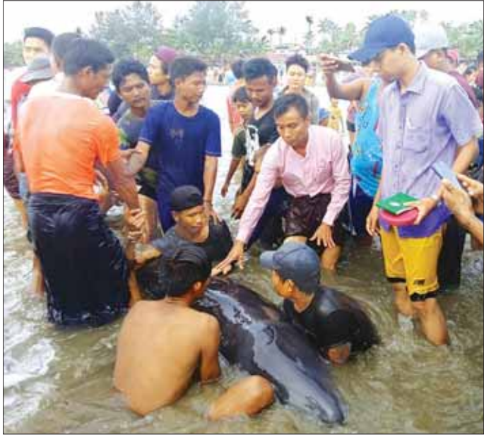
စာမျက်နှာ ၁၆ ကော်လံ ၅

ချောင်းသာ ဩဂုတ် ၂၀ ရော့ဝတီတိုင်းဒေသကြီးချောင်းသာ မြို့ ချောင်းသာကမ်းခြေ၌ ယမန်နေ့ ညနေ ၅ နာရီခန့်က ဝေလငါးမျိုးစိတ်ဝင် ငါးကြီးတစ်ကောင်သောင်တင်လျက်တွေ့ရှိခဲ့ပြီး ပင်လယ်ပြင်သို့ ပြန်လည်လွှတ်ပေးခဲ့ကြောင်း သိရသည်။ (ယာပုံ) မြို့ ငါးလုပ်ငန်းဦးစီးဌာန ဦးစီးဌာနမှူးနှင့် ဝန်ထမ်းများသည် ကမ်းခြေတစ်လျှောက် ငါးလုပ်ငန်းဆိုင်ရာ လုပ်ငန်းများကွင်းဆင်း ဆောင်ရွက်နေစဉ် ချောင်းသာကမ်းခြေ သီရိဟိုတယ်ရှေ့ ကမ်းခြေတွင် တွေ့ရှိရခြင်းဖြစ်ပြီး အလျား ၁၀ ဒသမ ၇ ပေ လုံးပတ် ငါးပေ၊ ရေယက်အကျယ် သုံးပေခန့်ရှိသော ဝေလငါးမျိုးစိတ်ဝင် ငါးကြီးတစ်ကောင်ဖြစ်ကြောင်း သိရသည်။