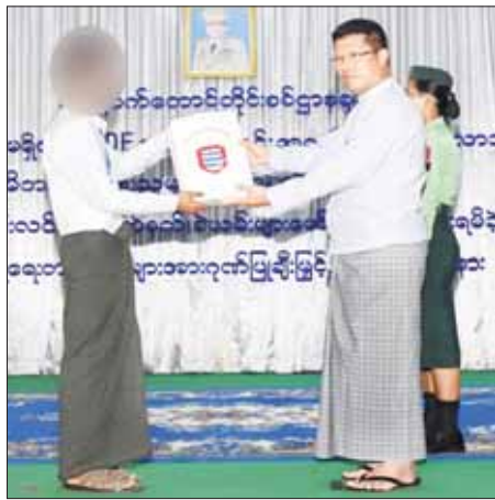
ပြန်လည်ဝင်ရောက်ရန် ဆန္ဒရှိသူများ ကျန်ရှိနေသေးကြောင်း သိရပြီး ဥပဒေဘောင်အတွင်း ပြန်လည်ဝင်ရောက်လိုသူများအနေဖြင့် နီးစပ်ရာ ခရိုင်၊ မြို့နယ်စီမံအုပ်ချုပ်ရေးအဖွဲ့များ၊ တစ်စခန်းများနှင့် ရှစ်စခန်းများ သို့ အမြန်ဆက်သွယ် သတင်းပေးပို့လာပါက ကြိုဆိုလိုက်ခံပေးသွား မည်ဖြစ်ကြောင်းနှင့် လက်နက်၊ ခဲယမ်းများအတွက် ဆုကြေးငွေများ ပေးအပ်သွားမည်ဖြစ်ကြောင်း သတင်းရရှိသည်။ သတင်းစဉ်

မိဘအုပ်ထိန်းသူများ တက်ရောက်ကြသည်။ ဦးစွာ တိုင်းဒေသကြီးဝန်ကြီးချုပ်နှင့် တိုင်းမှူးတို့က အမှာစကား ပြောကြားပြီး ဥပဒေဘောင်အတွင်း ပြန်လည်ဝင်ရောက်လာသည့် ပြစ်မှုကျူးလွန်ခြင်းမရှိသော ဧရာဝတီတိုင်းဒေသကြီး လပွတ္တာမြို့နယ်၊ ဘင်္ဂါတမြို့နယ်၊ မြောင်းမြမြို့နယ်၊ ကြံခင်းမြို့နယ်၊ ဘိုကလေးမြို့နယ် နှင့် ဟိုင်းကြီးကျွန်းမြို့တို့မှ PDF အဖွဲ့ဝင် အမျိုးသား ရှစ်ဦးနှင့် အမျိုး သမီး နှစ်ဦးတို့ကို ဝန်ခံကတိ လက်မှတ်ရေးထိုးကောက် ငင်းတို့၏ မိဘ အုပ်ထိန်းသူများထံသို့ လွှဲပြောင်းအပ်နှံပေးပြီး ထောက်ပံ့ပစ္စည်းများနှင့် စားသောက်ဖွယ်ရာများ ထောက်ပံ့ပေးအပ်သည်။ (ယာဝု)