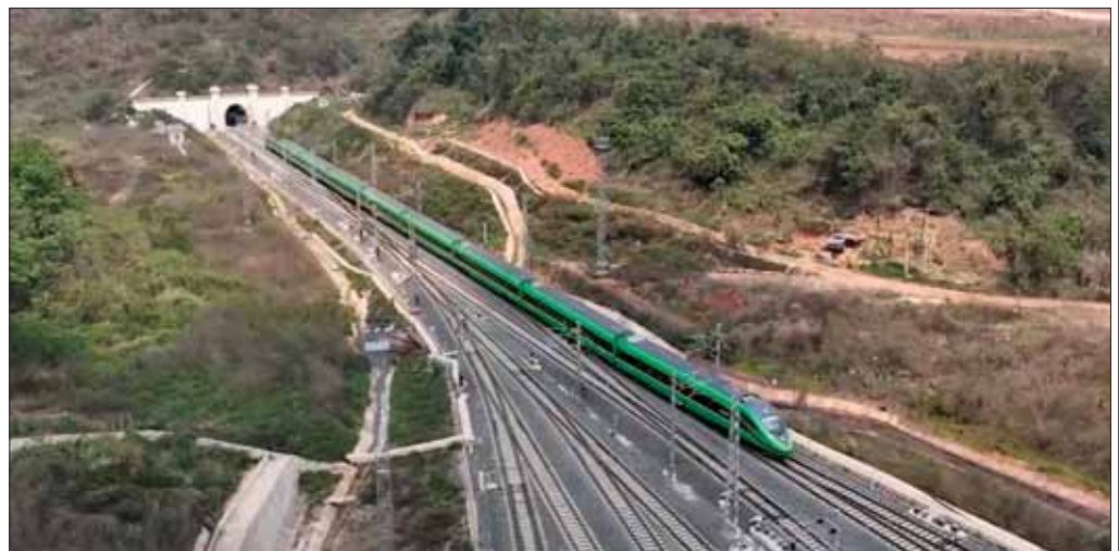
တရုတ် - လာအို မီးရထားလမ်း။

တရုတ်ခရီးသွားဧည့်သည်တွေ လာရောက် လည်ပတ်ပို့ဆောင်ရာမှာ အိမ်နီးချင်း ထိုင်းနိုင်ငံ တစ်နိုင်ငံတည်းမဟုတ်ပါဘူး။ မြန်မာ၊ ကမ္ဘော ဒီးယား၊ လာအို၊ ဗီယက်နမ်၊ အင်ဒိုနီးရှား စတဲ့ အရှေ့တောင်အာရှနိုင်ငံများ အားလုံးနီးပါးပါ။