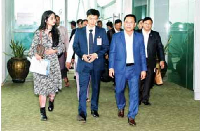
မြို့သို့ ပြန်လည်ရောက်ရှိကြသည်။ ဦးရဲနိုင်နှင့် တာဝန်ရှိသူများ၊ မြန်မာ နိုင်ငံဆိုင်ရာ တရုတ်ပြည်သူ့ရန်ကုန် အပြည်ပြည်ဆိုင်ရာ သမ္မတနိုင်ငံ သံရုံးမှ Minister လေဆိပ်၌ ကြိုဆိုနှုတ်ဆက်ခဲ့ကြသည့် Mr.Zheng ဖြစ်သူ သတင်းစဉ်

မြန်မာ့အလင်း ဝန်ကြီးဌာန ပြည်ထောင်စုဝန်ကြီး ဦးမောင်မောင်အုန်းနှင့်အဖွဲ့သည် တရုတ်ပြည်သူ့သမ္မတနိုင်ငံ ယူနန်ပြည်နယ်ပြည်သူ့အစိုးရပြည်နယ်အုပ်ချုပ်ရေးမှူး၏ ဖိတ်ကြားချက်အရ တရုတ်ပြည်သူ့သမ္မတနိုင်ငံ ကူမင်းမြို့၌ ၂၀၂၃ ခုနှစ် ဩဂုတ် ၁၅ ရက်မှ ၁၈ ရက်အထိ ကျင်းပသည့် (၇) ကြိမ်မြောက် တရုတ်-တောင်အာရှပြပွဲ၊ (၂၇) ကြိမ်မြောက် တရုတ် (ကူမင်း) ပို့ကုန်၊ သွင်းကုန် ကုန်စည်ပြပွဲဖွင့်ပွဲအခမ်းအနား၊ ၂၀၂၃-ခုနှစ် မဟာမဲခင်ဒေသခွဲ စီးပွားရေးစင်္ကြံအုပ်ချုပ်သူများ ဖိရစ်နှင့် ဆက်စပ် အခမ်းအနားများသို့ တက်ရောက်ခဲ့ပြီး ယနေ့မွန်းလွဲပိုင်းတွင် တရုတ်နိုင်ငံ ကူမင်းမြို့မှ လေကြောင်းခရီးဖြင့် ရန်ကုန်