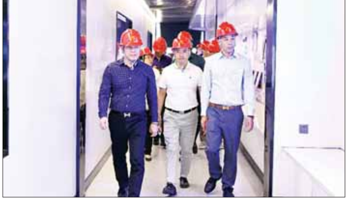
ပြည်ထောင်စုဝန်ကြီး ဦးမောင်မောင်အုန်းနှင့် အဖွဲ့ဝင်များ Chengggang Group ၏ လူသိများသော Yunnan Qujing Chengggang Iron and Steel (Group) Co.Lt ၏ သံမဏိစက်ရုံအတွင်း ကြည့်ရှုလေ့လာစဉ်။

International Cooperation Association of SMES Executive Director Global Business, CEO