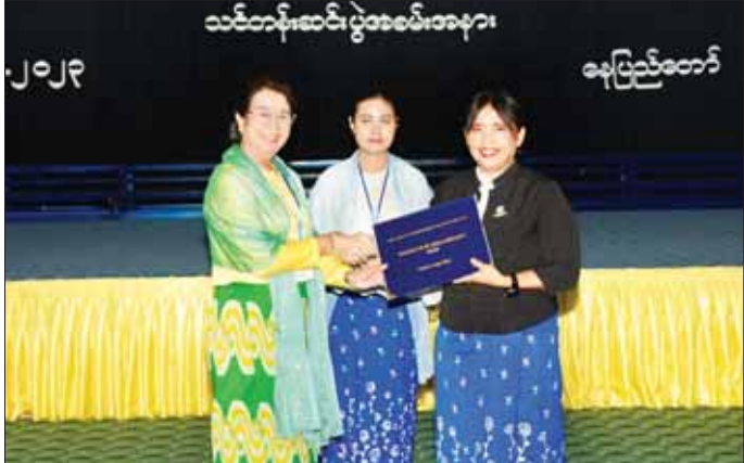
နေပြည်တော်၊ အဂတီလိုက်စားမှု တိုက်ဖျက်ရေး ကော်မရှင်ဥက္ကဋ္ဌနှင့် အဖွဲ့ဝင်၊ နိုင်ငံတော်ဖွဲ့စည်းပုံအခြေခံဥပဒေဆိုင်ရာနည်းပညာအဖွဲ့ဝင်များ၊ ပြည်ထောင်စု ရာထူးဝန်အဖွဲ့ အဖွဲ့ဝင်၊ သင်တန်းဆရာများ၊ တာဝန်ရှိသူများနှင့် သင်တန်းသား သင်တန်းသူများအဖြစ် ညွှန်ကြားရေးမှူးချုပ်များ၊ ဒုတိယအမြဲတမ်းအတွင်းဝန်များ၊ တပ်ဖွဲ့မှူးများ၊ ဒုတိယညွှန်ကြားရေးမှူးချုပ်များ၊ ဒုတိယပိမာကျွန်းများ၊ အင်ဂျင်နီယာချုပ်များ၊ အထွေထွေမန်နေဂျာများ တက်ရောက်ကြသည်။ သတင်းစဉ်

လက်တွေ့ကျင့်သုံးဆောင်ရွက်သည့် သင်တန်းသားများသည် ဤသင်တန်းမှ သင်ကြားပို့ချပေးသည့် ဥပဒေဘာသာရပ်များကို မိမိတို့၏ လုပ်ငန်းခွင်တွင် လက်တွေ့ကျင့်သုံးဆောင်ရွက်ခြင်းဖြင့် ဝန်ကြီးဌာန၏ လုပ်ငန်းတာဝန်များကို ပိုမိုထိရောက်ကောင်းမွန်စွာ ဆောင်ရွက်နိုင်မည်ဟု ယုံကြည်ပါကြောင်း ပြောကြားသည်။ သင်တန်းဆင်းပွဲသို့ ဒုတိယဝန်ကြီးနှင့် ဒုတိယ