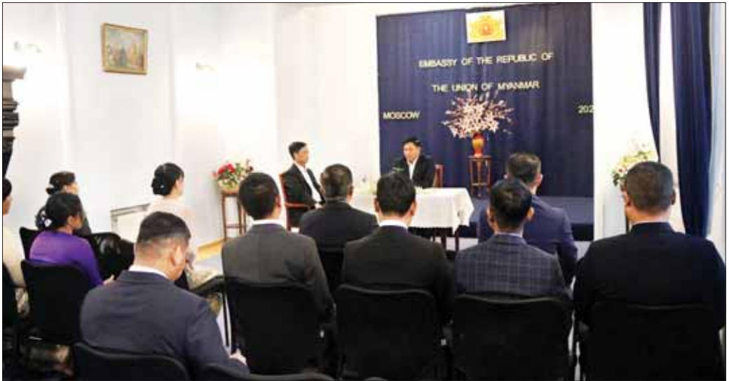
နိုင်ငံတော်စီမံအုပ်ချုပ်ရေးကောင်စီဝင်၊ ဒုတိယဝန်ကြီးချုပ်နှင့် ကာကွယ်ရေးဝန်ကြီးဌာန ပြည်ထောင်စုဝန်ကြီး ဗိုလ်ချုပ်ကြီး တင်အောင်စန်း မြန်မာစစ်သံရုံး၌ သံအမတ်ကြီး၊ စစ်သံမှူး(ကြည်း၊ ရေ၊ လေ)နှင့် စစ်သံရုံးမှ အရာရှိ၊ စစ်သည်၊ မိသားစုများနှင့်တွေ့ဆုံ၍ နိုင်ငံတော်၏ လက်ရှိဖြစ်ပေါ်တိုးတက်မှုအခြေအနေများကို ရှင်းလင်းပြောကြားစဉ်။

နိုင်ငံတော်စီမံအုပ်ချုပ်ရေးကောင်စီဝင်၊ ဒုတိယဝန်ကြီးချုပ်နှင့် ကာကွယ်ရေးဝန်ကြီးဌာန ပြည်ထောင်စုဝန်ကြီး ဗိုလ်ချုပ်ကြီး တင်အောင်စန်း ဦးဆောင်သည့် ကိုယ်စားလှယ်အဖွဲ့သည် ရုရှားနိုင်ငံ မော်စကိုဒေသတွင် ကျင်းပပြုလုပ်ခဲ့သည့် နိုင်ငံတကာ စစ်ဘက်နည်းပညာဖိုရမ် (ARMY-2023) နှင့် (၁၁)ကြိမ်မြောက် နိုင်ငံတကာလုံခြုံရေးဆိုင်ရာညီလာခံ (XI Moscow Conference on International Security) သို့ တက်ရောက်ခဲ့ပြီး ယနေ့ ညနေပိုင်းတွင် လေကြောင်းခရီးဖြင့် ရန်ကုန်မြို့သို့ ပြန်လည်ရောက်ရှိလာရာ ရန်ကုန်တိုင်းစစ်ဌာနချုပ်တိုင်းမှူး ဗိုလ်ချုပ်ဇော်ဟိန်း၊ တပ်မတော်အရာရှိကြီးများ၊ မြန်မာနိုင်ငံဆိုင်ရာ ရုရှားဖက်ဒရေရှင်းနိုင်ငံသံရုံးမှ Counsellor Mr. Pavel KLABUKOV၊ စစ်သံမှူး Mr. Sergey KURCHENKO နှင့် တာဝန်ရှိသူများက ရန်ကုန်အပြည်ပြည်ဆိုင်ရာလေဆိပ်၌ ကြိုဆိုကြသည်။