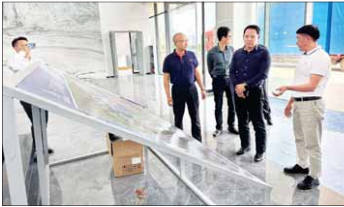
ပြည်ထောင်စုဝန်ကြီး ဦးမောင်မောင်အုန်းနှင့် အဖွဲ့ဝင်များ Nanhai စက်မှုဇုန်ရှိ Yunnan Runyang century Phobovoltaic Technology ကုမ္ပဏီလီမိတက်မှ တည်ထောင်လျက်ရှိသည့် စွမ်းဆောင်ရည်မြင့် ဆိုလာဆဲလ် ထုတ်လုပ်မှုလုပ်ငန်းခွင်အတွင်း ကြည့်ရှုလေ့လာစဉ်။

ယနေ့ နံနက်ပိုင်းတွင် ပြည်ထောင်စုဝန်ကြီးအား China