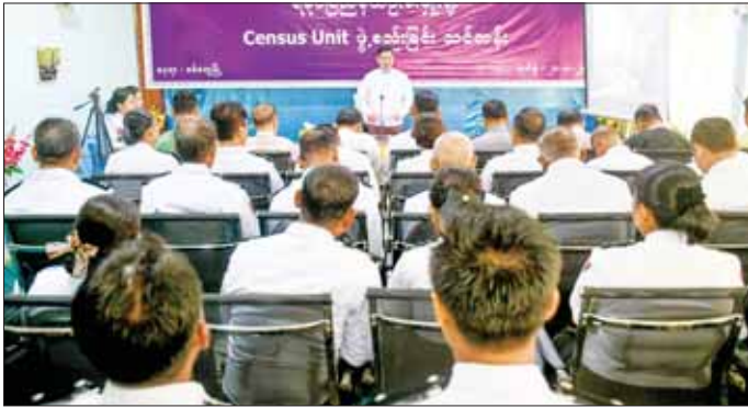
ထို့နောက် သင်တန်းနည်းပြ ပြည်သူ့အင်အား ဦးစီးဌာန(ရုံးချုပ်)မှ လက်ထောက်ညွှန်ကြားရေးမှူး ဒေါ်လင်းလင်းမာက သန်းခေါင်စာရင်းလုပ်ငန်းစီမံ ချက်အား ရှင်းလင်းတင်ပြသည်။ အဆိုပါ သင်တန်းသို့ ပြည်နယ်အတွင်းရှိ ခရိုင် ခုနစ်ခုမှ သင်တန်းသား၊ သင်တန်းသူ ၄၀ တက်ရောက်ကြပြီး ပြည်သူ့အင်အား ဦးစီးဌာန (ရုံးချုပ်) မှ သင်တန်းနည်းပြများက ပို့ချ ပေးသွားမည်ဖြစ်သည်။ မွန်လွဲပိုင်းတွင် ပြည်နယ်ဝန်ကြီးချုပ်နှင့် အဖွဲ့

စစ်တွေ ဩဂုတ် ၂၀ ရခိုင်ပြည်နယ် သဘာဝဘေးအန္တရာယ်ဆိုင်ရာ စီမံ ခန့်ခွဲမှုအဖွဲ့ ဥက္ကဋ္ဌ ရခိုင်ပြည်နယ် ဝန်ကြီးချုပ် ဦးထိန်လင်းသည် ပြည်နယ်ဝန်ကြီးများ၊ တာဝန်ရှိ သူများနှင့်အတူ ယနေ့နံနက်ပိုင်းက လူဝင်မှုကြီးကြပ် ရေးနှင့် ပြည်သူ့အင်အားဝန်ကြီးဌာန ရခိုင်ပြည်နယ် ဦးစီးမှူးရုံး၌ ကျင်းပသော သန်းခေါင်စာရင်း ယူနစ် များ (Census Unit) ဖွဲ့စည်းခြင်းလုပ်ငန်း သင်တန်း ဖွင့်ပွဲသို့တက်ရောက်ပြီး ပြည်နယ်အစိုးရအဖွဲ့ရုံး၌ ပြည်နယ် တည်ဆောက်ရေးလုပ်ငန်း စီစစ်ရေး ကော်မတီ အဖွဲ့ဝင်များနှင့် တွေ့ဆုံသည်။