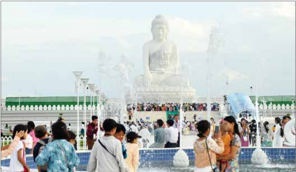
မာရဝိဇယဘုရားကြီးအား ဖူးမြော်ရန်လာရောက်ကြသည့် အနယ်နယ်အရပ်ရပ်မှ ပြည်သူများကို ဩဂုတ် ၁၈ ရက်က စည်ကားစွာ တွေ့ရစေပါ။

ကျွန်တော်တို့အဖွဲ့ဟာ အဝင်မုခ်ဝကို ကျော်ဖြတ်ပြီး များမကြာခင် အဝင်၊ အထွက် စစ်ဆေးတဲ့ စစ်ဆေးရေးဂိတ်ကို ဖြတ်ရပါတယ်။ တာဝန်ကျ ဝန်ထမ်းတွေကလည်း ဖော်ဖော်ရွေရွေပါပဲ။ ဘုရားဖူးတဲ့လူတွေက များလှန်းတော့ အဖွဲ့လိုက်၊ အဖွဲ့လိုက် တစ်သုတ်ပြီး တစ်သုတ် ဝင်သွားကြတာ အဝင်လမ်းမကြီး တစ်ခုလုံးပြည့်သွားပါတယ်။ သက်ကြီးရွယ်အိုတွေနဲ့ ကျန်းမာရေး သိပ်မကောင်းတဲ့သူတွေ အသက်အရွယ်ကြီးသူတွေကတော့ ဖော်တော်ယာဉ်ငယ်(ဘာဂီ)လေးတွေစောင့်စီးကြတာပေါ့။ ကျွန်တော်တို့အဖွဲ့ကတော့ လမ်းလျှောက်ရင်း အဝေးကနေ ဘုရားကြီးဆီကို ငေးမေးလိုက်၊ ဘုရားဖူးပြီး ပြန်လာ