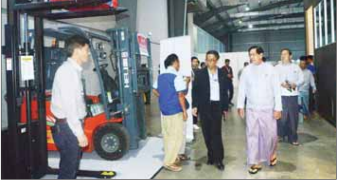
ထုတ်လုပ်သောပစ္စည်းများ ဝင်ရောက်ပြသကြသည်။ နာရီမှ ညနေ ၅ နာရီအထိ ပြသသွားမည် ဖြစ်ကြောင်း ပြပွဲကို ဩဂုတ် ၁၈ ရက်မှ ၂၀ ရက်အထိ နံနက် ၁၀ သိရသည်။ အာကာလင်း

ဆောက်လုပ်ရေးဆိုင်ရာနှင့် ပတ်သက်သည့် သံထည် ပစ္စည်းများ၊ ဓာတုပစ္စည်းများ၊ အိမ်အမိုး၊ ကြမ်းခင်း၊ ရေချိုးခန်းသုံးပစ္စည်းများ၊ အိမ်အလှဆင်ပစ္စည်းများ၊ အိမ်ရာကဏ္ဍတွင် ဆောက်လုပ်ပြီးဖြစ်သည့် ကွန်ပိုများ၊ အိမ်ရာများ၊ မြေကွက်အရောင်းပြခန်းများ၊ ဆိုလာပြား၊ အင်ဗာတာ၊ ဘက်ထရီ၊ ဆိုလာနှင့် ဆက်စပ်ပစ္စည်းပြခန်းများပြသထားပြီး ကုမ္ပဏီပေါင်း ၉၀ ခန့်က ပြခန်းပေါင်း ၂၀၀ ကျော် ပြသထားကြောင်း သိရသည်။ ထို့ပြင် ပြည်ပကုမ္ပဏီတို့သည် ဂျပန်၊ ကိုရီးယား၊ ဗီယက်နမ်၊ အိန္ဒိယ၊ ထိုင်း၊ တရုတ်၊ မလေးရှားနိုင်ငံတို့မှ