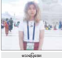
မသပြေအေး

သာသနိကအဆောက်အအုံတွေရဲ့ မြန်မာမှု အနုပညာ ပြည့်စုံစွာ ခမ်းခမ်းနားနား တည်ဆောက်ပေးထားတာလည်း မြန်မာ နိုင်ငံအတွက် လှစ်ယူစရာပါ။ ကျွန်တော် တို့ နေပြည်တော် ဆိုင်ကယ်ချစ်သူများ အဖွဲ့အနေနဲ့ တိုင်းဒေသကြီးနဲ့ ပြည်နယ် အသီးသီးမှာရှိကြတဲ့ ဆိုင်ကယ်ချစ်သူများ အဖွဲ့တွေကို နေပြည်တော်မှာဆိုရင် တစ်ခုလုပ်ပြီး ဘုရားကြီးကို ဆိုင်ကယ် ပေါင်းပေးဖွဲ့ဖွဲ့စုစု ပေါင်းပေးဖွဲ့ဖွဲ့ စီစဉ် သွားဦးမှာပါ။ ဒီနေ့ မိုးပွဲလေးတွေလည်း ကျတော့ ဘုရားကြီးဖူးလိုက်ရတဲ့အခါ တိမ်တိုက်တွေထဲမှာ ဖူးမြော်ရသလို ခံစား မိပြီး ကြည့်နူးဝမ်းသာမိပါတယ်။ အားလုံး ကျန်းမာချမ်းသာကြပါစေလို့ ဆုတောင်း လိုက်ပါတယ်။