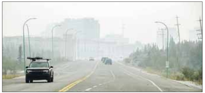
ယင်းနီးကပ်တွင် တောမီးလောင်မှုကြောင့် မီးခိုးများပျံ့နှံ့နေသည်ကို ဩဂုတ် ၁၅ ရက် က တွေ့ရစဉ်။

အကယ်၍ မိုးမရွာခဲ့ပါက ဩဂုတ် ၁၉ ရက်တွင် အဆိုပါဒေသသို့ တောမီးပျံ့နှံ့လာနိုင်လျှင် နိုင်ငံ တစ်ဝန်း လက်ရှိတွင် တောမီးလောင်ကျွမ်းမှုပေါင်း ၁၀၀၀ ကျော် ရှိသည်ဟု ကနေဒါ တောမီးစင်တာက ပြောသည်။ ယခုနှစ်အတွင်း တောမီးကြောင့် မြေဩ ၁၄၀၀၀၀ စတုရန်းကီလိုမီတာ မီးလောင်ခဲ့ သည်ဟု သိရသည်။ အင်န်အိတ်ချ်က