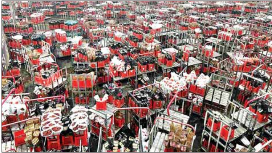
ကူမင်းနိုင်ငံတကာပန်းရောင်းဝယ်ရေးစင်တာကို တွေ့ရစဉ်။