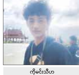
ကိုမင်းသီဟ

ဒီနေ့တော့သားက လိုက်ပို့ပေးတဲ့အတွက် မနက်ကတည်းက ဘုရားကြီးကို ရောက်ရှိ ဖူးမြော်နေတာ အခုညနေထိ အားပေးတရ ဖူးမြော်နေတာဖြစ်ပါတယ်။ ဝမ်းသာတိ ဖြစ်မိပါတယ်။ ဘုရားရှင်ရဲ့ထုဆစ်ထားတဲ့ တွေကို ပြည်သူတွေသိအောင် ဖော်ပြပေး နေတဲ့ ပြန်ကြားရေးဝန်ကြီးဌာနကိုလည်း ကျေးဇူးအထူးတင်ရှိပါတယ်လို့ ပြောလိုပါ တယ်။ သတင်းတွေမှာ တွေ့ကတည်းက ဖူးမြော်လိုစိတ်တွေ ပြင်းပြခဲ့ပါတယ်။ မာရဝိဇယဘုရားကြီး တည်ထားတဲ့ အတွက် မြန်မာနိုင်ငံမှာရှိတဲ့ ပုဒ္ဒဘာသာ ဝင်အားလုံးကလည်း အံ့ဖွယ်မာရဝိဇယ ဘုရားကြီးကို လာရောက်ဖူးမြော်ကြတဲ့ ပြည်သူပေါင်း သောင်းချီပြီး ရှိပါမယ်။ တိုင်းဒေသကြီးနဲ့ ပြည်နယ်များမှာရှိတဲ့ ပြည်သူတွေလည်း လာရောက်ဖူးမြော် ကြည့်ည့်ကြပါလို့ မေတ္တာစကားပါးချင် ပါတယ်။