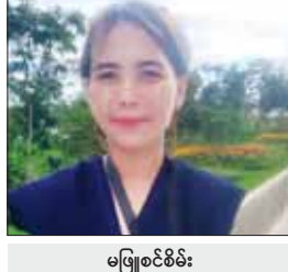
မဖြူစင်စိမ်း

ဘုန်းဘုန်းရဲ့ မိတ်ဆွေတွေ၊ ဒကာ၊ ဒကာမ တွေကိုလည်း ဘုရားကြီး လာရောက် ဖူးမြော်ကြည့် ခေါ်ဆောင်ပို့ပါ။ ဘုန်းဘုန်း တို့ ပြည်ပကို ရောက်တဲ့အခါ ဘုရားဖူးဖို့ အတွက် ၁၀ ဒေါ်လာပေးပြီး ဖူးမြော်ခဲ့ရပါ တယ်။ အုတ်၊ ထုံး၊ သဲ၊ ကျောက်နဲ့ တည်ထားတာ မဟုတ်ပါဘူး။ စကျင် ကျောက်တုံးအကြီးကြီးတွေ၊ စကျင် ကျောက်စစ်စစ်ကြီးတွေနဲ့ တည်ထားပေး တဲ့အတွက် ပုဒ္ဒဘာသာဝင်တစ်ဦးအနေနဲ့ အင်မတန်ဝမ်းမြောက်ပီတိဖြစ်ရပါတယ်။ ရဟန်းရှင်လူ ပြည်သူအပေါင်းလည်း လာရောက်ဖူးမြော်ကြပါလို့ မေတ္တာ ရှေ့ထားပြီး နှိုးဆော်ပါတယ်။ ဘုရား ကိုးကွယ် တန်ခိုးကြွယ်၊ တရားကိုးကွယ် ပညာကြွယ်၊ သံဃာကိုးကွယ် စည်စိမ် ကြွယ်ဆိုတဲ့အတိုင်း ပြည်သူတွေအနေ နဲ့ ဘာသာတရားကိုးကွယ်ပြီး ဖူးမြော် ကြည့်ည့်နေကြတာ မြင်ရတာလည်း ပီတိ အပြာပြာ ပွားမိပါတယ်။ မြန်မာနိုင်ငံမှာ စကျင်ကျောက်နဲ့ ထုဆစ်ထားတဲ့ ကမ္ဘာ ပေါ်ရှိအကြီးဆုံး မာရဝိဇယဘုရားကြီးကို အခုလို အခမဲ့ဖူးမြော်ရတာ ဦးဆောင် ဘုရားဒါယကာကြီးကိုလည်း ကျေးဇူး တင်ပါတယ်။