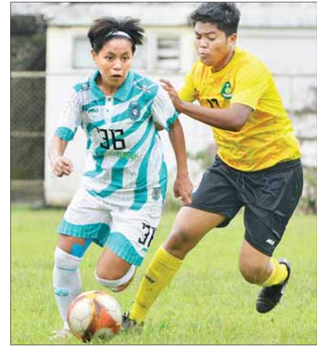
မြဝတီအသင်းနှင့် ရန်ကုန်ယူနိုက်တက်အသင်း ယှဉ်ပြိုင်နေစဉ်။

ရန်ကုန် ဩဂုတ် ၁၇ ၂၀၂၃ ရာသီ မြန်မာအမျိုးသမီးလိဂ်ပြိုင်ပွဲ ပွဲစဉ် (၈) တွင် ဇယား ထိပ်ဆုံးမှ မြဝတီအသင်း သရေကျခဲ့သဖြင့် ချန်ပီယံဆုအတွက် အကြိတ်အနယ်ပြန်ဖြစ်လာသည်။ စာမျက်နှာ ၁၁ ကော်လံ ၅