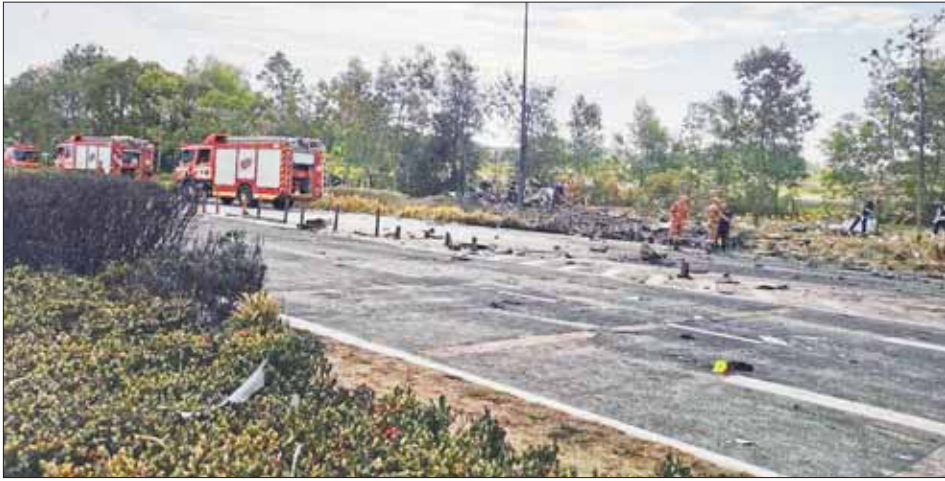
မလေးရှားနိုင်ငံ ဆီလန်ဂေါ့ပြည်နယ်၌ လေယာဉ်ပျက်ကျသည့်နေရာကို တွေ့ရစဉ်။

ကွာလာလမ်ပူ ဩဂုတ် ၁၇ မလေးရှားနိုင်ငံ ဆီလန်ဂေါ့ ပြည်နယ်၌ ဩဂုတ် ၁၇ ရက် နေ့လယ်ပိုင်းက အသေးစား လေယာဉ်တစ်စင်း ပျက်ကျမှု ကြောင့် ၁၀ ဦး သေဆုံးခဲ့ကြောင်း မလေးရှား သယ်ယူပို့ဆောင်ရေး ဝန်ကြီး အန်တိုနီ လော့ခ် စီဖု က ပြောကြားသည်။