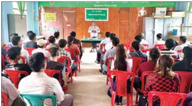
ရှင်းလင်းပွဲသို့ ပြည်ထောင်စုနယ်မြေအတွင်းရှိ သီရိငါးမြို့နယ်မှ စားသောက်ဆိုင်၊ တည်းခိုခန်း/ဟိုတယ်/မိုတယ်နှင့် ရွှေဆိုင် လုပ်ငန်းရှင် စုစုပေါင်း ၁၅၀ ခန့် တက်ရောက်ပြီး အခွန်ပညာပေးလက်ကမ်းစာစောင်များ ဖြန့်ဝေပေးသည်။ ပြည်တွင်းအခွန်များ ဦးစီးဌာနသည် ဥပဒေ၊ နည်းဥပဒေ၊

နေပြည်တော် ဩဂုတ် ၁၇ ပြည်တွင်းအခွန်များ ဦးစီးဌာန၊ ပြည်ထောင်စုနယ်မြေ အခွန်ဦးစီးဌာနမှူးရုံးအောက်ရှိ ဇေယျာသီရိမြို့နယ်၊ ဒက္ခိဏသီရိမြို့နယ်၊ ဥတ္တရသီရိမြို့နယ်၊ ပုဗ္ဗသီရိမြို့နယ်၊ ဇေယျာသီရိမြို့နယ် စသည့် ငါးမြို့နယ် အခွန်ထမ်းများအား အခွန်ပညာပေး ရှင်းလင်းပွဲကို ဩဂုတ် ၃ ရက်နှင့် ဩဂုတ် ၄ ရက်တို့တွင် ပြည်ထောင်စုနယ်မြေ အခွန်ဦးစီးဌာနမှူးရုံး၌ ကျင်းပခဲ့သည်။ (ယာဝုံ) အဆိုပါ အခွန်ပညာပေး