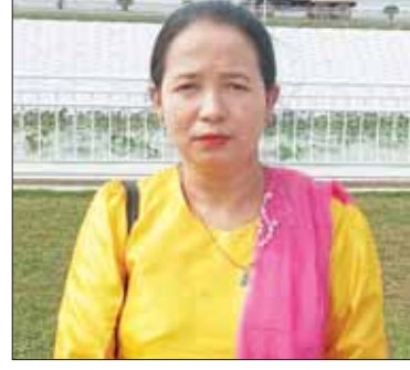
ဒေါ်ယဉ်ယဉ်အေး

တွေပွားများရသလို၊ ကျောက်စာရုံစေတီ တွေဖူးမြော်ပြီး ကိုယ့်ဘာသာ ကမ္ဘာကို သိရှိ ပြသနိုင်အောင် အမြော်အမြင်ရှိရှိနဲ့ တည်ထားပေးတဲ့ ဦးဆောင်ဘုရားဒကာ နဲ့ အလှူရှင်တွေကိုလည်း မေတ္တာပို့သပါ တယ်။ မြန်မာနိုင်ငံအတွက်လည်း အတိုင်း မသိ ဂုဏ်ယူမိပါတယ်။ မပြည့်ပြည့်အောင် (မိတ္ထီလာမြို့နယ်) မာရဝိဇယဘုရားကြီးကို ပထမအကြိမ် လာရောက်ဖူးမြော်တာ ဖြစ်ပါတယ်။ ရွာက လည်း နေ့တိုင်းလိုလို မာရဝိဇယဘုရားကြီး ဖူးမြော်ချင်လို့ ကားတွေစီးပြီး လာရောက် နေကြတာတွေ ရှိပါတယ်။ ဘုရားကြီးက ကြီးကျယ်ခမ်းနားပါတယ်။ ကိုယ့်နိုင်ငံ၊ ကိုယ့်ဘာသာ ပိုပိုပြီး ချစ်ခင်မြတ်နိုး တန်ဖိုးထားတတ်ဖို့ လူကြီးမိဘတွေအနေ နဲ့ ကလေးငယ်တွေကိုလည်း ဖူးမြော် ကြည့်ညိုလေ့လာနိုင်စေဖို့လိုက်ပါပို့ဆောင် ပေးစေချင်ပါတယ်။ စကျင်ကျောက်တွေ မြန်မာနိုင်ငံမှာ အင်မတန်ထွက်တယ်ဆိုတဲ့ အသိလေးကို နောင်လာနောက်သား ကလေးသူငယ်တွေကနေ မျက်ဝါးထင်ထင် တွေ့မြင်နိုင်ပြီး နိုင်ငံချစ်စိတ်၊ ဘာသာ တရားချစ်စိတ်၊ လူမျိုးချစ်စိတ်တွေ ပေါက်ဖွားလာမယ့် ဘုရားကြီးလည်း ဖြစ်ပါ တယ်။ ကျွန်မအနေနဲ့ နောက်တစ်ခေါက် လာရောက်ဖူးမြော်ချင်ပါသေးတယ်။