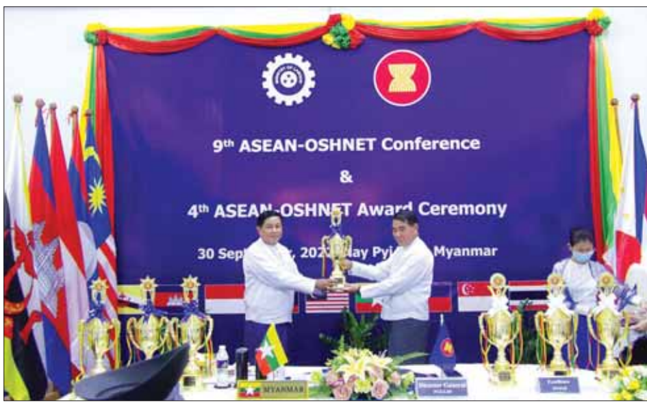
4th ASEAN-OSHNET Award ဆုများ ချီးမြှင့်စဉ်။

ဆုအမျိုးအစား နှစ်မျိုးသတ်မှတ် ASEAN-OSHNET Excellence Award နှင့် ASEAN-OSHNET Best Practices Award ဟူ၍ ဆုအမျိုးအစား နှစ်မျိုး သတ်မှတ်၍ ဆုရွေးချယ်ရေး စံနှုန်းသတ်မှတ်ချက်များနှင့်အညီ ရွေးချယ်ချီးမြှင့်