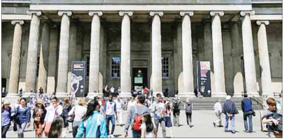
ဗြိတိသျှပြတိုက်သို့ လာရောက်လည်ပတ်သူများကို ၂၀၁၅ ခုနှစ်က တွေ့ရစဉ်။

သိရသည်။ ဗြိတိသျှပြတိုက်မှာ လွန်ခဲ့ သည့် နှစ်ပေါင်း ၂၇၀ ခန့်ကတည်း က တည်ဆောက်ခဲ့ခြင်းဖြစ်ပြီး ခရီးသွားများ နှစ်ခြိုက်စွာ လာရောက်လည်ပတ်သည့် နေရာ လည်းဖြစ်သည်။ အဆိုပါပြတိုက် တွင် ဗြိတိသျှအင်ပါယာခေတ်က ကမ္ဘာအနှံ့ သမိုင်းဝင် အသုံး အဆောင်ပစ္စည်းများ အပါအဝင် ပစ္စည်းပေါင်း ရှစ်သန်းရှိပြီး ကမ္ဘာ ပေါ်တွင် အကြီးဆုံးစုဆောင်းထား သည့်ပြတိုက်များထဲမှတစ်ခုလည်း ဖြစ်သည်။ အင်န်အိတ်ချ်ကေ