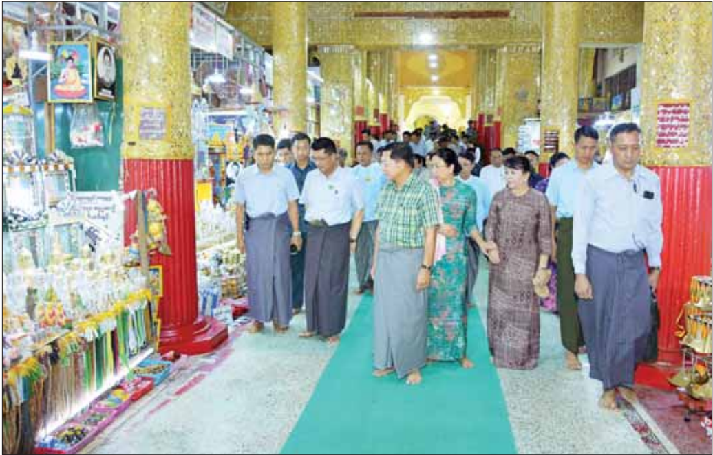
နိုင်ငံတော်စီမံအုပ်ချုပ်ရေးကောင်စီဥက္ကဋ္ဌ နိုင်ငံတော်ဝန်ကြီးချုပ် ဗိုလ်ချုပ်မှူးကြီး မင်းအောင်လှိုင် ရွှေမုဒ္ဒာ မဟာစေတီတော်မြတ်ကြီး အာရုံခံတန်ဆောင်းအတွင်းရှိ သာသနာရေးဆိုင်ရာပစ္စည်းများနှင့် ရိုးရာလက်မှုပစ္စည်းအရောင်းဆိုင်များကို လှည့်လည်ကြည့်ရှုအားပေးစဉ်။

ထို့နောက် နိုင်ငံတော်စီမံအုပ်ချုပ်ရေးကောင်စီ ဥက္ကဋ္ဌ နိုင်ငံတော်ဝန်ကြီးချုပ်နှင့် နီး၊ အဖွဲ့ဝင်များသည် ပုသိမ်မြို့ ကျက်သရေဆောင် ရွှေမုဒ္ဒာ မဟာစေတီတော်မြတ်ကြီးသို့ သွားရောက်ဖူးမြော်ကြည့်ညှိကြရာ ဂေါပကအဖွဲ့ဝင်များက ကြိုဆိုနှုတ်ဆက်ကြသည်။ ယင်းနောက် နိုင်ငံတော်စီမံအုပ်ချုပ်ရေးကောင်စီဥက္ကဋ္ဌ နိုင်ငံတော်ဝန်ကြီးချုပ်နှင့် နီး၊ အဖွဲ့ဝင်များသည် စေတီတော်မြတ်ကြီးအား ဖူးမြော်ကြည့်ညှိကာ ပန်း၊ ရေချမ်း၊ ဆီမီးများ ကပ်လှူပူဇော်သည်။