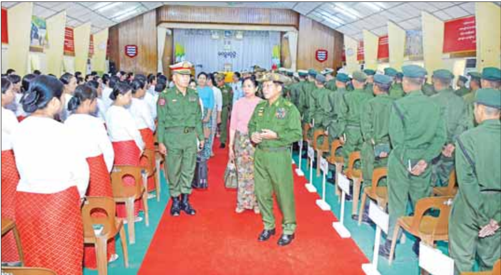
နိုင်ငံတော်စီမံအုပ်ချုပ်ရေးကောင်စီဥက္ကဋ္ဌ တပ်မတော်ကာကွယ်ရေးဦးစီးချုပ် ဗိုလ်ချုပ်မှူးကြီး မင်းအောင်လှိုင်နှင့်အဖွဲ့ဝင်များ အရာရှိ၊ စစ်သည်၊ မိသားစုများအား ရင်းရင်းနှီးနှီး လိုက်လံနှုတ်ဆက်စဉ်။

တပ်မတော်ပိုင်းဆိုင်ရာများနှင့် ပတ်သက်၍ တပ်မတော်၏ အဓိကတာဝန်သည် နိုင်ငံတော်၏ အချုပ်အခြာအာဏာကို ထိပါးလာသည့် အန္တရာယ်များကို ကာကွယ်စောင့်ရှောက်ရန်နှင့် နိုင်ငံနှင့် နိုင်ငံသားတို့၏ အကျိုးအမြတ်များကို ကာကွယ်စောင့်ရှောက်ရန်ဖြစ်ကြောင်း၊ နိုင်ငံတော်၏ တပ်မတော် တိုင်းသည် ပြည်ပအန္တရာယ်၊ ရန်စွယ်များကို ကာကွယ်ရန်ဖြစ်ပြီး ရဲတပ်ဖွဲ့သည် ပြည်တွင်းလက်နက်ကိုင် အကြမ်းဖက်မှုများ၊ ပဋိပက္ခများကို ကိုင်တွယ်ဖြေရှင်းရသည်ဖြစ်သော်လည်း မိမိတို့နိုင်ငံ၏ သမိုင်းကြောင်း အခြေအနေများအရ တပ်မတော်မှ မြန်မာနိုင်ငံ ရဲတပ်ဖွဲ့ဝင်များနှင့်အတူ ပြည်တွင်းလက်နက်ကိုင် ပဋိပက္ခဖြေရှင်းရေးနှင့် ပြည်သူတို့၏ အသက်အိုးအိမ်