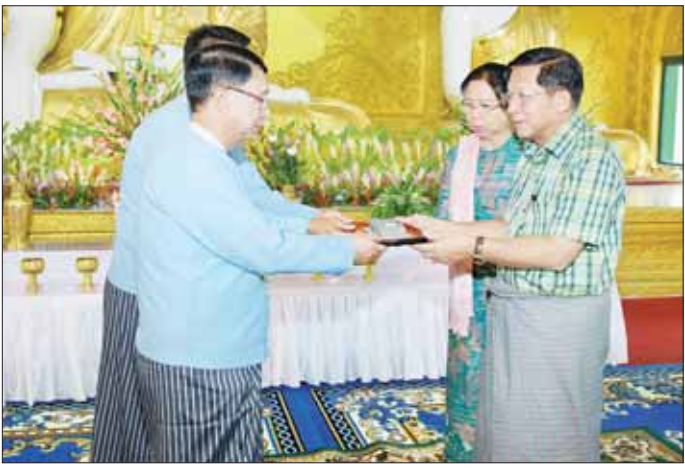
နိုင်ငံတော်စီမံအုပ်ချုပ်ရေးကောင်စီဥက္ကဋ္ဌ နိုင်ငံတော်ဝန်ကြီးချုပ် ဗိုလ်ချုပ်မှူးကြီး မင်းအောင်လှိုင်နှင့် ဇနီး ဒေါ်ကြာကြာလှတို့ စေတီတော်ကြီးအတွက် ဂေါပကအဖွဲ့ထံ အလှူငွေများ ပေးအပ်လှူဒါန်းစဉ်။

ပညာရေးကိုအားပေးမြှင့်တင်လျက်ရှိ ဆန်ဖူလုံမှုသည်လည်း မြင့်မားမှုရှိသည်ကို တွေ့ရှိ ရပြီး အရည်အသွေးကောင်းသည့် စပါးမျိုးများကို ပိုင်ဆိုင်ထားကြောင်း၊ ပညာရေးနှင့်ပတ်သက်၍ လည်း ဧရာဝတီတိုင်းဒေသကြီးသည် ကျောင်းတက် ရောက်သူဦးရေ အများဆုံး၊ ကျောင်းနေထိုင်မှုနှင့် အောင်ချက်ရာခိုင်နှုန်း အမြင့်ဆုံးဖြစ်သည်ကို တွေ့ရှိ ရပြီး ဂုဏ်ယူဖွယ်ရာပင်ဖြစ်ကြောင်း၊ မိမိတို့အနေဖြင့် ပညာရေးကို အားပေးမြှင့်တင်လျက်ရှိပြီး စိုက်ပျိုး မွေးမြူရေးနှင့် စက်မှုနည်းပညာ အထက်တန်း ကျောင်းများကို ခရိုင် ၅၀ ဌာန ဖွင့်လှစ်ထားရှိပြီး ဆက်လက်တိုးချဲ့ဖွင့်လှစ်သွားမည်ဖြစ်ကြောင်း၊ မိမိ အနေဖြင့်လည်း ဧရာဝတီတိုင်းဒေသကြီး၏ဆောင်ရွက် ချက်များအားလုံးကို အသိအမှတ်ပြုအားပေးပါ ကြောင်းနှင့် တက်ရောက်လာကြသည့် မြို့၊ မြို့၊ မြို့ များအနေဖြင့်လည်း မိမိတို့ တိုင်းဒေသကြီး ဖွံ့ဖြိုး တိုးတက်ရေးအတွက် လိုအပ်ချက်များကို ရင်းနှီး ပွင့်လင်းစွာ အမြင်ချင်းဖလှယ် ဆွေးနွေးပြောကြား ကြစေလိုကြောင်း ဆွေးနွေးပြောကြားသည်။