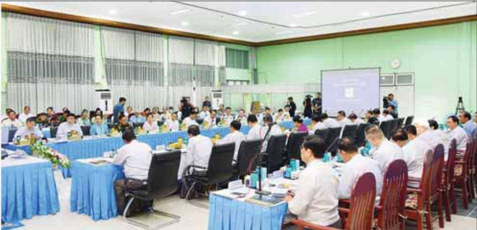
နိုင်ငံတော်စီမံအုပ်ချုပ်ရေးကောင်စီ ဒုတိယဥက္ကဋ္ဌ ဒုတိယဝန်ကြီးချုပ် ဒုတိယဗိုလ်ချုပ်မှူးကြီး စိုးဝင်း (၂၄) ကြိမ်မြောက် မြန်မာ့ရိုးရာယဉ်ကျေးမှု အဆို၊ အက၊ အရေး၊ အတီး ပြိုင်ပွဲကျင်းပရေး ဦးစီးကော်မတီ လုပ်ငန်းညှိနှိုင်းအစည်းအဝေးတွင် အမှာစကားပြောကြားစဉ်။