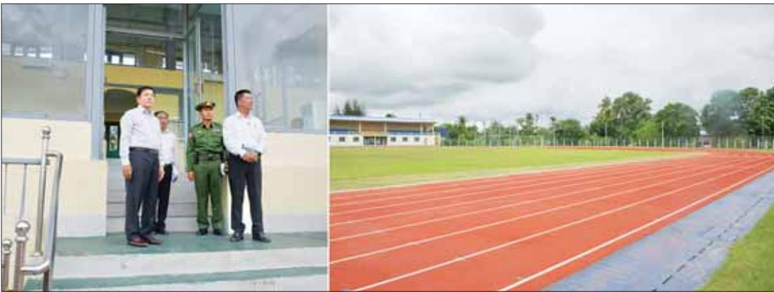
နိုင်ငံတော်စီမံအုပ်ချုပ်ရေးကောင်စီဥက္ကဋ္ဌ နိုင်ငံတော်ဝန်ကြီးချုပ် ဗိုလ်ချုပ်မှူးကြီး မင်းအောင်လှိုင် ပုသိမ်မြို့ ကိုးသိန်းအားကစားပြိုင်ကွင်းအား ကြည့်ရှုစစ်ဆေးစဉ်။

နေပြည်တော် ဩဂုတ် ၁၁ နိုင်ငံတော်စီမံအုပ်ချုပ်ရေးကောင်စီဥက္ကဋ္ဌ နိုင်ငံတော်ဝန်ကြီးချုပ် ဗိုလ်ချုပ်မှူးကြီး မင်းအောင်လှိုင်သည် ယနေ့မွန်းလွဲပိုင်းတွင် ကောင်စီတွဲဖက်အတွင်းရေးမှူး ဒုတိယဗိုလ်ချုပ်ကြီး ရဲဝင်းဦး၊ ပြည်ထောင်စုဝန်ကြီးများ၊ ညှိနှိုင်းကွပ်ကဲရေးမှူးကြီး ဦးကျော်စွာ၊ နှင့် အဆင့်မြင့်တပ်မတော် အရာရှိကြီးများ၊ ရောဂါတိုင်းဒေသကြီးဝန်ကြီးချုပ် ဦးတင်မောင်ဝင်း၊ အနောက်တောင်တိုင်းစစ်ဌာနချုပ် တိုင်းမှူးနှင့် တာဝန်ရှိသူများလိုက်ပါ၍ ရောဂါတိုင်းဒေသကြီးအတွင်း အားကစားကဏ္ဍ မြှင့်တင်ရေး ဆောင်ရွက်နေမှုများနှင့် ပုသိမ်မြို့ ရေပေးဝေရေးလုပ်ငန်းသို့ သွားရောက်ကြည့်ရှုစစ်ဆေးသည်။