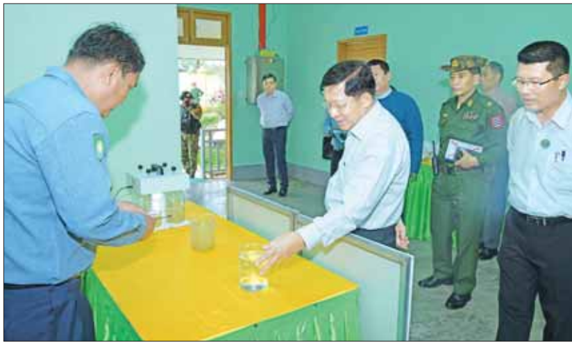
နိုင်ငံတော်စီမံအုပ်ချုပ်ရေးကောင်စီဥက္ကဋ္ဌ နိုင်ငံတော်ဝန်ကြီးချုပ် ဗိုလ်ချုပ်မှူးကြီး မင်းအောင်လှိုင် ပုသိမ်မြို့ ရေပေးဝေရေးလုပ်ငန်း တွင် ရေအရည်အသွေးဓာတ်ခွဲစစ်ဆေးမှုများကို ကြည့်ရှုစဉ်။