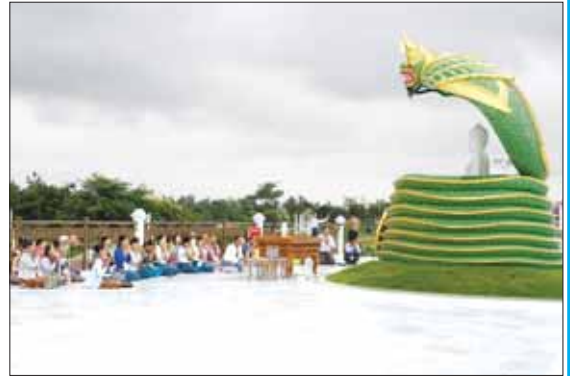
ဓာတ်ပုံ-သတင်းစဉ်