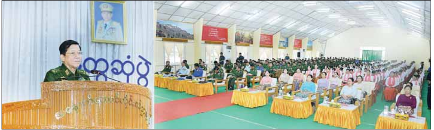
နိုင်ငံတော်စီမံအုပ်ချုပ်ရေးကောင်စီဥက္ကဋ္ဌ တပ်မတော်ကာကွယ်ရေးဦးစီးချုပ် ဗိုလ်ချုပ်မှူးကြီး မင်းအောင်လှိုင် အနောက်တောင်တိုင်းစစ်ဌာနချုပ် ပုသိမ်တပ်နယ်မှ အရာရှိ၊ စစ်သည်၊ မိသားစုများအား တွေ့ဆုံအမှာစကားပြောကြားစဉ်။