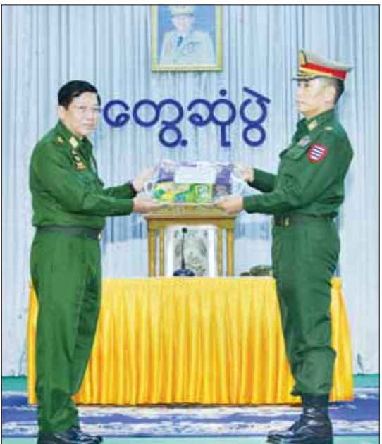
နိုင်ငံတော်စီမံအုပ်ချုပ်ရေးကောင်စီဥက္ကဋ္ဌ တပ်မတော်ကာကွယ်ရေးဦးစီးချုပ် ဗိုလ်ချုပ်မှူးကြီး မင်းအောင်လှိုင် အရာရှိ၊ စစ်သည်၊ မိသားစုများအတွက် စားသောက်ဖွယ်ရာပစ္စည်းများ ပေးအပ်စဉ်။

ထိုသို့ တွေ့ဆုံအမှာစကား ပြောကြားရာတွင် ၂၀၂၀ ပြည့်နှစ်၊ ပါတီစုံဒီမိုကရေစီ ရွေးကောက်ပွဲတွင် မဲသမားများဖြစ်ပေါ်ခဲ့သည့် အခြေအနေများ၊ မဲသမားများကို တရားဥပဒေနှင့်အညီ ဖြေရှင်းဆောင်ရွက်ပေးခြင်းမရှိသည့်အပြင် နိုင်ငံတော်၏ အာဏာကို အတင်းအဓမ္မရယူရန်လုပ်ဆောင်လာခဲ့သောကြောင့် ဖြစ်ပေါ်လာသည့် အခြေအနေများအရ နိုင်ငံတော်ကို နိုင်ငံရေးအရအရေးပေါ်အခြေအနေ ကြေညာခဲ့ပြီး တပ်မတော်မှ နိုင်ငံ့တာဝန်များကို ထမ်းဆောင်ခဲ့ရသည့်အခြေအနေများ၊ နိုင်ငံတော်စီမံ