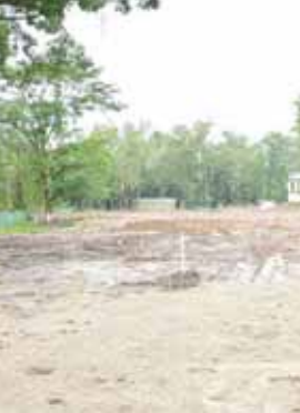
နိုင်ငံတော်စီမံအုပ်ချုပ်ရေးကောင်စီဥက္ကဋ္ဌ နိုင်ငံတော်ဝန်ကြီးချုပ် ဗိုလ်ချုပ်မှူးကြီး မင်းအောင်လှိုင် ပုသိမ်မြို့ မိုးလုံလေလုံအဆင့်မြင့်ရေကူးကန် တည်ဆောက်နေမှုအခြေအနေများ ကြည့်ရှုစစ်ဆေးစဉ်။