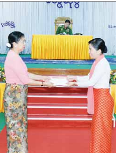
နိုင်ငံတော်စီမံအုပ်ချုပ်ရေးကောင်စီဥက္ကဋ္ဌ တပ်မတော်ကာကွယ်ရေးဦးစီးချုပ် ဗိုလ်ချုပ်မှူးကြီး မင်းအောင်လှိုင်၏ဇနီး ဒေါ်ကြူကြူလှ တပ်နယ်မိခင်နှင့် ကလေး စောင့်ရှောက်ရေးအသင်းအတွက် ချီးမြှင့်ငွေများပေးအပ်စဉ်။

အုပ်ချုပ်ရေးကောင်စီအစိုးရအနေဖြင့် တာဝန်ထမ်းဆောင်ခဲ့သည့်ကာလအတွင်း နိုင်ငံတော်ကို ဘက်ပေါင်းစုံမှ ဖွံ့ဖြိုးတိုးတက်ရေးဆောင်ရွက်လျက်ရှိသော်လည်း အကြမ်းဖက်မှုဖြစ်စဉ်များ ရှိနေဆဲ