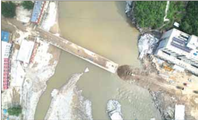
ဟူပေပြည်နယ်အတွင်း ပျက်စီးနေသည့်တံတားတစ်စင်းကို ပြင်ဆင်နေသည့်ကို တွေ့ရစဉ်။

ရိုကျားကျွမ် ဩဂုတ် ၁၁ တရုတ်နိုင်ငံမြောက်ပိုင်း ဟူပေပြည်နယ်တွင် မိုးသည်းထန်စွာ ရွာသွန်းမှုကြောင့် ဖြစ်ပေါ်လာရသည့် သဘာဝဘေးများကြောင့် ဩဂုတ် ၁၀ ရက်အထိ ၂၉ ဦး သေဆုံးခဲ့ပြီး ၁၆ ဦး ပျောက်ဆုံးနေဆဲဖြစ်သည်ဟု ဒေသခံ အာဏာပိုင်များက ဩဂုတ် ၁၁ ရက်တွင် ပြောသည်။