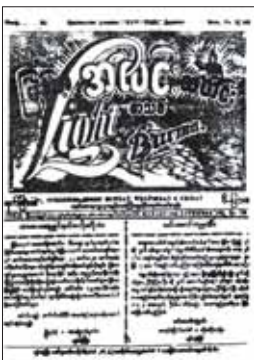
မြန်မာ့အလင်းမဂ္ဂဇင်းနှင့် ၂၉-၁၂-၁၉၁၉ ခုနှစ်ထုတ် မြန်မာ့အလင်းသတင်းစာသစ်