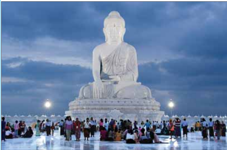
မာရဝိဇယဗုဒ္ဓရုပ်ပွားတော်မြတ်ကြီးအား ညပိုင်းတွင် လာရောက်ဖူးမြော်ကြသည့် အနယ်နယ်အရပ်ရပ်မှ ဘုရားဖူးပြည်သူများဖြင့် စည်ကားနေသည်ကို တွေ့ရစဉ်။