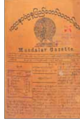
မြန်မာ့သမိုင်းခေတ်ဦးသတင်းစာများဖြစ်သည့် မော်လမြိုင်ခရော်နီကယ်၊ ဓမ္မသီတင်းစာနှင့် ရတနာပုံနေပြည်တော်သတင်းစာ။

“သတင်းစာတွင် ဖော်ပြပါရှိသည့် ပြည်သူ့အရေးအခင်းတို့သည် ယနေ့အတိုင်း “သတင်း” ဖြစ်သော်လည်း နောက်နေ့တွင် “သမိုင်း”အဖြစ်သို့ ရောက်ရှိသွားကြလေသည်။ ထို့ကြောင့် သတင်းစာများသည် သမိုင်းကို မှတ်တမ်းတင်နေကြသည်ဟု ဆိုရိုးရှိလေသည်။ ဤစကားသည် မှန်၏။ သို့သော် မပြည့်စုံသေးချေ။ သတင်းစာ၏ အခန်းကဏ္ဍကို တဝက်တပျက်မျှသာ ထပ်ဟပ်ခြင်းဖြစ်ပေသည်။ အကြောင်းသော်ကား သတင်းစာများသည် သမိုင်းကို မှတ်တမ်းတင်နေကြသည်သာမဟုတ်ဘဲ အနာဂတ်သမိုင်းကိုပါ ဖန်တီးနေကြ၍ ဖြစ်သည်။ ဤနေရာတွင် သတင်းစာဟုဆိုရာ၌ စာနယ်ဇင်းတရပ်လုံးကို ဆိုလိုခြင်းဖြစ်ပါသည်”ဟု သတင်းစာဆရာကြီး ဇေနက စာနယ်ဇင်းနှင့် နိုင်ငံရေး စာတန်းတွင် ရေးသားဖော်ပြခဲ့သည်။