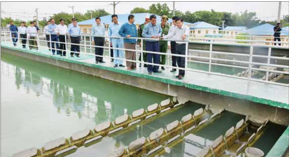
နိုင်ငံတော်စီမံအုပ်ချုပ်ရေးကောင်စီဥက္ကဋ္ဌ နိုင်ငံတော်ဝန်ကြီးချုပ် ဗိုလ်ချုပ်မှူးကြီး မင်းအောင်လှိုင်နှင့် အဖွဲ့ဝင်များ ပုသိမ်မြို့ ရေပေးဝေရေးလုပ်ငန်းရှိ ရေသန့်စင်စက်ရုံ၌ ရေများအဆင့်ဆင့် သန့်စင်ခြင်းလုပ်ငန်းများဆောင်ရွက်နေမှုကို ကြည့်ရှုစစ်ဆေးစဉ်။

ထို့နောက် နိုင်ငံတော်စီမံအုပ်ချုပ်ရေး ကောင်စီဥက္ကဋ္ဌ နိုင်ငံတော်ဝန်ကြီးချုပ်နှင့် အဖွဲ့ဝင်များသည် ပုသိမ်မြို့ ရေပေးဝေရေး လုပ်ငန်းသို့ရောက်ရှိကြရာ တိုင်းဒေသကြီး စည်ပင်သာယာရေးအဖွဲ့ ညွှန်ကြားရေးမှူး ဦးဘုန်းလွင်က ပုသိမ်မြို့ ရေပေးဝေရေး လုပ်ငန်းဆိုင်ရာ အချက်အလက်များ၊ ရေဖိတာများတပ်ဆင်ထားရှိမှုနှင့် ရေပေး