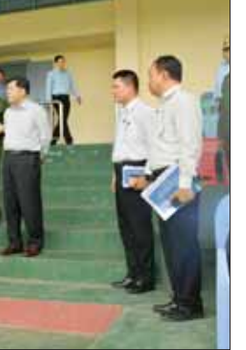
နိုင်ငံတော်စီမံအုပ်ချုပ်ရေးကောင်စီဥက္ကဋ္ဌ နိုင်ငံတော်ဝန်ကြီးချုပ် ဗိုလ်ချုပ်မှူးကြီး မင်းအောင်လှိုင် ပုသိမ်မြို့ ကျောက်တိုင်းအားကစားကွင်းအား ကြည့်ရှုစစ်ဆေးစဉ်။

“အားကစားကဏ္ဍ မြှင့်တင်ဆောင်ရွက်ခြင်းသည် မိမိတို့နိုင်ငံနှင့် လူမျိုး၏ ဂုဏ်ကို မြှင့်တင်ပေးခြင်းပင် ဖြစ်ပြီး တိုင်းချစ် ပြည်ချစ်စိတ်များနှင့် အမျိုးသားရေး စိတ်ဓာတ်များကိုလည်း နိုးကြားတက်ကြွလာစေမည်ဖြစ်”