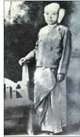
မြန်မာ့အလင်းသတင်းစာကို စတင်တည်ထောင်သူ ဦးရွှေကြူး

၁၉၁၅ ခုနှစ်တွင် “မတ်လ ၁၅ ရက်နေ့ ကို သတိပြုပါ” ဟူသော မြန်မာ့အလင်း သတင်းစာကြော်ငြာကြောင့် အစိုးရက အထင်လုံကာ ပိုင်ရှင် ဦးရွှေကြူးနှင့် ၎င်း၏ ညီကို အကျယ်ချုပ်ဖြင့် ဖမ်းခဲ့