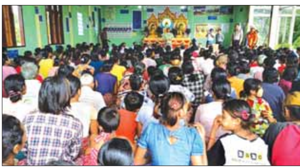
နှင့်အဖွဲ့ဝင်များက ရေဘေးသင့်အိမ်ထောင်စု ခေါက်ဆွဲခြောက်များကို ရေဘေးသင့်ပြည်သူများအား ထောက်ပံ့ပေးအပ်ခဲ့ကြောင်း သိရသည်။

မင်းပြား၊ ဩဂုတ် ၁၀ ရခိုင်ပြည်နယ် မင်းပြားမြို့နယ်၌ လေးမြို့မြစ် ရေကြီးမှုကြောင့် နေအိမ်များရေနှစ်မြုပ်မှုကြောင့် ဘေးလွတ်ရာ ဘုန်းတော်ကြီးကျောင်း ဓမ္မာရုံများ၌ ခေတ္တခိုလှုံခဲ့ရသည့် ရေဘေးသင့်ပြည်သူများအား ပြည်နယ်သဘာဝဘေးအန္တရာယ်ဆိုင်ရာစီမံခန့်ခွဲမှုအဖွဲ့က စားသောက်ဖွယ်ရာများပေးအပ်ပွဲကို ဩဂုတ် ၉ ရက် မွန်းလွဲပိုင်းက ဓမ္မမေတလင်ဘုန်းတော်ကြီးကျောင်းဓမ္မာရုံ၌ ကျင်းပသည်။(ယာပုံ)