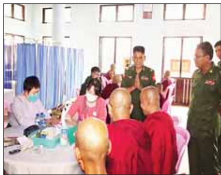
ယင်းသို့ဆောင်ရွက်နေမှုများကို တိုင်းစစ်ဌာနချုပ်မှ တာဝန်ရှိသူများက လိုက်လံကြည့်ရှုအားပေးပြီး လိုအပ်သည်များ ပေါင်းစပ်ညှိနှိုင်းဆောင်ရွက်ပေးခဲ့ကြောင်း သတင်းရရှိသည်။ သတင်းစဉ်

အလားတူ ရှမ်းပြည်နယ်(မြောက်ပိုင်း) လားရှိုးမြို့ ရပ်ကွက်(၄)ရှိ မဟာဗောဓာရုံ ပရိယတ္တိစာသင်တိုက်၊ တန့်ယန်းမြို့ရှိ ဓမ္မဂုဏ်ရည်ကျောင်းတိုက်နှင့် ကွမ်းလုံမြို့ရှိ ကွန်မြင်ရွာဦးဘုန်းတော်ကြီးကျောင်း အစရှိသော မြို့နယ် သုံးမြို့နယ်တို့မှ ဆရာတော်၊ သံဃာတော်များ၊ သာသနာ့နွယ်ဝင်သီလရှင်များနှင့် ဒေသခံပြည်သူများအား အရှေ့မြောက်တိုင်းစစ်ဌာနချုပ် နယ်လှည့်ဆေးကုသရေးအဖွဲ့ များက ပြည်သူ့ဆေးရုံမှ ကျန်းမာရေးစစ်ဆေးမှုများနှင့်အတူ ယနေ့နံနက်ပိုင်းတွင် အဆိုပါ ကျောင်းတိုက်များ၌ ကျန်းမာရေးစောင့်ရှောက်မှုလုပ်ငန်းများ ဆောင်ရွက်ပေးသည်။ ထိုသို့ဆောင်ရွက်ပေးလျက်ရှိရာ ဆရာတော်၊ သံဃာတော် ၁၀၆ ပါး၊ သာသနာ့နွယ်ဝင်သီလရှင် ၄၂၅ ဦးနှင့် ဒေသခံပြည်သူ ၄၉၂ ဦးတို့အား မျက်စိရောဂါ၊ သွားနှင့်ခံတွင်းရောဂါ၊ ခွဲစိတ်ကုသမှုဆိုင်ရာရောဂါ၊ နား၊ နှာခေါင်း၊ လည်ချောင်းရောဂါ၊ ဖျားနာရောဂါ၊ အထွေထွေရောဂါတို့နှင့် ပတ်သက်၍ လိုအပ်သည့်ကျန်းမာရေး စစ်ဆေးကုသပေးခြင်းများ ဆောင်ရွက်ပေးပြီး ECG စက်၊ အာထရာဆောင်းစက်တို့ဖြင့် ရောဂါရှာဖွေစစ်ဆေးကုသပေးခြင်းများ ဆောင်ရွက်ပေးသည်။