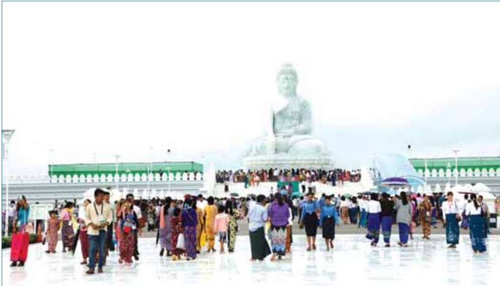
မာရဝိဇယဗုဒ္ဓရုပ်ပွားတော်မြတ်ကြီး ဖူးမြော်ရန် အနယ်နယ်အရပ်ရပ်မှ လာရောက်ကြသည့်ပြည်သူများအား စည်ကားစွာ တွေ့ရစဉ်။ (၁၀-၈-၂၀၂၃)

အဆင်ပြေရင်ပြေသလို ကိုယ့်သူငယ်ချင်း မိတ်ဆွေအပေါင်းအသင်း၊ ဆွေမျိုးတွေကိုလည်း ဝေမျှပေးပါ။ ဆွေမျိုးတွေကို ချီးမြှောက်စောင့်ရှောက် ထောက်ပံ့တာကလည်း မင်္ဂလာတရားတော်နဲ့အညီ တရား အားထုတ်နေတယ်လို့ မှတ်ယူပါ။ သက်ရှိ မိဘနှစ်ပါးကိုလည်း စောင့်ရှောက်လှူဒါန်းရမှာ ဖြစ်ပါတယ်။ မိဘနှစ်ပါးကို လှူဒါန်းတာဟာ သက်ရှိတရားကို လှူဒါန်းတာနဲ့ တူပါတယ်။ မိဘ နှစ်ပါးလိုအပ်တာတွေကို စောင့်ရှောက်လှူဒါန်း နေတာကလည်း မင်္ဂလာသတ္တန်နည်းအရ တရား အားထုတ်နေတာပါ။ ဘုရားကျောင်းကန်တွေမှာ လှူသင့်တာလည်းလှူပါ။ လူ့ကျင့်ဝတ်တွေကိုလည်း တတ်နိုင်သမျှ ကျေပွန်အောင် ကြိုးစားပါ။ ဒါတွေ အားလုံးဟာ ဒါနတွေချည်းပါပဲ။ လှူတဲ့နေရာမှာ လည်း ကံ ကံရဲ့ အကျိုးကို ယုံကြည်စွာ လှူပါ။ အယုတ်အလတ်အမြတ်မရွေး ရှိရှိသေသေ လေးလေးစားစားနဲ့ လှူပါ။ အချိန်ကာလအလိုက် လိုအပ်တာကိုလှူပေးပါ။ အစစအရာရာအဆင်ပြေပါ စေဆိုတဲ့ စိတ်လေးထားပြီး ချီးမြှောက်လိုစိတ်နဲ့ လှူပါ။ သန့်ရှင်းစင်ကြယ်တဲ့ လှူဖွယ်ပစ္စည်းနဲ့ မိမိ သူတစ်ပါး ပတ်ဝန်းကျင်ကိုပါ မထိခိုက်ရအောင် ငါးပါးသီလလုံစွာ လှူပါ။ လှူတဲ့အခါမှာလည်း မလှူခင်နဲ့ လှူပြီးတဲ့အခါမှာပဲ စေတနာမယုတ်စေရ ဘဲ စေတနာသုံးတန် ပြည့်စွာ လှူဒါန်းရပါမယ်။ ကိုယ်ရလာတဲ့ အကျိုးအမြတ်တွေထဲက အယုတ် အလတ်အမြတ်မရွေး တတ်နိုင်သမျှ ပေးကမ်း၊ ဝေမျှ လှူဒါန်းရပါမယ်လို့လည်း ဆရာတော်ကြီးရဲ့ ဟောကြားမှုကို နာယူဖူးပါတယ်။