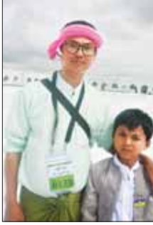
ကိုဇော်ရဲတင်