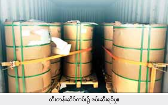
ထီးတန်းဆိပ်ကမ်း၌ ဖမ်းဆီးရမိမှု။

ထို့အတူ ဩဂုတ် ၈ ရက်တွင် အကောက်ခွန်ဦးစီးဌာန၏ စီမံခန့်ခွဲမှုဖြင့် တာဝန်ကျ အကောက်ခွန်အဖွဲ့များက စစ်ဆေးမှုများ ဆောင်ရွက်ခဲ့ရာ မြန်မာ တစ်မှတ်တံတံဆိပ်ကမ်း၌ ကုန်သွယ်မှုတစ်လုံး အတွင်းမှ သွင်းကုန်ကြေညာလွှာတွင် ကြေညာထားသည့် Bolt And Nut ၁၂၅ တန် အပါအဝင် ကုန်ပစ္စည်းနှစ်မျိုး (ခန့်မှန်း တန်ဖိုးငွေကျပ် ၂၅၂၀၀၀၀၀) နှင့် သွင်းကုန်လိုင်စင် လိုအပ်သော Perforated Metal Sheet ၂၀၂၆၅ ကီလိုဂရမ် (ခန့်မှန်းတန်ဖိုးငွေကျပ် ၁၄၀၄၆၄၅) ကိုလည်းကောင်း၊ ထီးတန်းဆိပ်ကမ်း၌ ကုန်သွယ်မှုတစ်လုံးအတွင်းမှ သွင်းကုန် လိုင်စင်တင်ပြနိုင်ခြင်းမရှိသည့် Color Coated Aluminium Coil ၂၂၀၁၃ ကီလိုဂရမ်အပါအဝင် ကုန်ပစ္စည်း ၁၀ မျိုး (ခန့်မှန်းတန်ဖိုးငွေကျပ် ၉၁၀၆၇၄၆)ကို လည်းကောင်း စုစုပေါင်း ခန့်မှန်းတန်ဖိုး ငွေကျပ် ၃၇၀၀၀၆၂၄၇ ကို ဖမ်းဆီးရမိခဲ့ပြီး အကောက်ခွန် လုပ်ထုံးလုပ်နည်းများနှင့် အညီ အရေးယူဆောင်ရွက်လျက်ရှိသည်။