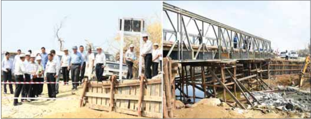
နိုင်ငံတော်စီမံအုပ်ချုပ်ရေးကောင်စီအဖွဲ့ဝင် ဒုတိယဝန်ကြီးချုပ်နှင့် ပြည်ထောင်စုဝန်ကြီး ဗိုလ်ချုပ်ကြီးတင်အောင်စန်းနှင့်အဖွဲ့ မိုခါမုန်တိုင်းဒဏ်ကြောင့် ပျက်စီးသွားသည့် စစ်တွေ - ပလ္လင်ပြင်လမ်းပေါ်ရှိ သဲချောင်းတံတားအား ကြည့်ရှုစစ်ဆေးစဉ်။

သို့သော် အချိန်မီမရောက်ရှိပါက လေဘေး ဒဏ်ခံ ပြည်သူများ ပို၍ဒုက္ခရောက်တော့မည်။ ထို့ကြောင့် ထောက်ပံ့ပေးရန်နှင့် တည်ဆောက်ရေး လုပ်ငန်းသုံးပစ္စည်းများကို ရသည့်ဈေးဖြင့် ဝယ်ယူ