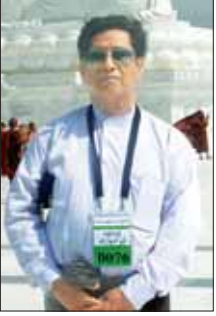
ဦးသန်းဆွေ