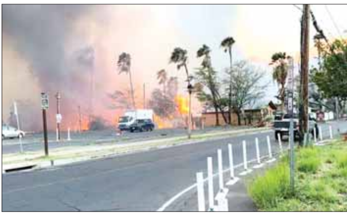
တောမီးများ ပျံ့နှံ့လောင်ကျွမ်းနေသည့်ကို ကြောက်မက်ဖွယ် တွေ့ရစဉ်။

ဟာပိုင်ယီ ဩဂုတ် ၁၀ ဟာပိုင်ယီပြည်နယ်ရှိ မော်အီကျွန်း တောမီးကြောင့် လူပေါင်း ၃၆ ဦး ထက်မနည်းသေဆုံးခဲ့ပြီး ၂၁၀၀ ကျော် ဘေးလွတ်ရာသို့ပြောင်းရွှေ့ ခဲ့ရသည်။ လေပြင်းများတိုက်ခတ် ဩဂုတ် ၈ ရက်တွင် ဟာပိုင်ယီ ပြည်နယ်ရှိ ကျွန်းအတော်များများ ၌ တောမီးလောင်မှုများ ဖြစ်ပွားခဲ့ သည်။ တစ်ဆက်တည်း ဖြစ်ပေါ် နေသည့် သွယ်တန်းနေသော ကျွန်းများ၏ တောင်ဘက်ကို ဖြတ်ကျော် တိုက်ခတ်လာသော ဟာရီကိန်း မုန်တိုင်းကြောင့် လေပြင်းများ တိုက်ခတ်ခဲ့ပြီး တောမီးများ လျင်မြန်စွာကူးစက် ပျံ့နှံ့လောင်ကျွမ်းခဲ့ကြောင်း သိရ သည်။ ဒေသခံပြည်သူ ၁၀၀၀၀ သည် ဩဂုတ် ၈ ရက်က မော်အီကျွန်းကို စွန့်ခွာခဲ့ကြောင်း ဒေသအာဏာပိုင် များက ပြောသည်။ ကျွန်းပေါ်၌ မီးတောက်များ