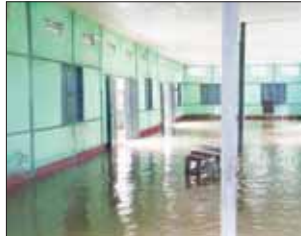
အမင်းရည်စော(ပြန်/ဆက်)

ညနေပိုင်းမှစတင်၍ အဆက်မပြတ် မိုးသည်းထန်စွာ ရွာသွန်းမှုကြောင့် ဖြိုကျပျက်စီးမှုများဖြစ်ပေါ်ခဲ့ကြောင်း သိရသည်။ အဆိုပါ ဖြစ်စဉ်ကြောင့် ကြက်သွန်ခင်း (၂) ရပ်ကွက်ရှိ တိုက်ကျောင်း ဘုန်းတော်ကြီးကျောင်းအုတ်တံတိုင်း ပေ ၆၀ ခန့် ပြိုကျသွားကြောင်း၊ တဲကြီးကုန်းကျေးရွာမှ စာသင်ကျောင်း (ဝဲပုံ) နှင့် ဘုန်းတော်ကြီးကျောင်းများ၌ ရေဝင်ရောက်နေသဖြင့် စာသင်ကျောင်းအား ယာယီပိတ်ထားကြောင်းနှင့် အနီးပင်ကျေးရွာအုပ်စု ဇီးဖြူခင်ကျေးရွာ (အောက်)