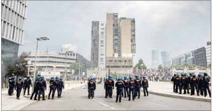
၂၀၂၃ခုနှစ် ဇွန်လက ပြင်သစ်နိုင်ငံ၌ ဖြစ်ပွားသည့်အဓိကရုဏ်းမြင်ကွင်း။

ယာဉ်ကြောတွေအင်မတန်ကျပ်နေချိန်မှာ သူ့ကိုယ်ကိုယ် ယာဉ်စည်းကမ်းလမ်းစည်းကမ်းဆိုတာ ဖောက်ဖျက်မိတတ်ကြပါတယ်။ ဒါပေမဲ့ လူငယ်တစ်ဦး ဥပဒေခံသောဆုံးသွားရတဲ့အထိ ဖြစ်ပျက်