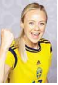
အီလီစတာ (ဗဟိုခံစစ်)

နယ်သာလန်က လက်ရှိချန်ပီယံ အမေရိကန်ကိုတောင် သရေ ပေါ်တူဂီကို အနိုင်ရရှိထားတာကြောင့် ခြေစွမ်းထက်မြက်မှုရှိတယ်။ အာဂျင်တီးနားကို သရေကျပြီး အသင်းကြီး အီတလီကို အနိုင်ရရှိ အောင် စွမ်းဆောင်ထားနိုင်တဲ့ တောင်အာဖရိကအသင်းခြေစွမ်းက လည်း မဆိုးဘူး။ ဒါပေမယ့် နယ်သာလန်က တောင်အာဖရိကထက် အဆုံးသတ်ပိုင်း သေချာမှုရှိတယ်။ ပြိုင်ဆိုင်မှုပြင်းထန်ပြီး နောက် တစ်ဆင့်ကို နယ်သာလန် တက်လှမ်းသွားဖွယ်ရှိတယ်။