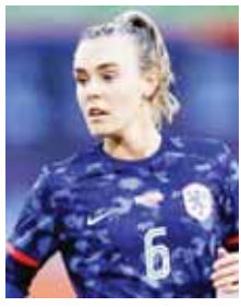
ဂျိုးလ်ရုဒ် (ကွင်းလယ်တိုက်စစ်)