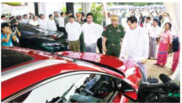
၆ ရက်အထိ နံနက် ၉ နာရီမှ ည ၇ နာရီအထိ ပြသ စားသောက်ရေးအတွက် တန်ဖိုးသင့်ထမ်းဆိုင်များ ရောင်းချမည်ဖြစ်ကြောင်းနှင့် ဆိုင်ခန်းရောင်းချ ဖွင့်လှစ်ရောင်းချပေးမည်ဖြစ်ကြောင်း သိရသည်။ မည်သူများနှင့် ဈေးလားရောက်ဝယ်ယူကြသူများ ဆန်းကျော်ဦး(ပြန်/ဆက်)

ထို့ပြင် မြန်မာနိုင်ငံ ဆန်စပါးအသင်းချုပ်နှင့် လက်လီရောင်းချသူများအသင်းက ဆန်ကိုလည်းကောင်း၊ မြန်မာနိုင်ငံဆီကုန်သည်နှင့် ဆီလုပ်ငန်းရှင်များအသင်းက စားသုံးဆီကိုလည်းကောင်း၊ ရန်ကုန် မြို့တော်စည်ပင်သာယာရေးကော်မတီမှ ဟင်းသီးဟင်းရွက်နှင့် အသီးအနှံများကို သက်သာသောနှုန်းထားဖြင့် ရောင်းချပေးသွားမည်ဖြစ်ကြောင်းနှင့် ဈေးလားရောက်ဝယ်ယူသူများအား Dancer အကများ၊ ရိုးပွဲများ၊ ဒီဂျေများဖြင့် ဖျော်ဖြေတင်ဆက်မည်ဖြစ်ပြီး အတွင်းပတ်လမ်းမှ ဖော်တော်ယာဉ်များဖြင့် ဝင်ရောက်ကြည့်ရှုနိုင်ရန် စီစဉ်ဆောင်ရွက်ထားရှိသည်။ အဆိုပါ ဈေးရောင်းပွဲတော်ကို ဩဂုတ် ၄ ရက်မှ