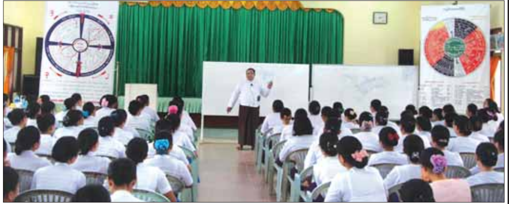
ဗဟိုလေ့ကျင့်ရေးကျောင်းမှ သင်တန်းများတွင် ကိုယ်ကျင့်တရားဘာသာရပ်ကို သင်ကြားပို့ချနေစဉ်။

ဗဟိုလေ့ကျင့်ရေးကျောင်းမှ ဖွင့်လှစ်သည့် သင်တန်းများတွင် စာရေးသူက ကိုယ်ကျင့်တရား ဘာသာရပ်ကို ၂၀၀၇ ခုနှစ်မှ ယနေ့အထိ “ကိုယ်ကျင့်တရားနှင့် တာဝန်ဝတ္တရား” ခေါင်းစဉ် ကျမ်းပုဒ်တစ်စောင် ရေးသားပြုစု၍ တာဝန်ရှိသူ အထက်ဌာနထံ တင်ပြခွင့်ပြုချက်ရယူပြီး သင်ကြားပို့ချလေ့ကျင့်ပေးနေပါသည်။ ကိုယ်ကျင့်တရား ဘာသာရပ်သည် ဝန်ထမ်းများအတွက်သာမက လူသားအားလုံးအတွက် လိုက်နာကျင့်ကြံရန် အလွန်အရေးကြီးပါသည်။ ကိုယ်ကျင့်တရား ဆိုသည်မှာ လူသားတိုင်း နေ့စဉ်ကြုံစဉ်၊ ပြောဆို၊ ပြုမူ လုပ်ကိုင်ဆောင်ရွက်ချက်များပင်ဖြစ်ပါသည်။ ထို့ကြောင့် ကိုယ်ကျင့်တရားများတွင် မှန်ခြင်း၊ မှားခြင်း၊ ကောင်းခြင်းဆိုးခြင်း၊ မြင့်မြတ်ခြင်း ယုတ်နိမ့်ခြင်း စသည့်တန်ဖိုးဖြတ်မှုများ ရှိလာပါသည်။