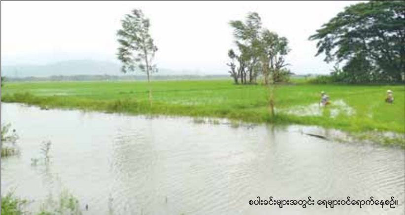
စပါးခင်းများအတွင်း ရေများဝင်ရောက်နေစဉ်။