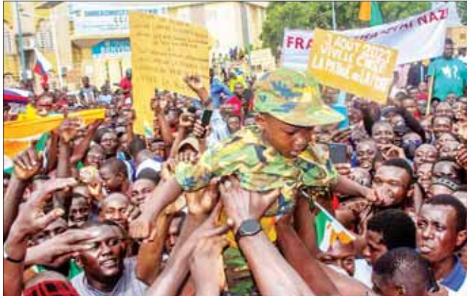
နိုင်ငံတကာအရေးယူပိတ်ဆို့မှုများကို ဆန့်ကျင်ဆန္ဒပြနေသည့် နိုင်ငံ့ပြည်သူများကို ဩဂုတ် ၃ ရက် တွင် မြို့တော် နီးယားမေ၌ တွေ့ရစဉ်။

လွန်ခဲ့သည့် သီတင်းပတ်က အာဏာသိမ်းမှု ဖြစ်ပွားပြီးနောက် နိုင်ငံ့နိုင်ငံအပေါ် ချမှတ်ထား သည့် ပိတ်ဆို့ရေးအမျိုးမျိုးကို ကန့်ကွက်သည့် အနေဖြင့် အမိမြေကာကွယ်ရေး အမျိုးသားကောင်စီ ထောက်ခံသူများသည် ယမန်နေ့က မြို့တော် နီးယားမေ၌ စုဝေးဆန္ဒပြခဲ့ကြသည်။ ဆန္ဒဖော်ထုတ် ပွဲတွင် “နိုင်ငံ့၊ ရုရှား၊ မာလီနှင့် ဘာကီနာဖာဆီ နိုင်ငံများ အခွန်ရည်ပါစေ” “ပြင်သစ်၊ အီကိုဝက်စ်နှင့်