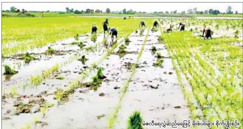
မဲလီရေလွှဲဆည်ရေဖြင့် မိုးစပါးများ စိုက်ပျိုးစဉ်။