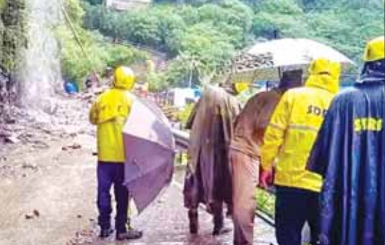
ပျောက်ဆုံးနေသူများအား ကူညီကယ်ဆယ်ရေးအဖွဲ့ များက ရှာဖွေရေးလုပ်ငန်းများ ဆောင်ရွက်စဉ်။

အက်ထရာခန် ပြည်နယ် မြို့တော် ဒေရာခွန်း၏ အရှေ့ မြောက်ဘက် ၂၄၅ ကီလိုမီတာ အကွာ ရွာရာပရာယင်ခရိုင်ရှိ ဂေါ်ရီ ခွန်းအနီးတွင် ယမန်နေ့ညက ဈေးဆိုင်အများအပြား ရေနောက် မျောပါသွားခဲ့ကြောင်း တာဝန် ရှိသူများက ပြောကြားသည်။