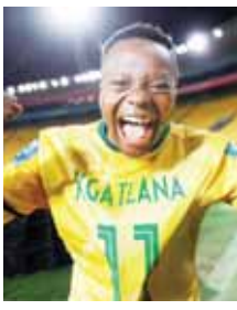
ဂတ်လာနာ (တိုက်စစ်)