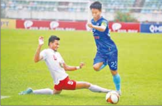
ရတနာပုံအသင်းနှင့် ရခိုင်ယူနိုက်တက်အသင်း ယှဉ်ပြိုင်စဉ်။