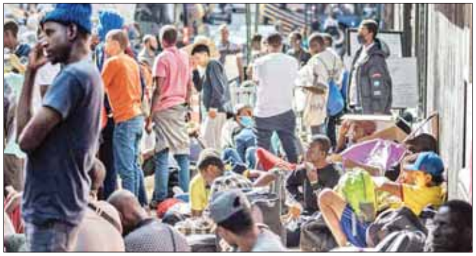
လမ်းဘေး၌ စောင့်ဆိုင်းနေသည့် ရွှေ့ပြောင်းနေထိုင်သူများကိုတွေ့ရစဉ်။

မူဝါဒကို ဆန့်ကျင်သည့်အနေ ဖြင့် ယင်းသို့လုပ်ဆောင်ကြခြင်း လည်းဖြစ်သည်။ ရွှေ့ပြောင်း နေထိုင်သူ ၁၀၀ ကျော်မှာ နယူး ယောက်မြို့ လမ်းဘေး၌ အိပ်စက် နေရသည်။ ၎င်းတို့အတွက် အခန်း အပို မရှိတော့ကြောင်း နယူး ယောက်မြို့မှ အရာရှိတစ်ဦးက ပြောသည်။