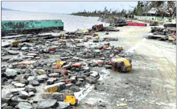
မိုခါမုန်တိုင်းဒဏ်ကြောင့် ထိခိုက်ပျက်စီးခဲ့ရသည့် စစ်တွေမြို့