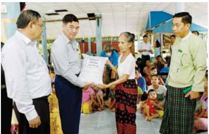
တိုးတက်ရေး စိုက်ပျိုးထုတ်လုပ်ခြင်း ကွင်းသရုပ်ပြပွဲသို့ တက်ရောက်ကြသည်။

ထို့နောက် ပြည်နယ်ဝန်ကြီးချုပ်နှင့် အဖွဲ့သည် ကျွန်းလီမြို့ ရှောက်ကုန်းကျေးရွာ၌ အကျိုးဆောင်တောင်သူများဖြင့် မြို့နယ်စိုက်ပျိုးရေးဦးစီးဌာနက ဆင်းသွယ်လတ်စပါး ၁၅ ဧက မျိုးစေ့ထုတ် စံပြစိုက်ခင်းထွန်ယက်စိုက်ပျိုးနေမှုအား သွားရောက်ကြည့်ရှုအားပေးကြပြီး တောင်သူများ၏ တင်ပြချက်များကို တာဝန်ရှိသူများနှင့် ပေါင်းစပ်ညှိနှိုင်းပေးကာ ကောက်စိုက်လုံမေးများနှင့် တောင်သူများအား စားသောက်ဖွယ်ရာများ ထောက်ပံ့ပေးအပ်ကြသည်။ ယင်းနောက် ပြည်နယ်ဝန်ကြီးချုပ်နှင့် အဖွဲ့သည် ပြည်နယ် ရဟိုင်းကွင်းကျေးရွာ၌ စိုက်ပျိုးရေးဦးစီးဌာနက ဘက်စုံအဆင့်မြင့်နည်းပညာသုံး စံပြကျေးရွာဖော်ဆောင်ခြင်း၊ မိုးစပါးမျိုးစေ့ထုတ်နှင့် အထွက်နှုန်း