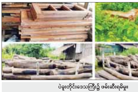
ပဲခူးတိုင်းဒေသကြီး၌ ဖမ်းဆီးရမိမှု။

ထို့အတူ ဩဂုတ် ၁ ရက်တွင် ကရင်ပြည် နယ် တရားမဝင် ကုန်သွယ်မှုတိုက်ဖျက်ရေး