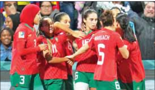
ကိုလံဘီယာအသင်းဘက်သို့ ရိုးသွင်းယူပြီးနောက် မော်ရိုကိုအမျိုးသမီးအသင်းအောင်ပွဲခံစဉ်။