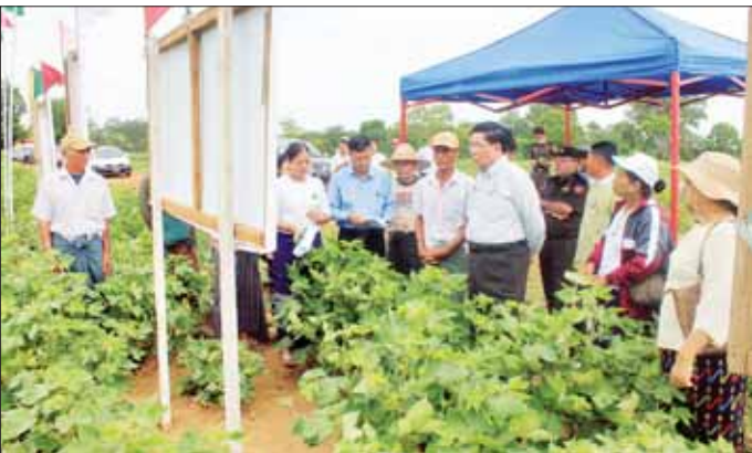
ထားသည့် တောင်သူ ဦးမြင့်ထွန်း၏ ရာကာ ၆၆၆ ချည်မျှင်ရှည်ဝါ စိုက်ခင်း သုံးဧက အောင်မြင်ဖြစ်ထွန်းနေမှုတို့ကို ကြည့်ရှုပြီး လက်ပံရှည် ဘုန်းတော်ကြီးကျောင်း၌ ဝါစိုက်တောင်သူများနှင့်

တောင်တွင်းကြီး ဩဂုတ် ၃ မကွေးတိုင်းဒေသကြီး ဝန်ကြီးချုပ် ဦးတင်လွင်သည် လူမှုရေးရာ ဝန်ကြီး ဦးသန့်ဇင်ကိုနှင့် တိုင်းဒေသကြီးအဆင့် ဌာနဆိုင်ရာ တာဝန်ရှိသူများနှင့်အတူ ယနေ့ နံနက်ပိုင်းက တောင်တွင်းကြီးမြို့နယ်အတွင်းရှိ ဒေသခံတောင်သူများနှင့် တွေ့ဆုံပြီး မြို့နယ်ပြည်သူ့ဆေးရုံ၌ ဆေးကုသမှုခံယူလျက်ရှိသည့် လူနာများအား ကြည့်ရှုအားပေးသည်။