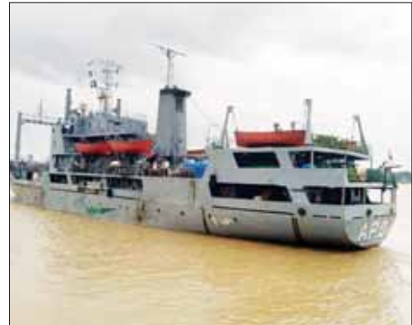
ပိုး ၅၀၀၊ ကလိုရင်းဒိုင်အောက်ဆိုဒ် ၄၀၀၊ စောင် ဖာ ၂၅၀၊ ကျန်းမာရေး ဝန်ကြီးဌာနမှ ဆေးပစ္စည်းမျိုးစုံ ၁၉၉၉ ဘူး၊ ခရီးဆောင်ဆိုလာ ဝန်ကြီးဌာနမှ ဆေးပစ္စည်းမျိုးစုံ ၄၀၀၊ စောင် ဖာ ၂၅၀၊ ကျန်းမာရေး ဝန်ကြီးဌာနမှ ဆေးပစ္စည်းမျိုးစုံ ၁၉၉၉ ဘူး၊ ခရီးဆောင်ဆိုလာ မီးအိမ် ၁၅၅ ဖာ၊ ခြင်ထောင် ဖာ ၃၄၀၊ အာဟာရရန်များ ၁၆၁၆ ဖာ၊

နေပြည်တော် ဩဂုတ် ၃ ဆိုင်ကလုန်းမုန်တိုင်း မိုခါ တိုက်ခတ်မှုကြောင့် ထိခိုက် ပျက်စီးဆုံးရှုံးမှုများ ဖြစ်ပေါ် ခဲ့သော ရခိုင်ပြည်နယ်အတွင်းရှိ မုန်တိုင်းဒဏ်သင့် ပြည်သူများ အား လိုအပ်သောပစ္စည်းများ ကူညီထောက်ပံ့မှုများဆောင်ရွက် ပေးနိုင်ရန် တပ်မတော် (ရေ)မှ စစ်ရေယာဉ် (မြစ်ကြီးနား)သည် လူမှုဝန်ထမ်း၊ ကယ်ဆယ်ရေး နှင့် ပြန်လည်နေရာချထားရေး ဝန်ကြီးဌာနမှ ဆန်အိတ် ၅၀၀၀၊ ရေစုပ်စက် ၂၀၀၊ မီးစက် ၃၉၉ လုံး၊ မိုးကာဘဲ ၂၀၀၊ ခေါက်ဆွဲခြောက် ၃၉၇၉ ဖာ၊ ဆေးပိုးသတ်ဆေးပြား