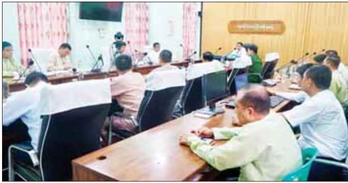
အဆင့်မြှင့်တင်ရေးများက ကဏ္ဍအလိုက် ရှင်းလင်းသော ရိုဘတ်စတာ ကော်ဖီ ၂၃၇ ဧကနှင့် ကိုကိုးသီးနဲ့ တင်ပြခဲ့ရာ တိုင်းဒေသကြီး ဝန်ကြီးချုပ်က လိုအပ်သည်များ ဖြည့်စွက်မှာကြားသည်။ ပဲခူးတိုင်းဒေသကြီးအတွင်း မိုးရာသီမကုန်မီ စိုက်ပျိုးသွားမည်ဖြစ်ကြောင်း တိုင်းဒေသကြီး(ပြန်/ဆက်)

ရိုဘတ်စတာကော်ဖီနှင့် ကိုကိုးသီးနဲ့ စိုက်ပျိုးနိုင်ရေး စီစဉ်ဆောင်ရွက်လျက်ရှိသဖြင့် လိုအပ်သည့် နည်းပညာနှင့် မျိုးကောင်းမျိုးသန့်ရရှိရေး အထူးအလေးထား ဆောင်ရွက်ပေးရန်လိုအပ်ကြောင်း၊ မွေးမြူရေးကဏ္ဍနှင့်ပတ်သက်၍ ဥစားသုံးမှု ဖူလုပ်ပိုလျှံမှုရှိစေရေး ဥစားကြက်နှင့် ဥစားဘဲ တိုးချဲ့မွေးမြူရန်လိုအပ်ပြီး စီးပွားဖြစ် ဆိတ်မွေးမြူရေးကို ဘက်ပေါင်းစုံမှ ဖြည့်ဆည်း ဆောင်ရွက်ပေးသွားမည်ဖြစ်ကြောင်း၊ မိသားစု ဝင်ငွေတိုးတက်ရန်အတွက် အိမ်တွင်းမှု MSMEs လုပ်ငန်းများ ဆောင်ရွက်နိုင်ရန် အသက်မွေးပညာသင်တန်းများ ကျယ်ကျယ်ပြန့်ပြန့် ဖွင့်လှစ်ဆောင်ရွက်ရန်နှင့် လိုအပ်သည်များ ပံ့ပိုးကူညီ ဆောင်ရွက်ပေးသွားမည်ဖြစ်ကြောင်း ပြောကြားသည်။ ထို့နောက် တက်ရောက်လာသည့် တိုင်းဒေသကြီး