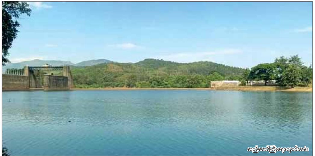
ဆည်တော်ကြီးရေလှောင်တမံ။

မန္တလေးတိုင်းဒေသကြီး မတ္တရာမြို့နယ်ရှိ ဆည်တော်ကြီးရေလှောင်တမံအတွင်း မြန်မာပြည် အထက်ပိုင်းတွင် မိုးများရွာသွန်း၍ ရေများဝင်ရောက်ခဲ့ကာ ဓာတ်အားပေးစက်ရုံများ ပုံမှန်လည်ပတ်လျက် ရှိပြီး စိုက်ပျိုးရေးများ ပေးဝေလျက်ရှိသည်။ ဩဂုတ် ၂ ရက် နံနက် ၆ နာရီတွင် ဆည်တော်ကြီး တမံ ကန်တွင်းရေအမှတ်မှာ ၃၉၆ ဒသမ ၃ ပေသို့ ရောက်ရှိနေသည်။ ကန်တွင်းရေအနက်မှာ ၉၈ ဒသမ ၃ ပေဖြစ်ပြီး ရေပမာဏမှာ ဧကပေ ၂၀၆၇၄၀ သို့လှောင်ထားသည်။ ကန်အတွင်းဝင်ရေမှာ ၅၃၀၇ ဧကပေရှိသည်။ ရေအားလျှပ်စစ်စက်ရုံ (၁) မှ ၅ ဒသမ ၁ မဂ္ဂါဝပ်၊ ရေအားလျှပ်စစ်စက်ရုံ (၂) မှ ၅ ဒသမ ၃ မဂ္ဂါဝပ်ကို ၂၄ နာရီလျှပ်စစ်ဓာတ်အား ထုတ်လုပ်ပေးလျက်ရှိပြီး စိုက်ပျိုးရေးအတွက် မန္တလေးတူးမြောင်းမှ ဆည်ရေ ၈ ဒသမ ၇ ပေနှင့် ရေနံသာတူးမြောင်းမှ ဆည်ရေခြောက်ပေခန့် မတ္တရာမြို့နယ်နှင့် ပုသိမ်ကြီး မြို့နယ်များသို့ စာမျက်နှာ ၅ ကော်လံ ၅