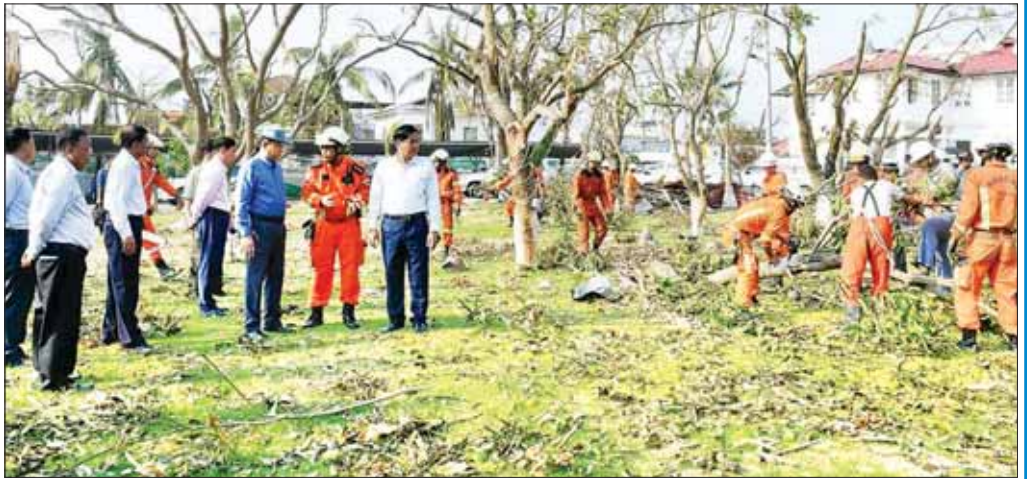
နိုင်ငံတော်စီမံအုပ်ချုပ်ရေးကောင်စီအဖွဲ့ဝင် ဒုတိယဝန်ကြီးချုပ်နှင့် ပြည်ထောင်စုဝန်ကြီး ဗိုလ်ချုပ်ကြီး တင်အောင်စန်းနှင့်အဖွဲ့ မုန်တိုင်းဒဏ်သင့်ဒေသများ ပြန်လည်ထူထောင်ရေးလုပ်ငန်းများ ဆောင်ရွက်နေမှုအခြေအနေအား ကြည့်ရှုစစ်ဆေးစဉ်။

ကမ္ဘာပနဒီခေါ် ကုလားတန်မြစ်သည် ရခိုင်တို့၏ ပင်မသွေးကြောလည်းဖြစ်၊ ရခိုင်ယဉ်ကျေးမှုတို့ ဖွံ့ဖြိုးစည်ပင်ဖြတ်သန်းရာ အရပ်ဌာနလည်းဖြစ်၏။ ထိုကုလားတန်မြစ်၏ မြစ်ဝပိုင်း မြစ်ရေစီးရာ လက်ယာဘက်ကမ်းတွင် စစ်တွေမြို့တည်ရှိသည်။ ပင်လယ်သမုဒ္ဒရာအနီး၌ မြို့တည်ခဲ့၍ ရှေးဟောင်းစာပေများတွင် သမုဒ္ဒဂီရိမြို့ (စစ်တွေ) ဟုလည်း