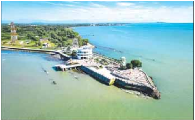
စစ်တွေမြို့၏ အလှ

မူလတန်းအရွယ်က သင်ယူခဲ့ရသော ယခုတိုင် မှတ်မိနေသေးသည့် ဖတ်စာအား သတိရမိပါသည်- ဇွန်ပန်းရံအနီး လှည်းဘီး နှံ့ထဲကျနေသည်။ ကျွဲတွန်းပေးကြပါ။ လေးလွန်း၍ မတွန်းနိုင်ဘူးလား။ ပြိုင်ဘက်တို့လျှင် ရွှေနိုင်ပါသည်။ ။