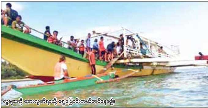
လူများကို ဘေးလွတ်ရာသို့ ရွှေ့ပြောင်းကယ်တင်နေစဉ်။

မန်လာ ဩဂုတ် ၃ ဖိလစ်ပိုင်နိုင်ငံ လူ့စွန့်ကျန်းခံ တောင်ဘက် ကွီစွန်ပြည်နယ်၌ ဩဂုတ် ၃ ရက် မွန်းလွဲပိုင်းက ခရီးသည်တင် ကူးတိုလှေတစ်စင်း တစ်ဝက်နှစ်မြုပ်မှုဖြစ်ပွားသဖြင့် လှေပေါ်ပါ လူ ၆၇ ဦးလုံးကို ကယ်ဆယ်နိုင်ခဲ့ကြောင်း ဖိလစ် ပိုင် ကမ်းခြေစောင့်တပ်ဖွဲ့ (ပီစီဂျီ) က ပြောကြားသည်။