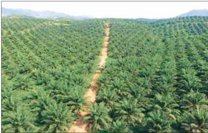
ကော့သောင်းမြို့နယ်အတွင်း စိုက်ပျိုးထားသည့် ဆီအုန်းပင်စိုက်ခင်းများ။

ဧရာဝတီတိုင်းဒေသကြီးသည် မြန်မာ့စပါးကို အဖြစ် ထင်ရှားသကဲ့သို့ ဆီအိုးကြီးအဖြစ် ပဲ၊ နှမ်း၊ ပြောင်း အထွက်များသော မကွေးတိုင်းဒေသကြီးကို တင်စားထားပါသည်။ ဤသို့ဆိုလျှင် ဆီအုန်းပင် များစွာဖြစ်ထွန်းပေါက်ရောက်နေသော တနင်္သာရီ တိုင်းဒေသကြီးသည် ဒုတိယဆီအိုးကြီးအဖြစ် မှတ်ကျောက်တင်နိုင်ရန် အလားအလာကောင်း များစွာရှိပါသည်။