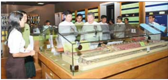
အဆိုပါပြခန်း၌ ပေစာထုပ်စုစုပေါင်း ၂၁၂၇ ထုပ်၊ ကမ္ဘာတို့ကို စုစုပေါင်း ၂၂ ထုပ်နှင့် ပုရပိုက် စုစုပေါင်း ၇၁ ထုပ်တို့ကို စနစ်တကျထိန်းသိမ်းကာ အများ ပြသပစ္စည်းမြှင့်ရန် ပြသမည်ဖြစ်ကြောင်း သိရသည်။ သတင်းစဉ်

ရှိ ပြသပစ္စည်း ရှေးဟောင်းပေ၊ ပုရပိုက်များအား မှန်အုပ်ဆောင်းအတွင်း လေအဝင်အထွက်ရရှိစေရန် စီမံထားရှိမှု၊ ကျန်ရှိပေစာ၊ ပုရပိုက်စာနှင့် ကမ္ဘာတို့ကို ပြခန်းရှိပိရီများ၌ စနစ်တကျထိန်းသိမ်းကာ ပြသ ထားရှိမှု၊ ပြသပစ္စည်းများ၏ရှင်းလင်းချက်စာသားများ ကို မြန်မာ-အင်္ဂလိပ်(၂)ဘာသာဖြင့် ဖတ်ရှုနိုင်သည့် အပြင် QR စနစ်များဖြင့် လေ့လာဖတ်ရှုနိုင်ရန်နှင့် E-Library အခန်းအတွင်း၌ အကြောင်းအရာ အပြည့် အစုံကိုလေ့လာဖတ်ရှုနိုင်ရန် စီစဉ်ဆောင်ရွက်ထားရှိမှု များကို လှည့်လည်ကြည့်ရှုကာ လိုအပ်သည်များကို ဖြည့်စွက်မှာကြားခဲ့သည်။