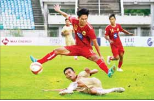
ရှမ်းယူနိုက်တက်နှင့် ဧရာဝတီအသင်း ယှဉ်ပြိုင်နေစဉ်။

နေပြည်တော် ဩဂုတ် ၃ ၂၀၂၃ ရာသီ MNL အမှတ်ပေးပြိုင်ပွဲ ပွဲစဉ် (၁၅) ပထမနေ့ကို ဩဂုတ် ၃ ရက်က ဆက်လက်ကျင်းပရာ လက်ရှိချန်ပီယံ ရှမ်းယူနိုက်တက်အသင်း ရိုးပြတ်အနိုင် ရပြီး မဟာယူနိုက်တက်နှင့် ဒဂုံစတား အသင်း ရိုးမရှိသရေကျခဲ့သည်။ သုဝဏ္ဏကွင်း၌ ကျင်းပသည့်ပွဲတွင် ရှမ်းယူနိုက်တက်အသင်းက ဧရာဝတီ အသင်းကို ငါးဂိုး - တစ်ဂိုးဖြင့် အနိုင် ရခဲ့သည်။ ဇယားထိပ်ဆုံးတွင် ရမှတ် အသာ ဖြင့် ဦးဆောင်နေသည့် လက်ရှိ ချန်ပီယံ ရှမ်းယူနိုက်တက်အသင်းသည် စာမျက်နှာ ၉ ကော်လံ ၁ *