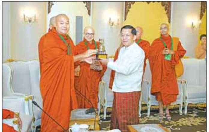
နိုင်ငံတော်စီမံအုပ်ချုပ်ရေးကောင်စီဥက္ကဋ္ဌ နိုင်ငံတော်ဝန်ကြီးချုပ် ဗိုလ်ချုပ်မှူးကြီး မင်းအောင်လှိုင်ထံ အိန္ဒိယနိုင်ငံမှ ဆရာတော်ကြီးများက ဓမ္မလက်ဆောင်များ ပေးအပ်စဉ်။