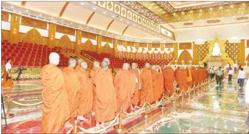
ပြည်ပနိုင်ငံများမှ ကြွရောက်လာကြသည့် ဆရာတော်ကြီးများ ဗုဒ္ဓဥယျာဉ်တော်အတွင်း သာသနိက အဆောက်အအုံများ တည်ဆောက်ထားရှိမှုကို ဖူးမြော်လေ့လာကြည့်ညိစဉ်။

အဆိုပါပြည်ပနိုင်ငံများမှကြွရောက်လာကြသည့် ဆရာတော်ကြီးများသည် ယနေ့ မွန်းလွဲပိုင်းတွင် မာရဝိဇယ ဗုဒ္ဓရုပ်ပွားတော်မြတ်ကြီး တည်ထား ကိုးကွယ်ထားရှိမှု၊ ဗုဒ္ဓဥယျာဉ်တော်အတွင်း သာသနိကအဆောက်အအုံများ တည်ဆောက်ထား ရှိမှု မုစလိန္ဒ နဂါးရုံဘုရားနှင့်ကျောက်စာရုံစေတီတော် များ တည်ထားကိုးကွယ်ထားရှိမှုတို့ကို သွားရောက် ဖူးမြော်လေ့လာကြည့်ညိကြရာ တာဝန်ရှိသူများက လိုက်လံရှင်းလင်းပြသခဲ့ကြောင်း သတင်းရရှိ သည်။ သတင်းစဉ်