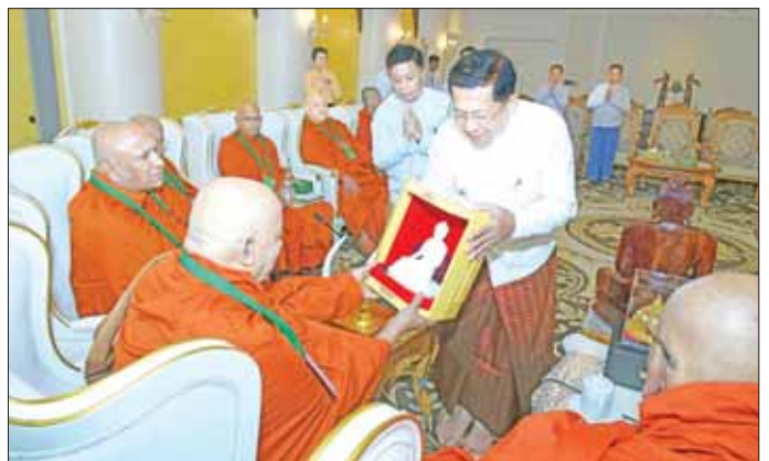
နိုင်ငံတော်စီမံအုပ်ချုပ်ရေးကောင်စီဥက္ကဋ္ဌ နိုင်ငံတော်ဝန်ကြီးချုပ် ဗိုလ်ချုပ်မှူးကြီး မင်းအောင်လှိုင် သီရိလင်္ကာနိုင်ငံမှ ဆရာတော်ကြီးများထံ မာရဝိဇယဗုဒ္ဓရုပ်ပွားတော်မြတ်ပုံစံတူ ကျောက်ဆစ်ဗုဒ္ဓရုပ်ပွား တော်မြတ်များ ဆက်ကပ်လှူဒါန်းစဉ်။

ဦးစွာ ဦးဆောင်ဘုရားဒါယကာ နိုင်ငံတော်စီမံ အုပ်ချုပ်ရေးကောင်စီဥက္ကဋ္ဌ နိုင်ငံတော်ဝန်ကြီးချုပ်၊ နိုင်ငံတော်စီမံအုပ်ချုပ်ရေးကောင်စီ ဒုတိယဥက္ကဋ္ဌ ဒုတိယဝန်ကြီးချုပ်နှင့် အဖွဲ့ဝင်များအား နိုင်ငံတော် ဩဝါဒစရိယ သောဋ္ဌသမ္မေ ကျောင်းသားသန့်ပိုင် ဆရာ တော်၊ သီတာဂုဏ္ဍာဗုဒ္ဓတက္ကသိုလ်များ၏အဓိပတိ အဘိဓမ္မမဟာရဋ္ဌဂုရု အဘိဓမ္မ အဂ္ဂမဟာသဒ္ဓမ္မ ဇောတိက ဒေါက်တာ ဘဒ္ဒန္တဉာဏိဿရနှင့် အပြည် ပြည်ဆိုင်ရာ ထေရဝါဒ ဗုဒ္ဓသာသနာပြု တက္ကသိုလ် ပါမောက္ခချုပ် အဂ္ဂမဟာသဒ္ဓမ္မဇောတိကဓမ္မ မဟာ ဂန္ဓဝါစကပဏ္ဍိတ အဂ္ဂမဟာပဏ္ဍိတ မဟာဓမ္မ ကထိက ဗဟုဇနဟိတဓရ ဘဒ္ဒန္တ ဆေကန္တတို့က နိုင်ငံအသီးသီးမှ ကြွရောက်လာကြသည့် ဆရာတော် ကြီးများနှင့် တစ်နိုင်ငံချင်း သီးခြားစီ တွေ့ဆုံ မိတ်ဆက်ပေးသည်။