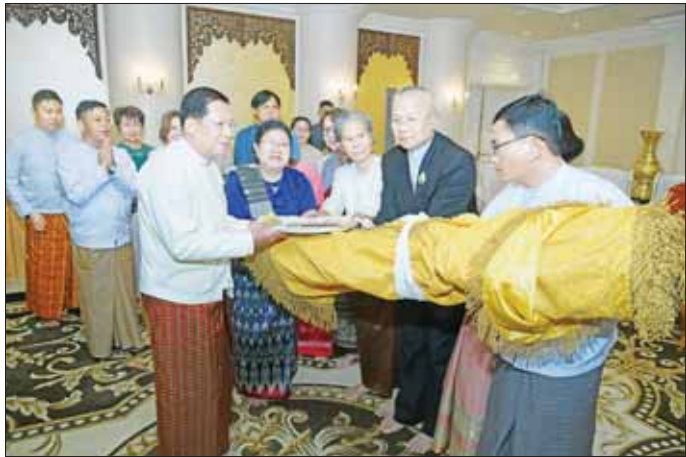
နိုင်ငံတော်စီမံအုပ်ချုပ်ရေးကောင်စီဥက္ကဋ္ဌ နိုင်ငံတော်ဝန်ကြီးချုပ် ဗိုလ်ချုပ်မှူးကြီး မင်းအောင်လှိုင်ထံ ထိုင်းနိုင်ငံမှ ဆရာတော်ကြီးများနှင့်အတူ လိုက်ပါလာသူများက အလှူငွေများနှင့် ဓမ္မလက်ဆောင်များ ပေးအပ်လှူဒါန်းစဉ်။