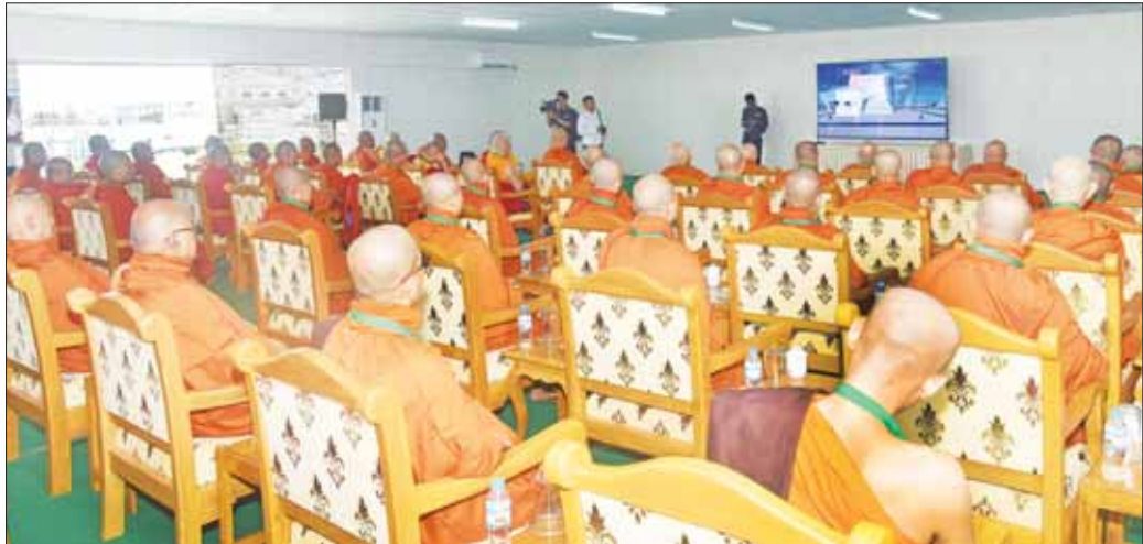
ပြည်ပနိုင်ငံများမှ ကြွရောက်လာကြသည့် ဆရာတော်ကြီးများအား မာရဝိဇယဘုရားကြီးနှင့် ဗုဒ္ဓဥယျာဉ်တော် တည်ထားကိုးကွယ်မှုအခြေအနေများနှင့် ပတ်သက်၍ တာဝန်ရှိသူများက ရှင်းလင်းလျှောက်ထားစဉ်။

လျှောက်ထားမှုများအပေါ် ကြွရောက်လာကြ သည့် ပြည်ပနိုင်ငံများမှ ဆရာတော်ကြီးများ ယခု ကဲ့သို့ မာရဝိဇယဗုဒ္ဓရုပ်ပွားတော်မြတ်ကြီး ဗုဒ္ဓါ ဘိသက အနေကဇာတင်လှူခြင်း၊ ကျောက်စာရုံ စေတီတော်များ ထီးတော်တင်လှူခြင်းနှင့် ရေစက်ချ ခြင်း စသည့် မဟာမင်္ဂလာအခမ်းအနားများသို့ ကြွရောက်ချီးမြှင့်နိုင်ရေး ဖိတ်ကြားခဲ့သည့်အတွက် များစွာဂုဏ်ယူဝမ်းမြောက်မိပါကြောင်း၊ ယခုကဲ့သို့