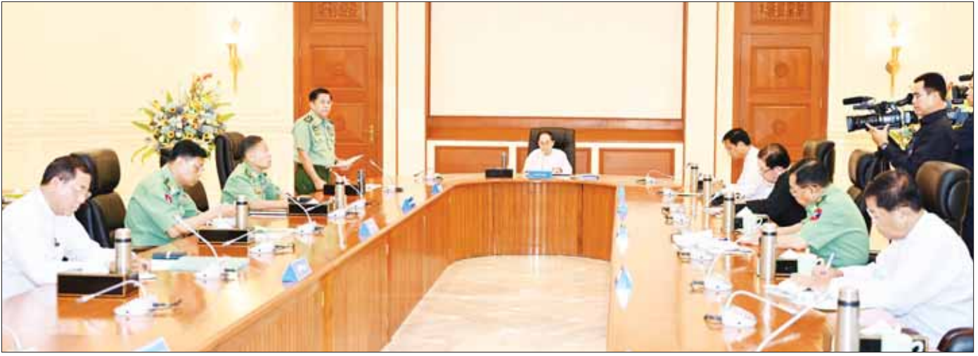
တပ်မတော်ကာကွယ်ရေးဦးစီးချုပ် ဗိုလ်ချုပ်မှူးကြီး မင်းအောင်လှိုင် ပြည်ထောင်စုသမ္မတမြန်မာနိုင်ငံတော် အမျိုးသားကာကွယ်ရေးနှင့် လုံခြုံရေးကောင်စီ အစည်းအဝေး (၂/၂၀၂၃) တွင် တင်ပြစဉ်။