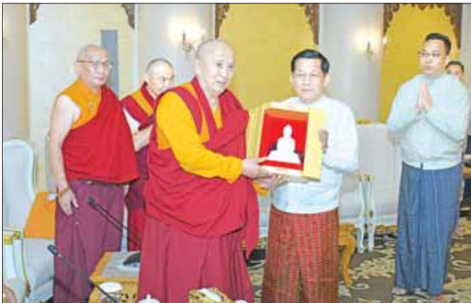
နိုင်ငံတော်စီမံအုပ်ချုပ်ရေးကောင်စီဥက္ကဋ္ဌ နိုင်ငံတော်ဝန်ကြီးချုပ် ဗိုလ်ချုပ်မှူးကြီး မင်းအောင်လှိုင် ရုရှားနိုင်ငံမှ ဆရာတော်ကြီးများထံ မာရဝိဇယဗုဒ္ဓရုပ်ပွားတော်မြတ်ပုံစံတူ ကျောက်ဆစ်ဗုဒ္ဓရုပ်ပွားတော် မြတ်များ ဆက်ကပ်လှူဒါန်းစဉ်။