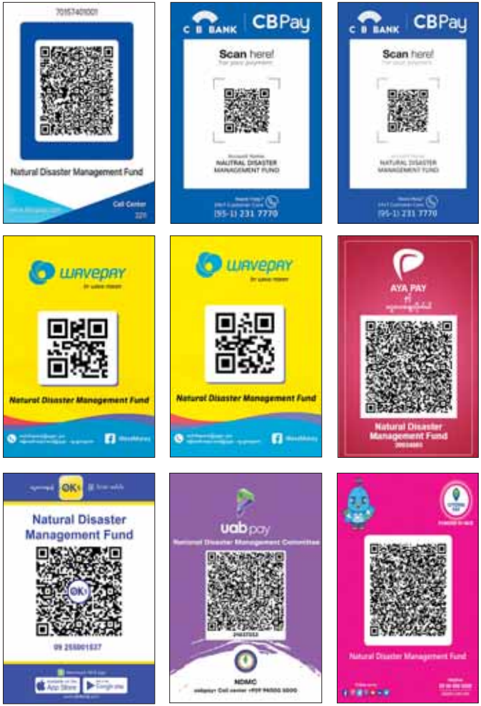
အမျိုးသားသဘာဝဘေးအန္တရာယ်ဆိုင်ရာစီမံခန့်ခွဲမှုကော်မတီ