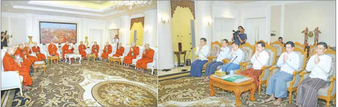
နိုင်ငံတော်စီမံအုပ်ချုပ်ရေးကောင်စီဥက္ကဋ္ဌ နိုင်ငံတော်ဝန်ကြီးချုပ် ဗိုလ်ချုပ်မှူးကြီး မင်းအောင်လှိုင်နှင့်အဖွဲ့ဝင်များ ဘင်္ဂလားဒေ့ရှ်နိုင်ငံမှ ဆရာတော်ကြီးများအား ဖူးမြော်ကြည့်ညိဉ်းစဉ်။