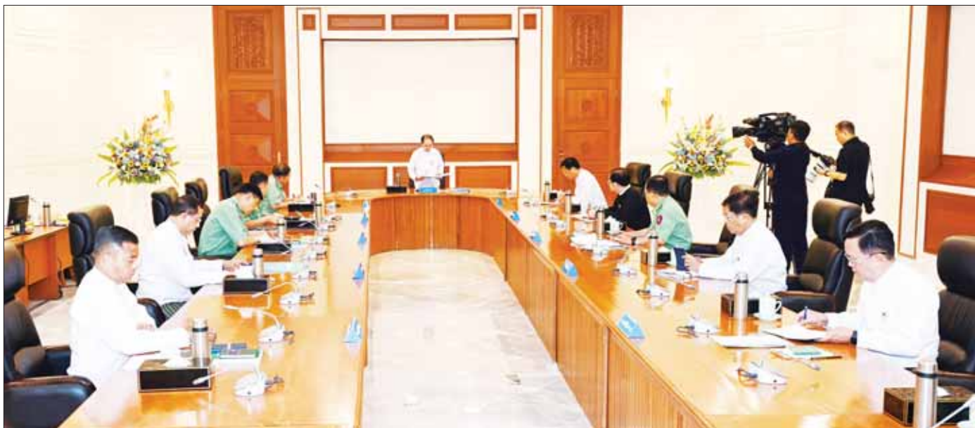
ပြည်ထောင်စုသမ္မတမြန်မာနိုင်ငံတော် အမျိုးသားကာကွယ်ရေးနှင့် လုံခြုံရေးကောင်စီ အစည်းအဝေး (၂/၂၀၂၃) ကျင်းပပြုလုပ်စဉ်။

နိုင်ငံတစ်ဝန်းလုံး အရေးပေါ်အခြေအနေကြေညာထားသည့် ကာလအား ၂၀၂၃ ခုနှစ် ဩဂုတ်လ ၁ ရက်နေ့မှစ၍ နောက်ထပ် (၆) လ သက်တမ်းတိုးမြှင့် ပြည်ထောင်စုသမ္မတမြန်မာနိုင်ငံတော် အမျိုးသားကာကွယ်ရေးနှင့် လုံခြုံရေးကောင်စီ ကြေညာချက်အမှတ် ၂/၂၀၂၃ ၁၃၈၅ ခုနှစ်၊ ဒုတိယဝါဆိုလဆန်း ၁၄ ရက် (၂၀၂၃ ခုနှစ်၊ ဇူလိုင်လ ၃၁ ရက်) ၁။ ပြည်ထောင်စုသမ္မတမြန်မာနိုင်ငံတော်၊ အမျိုးသားကာကွယ်ရေးနှင့် လုံခြုံရေးကောင်စီအစည်းအဝေး (၂/၂၀၂၃) ကို ၂၀၂၃ ခုနှစ်၊ ဇူလိုင်လ ၃၁ ရက်နေ့ (၀၉ ဝုဒ) နာရီတွင် ကျင်းပခဲ့သည်။ အစည်းအဝေးတွင် တပ်မတော်ကာကွယ်ရေးဦးစီးချုပ် ဗိုလ်ချုပ်မှူးကြီး မင်းအောင်လှိုင်က ထပ်မံသက်တမ်းတိုးထားသည့် ၆ လတာကာလအတွင်း နိုင်ငံဖွံ့ဖြိုးတိုးတက်မှုကို အရှိန်အဟုန်မြှင့်တင်ဆောင်ရွက်နိုင်ရန်၊ နိုင်ငံရေး လုပ်ငန်းစဉ် (၂) ရပ်နှင့် အမျိုးသားရေးလုပ်ငန်းစဉ် (၂) ရပ်တို့ကို အကောင်အထည်ဖော်ဆောင်ရွက်ရာတွင် ပိုမိုလျင်မြန်စွာ ဆောင်ရွက်နိုင်ရန် ၂၀၂၃ ခုနှစ်၊ ဖေဖော်ဝါရီလ ၄ ရက်တွင် ရှေ့လုပ်ငန်းစဉ် (၅) ရပ်နှင့် ဦးတည်ချက် (၁၂) ရပ်ကို ပြင်ဆင်ခြင်း၊ ထပ်မံဖြည့်စွက်ခြင်းတို့ကို ဆောင်ရွက်ခဲ့မှုအခြေအနေများ၊ ရှေ့လုပ်ငန်းစဉ်နှင့် ဦးတည်ချက်များကို အလေးအနက်ထား အကောင်အထည်ဖော်ဆောင်ရွက်နိုင်ခဲ့မှု ကြောင့် နိုင်ငံရေး၊ လူမှုစီးပွားဘဝ ဖွံ့ဖြိုးတိုးတက်ရေးတို့၌ တိုးတက်မှုများရရှိခဲ့သည့် အခြေအနေများ၊ အကြမ်းဖက်အဖွဲ့များဖြစ်သည့် NUG၊ CRPH၊ PDF အမည်အကြမ်းဖက်အဖွဲ့များ၏ အကြမ်းဖက်တိုက်ခိုက် မှုများ၊ ပညာရေးကဏ္ဍ မြင့်မားတိုးတက်စေရေး ကြိုးပမ်းအကောင်အထည်ဖော်လျက်ရှိမှုနှင့် အကြမ်းဖက် သမားများ၏ ပညာရေးကဏ္ဍနိမ့်ကျစေရေး အကြမ်းဖက်မှုများကို စာမျက်နှာ ၃ ကော်လံ ၁ ❖