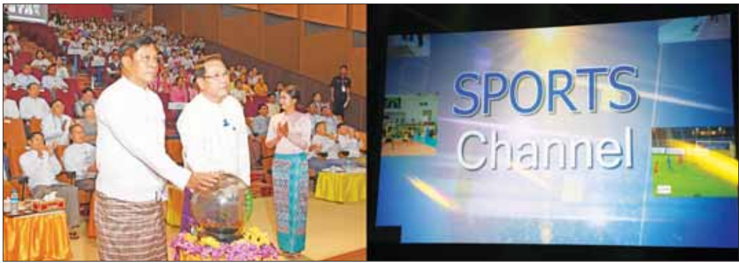
ဒုတိယဝန်ကြီးချုပ်နှင့် ပြည်ထောင်စုဝန်ကြီး ဗိုလ်ချုပ်ကြီးတင်အောင်စန်းနှင့် ပြည်ထောင်စုဝန်ကြီး ဦးမောင်မောင်အုန်းတို့က MRTV Farmers' Channel နှင့် MRTV Sports Channel တို့အား Channel များအလိုက် စက်ခလုတ်နှိပ်၍ ဖွင့်လှစ်ပေးစဉ်။

နေပြည်တော် ဇူလိုင် ၃၁ ၂၀၂၃ ခုနှစ် ဩဂုတ် ၁ ရက် (ဝါဆိုလပြည့်နေ့) တွင် နိုင်ငံတော်စီမံအုပ်ချုပ်ရေးကောင်စီ၏ နိုင်ငံတော် တာဝန်ထမ်းဆောင်ခြင်း ၂ နှစ်နှင့် ၆ လပြည့်မြောက်မှု အထိမ်းအမှတ်နှင့် ကမ္ဘာပေါ်ရှိ ထိုင်တော်မူ ဗုဒ္ဓ ရုပ်ပွားတော်များအနက် ဉာဏ်တော်အမြင့်ဆုံးအဖြစ် ကမ္မည်းမော်ကွန်းရေးထိုးနိုင်မည့် မာရဝိဇယ ရုပ်ပွား တော်မြတ်ကြီးကို နေပြည်တော်တွင် တည်ထား ပူဇော်မှု အနေကဇာတင်လှူခြင်း အခမ်းအနား ကျင်းပမည့် အထိမ်းအမှတ်အဖြစ် ပြန်ကြားရေး ဝန်ကြီးဌာန မြန်မာ့အသံနှင့် ရုပ်မြင်သံကြားနှင့် Hey Play Co., Ltd တို့ပူးပေါင်း၍ MRTV Farmers' Channel နှင့် MRTV Sports Channel အဆင့်မြှင့်တင် ထုတ်လွှင့်မှု (Channel Rebranding) ဖွင့်လှစ်ခြင်း အခမ်းအနားကို ယနေ့မွန်းလွဲ ၂ နာရီတွင် နေပြည်တော် တပ်ကုန်းမြို့နယ်ရှိ မြန်မာ့အသံနှင့် ရုပ်မြင်သံကြား Auditorium ခန်းမ၌ ကျင်းပသည်။