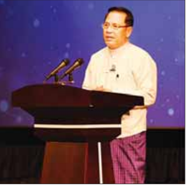
ပြည်ထောင်စုဝန်ကြီး ဦးမောင်မောင်အုန်း MRTV Farmers' Channel နှင့် MRTV Sports Channel များအား အဆင့်မြှင့်တင်ထုတ်လွှင့်ခြင်းနှင့် စပ်လျဉ်း၍ ရှင်းလင်းပြောကြားစဉ်။

အခမ်းအနားတွင် မြန်မာ့အသံနှင့် ရုပ်မြင် သံကြား ဝန်ထမ်းများနှင့် နိုင်ငံကျော်တေးသံရှင်များ က သီချင်းများဖြင့် ဖျော်ဖြေတင်ဆက်ကြပြီး “ရှေ့သို့ ချီထပ်ပန်းတိုင်ဆီ” Video Clip ကို ပြသသည်။ ထို့နောက် ပြည်ထောင်စုဝန်ကြီး ဦးမောင်မောင် အုန်းက MRTV Farmers' Channel နှင့် MRTV Sports Channel များအား အဆင့်မြှင့်တင်ထုတ်လွှင့် ခြင်း (Channel Rebranding) ကို ၂၀၂၃ ခုနှစ် ဩဂုတ် ၁ ရက်တွင် စတင်ဆောင်ရွက်မည့် အခြေ အနေများနှင့် စပ်လျဉ်း၍ ရှင်းလင်းပြောကြားသည်။ ယင်းနောက် တေးသံရှင်ထူးအယ်လင်း သီဆို ထားသည့် “ကျွန်ုပ်တို့ မြန်မာပြည်” တေးသီချင်း