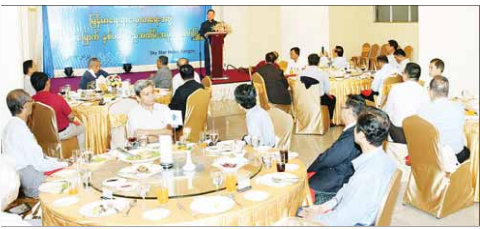
ပြည်ထောင်စုဝန်ကြီး ဦးမောင်မောင်အုန်း မြန်မာရေးရာလေ့လာရေးအဖွဲ့၏ (၇) နှစ်မြောက် နှစ်ပတ်လည်အထိမ်းအမှတ်ဂုဏ်ပြုပွဲအခမ်းအနားတွင် အမှာစကားပြောကြားစဉ်။

ထို့နောက် မြန်မာရေးရာလေ့လာရေးအဖွဲ့၏ နိုင်ငံအရေး စုဝေးပေါင်းစပ်သုံးသပ်လေ့လာ မြန်မာ