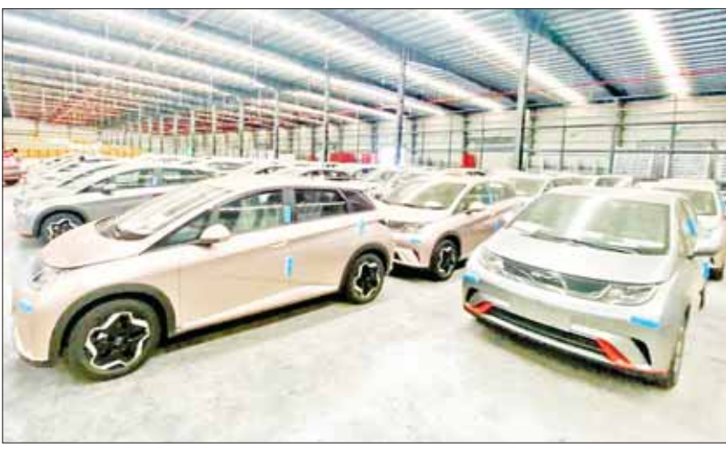
ရန်ကုန်ဆိပ်ကမ်းသို့ရောက်ရှိလာသည့် လျှပ်စစ်သုံးမော်တော်ယာဉ်များကို တွေ့ရစဉ်။

နေပြည်တော် ဇူလိုင် ၂၀ အမျိုးသားအဆင့် လျှပ်စစ်သုံးယာဉ်နှင့် ဆက်စပ်လုပ်ငန်းများ ဖွံ့ဖြိုးတိုးတက်ရေး ဦးဆောင်ကော်မတီ၏ ခွင့်ပြုချက်ဖြင့် N.P.K Motors Co.,Ltd. မှ တင်သွင်းလာသော MG, MG4 (Mulan) အမျိုးအစား လျှပ်စစ်သုံးမော်တော်ယာဉ် ၁၀ စီးနှင့် Earth Renewable Energy Co.,Ltd. မှ တင်သွင်းလာသော BYD Dolphin အမျိုးအစား လျှပ်စစ်သုံးမော်တော်ယာဉ် အစီး ၃၀၊ စုစုပေါင်း လျှပ်စစ်သုံးမော်တော်ယာဉ် အစီး ၄၀ သည် ရန်ကုန်ဆိပ်ကမ်းသို့ ရောက်ရှိလာသဖြင့် ယနေ့တွင် လုပ်ထုံးလုပ်နည်းနှင့်အညီ ထုတ်ယူခွင့်ပြုခဲ့ကြောင်းနှင့် အဆိုပါလျှပ်စစ်သုံးမော်တော်ယာဉ်များ တင်သွင်းမှုအတွက် အကောက်ခွန်ကင်းလွတ်ခွင့်ပြုထားကြောင်း သိရသည်။