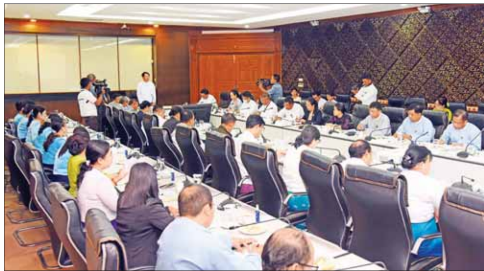
အဝန်း မျှော်မှန်းချက်ရေးဆွဲရေးဆိုင်ရာ အဆင့်မြင့်လုပ်ငန်းအဖွဲ့ (HLTF-ACV) မြန်မာနိုင်ငံကိုယ်စားလှယ်အဖွဲ့ခေါင်းဆောင်

ကြောင်း၊ ဝန်ကြီးဌာနကိုယ်စားလှယ်များအနေဖြင့် သက်ဆိုင်ရာကဏ္ဍများတွင် ကြုံတွေ့နေရသည့် လက်ရှိစိန်ခေါ်မှုများနှင့် အနာဂတ်စိန်ခေါ်မှုများကို ကြိုတင်မျှော်မှန်းထားရန်နှင့် အနာဂတ်လုပ်ငန်းစဉ်များကို အဆိုပြုဆွေးနွေးကြရန် တိုက်တွန်းပြောကြားလိုကြောင်း၊ ဆက်လက်ပြီး အာဆီယံအနာဂတ်မျှော်မှန်းချက်ကို ဆွေးနွေးရာမှာ သက်ဆိုင်ရာ ဝန်ကြီးဌာနများ၏ အမျိုးသား စီမံကိန်းများနှင့် ကိုက်ညီစွာ ထည့်သွင်းဆွေးနွေးခြင်းဖြင့် ဒေသတွင်းပူးပေါင်းဆောင်ရွက်မှုမှ အမျိုးသားအကျိုးစီးပွားကို ဖြစ်ထွန်းစေမည်ဖြစ်ကြောင်း ပြောကြားသည်။ ထို့နောက် အာဆီယံအသိုက်