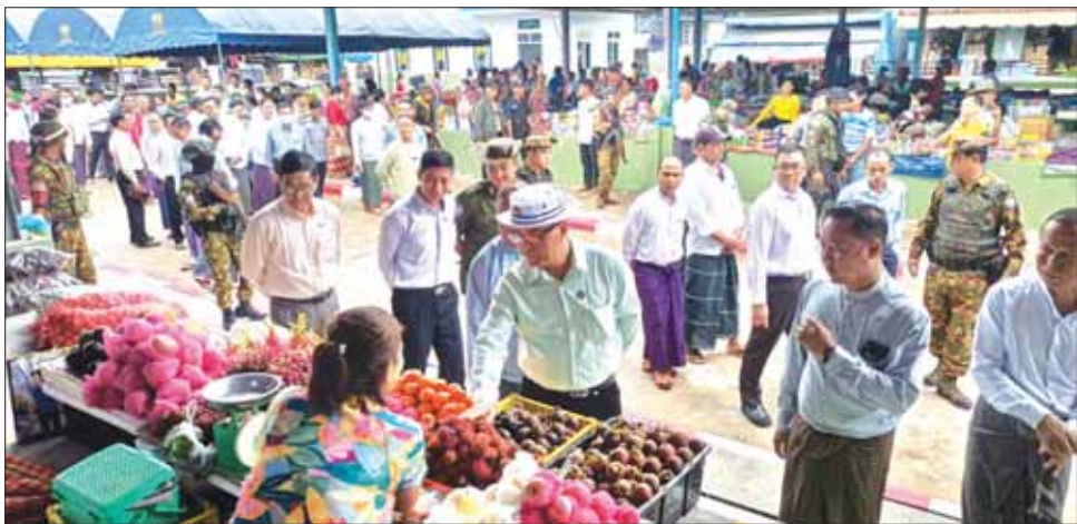
ဖဲကြိုးဖြတ်ဖွင့်လှစ်ပေးသည်။ ဆက်လက်၍ ပြည်နယ်ဝန်ကြီးချုပ်က လှိုင်းဘွဲ့မြို့မဈေးသစ် ဆိုင်းဘုတ်ကို စက်ခလုတ်နှိပ်ဖွင့်လှစ်ပေးကာ ကမ္ဘာ့မော်ကွန်းအား အမွှေးနံ့သာရည် ပက်ဖျန်းပေးသည်။

ထို့နောက် ကရင်ပြည်နယ်ဝန်ကြီးချုပ်၊ ပြည်နယ်တရားလွှတ်တော်တရားသူကြီးချုပ် ဒေါ်ခင်ဆွေထွန်း၊ ပြည်နယ်လုံခြုံရေးနှင့် နယ်စပ်ရေးရာဝန်ကြီး ဗိုလ်မှူးကြီး မျိုးမင်းနောင်၊ ပြည်နယ်စီးပွားရေးရာဝန်ကြီး ဦးစောခင်မောင်မြင့်၊ ပြည်နယ်သယံဇာတရေးရာဝန်ကြီး ဦးဇော်ဝင်းတို့က လှိုင်းဘွဲ့မြို့မဈေးသစ်ကို