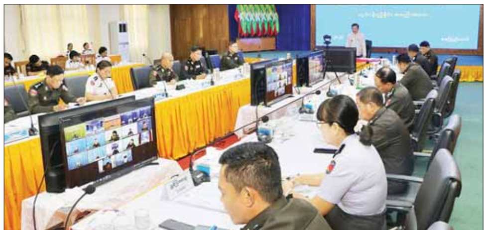
သည့် ကတ်ပြားတစ်မျိုးမျိုးကိုင်ဆောင်မဲပေးနိုင်ရေးအတွက် မိမိတို့ဝန်ကြီးဌာနမှ တာဝန်ယူဆောင်ရွက်နေသည့် ပန်းခင်းစီမံချက် အဆင့်(၁) နှင့် အဆင့်(၂) ဆောင်ရွက်ပြီးစီးမှု၊ တိုင်းဒေသကြီး/ ပြည်နယ်အသီးသီး၌ e-ID Software ဖြင့် လူတစ်ဦးချင်းစီ