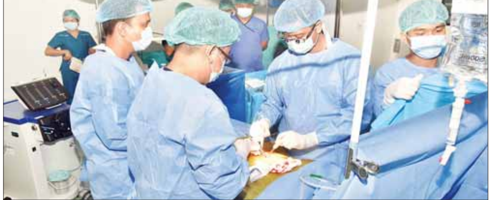
ယခုကဲ့သို့ အသည်းအစားထိုးခွဲစိတ်ကုသမှုကို တပ်မတော်ဆေးရုံကြီးများမှ တာဝန်ရှိသူများ သွားရောက်ကြည့်ရှုအားပေးခဲ့ကြောင်း သတင်းရရှိသည်။ သတင်းစဉ်