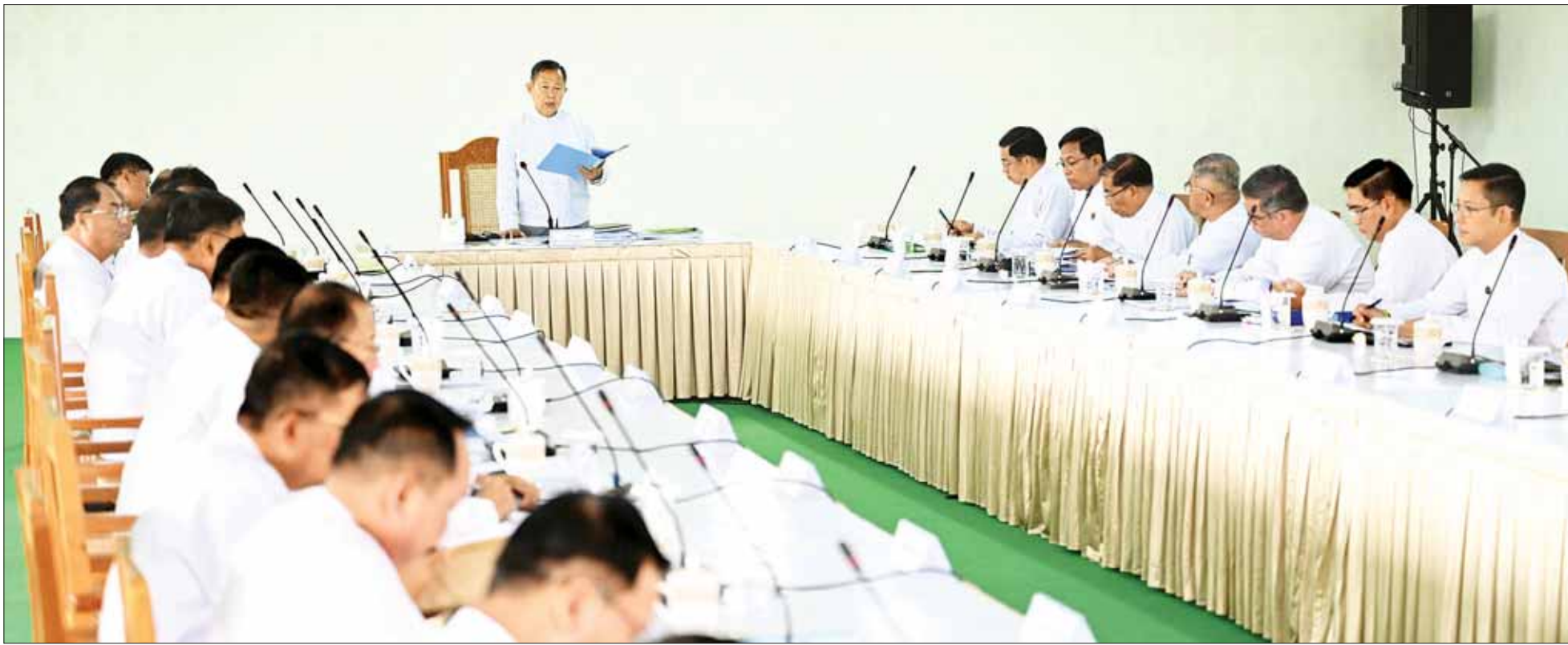
နိုင်ငံတော်စီမံအုပ်ချုပ်ရေးကောင်စီ ဒုတိယဥက္ကဋ္ဌ ဒုတိယဝန်ကြီးချုပ် ဒုတိယဗိုလ်ချုပ်မှူးကြီး စိုးဝင်း မြန်မာသက္ကရာဇ် ၁၃၈၅ ခုနှစ်၊ ဒုတိယဝါဆိုလပြည့်နေ့(ဓမ္မစကြာနေ့)တွင် ကျင်းပမည့် မာရဝိဇယဗုဒ္ဓရုပ်ပွားတော်မြတ်ကြီး ဗုဒ္ဓါဘိသေကအနေကဇာတင်လှူခြင်း၊ ကျောက်စာရုံစေတီတော်များ ထီးတော်တင်လှူခြင်းနှင့် ရေစက်ချအခမ်းအနားများအတွက် လုပ်ငန်းညှိနှိုင်းအစည်းအဝေးတွင် အမှာစကားပြောကြားစဉ်။