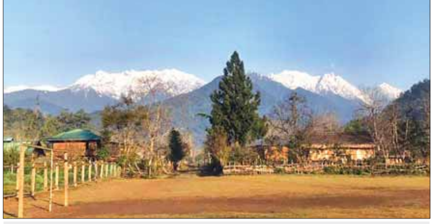
ဖုန်ကန်ရာဇီရေခဲတောင်ခြေရှိ ဇီယာဒမ်းကျေးရွာ။

အလားတူ ကချင်ပြည်နယ်အစိုးရအဖွဲ့ အနေဖြင့် ဒေသတွင်း ခရီးစဉ်ဒေသသစ်များ ဖော်ဆောင်နိုင်ရေး စီမံဆောင်ရွက်လျက်ရှိပြီး မြစ်ဆုံဒေသအား မြစ်ကြီးနားမြို့၏ ခရီးသွား ပြယုဂ်တစ်ခုဖြစ်ပေါ်လာစေရေး အဆင့်မြှင့်တင် အကောင်အထည်ဖော် ဆောင်ရွက်လျက် ရှိသည့်အပြင် ပူတာအိုဒေသအား ရေခဲတောင် များ အပါအဝင် သဘာဝအလှအပများစွာ ရှိသည့်အတွက် ပြည်တွင်း ပြည်ပခရီးသွား မြို့တော်ဖြစ်လာစေရေး ဒေသခံပြည်သူများ၊ ပူတာအိုခရိုင် ခရီးသွားစီမံခန့်ခွဲရေးအဖွဲ့များ နှင့် ညှိနှိုင်းပေါင်းစပ် ဆောင်ရွက်လျက်ရှိ ကြောင်း သိရသည်။ ပြည်နယ်(ပြန်/ဆက်)