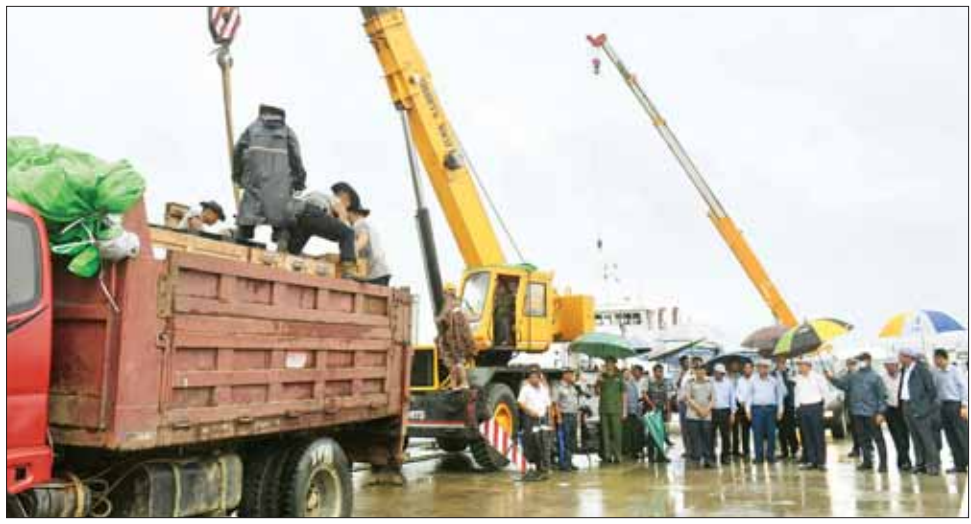
တင်ထွန်း(ပြန်/ဆက်)