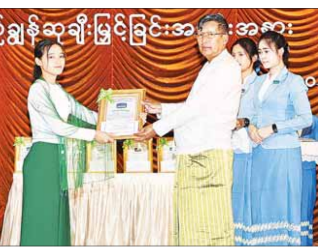
များနှင့် ၎င်းတို့၏ မိဘများ၊ ဥက္ကဋ္ဌ၊ မြို့တော်ဝန် ဦးတင်ဦးလွင်က တက္ကသိုလ်ဝင်စာမေးပွဲတွင် အောင်မြင်ခဲ့သည့်ကျောင်းသားလူငယ်များအနေဖြင့် ရရှိနေသည့် ပညာရေး အရှိန်အဟုန်ကို

နေပြည်တော် ဇူလိုင် ၂၀ နေပြည်တော်စည်ပင်သာယာရေးကော်မတီမှ ၂၀၂၃ ခုနှစ် တက္ကသိုလ်ဝင်စာမေးပွဲတွင် ထူးချွန်စွာ အောင်မြင်ခဲ့ကြသော ဝန်ထမ်းများ၏ သား/သမီးများ ပညာရည်ချွန်ဆုများ ပေးအပ်ချီးမြှင့်ခြင်း အခမ်းအနားကို ယနေ့ နံနက် ၁၀ နာရီက နေပြည်တော်စည်ပင်သာယာရေးကော်မတီ မြို့တော်ခန်းမရှိ မင်္ဂလာခန်းမ၌ ကျင်းပရာ နေပြည်တော် စည်ပင်သာယာရေးကော်မတီဥက္ကဋ္ဌ မြို့တော်ဝန် ဦးတင်ဦးလွင်၊ အမြဲတမ်းအတွင်းဝန်နှင့် ဌာနကြီးမှူးများ၊ ဌာနမှူးများ၊ ထူးချွန်စွာအောင်မြင်ခဲ့ကြသော ကျောင်းသား ကျောင်းသူ