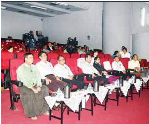
ပြည်ထောင်စုဝန်ကြီး ဦးမောင်မောင်အုန်းနှင့်အဖွဲ့ဝင်များ “ဟာသမြို့တော်ရယ်စရာစင်တင်ဟာသ တစ်ခန်းရုပ်ပြဇာတ်” ရိုက်ကူးနေမှုကို ကြည့်ရှုအားပေးစဉ်။

လေ့ကျင့်နေမှုနှင့် ပြည်ထောင်စုဝန်ကြီး၏ လမ်းညွှန်မှာကြားချက်များအပေါ် ဆောင်ရွက်ပြီးစီးမှုအခြေအနေများကို ရှင်းလင်းတင်ပြသည်။ ထို့နောက် သံစုံတီးဝိုင်း၏ နိုင်ငံတကာတေးသီချင်းများ လေ့ကျင့်တီးခတ်သီဆိုမှု တစ်ဦးချင်း ကိုယ်ရည်ကိုယ်သွေးမြှင့်တင်ရေးသင်တန်း (Personal Grooming Course) သင်ကြားနေမှုနှင့် လူ့ရွှင်တော်စတား ကောင်းထက်စီစဉ်သည့် “ဟာသမြို့တော် ရယ်စရာစင်တင်ဟာသ တစ်ခန်းရုပ်ပြဇာတ်” ရိုက်ကူးနေမှုတို့ကို ကြည့်ရှုအားပေးပြီး ဝန်ထမ်းများအား ထောက်ပံ့ငွေများ ပေးအပ်ချီးမြှင့်သည်။ ရှေးဦးစွာ မြန်မာ့အသံနှင့် ရုပ်မြင်သံကြား(ရန်ကုန်) Studio (B)၌ မြန်မာ့အသံနှင့် ရုပ်မြင်သံကြား ညွှန်ကြားရေးမှူးချုပ် ဦးရဲနိုင်က သံစုံတီးဝိုင်း စုဖွဲ့ပြင်ဆင်