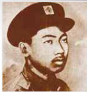
ရဲဘော်ကိုထွေး