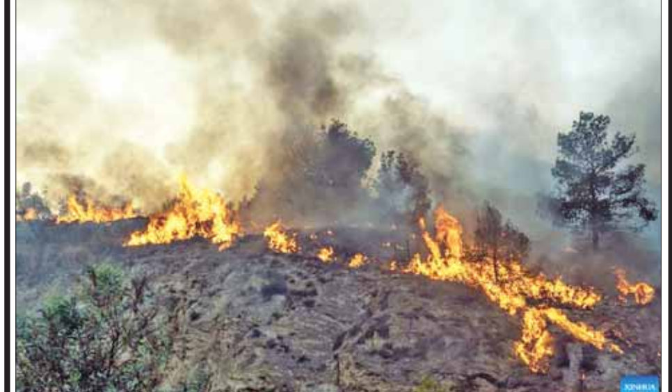
ဂရိနိုင်ငံ အသင်မြို့ အနောက်တောင်ဘက် ကီလိုမီတာ ၈၀ အကွာ ကမ်းခြေအပန်းဖြေမြို့ လူထုရက် ကီတွင် လောင်ကျွမ်းနေသော တောမီးကိုတွေ့ရစဉ်။

ပေးခဲ့ရသည်။ ရဲများသည် မီးရှို့မှုသံသယနှင့် အမည်မသိ လူတစ်ဦးကို ဖမ်းဆီးခဲ့ကြောင်း ဂရိအမျိုးသား သတင်းဌာနဖြစ်သည့် အမ်နာက ဖော်ပြခဲ့သည်။ ရဟတ်ယာဉ် ခြောက်စင်း၊ မီးသတ်လေယာဉ် ၁၀ စင်း အကူအညီနှင့်အတူ မီးသတ်သမား အနည်းဆုံး ၂၀၀ သည် ၁၂ ကီလိုမီတာပမာဏရှိ တောမီးကို ငြိမ်းသတ်နိုင်ရေး နာရီပေါင်းအတော် ကြာ ကြိုးစားခဲ့ကြသည်။ သို့သော်လည်း ၎င်းတို့၏ ကြိုးစားမှုများကို ပြင်းထန်သော လေပြင်းတိုက်ခတ် မှုများက နှောင့်ယှက်ဟန့်တားသလို ဖြစ်စေခဲ့ သည်။ ဂရိနိုင်ငံတစ်ဝန်း တောမီးပေါင်း ၈၁ ခု လောင်ခဲ့ သည်။ အဆိုပါ တောမီးများအနက် တောမီးလေးခု မှာ မီးသတ်တပ်ဖွဲ့အတွက် စိန်ခေါ်မှုဖြစ်ခဲ့ကြောင်း မီးသတ်ဌာန ပြောရေးဆိုခွင့်ရှိသူ အီယိုနာနက်စ် အာတိုပွိုက်က အမိနာသို့ ပြောခဲ့သည်။ ဆင်ဟွာ