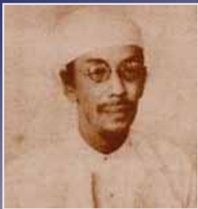
ဒီးဒုတ်ဦးဘချို