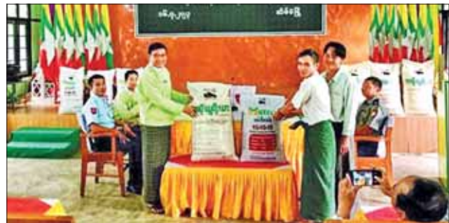
အိမ်မဲမြို့နယ်၌ နိုင်ငံစီးပွားမြှင့်တင်ရေးရန်ပုံငွေဖြင့် ဆောင်ရွက်သည့် လယ်ယာကဏ္ဍ ဖွံ့ဖြိုးတိုးတက်ရေးအတွက် လိုအပ်သောသွင်းအားစုများ ပေးအပ်ပွဲကျင်းပ

နေပြည်တော် ဇူလိုင် ၁၈ ယနေ့နံနက် ၈ နာရီခွဲ တိုင်းထွာချက်အရ ချင်းတွင်းမြစ်ရေသည် ဟုမလင်းမြို့တွင် ယင်းမြို့၏ စိုးရိမ်ရေမှတ်အထက်သို့ တစ်ပေခန့် ကျော်လွန်ရောက်ရှိနေသည်။ အဆိုပါမြစ်ရေသည် နောက်နှစ်ရက်အတွင်း တစ်ပေခန့် မြင့်တက်လာနိုင်ပြီး ယင်းမြို့၏ စိုးရိမ်ရေမှတ်အထက် ဆက်လက်တည်ရှိနိုင်သည်။ ချင်းတွင်းမြစ်ရေသည် ဖောင်းပြင်မြို့တွင် ယင်းမြို့၏ စိုးရိမ်ရေမှတ်အထက်သို့ တစ်ပေခန့် ကျော်လွန်ရောက်ရှိနေသည်။ အဆိုပါမြစ်ရေသည် နောက်နှစ်ရက်အတွင်း တစ်ပေခန့် မြင့်တက်လာနိုင်ပြီး ယင်းမြို့၏ စိုးရိမ်ရေမှတ်အထက် ဆက်လက်တည်ရှိနိုင်သည်။ အကြံပြုချက် သို့ဖြစ်၍ ဟုမလင်းမြို့နှင့် ဖောင်းပြင်မြို့နယ်များအတွင်း ရှိ မြစ်ကမ်းအနီးနှင့် မြေနိမ့်ပိုင်းနေထိုင်သူများအနေဖြင့် အထူးသတိပြုနေထိုင်ကြပါရန် အကြံပြုအပ်ပါသည်။ မိုး/ဇလ