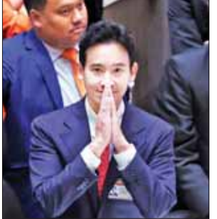
လှယ်လောင်းတစ်ဦးကို ထောက်ခံ သွားမည်ဖြစ်ကြောင်း ပြောသည်။ ဖြူထိုင်းပါတီသည် ထိုင်းနိုင်ငံတွင် ဒုတိယအကြီးဆုံးပါတီ ဖြစ်သည်။ အဆိုပါ ပါတီသည် ဖြူထိုင်းချစ် ဝန်ကြီး ချုပ်ဟောင်း သက်ဆင် ရှင်နာဝပ်ထရာနှင့် ဆက်နွယ်မှု ရှိသည့် ပါတီလည်းဖြစ်သည်။ အင်န်အိတ်ချ်ကေ

ဘန်ကောက် ဇူလိုင် ၁၈ ထိုင်းနိုင်ငံ၌ ရှေ့သို့ချီပါတီ ခေါင်းဆောင်က ၎င်းအနေဖြင့် နိုင်ငံ၏ဝန်ကြီးချုပ်သစ် ဖြစ်လာရေးနှင့်ပတ်သက်ပြီး လွှတ်တော်အတွင်း နောက်ထပ်တစ်ကြိမ် မဲခွဲဆုံးဖြတ်မှုတွင် ပါဝင်ယှဉ်ပြိုင်သွားမည်ဖြစ်ကြောင်း ပြောကြား လိုက်သည်။ ရှေ့သို့ချီ ပါတီခေါင်းဆောင် ပီထာလင်ဂျာရွန်ရတ်သည် ပြီးခဲ့ သည့် သီတင်းပတ်က ပထမ အကြိမ် လွှတ်တော်တွင်း မဲခွဲ ဆုံးဖြတ်မှုတွင် လုံလောက်သည့် မဲအရေအတွက်ရရှိခဲ့ခြင်း မရှိပေ။ သို့သော်လည်း ၎င်းပါတီနှင့် မဟာမိတ်ပါတီများက ၎င်းကို နောက်ထပ်တစ်ကြိမ် အမည်စာရင်း တင်သွင်းရန် သဘောတူခဲ့ကြ ကြောင်း သိရသည်။ ပထမအကြိမ် မဲခွဲဆုံးဖြတ်မှု ကို လွန်ခဲ့သည့် ဇူလိုင် ၁၃ ရက် က ကျင်းပခဲ့ရာ ပီထာလင် ဂျာရွန်ရတ်သည် နှစ်ရပ်ပေါင်း၏ ထောက်ခံမဲ ၃၇၅ မဲရရှိရန် လိုအပ် သော်လည်း ကွန်ဆာဗေးတစ် အမတ်များထံမှ လုံလောက်သော မဲအရေအတွက် မရရှိခြင်းကြောင့် အောင်မြင်မှုမရရှိခဲ့ပေ။ ရှေ့သို့ချီပါတီနှင့် အခြား အတိုက်အခံ ပါတီ ခုနစ်ခုတို့သည် ညွန့်ပေါင်းအစိုးရ ဖွဲ့စည်းနိုင်ရန် ကြိုးစားလုပ်ဆောင်နေပြီး ဇူလိုင် ၁၇ ရက်က တွေ့ဆုံဆွေးနွေးမှုများ ပြုလုပ်ခဲ့ကြကြောင်း သိရသည်။ ထိုကဲ့သို့ တွေ့ဆုံဆွေးနွေးမှုအပြီး တွင် ပီထာက နောက်ထပ် တစ်ကြိမ် ဝင်ရောက်ယှဉ်ပြိုင်ရန် အတည်ပြုခဲ့ခြင်းဖြစ်သည်။ ထို့ပြင် ၎င်းအနေဖြင့် ယခု အကြိမ် မဲခွဲဆုံးဖြတ်မှုတွင် လုံလောက်သည့် မဲအရေအတွက် မရရှိပါက ဖြူထိုင်းပါတီ ကိုယ်စား