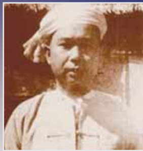
စဝ်စံထွန်း