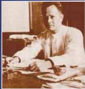
မန်းဘခိုင်