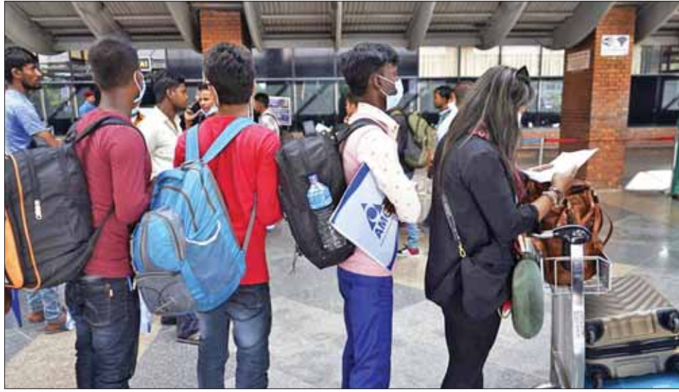
နိုင်ငံရပ်ခြားသို့ အလုပ်ထွက်လုပ်မည့် နီပေါရွှေ့ပြောင်းလုပ်သားများကို ခတ္တမန္တူလေဆိပ်၌ တွေ့ရစဉ်။