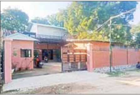
၂၄-၁၂-၂၀၂၂ ရက်တွင် စဉ်ကိုင်မြို့နယ် ပလိပ်မြို့ ဝန်ထမ်းကွက်သစ်ရပ်ရှိ Heart Zoom စားသောက်ဆိုင်အား အကြမ်းဖက်သမားများက လက်လုပ်ဆိုင်းဖြင့်ပစ်ခတ်မှုကြောင့် ပျက်စီးမှု မှတ်တမ်းဓာတ်ပုံ။