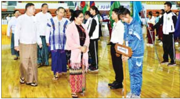
နိုင်ငံတော်စီမံအုပ်ချုပ်ရေးကောင်စီ အဖွဲ့ဝင်များ ၂၀၂၃ ခုနှစ် ပြည်နယ်နှင့် တိုင်းဒေသကြီး ဗိုလ်ချုပ်ပြိုင်ပွဲဝင် အသင်းများအား ရင်းနှီးနှီးနှီး နှုတ်ဆက်စဉ်။

၂၀၂၃ ခုနှစ် ပြည်နယ်နှင့် တိုင်းဒေသကြီး ဗိုလ်ချုပ်ပြိုင်ပွဲကို ဇူလိုင် ၁၇ ရက်မှ ၂၀ ရက်အထိ ဝဏ္ဏသိဒ္ဓိအားကစားရုံ (A) ၌ ကျင်းပသွားမည်ဖြစ်ပြီး ပြည်နယ်နှင့် တိုင်းဒေသကြီးများမှ ပြိုင်ပွဲဝင် အမျိုးသားအသင်း ၁၃ သင်း၊ အားကစားသမား စုစုပေါင်း ၂၂၀ ဦး ပါဝင်ယှဉ်ပြိုင်သွားမည်ဖြစ်ကြောင်းနှင့် စိတ်ပါဝင်စားသည့် မိဘပြည်သူများအနေဖြင့် အခမဲ့လာရောက် ကြည့်ရှုနိုင်ကြောင်း သိရသည်။