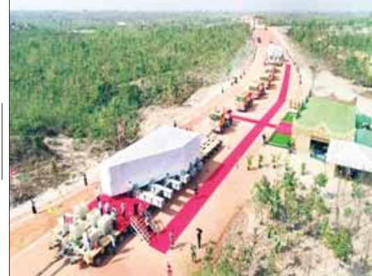
ကျောက်တုံးတော်ကြီးအား ကုန်းလမ်းခရီးဖြင့် သယ်ဆောင်စဉ်။

သီလ၊ ဘာဝနာတရားများကို ကြိုးစားအားထုတ်လျက် ရှိကြသည့်အပြင် သာသနာတော်ပြန့်ပွားရေးလုပ်ငန်းများ လိုလည်း အားကြီးမာန်တက် တက်ညီတက်ညီ၊ စည်းလုံးညီညွတ်စွာ တတ်နိုင်သည့် အခန်းကဏ္ဍတိုင်းမှ ဆောင်ရွက် တတ်ကြသူများဖြစ်ပါသည်။