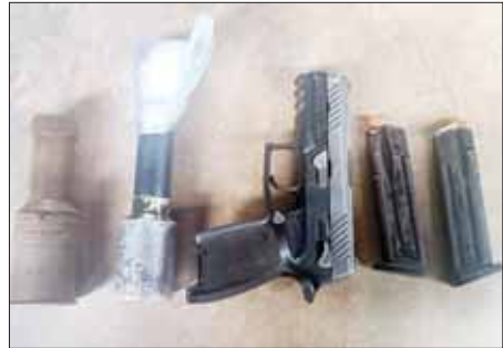
အမရပူရမြို့နယ် ဝက်ကုန်းတမာတန်းရပ်၌ သီဟဇော်ထွေး(ခ)သီဟ နှင့်အတူ သိမ်းဆည်းရမိသည့် လက်နက်/ခဲယမ်းများ။