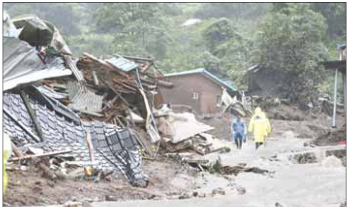
မိုးသည်းထန်စွာရွာသွန်းပြီး မြေပြိုကျမှုကြောင့် နေအိမ်များ ပြိုလဲနေမှုကို တွေ့ရစဉ်။

ကြောင်း သိရသည်။ မြစ်တစ်စင်းအနီးတွင် ရေကြီး ရေလျှံမှု သတိပေးချက်များကို လေးနာရီကျော်ကြာ ကြိုတင် ထုတ်ပြန်ခဲ့ကြောင်း၊ သို့သော် လည်း အာဏာပိုင်များက ဥမင် လိုက်ခေါင်းကို မပိတ်ခဲ့ကြောင်း ဒေသဒီဒီယာများက ပြောသည်။