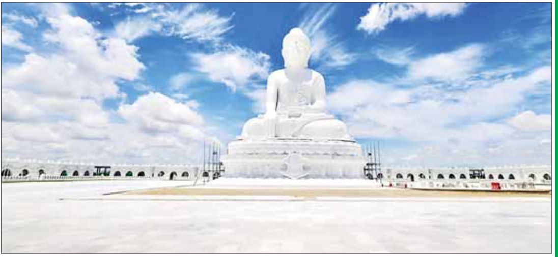
မာရဝိဇယဗုဒ္ဓရုပ်ပွားတော်မြတ်ကြီးအား အဝေးမှဖူးတွေ့ရစဉ်။

ကြီးကျယ်ခမ်းနားမှုကို အံ့ဩမဆုံးဖြစ်ခဲ့ရသလို ယခုကဲ့သို့ အင်မတန်ကြီးကျယ်ခမ်းနားပြီး ကမ္ဘာပေါ်တွင် ဗုဒ္ဓသာသနာအတွက် အမြင့်မြတ်ဆုံးတစ်နေရာ (Holy Place) အဖြစ် ပေါ်ထွန်းလာမည့် ဗုဒ္ဓရုပ်ပွားတော်ကြီး ရာနှုန်းပြည့်ပြီးစီးနိုင်ရေးအတွက် တည်ဆောက်နေဆဲကာလတွင် လှူဒါန်းခွင့်ရသဖြင့် တစ်နည်းဆိုရသော် ရှေးဦးအလှူရှင် (Founder) ဘုရားဒါယကာ၊ ဒါယိကာမများအဖြစ် လှူဒါန်းခွင့်ရရှိခဲ့သဖြင့် သာသနာမှတ်တမ်းတစ်ခု စိုက်ထူနိုင်ခဲ့ခြင်းဖြစ်ပြီး မိမိတို့၏ နောင်လာနောက်သားများအတွက်ပါ ဓမ္မအမွေပေးဆပ်နိုင်မည့် လက်ဆင့်ကမ်း ရာသက်ပန်ကုသိုလ်အလှူတစ်ခုအဖြစ် ကြည့်နူးသဒ္ဓါစိတ်ပွားများကာ သာဓုအကြိမ်ကြိမ် ခေါ်ဆိုမိပါကြောင်း ရေးသားလိုက်ရပါသည်။ ။