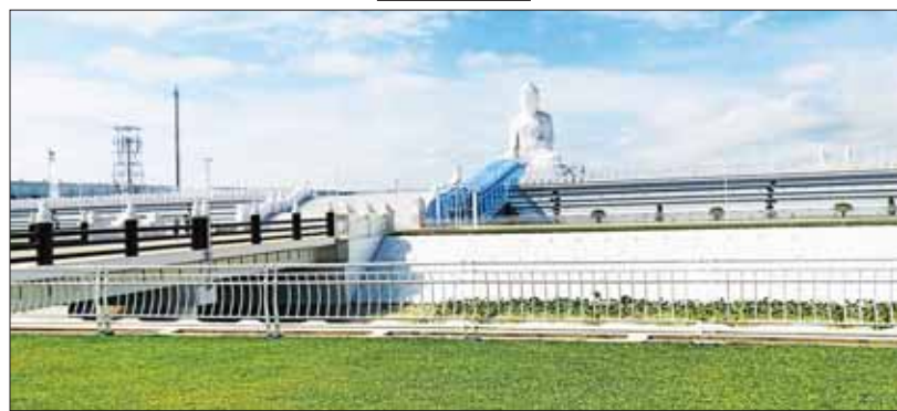
မာရဝိဇယဗုဒ္ဓရုပ်ပွားတော်မြတ်ကြီးအား အဝေးမှဖူးတွေ့ရစဉ်။

အဆင့် ပင့်ဆောင်ခဲ့ရပြီး စကျင်ကျောက်တော်ကြီး ရေကြောင်းမှသယ်ယူပို့ဆောင်ရေးခရီးစဉ် အစမှအဆုံး ၁၁-၆-၂၀၂၀ ရက်နေ့မှ ၂၃-၉-၂၀၂၀ ရက်နေ့အထိ ရက်ပေါင်း ၁၀၅ ရက်ကြာမြင့်ခဲ့ကြောင်း၊ ဆီမီးခုံဆိပ်ကမ်းမှ စကားအင်းအပိုင်းအကြား ကျောက်တုံးတော်ကြီးများ ချောမွေ့စွာ သယ်ယူနိုင်ရေး ၂၂ ခိုင် ၅ ဖာလုံအရှည် ရှိသောလမ်းကို ဖောက်လုပ်ခဲ့ရပြီး ၂၅-၁-၂၀၂၁ ရက်နေ့ မှစ၍ မန္တလေး-ရန်ကုန် အမြန်လမ်းမကြီးအတိုင်း Modular Trailer များဖြင့် ယခုတည်ထားကိုးကွယ်မည့် ဗုဒ္ဓဥယျာဉ်တော်နေရာသို့ အဆင့်ဆင့်ပင့်ဆောင်ခဲ့ရကြောင်း၊ ကုန်းလမ်းခရီးဖြင့် သယ်ယူရာတွင် စုစုပေါင်း ၇ ခေါက်၊ တန်ချိန်အားဖြင့် ၇၆၂ တန်ကို သယ်ယူခဲ့ရပြီး ကျောက်တုံးတော်ကြီးများ ပင့်ဆောင်ပြီးစီးချိန်တွင် ဖောက်လုပ်ခဲ့သည့် တူးမြောင်းနေရာအား မြေပြန်လည်ဖွဲ့ခြင်းနှင့် အမြန်လမ်းမကြီး တစ်လျှောက်ရှိ ပြုပြင်ခဲ့သည့် By Pass ၈၄ နေရာနှင့် အခြားနေရာများအား မူလအတိုင်း ပြန်လည်ဆောင်ရွက်ပေးခဲ့ကြောင်း၊ ကျောက်တုံးတော်ကြီးများ ပင့်ဆောင်မှုသည် ကမ္ဘာပေါ်တွင် ရေလမ်းခရီးအရ လည်းကောင်း၊ ကုန်းလမ်းခရီးအရ လည်းကောင်း အဝေးဆုံးဖြစ်သကဲ့သို့ အလေးချိန်အရလည်း အများဆုံးအဖြစ် စံချိန်တင် ဆောင်ရွက်နိုင်ခဲ့ကြောင်း လေ့လာသိရှိရပါသည်။ ယခုဆောင်ရွက်ချက်များသည် ပြည်တွင်းအတတ်ပညာရှင်များဖြင့်သာ ဆောင်ရွက်ခြင်းဖြစ်သည်ဟု သိရှိရသည့်အတွက် မြန်မာတို့၏ ထုံးထွင်းကြံဆမှုနှင့် တီထွင်လုပ်ကိုင်နိုင်စွမ်းကို မြန်မာနိုင်ငံသားတစ်ဦးစီပီဂုဏ်ယူစိတ်များ တဖွားဖွားပေါ်ပေါက်ခဲ့ရပါသည်။