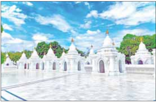
မန္တလေးမြို့ မဟာလောကမာရဇိန် ကုသိုလ်တော်ဘုရားရှိ ပိဋကတ်ကျောက်စာရံများ။