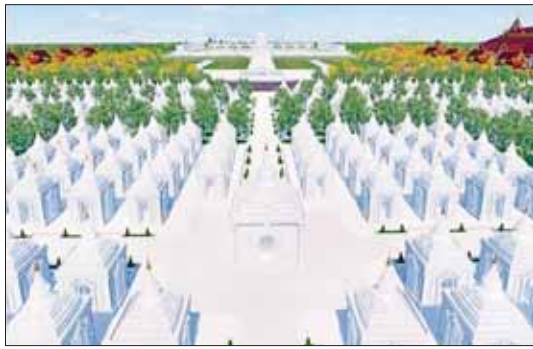
နေပြည်တော် မာရဝိဇယ ဗုဒ္ဓဥယျာဉ်တော်အတွင်းရှိ ကျောက်စာရံစေတီများ။

များလက်ထက်တွင်လည်း တည်ထားကိုးကွယ်နေသည့် မာရဝိဇယဗုဒ္ဓရုပ်ပွားတော်မြတ်ကြီးသည် သမိုင်းဝင်သာသနာ့အမွေအနှစ်ကြီး တစ်ခုအဖြစ် အခွန်ရှည်စွာ ထာဝရတည်တံ့နေမည့်အဖြစ်ကို တွေးကြည့်မိသည့်အခါ ပီတိဖြစ်မိပါသည်။ ဗုဒ္ဓဥယျာဉ်တော် “ဗုဒ္ဓဥယျာဉ်တော်” ဟု တင်စားခေါ်ဆိုနိုင်လောက်အောင် မာရဝိဇယဗုဒ္ဓရုပ်ပွားတော်မြတ်ကြီး အပါအဝင် ကျောက်စာရံစေတီ၊ မာရဝိဇယကျောင်းတော်၊ သာသနာ့ဗိမာန်တော်ကြီး (သိမ်တော်ကြီး)၊ သံဃာနားနေဆောင်၊ သုဓမ္မာဇရပ်၊ မုစလိန္နအိုင်း၊ နဂါးရံဘုရားများ၊ မဟာရတ်တိုင်း၊ မော်ကွန်းတိုက်၊ အဝင်မုနိဦး၊ ရွှေလျားစက်လှေကားနှင့် ဂေါပကရုံးတို့ကိုလည်း ပိဋကတ်တော်လား အဆိုအမိန့်များနှင့် မဟာဗုဒ္ဓဝင်ကျမ်းဂန်တော်များနှင့်အညီ ပြည့်စုံစွာ တည်ထား ကိုးကွယ်ခဲ့သည်ကိုလည်း ကြည့်နူးသဒ္ဓါအပြည့်ဖြင့် တွေ့မြင်ခဲ့ရပါသည်။