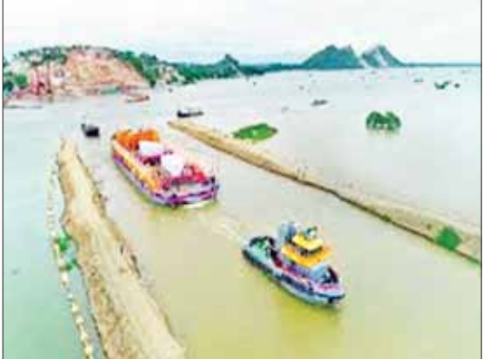
ကျောက်တုံးတော်ကြီးအား တူးမြောင်းဖောက်လုပ်၍ ရေလမ်းခရီးဖြင့် စတင်သယ်ယူစဉ်။

စတင်တွေ့ရှိမှု ၂၀၁၇ ခုနှစ်နှောင်းပိုင်းတွင် ယခင် နိုင်ငံတော်အကြီးအကဲ ဗိုလ်ချုပ်မှူးကြီး သန်းရွှေက ၂၀၁၃ ခုနှစ်တွင် Angelo Mining Co., Ltd. မှ ၎င်းထံသို့ လှူဒါန်းထားသည့် စကျင်ကျောက်တော်ကြီးအား တပ်မတော်မှ ဦးဆောင်ပြီး ဘုရားတည်ထားရန် လွှဲအပ်ချက်အရ တပ်မတော်က အောက်တိုဘာလမှစတင်၍ လေ့လာရေး လုပ်ငန်းများကို ဆောင်ရွက်ခဲ့ကြောင်း၊ စကျင်ကျောက်တော်ကြီးမှ ထွက်ရှိလာ နိုင်သည့် အတိုင်းအတာ၊ ထုထည်နှင့် မြို့နယ်အတွင်း တည်ထားကိုးကွယ်