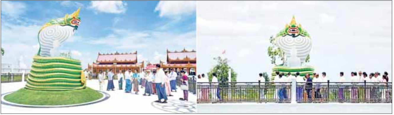
နေပြည်တော် မာရဝိဇယ ဗုဒ္ဓဥယျာဉ်တော်အတွင်းရှိ နဂါးရုံဘုရားအား တွေ့ရစဉ်။