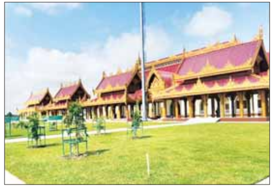
နေပြည်တော် မာရဝိဇယ ဗုဒ္ဓဥယျာဉ်တော်အတွင်းရှိ သုဓမ္မာဇရပ်များ။

သုဓမ္မာဇရပ်နှင့် အောင်မြေ ဘုရားကြီးပေါ်သို့ တက်ရောက်ဖူးမြော်ကြည့်ညှိချိန်တွင် သုဓမ္မာဇရပ်များ၊ ကျောက်စာရံစေတီတော်များ၊ ရေပန်းကြီး၊ ရေပန်းငယ်များဖြင့် တင့်တယ်ဝေဆာလျက်ရှိပြီး ဘုရားဖူးရာလမ်းတစ်လျှောက် မြတ်ဗုဒ္ဓအရိပ်အာဝါဒ၏ စာမျက်နှာ ၉ သို့