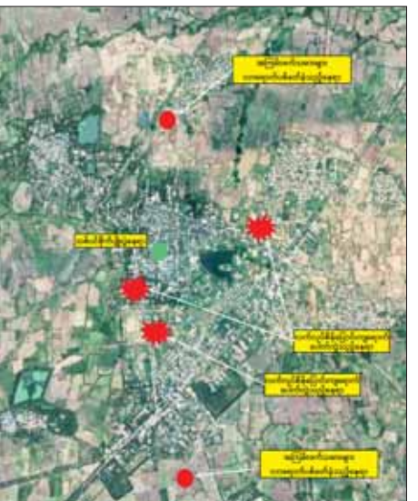
PDF အမည်ခံ အကြမ်းဖက်သမားများက လက်လုပ်စိန်ပြောင်းများဖြင့် အကြောင်းမဲ့ ပစ်ခတ်တိုက်ခိုက်ခဲ့မှုကြောင့် မိုးရာသီသစ်ပင်စိုက်ပျိုးပွဲ ပါဝင်ဆင်နွှဲခဲ့ကြသည့် ဌာနဆိုင်ရာ ဝန်ထမ်းများ၊ ဒေသခံပြည်သူများ၊ ကျောင်းသား ကျောင်းသူများအနက် တစ်ဦးသေဆုံး၊ အသက် ၁၀ နှစ် အောက် ကလေးငယ် သုံးဦးအပါအဝင် ၁၁ ဦး ထိခိုက်ဒဏ်ရာ ရရှိခဲ့ သည့် ဖြစ်စဉ်ပြပုံ။

ပြည်သူများ၊ ကျောင်းသား ကျောင်းသူများအနက် တစ်ဦးသေဆုံးခဲ့ရပြီး အသက် ၁၀ နှစ်အောက် ကလေးငယ် သုံးဦးအပါအဝင် ၁၁ ဦး ထိခိုက် ဒဏ်ရာရရှိခဲ့ကြောင်းနှင့် ဗန္ဓုလရပ်ကွက်ရှိ ရောင်ခြည်ဦး ဘုန်းတော် ကြီးကျောင်း တံခါးမှန်အချို့ ဖျက်စီးခဲ့ရကြောင်း သိရသည်။ ဖြစ်စဉ်တွင် ထိခိုက်ဒဏ်ရာရရှိခဲ့သည့် ဌာနဆိုင်ရာဝန်ထမ်းများ၊ ဒေသခံပြည်သူများနှင့် ကျောင်းသား ကျောင်းသူများကို ဘုတလင်မြို့ ပြည်သူ့ဆေးရုံသို့ ပို့ဆောင်၍ လိုအပ်သည့်ဆေးဝါးကုသမှုများ ခံယူစေ လျက်ရှိသည်။ ထိုကဲ့သို့ဌာနဆိုင်ရာဝန်ထမ်းများ၊ အပြစ်မဲ့အရပ်သားပြည်သူများနှင့် ကျောင်းသား ကျောင်းသူများကို ယုတ်မာရက်စက်စွာ လက်လုပ်စိန် ပြောင်းများဖြင့် လာရောက်ပစ်ခတ်ခဲ့သည့် အကြမ်းဖက်သမားများကို ဖမ်းဆီးအရေးယူနိုင်ရေးနှင့် နယ်မြေဒေသ တည်ငြိမ်အေးချမ်းရေး အတွက် လုံခြုံရေးတပ်ဖွဲ့ဝင်များက ဆက်လက်ဆောင်ရွက်လျက်ရှိ ကြောင်း သတင်းရရှိသည်။