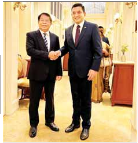
ပြည်ထောင်စုဝန်ကြီး ဦးသန်းဆွေ သီရိလင်္ကာနိုင်ငံခြားရေးဝန်ကြီး မစ္စတာ အလီ ဆာဘာရီ အား ရင်းနှီးနှီးနှီး နှုတ်ခတ်စဉ်။

အမြင်ချင်းဖလှယ်ဆွေးနွေး ဘင်္ဂလားဒေ့ရှ် နိုင်ငံခြားရေးဝန်ကြီးနှင့် တွေ့ဆုံစဉ် နှစ်နိုင်ငံ ဆက်ဆံရေး ပိုမိုတိုးတက်နိုင်စေရေး၊ နှစ်နိုင်ငံကုန်သွယ်ရေးနှင့်