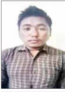
သီဟဇော်ထွေး(ခ)သီဟ မြစ်ငယ် PDF အမည်ခံ အကြမ်းဖက်အဖွဲ့ဝင်

နေပြည်တော် ဇူလိုင် ၁၇ နိုင်ငံတော်အစိုးရက အကြမ်းဖက် အုပ်စုအဖြစ် ကြေညာထားသည့် NUG၊ CRPH နှင့် ၎င်းတို့၏ လက်ဝဲခံ PDF အမည်ခံ အကြမ်းဖက် အဖွဲ့များသည် ပြည်သူ့အတွက်ဟု သုံးနှုန်း၍ ရဟန်းသံဃာများ၊ ဆရာမများအပါအဝင် နိုင်ငံ့ဝန်ထမ်းများနှင့် ပြည်သူများကို ရက်စက်စွာ လုပ်ကြံသတ်ဖြတ်ခြင်း၊ လုယက်ခြင်းများ၊ အပြစ်မဲ့ပြည်သူများ သေကျေပျက်စီးစေရန် စာမျက်နှာ ၁၄ ကော်လံ ၁ ☸