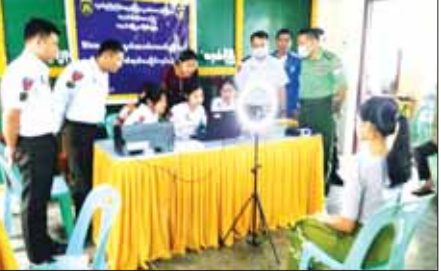
တနင်္သာရီ၌ ဇီဝဆိုင်ရာအချက်အလက်များ စတင်ကောက်ယူ

၀ ရှေ့ဖိုးမှ တီရစ္ဆာန်အရင်၊ လူသုံးကုန်ပစ္စည်း၊ စက်ရုံသုံးပစ္စည်း၊ စက်နှင့် စက်ပစ္စည်း ကိရိယာများ၊ ဆေးဝါး၊ Packing Material၊ အိမ်သုံးဆေး၊ ကုန်ကြမ်းပစ္စည်း၊ ယန္တရားစက်ပစ္စည်းများ၊ ငါးဖမ်းပစ္စည်း၊ LPG (ဓာတ်ငွေ့ရည်) နှင့် အလှူကုန်ပစ္စည်းတို့ တင်သွင်းခဲ့သည်။ ငွေလဲနှုန်းအနေဖြင့် ယခင်အပတ်ကာ တစ်ဘတ်လျှင် ၈၈ ဒေသ ၁၁ ကျပ်သာရှိပြီး ယခုအပတ်တွင် ၈၉ ဒေသ ၂၉ ကျပ်ဖြစ်သဖြင့် ဘတ်ဈေး အနည်းငယ်တက်ခဲ့ကြောင်းနှင့် ကုန်ပစ္စည်းများ တင်ပို့ တင်သွင်းခြင်းကို ရန်ကုန်-ဘားအံ-မြဝတီ ကုန်သွယ်မှုလမ်းကြောင်း အတိုင်း ပုံမှန်ဆောင်ရွက်လျက်ရှိသည်။ ၂၀၂၃-၂၀၂၄ ဘဏ္ဍာနှစ် (ဧပြီ ၁ ရက်မှ ဇူလိုင် ၁၄ ရက်အထိ) အမှန်ဆောင်ရွက်နိုင်မှုမှာ ပို့ကုန် အမေရိကန်ဒေါ်လာ ၁၆၅ ဒေသ ၁၃၈ သန်း၊ သွင်းကုန် အမေရိကန်ဒေါ်လာ ၃၆၅ ဒေသ ၆၀၅ သန်း၊ ကုန်သွယ်မှုပမာဏ အမေရိကန်ဒေါ်လာ ၅၃၀ ဒေသ ၆၄၃ သန်း ဖြစ်သည်။ DOT (Myawaddy)