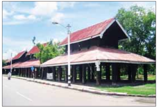
မန္တလေးတောင်ခြေရှိ ဓင်းတုန်းမင်း၏ ကောင်းမှုတော်ဖြစ်သော သုဓမ္မာဇရပ်များ။

များအနေဖြင့် အလျား ၁၂ ပေ၊ အနံ ၁၂ ပေ၊ အမြင့် ၁၈ ပေ ရှိမည်ဖြစ်ကာ ကျောက်စာရံအနေဖြင့် အလျား ၃ ပေ ၉ လက်မ၊ အမြင့် ၆ ပေ ၃ လက်မ၊ ထု ၇ ဒသမ ၂ လက်မရှိမည်ဖြစ်ပြီး ပါဠိနှင့် ရှိမန်ဘာသာများဖြင့် ပိဋကတ်ကျမ်းစာတော်များကို ရေးထိုးပူဇော်ထားပြီး ဘုရားဖူးလာ မိဘပြည်သူများအပြင် နိုင်ငံတကာလေ့လာသူများပါ ဗုဒ္ဓရုပ်ပွားတော်မြတ်ကြီးအား လာရောက်ဖူးမြော်ရာတွင် ကျောက်စာရံစေတီများအတွင်းရှိ ဘုရားဟောဒေသနာတော်များကို ပါဠိနှင့် ရှိမန်ဘာသာများဖြင့် ပြည့်စုံစွာ ကြည့်ညှိလေ့လာနိုင်ရေး စီမံဆောင်ရွက်ထားကြောင်း တွေ့ရှိရပါသည်။ မာရဝိဇယဗုဒ္ဓရုပ်ပွားတော်မြတ်ကြီး၏ မျက်နှာတော်အား တောင်ဘက်မှနေ၍ မြောက်ဘက်သို့ မျက်နှာမူထားပြီး တည်ထားကိုးကွယ်မည့် ဖြစ်ပါသည်။ မာရဝိဇယဗုဒ္ဓရုပ်ပွားတော်မြတ်ကြီး မျက်နှာတော် ရှေ့တည့်တည့်တွင် မြတ်စွာဘုရား၏ နှုတ်ကပါဠိတော်များအား ကျောက်စာရံစေတီအတွင်း ထည့်သွင်းထားသည်ကို တွေ့မြင်ခဲ့ရသည့်အတွက် မြတ်ဗုဒ္ဓ၏ နှုတ်ကပါဠိတော်များသည် မြတ်စွာဘုရား၏ မျက်လုံးတော်အောက်တွင် တည်ရှိနေသကဲ့သို့ ခံစားမိပြီး ကြည့်နူးပီတိဖြစ်ကာ ကုသိုလ်စိတ်များ တဖွားဖွား ပိုမိုတိုးပွားခဲ့ရပါသည်။