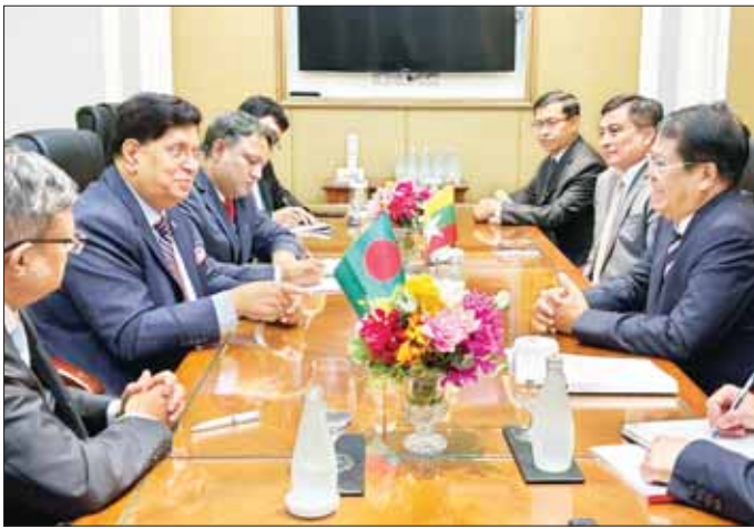
ပြည်ထောင်စုဝန်ကြီး ဦးသန်းဆွေနှင့် ဘင်္ဂလားဒေ့ရှ် နိုင်ငံခြားရေးဝန်ကြီး ဒေါက်တာ အေ ကေ အပ္ပဒူလ မိုမန်တို့ တွေ့ဆုံဆွေးနွေးစဉ်။

နေပြည်တော် ဇူလိုင် ၁၇ ထိုင်းနိုင်ငံ ဗန်ကောက်မြို့၌ ကျင်းပပြုလုပ်သည့် (၁၂) ကြိမ်မြောက် မဲခေါင်-ဂင်္ဂါ ပူးပေါင်းဆောင်ရွက်မှု နိုင်ငံခြားရေးဝန်ကြီးများ အစည်းအဝေးနှင့် ဘင်းမိစတက် နိုင်ငံခြားရေးဝန်ကြီးများ၏ သီးသန့်အစည်းအဝေးသို့ တက်ရောက်လျက်ရှိသည့် နိုင်ငံခြားရေးဝန်ကြီးဌာန ပြည်ထောင်စုဝန်ကြီး ဦးသန်းဆွေသည် ယနေ့ဒေသစံတော်ချိန် ညနေ ၄ နာရီခွဲတွင် ဘင်္ဂလားဒေ့ရှ် နိုင်ငံခြားရေးဝန်ကြီး ဒေါက်တာ အေ ကေ အပ္ပဒူလ မိုမန်နှင့် လည်းကောင်း၊ ဒေသစံတော်ချိန် ညနေ ၅ နာရီ ၁၅ မိနစ်တွင် သီရိလင်္ကာ နိုင်ငံခြားရေးဝန်ကြီး မစ္စတာ အလီ ဆာဘာရီနှင့် လည်းကောင်း သီးခြားစီ တွေ့ဆုံသည်။