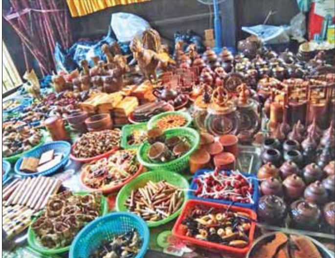
ချောင်းဆုံမြို့နယ်ရှိ ရိုးရာလုပ်ငန်းများမှ ထုတ်လုပ်သော သစ်သားပန်းပွတ် အသုံးအဆောင်များ။