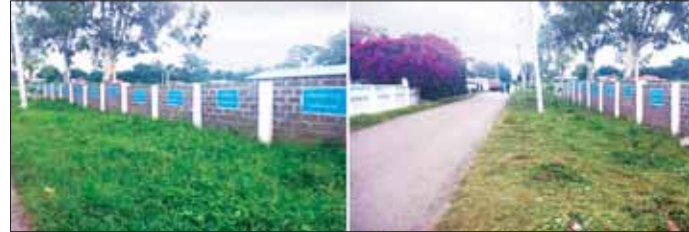
ပြင်ဦးလွင်မြို့နယ် ရပ်ကွက်ကြီး(၇) အမှတ်(၁၁)အခြေခံပညာမူလတန်းကျောင်း၌ စုပေါင်းသန့်ရှင်းရေး မဆောင်ရွက်မီနှင့် ဆောင်ရွက်ပြီးစီးမှုအခြေအနေ။