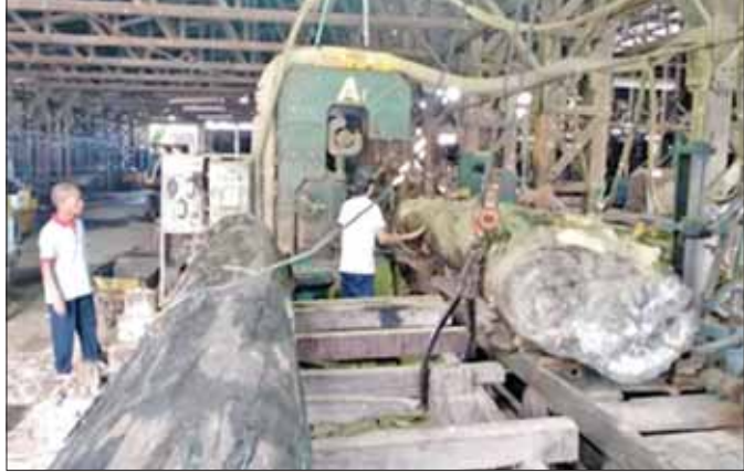
အသင့်သုံး သစ်ခွဲသားများရရှိရေး ကြိုတင်ခွဲစိတ်နေမှုကို တွေ့ရစဉ်။

○ ရန်ကုန်ဆိပ်ကမ်းကနေ ပို့ဖို့အတွက် သစ်ခွဲသား ၇၂ တန်ကို ရန်ကုန်သစ်စက်တွေမှာ ထပ်မံခွဲစိတ်စုစည်းထားရှိပါတယ်။ စစ်တွေမြို့ကို ပို့ဖို့အတွက် တောင်ကုတ်မြို့ အငှားစက်တွေမှာ သစ်ခွဲသားလက်ကျန် ၃၃၃ တန် အသင့်ရှိပြီး သံတွဲမြို့မှာတော့ ထပ်မံခွဲစိတ်ပြီး ထွက်ရှိတဲ့ အသင့်သုံးခွဲသား ၁၈ တန် ရှိနေပါတယ်။ အားလုံးကို ရခိုင်ပြည်နယ် ပြန်လည်တည်ဆောက်ရေးလုပ်ငန်းတွေမှာ အသုံးပြုသွားမှာ ဖြစ်ပါတယ်