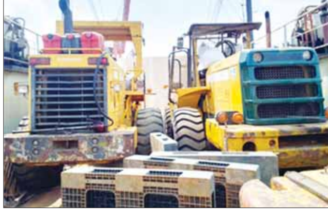
သစ်များတင်ချရန် Clark ကားများ စစ်တွေသို့ တင်ပို့သည့် ဓာတ်ပုံမှတ်တမ်း။