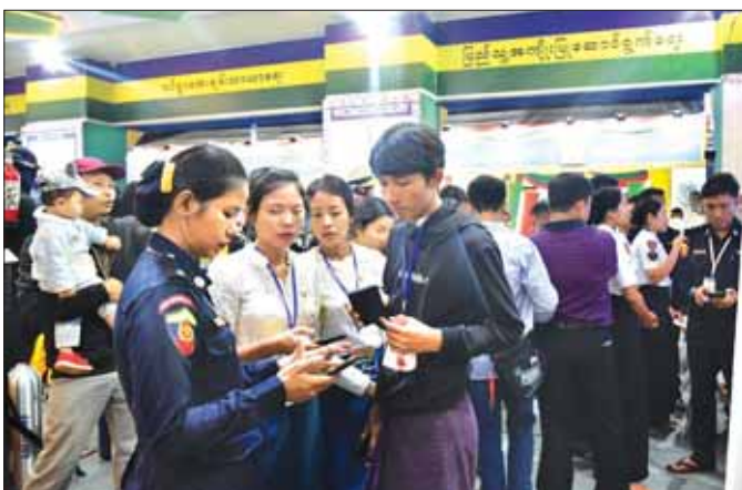
စိန်ရတုလွတ်လပ်ရေးနေ့က မီးသတ်ဦးစီးဌာန၏ ပြခန်း၌ 191 Report အက်ပလီကေးရှင်းကို မိတ်ဆက်ပြသစဉ်။

191 Report Mobile Application မှ တစ်ဆင့် ပြည်သူများ သတင်းပေးပို့လာမှုအား မြန်မာနိုင်ငံမီးသတ်တပ်ဖွဲ့ဌာနချုပ်၊ Command and Control Center မှ ၂၄ နာရီ စောင့်ကြည့်လျက်ရှိပြီး သတင်းပေးပို့လာပါက ပေးပို့လာသော ဖုန်းနံပါတ်သို့ ပြန်လည်ဆက်သွယ်မေးမြန်းပြီး ဖြစ်စဉ်ဖြစ်ပွားမှုအပေါ်မူတည်၍ အခင်းဖြစ်ပွားရာနေရာနှင့် အနီးဆုံးမီးသတ်စခန်းများမှ မီးငြိမ်းသတ်ယာဉ်နှင့် ရှာဖွေကယ်ဆယ်ရေးယာဉ်များ အမြန်ဆုံးစေလွှတ်ကာ အကူအညီပေးနိုင်မည်ဖြစ်ကြောင်း သိရသည်။ ထိုသို့ဆောင်ရွက်နိုင်ရန် ကချင်ပြည်နယ်၊ ကရင်ပြည်နယ်၊ ရှမ်းပြည်နယ်၊ စစ်ကိုင်းတိုင်းဒေသကြီး၊ ပဲခူးတိုင်းဒေသကြီး၊ မကွေးတိုင်းဒေသကြီး၊ မန္တလေးတိုင်းဒေသကြီးနှင့် ဧရာဝတီတိုင်းဒေသကြီး မီးသတ်ဦးစီးဌာနများတွင် Command and Control Center (ခွဲ)များ တည်ဆောက်ထားရှိပြီး မီးသတ်တပ်ဖွဲ့ဌာနချုပ်နှင့် ချိတ်ဆက်ဆောင်ရွက်လျက်ရှိသည်။ ထို့ပြင် တိုင်းဒေသကြီးနှင့် ပြည်နယ်အသီးသီးရှိ မီးသတ်ဦးစီးဌာနများတွင်လည်း Command and Control Center များ တိုးချဲ့တည်ဆောက်နိုင်ရေး ဆက်လက်ဆောင်ရွက်လျက်ရှိသည်။