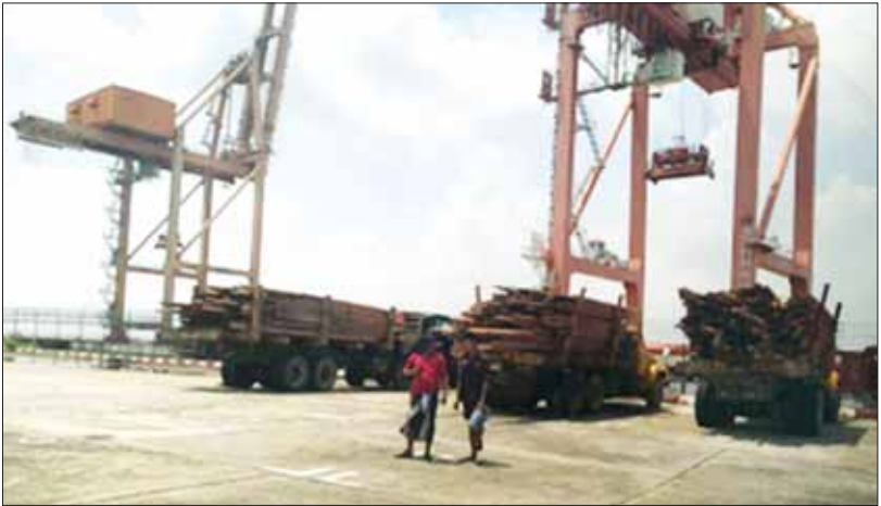
မုန်တိုင်းကျရောက်ပြီး ပြန်လည်ထူထောင်ရေးလုပ်ငန်းဆောင်ရွက်ရန် စစ်တွေသို့ သစ်ခွဲသားများ ပို့ဆောင်နေစဉ်။

ဖြေ ။ ။ ကပ္ပလီပင်လယ်ပြင်နံဆက်စပ် လျက်ရှိတဲ့ ဘင်္ဂလားပင်လယ်အော် အရှေ့တောင်ပိုင်းမှာ ဖြစ်ပေါ်လာမယ့် လေဖိအားနည်းရပ်ဝန်းရဲ့ နောက်ဆက်တွဲအခြေအနေတွေနဲ့ စပ်လျဉ်းပြီး မေလ ၆ ရက်နေ့မှာ ကျင်းပခဲ့တဲ့ အမျိုးသားသဘာဝဘေးအန္တရာယ်ဆိုင်ရာစီမံခန့်ခွဲမှုကော်မတီ ဥက္ကဋ္ဌ နိုင်ငံတော် စီမံအုပ်ချုပ်ရေးကောင်စီ