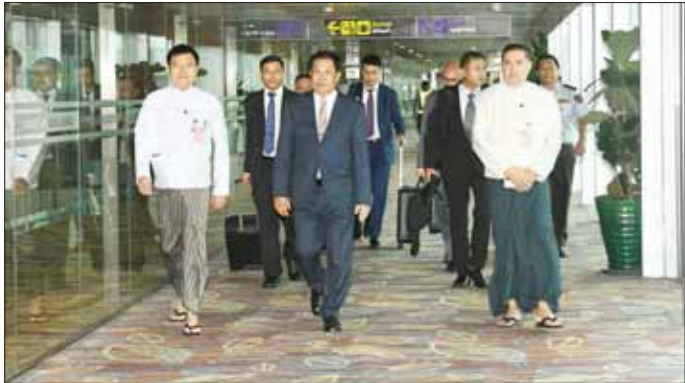
လွယ်အဖွဲ့အား နိုင်ငံခြားရေး လေဆိပ်၌ ပို့ဆောင်နှုတ်ဆက်ကြ သွားကြသည်။ (အပေါ်ပုံ) ဝန်ကြီးဌာနမှ တာဝန်ရှိသူများ ဝန်ကြီးဌာနမှ တာဝန်ရှိသူများ သည်။ လွယ်အဖွဲ့အား နိုင်ငံခြားရေး လေဆိပ်၌ ပို့ဆောင်နှုတ်ဆက်ကြ သွားကြသည်။ (အပေါ်ပုံ) ဝန်ကြီးဌာနမှ တာဝန်ရှိသူများ ဝန်ကြီးဌာနမှ တာဝန်ရှိသူများ သည်။

နေပြည်တော် ဇူလိုင် ၁၅ လာအိုပြည်သူ့ ဒီမိုကရက်တစ် သမ္မတနိုင်ငံ ဒုတိယဝန်ကြီးချုပ်နှင့် နိုင်ငံခြားရေးဝန်ကြီး မစ္စတာဆလုံး ဆေးကုမာဆစ်နှင့် ထိုင်းဘုရင့်နိုင်ငံ ဒုတိယဝန်ကြီးချုပ်နှင့် နိုင်ငံခြားရေးဝန်ကြီး မစ္စတာဒွန်ပရာမှတ်(မ်) တီနိုင်းတို့၏ တရားဝင်ဖိတ်ကြားချက် အရ နိုင်ငံခြားရေးဝန်ကြီးဌာန ပြည်ထောင်စုဝန်ကြီး ဦးသန်းဆွေ ခေါင်းဆောင်သည့် မြန်မာကိုယ်စား လှယ်အဖွဲ့သည် (၁၂) ကြိမ်မြောက် မဲခေါင် - ဂင်္ဂါ ပူးပေါင်းဆောင်ရွက်မှု နိုင်ငံခြားရေးဝန်ကြီးများ အစည်း အဝေးနှင့် ဘင်းမိစတင်နိုင်ငံခြား ရေးဝန်ကြီးများ၏ သီးသန့်အစည်း အဝေးများသို့ တက်ရောက်ရန်