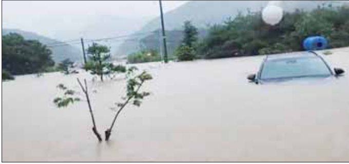
ဂိုဆန်ဒေသအလယ်ပိုင်းတွင် မိုးသည်းထန်စွာ ရွာသွန်းမှုကြောင့် ဆည်ရေလျှံပြီး ကျေးရွာတစ်ရွာ၌ ရေကြီးနေမှုကို တွေ့ရစဉ်။

ဆိုးလ် ဇူလိုင် ၁၅ တောင်ကိုရီးယား နိုင်ငံ၌ မိုးသည်းထန်စွာ ရွာသွန်းမှုကြောင့် ခုနစ်ဦးသေဆုံးပြီး သုံးဦး ပျောက်ဆုံးနေကာ ဒဏ်ရာရရှိသူ ခုနစ်ဦးရှိသည်ဟု ယွန်ဟတ် သတင်းအေဂျင်စီတွင် ဇူလိုင် ၁၅ ရက်က ဖော်ပြထားသည်။