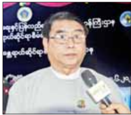
ညွှန်ကြားရေးမှူးချုပ် ဦးသိန်းတိုး

သဘာဝဘေးအန္တရာယ်စီမံခန့်ခွဲမှုဗဟိုဌာန(Disaster Management Centre- DMC)သည် မိုခါမုန်တိုင်းနှင့်ပတ်သက်၍ အချိန်နှင့်တစ်ပြေးညီ တုံ့ပြန်ဆောင်ရွက်ပေးသည့် ဗဟိုဌာနဖြစ်ပါသည်။ အမျိုးသားသဘာဝဘေးအန္တရာယ်ဆိုင်ရာ စီမံခန့်ခွဲမှုကော်မတီအောက်တွင် လုပ်ငန်းကော်မတီ (၁၂) ခုကို ဖွဲ့စည်းထားရှိပြီး အဆိုပါလုပ်ငန်းကော်မတီ များသည် DMC တွင် စုဖွဲ့ကာ မိုခါမုန်တိုင်းနှင့်ပတ်သက်၍ သဘာဝဘေးအန္တရာယ်ဆိုင်ရာစီမံခန့်ခွဲမှုလုပ်ငန်းများကို အရေးပေါ်တုံ့ပြန်ဆောင်ရွက်လျက်ရှိပါသည်။ လုပ်ငန်းကော်မတီ (၁၂) ခုအနက် သဘာဝပတ်ဝန်းကျင်ထိန်းသိမ်းရေးလုပ်ငန်းကော်မတီအတွင်းရေးမှူး ပတ်ဝန်းကျင်ထိန်းသိမ်းရေးဦးစီးဌာန ညွှန်ကြားရေးမှူးချုပ် ဦးသိန်းတိုးနှင့် တွေ့ဆုံမေးမြန်းမှုများကို ဖော်ပြလိုက်ရပါသည်-