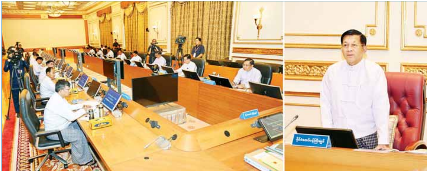
နိုင်ငံတော်စီမံအုပ်ချုပ်ရေးကောင်စီဥက္ကဋ္ဌ နိုင်ငံတော်ဝန်ကြီးချုပ် ဗိုလ်ချုပ်မှူးကြီး မင်းအောင်လှိုင် နိုင်ငံ့ကုန်ထုတ်လုပ်မှုဖြင့်တင်ရေးအစည်းအဝေးတွင် အမှာစကားပြောကြားစဉ်။

နိုင်ငံတော်စီမံအုပ်ချုပ်ရေးကောင်စီ၏ ရှေ့လုပ်ငန်းစဉ် (၅) ရပ် ပြည်သူတို့၏ လူမှုစီးပွားဘဝလုံခြုံရေးအတွက် ပြည်ထောင်စုတစ်ဝန်းလုံး တည်ငြိမ်အေးချမ်းရေးနှင့် တရားဥပဒေစိုးမိုးရေး အပြည့်အဝရရှိစေရန် အလေးထားလုပ်ဆောင်မည်။ တိုင်းပြည်သာယာဝပြောရေးနှင့် စားရေရိက္ခာဖူလုံရေးအတွက် ပြည်သူလူထုဗဟိုပြု ဖွံ့ဖြိုးရေးလုပ်ငန်းများကို လူမှုစီးပွားဘဝဖွံ့ဖြိုးတိုးတက်စေရန် ဆောင်ရွက်သွားမည်။ စစ်မှန်စည်းကမ်းပြည့်ဝသည့် ပါတီစုံဒီမိုကရေစီစနစ် ခိုင်မာစေရေးနှင့် ဒီမိုကရေစီနှင့် ဖက်ဒရယ်စနစ်ကို အခြေခံသည့် ပြည်ထောင်စုတည်ဆောက်ရေး လုပ်ငန်းစဉ်များကို ဆက်လက်ဆောင်ရွက်သွားမည်။ တစ်နိုင်ငံလုံး ထာဝရငြိမ်းချမ်းရေးရရှိရေးအတွက် တစ်နိုင်ငံလုံးပစ်ခတ်တိုက်ခိုက်မှု ရပ်စဲရေး သဘောတူစာချုပ် (NCA) ပါ သဘောတူညီချက်များအတိုင်း ဖြစ်နိုင်သမျှ အလေးထား လုပ်ဆောင်သွားမည်။ အရေးပေါ်ကာလဆိုင်ရာ ပြဋ္ဌာန်းချက်များနှင့်အညီ ဆောင်ရွက်ပြီးစီးပါက ဖွဲ့စည်းပုံအခြေခံဥပဒေ (၂၀၀၈) နှင့်အညီ လွတ်လပ်ပြီးတရားမျှတသော ပါတီစုံဒီမိုကရေစီ အထွေထွေရွေးကောက်ပွဲအား ပြန်လည်ကျင်းပ၍ အနိုင်ရသည့်ပါတီအား ဒီမိုကရေစီစံနှုန်းများနှင့်အညီ နိုင်ငံတော်တာဝန်အားလွှဲအပ်နိုင်ရေး ဆက်လက်ဆောင်ရွက်သွားမည်။