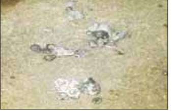
၂၁-၂၀၂၃ ရက်တွင် ပုသိမ်ကြီးမြို့နယ်ရှိ မြို့နယ်လှုပ်စစ်ရုံးအား အကြမ်းဖက်သူများက လက်လုပ်မိုင်းတစ်လုံး လာရောက်ပစ်ခတ်ခဲ့သည့် မှတ်တမ်းဓာတ်ပုံ။