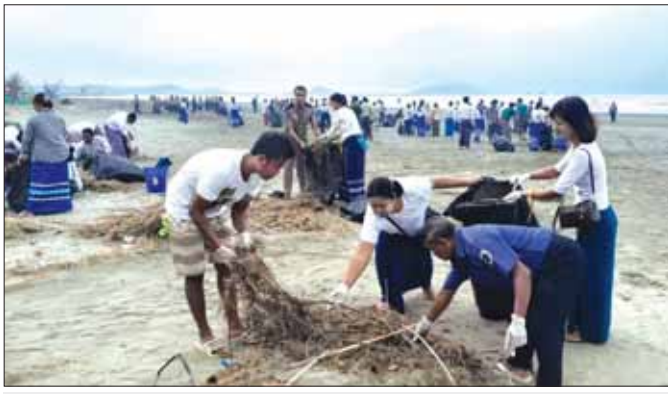
စစ်တွေကမ်းခြေသို့ ဝန်ထမ်းများ၊ လူမှုရေးအသင်းအဖွဲ့များ စုပေါင်း၍ သန့်ရှင်းရေး ဆောင်ရွက်ကြစဉ်။

ကြိုတင်ကျေးရွာ၏ ဘုန်းတော်ကြီးကျောင်း အောက်ထပ်မှာ အထူးကုဆရာဝန်ကြီးများအဖွဲ့က ဒေသခံတိုင်းရင်းသားများအား ဆေးဝါးကုသ၍ ကျန်းမာရေးစောင့်ရှောက်မှုပေးနေကြသည်။ မျက်စိအထူးကုအဖွဲ့၊ သွားနှင့် ခံတွင်း၊ သားဖွားမီးယပ်၊ အထွေထွေရောဂါစသည်ဖြင့် သူ့နေရာနှင့်သူ ရှိနေကြပြီး လူနာတွေကလည်း လာလိုက်ကြတာမှ ကျောင်းဝင်းတစ်ခုလုံး ပြည့်လျှံလျက်။ ဒုတိယဝန်ကြီးချုပ်နှင့် ပို့ဆောင်ရေးနှင့် ဆက်သွယ်ရေးဝန်ကြီးဌာန ပြည်ထောင်စုဝန်ကြီး ဗိုလ်ချုပ်ကြီး တင်အောင်စန်း၊ နယ်စပ်ရေးရာ ဝန်ကြီးဌာန ပြည်ထောင်စုဝန်ကြီး ဒုတိယဗိုလ်ချုပ်ကြီး ထွန်းထွန်းနောင်၊ လူမှုဝန်ထမ်း၊ ကယ်ဆယ်ရေးနှင့် ပြန်လည်နေရာချထားရေး ဝန်ကြီးဌာန၊ ပြည်ထောင်စုဝန်ကြီး ဒေါက်တာ သက်သက်ခိုင်၊ ရခိုင်ပြည်နယ် ဝန်ကြီးချုပ် ဦးထိန်လင်းနှင့် တာဝန်ရှိသူများက ကြိုတင်ကျေးရွာသို့ သွားရောက်ကာ အထူးကု ဆရာဝန်ကြီးများအဖွဲ့၏ ဆေးကုသမှုကို အားပေးကြည့်ရှုခဲ့ကြသည်။ မျက်စိအထူးကု ဆရာဝန်ကြီးများအဖွဲ့နှင့် မလှမ်းမကမ်းတွင် အသက် ၄၀ ခန့် အမျိုးသမီးတစ်ဦး ချိုင်းထောက်နှစ်ဖက်ကို အားပြု၍ ရပ်နေသည်။ သူ၏ လုံ့လပြည့်အနားစကို ကြမ်းနှင့်ထိလန့်ပါး ခပ်ရှည်ရှည် ဝတ်ထားသည်။ ခြေထောက်မှာ ဒဏ်ရာတစ်ခုခု ရထားလို့ ချိုင်းထောက်နဲ့အားပြုသွားနေရတာများလား။ သူလည်း အထူးကု ဆရာဝန်ကြီးတွေဆီမှာ ရောဂါတစ်ခုခု ပြစရာရှိလို့ လာတာဖြစ်မှာပေါ့လေ။ ထိုနေ့က သူ့နဲ့ပတ်သက်ပြီး ကရုဏာသက်မှုနှင့် စိတ်ဝင်စားမှုက ဤမျှလောက်သာ။ ပြည်ထောင်စုဝန်ကြီးများနှင့် အဖွဲ့လည်း ကြည့်စရာရှိတာကြည့်၊ အထူးကုဆရာဝန်ကြီးများကို နှုတ်ဆက်၊ ရွာသူရွာသားများကို အားပေးပြီးသကာလ စစ်တွေမြို့သို့ ပြန်လည်ထွက်ခွာခဲ့ကြသည်။