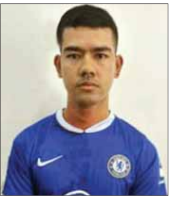
အကြမ်းဖက်လုပ်ငန်းများ ဆောင်ရွက်လျက်ရှိသည့် နတ်ဆိုး PDF အမည်ခံ အကြမ်းဖက်အဖွဲ့ ခေါင်းဆောင် ငြိမ်းချမ်းအောင် (ခ) အားသစ်။ (ပုသိမ်ကြီးမြို့နယ် အတွင်း အကြမ်းဖက် သတ်ဖြတ်မှု လေးကြိမ်၊ မိုင်းထောင်ဖောက်ခွဲမှု နှစ်ကြိမ် ဆောင်ရွက်ခဲ့)

နေပြည်တော် ဇူလိုင် ၁၂ နိုင်ငံတော်အစိုးရမှ အကြမ်းဖက်အုပ်စု အဖြစ် ကြေညာထားသည့် NUG ၊ CRPH နှင့် ၎င်းတို့၏ လက်ဝဲခံ PDF အမည်ခံ အကြမ်းဖက်အဖွဲ့များသည် ပြည်သူ့အတွက်ဟုသုံးနှုန်း၍ ရဟန်းသံဃာများ၊ ဆရာ ဆရာမများအပါအဝင် နိုင်ငံဝန်ထမ်းများနှင့် ပြည်သူများကို ရက်စက်စွာ လုပ်ကြံသတ်ဖြတ်ခြင်း၊ လူယက်ခြင်းများ၊ အပြစ်မဲ့ပြည်သူများ သေကျေပျက်စီးစေရန် ရည်ရွယ်ချက်ဖြင့် ပျော်ပွဲရွှင်ပွဲများ ပြုလုပ်နေသည့် နေရာများတွင် မိုင်းထောင်ဖောက်ခွဲခြင်းများ၊ နိုင်ငံတော်အစိုးရ၏