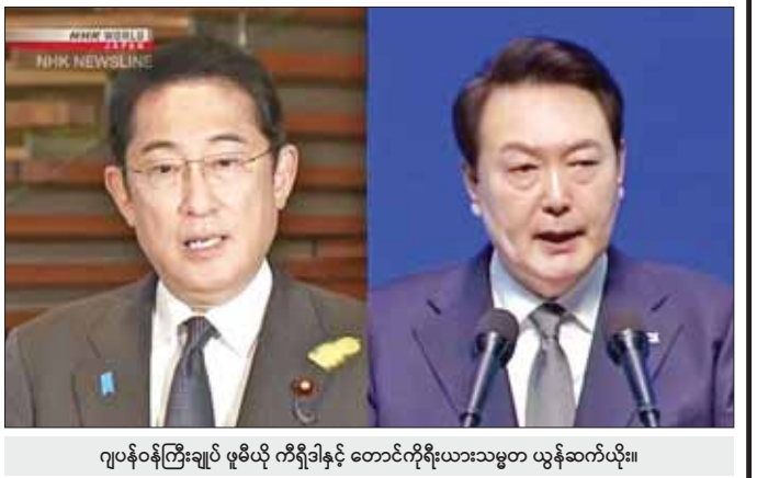
ဂျပန်ဝန်ကြီးချုပ် ဖူမိယို ကိရိုဒါနှင့် တောင်ကိုရီးယားသမ္မတ ယွန်ဆက်ယိုး။

ဦးနီးယက်စ် ဇူလိုင် ၁၂ လစ်သူယေးနီးယားနိုင်ငံ၌ ကျင်းပသည့် နေ့တိုး ထိပ်သီးအစည်းအဝေးတွင် ဂျပန်ဝန်ကြီးချုပ် ဖူမိယို ကိရိုဒါနှင့် တောင်ကိုရီးယားသမ္မတ ယွန်ဆက်ယိုး တို့ တွေ့ဆုံကြသည်ဟု သိရသည်။ ဖူကူရီးမား ဒိုင်အီချီ နှုတ်လမ်းထုတ်ဖော်ရာမှ သမုဒ္ဒရာအတွင်းသို့ စွန့်ပစ်သည့်သန့်စင်ထားသည့် ရေနှင့်ပတ်သက်၍ ဂျပန်နိုင်ငံ၏ အစီအစဉ်ကို ကိရိုဒါက ရှင်းပြခဲ့သည်။ နျူကလီးယားလောင်စာကို အေးခဲရန်အတွက် အသုံးပြုသောရေတွင် မိုးရေနှင့်မြေအောက်ရေများ ရောနှောပါဝင်ပြီး အဆိုပါစွန့်ပစ်ရေများမှာ စက်ရုံ တွင် စုပုံလာသည်။ ရေဒီယိုသတ္တိကြွပစ္စည်းများကို ဖယ်ရှားရန် အတွက် ရေကိုအသုံးပြုသော်လည်း ထိုရေထဲမှာမူ ကျန်ရစ်နေဆဲဖြစ်သည်။ ပင်လယ်အတွင်းသို့ ရေများမစွန့်ပစ်မီ ကမ္ဘာ့ ကျန်းမာရေးအဖွဲ့ကြီး၏ သောက်သုံးရေ အဆင့် သတ်မှတ်ချက် ခုနစ်ပုံ တစ်ပုံခန့်အထိ ထိုရေထဲမှ အဆင့်ကို လျှော့ချရန်အတွက် ရေကိုသန့်စင်ရန် ဂျပန်အစိုးရကစီစဉ်ထားသည်။ အင်န်အိတ်ချီကော