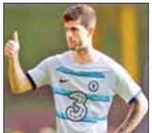
ချယ်ဆီးတိုက်စစ်ကစားသမား ပူလီဆစ်

အမေရိကန်တိုက်စစ်ကစားသမား ပူလီဆစ်သည် ချယ်ဆီးအသင်းမှ အေစီမီလန်အသင်းသို့ ပေါင်သန်း ၂၀ ဖြင့် အပြီးသတ်ပြောင်းရွှေ့ရန် နီးစပ်နေပြီဖြစ်ကြောင်း သိရသည်။ အသက် ၂၄ နှစ်အရွယ် အဆိုပါကစားသမားသည် ယခုသီတင်းပတ်အတွင်း မီလန်၌ ဆေးစစ်မှု ခံယူသွားဖွယ်ရှိသည်။ ချန်ပီယံလိဂ်ဆွတ်ခူး ပူလီဆစ်သည် ၂၀၁၉ ခုနှစ်တွင် ဒေါ့မန်အသင်းမှ ချယ်ဆီးအသင်းသို့ ပေါင် ၅၇ ဒသမ ၆ သန်း