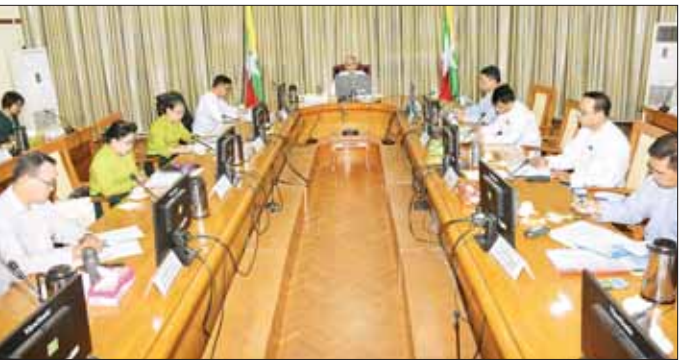
ကုန်စည်ပြင်ပများတွင် မြန်မာ့ပို့ကုန်များ ဝါဝင်ပြသနိုင်ရေးနှင့် ချိတ်ဆက်မှု ပိုမိုရရှိစေရေး၊ မိမိနိုင်ငံအတွက် အကျိုးရှိစေမည့် စီးပွားရေးဆိုင်ရာ သတင်းအချက်အလက်များ ကျယ်ပြန့်စွာ ရယူအသုံးပြုနိုင်ရေး၊ ပြည်တွင်းရှိ အသေးစား၊ အငယ်စား၊ အလတ်စား စီးပွားရေးလုပ်ငန်းရှင်များ၏ အကူအညီတောင်းခံ

နေပြည်တော် ဇူလိုင် ၁၂ စီးပွားရေးနှင့် ကူးသန်းရောင်းဝယ်ရေးဝန်ကြီးဌာန ပြည်ထောင်စုဝန်ကြီး ဦးအောင်နိုင်ဦးသည် ပြည်ပနိုင်ငံ ၁၂ နိုင်ငံရှိ မြန်မာသံမှူး/မြန်မာ ကောင်စီဝန်ချုပ်ရုံးများ၌ တာဝန်ထမ်းဆောင်နေသော စီးပွားရေးသံမှူး ၁၆ ဦးနှင့် ဆွစ်ဇာလန်နိုင်ငံ ဂျီနီဗာမြို့ ကမ္ဘာ့ကုန်သွယ်ရေးအဖွဲ့ဆိုင်ရာ မြန်မာအမြဲတမ်းကိုယ်စားလှယ်အဖွဲ့ရုံးတွင် တာဝန်ထမ်းဆောင်လျက်ရှိသည့် သံမှူးတို့ကို ယနေ့မ္မန်းလွဲပိုင်းတွင် Virtual စနစ်ဖြင့် တွေ့ဆုံသည်။ (ယာပုံ) တွေ့ဆုံစဉ် ပြည်ထောင်စုဝန်ကြီးက စီးပွားရေးသံမှူးများအနေဖြင့် မြန်မာ့ပို့ကုန်များ ဈေးကွက်ပိုမိုရရှိရေးအတွက် သက်ဆိုင်ရာနိုင်ငံများမှ အစိုးရဌာန အဖွဲ့အစည်းများ၊ သွင်းကုန်လုပ်ငန်းရှင်များနှင့် ထိတွေ့မှုပိုမိုရယူကာ ဈေးကွက်ဖြည့်တင်ရေးလုပ်ငန်းများ ဆောင်ရွက်ရေး၊ သက်ဆိုင်ရာ နိုင်ငံများ၏