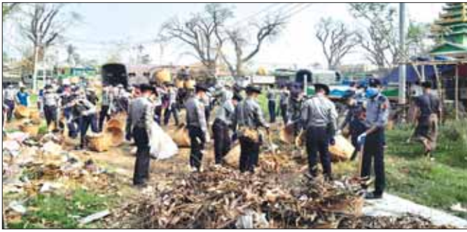
စစ်တွေမြို့၏ ကျက်သရေဆောင် အတုလမာရီနီ ပြည်လုံးချမ်းသာဘုရားကြီးဝင်းထဲ၌ မြန်မာနိုင်ငံ ရံတပ်ဖွဲ့ဝင်များ သန့်ရှင်းရေးဆောင်ရွက်ပေးနေစဉ်။