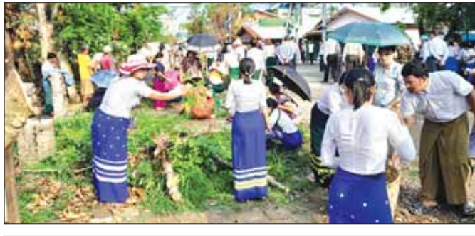
စစ်တွေမြို့တွင်းလမ်းများအား ဌာနဆိုင်ရာဝန်ထမ်းများ လူမှုရေးအသင်းအဖွဲ့များ စုပေါင်းသန့်ရှင်းရေး ဆောင်ရွက်ကြစဉ်။