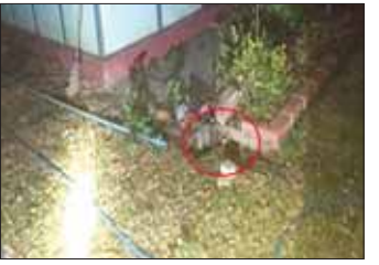
၃၁-၁-၂၀၂၂ ရက်တွင် ပုသိမ်ကြီးမြို့နယ်ရှိ မြို့နယ်စည်ပင်သာယာရေးအဖွဲ့ရုံးအား အကြမ်းဖက်သူများက လက်လုပ်မိုင်းတစ်လုံးဖြင့် ဖောက်ခွဲခဲ့သည့် မှတ်တမ်းဓာတ်ပုံ။