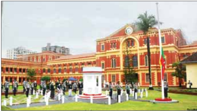
(၇၅)နှစ်မြောက် အာဇာနည်နေ့ ဝမ်းနည်းခြင်းအထိမ်းအမှတ်အဖြစ် ရန်ကုန်မြို့ဝန်ကြီးများရုံး (ယခင်အတွင်းဝန်ရုံး)၌ နိုင်ငံတော်အလံအား တိုင်ဝက်သို့ လျှောချလှူဒါန်း အခမ်းအနားကျင်းပမှုကိုတွေ့ရစဉ်။

နိုင်ငံရေးအခက်အခဲပြဿနာတွေကို နိုင်ငံရေးနည်းလမ်းနဲ့စေ့စပ်ဆွေးနွေး အဖြေရှာကြရာမယ့် အစား အကြမ်းဖက်ပါး၊ လူသတ်ပါးကို ကိုင်ခွဲပြီး လက်နက်အားကိုးနဲ့ဖြေရှင်းခဲ့ကြတဲ့ ဦးစောနဲ့ လက်ပါးစေအပေါင်းအဖော်တို့ရဲ့ လုပ်ရပ်ကြောင့် အမျိုးသားခေါင်းဆောင်ကြီး ဗိုလ်ချုပ်အောင်ဆန်းနဲ့ဝန်ကြီးများဟာ ကြေကွဲဖွယ်ရာအဖြစ်ဆိုးနဲ့ ကြုံခဲ့ကြရတာပဲ။