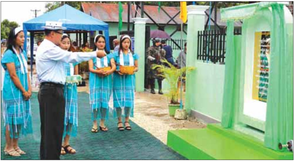
ရောင်းဝယ်ဖောက်ကားမှု အဆင်ပြေလွယ်ကူစေပြီး အလုပ်အကိုင် အခွင့်အလမ်းများလည်း ဖွံ့ဖြိုး တိုးတက်ရန် ရည်ရွယ်ကြောင်း ပြောကြားသည်။ ထို့နောက် ပြည်နယ်ဝန်ကြီးချုပ်၊ ပြည်နယ်တရား လွှတ်တော်တရားသူကြီးချုပ်၊ ပြည်နယ်ဝန်ကြီးများ နှင့် ပြည်နယ်အစိုးရအဖွဲ့ အတွင်းရေးမှူးတို့က ဈေးသစ်ကို ဖဲကြိုးဖြတ်ဖွင့်လှစ်ပြီး ပြည်နယ်ဝန်ကြီး ချုပ်က ဈေးသစ်ဆိုင်းဘုတ်နှင့် ကမ္ဘာ့မော်ကွန်းကို

ဘားအံ ဇူလိုင် ၆ ဘားအံမြို့နယ်ဘားကပ်ကျေးရွာ၌ ဘားကပ်ဈေးသစ် ဖွင့်ပွဲကို ဇူလိုင် ၅ ရက် ကကျင်းပရာ ကရင်ပြည်နယ် ဝန်ကြီးချုပ်ဦးစောမြင့်ဦး တက်ရောက်ဖွင့်လှစ်ပေးသည်။ ပြည်နယ်ဝန်ကြီးချုပ်က ဘားကပ်ဈေးသည် ဘားအံမြို့နှင့် တစ်ဖက်ကမ်း သံလွင်မြစ်ကူးတံတား လက်ဝဲဘက်တွင် တည်ရှိပြီး ဘားကပ်ကျေးရွာ၊ လင်းနီဂူ၊ ကော့ဂွန်းဂူ၊ ရသေ့ပျံဂူတို့နှင့် တစ်ဆက် တည်း တည်ရှိနေသော ဒေသတစ်ခုဖြစ်ကြောင်း၊ ဘားကပ်ကျေးရွာသည် စိုက်ပျိုးရေး လုပ်ငန်းများ အောင်မြင်ဖြစ်ထွန်းသည့် ကျေးရွာလည်း ဖြစ်ကြောင်း၊ ပြည်နယ်အစိုးရအနေဖြင့် ဒေသခံပြည်သူများ၏ လူမှုရေး၊ စီးပွားရေး၊ လမ်းပန်းဆက်သွယ်ရေး၊ လျှပ်စစ် မီး၊ သောက်သုံးရေ စိုက်ပျိုးရေး အလုပ်အကိုင် အခွင့် အလမ်းနှင့် ဒေသတွင်း ခရီးသွားလာရေးလုပ်ငန်းများ ဖွံ့ဖြိုးတိုးတက်ရေးအတွက် အစွမ်းကုန် ဖြည့်ဆည်း ဆောင်ရွက်ပေးလျက်ရှိကြောင်း၊ ဘားကပ်ဈေးသစ် ဖွင့်လှစ်ပေးခြင်းဖြင့် ကျေးရွာတစ်ရွာနှင့် တစ်ရွာ