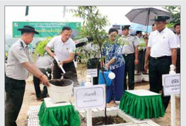
ရှမ်းပြည်နယ်(မြောက်ပိုင်း) လားရှိုးမြို့နယ်၌ ပြည်နယ်အဆင့် မိုးရာသီစုပေါင်းသစ်ပင်စိုက်ပွဲကို ဇူလိုင် ၅ ရက်က လားရှိုးမြို့ နည်းပညာတက္ကသိုလ်ဝင်းအတွင်း ကျင်းပရာ ပြည်နယ်အစိုးရ အုပ်ချုပ်ရေးအဖွဲ့ခွဲ(ရှမ်းမြောက်)ဥက္ကဋ္ဌ ဦးမျိုးကျော်နှင့် တာဝန်ရှိသူ များ၊ ဌာနဆိုင်ရာတာဝန်ရှိသူများ၊ လူမှုရေးအသင်းအဖွဲ့များ၊ မြို့မ မြို့ဖများနှင့် နည်းပညာတက္ကသိုလ် ဆရာ ဆရာမများ၊ ကျောင်းသား ကျောင်းသူများက ကျွန်း၊ ပိတောက်၊ သပြေတူတ၊ ချယ်ရီ၊ မဟော်ဂနီ၊ ခါတော်မီ၊ မဲလီ၊ ပန်းဝါနှင့် ကုံကော်ပျိုးပင် ၅၀၄ ပင်ကို စုပေါင်းစိုက်ပျိုးကြစဉ်။ ခရိုင်(ပြန်/ဆက်)

အတွက် ပညာသင် ထောက်ပံ့ ကြေးပေးအပ်ရာ ဌာနအလိုက် အမှုထမ်းငယ်များ ကိုယ်စား ဌာန တာဝန်ခံများက လက်ခံ ကြသည်။ ထို့နောက် အမှုထမ်းငယ်များ ကိုယ်စား အမှုထမ်းတစ်ဦးက ပညာသင်ထောက်ပံ့ကြေးပေးအပ် မှုနှင့်စပ်လျဉ်း၍ ကျေးဇူးတင် စကားပြောကြားပြီး အခမ်းအနား ကို ရုပ်သိမ်းလိုက်သည်။ အခမ်းအနားသို့ ကော်မရှင် ဒုတိယဥက္ကဋ္ဌ၊ ကော်မရှင်အဖွဲ့ဝင် များ၊ ကော်မရှင်ရုံး ညွှန်ကြားရေး မှူးချုပ်၊ ဒုတိယညွှန်ကြားရေးမှူး ချုပ်၊ ဌာနတာဝန်ခံများ၊ အမှုထမ်း များ တက်ရောက်ခဲ့ကြသည်။ သတင်းစဉ်