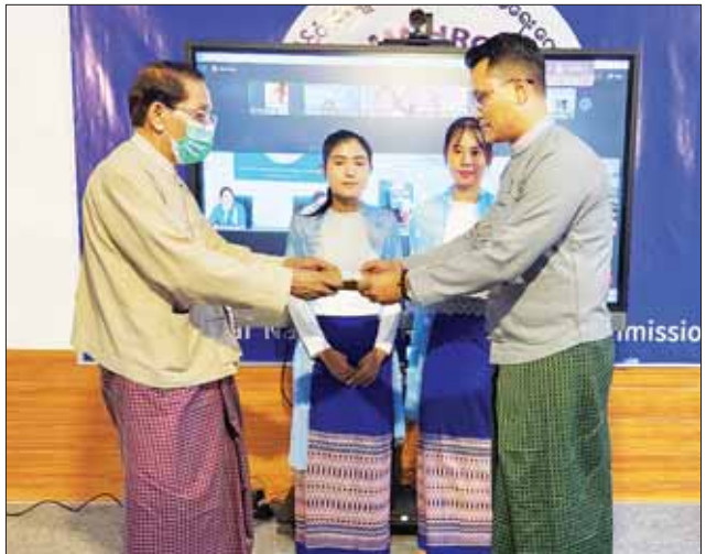
ထောက်ပံ့ကြေး ပေးအပ်ပြီး ရေးဌာနရှိ ဝန်ထမ်းများ၊ e-Gov- (အပေါ်ပုံ) ကော်မရှင်အဖွဲ့ဝင် များက နိုင်ငံတကာဆက်ဆံရေး ဌာနရှိ ဝန်ထမ်းများ၊ လူ့အခွင့် ပညာပေးရေးဌာနရှိ ဝန်ထမ်းများ၊ အရေး ကာကွယ်စောင့်ရှောက် ဥပဒေရေးရာဌာနရှိ ဝန်ထမ်းများ

နေပြည်တော် ဇူလိုင် ၆ ရန်ကုန်တိုင်းဒေသကြီး လှိုင်မြို့ နယ် မြန်မာနိုင်ငံ အမျိုးသား လူ့အခွင့်အရေး ကော်မရှင်ရုံးရှိ အမှုထမ်းငယ်များကို ၂၀၂၃-၂၀၂၄ ပညာသင်နှစ်အတွက် ပညာသင် ထောက်ပံ့ကြေး ပေးအပ်သည့် အခမ်းအနားကို ယနေ့ မွန်းလွဲ ၁ နာရီက ကော်မရှင်ရုံးရှိ Conference Room ၌ ကျင်းပသည်။ အခမ်းအနားတွင် လူ့အခွင့် အရေးကော်မရှင်ဥက္ကဋ္ဌ ဦးလှမြင့် က အမှာစကား ပြောကြားပြီး ကော်မရှင်ဒုတိယဥက္ကဋ္ဌက မုဒိတာ စကားပြောကြားသည်။ ထို့နောက် ကော်မရှင်ဥက္ကဋ္ဌ က စီမံရေးရာနှင့် ဘဏ္ဍာရေးဌာနရှိ ဝန်ထမ်းများအတွက် ပညာသင်