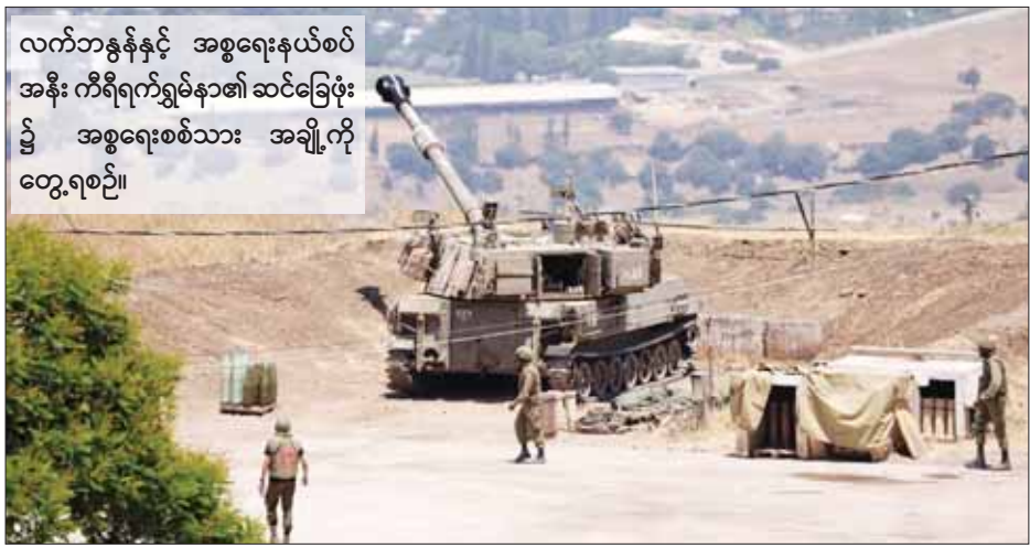
လက်ဘနွန်နှင့် အစွဲရောက်နယ်စပ် အနီး ကီရီရက်ရွှမ်နာ၏ ဆင်ခြေပုံ နှင့် အစွဲရောက်စစ်သား အချို့ကို တွေ့ရစဉ်။

ထားခြင်း မရှိသေးပေ။ အစွဲရောက်ပိုင်နက်၌ နယ်နိမိတ်နှင့် ကပ်လျက် တွင် ပေါက်ကွဲခဲ့သည့် လက်ဘနွန်နိုင်ငံမှ ဒုံးကျည် တစ်စင်းကို တုံ့ပြန်သည့်အနေဖြင့် ယင်းသို့ တိုက်ခိုက်ခြင်းဖြစ်ကြောင်း အစွဲရောက်စစ်တပ်မှ ပြောရေးဆိုခွင့်ရှိသူက ပြောကြားသည်။ အစွဲရောက် စစ်တပ်က နောက်ခံထားသည့် ဘူဒိုဇာတစ်စီး သည် နယ်စပ်တစ်လျှောက် အကာအကွယ်တစ်ခု တည်ဆောက်ရန်ကြိုးစားခဲ့သော်လည်း လက်ဘနွန် စစ်တပ်က ဆုတ်ခွာရန်ဖိအားပေးခဲ့ခဲ့ပြီး တစ်ရက် အကြာတွင် အဆိုပါ တိုက်ခိုက်မှုဖြစ်ပွားခဲ့ခြင်း ဖြစ်ကြောင်း သိရသည်။ ဆင်ဟွာ