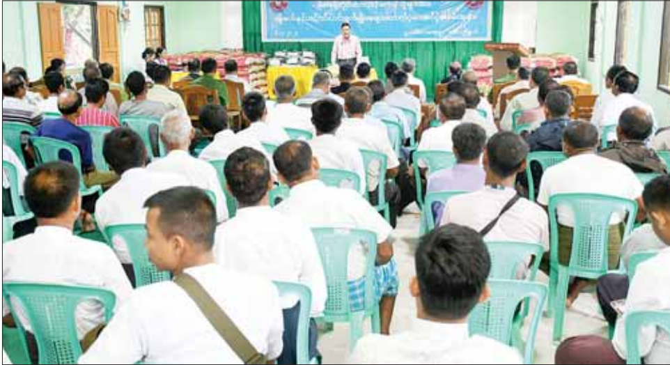
ရခိုင်ပြည်နယ်ဝန်ကြီးချုပ် ဦးထိန်လင်း စစ်တွေမြို့နယ် မိုခါမုန်တိုင်းဘေးသင့် တောင်သူများအား မျိုးစပါးနှင့် ဟင်းသီးဟင်းရွက်မျိုးစေ့များ ထောက်ပံ့ပေးအပ်ပွဲတွင် အမှာစကားပြောကြားစဉ်။

ထို့နောက် ပြည်နယ်ဝန်ကြီး ချုပ်နှင့်အဖွဲ့သည် အဆိုပါ ဘုန်းတော်ကြီးကျောင်း ဓမ္မာရုံ၌ ပြုလုပ်သည့် စစ်တွေမြို့နယ်မှ