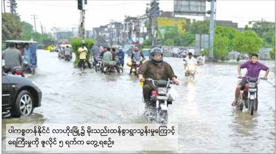
ပါကစ္စတန်နိုင်ငံ လာဟိုးမြို့၌ မိုးသည်းထန်စွာရွာသွန်းမှုကြောင့် ရေကြီးမှုကို ဇူလိုင် ၅ ရက်က တွေ့ရစဉ်။

ဒေသများ၌ မိုးသည်းထန်စွာ ရွာသွန်းခြင်းနှင့် လေပြင်းများ တိုက်ခတ်ခြင်းတို့ကြောင့် အိမ်များ ပျက်စီးခဲ့ကြောင်း ဒေသတွင်း မီဒီယာများက ဖော်ပြထားသည်။ ဇူလိုင် ၈ ရက်အထိ နိုင်ငံတစ်ဝန်း မိုးပိုလာမည်ဟု ခန့်မှန်းထား ကြောင်း အာဏာပိုင်များက ပြော ကြားသည်။