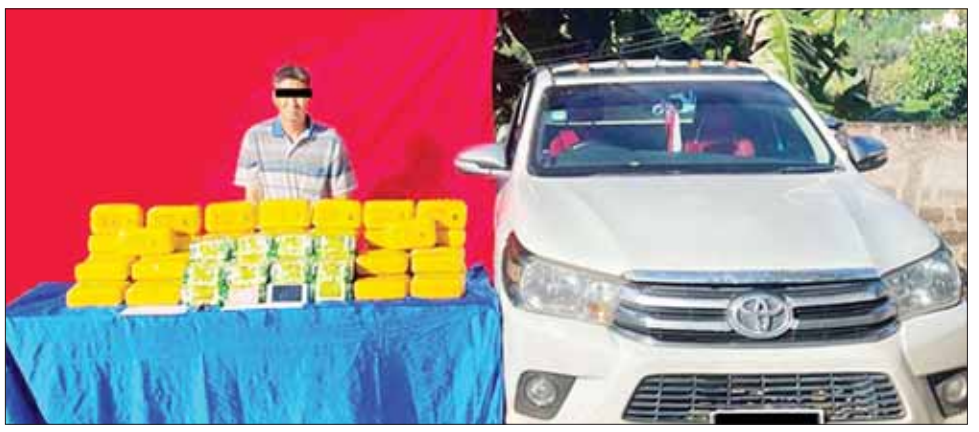
သိမ်းဆည်းရမိသည့် မူးယစ်ဆေးဝါးများနှင့်အတူ တွေ့ရစဉ်။

ဥပဒေအရ အရေးယူ စစ်ဆေး ဖော်ထုတ်ချက်အရ သိမ်းဆည်းရမိ မူးယစ်ဆေးဝါး များကို နမူနာမြို့နယ်မှ ကလေး မြို့နယ်သို့ သယ်ဆောင်ခြင်း ဖြစ်ကြောင်းသိရသဖြင့် ၎င်းအား ဥပဒေအရ အရေးယူထားရှိပြီး ကွင်းဆက် ပြစ်မှုကျူးလွန်သူ များကို ဆက်လက်စစ်ဆေး ဖော်ထုတ်လျက် ရှိကြောင်း မြန်မာနိုင်ငံရဲတပ်ဖွဲ့မှ သိရသည်။ သတင်းစဉ်