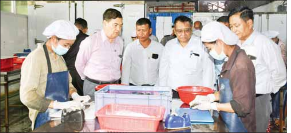
ရခိုင်ပြည်နယ်ဝန်ကြီးချုပ် ဦးထိန်လင်း ပုဏ္ဏားကျွန်းမြို့နယ် ကဏန်းပျော့မွေးမြူထုတ်လုပ်ရေးလုပ်ငန်း ဆောင်ရွက်နေမှု ကြည့်ရှုစစ်ဆေးစဉ်။

ရင်းရင်းနှီးနှီး နှုတ်ဆက်ကြသည်။ ထို့နောက် ပြည်နယ်ဝန်ကြီး ချုပ်နှင့်အဖွဲ့သည် ပုဏ္ဏားကျွန်းမြို့ စိုက်ပျိုးရေးဦးစီးဌာနရုံး အစည်း အဝေးခန်းမ၌ ကျင်းပသော မိုခါ မုန်တိုင်းဘေးသင့် တောင်သူများ အား မျိုးစပါးနှင့် ဟင်းသီး ဟင်းရွက် မျိုးစေ့များ ထောက်ပံ့ ပေးအပ်ပွဲသို့ တက်ရောက်ကြ သည်။ အခမ်းအနားတွင် ပြည်နယ်