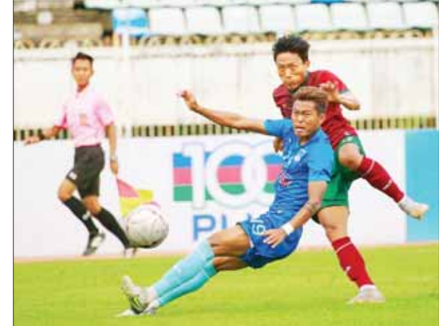
ရတနာပုံအသင်းနှင့် မြဝတီအသင်း ယှဉ်ပြိုင်ကစားစဉ်။

နေပြည်တော် ဇူလိုင် ၆ ၂၀၂၃ ရာသီ MNL အမှတ်ပေးပြိုင်ပွဲ ပွဲစဉ် (၁၁) နောက်ဆုံးနေ့ကို ဇူလိုင် ၆ ရက်က သုဝဏ္ဏတွင်း၌ ဆက်လက်ကျင်းပရာ ရတနာပုံအသင်းနှင့် မြဝတီအသင်း တစ်ဂိုးစီသရေကျခဲ့သည်။ နှစ်သင်းစလုံး နိုင်ပွဲရရှိရေးအတွက် ကြိုးပမ်းခဲ့သော်လည်း ဒုတိယပိုင်းသွင်းဂိုးများဖြင့် သရေကျခဲ့သည်။ မြဝတီအသင်းသည် ပွဲပြီးခါနီးအထိ ဦးဆောင်နိုင်ခဲ့သော်လည်း ၈၉ မိနစ်တွင် ပေးလိုက်ရသည့်ချေပဂိုးကြောင့် သရေတစ်မှတ်ဖြင့် ကျေနပ်ခဲ့ခြင်းဖြစ်သည်။ ပွဲစတင်တည်းက နှစ်သင်းစလုံး အပြန်အလှန်တိုက်စစ်ဆင်နိုင်သော်လည်း ပထမပိုင်းတွင် ရတနာပုံအသင်းက ဂိုးသွင်းခွင့် ပိုမိုရရှိခဲ့သည်။ စာမျက်နှာ ၉ ကော်လံ ၁ ၀