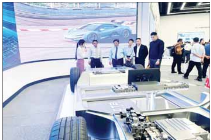
နေပြည်တော် ဇူလိုင် ၃

နေပြည်တော် ဇူလိုင် ၃ နေပြည်တော် မော်တော်ယာဉ်များ စတင် ထုတ်လုပ်ခဲ့သည့် အခြေအနေ၊ လက်ရှိ လုပ်ငန်းလည်ပတ်ဆောင် ရွက်နေမှု၊ ဈေးကွက်ရရှိမှုနှင့် လျှပ်စစ်အသုံးပြု မော်တော်ယာဉ် (EV)များ ထုတ်လုပ်နေမှုအခြေအနေ များကို ရှင်းလင်းတင်ပြကြသည်။ ယင်းနောက် ပြည်ထောင်စု ဝန်ကြီးက သိရှိလိုသည်များကို ထုတ်လုပ်လျက်ရှိသည့် စက်ရုံသို့ သွား ရောက်လေ့လာကြသည်။ (ဝဲပုံ) ပြည်ထောင်စုဝန်ကြီးနှင့် အဖွဲ့ အား အာဂပစ်ဖိတ်အရောင်းဌာန