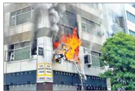
နှင့် တတိယထပ်မှာ ပေါက်ကွဲမှုကြောင့် မီးလောင်ပျက်စီးသွားကြောင်း၊ ပေါက်ကွဲမှုဖြစ်ပွားရာနေရာသည်ရုံးခန်းနှင့် စားသောက်ဆိုင် များစွာရှိကြောင်း သိရသည်။ ပေါက်ကွဲမှု ဖြစ်ပွားရခြင်း အကြောင်းရင်းကို စုံစမ်းစစ်ဆေးနေဆဲဖြစ်သည်။ ဆင်ယူ

တိုကျိုမြို့ ရဲတပ်ဖွဲ့၏ ထုတ်ပြန်ချက်အရ ပေါက်ကွဲမှုကြောင့် လေးဦးအသေစားထိခိုက်ဒဏ်ရာရရှိခဲ့ပြီး ၎င်းတို့ထဲမှ နှစ်ဦးမှာ လမ်းသွားလမ်းလာများဖြစ်ပြီး ကျန်နှစ်ဦးမှာ ပေါက်ကွဲမှုဖြစ်ပွားသော စားသောက်ဆိုင်မှ အလုပ်သမားများဖြစ်ကြောင်း သိရသည်။ အရေးပေါ်ထွက်ပေါက်မှတစ်ဆင့် ထိခိုက်ဒဏ်ရာရရှိသူ သုံးဦး ထွက်ပြေး လွတ်မြောက်သွားသည်ကို သတင်းထောက်များက မြင်တွေ့ခဲ့သည်ဟု ဆိုသည်။ မီးသတ်ဌာန၏ ထုတ်ပြန်ချက်အရ အဆောက်အအုံ၏ ဒုတိယထပ်