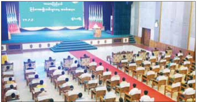
ကယားပြည်နယ်ဝန်ကြီးချုပ် ဦးစော်မျိုးတင် မြန်မာအမျိုးသမီးများနေ့ အထိမ်းအမှတ် အခမ်းအနားတွင် အမှာစကား ပြောကြားစဉ်။

အဖွဲ့အစည်းများမှ တာဝန်ရှိပုဂ္ဂိုလ်များ၊ ဌာနဆိုင်ရာ တာဝန်ရှိသူများနှင့် ဖိတ်ကြားထားသည့် ဧည့်သည်တော်များ တက်ရောက်ကြသည်။ ဦးစွာ တိုင်းဒေသကြီး၊ ပြည်နယ် ဝန်ကြီးချုပ်များက အမှာစကား ပြောကြားကြပြီး ယင်းနောက် အမျိုးသမီးများ ဖွံ့ဖြိုးတိုးတက်ရေးဆိုင်ရာ မြန်မာအမျိုးသမီးအရေးကို ဆောင်ရွက်နေကြသည့်