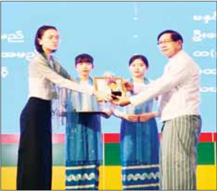
ကြည့်ခိုင်းနှင့် တက်ရောက်လာကြသူများက ရတနာတန်းဝင်ပင်၊ နှစ်ရှည် သီးနှံပင်နှင့် အရိပ်ရလေကပင် စုစုပေါင်း ၈၁၀ တို့ကို စုပေါင်းစိုက်ပျိုးခဲ့ကြကြောင်း သတင်းရရှိသည်။

ထို့ပြင် မြန်မာအမျိုးသမီးများနေ့ အထိမ်းအမှတ်အဖြစ် ဧရာဝတီတိုင်းဒေသကြီး ပုသိမ်မြို့ရှိ ကွန်ပျူတာတက္ကသိုလ်ဝင်အတွင်း၌ ၂၀၂၃ ခုနှစ် မိုးရာသီသစ်ပင်စိုက်ပျိုးပွဲ ပြုလုပ်ရာ တိုင်းဒေသကြီး ဝန်ကြီးချုပ် ဦးတင်မောင်ဝင်း၊ အနောက်တောင်တိုင်းစစ်ဌာနချုပ်တိုင်းမှူး ဗိုလ်မှူးချုပ်