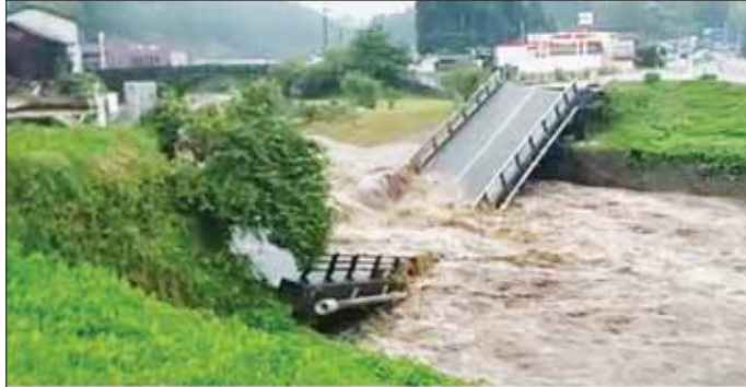
ကျူးရွာဒေသ၌ မိုးသည်းထန်စွာရွာသွန်းပြီး ရေများတစ်ဟုန်ထိုး ထိုးဆင်းလာသောကြောင့် တံတားတစ်စင်း ပြိုကျပြီး ရေနောက်ပါတော့မည်ကို တွေ့ရစဉ်။

မြေပြိုခြင်းများနှင့် ရေကြီးခြင်းများကြောင့် သစ်ပင်များ အမြစ်ကျွတ်ထွက်လဲကြကုန်ပြီး အနီးဝန်းကျင်ဒေသရှိ ဓာတ်တိုင်များလည်း လဲပြိုခဲ့သည်။ လွန်ခဲ့သော လေးရက်အတွင်း အဆိုပါဒေသတစ်ဝန်း၌ မိုးရေချိန်မှာ ၆၀၀ မီလီမီတာ ကျော်လွန်ရောက်ရှိ မှတ်တမ်းတင်ခဲ့သည်။ အဆိုပါမိုးရေချိန်သည် ဇူလိုင် တစ်လလုံးရွာသွန်းသော မိုးရေချိန်ကို ကျော်လွန်သွားခဲ့သည်။ ကျူးရွာ တောင်ပိုင်းတွင် လေဆိုင်စုံများ ဆက်လက်တည်ရှိနေသောကြောင့် မိုးအဆက်မပြတ် ရွာသွန်းမှုများ ဆက်လက်ဖြစ်ပွားမည်ဟု ခန့်မှန်းခဲ့သည်။ ဇူလိုင် ၄ ရက်အထိ ၂၄ နာရီ ကာလအတွင်း မိုးရေချိန် ၃၀၀ မီလီမီတာအထိ ရောက်ရှိမည်ဟု ခန့်မှန်းထားသည်။