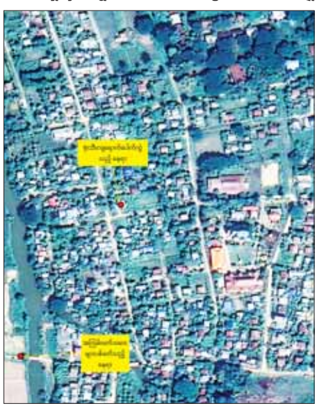
ကောလင်းမြို့အတွင်းသို့ PDF အမည်ခံအကြမ်းဖက်သမားများ ပစ်ခတ်ခဲ့သည့် လက်နက်ကြီးကျည်များ ကျရောက်ပေါက်ကွဲခဲ့သည့် နေရာပြပုံ။

နေပြည်တော် ဇူလိုင် ၃ စစ်ကိုင်းတိုင်းဒေသကြီး ကောလင်းမြို့အတွင်းသို့ PDF အမည်ခံ အကြမ်းဖက်သမားများက ဇူလိုင် ၁ ရက် ညပိုင်းတွင် လက်နက်ကြီးများဖြင့် ပစ်ခတ်မှုကြောင့် အသက်ရှစ်နှစ်အရွယ် ကလေးငယ် တစ်ဦးအပါအဝင် အပြစ်မဲ့ အရပ်သားပြည်သူသုံးဦး သေဆုံးပြီး တစ်ဦး ထိခိုက်ဒဏ်ရာ ရရှိခဲ့ကြောင်း သိရှိရသည်။