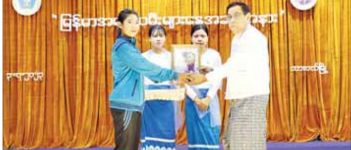
တနင်္သာရီတိုင်းဒေသကြီး ဝန်ကြီးချုပ် ဦးမြတ်ကို (၃၂)ကြိမ်မြောက် အရှေ့တောင်အာရှအားကစားပြိုင်ပွဲတွင် ဆုတံဆိပ်ရရှိသူအား ဆုချီးမြှင့်ပေးအပ်စဉ်။

ပြုသည်။ ဆက်လက်ပြီး တိုင်းဒေသကြီး၊ ပြည်နယ်များအတွင်း ပညာရေး၊ အားကစား ထူးချွန်ဆုရသူများအား ဂုဏ်ပြုဆုတံဆိပ်နှင့် ဂုဏ်ပြုလက်မှတ်များ ချီးမြှင့်ပေးအပ်ကြသည်။ ယင်းနောက် တိုင်းဒေသကြီး၊ ပြည်နယ် ဝန်ကြီး