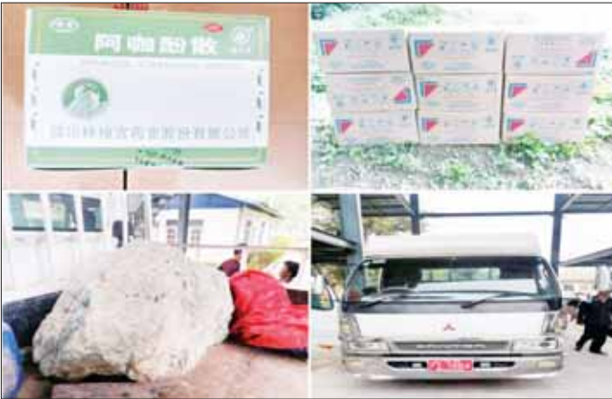
ရမ်းပြည်နယ်၌ ဖမ်းဆီးရမိမှု။

နေပြည်တော် ဇူလိုင် ၃ တရားမဝင်ကုန်သွယ်မှု တိုက်ဖျက်ရေး ဦးဆောင်ကော်မတီ၏ ကြီးကြပ်ကွပ်ကဲမှုဖြင့် တရားမဝင်ကုန်သွယ်မှုများကို ဥပဒေနှင့်အညီ ထိရောက်စွာ တားဆီးအရေးယူနိုင်ရေး ဆောင်ရွက်လျက်ရှိရာ ဇွန် ၃၀ ရက်က ရှမ်းပြည်နယ် တရားမဝင်ကုန်သွယ်မှုတိုက်ဖျက်ရေးအထူးအဖွဲ့၏ စီမံခန့်ခွဲမှုဖြင့် တာဝန်ကျ ပူးပေါင်းအဖွဲ့များက စစ်ဆေးမှုများ ဆောင်ရွက်ခဲ့ရာ လားရှိုးမြို့ရောင်လမ်း၊ နမူတူလမ်းဆုံအနီး၌ မူဆယ်မြို့မှ မန္တလေးမြို့သို့ မောင်းနှင်လာသည့် မော်တော်ယာဉ် တစ်စီးပေါ်မှ စာမျက်နှာ ၁၇ ကော်လံ ၁