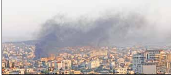
ဂျနင်းမြို့၌ အစွရေးလေကြောင်းတိုက်ခိုက်မှုကြောင့် ဒုက္ခသည်စခန်းတစ်ခုမှ မီးခိုးများထွက်နေသည်ကို ဇူလိုင် ၃ ရက်က တွေ့ရစဉ်။

အဝေးပြုလုပ်ခဲ့ကြောင်း အစွရေးဇေဒီယိုက ထုတ်ပြန်ထားသည်။ နေတန်ယာဟုက ၎င်း၏အစိုးရအဖွဲ့ဖွဲ့စည်းသည့်အချိန်မှစကာ ပါလက်စတိုင်းလူမျိုး အများအပြား သတ်ဖြတ်မှုကို ကြားဝါခဲ့ပြီး အခြေချနေထိုင်သူများကို ၎င်းတို့ ပြည်သူများအပေါ် ရာဇဝတ်မှုများ ကျူးလွန်ရန် တွန်းအားပေးကြောင်း ပါလက်စတိုင်းနိုင်ငံခြားရေးဝန်ကြီးဌာနက ထုတ်ပြန်ချက်တွင် ပြောကြားသည်။ ဇန်နဝါရီလမှစကာ ပါလက်စတိုင်းဘက်က တိုက်ခိုက်မှုကြောင့် အစွရေးလူမျိုး ၂၄ ဦး