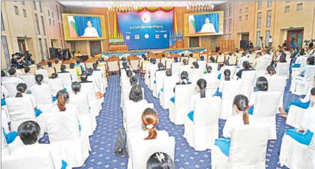
နိုင်ငံတော်စီမံအုပ်ချုပ်ရေးကောင်စီဥက္ကဋ္ဌ နိုင်ငံတော်ဝန်ကြီးချုပ် ဗိုလ်ချုပ်မှူးကြီး မင်းအောင်လှိုင် Video Message ဖြင့် အဖွင့်မိန့်ခွန်းပြောကြားစဉ်။

ဆက်လက်၍ မြန်မာနိုင်ငံလုံးဆိုင်ရာ အမျိုးသမီးကော်မတီဥက္ကဋ္ဌ လူမှုဝန်ထမ်း၊ ကယ်ဆယ်ရေးနှင့် ပြန်လည်နေရာချထားရေးဝန်ကြီးဌာန ပြည်ထောင်စုဝန်ကြီး ဒေါက်တာသက်သက်ခိုင်က အမျိုးသမီးများ ဖွံ့ဖြိုးတိုးတက်ရေး၊ အမျိုးသမီးအခွင့်အရေး မြှင့်တင်ဖော်ဆောင်ရေးနှင့် အမျိုးသမီးများအပေါ် အကြမ်းဖက်မှု တုံ့ပြန်တားဆီးကာကွယ်ရေးဆိုင်ရာ ဆောင်ရွက်ချက်များနှင့်စပ်လျဉ်း၍ အမျိုးသမီးများအား နည်းမျိုးစုံဖြင့် ခွဲခြားမှုပျောက်ရေးဆိုင်ရာ ကုလသမဂ္ဂကုန်စဉ်ရှင်း (UNCEDAW) အပေါ် မြန်မာနိုင်ငံမှ ၁၉၉၇ ခုနှစ်တွင် အဖွဲ့ဝင်နိုင်ငံအဖြစ် ပါဝင်ခဲ့ပြီး အစီရင်ခံစာတင်သွင်းနိုင်ရေးအတွက် ဆောင်ရွက်လျက်ရှိရာ 2 nd Draft အဆင့်သို့ ရောက်ရှိနေပြီဖြစ်ပါကြောင်း အာဆီယံဒေသတွင်း ဆောင်ရွက်ချက်များအဖြစ် ASEAN Ministerial Meeting on Women ကို ၂၀၂၃ ခုနှစ်တွင် မြန်မာနိုင်ငံမှ အိမ်ရှင်အဖြစ် ကျင်းပနိုင်ရန် ဆောင်ရွက်လျက်ရှိပါကြောင်း၊ ဆက်လက်ပြီး အာဆီယံအမျိုးသမီးကော်မတီ၊ အာဆီယံအမျိုးသမီးနှင့် ကလေးသူငယ်အခွင့်အရေးများ မြှင့်တင်ရေးနှင့် ကာကွယ်စောင့်ရှောက်ရေးကော်မရှင် အပါအဝင် အာဆီယံလူမှုဝန်ထမ်းနှင့် ဖွံ့ဖြိုးတိုးတက်ရေးဆိုင်ရာ ဝန်ကြီးများအဆင့် အစည်းအဝေးတို့တွင် ပါဝင်ဆောင်ရွက်လျက်ရှိပြီး လုပ်ငန်းစီမံချက်များအပေါ် အကောင်အထည်ဖော်ဆောင်ရွက်လျက်ရှိကြောင်း ပြောကြားပြီး အမျိုးသမီးဖွံ့ဖြိုးတိုးတက်ရေးဆိုင်ရာ အမျိုးသားအဆင့် မဟာဗျူဟာစီမံကိန်း (၂၀၂၃-၂၀၂၅) ရေးဆွဲဆောင်ရွက်လျက်ရှိသည့် အခြေအနေနှင့် ပဋိပက္ခအတွင်း လိင်ပိုင်းဆိုင်ရာအကြမ်းဖက်မှု တားဆီးကာကွယ်ရေးနှင့် တုံ့ပြန်ဆောင်ရွက်ရေးဆိုင်ရာ အမျိုးသားအဆင့် လုပ်ငန်းစီမံချက်ဆောင်ရွက်