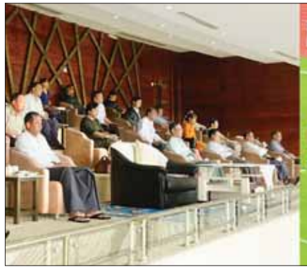
အမြဲတမ်းအတွင်းဝန်များ၊ ညွှန်ကြားရေးမှူးချုပ်များ၊ ပါမောက္ခချုပ်များ၊ ဒုတိယညွှန်ကြားရေးမှူးချုပ်များ၊ ပြိုင်ပွဲကျင်းပရေး ကော်မတီဝင်များနှင့် တာဝန်ရှိသူများ၊ ပြိုင်ပွဲဝင်အသင်းများမှ အားကစားသမားများ၊ တက္ကသိုလ် ကျောင်းသား ကျောင်းသူ၊ ဆရာ ဆရာမများ၊ သက်ဆိုင်ရာ ဝန်ကြီးဌာနများမှ ဝန်ထမ်းမိသားစုများနှင့် ဝါသနာရှင် ပြည်သူများ တက်ရောက် ကြည့်ရှုအားပေးကြသည်။

ယနေ့ကျင်းပသည့် အကြံပြုလုပ်လှပွဲများ ယှဉ်ပြိုင်ကစားနေမှုကို နယ်စပ်ရေးရာဝန်ကြီးဌာန ပြည်ထောင်စုဝန်ကြီး ဒုတိယဗိုလ်ချုပ်ကြီး တွန်းတုန်းနောင် (အပေါ်ယာပုံ) စိုက်ပျိုးရေး၊ မွေးမြူရေးနှင့် ဆည်မြောင်း ဝန်ကြီးဌာန ပြည်ထောင်စုဝန်ကြီး ဦးမင်းနောင်၊ ဒုတိယဝန်ကြီးများ၊