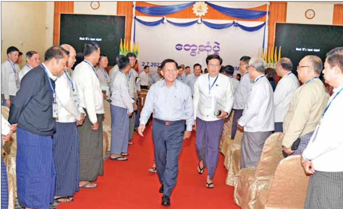
နိုင်ငံတော်စီမံအုပ်ချုပ်ရေးကောင်စီဥက္ကဋ္ဌ နိုင်ငံတော်ဝန်ကြီးချုပ် ဗိုလ်ချုပ်မှူးကြီး မင်းအောင်လှိုင် ပြည်ထောင်စုသမ္မတမြန်မာနိုင်ငံ ကုန်သည်များနှင့် စက်မှုလက်မှုလုပ်ငန်းရှင်များအသင်းချုပ် (UMFCCI) ညီနောင်အသင်းအဖွဲ့များမှ တာဝန်ရှိသူများအား ရင်းနှီးနှီးနှီးနှီးဆက်ဆံခဲ့သည်။

နေပြည်တော် ဇူလိုင် ၂ နိုင်ငံတော် စီမံအုပ်ချုပ်ရေးကောင်စီ ဥက္ကဋ္ဌ နိုင်ငံတော်ဝန်ကြီးချုပ် ဗိုလ်ချုပ်မှူးကြီး မင်းအောင်လှိုင်သည် ပြည်ထောင်စုသမ္မတ မြန်မာနိုင်ငံတော် ကုန်သည်များနှင့် စက်မှုလက်မှုလုပ်ငန်းရှင်များ အသင်းချုပ် (UMFCCI) ညီနောင်အသင်းအဖွဲ့များမှ တာဝန်ရှိသူများအား ယနေ့ နံနက် ၉ နာရီခွဲတွင် ရန်ကုန်မြို့၊ ကုန်သည်များနှင့် စက်မှုလက်မှုလုပ်ငန်းရှင်များအသင်းချုပ် (UMFCCI) ရှိ မင်္ဂလာခန်းမ၌ တွေ့ဆုံ၍ နိုင်ငံစီးပွားမြှင့်တင်နိုင်ရေး ကိစ္စရပ်များကို ကဏ္ဍအလိုက် ရင်းနှီးပွင့်လင်းစွာ ဆွေးနွေးခဲ့သည်။ အဆိုပါ တွေ့ဆုံပွဲသို့ နိုင်ငံတော် စီမံအုပ်ချုပ်ရေးကောင်စီ ဥက္ကဋ္ဌ နိုင်ငံတော်ဝန်ကြီးချုပ်နှင့် အတူ ကောင်စီတွဲဖက်အတွင်းရေးမှူး ဒုတိယဗိုလ်ချုပ်ကြီး ရဲဝင်းဦး၊ ကောင်စီဝင်များ ဖြစ်ကြသည့် ဒုတိယဗိုလ်ချုပ်ကြီး မိုးမြင့်ထွန်း၊ ဒုတိယဝန်ကြီးချုပ်နှင့် စီမံကိန်းနှင့် ဘဏ္ဍာရေးဝန်ကြီးဌာန စာမျက်နှာ ၃ ကော်လံ ၁