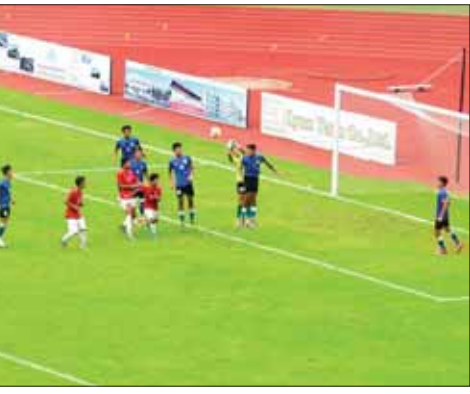
နေရာလှပွဲစဉ်များအဖြစ် နယ်စပ်ရေးရာဝန်ကြီးဌာနအသင်းနှင့် စိုက်ပျိုး ရေး၊ မွေးမြူရေးနှင့် ဆည်မြောင်းဝန်ကြီးဌာနအသင်းတို့ ယှဉ်ပြိုင်ကစား ကြမည်ဖြစ်ပြီး ညနေပိုင်းတွင် ၂၀၂၃ ခုနှစ် ဝန်ကြီးဌာနပေါင်းစုံ တက္ကသိုလ် များ ဘောလုံးပြိုင်ပွဲ ဗိုလ်လှပွဲအဖြစ် ပညာရေးဝန်ကြီးဌာန (က) အသင်း နှင့် သယံဇာတနှင့် သဘာဝပတ်ဝန်းကျင်ထိန်းသိမ်းရေးဝန်ကြီးဌာန အသင်းတို့ ဆက်လက်ယှဉ်ပြိုင် ကစားကြမည်ဖြစ်ကြောင်း သိရသည်။