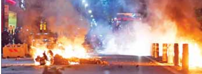
ပြင်သစ်နိုင်ငံ၌ အဓိကရုဏ်းဖြစ်ပွားမှုအတွင်း မီးလောင်မှုများကို ဇူလိုင် ၁ ရက်က တွေ့ရစဉ်။

ရဲတပ်ဖွဲ့ကို ဆန့်ကျင်ဆန္ဒပြမှုများ စတင်ပေါ်ပေါက်လာခဲ့ခြင်း ဖြစ်သည်။ ဇူလိုင် ၁ ရက် နံနက်ပိုင်းအထိ ဆန္ဒပြမှုများ ဆက်လက်ဖြစ်ပွားနေကြောင်းနှင့် အချို့ဆန္ဒပြသူများမှာ အကြမ်းဖက်အသွင် ပြောင်းလဲလာကြကြောင်း ပြည်ထဲရေးဝန်ကြီးဌာနမှ တာဝန်ရှိသူများက ပြောသည်။ ထို့ပြင် အခြေအနေကို ပြုလုပ်သော ဆယ်ကျော်သက် ဈာပနအခမ်းအနား၌ လူအများအပြား လာရောက်ခဲ့ကြသည်ဟု သိရသည်။ အင်န်အိတ်ချ်ကော