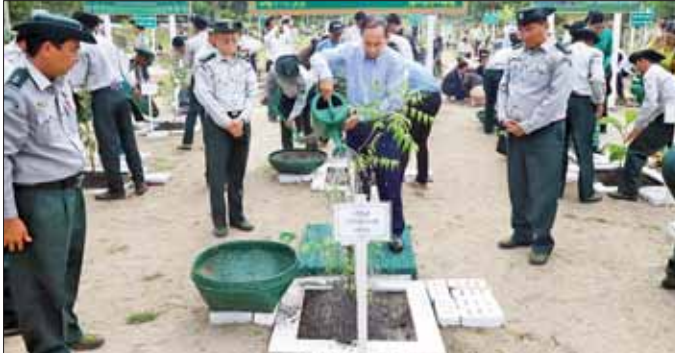
ခုနှစ် မိုးရာသီ စုပေါင်းသစ်ပင် စိုက်ပျိုးပွဲတော် အခမ်းအနားသို့ တက်ရောက်ကြသည်။ ရှေးဦးစွာ တိုင်းဒေသကြီး ဝန်ကြီးချုပ်က မုံရွာတက္ကသိုလ် ပါမောက္ခချုပ်ထံ တမာပျိုးပင် ကိုလှည်းကောင်း၊ တိုင်းဒေသ ကြီး လုံခြုံရေးနှင့် နယ်စပ်ရေးရာ ဝန်ကြီး၊ တိုင်းဒေသကြီး သယံ ဇာတရေးရာဝန်ကြီးတို့က တိုင်း ဒေသကြီးအဆင့် ဌာနဆိုင်ရာ များထံ ပျိုးပင်များ ပေးအပ် ကြသည်။ ဆက်လက်၍ တိုင်းဒေသကြီး ဝန်ကြီးချုပ်က တမာပျိုးပင်အား စိုက်ပျိုးပေးပြီး (အပေါ်ပုံ) တိုင်း ဒေသကြီး အစိုးရအဖွဲ့ဝင်များ၊ ဝန်ထမ်းများနှင့် တာဝန်ရှိသူများ က သတ်မှတ်နေရာများတွင် ပျိုးပင် များအား တပျော်တပေါ့ စိုက်ပျိုး ပေးကြပြီး တိုင်းဒေသကြီး ဝန်ကြီး ချုပ်နှင့် တာဝန်ရှိသူများက စုပေါင်း သစ်ပင် စိုက်ပျိုးပေးနေမှုများကို လိုက်လံ ကြည့်ရှုအားပေးသည်။ အဆိုပါ သစ်ပင် စိုက်ပျိုး ပွဲတော်တွင် နှစ်ပေနှင့်အထက် နှစ်နှစ်သားအရွယ်ရှိ သစ်ပင်မျိုး ပေါင်း ၁၂ မျိုး၊ စုစုပေါင်းပျိုးပင် ၇၀၀ အား စိုက်ပျိုးပေးကြသည်။ တိုင်းဒေသကြီး (ပြန်/ဆက်)

မုံရွာ ဇူလိုင် ၂ စစ်ကိုင်းတိုင်းဒေသကြီး မုံရွာမြို့ ပြည်ထောင်စု လမ်းအမှတ် ၂ နိုင်လွန်ကတ္တရာ လမ်းသစ်ဖွင့်ပွဲ အထိမ်းအမှတ် ဂေါက်သီးရိုက် ပြိုင်ပွဲကို ဇူလိုင် ၂ ရက်က မုံရွာမြို့ ဂေါက်ကလပ်၌ ကျင်းပရာ အခမ်း အနားသို့ တိုင်းဒေသကြီး ဝန်ကြီး ချုပ် ဦးမြတ်ကျော်၊ အနောက် မြောက်တိုင်းစစ်ဌာနချုပ် တိုင်းမှူး ဗိုလ်ချုပ် သန်းထိုက်၊ တိုင်းဒေသ ကြီး အစိုးရအဖွဲ့ဝင်များ၊ တိုင်း ဒေသကြီးအဆင့် ဌာနဆိုင်ရာများ နှင့် ဂေါက်သီးရိုက်အားကစား သမားများ တက်ရောက်ကြသည်။ ရှေးဦးစွာ တိုင်းဒေသကြီး ဝန်ကြီးချုပ်နှင့် တိုင်းမှူးတို့က စုပေါင်းဂေါက်ရိုက်၍ အခမ်းအနား ကို ဖွင့်လှစ်ပေးသည်။ ထို့အပြင် တိုင်းဒေသကြီး ဝန်ကြီးချုပ်နှင့် တာဝန်ရှိသူများ သည် ဇူလိုင် ၁ ရက်က မုံရွာ တက္ကသိုလ်၌ ကျင်းပသော ၂၀၂၃