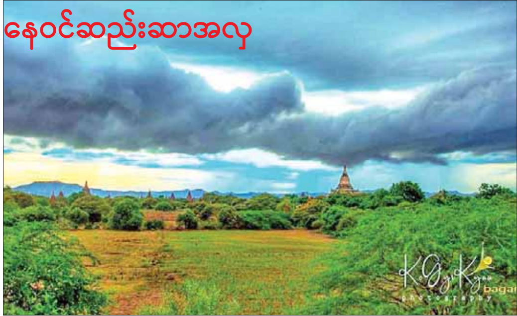
မိုးရာသီကာလတွင် မြင်တွေ့ရသော ပုဂံဒေသ၏ ရှုခင်းအလှများ။

ဟိုးအရင်ကာလတွေမှာတော့ နေဝင်ဆည်းဆာအလှကို ရွှေဆံတော်ဘုရားပေါ်ကနေ မကြည့်ဖြစ်လိုက်ဖူးရင် ပုဂံကိုရောက်တာဟာ ရောက်ရကျိုး