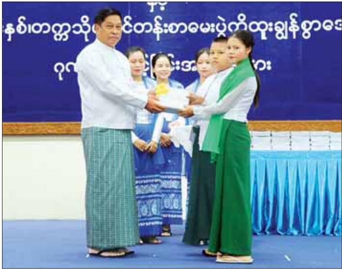
ပို့ဆောင်ရေးနှင့် ဆက်သွယ်ရေးဝန်ကြီးဌာနမှ ဝန်ထမ်းများ၏ သားသမီးများအား ဂုဏ်ပြုချီးမြှင့်ခြင်းနှင့် အခြေခံပညာ ကျောင်းသားကျောင်းသူများအား ကျောင်းသုံးစာရေးကိရိယာများ ပေးအပ်ခြင်းအခမ်းအနားကျင်းပနေပုံ။

ယင်းနောက် ပြည်ထောင်စုဝန်ကြီးနှင့် ဇနီး၊ ဒုတိယဝန်ကြီးများနှင့် ဇနီးများက ၂၀၂၂-၂၀၂၃ ပညာသင်နှစ် တက္ကသိုလ်ဝင်စာမေးပွဲတွင် ထူးချွန်စွာ အောင်မြင်ခဲ့ကြသည့် ဂုဏ်ထူးရရှိသူ ကျောင်းသားကျောင်းသူ ၁၆၂ ဦးကို ဂုဏ်ပြုဆုများ ချီးမြှင့်ပေးအပ်ပြီး ၂၀၂၃-၂၀၂၄ ပညာသင်နှစ်အခြေခံပညာကျောင်းများတွင် ပညာသင်ကြားနေကြသည့် ဝန်ကြီးဌာနမှ ဝန်ထမ်းများ၏ သားသမီး ကျောင်းသားကျောင်းသူ ၁၅၈၈ ဦးကို ကျောင်းသုံးစာရေးကိရိယာများ ထောက်ပံ့ပေးအပ်သည်။ (အပေါ်ယာပုံ) ထို့နောက် ပို့ဆောင်ရေးနှင့်