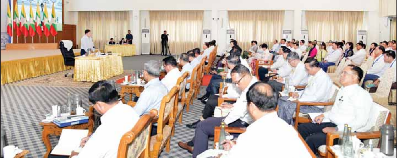
နိုင်ငံတော်စီမံအုပ်ချုပ်ရေးကောင်စီဥက္ကဋ္ဌ နိုင်ငံတော်ဝန်ကြီးချုပ် ဗိုလ်ချုပ်မှူးကြီး မင်းအောင်လှိုင် ပြည်ထောင်စုသမ္မတမြန်မာနိုင်ငံ ကုန်သည်များနှင့် စက်မှုလက်မှုလုပ်ငန်းရှင်များအသင်းချုပ် (UMFCCI) ညီနောင်အသင်းအဖွဲ့များမှ တာဝန်ရှိသူများအား တွေ့ဆုံ၍ နိုင်ငံစီးပွားဖြင့်တင်နိုင်ရေးကိစ္စရပ်များကို ကဏ္ဍအလိုက် ရင်းနှီးပွင့်လင်းစွာဆွေးနွေးစဉ်။