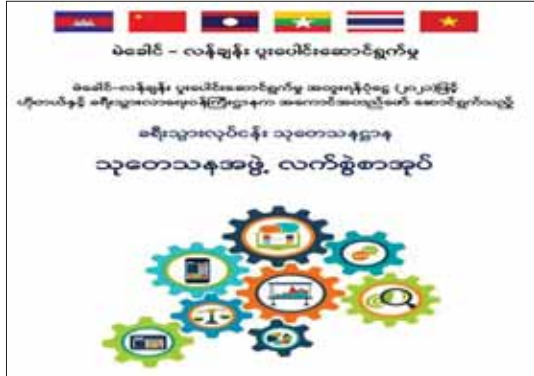
၂၀၂၂ ခုနှစ် ဒီဇင်ဘာလအတွင်း ထုတ်ဝေခဲ့သော သုတေသနအဖွဲ့လက်စွဲစာအုပ်။

ဌာနအသစ်ဖြစ်၍ ဌာနခွဲ၏ လုပ်ငန်းတာဝန်များနှင့်အညီ ခရီးလှည့်လုပ်ငန်းများ ဆောင်ရွက်သော ကုမ္ပဏီများနှင့် ဧည့်လမ်းညွှန်များ၊ စည်းကမ်းစနစ်တကျ ရှိစေရေးအတွက် အဓိကလုပ်ဆောင်ခဲ့ကြရသည်။ ဦးစီးဌာနဖွဲ့စည်းမှု စတင်ချိန်ဖြစ်၍ ခရီးသွားကုမ္ပဏီများ၏ ဧည့်သည်အဝင်အထွက် စာရင်းများ၊ ဝင်ငွေများ၊