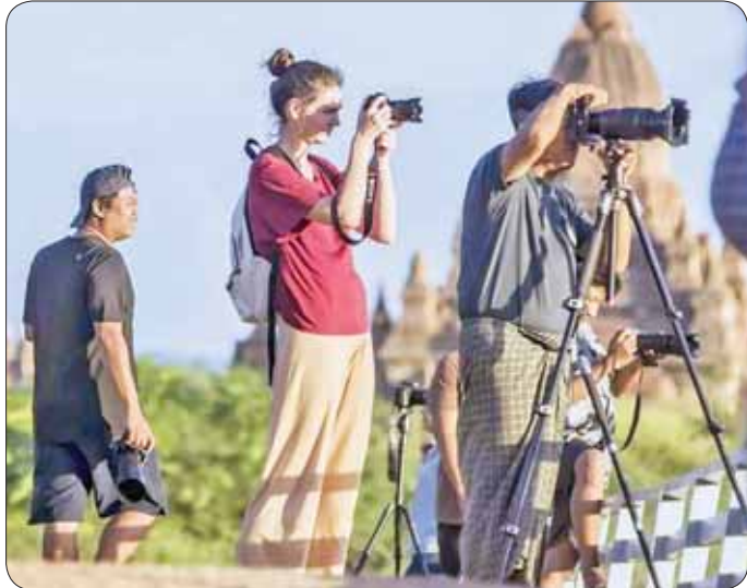
နေဝင်ချိန်ရှုခင်းမှတ်တမ်းတင်ဓာတ်ပုံရိုက်နေသော နိုင်ငံခြားခရီးသွားများ။

မိုးရာသီကာလမှာ ပုဂံကို ဘုရားဖူးတွေ ပိုလာဖို့ ကိုလည်း ပုဂံအခြေစိုက်ဟိုတယ်တွေက အထူးလျှော့ဈေးတွေနဲ့ ဆွဲဆောင်လာကြပါတယ်။ ပုဂံကို လာရောက်ကြတဲ့ ခရီးသွားညီညွတ်တော်တော် များများကတော့ ဘုရားဖူးပြီးရင် ပုဂံရဲ့နေထွက်ချိန်၊ နေဝင်ချိန်ကို စေတီပုထိုးများပေါ်ကနေ ခံစားကြည့်ရှုချင်တဲ့အတွက်လည်း ပုဂံကို သွားရောက်ကြပါတယ်။ ဒီလို အလှတရားတွေကို ကြည့်ရှုနိုင်စေဖို့ ပုဂံမြေကို မိုးရာသီကာလမှာ မရောက်ဖူးသေးရင် သွားရောက် အပန်းဖြေလည်ပတ်နိုင်စေဖို့ ရေးသားဖော်ပြလိုက်ရပါတယ်။