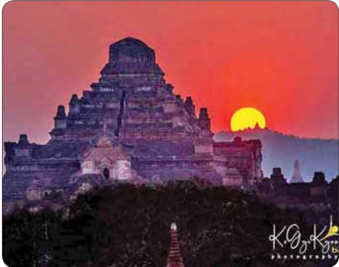
မွှေးရံကြီးစေတီတော်နှင့်အတူ တွေ့မြင်ရသော နေဝင်ချိန်ရှုခင်း။