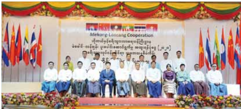
ခရီးသွားလုပ်ငန်းဆိုင်ရာ သုတေသနစီမံကိန်းပိတ်ပွဲကို ယခုနှစ် မတ်လက နေပြည်တော်၌ ကျင်းပစဉ်။

ဆူးလေလမ်းမကြီးကို အလယ်မျဉ်းကြောင်းခွဲပြီး၊ ဘယ်အခြမ်း၊ ညာအခြမ်းခွဲကာ မြို့နယ်အလိုက်၊ တစ်လမ်းဝင် တစ်လမ်းထွက် လွန်းထိုးသွား၍ ကုမ္ပဏီတစ်ခုဝင်၊ တစ်ခုထွက် စာရင်းကောက်ခဲ့ကြသည်။ တစ်ခါတစ်ရံ ကုမ္ပဏီပိုင်ရှင်များ၊ ကုမ္ပဏီမန်နေဂျာများနှင့် တွေ့ဆုံသော်လည်း များသောအားဖြင့် ရုံးစာရေးများနှင့်သာ တွေ့ရသည်က များသည်။ ကုမ္ပဏီများတွင် ထားရှိသော စာရင်းများမှာ အမျိုးမျိုးရှိ၍ မပေးချင်ကြ။ ပေးသည့် စာရင်းအင်းများကလည်း မှန်မည်ဟုမထင်။ အခွန်ကောက်ခံရမည်ကိုလည်း တွေးပူကြတာလည်းပါသည်။ မိမိတို့က နားလည်အောင် ရှင်းပြရသည်။