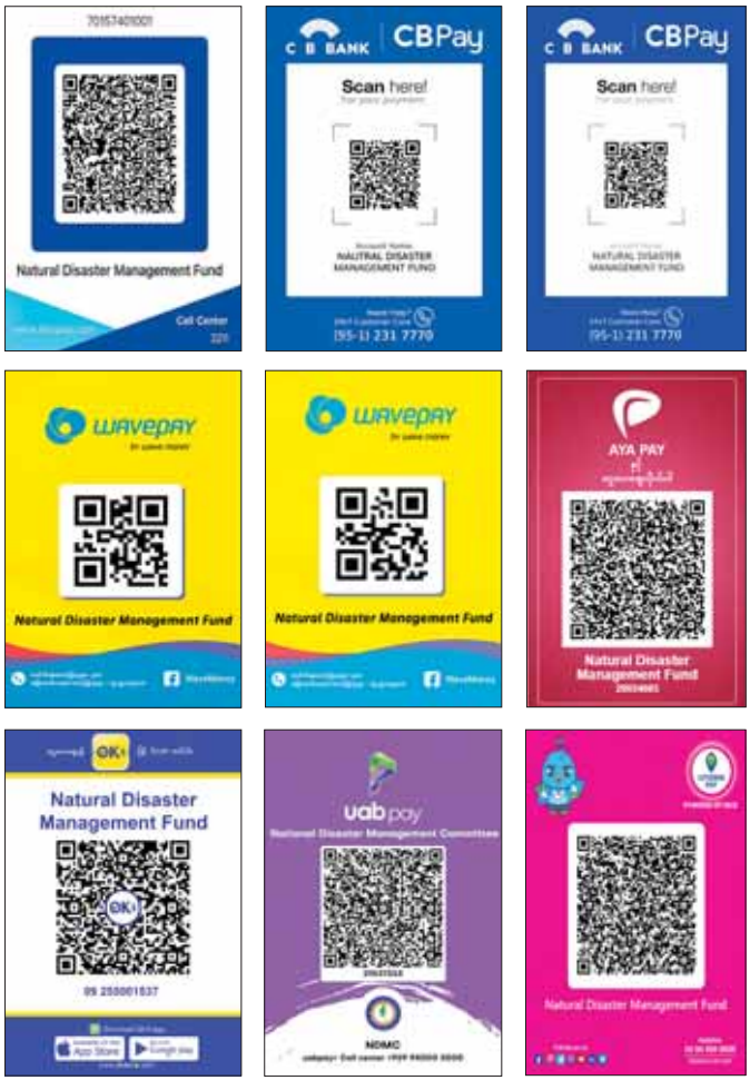
အမျိုးသားသဘာဝဘေးအန္တရာယ်ဆိုင်ရာစီမံခန့်ခွဲမှုကော်မတီ