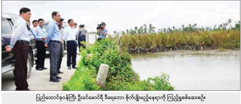
ပြည်ထောင်စုဝန်ကြီး ဦးခင်မောင်ရီ ဒီရေတော စိုက်ပျိုးမည့်နေရာကို ကြည့်ရှုစစ်ဆေးစဉ်။

အပန်းဖြေနိုင်ရေးအတွက် ဥယျာဉ်ကိုလူထုက ပိုမိုကောင်းမွန်အောင် စနစ်တကျ အလုပ်အမြန် ပြန်လည်တည်ဆောက် သွားနိုင်ရေး မှာကြားပြီး ရှာဖွေကူညီ ကယ်ဆယ်ရေးအဖွဲ့များက လူအင်အား၊ စက်ယန္တရား အင်အားဖြင့်ဥယျာဉ်အတွင်း ပြုလဲသစ်ပင်များအား ခုတ်ထွင်ရှင်းလင်း နေမှုကို ကြည့်ရှုအားပေးသည်။ ယင်းနောက် ပြည်ထောင်စုဝန်ကြီး ဦးထွန်းအံ့သည် ပြည်နယ်ပတ်ဝန်းကျင် ထိန်းသိမ်းရေးဦးစီးဌာန၌ ပတ်ဝန်းကျင် ထိန်းသိမ်းရေးဦးစီးဌာန အရာထမ်း၊ အမှုထမ်းများနှင့် တွေ့ဆုံသည်။ တွေ့ဆုံစဉ် ပြည်နယ်ပတ်ဝန်းကျင် ထိန်းသိမ်းရေးဦးစီးဌာန ညွှန်ကြားရေးမှူး က ၂၀၂၃-၂၀၂၄ ဘဏ္ဍာနှစ် လုပ်ငန်း ဆောင်ရွက်မှုများနှင့် မိုးခေါ်စိုက်ပျိုးစိုက်မှုအတွက် ကြိုတင်ပြင်ဆင် ဆောင်ရွက်ခဲ့မှုများ၊ ထိခိုက်ပျက်စီးမှုများ နှင့် မြန်မာပြည်ထောင်စုလုပ်ငန်း ဆောင်ရွက်ထားရှိမှုများကို ရှင်းလင်း တင်ပြရာ ပြည်ထောင်စုဝန်ကြီးက ဖြည့်ဆည်းဆောင်ရွက်ပေးပြီး မှန်တိုင်း တိုက်ခတ်မှုကြောင့် ထိခိုက်ပျက်စီးခဲ့သည့် အဆောက်အအုံများ ပြန်လည်ပြုပြင်ပြီးစီး မှုကို ကြည့်ရှုစစ်ဆေးကာ တာဝန်ရှိသူ များအား လိုအပ်သည်များ မှာကြားခဲ့ ကြောင်း သတင်းရရှိသည်။ သတင်းစဉ်