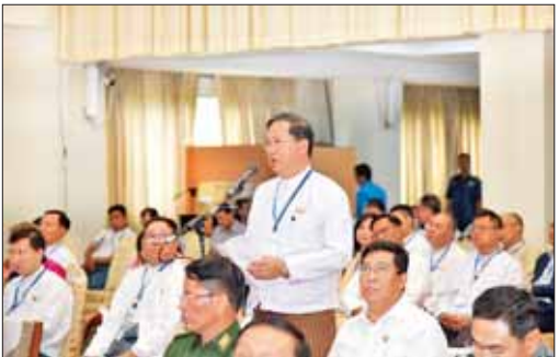
ပြည်ထောင်စုသမ္မတမြန်မာနိုင်ငံ ကုန်သည်များနှင့် စက်မှုလက်မှုလုပ်ငန်းရှင်များအသင်းချုပ် (UMFCCI) ညီနောင်အသင်းအဖွဲ့များမှ တာဝန်ရှိသူများက သက်ဆိုင်ရာကဏ္ဍအလိုက် လိုအပ်ချက်များအား တင်ပြဆွေးနွေးစဉ်။

ဦးစွာ နိုင်ငံတော်စီမံအုပ်ချုပ်ရေးကောင်စီဥက္ကဋ္ဌ နိုင်ငံတော်ဝန်ကြီးချုပ်က အဖွင့်အမှာစကား ပြောကြားရာတွင် နိုင်ငံတော်၏ စီးပွားရေးလုပ်ငန်းများကို မြှင့်တင်ဆောင်ရွက်ရာတွင် လိုအပ်သည်များကို ဆွေးနွေးပြောကြားနိုင်ရေးအတွက် တွေ့ဆုံခြင်းဖြစ်ကြောင်း၊ မြန်မာနိုင်ငံကုန်သည်များနှင့် စက်မှုလက်မှု လုပ်ငန်းရှင်များအသင်းချုပ် (UMFCCI) အနေဖြင့် အဓိကအားဖြင့် ထုတ်လုပ်မှုအပိုင်း၊ ကုန်သွယ်မှုအပိုင်းနှင့် ဝန်ဆောင်မှုအပိုင်း စသည့်အပိုင်း သုံးပိုင်းဖြင့် ဆောင်ရွက်လျက်ရှိပြီး အဆိုပါအချက်များသည် နိုင်ငံ၏ GDP တွက်ချက်မှုတွင် ပါဝင်သည့်အပိုင်းများ ဖြစ်သည်ကို တွေ့ရှိရကြောင်း၊ အဆိုပါကဏ္ဍများ၌ စက်မှုကုန်ထုတ်လုပ်မှုလုပ်ငန်းများနှင့် အခြားလုပ်ငန်းများစွာလည်း ပါဝင်ကြောင်း၊ ထို့ကြောင့် ယင်းကဏ္ဍများအားလုံးနှင့် ပတ်သက်၍ လိုအပ်သည်များကို ဆွေးနွေးပြောကြားနိုင်ရန်နှင့် လိုအပ်သည်များကို မှာကြားဖြည့်ဆည်း ဆောင်ရွက်ပေးနိုင်ရန် တွေ့ဆုံခြင်းဖြစ်ကြောင်း၊ မိမိတို့အနေဖြင့် တိုင်းပြည်သာယာဝပြောရေးနှင့် စားရေးကိစ္စရပ်ပူလှ