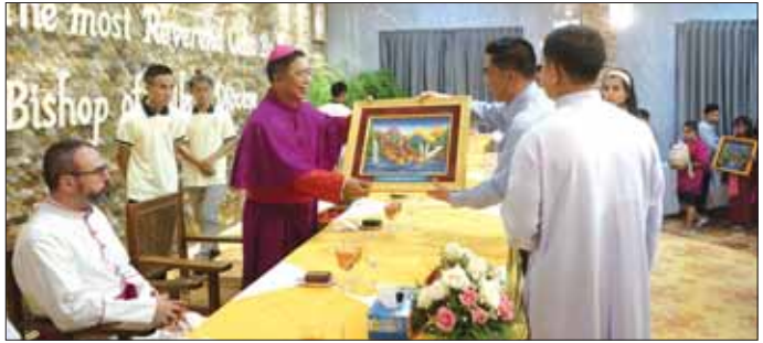
ကက်သလစ်ဆရာတော်ကြီးများ အဖွဲ့ချုပ်ဥက္ကဋ္ဌ ကာဒီနယ် မောင်ဘို၊ ပုဂံရဟန်းမင်းကြီး၏ ကိုယ်စားလှယ်တော်နှင့် ကက်သလစ်ဂိုဏ်းချုပ် ဂိုဏ်းအုပ် ကက်သလစ်ဆရာတော်ကြီးများ အဖွဲ့ချုပ်ဥက္ကဋ္ဌ ကာဒီနယ် ချားစီလ်မောင်ဘိုက ဝမ်းမြောက် နှုတ်ခွန်းဆက်စကား ပြောကြား ခဲ့ကြောင်း သိရသည်။

အခမ်းအနားတွင် ဘုန်းတော်ကြီး ဘယ်နာဒီးနီနံနယ်က အဖွင့် ဆုတောင်းမေတ္တာပို့သပြီး လျှင်ကော်ကက်သလစ် သာသနာပိုင် ဂိုဏ်းအုပ်ဆရာတော်သစ် ချယ်ဆိုဘရွှေက ကြိုဆိုနှုတ်ခွန်း ဆက်စကားပြောကြားသည်။ ထို့နောက် ပြည်နယ်ဝန်ကြီးချုပ် ဦးစော်မျိုးတင်က ကြိုဆို ဂုဏ်ပြုစကား ပြောကြားရာတွင် ကယားပြည်နယ် လျှင်ကော် ကက်သလစ် သာသနာပိုင် ပြည်နယ် ဖြစ်လာစေရန်အတွက် ပြည်နယ် အစိုးရအဖွဲ့နှင့်အတူ ဝိုင်းဝန်းကြိုးပမ်းကြစေလိုကြောင်း ပြောကြားသည်။ အထူးပင် ဝမ်းမြောက်ဂုဏ်ယူ ယင်းနောက် လျှင်ကော် ကက်သလစ် သာသနာပိုင် ဂိုဏ်းအုပ်ဆရာတော်သစ် ချယ်ဆို ဘရွှေက ပြည်နယ်ဝန်ကြီးချုပ်နှင့် ပြည်နယ်အစိုးရအဖွဲ့ဝင်များအား မေတ္တာလက်ဆောင်များ ပေးအပ် ခဲ့ပြီး ပြည်နယ်ဝန်ကြီးချုပ်နှင့် တာဝန်ရှိသူများက မြန်မာနိုင်ငံ