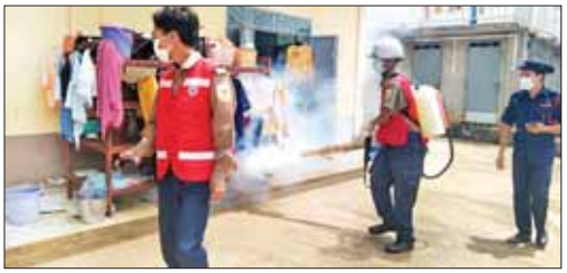
သည့်နေရာများတွင် အတိတ်ဆေးပေးခြင်း၊ ဖုံး၊ သွန်း၊ လဲ၊ စစ်လုပ်ငန်းများ ထည့်ခြင်း၊ ပိုးလောက်လမ်းများကို ဝိုင်းဝန်းကူညီဆောင်ရွက်လျက်ရှိ ရှင်းလင်းပေးခြင်း၊ ချုံနွယ်များခုတ်ထွင်ကြောင်း သိရသည်။ သန့်စင် (မူဆယ်)

အသင်းသူများ၊ မိုင်းယု(၁၀၅)မိုင် ကျေးရွာအတွင်းရှိ ကြက်မြေခွံသုနာပြုတပ်ဖွဲ့ဝင်များနှင့် မီးသတ်တပ်ဖွဲ့ဝင်များ ပူးပေါင်းအဖွဲ့သည် ဘုန်းကြီးကျောင်းများနှင့် သီလရှင်ဆရာလေးကျောင်းများ၊ မေတ္တာတစ်ဆိပ်ရဟိတဂေဟာအပါအဝင် မိုင်းယု(၁၀၅)မိုင်အခြေခံပညာ အထက်တန်းကျောင်းနှင့်ဈေးဆိုင်ခန်းများ၊ အထက်နမ့်ဟွယ်စာသင်ကျောင်းများတွင် ခြင်ဆေးဖျန်းခြင်း၊ ရေတွင်း၊ ရေအိုင်များ၊ ရွှံ့အိုင်၊ ဝေဠုကန် ရေဝပ်နိုင်