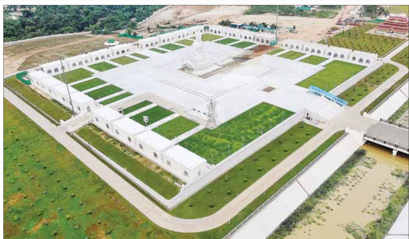
မာရဝိဇယဗုဒ္ဓရုပ်ပွားတော်မြတ်ကြီးနှင့် ဗုဒ္ဓဥယျာဉ်တော်အတွင်းမှ သာသနိကအဆောက်အဦများ တည်ဆောက်ပြီးစီးမှု။

ရက် တိတိ ကြာမြင့်ခဲ့ပြီဖြစ်သည်။ ကမ္ဘာပေါ်တွင် စကျင်ကျောက်ဖြင့် ထုဆစ်သည့်ဗုဒ္ဓရုပ်ပွားတော်များတွင် ဉာဏ်တော်အမြင့်ဆုံးဖြစ်လာမည့် မာရဝိဇယဗုဒ္ဓရုပ်ပွားတော်မြတ်ကြီးကို မြန်မာနိုင်ငံတွင် ထေရဝါဒဗုဒ္ဓသာသနာတော်ကြီး ခိုင်မာစွာ ထွန်းလင်းတောက်ပလျက်ရှိမှုကို ပြသရန်၊ မြန်မာနိုင်ငံသည် ထေရဝါဒဗုဒ္ဓဘာသာကိုးကွယ်မှု၏ ဗဟိုချက် ဖြစ်စေရန်၊ နိုင်ငံတော်ကြီး သာယာဝပြောမှုရှိစေရန်၊ ကမ္ဘာကြီးငြိမ်းချမ်းသာယာမှုဖြစ်စေရန် စသည့် ရည်ရွယ်ချက် (၄)ရပ်ဖြင့် တည်ဆောက်ပူဇော်နေခြင်း ဖြစ်ပြီး ရုပ်ပွားတော်မြတ်ကြီးနှင့် အတူ ဗုဒ္ဓဥယျာဉ်တော် အတွင်း၌ သာသနိက အဆောက်အဦများကိုလည်း နိုင်ငံတော်ဩဝါဒါစရိယ ဆရာတော်ကြီးများ၏ ဩဝါဒများ