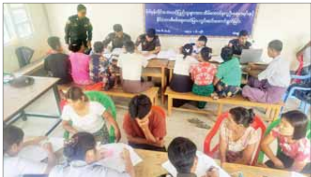
ပေါက်တောမြို့နယ်၌ အိမ်ထောင်စုလူဦးရေစာရင်းနှင့် နိုင်ငံသားစိစစ်ရေး ကတ်ပြားများ ဆောင်ရွက်ပေးစဉ်။