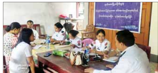
ဘူးသီးတောင်မြို့နယ်၌ အိမ်ထောင်စုလူဦးရေစာရင်းနှင့် နိုင်ငံသား စိစစ်ရေးကတ်ပြားများ ဆောင်ရွက်ပေးစဉ်။

ဝန်ကြီးချုပ်က မျက်မှောက်ခေတ် စိုက်ပျိုးခဲ့သည့် သစ်ပင်များ အပါ အဝင် ခေတ်အဆက်ဆက်စိုက်ပျိုး ထားရှိခဲ့ကြသည့် သစ်ပင်ကြီးများ ကြောင့် မိုခါမုန်တိုင်းတိုက်ခတ်မှု ဒဏ်ကို အတိုင်းအတာတစ်ခုအထိ ကာကွယ်နိုင်ခဲ့၊ သက်သာခွင့်ရရှိခဲ့ ရကြောင်း၊ ထို့ကြောင့် သစ်ပင်များ စိုက်ပျိုးခြင်းကို အမျိုးသားရေး တာဝန်တစ်ရပ်အဖြစ် ဆောင်ရွက် ကြရမည်ဖြစ်ပြီး ရှင်သန်ကြီးထွား အောင် အလေးထားဆောင်ရွက်