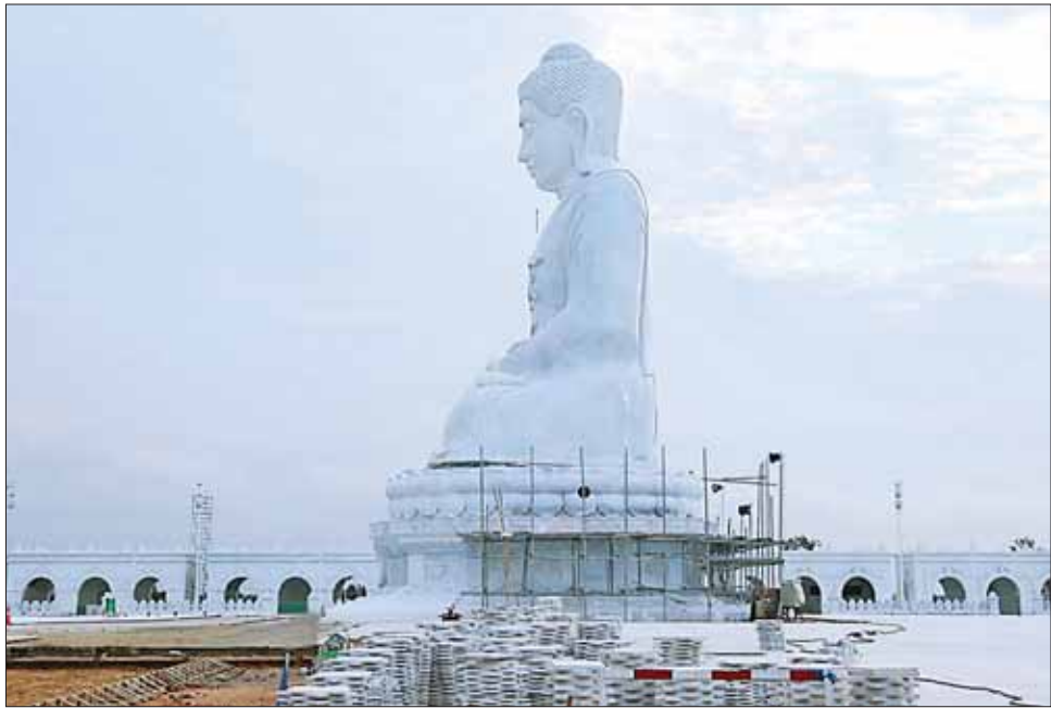
မာရဝိဇယဗုဒ္ဓရုပ်ပွားတော်မြတ်ကြီး တည်ဆောက်ပြီးစီးမှုကို တွေ့ရစဉ်။

နေပြည်တော် ဇွန် ၃၀ ကမ္ဘာပေါ်ရှိ ထိုင်တော်မူ ကျောက်ဆစ်ဗုဒ္ဓရုပ်ပွားတော်များအနက် ဉာဏ်တော်အမြင့်ဆုံးဖြစ်လာမည့် မာရဝိဇယဗုဒ္ဓရုပ်ပွားတော်မြတ်ကြီးကို ပြည်ထောင်စုနယ်မြေ နေပြည်တော် ဒက္ခိဏသီရိမြို့နယ်အတွင်း ဦးဆောင်ဘုရားဒါယကာ နိုင်ငံတော်စီမံအုပ်ချုပ်ရေး ကောင်စီဥက္ကဋ္ဌ နိုင်ငံတော်ဝန်ကြီးချုပ် ဗိုလ်ချုပ်မှူးကြီး မင်းအောင်လှိုင်၏ လမ်းညွှန်ချက်များဖြင့် မြန်မာနိုင်ငံ အင်ဂျင်နီယာအသင်းနှင့် တပ်မတော်အင်ဂျင်နီယာ တပ်ဖွဲ့ဝင်များက နေ့ညမပြတ်ကြိုးပမ်း တည်ဆောက် ပူဇော်လျက်ရှိရာ ၂၀၂၀ ဇွန် ၁၄ ရက် ပန္နက်တင်မင်္ဂလာအခမ်းအနား ကျင်းပခဲ့သည့်နေ့မှ ယနေ့အထိ ရက်ပေါင်း ၁၁၁၁ ရက် ၃ နှစ်နှင့် ၁၆