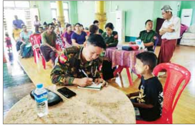
ကယ်ဆယ်ရေး အဖွဲ့များသည် နယ်လှည့်ဆေးကုသရေးအဖွဲ့များနှင့် ပူးပေါင်း၍ အရာရှိရပ်ကွက်၌ ဒေသခံပြည်သူများအား ကျန်းမာရေး စောင့်ရှောက်မှုလုပ်ငန်းများ ဆောင်ရွက်ရာတွင် လိုအပ်သည်များ ကူညီဆောင်ရွက်ပေးကြောင်း သတင်းရရှိသည်။ သတင်းစဉ်

လုပ်ငန်းများ ဆောင်ရွက်ရာတွင် လိုအပ်သည်များ ကူညီဆောင်ရွက်ပေးသည်။ ထို့အတူ ဘူးသီးတောင်မြို့၌ ရောက်ရှိနေသည့် ကူညီကယ်ဆယ်ရေး အဖွဲ့များသည် မြို့တွင်း လမ်းဘေး ဝဲ/ယာ၌ သန့်ရှင်းရေး လုပ်ငန်းများ ဆောင်ရွက်ပေးလျက်ရှိသည်။ အလားတူ ကျောက်ဖြူမြို့၌ ရောက်ရှိနေသည့် ကူညီ