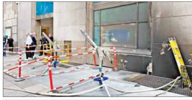
Tiffany & Co. ဆိုင် မီးလောင်ပျက်စီးမှုကို တွေ့ရစဉ်။

နယူးယောက် ဇွန် ၃၀ - နယူးယောက်မြို့ မင်ဟက်တန်ရပ်ကွက်ရှိ အမေရိကန်၏ အထင်ကရ လက်ဝတ်ရတနာဆိုင် ဖြစ်သည့် Tiffany & Co. ၌ မီးလောင်မှုဖြစ်ပွားရာ လူနှစ်ဦးကို ဆေးရုံသို့ပို့ဆောင်ပေးခဲ့ရသည်ဟု သိရသည်။ ဇွန် ၂၉ ရက် နံနက် ၉ နာရီခွဲခန့်က Tiffany & Co. ဆိုင်တွင် မီးလောင်မှုဖြစ်ပွားနေသည်ဟု သတင်းရရှိခဲ့ကြောင်း နယူးယောက်မြို့ မီးသတ်အာဏာပိုင်အဖွဲ့က ပြောသည်။ နှစ်နာရီခွဲခန့်ကြာပြီးနောက် မီးလောင်မှုကို ငြိမ်းသတ်နိုင်ခဲ့ကြောင်း မီးတောက်အရှိန်ကြောင့် အဆောက်အအုံ၏ နံရံပျက်စီးခဲ့သည်။ ဆိုင်ဝန်ထမ်းများ အပါ