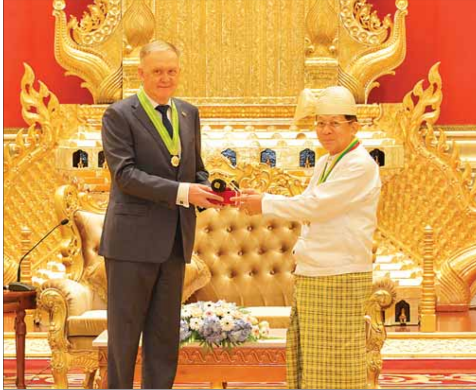
နိုင်ငံတော်စီမံအုပ်ချုပ်ရေးကောင်စီဥက္ကဋ္ဌ နိုင်ငံတော်ဝန်ကြီးချုပ် ဗိုလ်ချုပ်မှူးကြီး သတိုးမဟာသရေစည်သူ သတိုးသီရိသုဓမ္မ မင်းအောင်လှိုင် မြန်မာနိုင်ငံဆိုင်ရာ ရုရှားနိုင်ငံ သံအမတ်ကြီး H. E. Dr. Nikolay LISTOPADOV ထံ ဘွဲ့တံဆိပ်နှင့် အဆောင်အယောင်ကို လက်ရောက်ချီးမြှင့်အပ်နှင်းစဉ်။

အခမ်းအနားသို့ နိုင်ငံတော်စီမံအုပ်ချုပ်ရေးကောင်စီဥက္ကဋ္ဌ နိုင်ငံတော်ဝန်ကြီးချုပ် ဗိုလ်ချုပ်မှူးကြီး သတိုးမဟာသရေစည်သူ သတိုးသီရိသုဓမ္မ မင်းအောင်လှိုင်၊ ကောင်စီတွဲဖက်အတွင်းရေးမှူး ဒုတိယဗိုလ်ချုပ်ကြီး ဇေယျကျော်ထင် စည်သူ ရဲဝင်းဦး၊ နိုင်ငံခြားရေးဝန်ကြီးဌာန ပြည်ထောင်စု