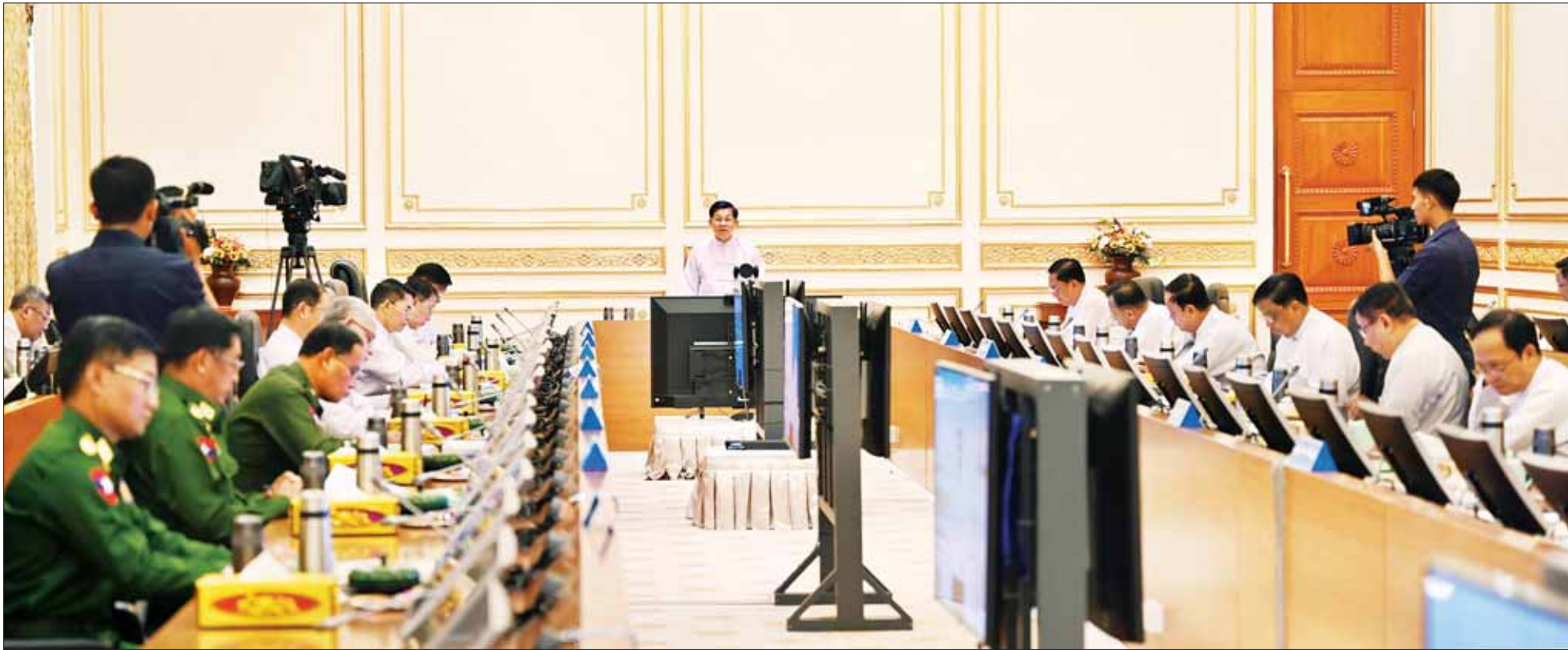
နိုင်ငံတော်စီမံအုပ်ချုပ်ရေးကောင်စီဥက္ကဋ္ဌ နိုင်ငံတော်ဝန်ကြီးချုပ် ဗိုလ်ချုပ်မှူးကြီး မင်းအောင်လှိုင် နိုင်ငံစီးပွားနှင့်တင်ရေးအစည်းအဝေးတွင် အမှာစကားပြောကြားစဉ်။