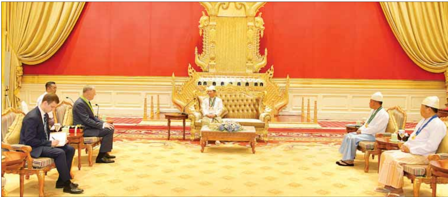
နိုင်ငံတော်စီမံအုပ်ချုပ်ရေးကောင်စီဥက္ကဋ္ဌ နိုင်ငံတော်ဝန်ကြီးချုပ် ဗိုလ်ချုပ်မှူးကြီး သတိုးမဟာသရေစည်သူ သတိုးသီရိသုဓမ္မ မင်းအောင်လှိုင်နှင့် မြန်မာနိုင်ငံဆိုင်ရာ ရုရှားနိုင်ငံ သံအမတ်ကြီး H. E. Dr. Nikolay LISTOPADOV တို့ တွေ့ဆုံဆွေးနွေးစဉ်။

နေပြည်တော် ဇွန် ၃၀ နိုင်ငံတော်စီမံအုပ်ချုပ်ရေးကောင်စီဥက္ကဋ္ဌ နိုင်ငံတော်ဝန်ကြီးချုပ် ဗိုလ်ချုပ်မှူးကြီး သတိုးမဟာသရေစည်သူ သတိုးသီရိသုဓမ္မ မင်းအောင်လှိုင်သည် မြန်မာနိုင်ငံနှင့် ရုရှားနိုင်ငံတို့အကြား ချစ်ကြည်ရင်းနှီးမှုနှင့် ပူးပေါင်းဆောင်ရွက်မှုများ ပိုမိုနီးကပ်ခိုင်မာအောင် စွမ်းစွမ်းတမ်းတမ်း ဆောင်ရွက်နိုင်ခဲ့သည့် မြန်မာနိုင်ငံဆိုင်ရာ ရုရှားနိုင်ငံ သံအမတ်ကြီး H. E. Dr. Nikolay LISTOPADOV အား စွမ်းဆောင်မှုဆိုင်ရာ ဂုဏ်ထူးဆောင်ဘွဲ့၊ ဝဏ္ဏကျော်ထင်ဘွဲ့ ချီးမြှင့်အပ်နှင်းခြင်းအခမ်းအနားကို ယနေ့နံနက်ပိုင်းတွင် နေပြည်တော်ရှိ နိုင်ငံတော်စီမံအုပ်ချုပ်ရေးကောင်စီဥက္ကဋ္ဌရုံး သံတမန်ဆောင် ဧည့်ခန်းမ၌ ကျင်းပပြုလုပ်သည်။