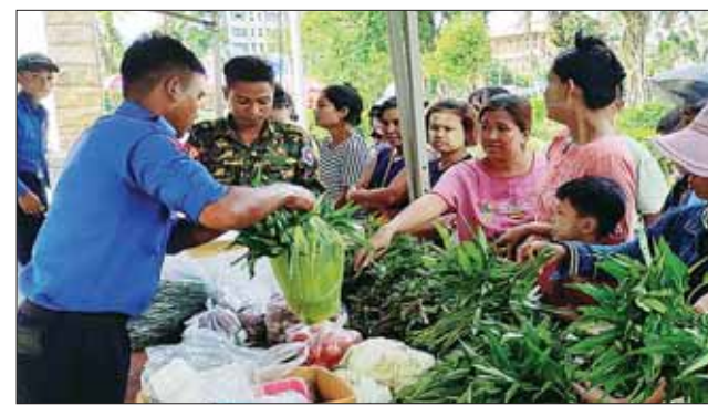
ကြက်သား အလူးဘူး၊ ငါးတန်အချိုပေါင်းဘူး၊ ငါးသလောက်ဘူး၊ ငါးပိကြော်ဘူး၊ ပဲထောပတ်ဘူး၊ ပဲခရမ်းဘူး၊ သရက်သီးသနပ်ဘူး စသည့် စားသောက်ကုန်များ၊ မြန်မာ့စီးပွားရေးဦးပိုင် အများနှင့် သက်ဆိုင်သော ကုမ္ပဏီလီမိတက် အရောင်းဆိုင်များ၏ စားကုန်ပစ္စည်းများ၊ လျှပ်စစ်ပစ္စည်းများနှင့် အိမ်ဆောက်ပစ္စည်းများကို သတင်းစဉ်

ဆား၊ အသား/ ငါး ကြက်ဥ၊ ဘဲဥ၊ နို့ထွက်ပစ္စည်းများ၊ ဟင်းသီးဟင်းရွက်များ၊ ကြက်သွန်နီ၊ ကြက်သွန်ဖြူနှင့် တပ်မတော် စက်ရုံများနှင့် မြန်မာ့စီးပွားရေး ကော်ပိုရေးရှင်းတို့မှ ထုတ်လုပ်သည့် ခေါက်ဆွဲခြောက်၊ ဘီစကွတ်နှင့် စည်သွတ်ဘူးများဖြစ်သည့် အမဲသားဘူး၊ မျှစ်စားတော်ပဲဘူး၊