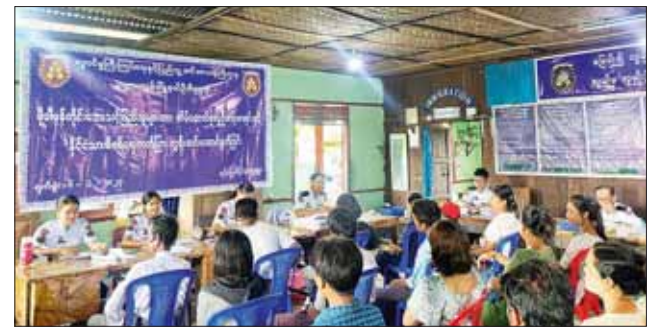
ပုဏ္ဏားကျွန်းမြို့နယ်၌ အိမ်ထောင်စုလူဦးရေစာရင်းနှင့် နိုင်ငံသားစိစစ်ရေး ကတ်ပြားများ ဆောင်ရွက်ပေးစဉ်။

လူဝင်မှု ကြီးကြပ်ရေးနှင့် ပြည်သူ့အင်အား ဝန်ကြီးဌာန