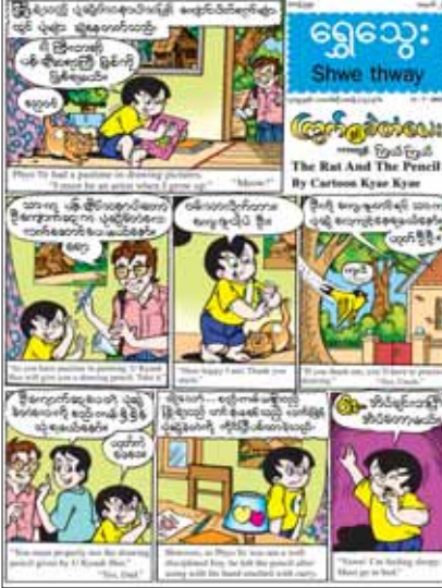
ဖူးငယ်ကို မေးသောအခါ သူ့အတွေးဖြင့် ပြန်ဖြေထားသည့်အကြောင်း တင်ဆက်ထား သည့် “ဖူးငယ်” တစ်မျက်နှာကားတွန်း၊ ကလေး

၁-၇ - ၂၀၂၃ ရက်(စနေနေ့)တွင် ထွက်ရှိ မည့် ရွှေသွေးဂျာနယ် အတွဲ (၅၅)၊ အမှတ်(၂၆) တွင် စည်းကမ်းမရှိသည့်အတွက် ပုံဆွဲခဲတံ လေးပျောက်ဆုံးသွားသော်လည်း ကံကောင်း စွာ ပြန်လည်တွေ့ရှိသွားသည့်အကြောင်း တင်ဆက်ထားသည့် “ကြွက်နှင့် ခဲတံလေး” မျက်နှာပုံကားတွန်း၊ မြန်မာ့ရိုးရာသိုင်းပညာကို သင်ချင်ပြီး သူတစ်ပါးကို ကူညီချင်သော နိုးတူးနှင့် သိုင်းဆရာကြီးတို့ တွေ့ဆုံမိသည့် အကြောင်း တင်ဆက်ထားသည့် “နိုးတူးနှင့် တုံတုံ” နှစ်မျက်နှာကားတွန်း၊ အမေဖြစ်သူက “သားသမီးမကောင်း ဘယ်သူခေါင်းလဲ” ဟု