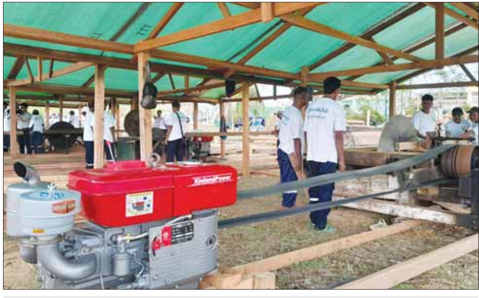
စစ်တွေမြို့သို့ ပို့ဆောင်ပေးထားသော ရွှေပြောင်းသစ်စက်များ။

အား ဂုဏ်ပြုလိုချင်ဖြစ်သည်။ ရာထောင်ချီ ရောက်ရှိလာကြသော မြန်မာနိုင်ငံရဲတပ်ဖွဲ့ဝင်များ၊ မီးသတ်တပ်ဖွဲ့ဝင်များ၊ လျှပ်စစ်ဝန်ထမ်းများ၊ ပို့/ဆက်ဝန်ထမ်းများ၊ သစ်တောဝန်ထမ်းများ၊ မိုးထဲလေထဲ ညမှောင်မှောင်မည်းမည်းထဲမှာ သူတို့ဓာတ်တိုင်များ ပေါ်တက်နေကြသည်။ ဆက်သွယ်ရေးလိုင်းများ ပြန်ကောင်းအောင် လုပ်နေကြရသည်။ အလွန်လေးလံသော သွပ်ပြားများ၊ သံချောင်းများ၊ ဆန်အိတ်များအပါအဝင် ပစ္စည်းမျိုးစုံကို ထမ်းပိုးသယ်ယူတင်/ချပေးနေရသည်။ လွှဲပိုင်းများမှာ စက်သံများ ညံ့နေသည်။ နေပူမိုးရွာမရွာခင် ရေဖြန့်ဝေရေး လုပ်ငန်းများ လုပ်ကိုင်ပေးနေကြသည်။ ဆိုတော့ကား သူတို့အားလုံး အပင်ပန်းခံ၍ စိတ်ရင်းစေတနာကောင်းစွာ လုပ်ကိုင်ဆောင်ရွက်ပေးနေမှုများကို ကိုယ်တိုင်ကိုယ်ကျလည်း တွေ့မြင်နေရသည်မို့ ဂုဏ်ပြုရေးသားနေခြင်း ဖြစ်သည်။ အရေးကြီးလုပ်ငန်းတာဝန်များ ထမ်းဆောင်နေကြရသည့် လျှပ်စစ်၊ ပညာရေး၊ ကျန်းမာရေးဝန်ကြီးဌာနများအကြောင်းအရင်ရေး၍ ပြီးမှ သမဝါယမနှင့် ကျေးလက်ဖွံ့ဖြိုးရေးဝန်ကြီးဌာန၊ ကြားထဲမှာ အမှတ်စဉ် (၆) အဖြစ် အားကစားနှင့် လူငယ်ရေးရာ ဝန်ကြီးဌာန ဖြတ်ဝင်သွားသည်ကတော့ ရခိုင်ပြည်နယ်ဇာတိပွား (၃၂) ကြိမ်မြောက် ဆီးဂိမ်းမှာ ငွေတံဆိပ်ဆုရ မြန်မာ့လက်ရွေးစင် အမျိုးသမီးဘောလုံးအသင်း၏ ကွင်းလယ်ကစားသမား၊ ကျောနံပါတ် (၆) နော်ထက်ထက်ဝေ၊ ဂျူဒိုနှင့်