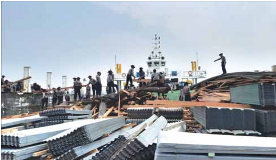
သင်္ဘောကြီးများပေါ်မှ သစ်ခွဲသားများကို သယ်ယူနေကြစဉ်။