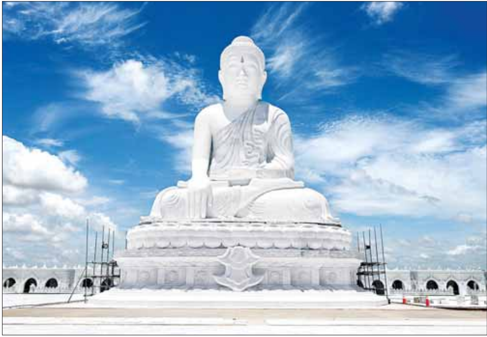
မာရဝိဇယဗုဒ္ဓရုပ်ပွားတော်မြတ်ကြီး တည်ဆောက်ပြီးစီးမှုကို ဖူးတွေ့ရစဉ်။

မာရဝိဇယ ဗုဒ္ဓရုပ်ပွားတော်မြတ်ကြီးအား လက်မူအချောသပ်လုပ်ငန်းနှင့် ဆေးသင်္ကန်းကပ်ခြင်း လုပ်ငန်းဆောင်ရွက်မှုနှင့်ပတ်သက်၍ ဆရာတော်ကြီး များထံမှ ဩဝါဒခံယူဆောင်ရွက်ခဲ့ကြောင်း၊ ဥက္ကဋ္ဌလုံ မွေးရှင်တော်မြတ်ကိုလည်း တပ်ဆင်ပူဇော်ခဲ့ကြောင်း၊ ဗုဒ္ဓရုပ်ပွားတော်မြတ်ကြီး တည်ဆောက်ရန်အတွက် ပန္နက်ရိုက်ခဲ့သည်မှ ယနေ့အထိ ရက်ပေါင်း ၁၁၀၊ ၂ နှစ်နှင့် ၁၅ ရက်ကြာမြင့်ခဲ့ပြီဖြစ်ကြောင်း၊ ရုပ်ပွား တော်မြတ်ကြီး ရေရှည်တည်တံ့ခိုင်မြဲစေရေးအတွက် တန်ချိန် ၂၀၀၀၀ အထိ ခံနိုင်သော အောက်ခံအမာ ရရှိရေး၊ တစ်နာရီလေတိုက်နှုန်း မိုင် ၁၂၀ ရှိသည့် လေပြင်းမုန်တိုင်းတိုက်ခတ်မှုဒဏ်ခံနိုင်ရေး၊ မြန်မာ နိုင်ငံတွင် အမြင့်ဆုံးလှုပ်ခတ်နိုင်သည့် ရစ်ချ်တာ စကေး ၈ ဒသမ ၈ အထိ မြေငလျင်ဒဏ်ခံနိုင်ရေးနှင့် လျှပ်စီးမိုးကြိုးများကြောင့် ဆင်းတုတော်ကြီးထိခိုက်မှု မရှိစေရေးတို့အတွက် အင်ဂျင်နီယာရှုထောင့်မှ စနစ်တကျ တွက်ချက် တည်ဆောက်ခဲ့ကြောင်း၊ ဆင်းတုတော်ကြီး၏ ကျောက်တုံးတော်ကြီးများကို