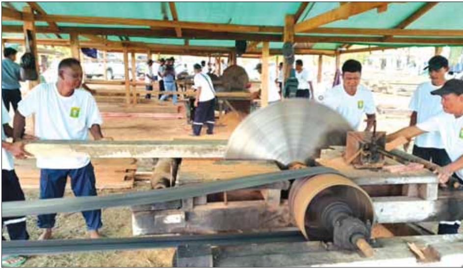
စစ်တွေမြို့သို့ ပို့ဆောင်ပေးထားသော ရွှေ့ပြောင်းသစ်စက်များ၌ အလုပ်လုပ်နေသော သစ်ထုတ်လုပ်ရေး အဖွဲ့များကို တွေ့ရစဉ်။