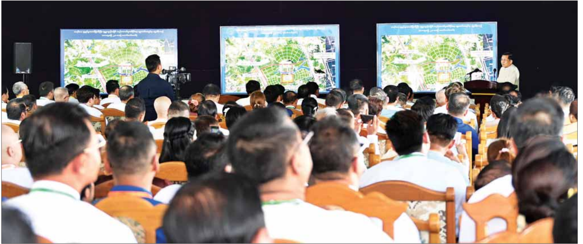
ဦးဆောင်ဘုရားဒါယကာ နိုင်ငံတော်စီမံအုပ်ချုပ်ရေးကောင်စီဥက္ကဋ္ဌ နိုင်ငံတော်ဝန်ကြီးချုပ် ဗိုလ်ချုပ်မှူးကြီး မင်းအောင်လှိုင် ကမ္ဘာပေါ်ရှိ ထိုင်တော်မူ ကျောက်ဆစ်ပုဒ္ဓရုပ်ပွားတော်များအနက် ဉာဏ်တော်အမြင့်ဆုံး ဖြစ်လာမည့် မာရဝိဇယပုဒ္ဓရုပ်ပွားတော်မြတ်ကြီး တည်ထားကိုးကွယ်ခြင်းနှင့်ပတ်သက်၍ ရှင်းလင်းပြောကြားစဉ်။

၎င်းမှာ အခမ်းအနားသို့ ဦးဆောင်ဘုရားဒါယကာ နိုင်ငံတော်စီမံအုပ်ချုပ်ရေးကောင်စီဥက္ကဋ္ဌ နိုင်ငံတော် ဝန်ကြီးချုပ် ဗိုလ်ချုပ်မှူးကြီး မင်းအောင်လှိုင်၊ ညှိနှိုင်းကွပ်ကဲရေးမှူး (ကြည်း၊ ရေ၊ လေ) ဗိုလ်ချုပ်ကြီး မောင်မောင်အေး၊ ပြည်ထောင်စုဝန်ကြီးများနှင့် ပြည် ထောင်စုအဆင့်ပုဂ္ဂိုလ်များ၊ ကာကွယ်ရေးဦးစီးချုပ် ရုံးမှ အဆင့်မြင့်တပ်မတော်အရာရှိကြီးများ၊ နေပြည် တော်တိုင်းစစ်ဌာနချုပ်တိုင်းမှူး၊ သာသနာ့ဥက္ကဋ္ဌ၊ ပုဂ္ဂိုလ်များ၊ ပြည်တွင်းဘက်များနှင့် ကမ္ဘာ့ကြီးများမှ တာဝန်ရှိပုဂ္ဂိုလ်များ၊ မြန်မာနိုင်ငံကုန်သည်များနှင့် စက်မှုလက်မှုလုပ်ငန်းရှင်များအသင်းချုပ်မှ တာဝန် ရှိ ပုဂ္ဂိုလ်များ၊ ပြည်တွင်းရုပ်သံလှိုင်းများနှင့် ဆက်သွယ်ရေးအော်ပရေတာများမှ တာဝန်ရှိပုဂ္ဂိုလ် များ၊ သတ္တုလုပ်ငန်းကုမ္ပဏီများမှ တာဝန်ရှိပုဂ္ဂိုလ် များ တက်ရောက်ကြသည်။