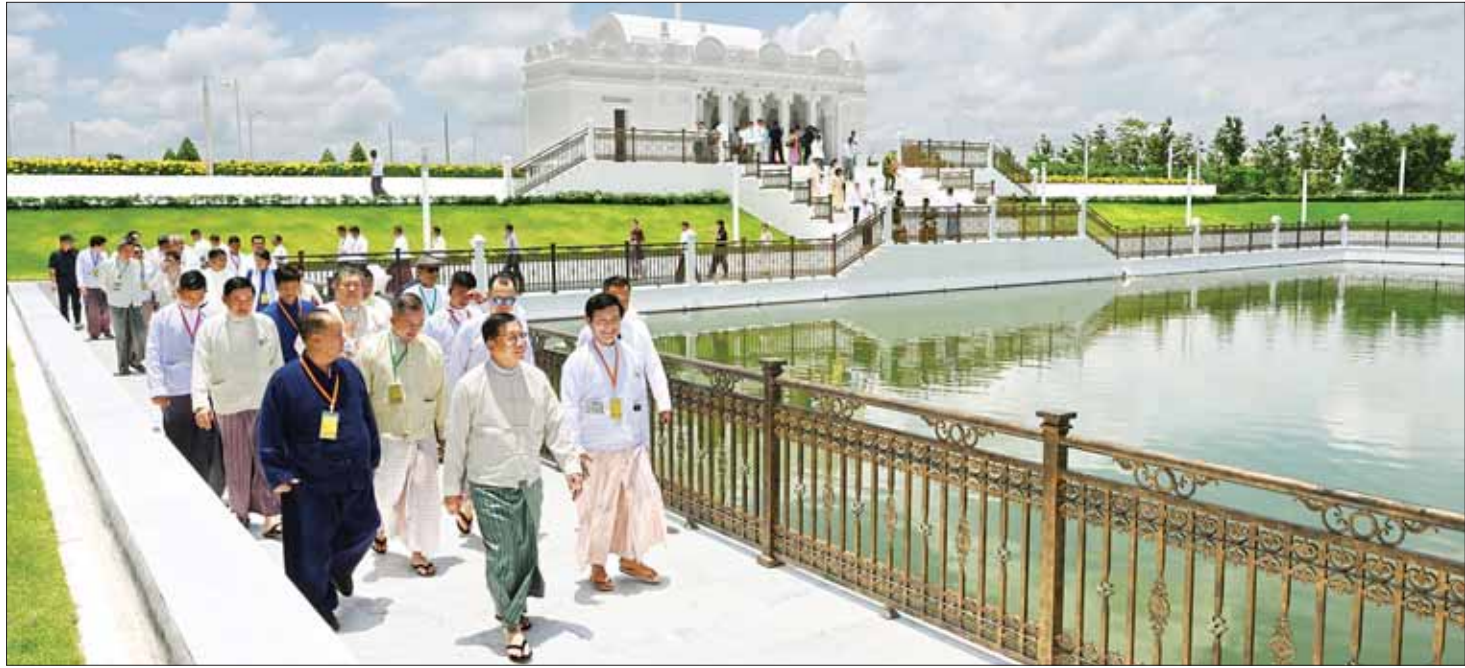
ဦးဆောင်ဘုရားဒါယကာ နိုင်ငံတော်စီမံအုပ်ချုပ်ရေးကောင်စီဥက္ကဋ္ဌ နိုင်ငံတော်ဝန်ကြီးချုပ် ဗိုလ်ချုပ်မှူးကြီး မင်းအောင်လှိုင် မာရဝိဇယဗုဒ္ဓရုပ်ပွားတော်အတွင်းရှိ မုစလီနွ်အိုင်တည်ဆောက်ပြီးစီးမှုကို အခမ်းအနားတက်ရောက်လာကြသူများအား လိုက်လံရှင်းလင်းပြသစဉ်။

တွဲဆက်ခြင်းများဆောင်ရွက်ရာတွင်လည်း သမား ရိုးကျ နည်းလမ်းများနှင့် ခေတ်မီနည်းလမ်းများ ပေါင်းစပ်တည်ဆောက်ထားခြင်းဖြစ်ကြောင်း။ ကုသိုလ်သဒ္ဓါများ ပွားနိုင်စေရန်ရည်ရွယ် ရင်ပြင်တော်ကြီး တည်ဆောက်ရေးနှင့် ပတ်သက်၍ မြက်ခင်းများကိုလည်း ထည့်သွင်း တည်ဆောက်ထားကြောင်း၊ ဂန္ဓကုဋ်တိုက်များကို လည်း စကျင်ကျောက်များ အသုံးပြု၍ မန္တလေးမြို့၊ အတုမရှိကျောင်းတော်၏ပုံစံအတိုင်း အဆောင်တစ်ခု နှင့်တစ်ခု အနုလက်ရာများလုံးဝမတူညီသည့် ၂၄ ဆောင် တည်ဆောက်ထားပြီး ဘုရားဖူးလာပြည်သူ များအနေဖြင့် နေပူပြင်းသည့်အချိန်များတွင် ဂန္ဓ ကုဋ်တိုက်တော်များအတွင်းမှ ဘုရားကြီးကို ဖူးမြော် ကြည့်ညိုနိုင်စေရန် တည်ဆောက်ထားခြင်းဖြစ် ကြောင်း၊ မသန်စွမ်းသူများနှင့် သက်ကြီးရွယ်အိုများ ဘုရားရင်ပြင်တော်ပေါ်သို့ တက်ရောက်နိုင်ရေးအတွက် စက်လှေကားကိုလည်း ထည့်သွင်းတည်ဆောက် ထားရှိကြောင်း၊ ဘုရားကြီးပရိဝုဏ်တော်အတွင်း အိန္ဒိယနိုင်ငံမှရရှိသည့် ဗောဓိညောင်ပင်ကိုလည်း စိုက်ပျိုးထားရှိကြောင်း၊ ဘုရားကြီး၏ ဘယ်ဘက်နှင့် ညာဘက်တို့တွင် လင်းလွန်းတောနှင့် ဘုရားကြီး၏ အနောက်ဘက်တွင် လင်းလွန်းပင်နှင့် လူမွှိန် အင်ကြင်းပင်များကို စိုက်ပျိုးသွားမည်ဖြစ်ကြောင်း၊ လူမွှိန်အင်ကြင်းပင်များအား အိန္ဒိယနိုင်ငံမှ လှူဒါန်း ခြင်းဖြစ်ကြောင်း ရှင်းလင်းပြောကြားပြီး ရေပန်း ရင်ပြင်နှင့် ကျောက်စာရုံများ အဆင့်ဆင့်တိုးတက် လာမှုအား Drone ဖြင့် ရိုက်ကူးထားရှိမှု မှတ်တမ်း Video Clip နှင့် မာရဝိဇယဗုဒ္ဓရုပ်ပွားတော်မြတ်ကြီးနှင့် ဗုဒ္ဓဥယျာဉ်ကြီး တည်ဆောက်ပြီးစီးပါက ဖူးမြော်