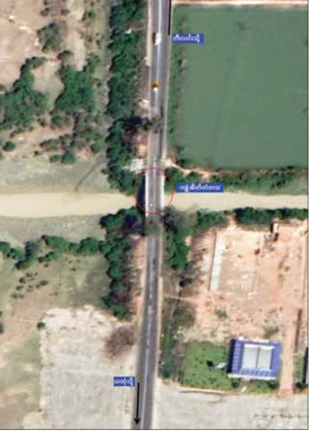
KNIA အဖွဲ့မှ အကြမ်းဖက်မှုလုပ်ရပ်များနှင့် PDF အကြမ်းဖက်ပူးပေါင်းအဖွဲ့မှ မိုင်းထောင်ဖောက်ခွဲဖျက်ဆီးခဲ့သည့် ကျူအိတ်တံတား နေရာပြပုံ

Bomb များ အသုံးပြု၍ ယုတ်မာ ရက်စက်စွာဖြင့် အကြမ်းဖက်မှု များ ထပ်မံလုပ်ဆောင်ခဲ့မှုကြောင့် အပြစ်မဲ့ ပြည်သူ နှစ်ဦး ထပ်မံ သေဆုံးခဲ့ပြီး ၁၀ ဦး ဒဏ်ရာရရှိ ခဲ့ကာ လုံခြုံရေးတပ်ဖွဲ့ဝင်အချို့ ထိခိုက်ဒဏ်ရာ ရရှိခဲ့ကြောင်း သိရှိရသည်။ ပြိုကျပျက်စီး KNLA အကြမ်းဖက်သမားများ အနေဖြင့် ဇန်နဝါရီ ၆ ရက်တွင် လည်း ပဲခူးတိုင်းဒေသကြီး ကျောက်ကြီးမြို့နယ် အတွင်းရှိ အများပြည်သူ အသုံးပြုသွားလာ လျက်ရှိသော စစ်တောင်းမြစ်ကူး တံတား (နတ်သံကွင်း) အား မိုင်းထောင် ဖောက်ခွဲဖျက်ဆီးခဲ့မှု ကြောင့် တံတား၏ ကမ်းကပ်ခုံနှင့် ကပ်လျက် ပေ ၁၃၀ ခန့် ပြိုကျ ပျက်စီးခဲ့သည်။ ပဲခူးတိုင်းဒေသ ကြီးနှင့် မွန်ပြည်နယ်တို့အတွင်းရှိ တံတားများအား အကြမ်းဖက် သမားများက ဖောက်ခွဲဖျက်ဆီးခဲ့မှု အနေဖြင့် ၂၀၂၁ ခုနှစ် ဖေဖော်ဝါရီ လမှ ယနေ့အထိ ၂၄ ကြိမ် ရှိပြီ ဖြစ်ကြောင်း သိရှိရသည်။