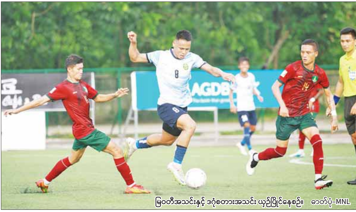
မြဝတီအသင်းနှင့် ဒဂုံစတားအသင်း ယှဉ်ပြိုင်နေစဉ်။

MNL ပြိုင်ပွဲ၌ မြဝတီနှင့် ဒဂုံစတားအသင်း တစ်ဂိုးစီသရေကျ ရန်ကုန် ဇွန် ၂၉ ၂၀၂၃ ရာသီ MNL အမှတ်ပေးပြိုင်ပွဲ ပွဲစဉ် (၁၀) စတုတ္ထနေ့ကို ဇွန် ၂၉ ရက်က YUSC ကွင်း၌ ဆက်လက်ကျင်းပရာ မြဝတီ အသင်းနှင့် ဒဂုံစတားအသင်း တစ်ဂိုးစီသရေကျခဲ့သည်။ ခြေစွမ်းမကွာသည့် အသင်းနှစ်သင်းတွေ့ဆုံသလို ပြည်တွင်း ကစားသမားများဖြင့် ဖွဲ့စည်းထားသည့် အသင်းနှစ်သင်း၏ အားပြိုင်မှုမှာ သရေရလဒ်ဖြင့် ပြီးဆုံးခဲ့သည်။ ပွဲအစ ၁၅ မိနစ် အတွင်း အပြန်အလှန်သွင်းဂိုးနှစ်ဂိုး တွေ့မြင်ခဲ့ရသော်လည်း နောက်ပိုင်းတွင် အဆုံးသတ်အားနည်းမှုကြောင့် ဂိုးထပ်မရဘဲ သရေတစ်မှတ်စီ ခွဲယူခဲ့ခြင်းဖြစ်သည်။ နှစ်သင်းစလုံး အမာခံ ကစားသမား အများစုဖြင့် ပွဲထွက်လာပြီး ပွဲစကတည်းက တိုက်စစ်ဖွင့်ကစားခဲ့သည်။ စာမျက်နှာ ၁၄ ကော်လံ ၁ ၀