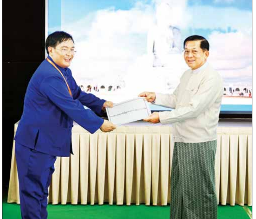
ဦးဆောင်ဘုရားဒါယကာ နိုင်ငံတော်စီမံအုပ်ချုပ်ရေးကောင်စီဥက္ကဋ္ဌ နိုင်ငံတော်ဝန်ကြီးချုပ် ဗိုလ်ချုပ်မှူးကြီး မင်းအောင်လှိုင်ထံ အခမ်းအနားတက်ရောက်လာကြသူများက မာရဝိဇယဗုဒ္ဓဥယျာဉ်တော်မြတ်ကြီးနှင့် မာရဝိဇယဗုဒ္ဓဥယျာဉ်တည်ဆောက်ခြင်းအတွက် ကြည့်ညှိသဒ္ဓါပွားများလျက် အလှူငွေများကို ပေးအပ်လှူဒါန်းစဉ်။