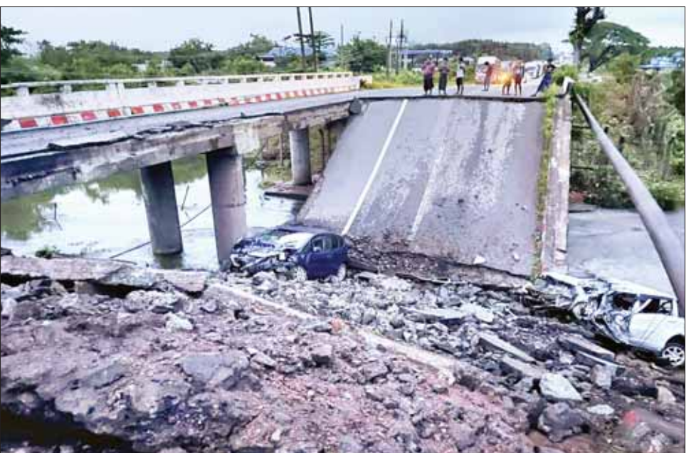
KNIA အဖွဲ့မှ အကြမ်းဖက်မှုလုပ်ရပ်များနှင့် PDF အကြမ်းဖက်ပူးပေါင်းအဖွဲ့ မိုင်းထောင်ဖောက်ခွဲ ဖျက်ဆီးခဲ့သည့် ကျူအိတ်တံတားကို တွေ့ရစဉ်။

စစ်ရာဇဝတ်မှုကျူးလွန် အကြမ်းဖက်သမား များ အနေဖြင့် အများပြည်သူ သွားလာ မှု ခက်ခဲစေရန်နှင့် အထိတ်တလန့် ဖြစ်ပြီး ကြောက်ရွံ့လာစေရန်၊ ကုန်စည်စီးဆင်းမှုကို ထိခိုက် ဆုံးရှုံးမှုဖြစ်စေပြီး တည်ငြိမ်မှု ပျက်ပြားစေရန်ရည်ရွယ်၍ စစ်ရေး နှင့် မသက်ဆိုင်သော အများ ပြည်သူ အသုံးပြုလျက်ရှိသည့် လမ်းတံတားများအား ဖောက်ခွဲ