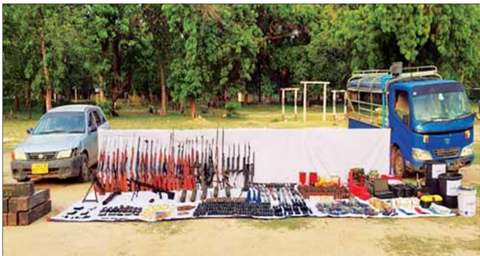
စစ်ကိုင်းတိုင်းဒေသကြီး စမွန်းကျေးရွာ၌ ဖမ်းဆီးရမိသော လက်နက်/ခဲယမ်းများကို တွေ့ရစဉ်။

နေပြည်တော် ဇွန် ၂၉ NUG၊ CRPH တို့၏ ဆက်သွယ် ညွှန်ကြားမှုဖြင့် စစ်ကိုင်းတိုင်း ဒေသကြီးအတွင်း နယ်မြေ တည်ငြိမ်အေးချမ်းမှုကို ပျက်ပြား စေရန်အတွက် အဖျက်အမှောင့် လုပ်ငန်းမျိုးစုံကို လုပ်ဆောင်လျက် ရှိသည့် PDF အမည်ခံ အကြမ်းဖက် သမားများသည် စစ်ကိုင်းမြို့နယ် ကင်းတော်ကျေးရွာ၊ ဥယျာဉ် ကျေးရွာ၊ လက်ပံတောကျေးရွာနှင့် စဉ့်ကိုင်ကျေးရွာများအနီး ရောက်ရှိ ခိုအောင်းနေကြောင်း အကြမ်းဖက် လုပ်ဆောင်မှုများကို လက်ခံနိုင် ခြင်းမရှိသည့် ဒေသခံပြည်သူအချို့ ၏ သျှိုဝှက်ဆက်သွယ် သတင်း ပေးပို့ချက်များအရ လုံခြုံရေး တပ်ဖွဲ့ဝင်များက သွားရောက် တိုက်ခိုက်ချေမှုန်းခဲ့ရာ ဇွန် ၂၅ ရက် တွင် PDF အမည်ခံ အကြမ်းဖက် သမားများထံမှ လက်နက်များစုံ