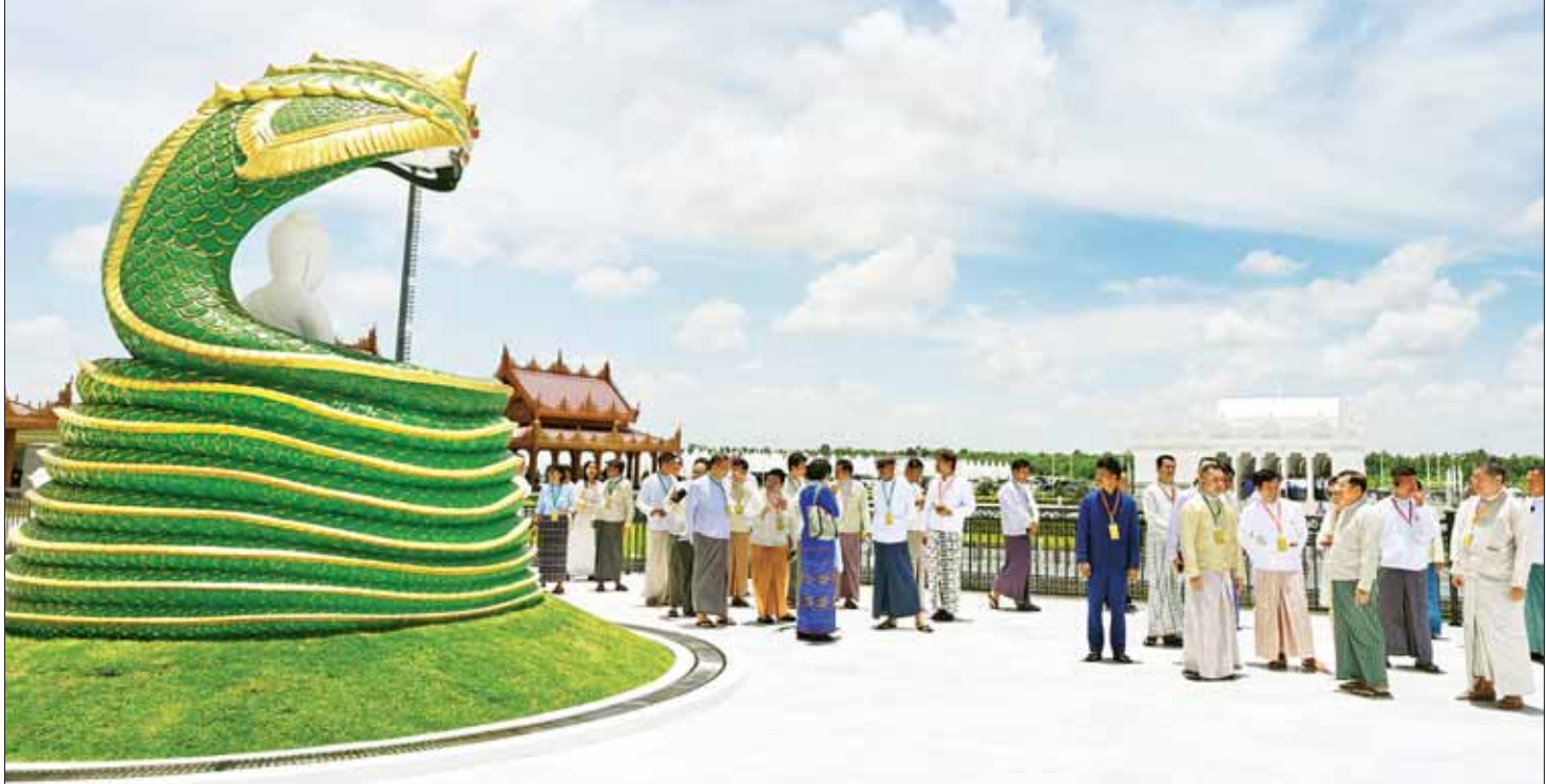
ဦးဆောင်ဘုရားဒါယကာ နိုင်ငံတော်စီမံအုပ်ချုပ်ရေးကောင်စီဥက္ကဋ္ဌ နိုင်ငံတော်ဝန်ကြီးချုပ် ဗိုလ်ချုပ်မှူးကြီး မင်းအောင်လှိုင် မာရဝိဇယဗုဒ္ဓဥယျာဉ်တော်အတွင်းရှိ နဂါးရုံဘုရားတည်ဆောက်ပြီးစီးမှုကို အခမ်းအနားတက်ရောက်လာကြသူများအား လိုက်လံရှင်းလင်းပြသစဉ်။