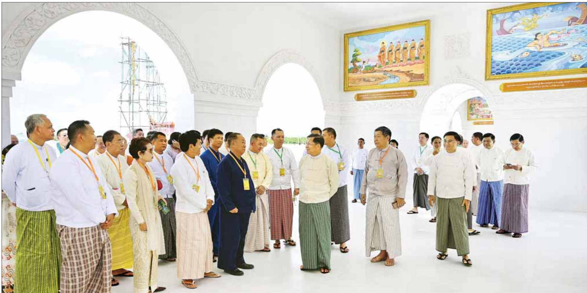
ဦးဆောင်ဘုရားဒါယကာ နိုင်ငံတော်စီမံအုပ်ချုပ်ရေးကောင်စီဥက္ကဋ္ဌ နိုင်ငံတော်ဝန်ကြီးချုပ် ဗိုလ်ချုပ်မှူးကြီး မင်းအောင်လှိုင် မာရဝိဇယဗုဒ္ဓဥယျာဉ်တော်အတွင်း အဆောက်အအုံများ တည်ဆောက်ပြီးစီးမှုကို အခမ်းအနားတက်ရောက်လာကြသူများအား လိုက်လံရှင်းလင်းပြသစဉ်။