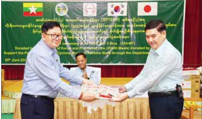
ဒုတိယဝန်ကြီး ဒေါက်တာအောင်ကြီး လှူဒါန်းဆန်များကို ပြည်နယ်ဝန်ကြီးချုပ် ဦးထိန်လင်းထံ လွှဲပြောင်းပေးအပ်စဉ်။

ဝန်ကြီးဌာန ဒုတိယဝန်ကြီး ဒေါက်တာအောင်ကြီးတို့က အမှာစကားများ ပြောကြားကြပြီး APTERR အတွင်းရေးမှူး Dr. Choomjet Karnjanakesorn က လှူဒါန်းခြင်းနှင့် စပ်လျဉ်း၍ ရှင်းလင်းပြောကြားသည်။ လွှဲပြောင်းပေးအပ် ထို့နောက် ဒုတိယဝန်ကြီး ဒေါက်တာအောင်ကြီးက ပြည်နယ်ဝန်ကြီးချုပ်ထံ လှူဒါန်းဆန်များကို လွှဲပြောင်းပေးအပ်ပြီး ပြည်နယ်ဝန်ကြီးချုပ်က APTERR အတွင်းရေးမှူးထံ ကျေးဇူးတင်လွှာပေးအပ်၍ ပြည်ထောင်စုဝန်ကြီးက အမှတ်တရလက်ဆောင်ပေးအပ်သည်။