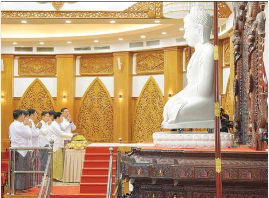
ဦးဆောင်ဘုရားဒါယကာ နိုင်ငံတော်စီမံအုပ်ချုပ်ရေးကောင်စီဥက္ကဋ္ဌ နိုင်ငံတော်ဝန်ကြီးချုပ် ဗိုလ်ချုပ်မှူးကြီး မင်းအောင်လှိုင် နောင်တော်ကြီး ဗုဒ္ဓရုပ်ပွားတော်မြတ်အား သာသနာဗိမာန် အဂ္ဂိမိပတိဝိသုဂါမ သိမ်တော်ကြီးအတွင်းရှိ ရတနာပလ္လင်တော်ထက်သို့ မင်္ဂလာစက်ခလုတ်နှိပ်၍ ပင့်ဆောင်စဉ်။

ယင်းနောက် ဦးဆောင်ဘုရားဒါယကာ နိုင်ငံတော်စီမံအုပ်ချုပ်ရေးကောင်စီဥက္ကဋ္ဌ နိုင်ငံတော်ဝန်ကြီးချုပ်