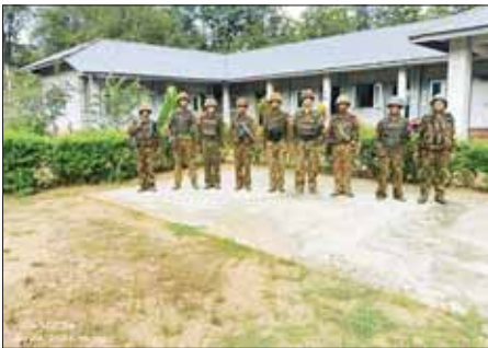
KNDF နှင့် KNPP အကြမ်းဖက်လက်နက်ကိုင်အဖွဲ့တို့ တိုက်ခိုက်သိမ်းပိုက်ထားသည့် ပန်တီန်းဒေသရှိ အမှတ် (၁၀၀၄) နယ်ခြားစောင့်တပ်အား ပြန်လည်တိုက်ခိုက်သိမ်းပိုက်နိုင်ခဲ့ပြီး တပ်ရင်းရုံးအား တွေ့ရစဉ်။

အကျယ်ချုပ်ဖြင့် ထိန်းသိမ်းထားကြောင်း သိရှိရသည်။ ပြန်လည်သိမ်းပိုက်နိုင်ခဲ့သည့် ထို့ကြောင့် ယင်းနေ့ နံနက်ပိုင်းတွင် တပ်မတော်အနေဖြင့် လေကြောင်းချီတပ်ဖွဲ့များ အသုံးပြု ကွန်မန်ဒိုနည်းဖြင့် ချီတက်ချဉ်းကပ်ကာ လေကြောင်းပစ်ကူ၊ အမြောက်ပစ်ကူရယူပြီး အဆင့်ဆင့် ချီတက်တိုက်ခိုက်ခဲ့ရာ မွန်းလွဲပိုင်းတွင် အမှတ် (၁၀၀၄) နယ်ခြားစောင့်တပ်ကို ပြန်လည်ထိန်းချုပ် သိမ်းပိုက်နိုင်ခဲ့ပြီး တပ်မတော်သားအရာရှိ၊ စစ်သည်၊ မိသားစုများကို ကယ်တင်၍ ရဟတ်ယာဉ်များဖြင့် လုံခြုံစိတ်ချ