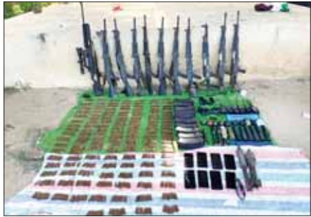
စစ်ကိုင်းမြို့နယ် စဉ့်ကိုင်ကျေးရွာ၌ ခိုအောင်းနေသော PDF အမည်ခံ အကြမ်းဖက်သမားများထံမှ သိမ်းဆည်းရမိခဲ့သည့် လက်နက်/ခဲယမ်းများ တွေ့ရစဉ်။

ထိုကဲ့သို့ စစ်ကိုင်းတိုင်းဒေသကြီးအတွင်း အကြမ်းဖက်လုပ်ငန်းမျိုးစုံ လုပ်ဆောင်လျက်ရှိသည့် PDF အမည်ခံ အကြမ်းဖက်သမားများအား ဖမ်းဆီးရမိရေး ဆောင်ရွက်ရာတွင် လုံခြုံရေးတပ်ဖွဲ့ဝင်အချို့ ထိခိုက်ဒဏ်ရာရရှိခဲ့ပြီး နီးစပ်ရာ တပ်မတော်ဆေးရုံသို့ ပို့ဆောင်ဆေးကုသမှုခံယူစေလျက်ရှိသည်။ ဖြစ်စဉ်တွင် သိမ်းဆည်းရမိလက်နက်များနှင့် ဆက်စပ်ပစ္စည်းများအား လုပ်ထုံးလုပ်နည်းများနှင့်အညီ ဆက်လက်ဆောင်ရွက်သွားမည်ဖြစ်ကြောင်းနှင့် အကြမ်းဖက်အဖွဲ့များအနေဖြင့် အဆိုပါလက်နက်များကို ကိုင်ဆောင်၍ ဒေသခံပြည်သူများကို အနိုင်ကျင့်ပိုလ်ကျခြင်း၊ နိုင်ငံ့ဝန်ထမ်းများနှင့် အပြစ်မဲ့ပြည်သူများအပေါ် စိတ်မထင်လျှင် မထင်သလို သတ်ဖြတ်ခြင်းများ ဆောင်ရွက်လျက်ရှိရာ ရပ်ရွာတည်ငြိမ်အေးချမ်းအတွက် လုံခြုံရေးတပ်ဖွဲ့ဝင်များနှင့်အတူ ပြည်သူတစ်ရပ်လုံး ပိုင်းဝန်းပူးပေါင်း ဆောင်ရွက်ပေးနိုင်ပါရန် သတင်းထုတ်ထားသည်။