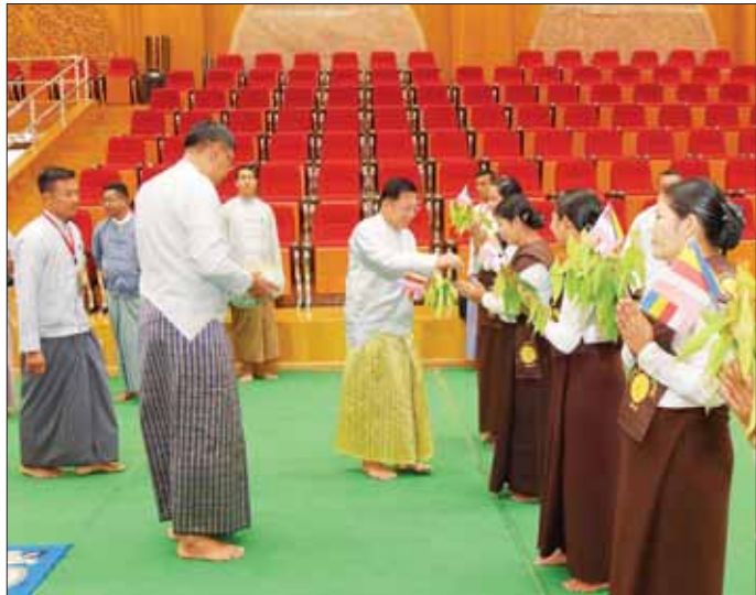
ဦးဆောင်ဘုရားဒါယကာ နိုင်ငံတော်စီမံအုပ်ချုပ်ရေးကောင်စီဥက္ကဋ္ဌ နိုင်ငံတော်ဝန်ကြီးချုပ် ဗိုလ်ချုပ်မှူးကြီး မင်းအောင်လှိုင်နှင့်ဇနီး ဒေါ်ကြူကြူလှ အခမ်းအနားအောင်မြင်ခြင်းအထိမ်းအမှတ် ရတနာ ရွှေမိုးငွေမိုးများ ရွာသွန်းဖြူးစဉ်။