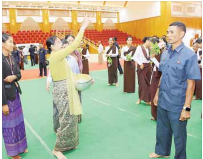
ဦးဆောင်ဘုရားဒါယကာ နိုင်ငံတော်စီမံအုပ်ချုပ်ရေးကောင်စီဥက္ကဋ္ဌ နိုင်ငံတော်ဝန်ကြီးချုပ် ဗိုလ်ချုပ်မှူးကြီး မင်းအောင်လှိုင်နှင့်ဇနီး ဒေါ်ကြူကြူလှ အခမ်းအနားအောင်မြင်ခြင်းအထိမ်းအမှတ် ရတနာ ရွှေမိုးငွေမိုးများ ရွာသွန်းဖြူးစဉ်။