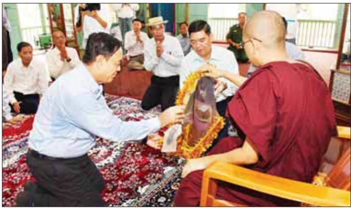
ပြည်ထောင်စုဝန်ကြီး ဦးလှမိုး ကျားရပ်ပရိယတ္တိဘိဝံသတိုက် ဆရာတော်ထံ နာကမ္မအလှူငွေများနှင့် လှူဖွယ်ဝတ္ထုပစ္စည်းများ ဆက်ကပ်လှူဒါန်းစဉ်။

အစီအစဉ်လည်း ဖြစ်ကြောင်း၊ အဆိုပါ လှူဒါန်းဆန်များကို သက်ဆိုင်ရာ ပြည်သူများထံ ထိထိရောက်ရောက် ထောက်ပံ့နိုင်ရေး ကူညီဆောင်ရွက်ပေးကြသည့် (APTERR) အတွင်းရေးမှူးရုံးမှ အဖွဲ့ဝင်များ၊ အလှူရှင်နိုင်ငံများဖြစ်သော ဂျပန်နှင့် ကိုရီးယားသမ္မတနိုင်ငံတို့နှင့်အတူ ပူးပေါင်းပါဝင် ဆောင်ရွက်ခဲ့ကြသည့် တာဝန်ရှိသူများအားလုံးကို အထူးကျေးဇူးတင်ရှိကြောင်း ပြောကြားသည်။ ရှင်းလင်းပြောကြား ယင်းနောက်ပြည်နယ်ဝန်ကြီးချုပ် ဦးထိန်လင်းနှင့် စိုက်ပျိုးရေး၊ မွေးမြူရေးနှင့် ဆည်မြောင်း