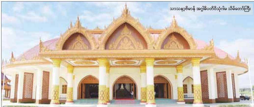
သာသနာဗိမာန် အဂ္ဂိမိပတိဝိသုဂါမ သိမ်တော်ကြီး

နှင့် အခမ်းအနားတက်ရောက်လာကြသူများက ဗုဒ္ဓရုပ်ပွားတော်မြတ်အား ပရိတ်နံ့သာရည်များဖြင့် ပတ်ဖျန်းပူဇော်ကြသည်။ ထို့နောက် “ဇယန္တော ဗောဓိယာမူလေ” အစရှိ အောင်ဂါထာတော်များကို ရွတ်ဆိုပူဇော်၍ အခမ်းအနားမှူးက အောင်ဆုမင်္ဂလာ အမျှဝေစာတမ်းလွှာကို ဖတ်ကြားကာ မေတ္တာပြုအမျှပေးဝေကြသည်။