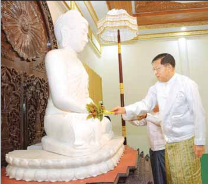
ဦးဆောင်ဘုရားဒါယကာ နိုင်ငံတော်စီမံအုပ်ချုပ်ရေးကောင်စီဥက္ကဋ္ဌ နိုင်ငံတော်ဝန်ကြီးချုပ် ဗိုလ်ချုပ်မှူးကြီး မင်းအောင်လှိုင် ဗုဒ္ဓရုပ်ပွားတော်မြတ်အား ပရိတ်နံ့သာရည်များဖြင့် ပက်ဖျန်းပူဇော်စဉ်။