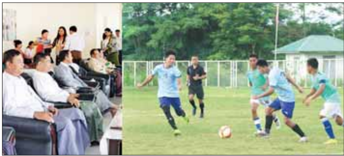
သက်ဆိုင်ရာ ဝန်ကြီးဌာနများမှ ဝန်ထမ်းမိသားစုများ ဆက်လက်ယှဉ်ပြိုင် ကစားကြမည်ဖြစ်ပြီး ဇူလိုင်နှင့် ဝါသနာရှင်ပြည်သူများ လာရောက်ကြည့်ရှုအားပေးကြသည်။ (အပေါ်ပုံ) ဇွန် ၂၉ ရက်တွင် ပြိုင်ပွဲကို ခေတ္တရပ်နားမည်ဖြစ်ပြီး ဇွန် ၃၀ ရက်တွင် သတိမှတ်ထားသည့် အုပ်စုအလိုက် အုပ်စု ပထမ၊ ဒုတိယ၊ တတိယအသင်းများ သတင်းစဉ်

ပို့ဆောင်ရေးနှင့်ဆက်သွယ်ရေးဝန်ကြီးဌာန အသင်းတို့ ယှဉ်ပြိုင်ကစားကြရာ တစ်ဖက် နှစ်ဂိုးစီဖြင့် သရေကျခဲ့သည်။ ထို့အတူ ဝဏ္ဏသိဒ္ဓိအားကစားကွင်းရှိ လေ့ကျင့်ရေးကွင်းအမှတ်(၁)၌ အုပ်စု(၁)မှ ကျန်းမာရေးဝန်ကြီးဌာနအသင်းနှင့် စိုက်ပျိုးရေး၊ မွေးမြူရေးနှင့် ဆည်မြောင်းဝန်ကြီးဌာနအသင်းတို့ ဆက်လက်ယှဉ်ပြိုင်ကစားကြရာ တစ်သင်းနှင့် တစ်သင်းဂိုးမသွင်းနိုင်ဘဲ ဂိုးမရှိ သရေကျခဲ့သည်။ ယနေ့ကျင်းပသည့် အုပ်စုပွဲစဉ်များ၏ ယှဉ်ပြိုင်ကစားမှုများကို အားကစားနှင့် လူငယ်ရေးရာဝန်ကြီးဌာနမှ ပြည်ထောင်စုဝန်ကြီး ဦးမင်းသိန်း၊ ဒုတိယဝန်ကြီးများ၊ ညွှန်ကြားရေးမှူးချုပ်များ၊ ပါမောက္ခချုပ်များ၊ ဒုတိယညွှန်ကြားရေးမှူးချုပ်များ၊ ပြိုင်ပွဲကျင်းပရေးကော်မတီဝင်များနှင့်တာဝန်ရှိသူများ၊ ပြိုင်ပွဲဝင်အသင်းများမှ အားကစားသမားများ၊ တက္ကသိုလ်ကျောင်းသား ကျောင်းသူများ၊ ဆရာ ဆရာမများ၊