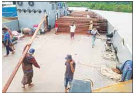
သွားသည်။ အဆိုပါ စစ်ရေယာဉ်မှ သယ်ဆောင်လာသည့် ထောက်ပံ့ရေးနှင့် ကယ်ဆယ်ရေးပစ္စည်းများအား တာဝန်ရှိသူများထံသို့ ပို့ဆောင်ပေးထားသည်။

နေပြည်တော် ဇွန် ၂၈ ဆိုင်ကလုန်းမုန်တိုင်း မိုခါ (MOCHA) ဖြတ်သန်းတိုက်ခတ်မှုကြောင့် ထိခိုက်ပျက်စီးဆုံးရှုံးမှုများ ဖြစ်ပေါ်ခဲ့သော ရခိုင်ပြည်နယ်အတွင်းရှိ မုန်တိုင်းဒဏ်သင့်ပြည်သူများအား လိုအပ်သော ပစ္စည်းများ ကူညီထောက်ပံ့မှုများ ဆောင်ရွက်ပေးနိုင်ရန် တပ်မတော်(ရေ)မှ ၅၆ စီတာ ကမ်းထိုး ရေယာဉ်နှစ်စင်းသည် မြန်မာ့သစ် လုပ်ငန်းမှ သစ်ခွံသား ဆိုက်စုံ ၁၃၆၁ ချောင်း စုစုပေါင်း တန် ၂၀၀ ခန့်အား တောင်ကုတ်မြို့၌ တင်ဆောင်၍ ရသေ့တောင်သို့ ယနေ့ညနေပိုင်းတွင် ထွက်ခွာ