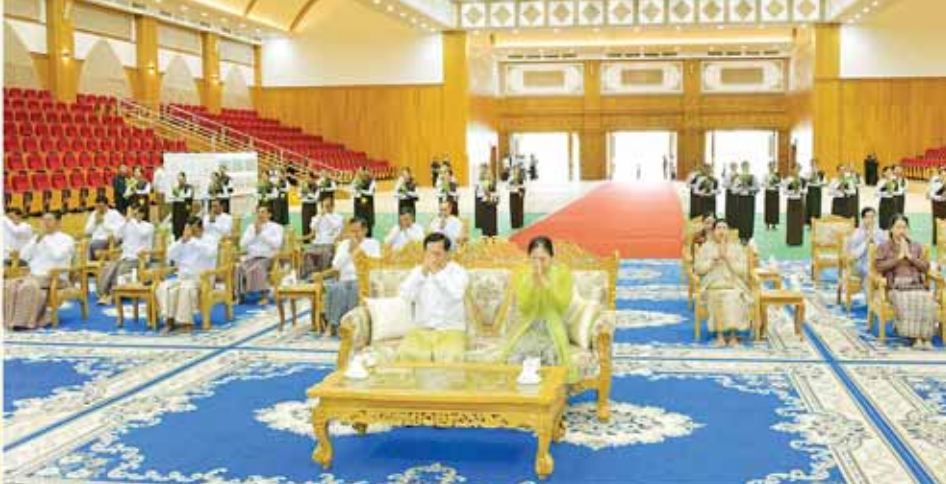
ဦးဆောင်ဘုရားဒါယကာ နိုင်ငံတော်စီမံအုပ်ချုပ်ရေးကောင်စီဥက္ကဋ္ဌ နိုင်ငံတော်ဝန်ကြီးချုပ် ဗိုလ်ချုပ်မှူးကြီး မင်းအောင်လှိုင်နှင့်ဇနီး ဒေါ်ကြူကြူလှ အမှူးပြုသည့်ဧည့်ပရိသတ်များက ရတနတ္ထယုဇာဂါထာတော်နှင့် သဗ္ဗသင်္ဂါဟက မေတ္တာပို့လင်္ကာနှစ်ပိုဒ်ကို သံပြိုင်ညီညာ သုံးကြိမ်ရွတ်ဆိုပူဇော်ကြသည်။