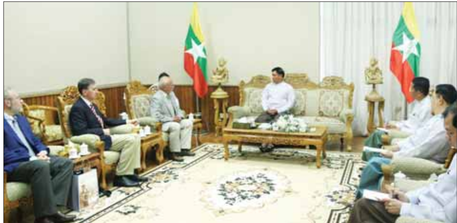
နိုင်ငံတော်စီမံအုပ်ချုပ်ရေးကောင်စီဝင် ဒုတိယဝန်ကြီးချုပ်နှင့် ပြည်ထောင်စုဝန်ကြီး ဗိုလ်ချုပ်ကြီး တင်အောင်စန်း ရုရှား - မြန်မာ ချစ်ကြည်ရေးနှင့် ပူးပေါင်းဆောင်ရွက်ရေးအသင်း ဒုတိယဥက္ကဋ္ဌ မစ္စတာအန်နာသိုလီ ဘူးလော့ချိန်ကော့ ဦးဆောင်သော ကိုယ်စားလှယ်အဖွဲ့အား လက်ခံတွေ့ဆုံစဉ်။

နိုင်ငံတော်စီမံအုပ်ချုပ်ရေးကောင်စီဝင် ဒုတိယဝန်ကြီးချုပ်နှင့် ပို့ဆောင်ရေးနှင့် ဆက်သွယ်ရေးဝန်ကြီးဌာန ပြည်ထောင်စုဝန်ကြီး ဗိုလ်ချုပ်ကြီး တင်အောင်စန်းသည် ရုရှား - မြန်မာ ချစ်ကြည်ရေးနှင့် ပူးပေါင်းဆောင်ရွက်ရေးအသင်း ဒုတိယဥက္ကဋ္ဌ မစ္စတာအန်နာသိုလီ ဘူးလော့ချိန်ကော့ ဦးဆောင်သော ကိုယ်စားလှယ်အဖွဲ့အား ယနေ့ နံနက်ပိုင်းတွင် နေပြည်တော်ရှိ ပို့ဆောင်ရေးနှင့် ဆက်သွယ်ရေးဝန်ကြီးဌာန ရုံးအမှတ်(၅) ၌ လက်ခံတွေ့ဆုံသည်။