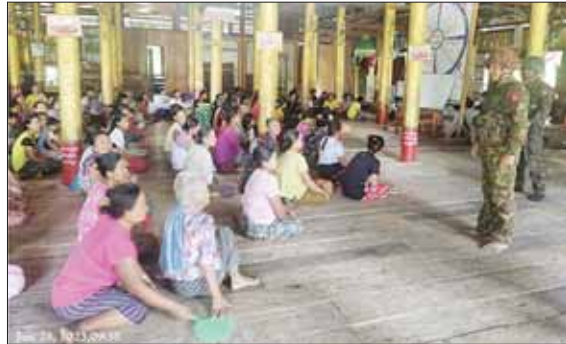
KNDF နှင့် KNPP အကြမ်းဖက်လက်နက်ကိုင်အဖွဲ့တို့ တိုက်ခိုက်သိမ်းပိုက်ထားသည့် စွတ်ပိုင်ဒေသအား ပြန်လည်ထိန်းချုပ်နိုင်ခဲ့ပြီး ရွာသစ်မြို့ ရွှေကျောင်းဘုန်းကြီးကျောင်းရှိ အကြမ်းဖက်သမားများကြောင့် နေရပ်စွန့်ခွာနေရသူများအား အားပေးစကားပြောကြားစဉ်။

ဆက်သွယ်မှုပြန်လည်ရရှိ ဇွန် ၁၇ ရက်နံနက်ပိုင်းတွင် အမှတ် (၁၀၀၄) နယ်ခြားစောင့်တပ်တွင် တာဝန်ထမ်းဆောင်လျက်ရှိသည့် တပ်မတော်အရာရှိ တစ်ဦးနှင့် ဆက်သွယ်မှုပြန်လည်ရရှိခဲ့ပြီး ၎င်း၏ သတင်းပို့ချက်အရ အမှတ် (၁၀၀၄) နယ်ခြားစောင့်တပ်မှ အသွင်ပြောင်း တပ်ဖွဲ့ဝင် အချို့သည် တပ်ဆင်ပေးထားသည့် လက်နက်၊ ခဲယမ်းများနှင့် အတူ နိုင်ငံတော်နှင့် တပ်မတော်အပေါ် သစ္စာဖောက်ဖျက် တောခိုခဲ့ပြီး KNPP အကြမ်းဖက် လက်နက်ကိုင်အဖွဲ့နှင့် KNDF အကြမ်းဖက်အဖွဲ့များနှင့် ပူးပေါင်းသွားကြောင်း၊ ၎င်းတပ်တွင် တာဝန်ထမ်းဆောင်လျက် ရှိသည့် တပ်မတော်သားများနှင့် မိသားစုဝင်များအား သက်ဆိုင်ရာ ရုံး၊ အဆောက်အဦ အသီးသီးတွင်