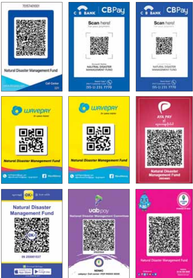
အမျိုးသားသဘာဝဘေးအန္တရာယ်ဆိုင်ရာစီမံခန့်ခွဲမှုကော်မတီ

ကိုဗစ်-၁၉ ရောဂါ ဓာတ်ခွဲအတည်ပြု လူနာသစ် ၄၅ ဦး တွေ့ရှိ (၂၈-၆-၂၀၂၃) ရက်နေ့၊ ည (၈:၀၀) နာရီ ကျန်းမာရေးဝန်ကြီးဌာနသည် ကိုဗစ်-၁၉ သံသယလူနာများ၊ ဓာတ်ခွဲအတည်ပြုလူနာနှင့် အနီးကပ်ထိတွေ့ခဲ့သူများနှင့် အသွား အလာကန့်သတ်ထားရှိသူများအား ကိုဗစ်-၁၉ ရောဂါ ရှိမရှိ ဓာတ်ခွဲ စစ်ဆေးခြင်း ပုံမှန်ဆောင်ရွက်လျက်ရှိပြီး (၂၇-၆-၂၀၂၃) ရက်နေ့၊ ည(၈:၀၀)နာရီမှ (၂၈-၆-၂၀၂၃) ရက်နေ့၊ ည (၈:၀၀)နာရီအတွင်း ဓာတ်ခွဲနမူနာစုစုပေါင်း (၇,၀၁၀) ခုအား စစ်ဆေးပြီးစီးခဲ့ရာ ကိုဗစ်-၁၉ ရောဂါ ဓာတ်ခွဲအတည်ပြုလူနာသစ် (၄၅) ဦး တွေ့ရှိရသည်။ ထို့ကြောင့် ယနေ့အတွက် ရောဂါပိုးတွေ့ရှိမှု ရာခိုင်နှုန်းမှာ (၀.၆၄) ရာခိုင်နှုန်း ရှိသည်။ သို့ဖြစ်ပါ၍ ယနေ့အထိ ဓာတ်ခွဲနမူနာစုစုပေါင်း (၁၀,၈၄၇,၁၂၃) ခုအား စစ်ဆေးခဲ့ပြီး ကိုဗစ်-၁၉ ဓာတ်ခွဲအတည်ပြုလူနာ စုစုပေါင်း (၆၄၀,၃၉၁) ဦး ရှိပြီဖြစ်သည်။ ဓာတ်ခွဲအတည်ပြုလူနာများအား နေအိမ်တွင်သီးခြားထားရှိခြင်းနှင့် ဆေးရုံများတွင် သီးခြားထားရှိကုသမှုပေးခြင်းများ ဆောင်ရွက်ခဲ့ရာ ယနေ့တွင် ပြန်လည်ကောင်းမွန်လာသူ (၃၈) ဦး ရှိသဖြင့် ယနေ့အထိ ပြန်လည်ကောင်းမွန်လာသူ စုစုပေါင်း (၆၁၉,၃၁၀) ဦး ရှိပြီဖြစ်သည်။ ယနေ့တွင် ကိုဗစ်-၁၉ ရောဂါဖြင့် သေဆုံးသူမရှိသဖြင့် ယနေ့အထိ သေဆုံးသူစုစုပေါင်း (၁၉,၄၉၄) ဦး ရှိသည်။ ကိုဗစ်-၁၉ ရောဂါဆိုင်ရာ သတင်းအချက်အလက်များကို ကျန်းမာရေးဝန်ကြီးဌာန၏ အင်တာနက်စာမျက်နှာ moh.gov.mm တွင် ဝင်ရောက်ကြည့်ရှုနိုင်ပါသည်။ ကျန်းမာရေးဝန်ကြီးဌာန