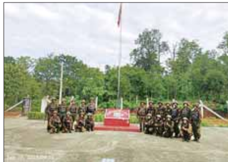
KNDF နှင့် KNPP အကြမ်းဖက်လက်နက်ကိုင်အဖွဲ့တို့ တိုက်ခိုက်သိမ်းပိုက်ထားသည့် စွတ်ပိုင်ဒေသရှိ အမှတ် (၁၀၀၅) နယ်ခြားစောင့်တပ်အား ပြန်လည်တိုက်ခိုက်သိမ်းပိုက်နိုင်ခဲ့ပြီး တပ်ရင်းဗဟိုကင်းအား တွေ့ရစဉ်။