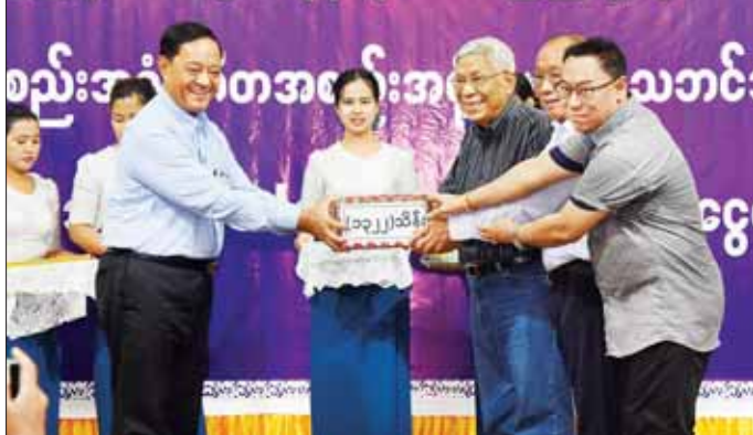
ပြည်ထောင်စုဝန်ကြီး ဦးလှမိုးက ကျေးဇူးတင် နှုတ်ခွန်းဆက်စကား ပြောကြားပြီး မြန်မာနိုင်ငံရုပ်ရှင်

ပြောကြားပြီး ပြည်ထောင်စုဝန်ကြီးနှင့်အဖွဲ့က မြန်မာနိုင်ငံရုပ်ရှင်အစည်းအရုံး၊ ဂီတအစည်းအရုံး(ဗဟို)၊ သဘာပညာရှင်များ အစည်းအရုံးနှင့် Old Star အဖွဲ့တို့အား အမှတ်တရလက်ဆောင်များ ပေးအပ်ကြသည်။ ထို့နောက် ပြည်ထောင်စုဝန်ကြီးနှင့်အဖွဲ့သည် ရခိုင်ပြည်နယ်အစိုးရအဖွဲ့ရုံး၌ ကျင်းပသည့် သဘာဝဘေးပြန်လည်ထူထောင်ရေးဆိုင်ရာ လုပ်ငန်းညှိနှိုင်းအစည်းအဝေးသို့ တက်ရောက်ကြသည်။ အစည်းအဝေးတွင် လုပ်ငန်းကော်မတီများအလိုက် ပြန်လည်ထူထောင်ရေးဆိုင်ရာ လုပ်ငန်းများနှင့် စပ်လျဉ်းသည့် အစည်းအဝေးဆိုင်ရာချက်များအပေါ် လိုက်နာဆောင်ရွက်ပြီးစီးမှု၊ ဆက်လက်ဆောင်ရွက်မည့် အစီအမံများ၊ လုပ်ငန်းတိုးတက်မှု အခြေအနေများနှင့်စပ်လျဉ်းသည့် ရှင်းလင်းတင်ပြချက်များအပေါ် ပြည်ထောင်စုဝန်ကြီးက လိုအပ်သည့် များ ပေါင်းစပ်ညှိနှိုင်း ဆောင်ရွက်ပေးခဲ့ကြောင်း သတင်းရရှိသည်။ သတင်းစဉ်