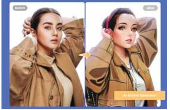
AI နည်းပညာဖြင့် ဖန်တီးထားသည့် ရုပ်ပုံများကို တွေ့ရစဉ်။

ပြပွဲကျင်းပသူက AI သည် ဈေးဝယ်များ၏အသံနှင့် အမူအရာတို့ကို ခွဲခြမ်းစိတ်ဖြာပြီး ၎င်း၏စိတ်ခံစားချက်ကို ဖတ်ရှုနိုင်မည်ဖြစ်ကြောင်း ပြောသည်။ ထုတ်ကုန်လာရောက်ကြည့်ရှုသူများအား အကြံပြုရောင်းချရန် ဒေတာကို အသုံးပြုနိုင်မည်ဖြစ်သည်။