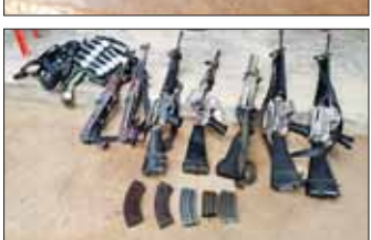
KNDF နှင့် KNPP အကြမ်းဖက်လက်နက်ကိုင်အဖွဲ့တို့ တိုက်ခိုက်သိမ်းပိုက်ထားသည့် ပန်တီန်းဒေသနှင့် စွတ်ပိုင်ဒေသရှိ နယ်ခြားစောင့်တပ်များအား ပြန်လည်တိုက်ခိုက် သိမ်းပိုက်စဉ် ရရှိခဲ့သည့် လက်နက်ခဲယမ်းများအား တွေ့ရစဉ်။