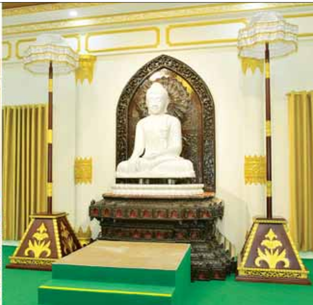
ဦးဆောင်ဘုရားဒါယကာ နိုင်ငံတော်စီမံအုပ်ချုပ်ရေးကောင်စီဥက္ကဋ္ဌ နိုင်ငံတော်ဝန်ကြီးချုပ် ဗိုလ်ချုပ်မှူးကြီး မင်းအောင်လှိုင် မာရဝိဇယဗုဒ္ဓဃျာဉ်တော်အတွင်းရှိ မာရဝိဇယကျောင်းတော်၌ ဗုဒ္ဓရုပ်ပွားတော်မြတ်အား ရတနာပလ္လင်တော်ထက်သို့ မင်္ဂလာစက်ခလုတ်နှိပ်၍ ပင့်ဆောင်စဉ်။