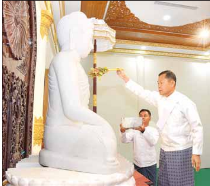
နိုင်ငံတော်စီမံအုပ်ချုပ်ရေးကောင်စီဒုတိယဥက္ကဋ္ဌ ဒုတိယဝန်ကြီးချုပ် ဒုတိယဗိုလ်ချုပ်မှူးကြီး စိုးဝင်း ဗုဒ္ဓရုပ်ပွားတော်မြတ်အား ပရိတ်နံ့သာရည်များဖြင့် ပက်ဖျန်းပူဇော်စဉ်။