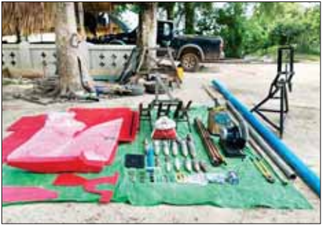
ကျေးရွာဘုန်းတော်ကြီးကျောင်းအတွင်းမှ ထပ်မံသိမ်းဆည်းရမိခဲ့သည့် လက်နက်/ခဲယမ်းများ တွေ့ရစဉ်။

ထိုကဲ့သို့ စစ်ကိုင်းတိုင်းဒေသကြီးအတွင်း အကြမ်းဖက်လုပ်ငန်းများအား ဖမ်းဆီးရမိရေး ဆောင်ရွက်ရာတွင် လုံခြုံရေးတပ်ဖွဲ့ဝင်အချို့ ထိခိုက်ဒဏ်ရာရရှိခဲ့ပြီး နီးစပ်ရာ တပ်မတော်ဆေးရုံသို့ ပို့ဆောင်ဆေးကုသမှုခံယူစေလျက်ရှိသည်။ ဖြစ်စဉ်တွင် သိမ်းဆည်းရမိလက်နက်များနှင့် ဆက်စပ်ပစ္စည်းများအား လုပ်ထုံးလုပ်နည်းများနှင့်အညီ ဆက်လက်ဆောင်ရွက်သွားမည်ဖြစ်ကြောင်းနှင့် အကြမ်းဖက်အဖွဲ့များအနေဖြင့် အဆိုပါလက်နက်များကို ကိုင်ဆောင်၍ ဒေသခံပြည်သူများကို အနိုင်ကျင့်ပိုလ်ကျခြင်း၊ နိုင်ငံ့ဝန်ထမ်းများနှင့် အပြစ်မဲ့ပြည်သူများအပေါ် စိတ်မထင်လျှင် မထင်သလို သတ်ဖြတ်ခြင်းများ ဆောင်ရွက်လျက်ရှိရာ ရပ်ရွာတည်ငြိမ်အေးချမ်းအတွက် လုံခြုံရေးတပ်ဖွဲ့ဝင်များနှင့်အတူ ပြည်သူတစ်ရပ်လုံး ပိုင်းဝန်းပူးပေါင်း ဆောင်ရွက်ပေးနိုင်ပါရန် သတင်းထုတ်ထားသည်။