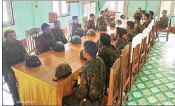
KNDF နှင့် KNPP အကြမ်းဖက်လက်နက်ကိုင်အဖွဲ့တို့ တိုက်ခိုက်သိမ်းပိုက်ထားသည့် စွတ်ပိုင်ဒေသရှိ အမှတ် (၁၀၀၅) နယ်ခြားစောင့်တပ်အား ပြန်လည်တိုက်ခိုက်သိမ်းပိုက်နိုင်ခဲ့ပြီး တပ်ရင်းရုံးအား တွေ့ရစဉ်။