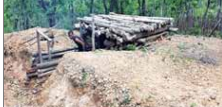
KNDF နှင့် KNPP အကြမ်းဖက်လက်နက်ကိုင်အဖွဲ့တို့ တိုက်ခိုက်သိမ်းပိုက်ထားသည့် ပန်တီန်းဒေသနှင့် စွတ်ပိုင်ဒေသရှိ နယ်ခြားစောင့်တပ်များအား ပြန်လည်တိုက်ခိုက်သိမ်းပိုက်စဉ် ရရှိခဲ့သည့် အကြမ်းဖက်သမားများ၏ အသုံးအဆောင်ပစ္စည်းများနှင့် ကင်းစခန်းများ။