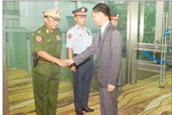
သတင်းစဉ်

နေပြည်တော် ဇွန် ၂၈ ထိုင်းဘုရင့်လေတပ် ဦးစီးချုပ်ဖြစ်သူ Air Chief Marshal Alongkom Vannarot ၏ ဖိတ်ကြားချက် အရ ကာကွယ်ရေးဦးစီးချုပ်(လေ) ဗိုလ်ချုပ်ကြီး ထွန်းအောင် ဦးဆောင်သော တပ်မတော်(လေ) ချစ်ကြည်ရေး ကိုယ်စားလှယ်အဖွဲ့သည် ယနေ့တွင် ထိုင်းနိုင်ငံသို့ လေကြောင်းခရီးဖြင့် ရန်ကုန်မြို့မှ ထွက်ခွာသွားသည်။