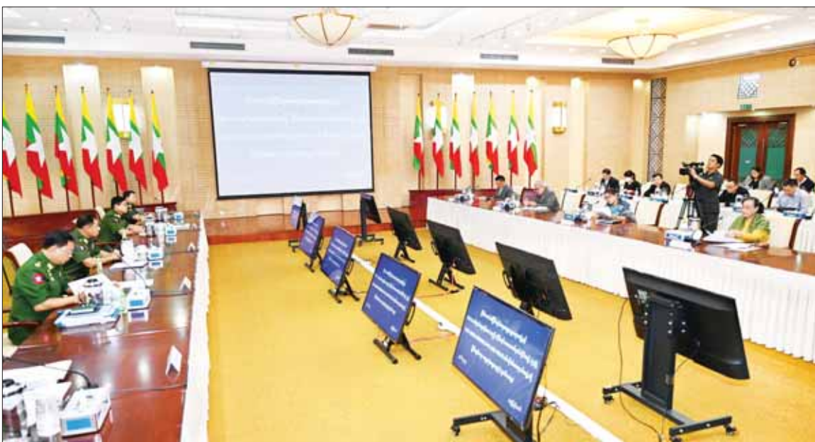
နိုင်ငံတော်၏ငြိမ်းချမ်းရေးဆွေးနွေးရေးအဖွဲ့နှင့် NCA လက်မှတ်ရေးထိုးထားသည့် PPST အဖွဲ့ဝင် တိုင်းရင်းသားလက်နက်ကိုင်အဖွဲ့ (၅)ဖွဲ့ (ALP၊ DKBA၊ KNU/KNLA-PC၊ LDU၊ PNLO)၏ ကိုယ်စားလှယ်အဖွဲ့တို့ ဒုတိယနေ့ တွေ့ဆုံဆွေးနွေးစဉ်။

နေပြည်တော် ဇွန် ၂၇ နိုင်ငံတော်၏ ငြိမ်းချမ်းရေး ဆွေးနွေးရေးအဖွဲ့နှင့် NCA လက်မှတ်ရေးထိုးထားသည့် PPST အဖွဲ့ဝင် တိုင်းရင်းသားလက်နက်ကိုင် အဖွဲ့ (၅)ဖွဲ့ (ALP၊ DKBA၊ KNU/KNLA-PC၊ LDU၊ PNLO)၏ ကိုယ်စားလှယ်အဖွဲ့တို့ တွေ့ဆုံ ဆွေးနွေးပွဲ ဒုတိယနေ့ကို ယနေ့ နံနက်ပိုင်းတွင် နေပြည်တော်ရှိ အမျိုးသားစည်းလုံးညီညွတ်ရေး နှင့် ငြိမ်းချမ်းရေးဗဟိုဆောင်ရွက်မှု ဗဟိုဌာန၌ ကျင်းပပြုလုပ်သည်။ တွေ့ဆုံဆွေးနွေးပွဲသို့ နိုင်ငံတော် စီမံအုပ်ချုပ်ရေးကောင်စီ အဖွဲ့ဝင် ပြည်ထောင်စုဝန်ကြီး ငြိမ်းချမ်းရေး ဆွေးနွေးရေးအဖွဲ့ ခေါင်းဆောင် ဒုတိယဗိုလ်ချုပ်ကြီး ရာပြည့်၊ နိုင်ငံတော်စီမံအုပ်ချုပ်ရေးကောင်စီအဖွဲ့ဝင် ဒုတိယဗိုလ်ချုပ်ကြီး မိုးမြင့်ထွန်း၊ အမျိုးသားစည်းလုံးညီညွတ်ရေး နှင့် ငြိမ်းချမ်းရေးဗဟိုဆောင်ရွက်မှု စာမျက်နှာ ၃ ကော်လံ ၁ □