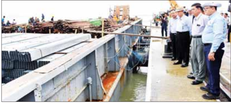
ပြည်ထောင်စုဝန်ကြီး ဦးလှမိုးနှင့်အဖွဲ့ဝင်များ စစ်တွေမြို့ ဘက်စုံသုံးဆိပ်ကမ်း၌ ထောက်ပံ့ရေးပစ္စည်းများ မုန့်တိုင်းဒဏ်သင့် ဒေသများသို့ စနစ်တကျဖြန့်ခွဲပေးပို့နိုင်ရေး စီမံဆောင်ရွက်နေမှုကို ကြည့်ရှုစစ်ဆေးစဉ်။

စီမံဆောင်ရွက်နေမှုများကို ကြည့်ရှုစစ်ဆေးပြီး တာဝန်ရှိသူများကို လိုအပ်သည်များ မှာကြားသည်။ ဆက်လက်၍ ပြည်ထောင်စုဝန်ကြီးနှင့်အဖွဲ့သည် ရခိုင်ပြည်နယ်တိုးတက်ရေးရိပ်သာသို့ ရောက်ရှိပြီး အဘိုး အဘွား ၃၇ ဦးအတွက် စားသောက်ဖွယ်ရာများနှင့် အလှူငွေများ ထောက်ပံ့လှူဒါန်းကာ ရိပ်သာအတွင်း လှည့်လည်ကြည့်ရှုသည်။