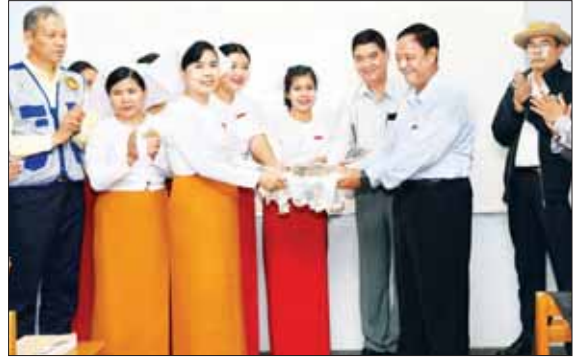
ပြည်ထောင်စုဝန်ကြီး ဦးလှမိုး သူနာပြုနှင့်သားဖွား သင်တန်းကျောင်း သင်တန်းသား သင်တန်းသူများအတွက် စားစရိတ်ထောက်ပံ့ငွေများ ပေးအပ်စဉ်။