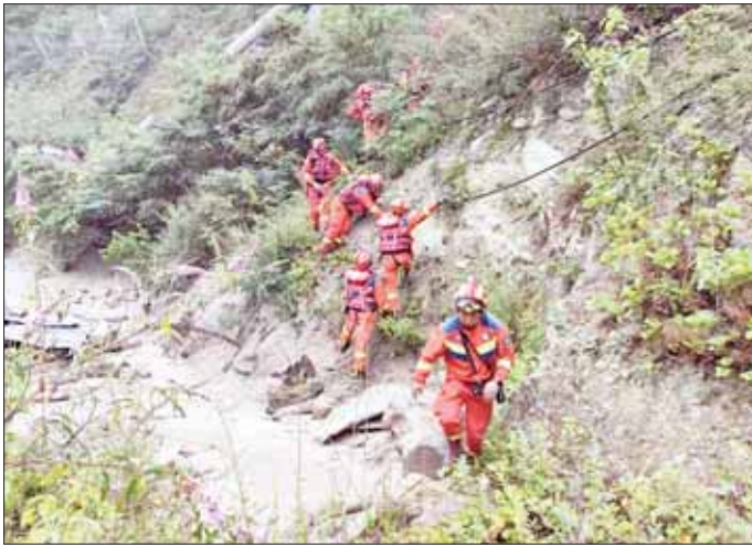
ကယ်ဆယ်ရေးလုပ်သား ၅၀၀ ထို့ပြင် လမ်းများပြင်ရန် ဘေးအန္တရာယ်များကို အကဲဖြတ် ကျော်ကို ကယ်ဆယ်ရေးလုပ်ငန်း ကူညီကယ်ဆယ်ရေး လုပ်သား နိုင်ရန် စောင့်ကြည့်လျက်ရှိ များတွင် ကူညီလုပ်ကိုင်နိုင်ရန် များကိုလည်း စေလွှတ်လိုက်ပြီး ကြောင်း သိရသည်။ နောက်ထပ် ပထဝီဝင်ဆိုင်ရာ ဆင်ဟွာ

ချန်ဒု ဇွန် ၂၇ တရုတ်နိုင်ငံ အနောက်တောင်ပိုင်း စီချွမ်းပြည်နယ်၌ ဇွန် ၂၇ ရက် နံနက်ပိုင်းက မြေပြိုကျမှုတစ်ခု ဖြစ်ပွားခဲ့ရာ လေးဦး သေဆုံးပြီး သုံးဦးပျောက်ဆုံးခဲ့သည်။ အချိန်ခဏတာ အတွင်း ပြင်းထန်သည့် မိုးရွာသွန်းမှုကြောင့် မြေပြိုကျမှုဖြစ်ပွားခဲ့ခြင်း ဖြစ်သည်။ မြေပြိုကျမှုသည် ဝမ်ချွန်းဒေသ မီယမ်စီမြို့နယ်နှင့် ဝေကျီမြို့နယ်တို့တွင် ဖြစ်ပွားခဲ့ခြင်းဖြစ်သည်။ ဇွန် ၂၇ ရက် ဒေသစံတော်ချိန် ညနေ ၅ နာရီအထိ လူပေါင်း ၉၀၀ ကျော် မြေပြိုကျမှုဒဏ်ခံစားခဲ့ရပြီး ၎င်းတို့ကို နေရာရွှေ့ပြောင်းပေးခဲ့ကာ အိုးအိမ်များ ထိခိုက်ခြင်း မရှိခဲ့ကြောင်း စီရင်စုအုပ်ချုပ်ရေးဌာနက ပြောသည်။ မြေပြိုကျမှုများ ဖြစ်ပွားပြီး နောက် ဒေသအာဏာပိုင်များက