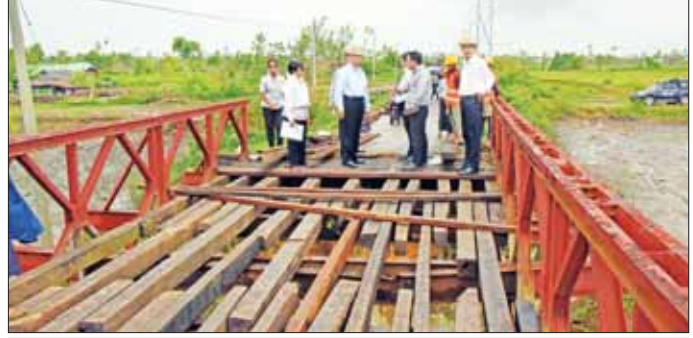
ပြည်ထောင်စုဝန်ကြီး ဦးလှမိုးနှင့်အဖွဲ့ဝင်များ အောင်မင်္ဂလာရပ်ကွက်နှင့် ရွာသစ်ကေကျေးရွာကို ဆက်သွယ် ထားသည့် ဘေလီသစ်သားကြမ်းခင်းတံတား ပြန်လည်တည်ဆောက်နေမှုကို ကြည့်ရှုစစ်ဆေးစဉ်။

မှာကြားသည်။ ညနေပိုင်းတွင် ပြည်ထောင်စုဝန်ကြီးနှင့်အဖွဲ့ သည် ရခိုင်ပြည်နယ်အစိုးရအဖွဲ့ရုံး၌ ကျင်းပသည့် သဘာဝဘေး ပြန်လည်ထူထောင်ရေးဆိုင်ရာ လုပ်ငန်းညှိနှိုင်းအစည်းအဝေးသို့ တက်ရောက်ပြီး လုပ်ငန်းကော်မတီအလိုက် တင်ပြသည့် ပြန်လည် ထူထောင်ရေးဆိုင်ရာ လုပ်ငန်းများအပေါ် လိုအပ် သည့်များ ပေါင်းစပ်ညှိနှိုင်းဆောင်ရွက်ပေးသည်။ ထို့ပြင် စိုက်ပျိုးရေး၊ မွေးမြူရေးနှင့် ဆည်မြောင်း ဝန်ကြီးဌာနမှ ရခိုင်ပြည်နယ်အတွင်းရှိ မြို့နယ်များသို့ ဟင်းသီးဟင်းရွက်မျိုးစေ့များ ပေးအပ်ပို့ဆောင်ပေး နေရာ ကို ယနေ့တွင် ပြည်နယ်စိုက်ပျိုးရေးဦးစီးဌာန၌ ကျင်းပရာ ဒုတိယဝန်ကြီး ဒေါက်တာအောင်ကြီး တက်ရောက်သည်။ အခမ်းအနားတွင် ရခိုင်ပြည်နယ်အတွင်းရှိ ရခိုင် စိုက်ပျိုးရေးဦးစီးမှူးများထံ ရုံးပတီ၊ တိုင်ထောင်ပဲ၊ တိုင်လွတ်ပဲ၊ ရွှေဖရုံ၊ ကျောက်ဖရုံ၊ ခရမ်းသီး၊ ခရမ်း ကြွပ်သီး၊ သခွား၊ ငရုတ်၊ ချဉ်ပေါင်း၊ ကြက်ဟင်းခါး၊ ပဲလင်းမြွေနှင့် ပဲစောင်းလျား စသည့်မျိုးစေ့ထုပ် ၅၅၀၀ ကို ဖြန့်ခွဲပေးအပ်ခဲ့ကြောင်း သိရသည်။ သတင်းစဉ်