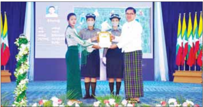
၈၀ ဒသမ ၅ စကကို ဖျက်ဆီးနိုင်ခဲ့ကြောင်း ပြောကြားသည်။ ထို့နောက် အခမ်းအနားတွင် ပြည်နယ်မူးယစ်ဆေးဝါးနှင့် စိတ်ကိုပြောင်းလဲစေသော ဆေးဝါးများ အန္တရာယ်တားဆီးကာကွယ်ရေးအဖွဲ့ဥက္ကဋ္ဌ၊ ပြည်နယ်

မြစ်ကြီးနား ဇွန် ၂၇ (၃၆)ကြိမ်မြောက် အပြည်ပြည်ဆိုင်ရာ မူးယစ်ဆေးဝါး အလွဲသုံးမှုနှင့် တရားမဝင်ရောင်းဝယ်မှု တိုက်ဖျက်ရေးနေ့ အထိမ်းအမှတ် အခမ်းအနားနှင့် ဆုချီးမြှင့်ပွဲကို ယမန်နေ့ နံနက်ပိုင်းက ကချင်ပြည်နယ် မြစ်ကြီးနားမြို့၊ ပြည်သူ့အားကစားကွင်းအတွင်းရှိ မိုးလုံလေလုံ အားကစားခန်းမ၌ ကျင်းပသည်။ အခမ်းအနားတွင် ပြည်နယ်ဝန်ကြီးချုပ် ဦးခက်ထိန်နန်က ကချင်ပြည်နယ်၌ ၂၀၂၂ ခုနှစ်အတွင်း မူးယစ်ဆေးဝါးနှင့် ပတ်သက်သည့် အမှုပေါင်း ၇၆၆ မှု၊ စုစုပေါင်းတန်ဖိုးငွေကျပ် ၁၈၅၂၆ ဒသမ ၁၄၇ သန်း၊ ပြစ်မှုကျူးလွန်သူ ၉၆၆ ဦးနှင့် ၂၀၂၃ ခုနှစ် မေလအထိ မူးယစ်ဆေးဝါးနှင့် ပတ်သက်သည့် အမှုပေါင်း ၂၄၅ မှု စုစုပေါင်းတန်ဖိုးငွေကျပ် ၆၈၃၈ ဒသမ ၃၃၈ သန်း၊ ပြစ်မှုကျူးလွန်သူ ၃၁၀ တို့အား ဖမ်းဆီးအရေးယူနိုင်ခဲ့ကြောင်း၊ အားကစား ၂၀၂၂-၂၀၂၃ ခုနှစ် ဘိန်းစိုက်ရာသီအတွင်း တပ်မတော်၊ မြန်မာနိုင်ငံရဲတပ်ဖွဲ့၊ ဌာနဆိုင်ရာများနှင့် ပြည်သူ့လူထုပူးပေါင်းပြီး ဘိန်းခင်း