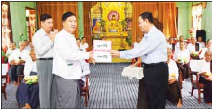
ပြည်ထောင်စုဝန်ကြီး ဦးလှမိုး ရခိုင်ပြည်နယ်တိုးတက်ရေးအဖွဲ့အဖွဲ့အတွက် စားသောက် ဖွယ်ရာများနှင့် အလှူငွေများ ထောက်ပံ့လှူဒါန်းစဉ်။

ထို့နောက် ပြည်ထောင်စုဝန်ကြီးသည် ကျေးလက် ဒေသ ဖွံ့ဖြိုးတိုးတက်ရေးဦးစီးဌာနနှင့် ကျေးလက် လမ်းဖွံ့ဖြိုးတိုးတက်ရေးဦးစီးဌာန ပြည်နယ်၊ ခရိုင်နှင့် မြို့နယ်ရုံးများ၊ သို့လောင်ရုံးများ၊ ဝန်ထမ်းအိမ်ရာများ ကို ကြည့်ရှုစစ်ဆေးပြီး တာဝန်ရှိသူများကို လိုအပ် သည့်များ မှာကြားသည်။ ယင်းနောက် ပြည်ထောင်စုဝန်ကြီးသည် မိုခါ မုန့်တိုင်းတိုက်ခတ်မှုကြောင့် ထိခိုက်ပျက်စီးခဲ့သည့် အောင်မင်္ဂလာရပ်ကွက်နှင့် ရွာသစ်ကေကျေးရွာတို့ကို ဆက်သွယ်ပေးထားသော အရှည် ၈၅ ပေ၊ အကျယ် ၁၂ ပေရှိ ဘေလီသစ်သားကြမ်းခင်းတံတား ပြန်လည် တည်ဆောက်နေမှုကို ကြည့်ရှုစစ်ဆေးပြီး တံတား ရေရှည်တည်တံ့ခိုင်မြဲအောင် စနစ်တကျ တည် ဆောက်သွားရန် မှာကြားသည်။