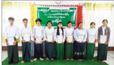
ကျောင်းသူများနှင့် သင်ကြားမှု အထကကျောင်းများသို့ အလှူငွေ ထူးချွန်ဆရာမအား ဂုဏ်ပြုဆုပေး အပ်ခြင်းများ ဆောင်ရွက်ခဲ့ များ ပေးအပ်ချီးမြှင့်ခဲ့ကြောင်းနှင့် ကြောင်း သိရသည်။ သတင်းစဉ်

သစ်ပင်နည်းလာ တို့ကမ္ဘာ၊ လွန်စွာပူအေး ဥတုဘေး