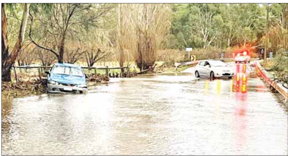
ယနေ့အတွက် မိုးရွာသွန်းခြင်းမရှိဟု မိုးလေဝသ ခန့်မှန်းထားသော်လည်း လမ်းများပေါ်တွင် ရေများရှိနေဆဲဖြစ်ပြီး အပျက်အစီးများလည်း ရှိနေဆဲဖြစ်သည်ဟု အရေးပေါ်ကယ်ဆယ်ရေးဌာနမှ ဒေသအိုရီရန်ကစရီက ပြောသည်။ ဆင်ဟွာ

အခြားသော ထုတ်လုပ်ရေး ပစ္စည်းများနှင့် စတိုး ဈေးကြီးမြင့်သည့်အတွက် ဈေးတက်ရခြင်း ဖြစ်ကြောင်း ကုမ္ပဏီကပြောသည်။ ဟွန်ဒါကားကုမ္ပဏီသည် ထုတ်လုပ်မှုစရိတ်ကြီးမြင့်မှုကို ဖြေရှင်းရန်အတွက် ယခင်ကလည်း ကားမော်ဒယ်အသစ်များကို ဈေးတင်ဖူးသည်။ မကြာသေးမီကလည်း ဈေးကွက်အတွင်းရှိ ကားဈေးနှုန်းကို တိုးမြှင့်ခဲ့ဖူးသည်။ အင်န်အိတ်ချီကေ