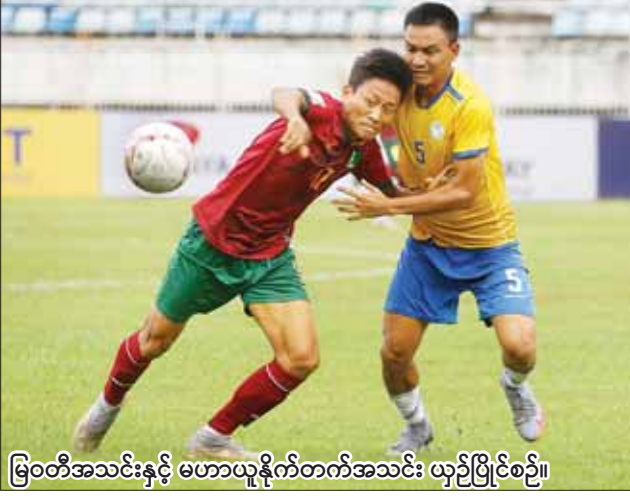
မြဝတီအသင်းနှင့် မဟာယူနိုက်တက်အသင်း ယှဉ်ပြိုင်ပွဲစဉ်။

ရန်ကုန် ၇ ဇွန် ၂၃ ၂၀၂၃ ရာသီ MNL အမှတ်ပေးပြိုင်ပွဲ ပွဲစဉ် (၉) တတိယနေ့ကို ၇ ဇွန် ၂၃ ရက်က သုဝဏ္ဏကွင်း၌ ဆက်လက် ကျင်းပရာ မြဝတီအသင်းက မဟာ ယူနိုက်တက်အသင်းကို သုံးဂိုး-တစ်ဂိုးဖြင့် အနိုင်ရခဲ့သည်။ မြဝတီအသင်းသည် ရာသီ အစတွင် ရန်ကုန်ခွဲရသော်လည်း ယခုနေ့ကပိုင်းပွဲများတွင် နိုင်ပွဲ များရရှိကာ ဇယားအလယ်ပိုင်းမှ စာမျက်နှာ ၁၄ ကော်လံ ၄ ခု