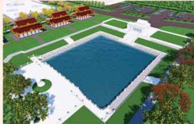
ကျောက်စာရုံစေတီ(၁၂ x ၁၂ x ၁၈)ပေ ၁ ဆူ တန်ဖိုး- ၂၇၉ သိန်း