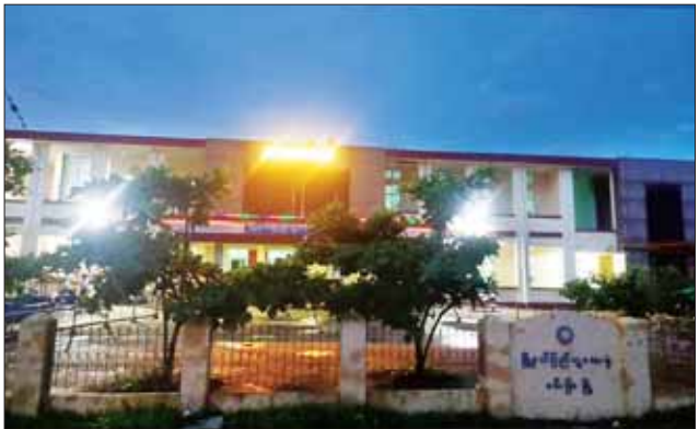
မင်းပြားမြို့၊ လျှပ်စစ်ဓာတ်အားဖြန့်ဖြူးထားရှိမှုကို တွေ့ရစဉ်။