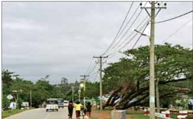
မြောက်ဦးမြို့၊ လျှပ်စစ်ဓာတ်အားဖြန့်ဖြူးထားရှိမှုကို တွေ့ရစဉ်။

ရပ်ကွက်နှင့် ကျေးရွာ ၅၇၅ ရွာ၌ ရွေ့လျား ရေသန့်စင်ကား၊ ဆိုလာ စွမ်းအင်သုံး ရေသန့်စင်စက်နှင့် Life Straw တို့ဖြင့် ရေဂါလန်ပေါင်း စာမျက်နှာ ၈ သို့