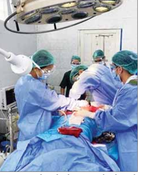
နည်းရောဂါ၊ ဆီးနှင့် ကျောက်ကပ်ရောဂါ၊ အဆုတ်နှင့် ရင်ခေါင်းရောဂါ၊ အရိုး၊ အကြော/အဆစ် ရောဂါ၊ အစာအိမ်နှင့် အူလမ်းကြောင်းရောဂါ၊ ဆီးချို နှင့်ဟော်မုန်းရောဂါ၊ သွေးရောဂါ၊ အရေပြားရောဂါ၊ ဦးနှောက်နှင့် အာရုံကြောရောဂါနှင့် အထွေထွေ ရောဂါကုသမားတော်ကြီးများ ပါဝင်သောအဖွဲ့သည် စစ်တွေမြို့သို့ မကြာမီသွားရောက်၍ ဒေသခံပြည်သူ များအား ဆေးကုသမှုများ ဆောင်ရွက်ပေးရန် စီစဉ် လျက်ရှိကြောင်း သိရသည်။

နည်းရောဂါ၊ ဆီးနှင့် ကျောက်ကပ်ရောဂါ၊ အဆုတ်နှင့် ရင်ခေါင်းရောဂါ၊ အရိုး၊ အကြော/အဆစ် ရောဂါ၊ အစာအိမ်နှင့် အူလမ်းကြောင်းရောဂါ၊ ဆီးချို နှင့်ဟော်မုန်းရောဂါ၊ သွေးရောဂါ၊ အရေပြားရောဂါ၊ ဦးနှောက်နှင့် အာရုံကြောရောဂါနှင့် အထွေထွေ ရောဂါကုသမားတော်ကြီးများ ပါဝင်သောအဖွဲ့သည် စစ်တွေမြို့သို့ မကြာမီသွားရောက်၍ ဒေသခံပြည်သူ များအား ဆေးကုသမှုများ ဆောင်ရွက်ပေးရန် စီစဉ် လျက်ရှိကြောင်း သိရသည်။ သတင်းစဉ်