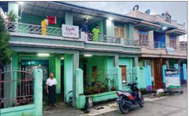
မြေပုံမြို့၊ လျှပ်စစ်ဓာတ်အားဖြန့်ဖြူးထားရှိမှုကို တွေ့ရစဉ်။