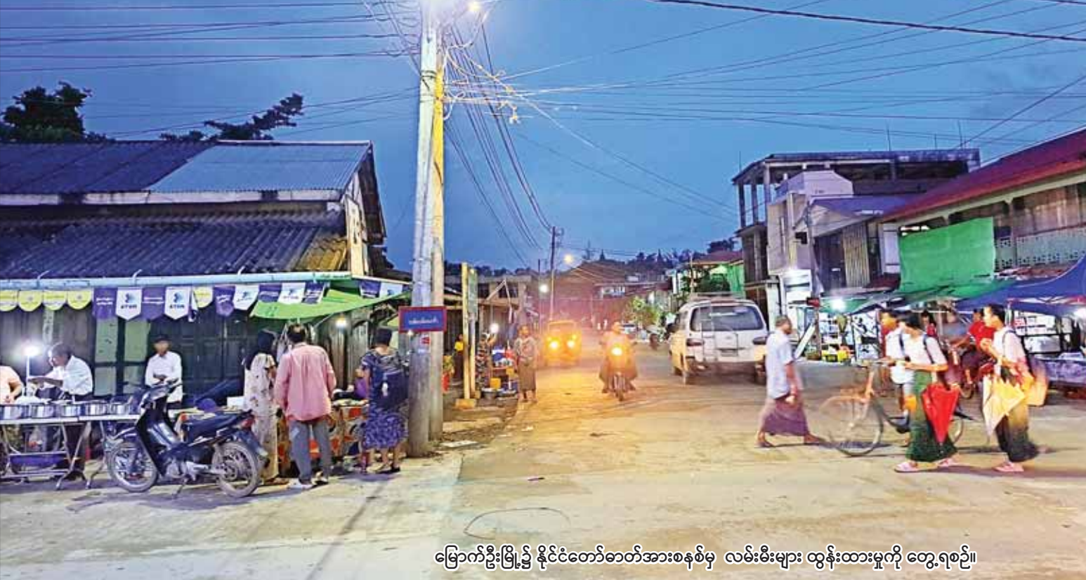
မြောက်ဦးမြို့၌ နိုင်ငံတော်ဓာတ်အားစနစ်မှ လမ်းမီးများ ထွန်းထားမှုကို တွေ့ရစဉ်။

နေပြည်တော် ဇွန် ၂၃ မေ ၁၄ ရက်က အလွန်အားပြင်းသော မိုခါမုန်တိုင်း သက်ရောက်မှုဒဏ်ကြောင့် ရခိုင်ပြည်နယ်မြောက်ပိုင်း ၁၀ မြို့နယ်သို့ ဓာတ်အားပို့လွှတ်ဖြန့်ဖြူးပေးထားသည့် ၂၃၀ ကေစီ၊ ၆၆ ကေစီ၊ ၁၁ ကေစီနှင့် ၄၀၀ ဗို့ ဓာတ်အား လိုင်းများ၊ ဓာတ်အားခွဲရုံများနှင့် ဆက်စပ်ပစ္စည်းများ ပျက်စီးဆုံးရှုံးခဲ့ရာ လျှပ်စစ်စွမ်းအားဝန်ကြီးဌာနမှ ကျွမ်းကျင်ဝန်ထမ်းများ၏ အားသွန်ခွန်စိုက်ကြိုးပမ်း ဆောင်ရွက်မှုများကြောင့် စစ်တွေမြို့၊ ပုဏ္ဏားကျွန်းမြို့နှင့် ကျောက်တော်မြို့များသို့ ဇွန် ၇ ရက်နှင့် ဇွန် ၁၈ ရက် တို့တွင် ဓာတ်အားစနစ်မှ လျှပ်စစ်ဓာတ်အား ပြန်လည်ဖြန့်ဖြူးပေးနိုင်ခဲ့ပြီးဖြစ်သည်။ ဆက်လက်၍ ရခိုင်ပြည်နယ်မြောက်ပိုင်းဒေသရှိ ကျန်ရှိနေသော ဒေသများအား လျှပ်စစ်မီးရရှိနိုင်ရေး အရှိန်အဟုန်ဖြင့် ဆောင်ရွက်ခဲ့ရာ ဇွန် ၂၃ ရက်တွင် ၆၆ ကေစီ ပုဏ္ဏားကျွန်း - မြောက်ဦး ဓာတ်အားလိုင်း ပြုပြင်ခြင်းလုပ်ငန်း ရာနန်းပြည့် ပြုပြင်ဆောင်ရွက်ပြီးဖြစ်သဖြင့် စာမျက်နှာ ၅ ကော်လံ ၁၀