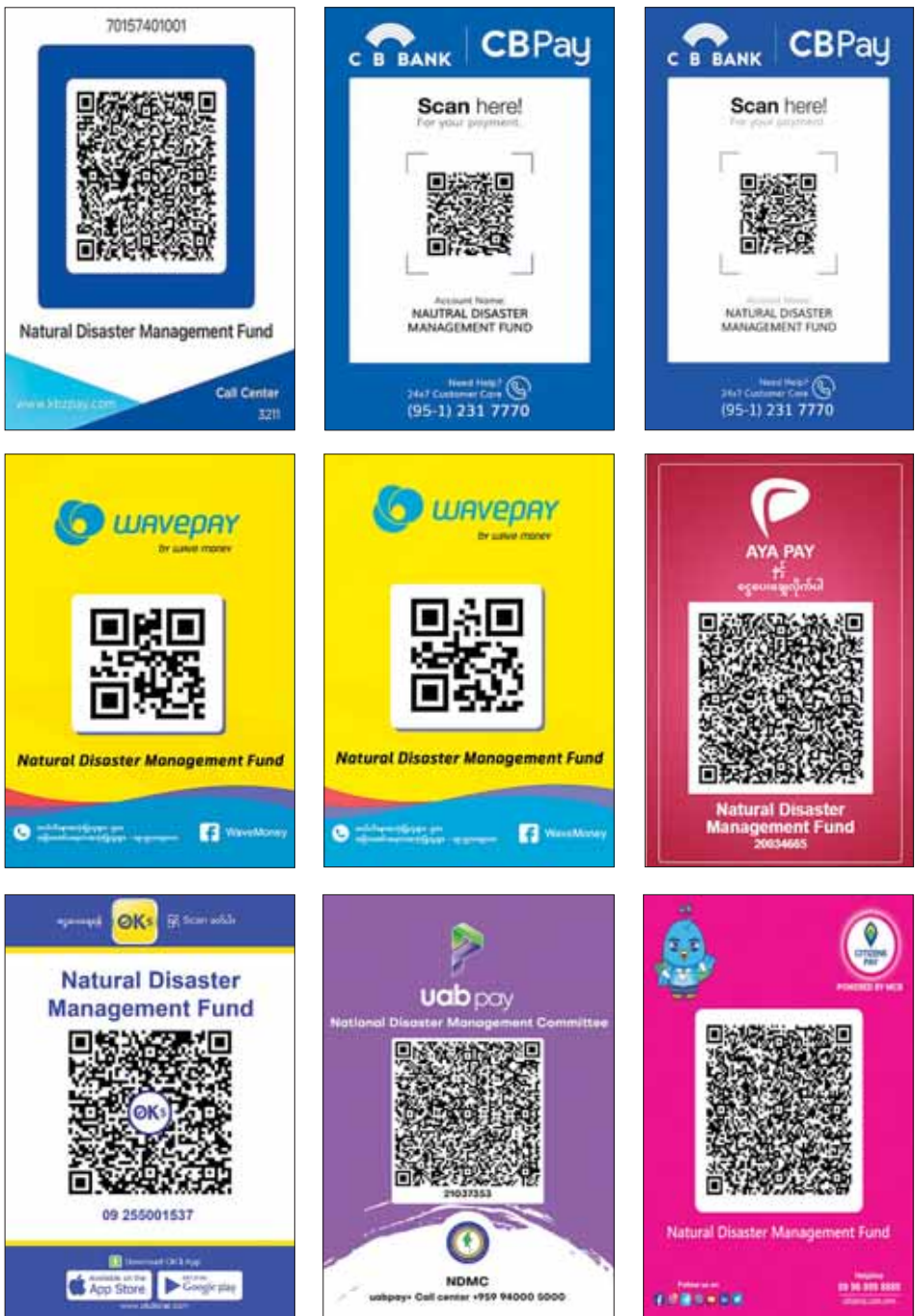
အမျိုးသားသဘာဝဘေးအန္တရာယ်ဆိုင်ရာစီမံခန့်ခွဲမှုကော်မတီ