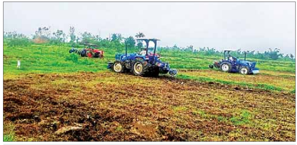
မောင်တောမြို့နယ် ကိုင်းကြီးကျေးရွာ၌ စက်မှုလယ်ယာဦးစီးဌာန ထွန်စက်များဖြင့် ထွန်ယက်စဉ်။