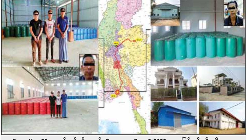
Operation 39 ဆောင်ရွက်စဉ်အတွင်း Precursor Case 2/2023 အနေဖြင့် ဖမ်းဆီးရမိမှုများ။