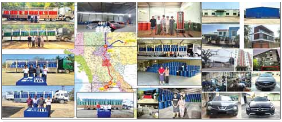
Operation 39 ဆောင်ရွက်စဉ်အတွင်း Precursor Case 1/2023 အနေဖြင့် ဖမ်းဆီးရမိမှုများ။