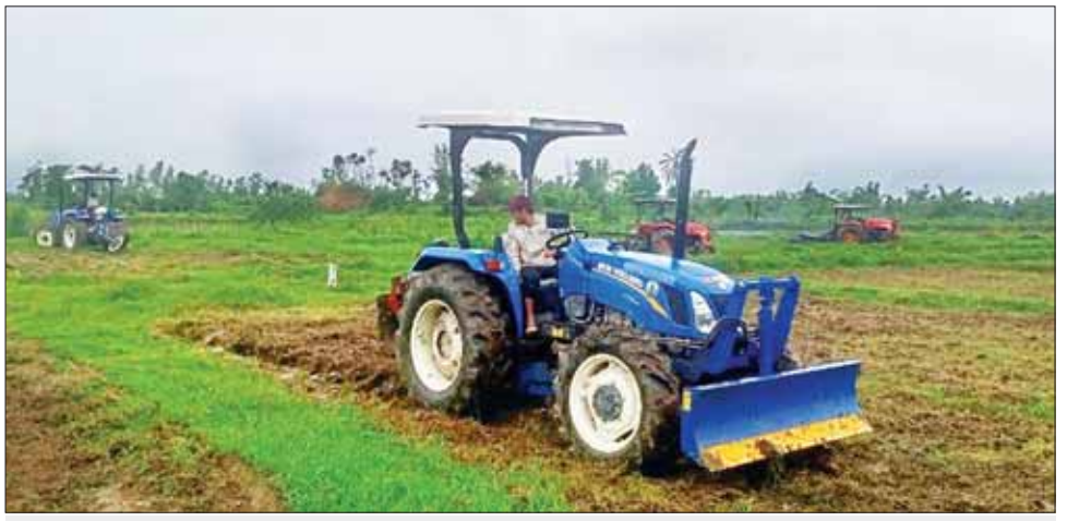
ရေသေတောင်မြို့နယ် လောင်းချောင်းကျေးရွာ၌ စက်မှုလယ်ယာဦးစီးဌာန ထွန်စက်များဖြင့် ထွန်ယက်စဉ်။