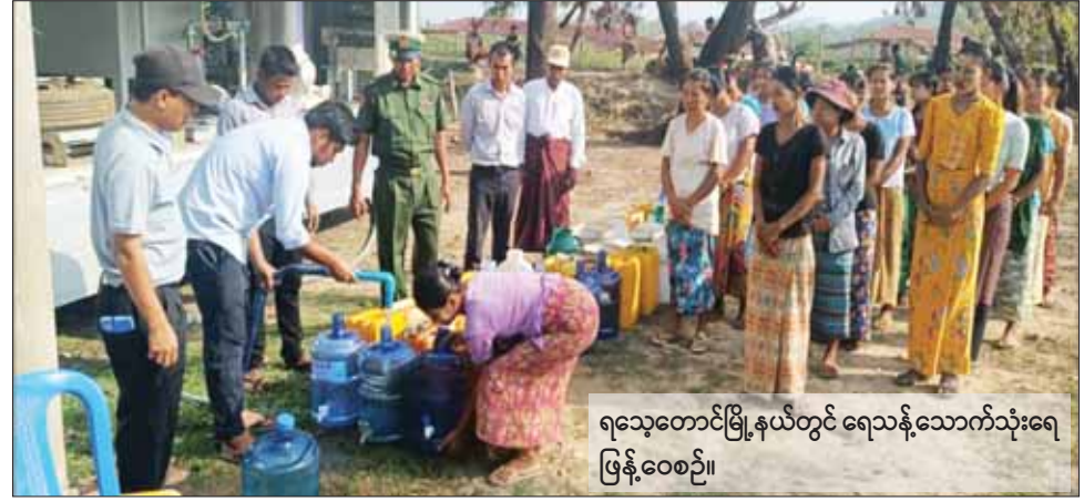
ရေသေတောင်မြို့နယ်တွင် ရေသန့်သောက်သုံးရေ ဖြန့်ဝေစဉ်။

မြို့ရှိ ဓာတ်အားခွဲရုံမှတစ်ဆင့် မြောက်ဦးမြို့ပေါ် ရပ်ကွက် ခုနစ်ရပ်ကွက်နှင့် ကျေးရွာ ၂၆ ရွာကို လည်းကောင်း၊ မင်းပြားဓာတ်အားခွဲရုံမှတစ်ဆင့် မင်းပြားမြို့ပေါ် ရှစ်ရပ်ကွက်နှင့် ကျေးရွာ သုံးရွာသို့လည်းကောင်း၊ မြေပုံဓာတ်အားခွဲရုံမှတစ်ဆင့် မြေပုံမြို့ရှိ ရပ်ကွက်ကိုးခုနှင့် ကျေးရွာ ငါးရွာသို့လည်းကောင်း လျှပ်စစ်ဓာတ်အားဖြန့်ဖြူးပေးထားပြီး ဖြစ်ကြောင်း သိရသည်။ သတင်းစဉ်