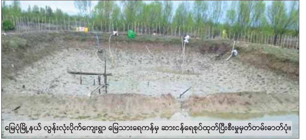
မြေပုံမြို့နယ် လွန်းလုံးပိုက်ကျေးရွာ မြေသားရေကန်မှ ဆားငန်ရေစုပုံထုတ်ပြီးစီးမှုမှတ်တမ်းဓာတ်ပုံ။