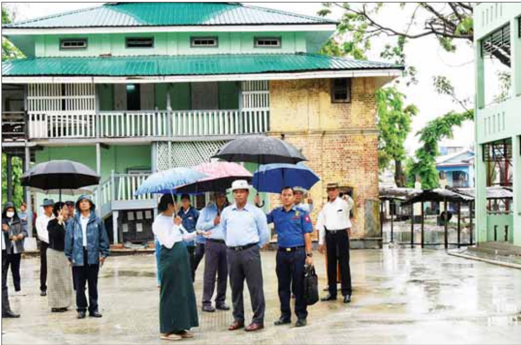
နိုင်ငံတော်စီမံအုပ်ချုပ်ရေးကောင်စီအဖွဲ့ဝင် ဒုတိယဝန်ကြီးချုပ်နှင့် ပြည်ထောင်စုဝန်ကြီး ဗိုလ်ချုပ်ကြီး တင်အောင်စန်းနှင့် အဖွဲ့ဝင်များ စစ်တွေမြို့ရှိ အမှတ်(၂) အခြေခံပညာအထက်တန်းကျောင်း၌ မိုခမန်တိုင်းတိုက်ခတ်မှုကြောင့် ထိခိုက်ပျက်စီးခဲ့သည့် စာသင်ဆောင်များ ပြန်လည်ပြင်ဆင်ပြီးစီးမှုကို ကြည့်ရှုစစ်ဆေးစဉ်။

ရခိုင်ပြည်နယ်အတွင်း မုန်တိုင်းဒဏ်ကြောင့် ပျက်စီးဆုံးရှုံးမှုများ ပြန်လည်ထူထောင်ရေးလုပ်ငန်းများကို အနီးကပ်ကြီးကြပ်ကွပ်ကဲရန် စစ်တွေမြို့၌ ရောက်ရှိနေသော နိုင်ငံတော်စီမံအုပ်ချုပ်ရေးကောင်စီအဖွဲ့ဝင် ဒုတိယဝန်ကြီးချုပ်နှင့် ပြည်ထောင်စုဝန်ကြီး ဗိုလ်ချုပ်ကြီး တင်အောင်စန်းသည် ပြည်ထောင်စုဝန်ကြီးများဖြစ်ကြသည့် ဒုတိယဗိုလ်ချုပ်ကြီး တွန်းတွန်းနောင်၊ ဦးမျိုးသန့်နှင့် ဒေါက်တာသက်သက်ခိုင်၊ ဒုတိယဝန်ကြီးများ၊ တာဝန်ရှိသူများနှင့်အတူ ယနေ့မုန်းလွဲပိုင်းတွင် စစ်တွေမြို့ရှိ အခြေခံပညာကျောင်းများတွင် ကျောင်းသား ကျောင်းသူများ အေးချမ်းပျော်ရွှင်စွာ ပညာသင်ကြားနေမှုများကို သွားရောက်ကြည့်ရှု အားပေးသည်။