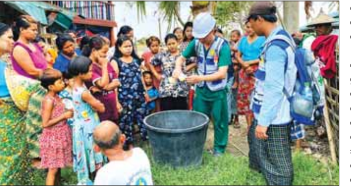
ပေါက်တောမြို့နယ်၌ ကျန်းမာရေးဝန်ထမ်းတစ်ဦးက ရေပုံးအတွင်း ရေသန့်ဆေးရည်နမူနာခတ်ပေးစဉ်။

ပြေ ။ ။ လက်ရှိမှာ ရခိုင်ပြည်နယ်အတွင်းရှိ မြို့နယ် ဆေးရုံ တိုက်နယ်ဆေးရုံတွေမှာ ဆေးရုံ လုပ်ငန်းတွေ ပုံမှန်လည်ပတ်လျက်ရှိပြီး ခွဲစိတ်ကုသမှု လုပ်ငန်း၊ ပြင်ပလူနာ၊ အတွင်းလူနာတွေကို လက်ခံ ကုသပေးခြင်းတွေကို ပုံမှန်အတိုင်း ဆောင်ရွက်ပေး လျက်ရှိရာ ရခိုင်ပြည်နယ်အတွင်းရှိ မြို့နယ်ပြည်သူ့ ဆေးရုံနဲ့ တိုက်နယ်ဆေးရုံ ၅၉ ရုံမှာ မေ ၁၆ ရက်မှ ဇွန် ၇ ရက်အထိ ပြင်ပလူနာအဖြစ် ၁၃၈၅ ဦး၊ နေ့စဉ်အတွင်းလူနာပျမ်းမျှ ၁၀၀၀ ကျော်ကို ကုသမှု တွေ ဆောင်ရွက်ပေးခဲ့ပြီး ကိုယ်ဝန်ဆောင် စောင့်ရှောက်မှုအဖြစ် ၇၃၂၇ ဦးကို ဆောင်ရွက်ပေးနိုင် ခဲ့ပါတယ်။ ကျန်းမာရေးစောင့်ရှောက်မှု စီမံခန့်ခွဲမှုလုပ်ငန်း ကော်မတီအနေနဲ့ ဆေးရုံလုပ်ငန်း ရပ်တန့်မှု မရှိ အောင် စီမံဆောင်ရွက်ခဲ့တာကြောင့် ရခိုင်ပြည်နယ် မှာ မေ ၁၅ ရက်မှာ အတွင်းလူနာပေါင်း ၅၀၀ ကျော် ကုသပေးခဲ့ရပြီး ဇွန်လဆန်းအထိ အတွင်းလူနာ ၁၂၀၀ ခန့်အထိ ကုသပေးနိုင်ပြီး ပုံမှန်အခြေအနေ အတိုင်း လုပ်ငန်းများ ဆောင်ရွက်နေပြီဖြစ်ပါတယ်။ ကျေးလက်ဒေသတွေရဲ့ ကျန်းမာရေးစောင့်ရှောက်မှု အတွက် ကျေးလက်ကျန်းမာရေးဌာန၊ ဒါမှမဟုတ် ကျေးလက်ကျန်းမာရေးဌာနခွဲ၊ ဒါမှမဟုတ် အထူးကု ဆေးအဖွဲ့တွေ ကွင်းဆင်းကုသမှု ဒါမှမဟုတ် ရွေ့လျားဆေးပေးခန်း (Mobile Clinic) တွေက စောင့်ရှောက်မှုပေးနေပါတယ်။