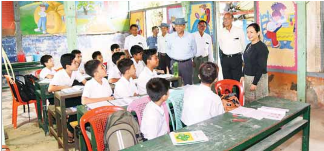
နိုင်ငံတော်စီမံအုပ်ချုပ်ရေးကောင်စီအဖွဲ့ဝင် ဒုတိယဝန်ကြီးချုပ်နှင့် ပြည်ထောင်စုဝန်ကြီး ဗိုလ်ချုပ်ကြီး တင်အောင်စန်းနှင့်အဖွဲ့ဝင်များ အမှတ်(၄) အခြေခံပညာအထက်တန်းကျောင်း၌ ကျောင်းသား ကျောင်းသူများ ပညာသင်ကြားနေမှုကို ကြည့်ရှုအားပေးစဉ်။

လိုအပ်သည်များဖြည့်ဆည်းပေး ဦးစွာ ဗိုလ်ချုပ်ကြီး တင်အောင်စန်းနှင့် အဖွဲ့သည် အမှတ် (၂) အခြေခံပညာအထက်တန်းကျောင်းနှင့် အမှတ် (၄) အခြေခံပညာအထက်တန်းကျောင်းတို့ သို့ သွားရောက်ပြီး ကျောင်းသား ကျောင်းသူများအား ရင်းရင်းနှီးနှီး နှုတ်ဆက်ကာ မိုခမန်တိုင်းတိုက်ခတ်မှုကြောင့် ထိခိုက်ပျက်စီးခဲ့သည့် စာသင်ဆောင်များ ပြန်လည်ပြင်ဆင်ပြီးစီးမှု၊ ကျောင်းသား ကျောင်းသူများ ပညာသင်ကြားနေမှု သင်ထောက်ကူပစ္စည်းများ ပြည့်စုံလုံလောက်မှု ရှိ/မရှိ အခြေအနေ၊ ဆရာနှင့် ကျောင်းသား အချိုးမျှတမှု ရှိ/မရှိ အခြေအနေ၊