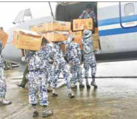
များသို့ ရောက်ရှိသည့် ကယ်ဆယ်ရေး ပစ္စည်းများကို မုန်တိုင်းဒဏ်သင့်ဒေသများသို့ ရဟတ်ယာဉ်များဖြင့် ဆက်လက်ပို့ဆောင်ပေးနိုင်ခဲ့ကြောင်းနှင့် လေဆိပ်များသို့ ရောက်ရှိသည့် ကယ်ဆယ်ရေး ပစ္စည်းများကို မုန်တိုင်းဒဏ်သင့်ဒေသများသို့ ရဟတ်ယာဉ်များဖြင့် ဆက်လက်ပို့ဆောင်ပေးလျက်ရှိရာ တာဝန်ရှိသူများက လက်ခံရယူကြကြောင်း သတင်းရရှိသည်။ သတင်းစဉ်

ထိုသို့ပို့ဆောင်ပေးလျက်ရှိရာ ယနေ့ တွင် တပ်မတော် (ကြည်း)၊ ရေ (လေ) မိသားစုများ၊ စေတနာ့အဖွဲ့အစည်းများ၊ ပန်ရှင် အလှူရှင်များက လှူဒါန်းသည့် ဆန်၊ ငါးသေတ္တာ၊ ပန်ရှင် နှစ်ပြန်ကြော်၊ ခေါက်ဆွဲခြောက်၊ ခရမ်းချဉ်သီး စသည့်အခြေခံစားသောက်ကုန်ပစ္စည်း၊ အိမ်သုံးပစ္စည်း ၂ ဒသမ ၇ တန်ကို ရန်ကုန်အပြည်ပြည်ဆိုင်ရာ လေဆိပ်မှစစ်တွေလေဆိပ်သို့ တပ်မတော် (လေ) မှ လေယာဉ်ဖြင့် ပို့ဆောင်ပေးခဲ့သည်။