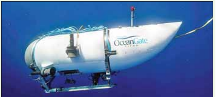
ရေမျက်နှာပြင်အောက် မီတာ ၄၀၀၀ ခန့်အတွက် သမုဒ္ဒရာကြမ်းပြင်တွင် ရှိသည်။ နောက်ဆုံးရသတင်းများတွင် ကနေဒါရှာဖွေရေး ယာဉ်က အတ္တလန္တိတ် သမုဒ္ဒရာအနက်ပိုင်းမှ အသံများကြားရကြောင်း ဖော်ပြထားသည်။ အင်န်အိတ်ချ်ကေ

ပြီး ရေအောက် ငုပ်လျှိုးသွားပြီးနောက် နှစ်နာရီခန့် အကြာတွင် ထောက်ပံ့ရေး သင်္ဘောနှင့် အဆက် အသွယ် ပြတ်တောက်သွားခဲ့ကြောင်း သိရ သည်။ အဆိုပါ ရေငုပ်ယာဉ်သည် ရေအောက်တွင် ၉၆ နာရီကြာနေနိုင်သော်လည်း ယခုသတင်းစာရှင်းလင်း ပွဲ ပြုလုပ်နေချိန်တွင် အောက်ဆီဂျင်ကျန်ရှိမှု နာရီ ၄၀ ခန့်သာ ရှိတော့ကြောင်း အရာရှိတစ်ဦးက ပြော သည်။ အမေရိကန်၊ ကနေဒါစစ်တပ်နှင့် ကမ်းခြေ စောင့်တပ်ဖွဲ့သည် လေယာဉ်၊ ကင်မရာနှင့် စက်ရုပ် လက်တံများ တပ်ဆင်ထားသော အဝေးထိန်း ရေအောက်ယာဉ်များဖြင့် ရေငုပ်ယာဉ်ရှာဖွေမှုများကို ဖြန့်ကြက်လုပ်ဆောင်နေကြောင်း သိရသည်။ ၁၉၁၂ ခုနှစ်တွင် ဗြိတိန်မှ အမေရိကန်နိုင်ငံသို့ သွားရာလမ်းခရီး၌ နှစ်မြုပ်သွားသော တိုက်တန်းနှစ် သင်္ဘောသည် အတ္တလန္တိတ်သမုဒ္ဒရာအလယ်ပိုင်း