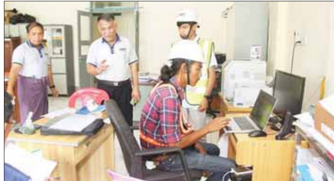
MPT မှ စစ်တွေမြို့ ပြည်သူ့ဆေးရုံသို့ လှူဒါန်းသည့် အင်တာနက်စနစ် ဆက်သွယ်တပ်ဆင်ပေးနေစဉ်။