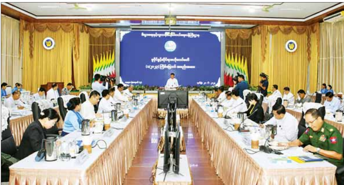
မူပိုင်ခွင့်ဆိုင်ရာ ဗဟိုကော်မတီဥက္ကဋ္ဌ ဒုတိယဝန်ကြီးချုပ်နှင့် ပြည်ထောင်စုဝန်ကြီး ဗိုလ်ချုပ်ကြီး မြထွန်းဦး မူပိုင်ခွင့်ဆိုင်ရာ ဗဟိုကော်မတီအစည်းအဝေး (၁/၂၀၂၃) တွင် အမှာစကား ပြောကြားစဉ်။

နေပြည်တော် ဇွန် ၂၁ မူပိုင်ခွင့်ဆိုင်ရာ ဗဟိုကော်မတီ အစည်းအဝေး (၁/၂၀၂၃) ကို ယနေ့ နံနက် ၉ နာရီ တွင် နေပြည်တော်ရှိ စီးပွားရေးနှင့် ကူးသန်းရောင်းဝယ်ရေး ဝန်ကြီးဌာန ညီလာခံခန်းမ၌ ကျင်းပရာ မူပိုင်ခွင့်ဆိုင်ရာဗဟိုကော်မတီဥက္ကဋ္ဌ ဒုတိယဝန်ကြီးချုပ်နှင့် ကာကွယ်ရေးဝန်ကြီးဌာန ပြည်ထောင်စုဝန်ကြီး ဗိုလ်ချုပ်ကြီး မြထွန်းဦး တက်ရောက် အမှာစကားပြောကြားသည်။ အစည်းအဝေးသို့ ဗဟိုကော်မတီဒုတိယဥက္ကဋ္ဌ စီးပွားရေးနှင့် ကူးသန်းရောင်းဝယ်ရေး ဝန်ကြီးဌာန ပြည်ထောင်စုဝန်ကြီး ဦးအောင်နိုင်ဦး၊ ကော်မတီဝင် ဒုတိယဝန်ကြီးများ၊ အမြဲတမ်းအတွင်းဝန်များ၊ ဩန်ကြားရေးမှူးချုပ်များ၊ တာဝန်ရှိသူများနှင့် ဖိတ်ကြားထားသူများ တက်ရောက်ကြသည်။ စာမျက်နှာ ၄ ကော်လံ ၁ ❖