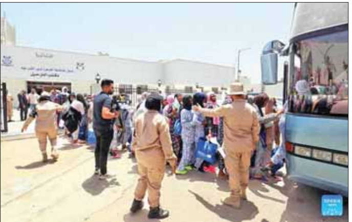
လစ်ဗျားမြို့တော် ထရိုပိုလီရှိ နေရပ်ပြန်လည်ပို့ဆောင်ရေးရုံးအပြင်ဘက်တွင် ဘတ်စ်ကားတစ်စီးဖြင့် တရားမဝင် ရွှေ့ပြောင်းအခြေချသူများ ပြန်ပို့ရန်ပြင်ဆင်နေသည်ကို တွေ့ရစဉ်။