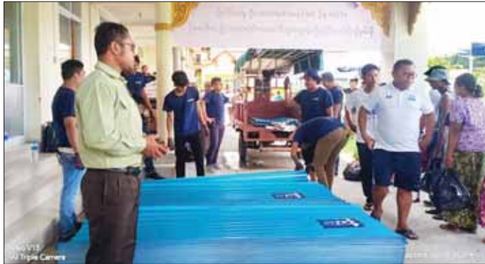
ATOM မှ စစ်တွေမြို့ရှိ အိမ်ဋ္ဌာန်ကျောင်း၊ အလိုတော်ပြည့်ကျောင်း၊ ရသေ့တောင်မြို့နှင့် ပုဏ္ဏားကျွန်းမြို့တို့ရှိ အိမ်ထောင်စု ၂၅၀ အတွက် အိမ်ဆောက်ပစ္စည်းများ လှူဒါန်းစဉ်။

အကန့်အသတ်မဲ့ဖုန်းခေါ်ဆိုခွင့်ပေးခဲ့ ရခိုင်ပြည်နယ်အတွင်း ကူညီကယ်ဆယ်ရေးနှင့် ပြန်လည်ထူထောင်ရေးလုပ်ငန်းများ ဆောင်ရွက်ရာတွင် ဆက်သွယ်ရေးအော်ပီရေတာများ၏ လူမှုအကျိုးပြုလုပ်ငန်းအနေဖြင့် စာမျက်နှာ ၄ သို့