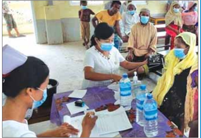
ရခိုင်ပြည်နယ် ဘူးသီးတောင်မြို့နယ် အထူးကုဆေးအဖွဲ့များက ပြည်သူများအား ဆေးကုသပေးစဉ်။