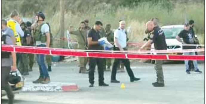
ပစ်ခတ်မှုဖြစ်ပွားသည့် နေရာကို တွေ့ရစဉ်။

အစ္စရေးတို့ ပြုလုပ်ခဲ့သည့် စီးနင်း တိုက်ခိုက်မှုကို လက်တုံ့ပြန် သည့်အနေဖြင့် ယခုလို ပစ်ခတ်မှု ပြုလုပ်ခဲ့ခြင်း ဖြစ်ကြောင်း ဟားမားစ်တို့က ပြောသည်။ စစ်သွေးကြွများကို ရှာဖွေ ဖမ်းဆီးသည့် အစ္စရေးတို့၏ စီးနင်းတိုက်ခိုက်မှုအတွင်း ၁၅ နှစ်အရွယ် ပါလက်စတိုင်း ကလေးတစ်ဦး အပါအဝင် ၁၅ ဦး သေဆုံးခဲ့ရသည်။ ထို့ပြင် လူ ၉၀ ထက်မနည်း ဒဏ်ရာရရှိခဲ့ကြောင်း သိရသည်။ သိမ်းပိုက်ထားသည့် ပါလက် စတိုင်းနယ်မြေများတွင် ဂျူး