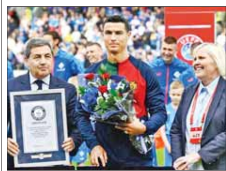
အောင်ဇော်

ယူရိုခြေစစ်ပွဲစဉ် (၄) မှ ဇွန် ၂၁ ရက် နံနက် ၁ နာရီ ၁၅ မိနစ်က ယှဉ်ပြိုင်ကစားခဲ့သည့် အိုင်စလန်နှင့် ပေါ်တူဂီ အသင်းတို့ပွဲစဉ်တွင် ပေါ်တူဂီအသင်းက စီရော်နယ်ဒို၏ တစ်လုံးတည်းသော သွင်းဂိုးဖြင့် အနိုင်ရရှိခဲ့သည်။ ပေါ်တူဂီအသင်းခေါင်းဆောင် စီရော်နယ်ဒိုသည် အဆိုပါ ပွဲစဉ်တွင် နိုင်ငံတကာပွဲပေါင်း ၂၀၀ ပြည့်သည့် ပထမဆုံးအမျိုးသားအားကစားသမားအဖြစ် မှတ်တမ်းဝင်ခဲ့ပြီး ပြိုင်ပွဲမစတင်မီတွင် ဂင်းနစ်ကမ္ဘာ့စံချိန်တင်လက်မှတ် ချီးမြှင့်ခံခဲ့ရသည်။ ၂၀၁၃ ခုနှစ်က ပေါ်တူဂီအသင်းအတွက် ပွဲဦးထွက်ကစားခဲ့ရရှိခဲ့သည့် အယ်နုဆာတိုက်စစ်မှူး စီရော်နယ်ဒိုသည် ကူပိုတိုက်စစ်ကစားသမား ဘာဒါ အယ်တာဝါ စံချိန်တင်ထားသော နိုင်ငံတကာပွဲအများဆုံး အရေအတွက် ၁၅၆ ပွဲကို မတ်လတွင် ကျော်ဖြတ်ခဲ့သည်။ အသက် ၃၈ နှစ်အရွယ်ရှိ စီရော်နယ်ဒိုသည် ပေါ်တူဂီအသင်းအတွက် တစ်လုံးတည်းသော အနိုင်ဂိုးကို ပွဲချိန်ပြည့်ခါနီးတွင် အိနာနီယို၏ ဖန်တီးမှုမှတစ်ဆင့် အဆုံးသတ်သွင်းယူနိုင်ခဲ့သည်။ အဆိုပါ သွင်းဂိုးကြောင့် စီရော်နယ်ဒိုသည် နိုင်ငံတကာသွင်းဂိုး ၁၂၃ ဂိုးအထိ ရှိလာပြီဖြစ်သည်။ ယခုပွဲစဉ်တွင် အနိုင်ရရှိခဲ့သောကြောင့် ပေါ်တူဂီအသင်းသည် အမှတ်ပေးဇယားတွင် လေးပွဲကစားလေးပွဲစလုံးအနိုင်ရကာ အုပ်စုထိပ်၌ ဦးဆောင်လျက်ရှိသည်။