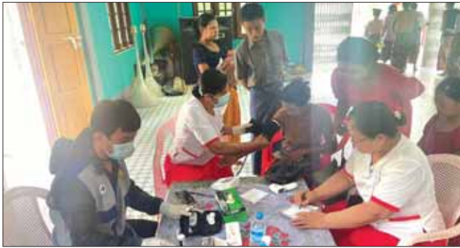
ဘူးသီးတောင်မြို့နယ်၌ အထူးကုဆေးအဖွဲ့က ပြည်သူများအား ကျန်းမာရေးစောင့်ရှောက်မှုပေးနေစဉ်။

မေး ။ ။ မိုခါမုန်တိုင်းမဖြစ်ပွားမီ ကျန်းမာရေးကဏ္ဍအနေနဲ့ ကြိုတင်ပြင်ဆင်ဆောင်ရွက်ထားရှိမှုတွေကို ပြောပြပေးစေလိုပါတယ်ရှင်။ ဖြေ ။ ။ ကျန်းမာရေးဝန်ကြီးဌာနက မိုးတွင်းကာလ နီးလာပြီဆိုရင် မိုးတွင်းကာလမှာ ဖြစ်ပေါ်နိုင်တဲ့ သဘာဝဘေးအန္တရာယ်တွေအတွက် ကျန်းမာရေးကဏ္ဍဆိုင်ရာ ကြိုတင်ပြင်ဆင်ခြင်း၊ သဘာဝဘေးအန္တရာယ်တွေဖြစ်ပွားလာပါက တုံ့ပြန်ဆောင်ရွက်ခြင်းနဲ့ ပြန်လည်ထူထောင်ရေးလုပ်ငန်းတွေကို လုပ်ဆောင်နိုင်ဖို့ ကြိုတင်ပြင်ဆင်လေ့ရှိပါတယ်။