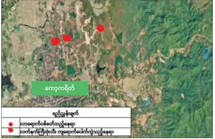
ကော့ကရိတ်မြို့အတွင်းသို့ KKO (ခွဲထွက်) အဖွဲ့နှင့် PDF အမည်ခံ အကြမ်းဖက်သမားများက လက်နက်ကြီးများဖြင့် အကြောင်းမဲ့ လာရောက်ပစ်ခတ်တိုက်ခိုက်မှုဖြစ်စဉ်ပြပုံ။

အလားတူ မွန်ပြည်နယ် ကျိုက်ထိုမြို့နယ် သိမ်ဇရပ်မြို့ အတွင်းသို့ KNLA အဖွဲ့နှင့် PDF အမည်ခံ အကြမ်းဖက်သမားများ က ဇွန် ၂၆ ရက် ည ၉ နာရီ ၄၅ မိနစ်ခန့်တွင် မြို့၏ အရှေ့တောင် ဘက် မီတာ ၂၅၀၀ ခန့်အကွာမှ လက်နက်ကြီးများဖြင့် အကြောင်း