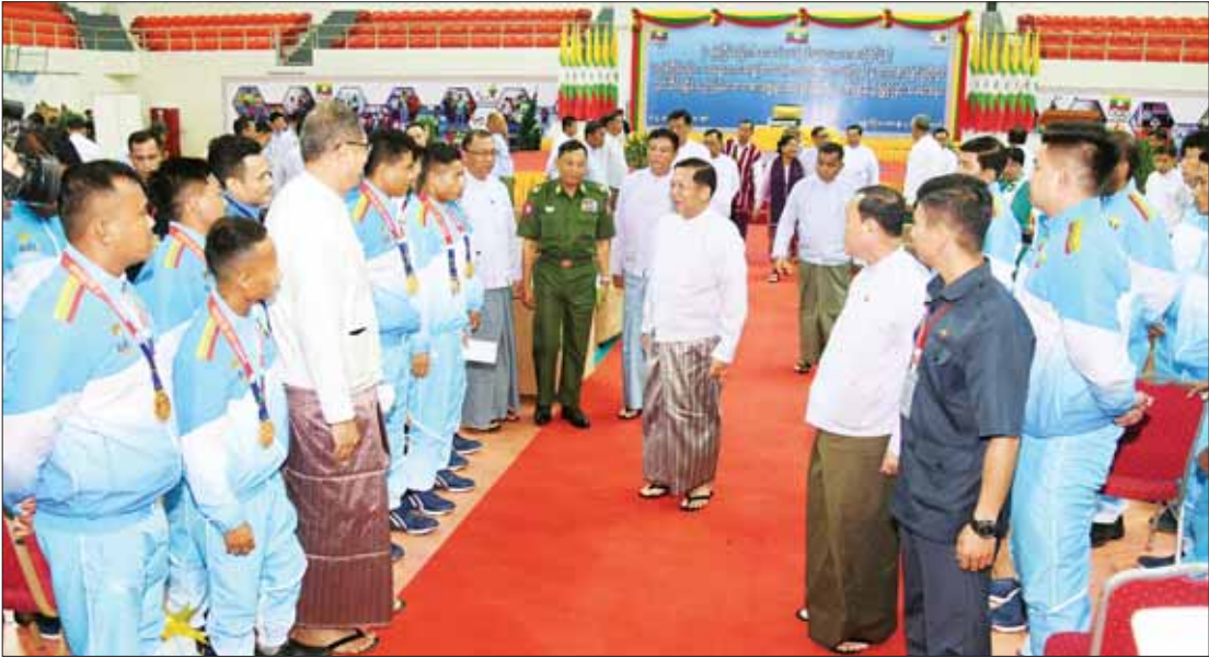
နိုင်ငံတော်စီမံအုပ်ချုပ်ရေးကောင်စီဥက္ကဋ္ဌ နိုင်ငံတော်ဝန်ကြီးချုပ် ဗိုလ်ချုပ်မှူးကြီး မင်းအောင်လှိုင် ဆုချီးမြှင့်ပွဲအခမ်းအနားသို့ တက်ရောက်လာကြသည့် နိုင်ငံဂုဏ်ဆောင် အားကစားသမားများနှင့် နည်းပြများကို ရင်းရင်းနှီးနှီး လိုက်လံနှုတ်ဆက်စဉ်။