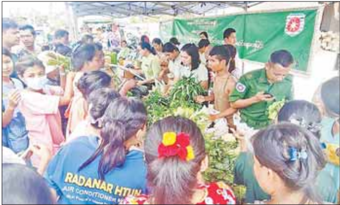
မုန်တိုင်းဒဏ်သင့်ပြည်သူများအား စားသောက်ကုန်များကို သက်သာသောဈေးနှုန်းများဖြင့် ရောင်းချ ပေးစဉ်။

ဒါ့အပြင် နောင်မှာအလားတူဖြစ်စဉ်မျိုး မဖြစ် ရလေအောင် ကန့်ပေါင်များကိုလည်း အတိုင်းအတာ တစ်ခုအထိ မြှင့်တင်ပေးခဲ့ပါသေးတယ်။