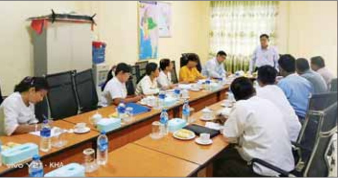
စီမံကိန်းနှင့် ဘဏ္ဍာရေး ဖြန့်ဖြူးမှုအတွင်း ဌာနပိုင်နှင့် ဝန်ထမ်း စသည်ဖြင့် ထိခိုက်ပျက်စီးမှုတန်း မိုခါမုနီတိုင်း ဒေသကြော် မိသားစုပိုင် အဆောက်အအုံ၊ ငွေကျပ်သန်း ၂၂၀၀ ခန့် ရှိခဲ့ ကြောင်း သိရသည်။ သတင်းစဉ်

၂၀၂၅ ဘဏ္ဍာရေးနှစ်တွင် ထည့် သွင်းတင်ပြ တောင်းခံခြင်းတို့ ဖြင့် ဆောင်ရွက်သွားမည်ဖြစ်ပြီး ဝန်ထမ်းများအတွက် ကူညီ ထောက်ပံ့ငွေများကို ဝန်ကြီးဌာနရှိ ဌာနအားလုံးမှ စုပေါင်းလျှူဒါန်း ငွေကျပ် ၂၀၆ သိန်းဖြင့် ကူညီပံ့ ပိုးဆောင်ရွက်မည်ဖြစ်ကြောင်း ပြော ကြားသည်။ ပေါင်းစပ်ညှိနှိုင်းဆောင်ရွက် ဆက်လက်၍ ဒုတိယဝန်ကြီး သည် ရုံးဌာနအဆောက်အအုံများ ပျက်စီးမှုများကို လိုက်လံကြည့်ရှု စစ်ဆေးခဲ့ပြီး လိုအပ်သည်များကို ပေါင်းစပ်ညှိနှိုင်း ဆောင်ရွက်ပေး သည်။