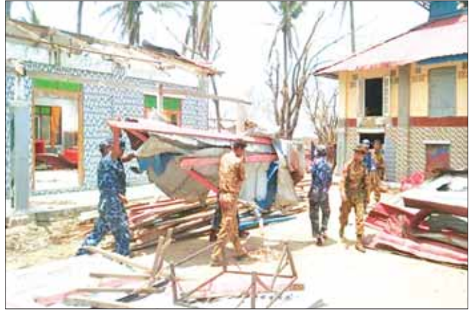
တပ်မတော်သားများက ကူညီကယ်ဆယ်ရေးလုပ်ငန်းတွင် ပါဝင်ဆောင်ရွက်နေစဉ်။