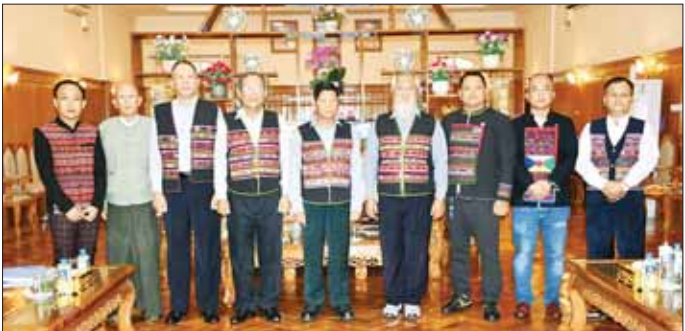
အညီ မှတ်ပုံတင်ခွင့် ပြုသည့်နေ့မှစ၍ ရက်ပေါင်း ၉၀ အတွင်း သတ်မှတ်ထားသော ပါတီဝင်အင်အား ၁၀၀၀ ပြည့်မီရေး၊ ရက်ပေါင်း ၁၈၀ အတွင်း ပြည်နယ် အတွင်းရှိ မြို့နယ်အားလုံး၏ အနည်းဆုံး ငါးမြို့နယ်၌ ပါတီရုံးခန်းဖွင့်လှစ်ရန်၊ ပါတီအဖွဲ့နှင့် ဆိုင်းဘုတ်များ ကို သတ်မှတ်ချက်နှင့်အညီ စနစ်တကျလိုက်နာ ဆောင်ရွက်သွားရန် ပါတီ၏ဘဏ္ဍာရေး စည်းမျဉ်း စည်းကမ်းများကို ညွှန်ကြားချက်နှင့်အညီ ရေးဆွဲ ဆောင်ရွက်သွားရန် ပါတီဝင်များ ကိုယ်ဆောင်သည့် သုံးခေါက်ချိုး အမျိုးသား မှတ်ပုံတင်

တာချီလိတ် ဇွန် ၁၇ ပြည်ထောင်စုရွေးကောက်ပွဲကော်မရှင် ဥက္ကဋ္ဌ ဦးသိန်းစိုးသည် နိုင်ငံရေးပါတီများ မှတ်ပုံတင်ခြင်း ဥပဒေ၊ နည်းဥပဒေများနှင့်အညီ ၂၀၂၃ ခုနှစ် မေ ၈ ရက်တွင် မှတ်ပုံတင်ခွင့် ရရှိပြီးဖြစ်သည့် ရှမ်းပြည်နယ် (အရှေ့ပိုင်း) တာချီလိတ်မြို့၊ ဝန်းကျောက်ရပ် အာခါ ဈေးလမ်း အမှတ် (၂၈)တွင် ပါတီရုံးချုပ်ဖွင့်လှစ်ထား ရှိသော အာခါအမျိုးသားဖွံ့ဖြိုးတိုးတက်ရေးပါတီ ဌာနချုပ်မှ နာယက၊ ဥက္ကဋ္ဌနှင့် အဖွဲ့ဝင်များအား ယနေ့တွင် နယ်မြေခံတပ်စဉ်ရိပ်သာ၌ တွေ့ဆုံ၍ နိုင်ငံရေးပါတီများ မှတ်ပုံတင်ခြင်း ဥပဒေ၊ နည်းဥပဒေ များနှင့်အညီ ပါတီလုပ်ငန်းဆောင်ရွက်ထားရှိမှု အခြေအနေကို စစ်ဆေးသည်။ တွေ့ဆုံစဉ် ပြည်ထောင်စုရွေးကောက်ပွဲ ကော်မရှင်ဥက္ကဋ္ဌက အာခါအမျိုးသား ဖွံ့ဖြိုးတိုးတက် ရေးပါတီနာယက၊ ဥက္ကဋ္ဌနှင့်အဖွဲ့ဝင်များအား နိုင်ငံရေး ပါတီများ မှတ်ပုံတင်ခြင်း ဥပဒေ၊ နည်းဥပဒေများနှင့်