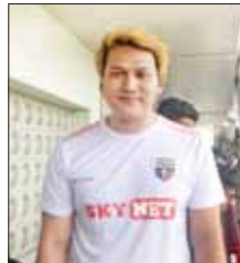
Dဖြိုး(အဆိုတော်)

လှူလည်းလှူဒါန်းတော့ မွန်မြတ် တဲ့အလှူလို့ ပြောချင်ပါတယ်။ အားပေးတဲ့ တီဗွီဖန်သားပြင်က ကြည့်ရှုတဲ့ ပရိသတ်တွေကိုလည်း ကျေးဇူးတင်ပါတယ်။ ကျွန်တော် တို့ ညွှန်ပေါင်းဘောလုံးအသင်း (Old Star FC)က အသက် ၅၀ ကျော်နီးပါး များတယ်။ ကုသိုလ်ပွဲ ဆိုတော့ ကြိုးစားပြီးကစားသွား မှာပါ။ အားလုံးကချစ်ချစ်ခင်ခင်နဲ့ ကွင်းထဲမှာညီအစ်ကိုတွေပါ။ ဒီပွဲ ကို ကုသိုလ်ပါဝင်ခွင့်ပြုနိုင်ဖို့ ဖိတ်ခေါ်တဲ့အတွက်လည်း ကျေးဇူး တင်ပါတယ်။ မြန်မာဘောလုံး သမားတွေလည်း အကောင်းဆုံး ကြိုးစားနေပါတယ်။ ညီငယ် ဘောလုံးအားကစားသမားတွေကို