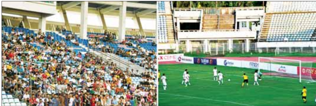
မိုခါရန်ပုံငွေဘောလုံးပွဲ ဗိုလ်လုပွဲအဖြစ် ရုပ်ရှင်ဘောလုံးအသင်း (Movie FC) နှင့် ဂီတဘောလုံးအသင်း (Music FC) တို့ ယှဉ်ပြိုင်ကစားနေမှုနှင့် ကြည့်ရှုအားပေး ကြသည့် ပရိသတ်များ။

ယနေ့ပွဲစဉ်တွင် ရောင်းချရရှိသည့် ဘောလုံးပွဲ ဝင်ကြေးရန်ပုံငွေများကို မိုခါမုန်တိုင်း သဘာဝဘေး ဒဏ် သင့်ဒေသများ ပြန်လည်ထူထောင်ရေးလုပ်ငန်း များအတွက် လှူဒါန်းသွားမည်ဖြစ်ကြောင်း သိရ သည်။