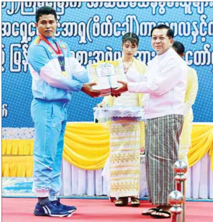
နိုင်ငံတော်စီမံအုပ်ချုပ်ရေးကောင်စီဥက္ကဋ္ဌ နိုင်ငံတော်ဝန်ကြီးချုပ် ဗိုလ်ချုပ်မှူးကြီး မင်းအောင်လှိုင် သံလုံးပစ်နှင် လှံတံပစ်ပြိုင်ပွဲတွင် ရွှေတံဆိပ်ဆုရရှိခဲ့သည့် တပ်ကြပ်ကြီး တင်ညို အား ဂုဏ်ပြုဆုငွေ ပေးအပ်ချီးမြှင့်စဉ်။