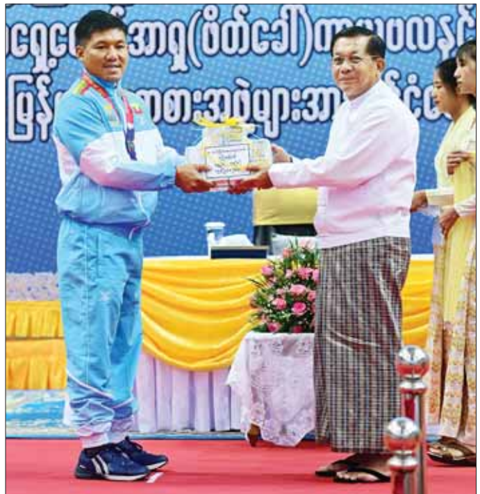
နိုင်ငံတော်စီမံအုပ်ချုပ်ရေးကောင်စီဥက္ကဋ္ဌ နိုင်ငံတော်ဝန်ကြီးချုပ် ဗိုလ်ချုပ်မှူးကြီး မင်းအောင်လှိုင် သံပြားပစ်ပြိုင်ပွဲတွင် ရွှေတံဆိပ်ဆုရရှိခဲ့သည့် ဒုတိယတပ်ကြပ် အောင်ထွန်းလင်း အား ဂုဏ်ပြုဆုငွေ ပေးအပ်ချီးမြှင့်စဉ်။