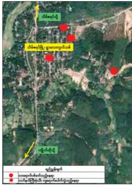
ကျိုက်ထိုမြို့နယ် သိမ်ဇရပ်မြို့သို့ KNLA အဖွဲ့နှင့် PDF အမည်ခံ အကြမ်းဖက်သမားများက လက်နက်ကြီးများဖြင့် အကြောင်းမဲ့ လာရောက်ပစ်ခတ်တိုက်ခိုက်မှုဖြစ်စဉ်ပြပုံ။

နေပြည်တော် ဇွန် ၁၇ မှုများဖြစ်စေရန် အကြမ်းဖက် KKO(ခွဲထွက်)အဖွဲ့၊ KNLA အဖွဲ့နှင့် လုပ်ရပ်များကို လုပ်ဆောင်လျက် PDF အမည်ခံ အကြမ်းဖက်သမား ရှိသည်။