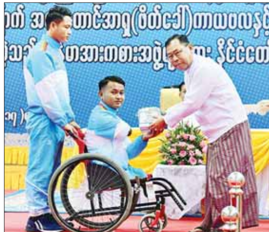
နိုင်ငံတော်စီမံအုပ်ချုပ်ရေးကောင်စီအဖွဲ့ဝင် ဒုတိယဗိုလ်ချုပ်ကြီး စိုးထွဋ် ဆုရရှိသူတစ်ဦးအား ဂုဏ်ပြုဆုငွေ ပေးအပ်ချီးမြှင့်စဉ်။