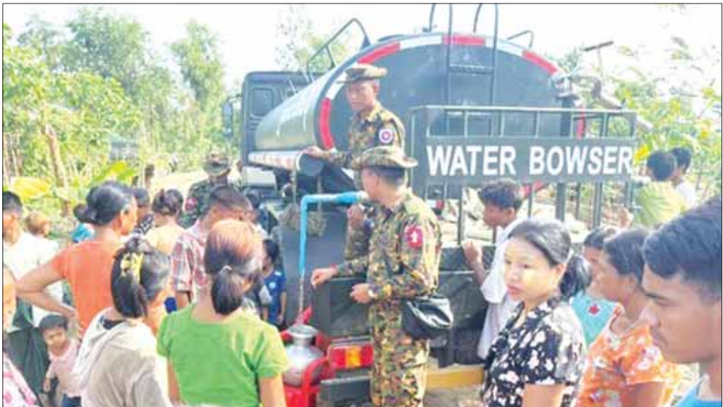
တပ်မတော်သားများက မုန်တိုင်းဒဏ်သင့်ပြည်သူများအား သောက်သုံးရေများ ပေးဝေနေစဉ်။

နယ်စပ်ရေးရာဝန်ကြီးဌာနမှ တာဝန်ရှိသူများ ဟာ ရခိုင်ပြည်နယ်အတွင်းရှိ သောက်သုံးရေကန့် စုစုပေါင်း ၂၂၀ ထဲမှာကျရောက်နေတဲ့ အမှိုက်များ၊ သစ်ပင်ကြီးများ၊ တိရစ္ဆာန်အသေကောင်များ ဖယ်ရှားရှင်းလင်းပေးခြင်းလုပ်ငန်းကို ဆောင်ရွက် ပေးခဲ့ပါတယ်။