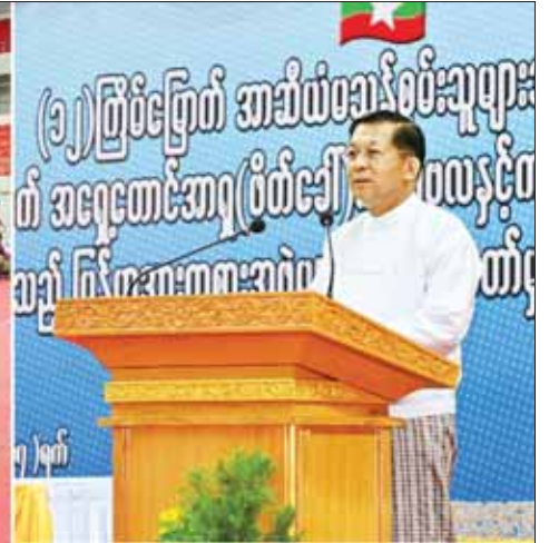
နိုင်ငံတော်စီမံအုပ်ချုပ်ရေးကောင်စီဥက္ကဋ္ဌ နိုင်ငံတော်ဝန်ကြီးချုပ် ဗိုလ်ချုပ်မှူးကြီး မင်းအောင်လှိုင် (၁၂)ကြိမ်မြောက် အာဆီယံမသန်စွမ်းသူများ အားကစားပြိုင်ပွဲနှင့် (၁၇)ကြိမ်မြောက် အရှေ့တောင်အာရှ(ဖိတ်ခေါ်) ကာယဗလနှင့် ကာယကြံ့ခိုင်မှုအားကစားပြိုင်ပွဲတို့တွင် ဆုတံဆိပ်ရရှိခဲ့သည့် မြန်မာအားကစားအဖွဲ့များအား နိုင်ငံတော်မှ ဂုဏ်ပြုဆုချီးမြှင့်ခြင်းအခမ်းအနားတွင် အမှတ်စဉ် ၁၆၅၂ ကြားဖြတ်အဖွဲ့ဝင်များ ပြောကြားစဉ်။

◆ ရှေ့ဖူးမှ အရာရှိကြီးများ၊ နေပြည်တော်တိုင်းစစ်ဌာနချုပ်တိုင်းမှူး၊ ဒုတိယဝန်ကြီးများ၊ မြန်မာနိုင်ငံ အားကစားအဖွဲ့ချုပ်များမှ ဥက္ကဋ္ဌများ၊ ဒုတိယဥက္ကဋ္ဌများ၊ ဖိတ်ကြားထားသူများ၊ နိုင်ငံ့ဂုဏ်ဆောင်အားကစားသမားများ၊ အုပ်ချုပ်သူများ၊ နည်းပြများနှင့် တာဝန်ရှိသူများ တက်ရောက်ကြသည်။