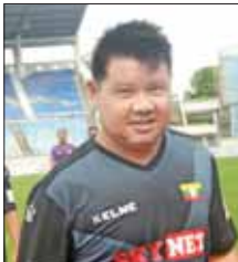
စိုးမြတ်မင်း

မိုခါမုန်တိုင်းဒဏ်သင့်ဒေသများ ပြန်လည်ထူထောင်ရေး ရန်ပုံငွေ အဖြစ် ရုပ်ရှင်၊ ဂီတအနုပညာရှင် များ၊ နိုင်ငံ့ဂုဏ်ဆောင် မြန်မာ့ လက်ရွေးစင် အားကစားသမား ဟောင်းများပေါင်း၍ ဘောလုံး ပွဲနှင့် ဂီတဖျော်ဖြေပွဲကို ယနေ့ မွန်းလွဲပိုင်းက ရန်ကုန်မြို့ သယ်န်း ကျွန်းမြို့နယ်ရှိ သုဝဏ္ဏအားကစား ကွင်း၌ ကျင်းပရာ ရုပ်ရှင်ဘောလုံး အသင်း (Movie FC)၊ ဂီတ ဘောလုံးအသင်း (Music FC)၊ Forever FC ဘောလုံးအသင်းနှင့် ညွှန်ပေါင်းဘောလုံးအသင်း (Old Star FC) တို့ တတိယနေရာလုပွဲ နှင့် ဗိုလ်လုပွဲယှဉ်ပြိုင်ခဲ့ကြပြီး အဆိုပါရန်ပုံငွေပွဲတွင် ပါဝင် ယှဉ်ပြိုင်သူများ၏ စကားသံ များကို ဖော်ပြလိုက်ပါသည်။