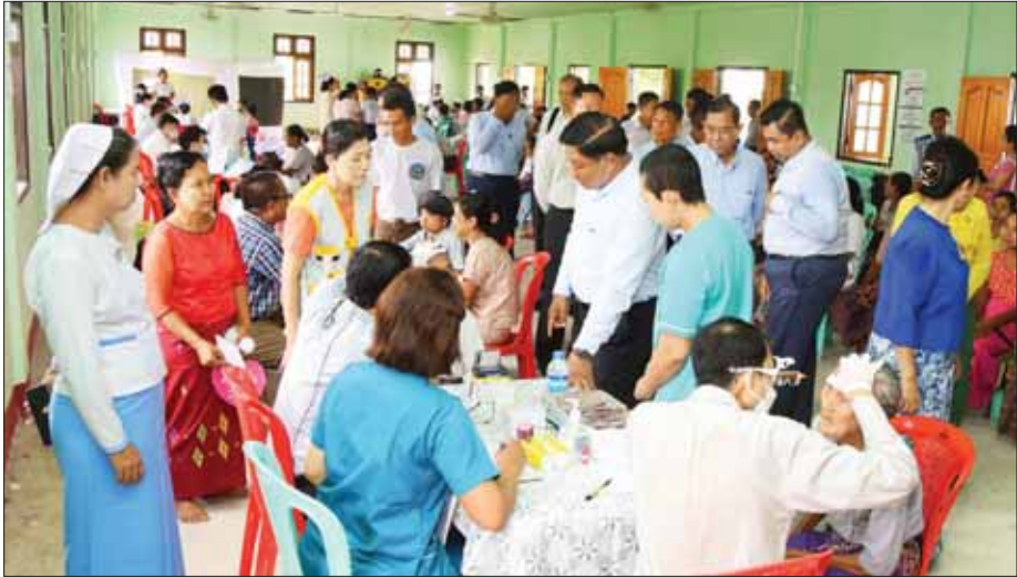
နိုင်ငံတော်စီမံအုပ်ချုပ်ရေးကောင်စီအဖွဲ့ဝင် ဒုတိယဝန်ကြီးချုပ်နှင့် ပြည်ထောင်စုဝန်ကြီး ဗိုလ်ချုပ်ကြီး တင်အောင်စန်းနှင့်အဖွဲ့ စစ်တွေမြို့နယ်ကြက်ကိုင်းတန်ကျေးရွာမှ မုန်တိုင်းဒဏ်သင့်ပြည်သူများအား ကျန်းမာရေးစောင့်ရှောက်ပေးနေမှုကို ကြည့်ရှုအားပေးစဉ်။

လိုအပ်သည်များ ပေါင်းစပ်ကူညီဖြည့်ဆည်းပေး တွေ့ဆုံစဉ် မိုခါမုန်တိုင်းဒဏ်သင့် ပြည်သူများအတွက် မိခင်နှင့်ကလေးကျန်းမာရေးစောင့်ရှောက်မှုဆိုင်ရာ ကိစ္စရပ်များ၊ စားရေရရှိစွာ စနစ်တကျ ဖြန့်ခွဲပေးလျက်ရှိသည့်အခြေအနေ၊ မုန်တိုင်းဒဏ်သင့် ရခိုင်ပြည်နယ်အတွင်း မိခင်နှင့်ကလေး ကျန်းမာရေးအတွက် အကူအညီ ဆောင်ရွက်ပေးနေမှုအခြေအနေများနှင့် ပတ်သက်၍ ရှင်းလင်းတင်ပြမှုအပေါ် လိုအပ်သည်များ ပေါင်းစပ်ကူညီဖြည့်ဆည်း ဆောင်ရွက်ပေးခဲ့သည်။ ထို့နောက် ဗိုလ်ချုပ်ကြီး တင်အောင်စန်းသည် ပြည်ထောင်စုဝန်ကြီးများဖြစ်ကြသည့် ဒုတိယဗိုလ်ချုပ်ကြီး ထွန်းထွန်းနောင်၊ ဦးမျိုးသန့်နှင့် ဒေါက်တာသက်သက်ခိုင်၊ ပြည်နယ်ဝန်ကြီးချုပ် ဦးထိန်လင်း၊ ဒုတိယဝန်ကြီးများ၊ တာဝန်ရှိသူများနှင့်အတူ စစ်တွေတက္ကသိုလ်သို့ ရောက်ရှိပြီး ကူညီကယ်ဆယ်ရေး အဖွဲ့များ၊ ဌာနဆိုင်ရာ တာဝန်ရှိသူများနှင့်