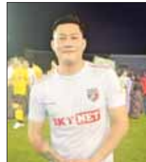
အစ္စဏီ(အဆိုတော်)

အားပေးဖို့ ဒီနေရာကနေ ပြောချင် ပါတယ်။ Dဖြိုး(အဆိုတော်) ကျွန်တော်တို့ ကိုယ်တိုင် သွားရောက်ပြီး မလှူဒါန်းနိုင်ဘူး။ ပါဝင်နိုင်တဲ့နေရာက ပါဝင်ခွင့်ရတဲ့ အတွက် ဝမ်းသာပါတယ်။ သီချင်း နှစ်ပုဒ်ဆိုမယ်။ ဖျော်ဖြေရေးတွေ လည်း ပါမယ်။ သဘာဝဘေး အန္တရာယ်ဆိုတာ ခန့်မှန်းလို့မရ ဘူး။ ကြိုတင်ကာကွယ်၊ ကြိုတင် မကာကွယ်နိုင်ရင် ဖြစ်လာတဲ့ခေါ မှာပိုင်းဝန်းပြီး တတ်နိုင်တဲ့ ဘက်က အားဖြည့်ပေးရမယ်။ ကျွန်တော် ဂီတဘောလုံးအသင်း (Music FC)က ကစားသွားမှာ ဖြစ်ပါတယ်။