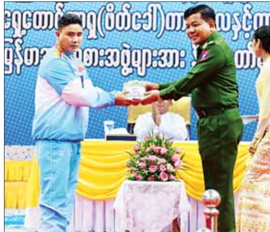
ညိုနှိုင်းကွပ်ကဲရေးမှူးကြီး (ကြည်း၊ ရေ/လေ) ဗိုလ်ချုပ်ကြီး မောင်မောင်အေး ဆုရရှိသူတစ်ဦးအား ဂုဏ်ပြုဆုငွေ ပေးအပ်ချီးမြှင့်စဉ်။