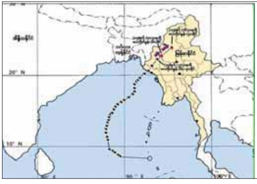
(၁၄.၅.၂၀၂၃) ရက်နေ့ မြန်မာစံတော်ချိန် (၂၁:၃၀) နာရီအချိန် တိုင်းထွာချက်များအရ အားကောင်းသော ဆိုင်ကလုန်းမုန်တိုင်း “မိုခါ” (MOCHA) လမ်းကြောင်းပြမြေပုံ

ထို့ပြင် ပြင်ပမိုးလေဝသပညာရှင်များ၏ ထုတ်ပြန်ချက်များကိုလည်း မျက်ခြည်မပြတ်စောင့်ကြည့် လိုက်နာဆောင်ရွက်ရမည်ဖြစ်ပါသည်။ ထို့ကြောင့် သဘာဝဘေးအန္တရာယ်ကြောင့် ပြည်သူများ၏ အသက်အိုးအိမ် စည်းစိမ်ပစ္စည်းဥစ္စာများ ပျက်စီးဆုံးရှုံးမှုမရှိစေရေးအတွက်လည်း မိုးလေဝသပညာရှင်များ များစွာလိုအပ်သဖြင့် စိတ်ပါဝင်စားသည့် လူငယ်များသည် မိုးလေဝသနှင့် လေဗေဒပညာရပ်များကို တတ်မြောက်ကျွမ်းကျင်အောင် လေ့လာသင်ယူသွားကြရန် တိုက်တွန်းပါကြောင်းနှင့် မိုးလေဝသပညာရပ်သည် လူ့အဖွဲ့အစည်းတစ်ခုလုံးအတွက် မည်မျှအရေးပါသည်ကို သိရှိနိုင်ရန် ဖြစ်စဉ်အမှန်များကို မှတ်တမ်းပြု ရေးသားတင်ပြလိုက်ရပါသည်။ ။