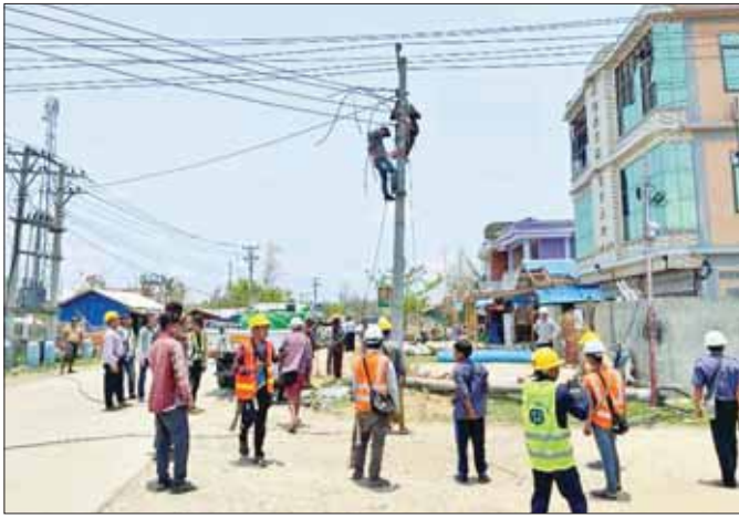
မေ ၂၈ ရက်က ရသေ့တောင်မြို့ပေါ်ရှိ ဓာတ်အားလိုင်းများ ပြုပြင်ဆောင်ရွက်နေမှုကို တွေ့ရစဉ်။

နိုင်ငံတော်အနေဖြင့် မေလ ၉ ရက်နေ့တွင် မြန်မာနိုင်ငံအတွင်းသို့ ဝင်ရောက်တိုက်ခတ်မည့်