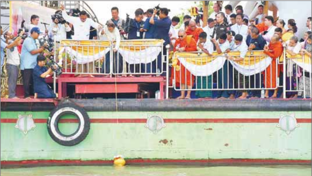
စာမျက်နှာ ၃ မှ

အန္တိမအင်္ဂါပစ္စည်းပူဇော်ပွဲကျင်းပရေးဦးစီးကော်မတီ