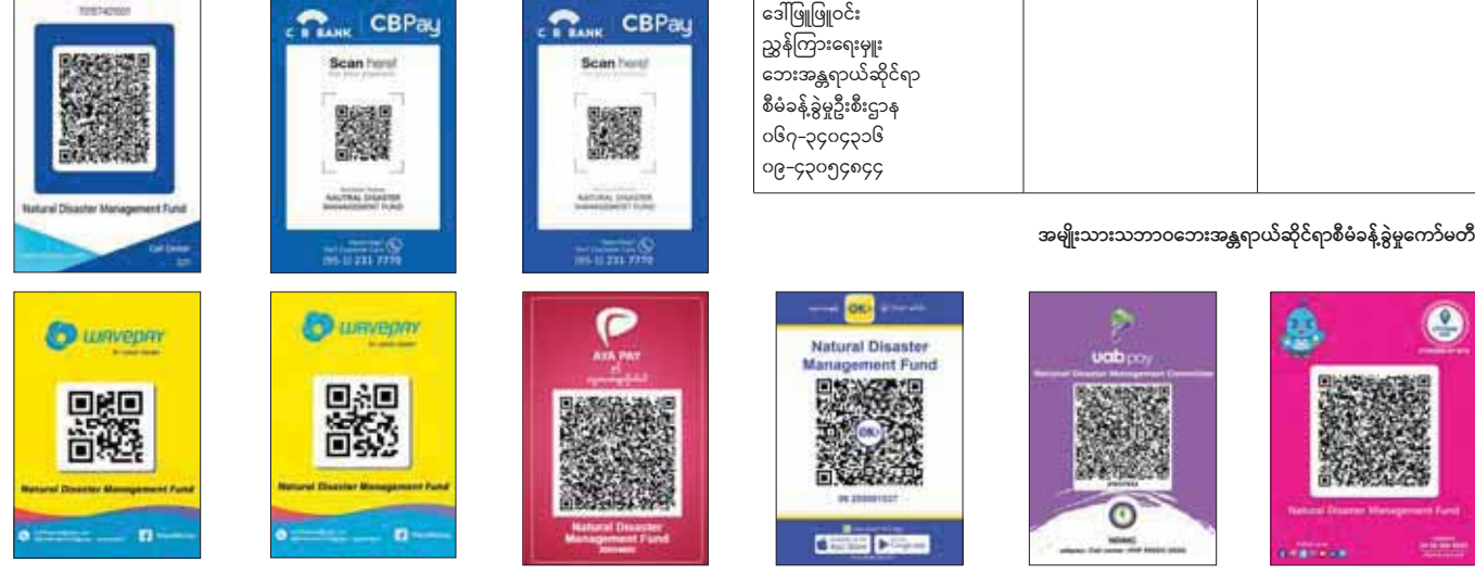
အမျိုးသားသဘာဝဘေးအန္တရာယ်ဆိုင်ရာစီမံခန့်ခွဲမှုကော်မတီ