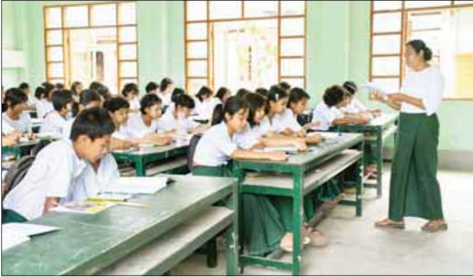
ရခိုင်ပြည်နယ်၌ ကျောင်းသား ကျောင်းသူများ အေးချမ်းစွာ ပညာသင်ကြားနေမှုကို တွေ့ရစဉ်။