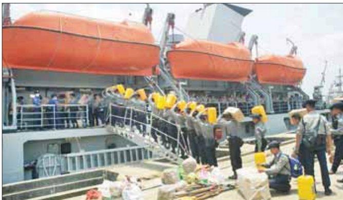
မေ ၁၉ ရက်က ရခိုင်ပြည်နယ်အတွင်းရှိ မုန်တိုင်းဒဏ်သင့်ပြည်သူများအတွက် ကူညီကယ်ဆယ်ရေးအဖွဲ့ဝင်များနှင့် ထောက်ပံ့ရေးပစ္စည်းများအား တပ်မတော်(ရေ)မှ တပ်ဖွဲ့တစ်ရပ်က ပို့ဆောင်ပေးခဲ့ခြင်းဖြစ်သည်။

၂၀၀၈ ခုနှစ်တွင် ဘင်္ဂလားပင်လယ်အော်မှ စတင်အစပျိုးတိုက်ခတ်ခဲ့သည့် အလွန်အားကောင်းသော ဆိုင်ကလုန်းမုန်တိုင်း “နာဂစ်” သည် ဟိုင်းကြီးကျွန်းမှတစ်ဆင့် မြစ်ဝကျွန်းပေါ်ဒေသသို့ ဝင်ရောက်တိုက်ခတ်ခဲ့သည်။ မေ ၂ ရက် “နာဂစ်” ဆိုင်ကလုန်းမုန်တိုင်းမတိုက်ခတ်မီ တစ်ပတ်ခန့် အလိုတွင် နေအပူချိန်များ သိသိသာသာမြင့်တက်လာသည်ကို ပြည်သူများသတိပြုမိမည်ထင်ပါသည်။ မိုးလေဝသနှင့် ဇလဗေဒဌာနကြားမှဦးစီးဌာနအနေဖြင့် ဘင်္ဂလားပင်လယ်အော်တွင် လေဖိအားနည်းရပ်ဝန်း စတင်ဖြစ်ပေါ်ခဲ့မှု၊ မုန်တိုင်းဖြစ်ပေါ်ခဲ့မှုနှင့် ရွေ့လျားရာလမ်းကြောင်းများကို အချိန်နှင့်တစ်ပြေးညီ ထုတ်ပြန်နေသော်လည်း မြစ်ဝကျွန်းပေါ်ဒေသရှိ ပြည်သူများသည် သာမန်မုန်တိုင်းအဆင့်အဖြစ် သဘောထားထင်မြင်မှု၊ ပြင်းထန်သည့် သဘာဝဘေးအန္တရာယ်များ ကြုံတွေ့ဖူးခြင်း မရှိမူ စည်ညီတို့ကိုအခြေခံ၍ ပေါ့လျော့စွာ ထင်မြင်ယူဆခဲ့ကြသည်။