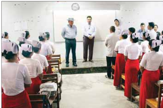
ပြည်ထောင်စုဝန်ကြီး ဒုတိယဗိုလ်ချုပ်ကြီး ထွန်းထွန်းနောင်နှင့်အဖွဲ့ စစ်တွေမြို့ သူနာပြုနှင့် သားဖွား သင်တန်းကျောင်း၌ သင်တန်းသား သင်တန်းသူများအား ရင်းရင်းနှီးနှီးတွေ့ဆုံနှုတ်ဆက်စဉ်။

ထွန်းထွန်းနောင်နှင့် အဖွဲ့သည် စစ်တွေမြို့ ကျေးပင်ကြီးရပ်ကွက် ရှိ သူနာပြုနှင့် သားဖွားသင်တန်း ကျောင်းသို့ ရောက်ရှိကြပြီး သင်တန်းခန်းမ၌ ကျောင်းအုပ် ဆရာမကြီးနှင့် ဆရာ ဆရာမများ သင်တန်းသား သင်တန်းသူများ နှင့် တွေ့ဆုံ၍ မိမိတို့ သင်ကြားရ သည့်ဘာသာရပ်များကို ကျွမ်းကျင် စွာ တတ်မြောက်အောင် ကြိုးစား သင်ယူကြစေ လိုကြောင်း၊ သင်တန်းပြီးဆုံး၍ ပြည်သူလူထု အား ကျန်းမာရေးဝန်ဆောင်မှုပေး ရာတွင်လည်း ဝါသနာ၊ စေတနာ အရင်းခံပြီး ကြပ်ကြပ်နာနာ ကုသ ပေးကြစေလိုကြောင်း၊ နိုင်ငံတော် ၏ပြည်သူ့ကျန်းမာရေး ဝန်ဆောင် မှု လုပ်ငန်းများတွင် အားကိုး အားထားပြုရသည့်သူများ ဖြစ် အောင် ကြိုးစားဆောင်ရွက်ကြ စေလိုကြောင်း မှာကြားသည်။