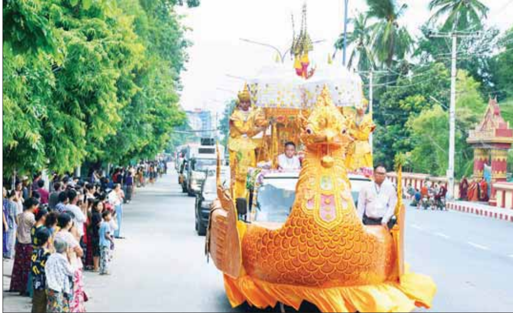
ဗန်းမော်ဆရာတော်ဘုရားကြီး၏ သရီရအရိုးဓာတ်ပြာတော်များကို ကရဝိက်ဖောင်တော်ယာဉ်ဖြင့် ရေမျောပူဇော်သဘင်ကျင်းပမည့် မရမ်းခြံဆိပ်ကမ်းနေရာသို့ ပင့်ဆောင်စဉ်။

ဗန်းမော်ဆရာတော်ဘုရားကြီး၏ သရီရအရိုးဓာတ်ပြာတော်များကို နိုင်ငံတော်ဗဟို သံဃာ့ဝန်ဆောင် မန္တလေးမြို့မစိုးရိမ်တိုက်သစ် မဟာနာယကဆရာတော် အဂ္ဂမဟာပဏ္ဍိတ ဘဒ္ဒန္တဝါသေဋ္ဌာဘိဝံသအမျိုးပြု၍ ဆရာတော်သံဃာတော်များနှင့် တာဝန်ရှိသူများက ကရဝိက်ရွှေဖောင်တော်ယာဉ်ပေါ်သို့ ပင့်ဆောင်စဉ်။