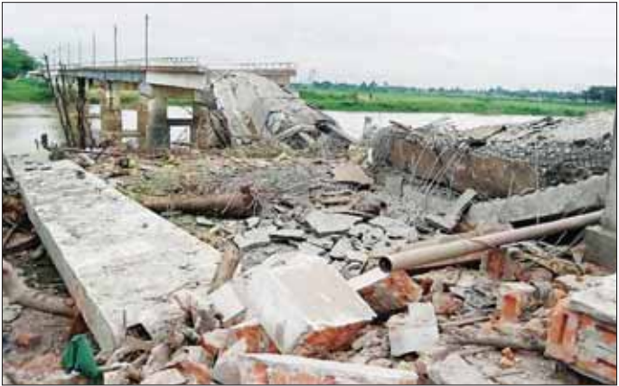
ဖက်မှုလိုလားသူများနှင့် PDF အမည်ခံအကြမ်းဖက် သမားများက မိုင်းထောင်ဖောက်ခွဲကြောင့် နတ်သံကွင်း ကျေးရွာဘက်ခြမ်းတံတား၏ ကမ်းကပ်ခုံနှင့် ကပ်လျက် ပေ ၃၀၀ ခန့် ပြိုကျပျက်စီး ခဲ့သည်။ (အပေါ်ပုံ) အလားတူ အကြမ်းဖက်သမားများအနေဖြင့် ပဲခူးတိုင်းဒေသကြီးအတွင်းရှိ ကျောက်ကြီးမြို့နယ်၊ ရွှေကျင်မြို့နယ်၊ ကျောက်တံခါးမြို့နယ်၊ ညောင်လေး

နေပြည်တော် ဇွန် ၇ အကြမ်းဖက်အဖွဲ့အစည်းများဖြစ်သည့် NUG၊ CRPH တို့၏ လက်ဝေခံ PDF အမည်ခံအကြမ်းဖက်သမားများ သည် တိုင်းပြည်တည်ငြိမ်အေးချမ်းမှုနှင့် တရားဥပဒေ စိုးမိုးမှုကို ပျက်ပြားစေရန် ရည်ရွယ်ချက်ဖြင့် ရုံးဌာန အဆောက်အဦများ၊ စာသင်ကျောင်းများ၊ အများ ပြည်သူနေထိုင်လျက်ရှိသော နေအိမ်များ၊ လမ်း၊ တံတားများအား မီးရှို့ဖျက်ဆီးခြင်း၊ မိုင်းထောင် ဖောက်ခွဲခြင်း၊ ကျေးရွာများအတွင်း ဝင်ရောက်၍ အဖျက်အမှောင်လုပ်ရပ်များ လုပ်ဆောင်ခြင်းစသည့် အကြမ်းဖက်လုပ်ရပ်များကို နည်းလမ်းမျိုးစုံဖြင့် လုပ်ဆောင်လျက်ရှိသည်။ ထိုသို့လုပ်ဆောင်လျက်ရှိရာ ဇွန် ၆ ရက် နံနက် ပိုင်းတွင် ပဲခူးတိုင်းဒေသကြီး ကျောက်ကြီးမြို့နယ် နတ်သံကွင်းကျေးရွာ၏ အနောက်ဘက်ရှိ ပဲခူးကုန်း - နတ်သံကွင်း - ကျောက်ကြီး ကားလမ်းပေါ်ရှိ ဒေသခံပြည်သူများ အားထားအသုံးပြုလျက်ရှိသည့် အရှည်ပေ ၇၀၀ အကျယ် ပေ ၃၀ စစ်တောင်းမြစ်ကူး တံတား (နတ်သံကွင်း) အား KNLA အဖွဲ့မှ အကြမ်း