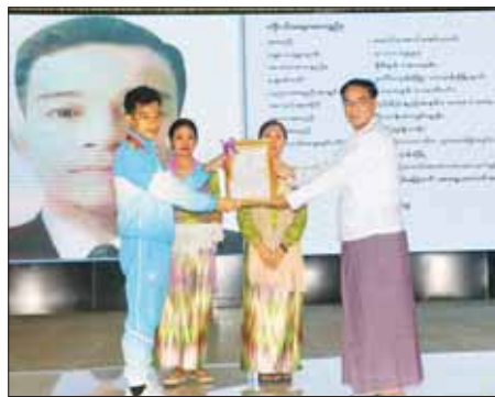
ကလည်း ထိုက်ထိုက်တန်တန် ဂုဏ်ပြုပေးလျက်ရှိကြောင်း၊ နိုင်ငံတကာ အလယ်မှာ မြန်မာနိုင်ငံတော်အလံလွှင့်ပျံအောင် စွမ်းဆောင်ကြီးပမ်းနိုင်ခဲ့သည့် ပဲခူးတိုင်းဒေသကြီးအတွင်းမှ နိုင်ငံ့ဂုဏ်ဆောင်အားကစား

ပဲခူး ဇွန် ၇ (၃၂)ကြိမ်မြောက် အရှေ့တောင်အာရှအားကစားပြိုင်ပွဲများနှင့် တိုင်းဒေသကြီး/ပြည်နယ် အားကစားပြိုင်ပွဲများတွင် ရွှေ၊ ငွေ၊ ကြေး ဆုတံဆိပ်များ ရယူပေးနိုင်ခဲ့သည့်အားကစားသမားများ၊ အုပ်ချုပ်/နည်းပြများအား ထပ်ဆင့်ဂုဏ်ပြုခြင်းအခမ်းအနားကို ပဲခူးမြို့ မြို့တော်ခန်းမ၌ ဇွန် ၇ ရက် နံနက်ပိုင်းက ကျင်းပသည်။ ထိုက်ထိုက်တန်တန်ဂုဏ်ပြု ဦးစွာ တိုင်းဒေသကြီး ဝန်ကြီးချုပ် ဦးမျိုးဆွေဝင်းက (၃၂)ကြိမ်မြောက် အရှေ့တောင်အာရှအားကစားပြိုင်ပွဲတွင် ပဲခူးတိုင်းဒေသကြီးအတွင်းမှ နိုင်ငံ့ဂုဏ်ဆောင်အားကစားသမားများက အားကစားနည်းအလိုက် ရွှေတံဆိပ် ခုနစ်ခု၊ ငွေတံဆိပ် လေးခု၊ ကြေးတံဆိပ် ရှစ်ခု စုစုပေါင်း ၁၉ ခု ရယူပေးနိုင်ခဲ့သည့်အတွက် အထူးပင်ဝမ်းမြောက်ဂုဏ်ယူမိကြောင်း၊ တိုင်းဒေသကြီးအတွင်း အားကစားကဏ္ဍ ဘက်စုံ ဖွံ့ဖြိုးတိုးတက်စေရေးအတွက် ယှဉ်ပြိုင်မည့် အားကစားနည်းအလိုက် အောင်နိုင်ရေးအလံပေးအပ်ခြင်းနှင့် ထောက်ပံ့ငွေပေးအပ်ခြင်းများကို စဉ်ဆက်မပြတ်ဆောင်ရွက်ပေးလျက်ရှိသကဲ့သို့ ဆုတံဆိပ်များ ရရှိလာပါ