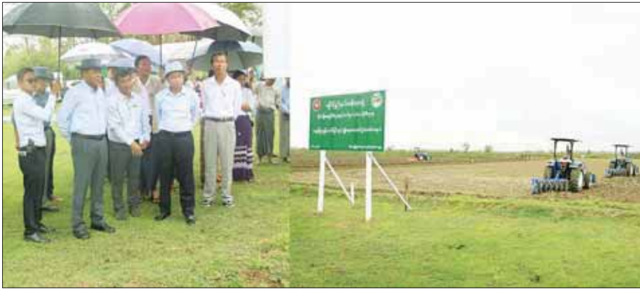
ပြည်ထောင်စုဝန်ကြီး ဒုတိယဗိုလ်ချုပ်ကြီး ထွန်းထွန်းနောင်နှင့်အဖွဲ့ စစ်တွေမြို့ ပျားလည်ချောင်းကျေးရွာ၌ ထွန်းထွန်းများဖြင့် သရုပ်ပြထွန်းယက် နေမှုကို ကြည့်ရှုအားပေးစဉ်။

စစ်တွေ ဇွန် ၇ စစ်တွေမြို့၌ ရောက်ရှိနေသော နယ်စပ်ရေးရာ ဝန်ကြီးဌာန ပြည်ထောင်စုဝန်ကြီး ဒုတိယ ဗိုလ်ချုပ်ကြီး ထွန်းထွန်းနောင် သည် ပြည်ထောင်စုဝန်ကြီးများ ဖြစ်ကြသည့်ဦးမျိုးသန့်၊ ဒေါက်တာ သက်သက်ခိုင်၊ ပြည်နယ်ဝန်ကြီး ချုပ် ဦးထိန်လင်းတို့နှင့်အတူ ယနေ့နံနက်ပိုင်းတွင် စစ်တွေမြို့ သူနာပြုနှင့် သားဖွားသင်တန်း ကျောင်းသို့ သွားရောက်ကြည့်ရှုပြီး မိုးစပါးစံပြစိုက်ကွက် သရုပ်ပြ ထွန်းယက်ခြင်းနှင့် စပါးမျိုးစေ့ ပေးအပ်ပွဲ အခမ်းအနားများသို့ တက်ရောက်သည်။