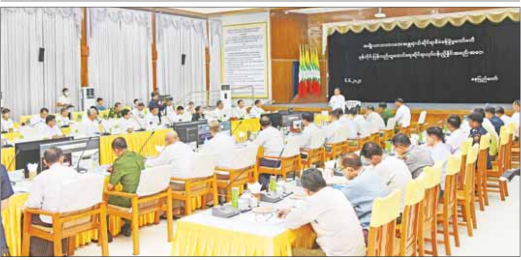
နိုင်ငံတော်စီမံအုပ်ချုပ်ရေးကောင်စီ ဒုတိယဥက္ကဋ္ဌ ဒုတိယဝန်ကြီးချုပ် ဒုတိယဗိုလ်ချုပ်မှူးကြီး ဖိုးဝင်း အမျိုးသားသဘာဝဘေးအန္တရာယ်ဆိုင်ရာ စီမံခန့်ခွဲမှု ကော်မတီ၏ ပြန်လည်ထူထောင်ရေးဆိုင်ရာ လုပ်ငန်းညှိနှိုင်းအစည်းအဝေးတွင် အမှာစကားပြောကြားစဉ်။

ဗန်းမော်ကျောင်းတိုက်ကြီး၏ ပဓာန နာယကဆရာတော် နိုင်ငံတော်သံဃမဟာ နာယကအဖွဲ့ဥက္ကဋ္ဌ အဘိဓမ္မမဟာရဋ္ဌဂုဏ် အဘိဓဇ အဂ္ဂမဟာ သဒ္ဓမ္မဇောတိက ဒေါက်တာ ဘဒ္ဒန္တကုမာရ ဘိဝံသ၏ သရီရဓာတုပါဟနပူဇာ အရိုးဓာတ်ပြာတော်များ ရေမျှောပူဇော်ခြင်းအခမ်းအနားအား တိုက်ရိုက် (Live) ထုတ်လွှင့်သွားမည် နေပြည်တော် ဇွန် ၆ မန္တလေးတိုင်းဒေသကြီး၊ မဟာအောင်မြေ ခရိုင်၊ မဟာအောင်မြေမြို့နယ်၊ မဟာနွယ်စဉ် ရပ်ကွက်၊ ဗန်းမော်ကျောင်းတိုက်ကြီး၏ ပဓာန နာယကဆရာတော် နိုင်ငံတော်သံဃမဟာ နာယကအဖွဲ့ ဥက္ကဋ္ဌ အဘိဓမ္မမဟာရဋ္ဌဂုဏ် အဘိဓဇ အဂ္ဂမဟာ သဒ္ဓမ္မဇောတိက ဒေါက်တာ ဘဒ္ဒန္တကုမာရဘိဝံသ၏ သရီရဓာတုပါဟန ပူဇာ အရိုးဓာတ်ပြာတော်များ ရေမျှောပူဇော် ခြင်းအခမ်းအနားအား ဇွန် ၇ ရက် နံနက် ၇ နာရီ မိနစ် ၅၀ မှ စတင်ပြီး MRTV HD Channel၊ MRTV Farmers' Channel၊ MRTV Parliament Channel၊ MWD HD Channel၊ MWD Variety HD Channel၊ မဟာဇောစိရုပ်သံလိုင်းနှင့် Buddha Channel တို့မှ တိုက်ရိုက် Live ထုတ်လွှင့်သွားမည်ဖြစ်ကြောင်း မိဘပြည်သူများ အား လေးစားစွာ ကြိုတင်အသိပေးအပ် ပါသည်။ သတင်းစဉ်