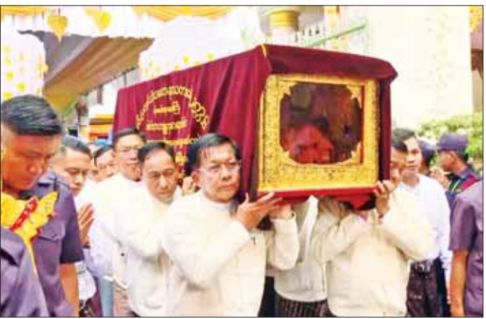
နိုင်ငံတော်စီမံအုပ်ချုပ်ရေးကောင်စီဥက္ကဋ္ဌ နိုင်ငံတော်ဝန်ကြီးချုပ် ဗိုလ်ချုပ်မှူးကြီး မင်းအောင်လှိုင် အမှူးပြု သည့် အကြီးအကဲရှစ်ဦးက ဆရာတော်ဘုရားကြီး၏ ရုပ်ကလာပ်တော်အား ဗိမာန်တော်မှခန့်မှီးမှ သတိမှတ် နေရာအထိ ပင့်ဆောင်စဉ်။