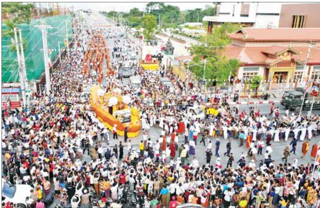
နိုင်ငံတော်သံဃမဟာနာယကအဖွဲ့ဥက္ကဋ္ဌ ဗန်းမော်ဆရာတော်ဘုရားကြီး၏ ရုပ်ကလာပ်တော်ကို တင်ဆောင်ထားသည့် ကရဝိက်ယာဉ်တော်အား ပင့်ဆောင်ရာ လမ်းကြောင်းတစ်လျှောက်တွင် သံဃာတော်များ၊ သာသနာ့နွယ်ဝင် သီလရှင်များ၊ တပည့်ဒါယကာ ဒါယိကာမများ၊ ပြည်သူလူထုအပေါင်းတို့က လိုက်ပါခြင်းဖြင့် စည်ကားသိုက်မြိုက်စွာဖြင့် ပို့ဆောင်တော်မူစဉ်။

နိုင်ငံတော်သံဃမဟာနာယကအဖွဲ့ ဥက္ကဋ္ဌ ဗန်းမော်ဆရာတော်ဘုရားကြီးသည် နိုင်ငံတော် သံဃမဟာနာယကအဖွဲ့ဥက္ကဋ္ဌနှင့် နိုင်ငံတော်ဗဟို သံဃာဝန်ဆောင်အဖွဲ့ဥက္ကဋ္ဌအဖြစ် ၁၃ နှစ်နီးပါး တာဝန်ထမ်းဆောင်ခဲ့သည့် သာသနာ့ဦးညွှောင် ဆရာတော်ဘုရားကြီးဖြစ်ကြောင်း၊ ဗန်းမော်ဆရာ တော်ဘုရားကြီး လောင်းလျာကို မြန်မာသက္ကရာဇ် ၁၂၅၁ ခုနှစ်၊ တော်သလင်းလဆန်း (၁၄) ရက်၊ တနင်္လာ နေ့တွင် မန္တလေးတိုင်းဒေသကြီး တောင်သာမြို့နယ်