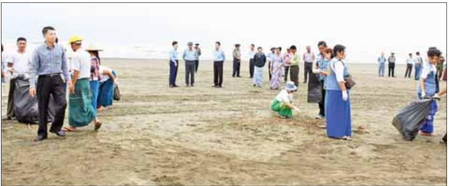
ပြည်ထောင်စုဝန်ကြီး ဒုတိယဗိုလ်ချုပ်ကြီး ထွန်းထွန်းနောင်နှင့်အဖွဲ့ စစ်တွေမြို့ ကမ်းခြေတစ်လျှောက်တွင် ဌာနဆိုင်ရာဝန်ထမ်းများ စုပေါင်းသန့်ရှင်းရေးဆောင်ရွက်နေမှုအား ကြည့်ရှုအားပေးစဉ်။

ရေလှိုင်းနှင့်အတူ ကမ်းခြေသို့ စုပုံရောက်ရှိလာသည့် အမှိုက်များကို တပ်မတော်၊ မြန်မာနိုင်ငံရဲတပ်ဖွဲ့၊ မီးသတ်တပ်ဖွဲ့၊ မြို့နယ်စည်ပင်သာယာရေး အဖွဲ့များ ပူးပေါင်း၍ နေ့စဉ် ရှင်းလင်းဆောင်ရွက်လျက် ရှိသည့်အပြင် ဌာနဆိုင်ရာ ဝန်ထမ်းများ၊ လူမှုကူညီရေးအဖွဲ့များနှင့် ဒေသခံပြည်သူများ ပူးပေါင်းပါဝင်၍ လည်း လူထုလှုပ်ရှားမှုအသွင်ဖြင့် ပြည်နယ်မြို့တော်သန့်ရှင်းသာယာလှပရေးအတွက် အားတက်သရော ဆောင်ရွက်လျက်ရှိသည်။ ယင်းနောက် မုန်တိုင်းဒဏ်ကြောင့် ပျက်စီးသွားသော စစ်တွေ