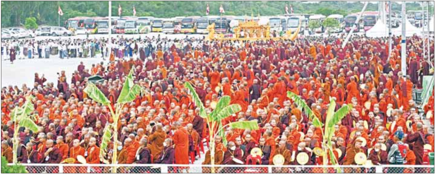
နိုင်ငံတော်သံဃမဟာနာယကအဖွဲ့ဥက္ကဋ္ဌ ဗန်းမော်ဆရာတော်ဘုရားကြီး၏ ရုပ်ကလာပ်တော်ကို တင်ဆောင်ထားသည့် ကရဝိက်ယာဉ်တော် ချမ်းမြသာစည်ဖြူနယ် ဈာပနကွင်းသို့ ပင့်ဆောင်လာရာ သံဃာတော်များ၊ သာသနာ့အဖွဲ့ဝင် သီလရှင်များ၊ တပည့်ဒါယကာ ဒါယိကာမများ၊ ပြည်သူများအား တွေ့ရစဉ်။