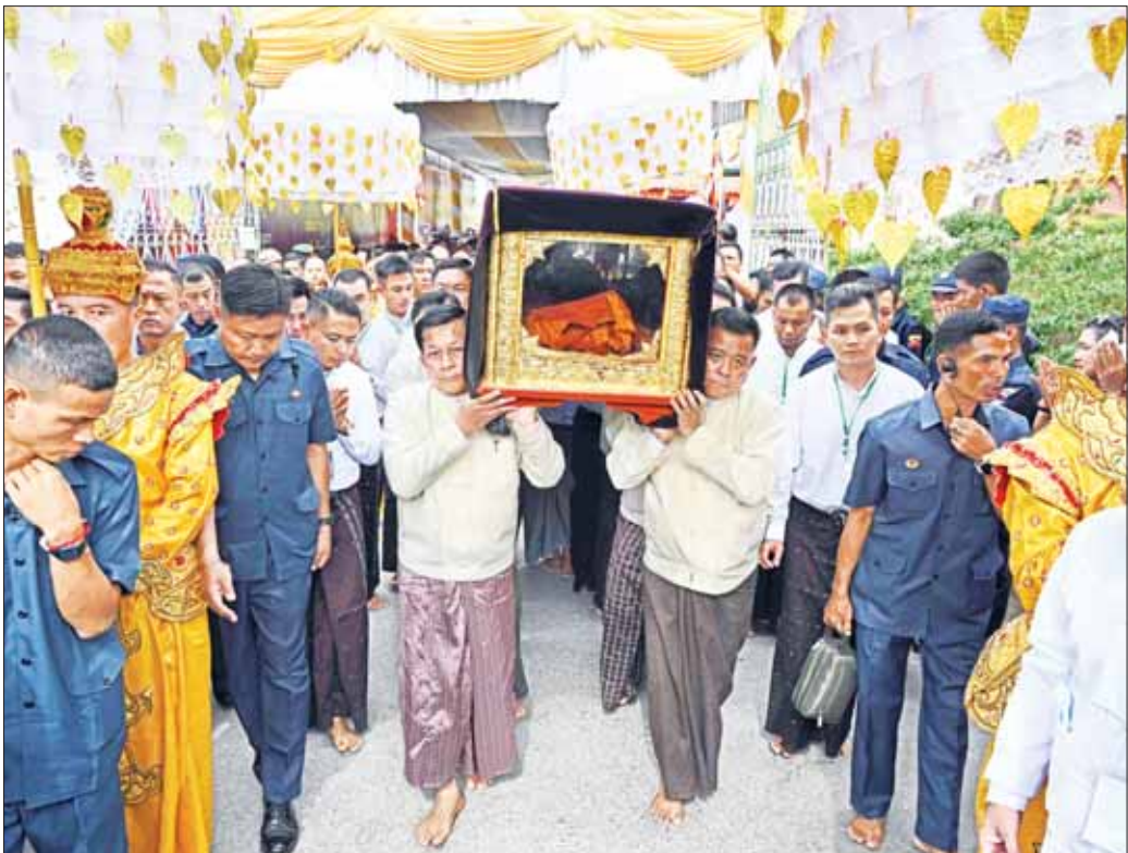
နိုင်ငံတော်စီမံအုပ်ချုပ်ရေးကောင်စီဥက္ကဋ္ဌ နိုင်ငံတော်ဝန်ကြီးချုပ် ဗိုလ်ချုပ်မှူးကြီး မင်းအောင်လှိုင် အမှူးပြုသည့် အကြီးအကဲရှစ်ဦးက ဆရာတော်ဘုရားကြီး၏ ရုပ်ကလာပ်တော်အား ဗိမာန်တော်မှခွဲအထိမှ သတ်မှတ်နေရာအထိ ပင့်ဆောင်စဉ်။

ယင်းနောက် အခမ်းအနားအစီအစဉ် ဒုတိယပိုင်း အဖြစ် ချမ်းမြသာစည်မြို့နယ်ရှိ ဈာပနကွင်းသို့ ဆရာတော်ဘုရားကြီး၏ ရုပ်ကလာပ်တော်အား ပင့်ဆောင်ခြင်းအခမ်းအနားကို ဆက်လက်ကျင်းပရာ အခမ်းအနားများက ဆရာတော်ဘုရားကြီး၏ ရုပ်ကလာပ်တော်အား ကရဝိက်ယာဉ်ပေါ်သို့ ကြိုချီ တော်မူပါရန် အဘိယာစန နိမန္တန ဂါထာဖြင့် တောင်းပန်လျှောက်ထားပြီး ကရဝိက်ယာဉ်ပေါ်သို့ ပင့်ဆောင်ရန်အတွက် ဆရာတော်ကြီး၏ ရုပ်ကလာပ် တော်အား ပင့်ဆောင်ရာတွင် တပည့်သံဃာတော် ရှစ်ပါးက ဗိမာန်တော်မှ ဗိမာန်တော်မှခွဲအထိ၊ နိုင်ငံတော်စီမံအုပ်ချုပ်ရေးကောင်စီဥက္ကဋ္ဌ နိုင်ငံတော် ဝန်ကြီးချုပ် အမှူးပြုသည့် အကြီးအကဲရှစ်ဦးက ဗိမာန်တော်မှခွဲအထိမှ သတ်မှတ်နေရာအထိ၊ ထိုမှ တစ်ဆင့် ဦးစီးကော်မတီ ရှစ်ဦး၊ ဆွေတော်မျိုးတော် ရှစ်ဦးတို့က သတ်မှတ်နေရာအသီးသီးမှ ကရဝိက် ယာဉ်တော်ပေါ်အထိ အသီးသီး ပင့်ဆောင်ကြပြီး လောင်တိုက်တော်တည်ရှိရာ ချမ်းမြသာစည်မြို့နယ်ရှိ ဈာပနကွင်းသို့ ပင့်ဆောင်ကြသည်။