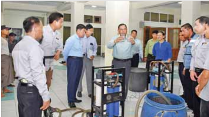
ပြည်ထောင်စုဝန်ကြီး ဒုတိယဗိုလ်ချုပ်ကြီး ထွန်းထွန်းနောင်နှင့်အဖွဲ့ ရေသန့်စင်စက် စမ်းသပ်နေမှုအား ကြည့်ရှုစစ်ဆေးစဉ်။

ရခိုင်ပြည်နယ် စစ်တွေမြို့နှင့် မြောက်ပိုင်းဒေသရှိ မြို့များ လျှပ်စစ်ဓာတ်အား အမြန်ရရှိရေးအတွက် ၂၃၀ ကေစွိဓာတ်အားလိုင်းနှင့် မိမိ ကေစွိဓာတ်အားလိုင်းများ ပြင်ဆင်ရေးဝန်ထမ်းအင်အား ၅၈၀ ဦး၊ ယန္တရား ၆၂ စီးကို အဖွဲ့ ၁၆ ဖွဲ့ခွဲ၍ ပြင်ဆင်ဆောင်ရွက်ပေးလျက်ရှိပြီး မြို့တွင်းဓာတ်အားလိုင်းများ ပြင်ဆင်ရေးအတွက် ဝန်ထမ်းအင်အား ၆၄၂ ဦး၊ ကရိန်းယာဉ် ၃၆ စီး၊ အုပ်ချုပ်မှုယာဉ် ၃၆ စီး၊ အဖွဲ့ ၁၄ ဖွဲ့နှင့် ပြင်ပကုမ္ပဏီတစ်ဖွဲ့ စုစုပေါင်း ၁၅ ဖွဲ့ဖြင့် ဆောင်ရွက်လျက်ရှိသည်။