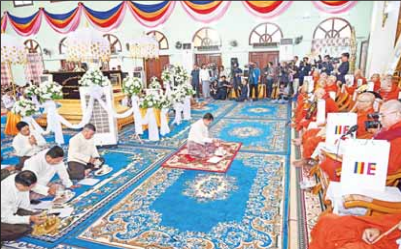
သန့်လျှင်မင်းကျောင်းဆရာတော်ကြီးထံမှ နိုင်ငံတော်စီမံအုပ်ချုပ်ရေးကောင်စီဥက္ကဋ္ဌ နိုင်ငံတော်ဝန်ကြီးချုပ် ဗိုလ်ချုပ်မှူးကြီး မင်းအောင်လှိုင်နှင့် အခမ်းအနားတက်ရောက်လာကြသူများက ရေစက်သွန်းချ တရားနာယူ၍ လှူဒါန်းမှုအစုစုအတွက် အမျှပေးစေစဉ်။