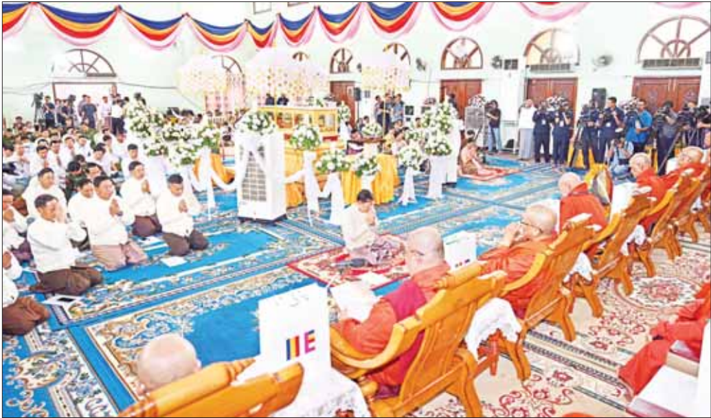
သန်လျင်မင်းကျောင်းဆရာတော်ကြီးထံမှ နိုင်ငံတော်စီမံအုပ်ချုပ်ရေးကောင်စီဥက္ကဋ္ဌ နိုင်ငံတော်ဝန်ကြီးချုပ် ဗိုလ်ချုပ်မှူးကြီး မင်းအောင်လှိုင်၊ ဇနီး ဒေါ်ကြူကြူလှနှင့် ဧည့်ပရိသတ်များက ငါးပါးသီလ ခံယူဆောက်တည်ကြစဉ်။

အဆိုပါအန္တိမအင်္ဂါပုဂံပုဏ္ဏားပူဇော်သော အခမ်းအနားသို့ နိုင်ငံတော်သံဃမဟာနာယကအဖွဲ့၊ အကျိုးတော်ဆောင်၊ သန်လျင်မြို့၊ မင်းကျောင်းပထမ ပြန် စာသင်တိုက်၊ ဦးစီးပဓာနနာယကဆရာတော် အဂ္ဂမဟာပဏ္ဍိတ အဂ္ဂမဟာသဒ္ဓမ္မဇောတိကဇေ ဒေါက်တာ ဘဒ္ဒန္တ စန္ဒိမာဘိဝံသ၊ နိုင်ငံတော်ဩဝါဒါ စရိယ သောဠသမ ရွှေကျင်သာသနာပိုင်ဆရာတော်၊ သီတာဂူကမ္ဘာ့ဗုဒ္ဓတက္ကသိုလ်များ၏ အဓိပတိ အဘိဇေ မဟာရဋ္ဌဂုရု၊ အဘိဇေ အဂ္ဂမဟာသဒ္ဓမ္မဇောတိက ဒေါက်တာ ဘဒ္ဒန္တ ဉာဏိသရ အမှူးပြုသော ဆရာ တော်ကြီးများ ကြွရောက်တော်မူကြပြီး နိုင်ငံတော် စီမံအုပ်ချုပ်ရေးကောင်စီဥက္ကဋ္ဌ နိုင်ငံတော်ဝန်ကြီးချုပ် ဗိုလ်ချုပ်မှူးကြီး မင်းအောင်လှိုင်နှင့် ဇနီး ဒေါ်ကြူကြူ လှ၊ ကောင်စီတွဲဖက်အတွင်းရေးမှူး ဒုတိယဗိုလ်ချုပ် ကြီး ရဲဝင်းဦးနှင့်ဇနီး၊ ကောင်စီအဖွဲ့ဝင် ဒုတိယ ဗိုလ်ချုပ်ကြီး ရာပြည့်၊ ပြည်ထောင်စုဝန်ကြီးများ၊ မန္တလေးတိုင်းဒေသကြီးဝန်ကြီးချုပ်၊ ကာကွယ်ရေး ဦးစီးချုပ်မှူး တပ်မတော်အရာရှိကြီးများနှင့် ဇနီး များ၊ အလယ်ပိုင်းတိုင်း စစ်ဌာနချုပ် တိုင်းမှူးနှင့် ဒါယကာ ဒါယိကာမများ၊ ရဟန်းသံဃာများနှင့် သာသနာ့ဇွယ်ဝင်သီလရှင်များ၊ ဖတ်အသင်းအဖွဲ့များ၊ ဘာသာပေါင်းစုံ အသင်းအဖွဲ့များ၊ ဒေသခံပြည်သူများ တက်ရောက်ပူဇော်ကြသည်။