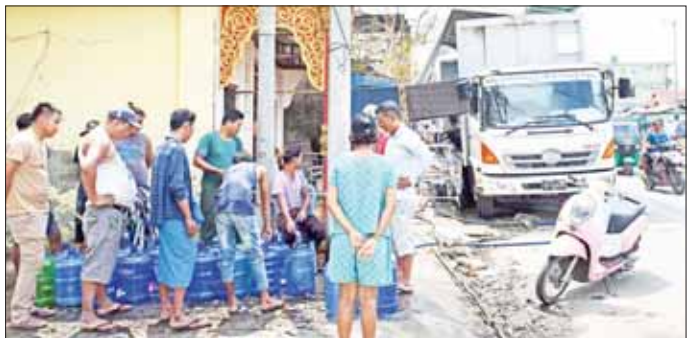
မိုခါမုန်တိုင်းဒဏ်သင့်ပြည်သူများအတွက် ရေသန့်စက်များဖြင့် သောက်သုံးရေများ ပေးစေစဉ်။

ဒသမ ၆၃ တန်တို့အား ဘေးသင့်ဒေသများသို့ အချိန်နှင့်တစ်ပြေးညီ ဆက်လက်ဖြန့်ခွဲ ပို့ဆောင်ပေးခဲ့ပြီး ဆက်လက်ရောက်ရှိလာမည့် ကုန်ပစ္စည်းများကိုလည်း အလားတူ ပေးပို့သွားမည် ဖြစ်ကြောင်း သတင်းရရှိသည်။ သတင်းစဉ်