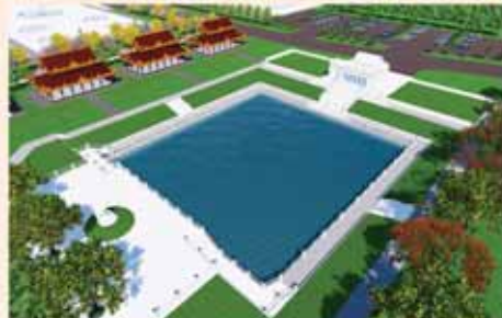
ပုလဲနုအိုင်

၁။ နိုင်ငံတော်စီမံအုပ်ချုပ်ရေးကောင်စီဥက္ကဋ္ဌ၊ တပ်မတော်ကာကွယ်ရေးဦးစီးချုပ် ဗိုလ်ချုပ်မှူးကြီးမင်းအောင်လှိုင် ဦးဆောင်သည့် (၇)ရက်သား၊ သမီး၊ ဘုရားဝါယကား၊ ဝါယံကာမတို့က "မာရဝိဇယ" ပုဒ္ဓရုပ်ပွားတော်မြတ်ကြီးကို မြန်မာနိုင်ငံတွင် ထေရဝါဒပုဂ္ဂိုလ်သဘာဝတော်ကြီး နိုင်ငံအစွာထွန်းလင်းတောက်ပလျက်ရှိမှုအား ကမ္ဘာကိုပြသရန်၊ မြန်မာနိုင်ငံသည် ထေရဝါဒပုဂ္ဂိုလ်သဘာဝတော်ကြီးကွယ်မုဗ်မည့်အထိဖြစ်စေရန်၊ တိုင်းပြည်အေးချမ်းသာယာမှုရှိစေရန်၊ ကမ္ဘာကြီးငြိမ်းချမ်းသာယာမှုဖြစ်စေရန် စသည်ရည်ရွယ်ချက် ၄ ရပ်ဖြင့်တည်ထားကိုးကွယ်ရန် ရည်သန်လျက် ပြည်ထောင်စုနယ်မြေ နေပြည်တော်၊ ဒဂုံကားသိမ်မြို့နယ်အတွင်း၌ သာသနာတော်ထုံး၊ ရုပ်ပွားဆင်းတုတော်ထုံး၊ မြန်မာ့ရိုးရာတည်ထိုးမှုများနှင့်အညီ တည်ဆောက်ပူဇော်လျက် ရှိပါသည်။ ၂။ မာရဝိဇယပုဒ္ဓရုပ်ပွားတော်မြတ်ကြီး တည်ဆောက်ရေးလုပ်ငန်းများအား တပ်မတော်(ကြည်း၊ ရေ၊ လေ)ဗိသားစုများ၊ စေတနာရှင်များ၊ တိုင်းရင်းသားပြည်သူတို့၏ စုပေါင်းလှူဒါန်းမှုဖြင့် အောက်ပါအတိုင်းတည်ဆောက်ပူဇော်သွားမည်ဖြစ်ပါသည်-