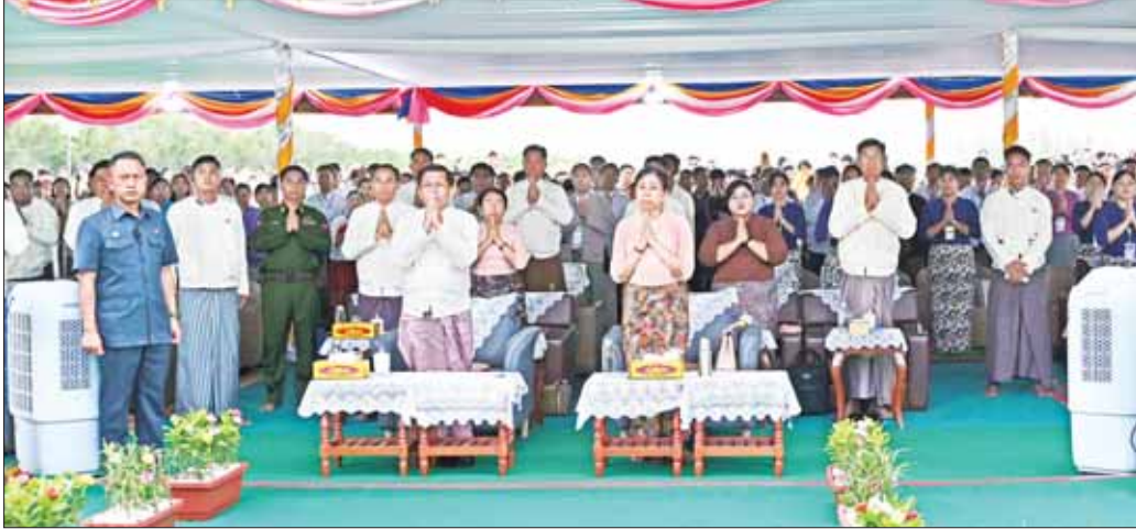
နိုင်ငံတော်စီမံအုပ်ချုပ်ရေးကောင်စီဥက္ကဋ္ဌ နိုင်ငံတော်ဝန်ကြီးချုပ် ဗိုလ်ချုပ်မှူးကြီး မင်းအောင်လှိုင်၊ ဇနီး ဒေါ်ကြူကြူလှနှင့် ဧည့်ပရိသတ်တို့က နိုင်ငံတော်သံဃမဟာနာယကအဖွဲ့ဥက္ကဋ္ဌ ဗန်းမော်ဆရာတော်ဘုရားကြီး၏ ရုပ်ကလာပ်တော်အား ဖူးမြော်ကြည့်ညိစဉ်။

နိုင်ငံတော်သံဃမဟာနာယကအဖွဲ့ဥက္ကဋ္ဌ ဗန်းမော်ဆရာတော်ဘုရားကြီး၏ ရုပ်ကလာပ်တော်အား ကရဝိက်ယာဉ်တော်ပေါ်မှ လောင်တိုက်ပေါ်သို့ တပည့်သံဃာတော် ရှစ်ပါးတို့က စတင်ပင့်ဆောင်စဉ်။