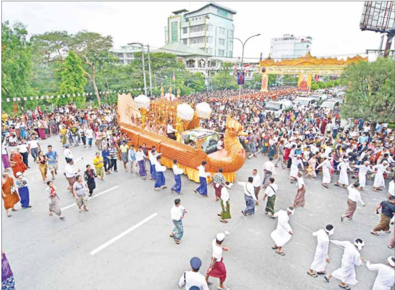
နိုင်ငံတော်သံဃမဟာနာယကအဖွဲ့ဥက္ကဋ္ဌ ဗန်းမော်ဆရာတော်ဘုရားကြီး၏ ဥတုဇရပ်ကလာပ်တော်ကို တင်ဆောင်ထားသည့် ကရဝိက်ယာဉ်တော်အား ချမ်းမြသာစည်မြို့နယ်ရှိ ဈာပနကွင်းသို့ ပင့်ဆောင်ရာ လမ်းကြောင်းတစ်လျှောက်တွင် သံဃာတော်များ၊ သာသနာ့နွယ်ဝင် သီလရှင်များ၊ တပည့်ဒါယကာ ဒါယိကာမများ၊ ပြည်သူလူထုအပေါင်းတို့က လိုက်ပါခြံရံ၍ စည်ကားသိုက်မြိုက်စွာဖြင့် ပို့ဆောင်တော်မူစဉ်။

နိုင်ငံတော်သံဃမဟာနာယကအဖွဲ့ ဥက္ကဋ္ဌ မန္တလေးတိုင်းဒေသကြီး မဟာအောင်မြေမြို့နယ် မဟာနွယ်စဉ်ရပ်ကွက် ဗန်းမော်ကျောင်းတိုက်ကြီး၏ ပဓာနနာယက ဆရာတော် အဘိဓဇမဟာရဋ္ဌဂုရု၊ အဘိဓဇအဂ္ဂမဟာသဒ္ဓမ္မဇောတိက ဒေါက်တာ ဘဒ္ဒန္တ ကုမာရာဘိဝံသ မဟာထေရ်မြတ်ကြီး၏ အန္တိမအင်္ဂါဈာပန သာဓုကိဋ္ဌန ပူဇာသဘင်အခမ်းအနား