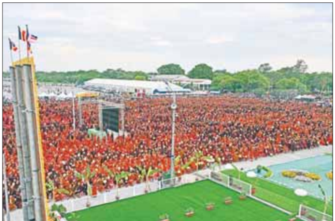
ဗန်းမော်ဆရာတော်ဘုရားကြီး၏ အန္တိမအဂ္ဂိဈာပနသာဓုကိဋ္ဌန ပူဇော်သဘင်အခမ်းအနားကျင်းပသည့် ချမ်းမြသာစည်မြို့နယ်ရှိ ဈာပနကွင်း၌ တက်ရောက်ပူဇော်ကြသည့် ရဟန်းရှင်လူပရိသတ်များကို တွေ့ရစဉ်။