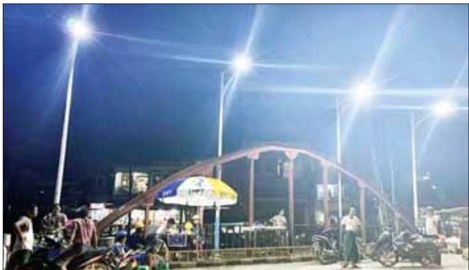
စစ်တွေမြို့ လမ်းများ၌ လျှပ်စစ်မီးများ ထွန်းထားမှုကို တွေ့ရစဉ်။

အလားတူ လျှပ်စစ်ဓာတ်အား မလိုအပ်သည့် တစ်နာရီလျှင် သုံးဂါလန်ခန့် သန့်စင်ပေးနိုင်သော Life Straw ရေသန့်စက်အလုံး ၂၁၀ ကို စစ်တွေ၊ ပုဏ္ဏားကျွန်း၊ ရသေ့တောင်၊ ကျောက်တော်၊ မင်းပြား၊ မြောက်ဦး၊ ပေါက်တော၊ ဘူးသီးတောင်၊ မောင်တောနှင့် မြေပုံ မြို့နယ်များအတွင်းရှိ ကျေးရွာပေါင်း ၁၄၃ ရွာသို့ ဖြန့်ခွဲပေးပို့ထားပြီး ယင်းရေသန့်စက်တစ်လုံးသည် လူဦးရေ ၁၀၀ အတွက် တစ်နေ့တာ သောက်သုံးရန်ရေကို လုံလောက်စွာ သန့်စင်ပေးနိုင်ကြောင်း သိရသည်။