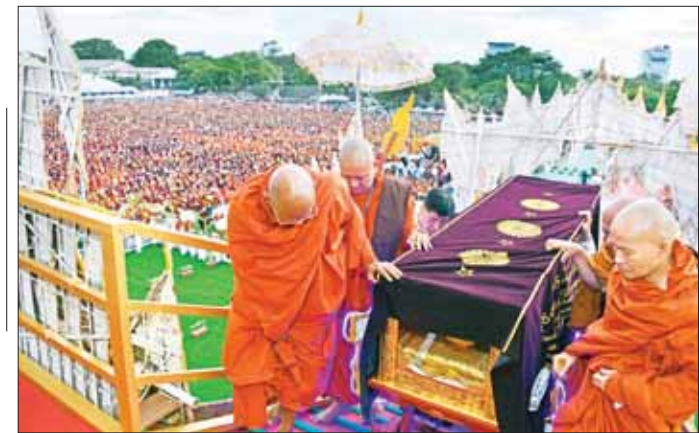
ဗန်းမော်ဆရာတော်ဘုရားကြီး၏ ဥတုဇရုပ်ကလာပ်တော်အား လောင်တိုက်တော်ပေါ်သို့ ပင့်ဆောင်စဉ်။