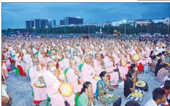
ဗန်းမော် ဆရာတော် ဘုရားကြီး၏ အန္တိမအဂ္ဂိဈာပနသာဓုကိဋ္ဌန ပူဇော်သဘင် အခမ်းအနား ကျင်းပသည့် ချမ်းမြသာစည်မြို့နယ်ရှိ ဈာပနကွင်း၌ တက်ရောက်ပူဇော်ကြသည့် ရဟန်းရှင်လူပရိသတ်များကို တွေ့ရစဉ်။