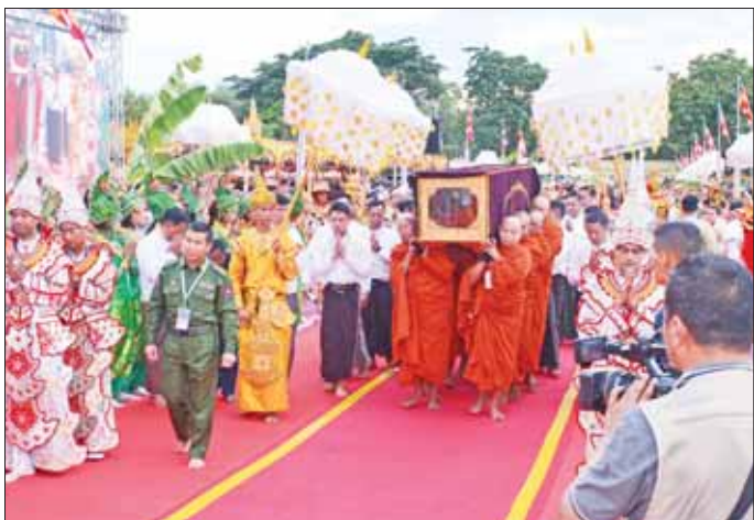
နိုင်ငံတော်သံဃမဟာနာယကအဖွဲ့ဥက္ကဋ္ဌ ဗန်းမော်ဆရာတော်ဘုရားကြီး၏ ရုပ်ကလာပ်တော်အား ကရဝိက်ယာဉ်တော်ပေါ်မှ လောင်တိုက်ပေါ်သို့ တပည့်သံဃာတော် ရှစ်ပါးတို့က စတင်ပင့်ဆောင်စဉ်။