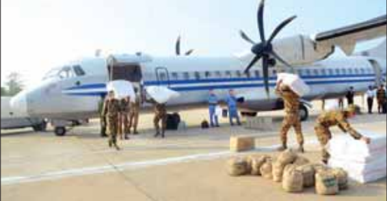
မိုခါမုန်တိုင်းအလွန် ရခိုင်ပြည်နယ်အတွင်းရှိ ဒေသခံပြည်သူများအတွက် ကူညီကယ်ဆယ်ရေးနှင့် ပြန်လည်ထူထောင်ရေးပစ္စည်းများကို တပ်မတော်ရေယာဉ်နှင့် လေယာဉ်များဖြင့် ပို့ဆောင်ပေးလျက်ရှိစဉ်။