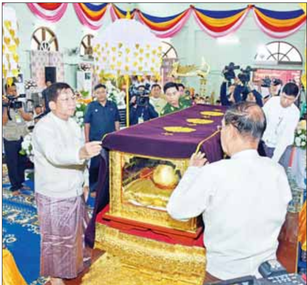
နိုင်ငံတော်စီမံအုပ်ချုပ်ရေးကောင်စီဥက္ကဋ္ဌ နိုင်ငံတော်ဝန်ကြီးချုပ် ဗိုလ်ချုပ်မှူးကြီး မင်းအောင်လှိုင်၊ ပြည်ထောင်စုဝန်ကြီး ဦးကိုကို၊ မန္တလေးတိုင်းဒေသကြီး ဝန်ကြီးချုပ် ဦးမျိုးအောင်နှင့် အလယ်ပိုင်းတိုင်းစစ်ဌာနချုပ်တိုင်းမှူး ဗိုလ်ချုပ်ကိုကိုဦးတို့ ဗန်းမော်ဆရာတော်ဘုရားကြီး၏ ဥတုဇရုပ်ကလာပ်တော်အား စိန်ကတ္တီပါလွှမ်း၍ ပူဇော်စဉ်။

နိုင်ငံတော်သံဃမဟာနာယကအဖွဲ့ဥက္ကဋ္ဌ မန္တလေးတိုင်းဒေသကြီး မဟာအောင်မြေမြို့နယ် မဟာနွယ်စဉ်ရပ်ကွက် ဗန်းမော်ကျောင်းတိုက်ကြီး၏ ပဓာနနာယကဆရာတော် အဘိဓဇမဟာရဋ္ဌဂုရု၊ အဘိဓဇအဂ္ဂမဟာသဒ္ဓမ္မဇောတိက ဒေါက်တာ ဘဒ္ဒန္တကုမာရာဘိဝံသ မဟာထေရ်မြတ်ကြီး၏ အန္တိမအင်္ဂုဇာပုဒ် သာဓုကိဋ္ဌန ပူဇာသဘင်အခမ်းအနား