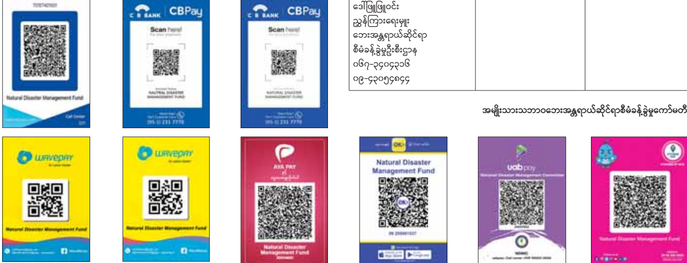
အမျိုးသားသဘာဝဘေးအန္တရာယ်ဆိုင်ရာစီမံခန့်ခွဲမှုကော်မတီ

ဆိုင်ကလုန်းမုန်တိုင်း မိခါကြောင့် ဘေးသင့်ပြည်သူများအတွက် SMS စာတိုဖြင့် လှူဒါန်းနိုင်ရေး အသိပေးကြေညာခြင်း ၁။ မြန်မာနိုင်ငံတွင် ၁၄-၅-၂၀၂၃ ရက်နေ့တွင် ဖြစ်ပွားခဲ့သည့် အလွန်အလွန်အားကောင်းသော ဆိုင်ကလုန်းမုန်တိုင်း မိခါကြောင့် ဘေးသင့်ပြည်သူများအတွက် ပါဝင်လှူဒါန်းလိုသော စေတနာရှင် ပြည်သူများအနေဖြင့် လှူဒါန်းမှုများ ပြုလုပ်ရာတွင် ပိုမိုအဆင်ပြေစေရေးအတွက် ပြည်သူများ အသုံးပြုမှုများ ပြားသည့် မိုဘိုင်းတယ်လီဖုန်းများမှတစ်ဆင့် SMS (စာတို) ဖြင့် လှူဒါန်းငွေများ ပေးပို့နိုင်ရေးဆောင်ရွက်သွားမည်ဖြစ်ပါသည်။ ၂။ ထိုသို့လှူဒါန်းရာတွင် မိုဘိုင်းသုံးစွဲသူ စေတနာရှင် ပြည်သူများအနေဖြင့် မိမိတို့၏ အသုံးပြုနေသည့် မိုဘိုင်းဖုန်းများမှ တစ်ဆင့် 9090 သို့ 500 ဟု SMS ပေးပို့၍ တစ်ကြိမ်လျှင် ၅၀၀ ကျပ်နှုန်းဖြင့် ၇-၆-၂၀၂၃ ရက်နေ့မှစ၍ လှူဒါန်းနိုင်ပါကြောင်း အသိပေးကြေညာအပ်ပါသည်။