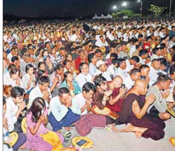
ဗန်းမော်ကျောင်းတိုက်ကြီး၏ ပဓာနနာယက ဆရာတော် အဘိဓဇမဟာရဋ္ဌဂုရု၊ အဘိဓဇအဂ္ဂမဟာသဒ္ဓမ္မဇောတိက ဒေါက်တာ ဘဒ္ဒန္တ ကုမာရာဘိဝံသ မဟာထေရ် မြတ်ကြီး၏ အန္တိမ အဂ္ဂိဈာပနသာဓုကိဋ္ဌန ပူဇာသဘင်အခမ်းအနားသို့ တက်ရောက်ပူဇော် ကန်တော့ကြသည့် ရဟန်းရှင်လူပရိသတ်များ။