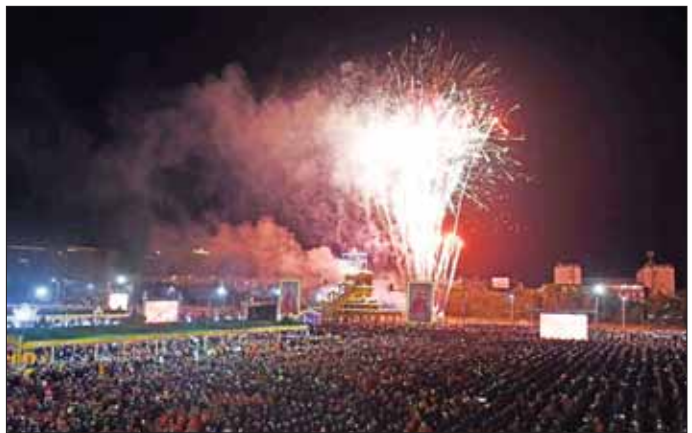
ဗန်းမော်ဆရာတော်ဘုရားကြီး၏ ဥတုဇရုပ်ကလာပ်တော်အား အဂ္ဂိဈာပန တေဇောဓာတ်ဖြင့်ပူဇော်စဉ်။