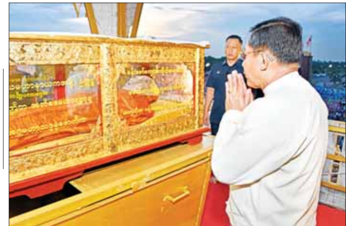
နိုင်ငံတော်စီမံအုပ်ချုပ်ရေးကောင်စီ ဥက္ကဋ္ဌ နိုင်ငံတော်ဝန်ကြီးချုပ် ဗိုလ်ချုပ်မှူးကြီး မင်းအောင်လှိုင် ဗန်းမော်ဆရာတော်ဘုရားကြီး၏ ရုပ်ကလာပ်တော်အား ဖူးမြော်ကြည့်ည့်စဉ်။