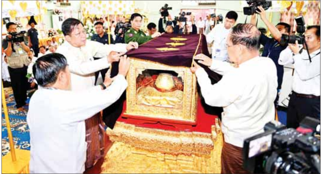
နိုင်ငံတော်စီမံအုပ်ချုပ်ရေးကောင်စီဥက္ကဋ္ဌ နိုင်ငံတော်ဝန်ကြီးချုပ် ဗိုလ်ချုပ်မှူးကြီး မင်းအောင်လှိုင်၊ ပြည်ထောင်စုဝန်ကြီး ဦးကိုကို၊ မန္တလေးတိုင်းဒေသကြီး ဝန်ကြီးချုပ် ဦးမျိုးအောင်နှင့် အလယ်ပိုင်းတိုင်း စစ်ဌာနချုပ် တိုင်းမှူး ဗိုလ်ချုပ်ကိုကိုဦးတို့ ဗန်းမော်ဆရာတော်ဘုရားကြီး၏ ဥတုဇရုပ်ကလာပ်တော်အား စိန်ကတ္တီပါလွမ်း၍ ပူဇော်စဉ်။

ဝမ်းနည်းကြောင်းသဝဏ်လွှာ ဖတ်ကြား ယင်းနောက် နိုင်ငံတော်သံဃမဟာနာယကအဖွဲ့ ၏ သဝဏ်ပေးတော်မူကြောင်း သဝဏ်လွှာကို နိုင်ငံ တော်သံဃမဟာနာယကအဖွဲ့ အကျိုးတော်ဆောင်၊ သန်လျင်မင်းကျောင်းဆရာတော်ကြီးက ဖတ်ကြား ပူဇော်သည်။ ထို့နောက် သာသနာရေးနှင့် ယဉ်ကျေးမှု ဝန်ကြီးဌာန၏ ဝမ်းနည်းကြောင်းသဝဏ်လွှာကို