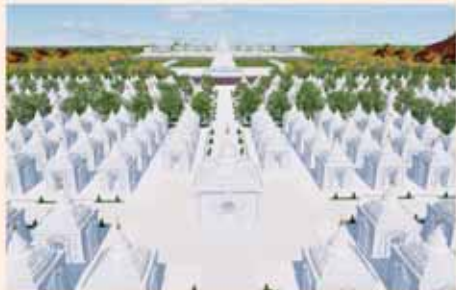
ကျောက်စာရံစေတီ(၁၂ x ၀၂ x ၀၈)၀၀ ဝ ဆူ တန်ဖိုး-၂၇၉ သိန်း