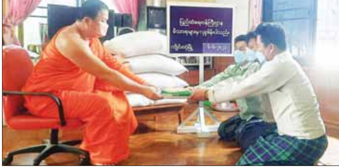
တိမ်အသင့်အတင့်မှ တိမ်ထူထပ်နေ

နေပြည်တော် ဇွန် ၇ ဘင်္ဂလားပင်လယ်အော်အခြေအနေမှာ ကမ္ဘာ့ပင်လယ်ပြင်နှင့် ဘင်္ဂလားပင်လယ်အော် တောင်ပိုင်းတို့တွင် မုတ်သုံလ အားကောင်းရာမှ အားအလွန်ကောင်းနေပြီး ကျန်ဘင်္ဂလားပင်လယ်တွင် တိမ်အသင့်အတင့်မှ တိမ်ထူထပ်နေသည်။ မိုး/လေ