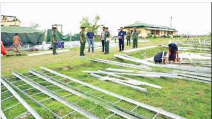
ဆွေးနွေးတင်ပြကြသည်။ ထို့နောက် ဒုတိယဗိုလ်ချုပ်ကြီး ဖုန်းမြတ်နှင့် အဖွဲ့ဝင်များသည် စစ်တွေတပ်နယ်တွင် ဆောင်ရွက်ထားရှိသည့် DYL ဝက်မွေးမြူရေးခြံများနှင့် ဥစား

နေပြည်တော် ဇွန် ၆ ကာကွယ်ရေးဦးစီးချုပ်ရုံး(ကြည်း)မှ ဒုတိယဗိုလ်ချုပ်ကြီး ဖုန်းမြတ်၊ အနောက်ပိုင်းတိုင်းစစ်ဌာနချုပ် တိုင်းမှူး ဗိုလ်ချုပ် ထင်လတ်ဦး၊ စိုက်ပျိုးရေး၊ မွေးမြူရေးနှင့် ဆည်မြောင်းဝန်ကြီးဌာန ဒုတိယဝန်ကြီးဦးတင်ထွဋ်တို့က တာဝန်ရှိသူများနှင့်အတူ ယနေ့နံနက်ပိုင်းတွင် ရခိုင်ပြည်နယ် စစ်တွေမြို့ရှိ ကြက်ကိုင်းတန်ကျေးရွာ၌ တောင်သူပညာပေးမိုးစပါးစံပြကွက် စိုက်ပျိုးပြသနိုင်ရန် စက်မှုလယ်ယာဦးစီးဌာနက ထွန်စက်များဖြင့် လယ်ယာများ ထွန်ယက်ခြင်းလုပ်ငန်းများ ဆောင်ရွက်နေမှုကို သွားရောက်ကြည့်ရှုအားပေးရာ တာဝန်ရှိသူများက ယခုနှစ် မိုးစပါးစိုက်ပျိုးရာသီတွင် စပါးအထွက်နှုန်းကောင်းမွန်စေရေးအတွက် ဒေသနှင့်ကိုက်ညီသည့် စပါးမျိုးများကို နည်းစနစ်မှန်ကန်စွာဖြင့် စိုက်ပျိုးလုပ်ကိုင်ဆောင်ရွက်နိုင်ရေးအတွက် တောင်သူပညာပေးစံပြစိုက်ကွက်များ စိုက်ပျိုးပြသရန် ဆောင်ရွက်နေမှုအခြေအနေများနှင့် စပ်လျဉ်း၍