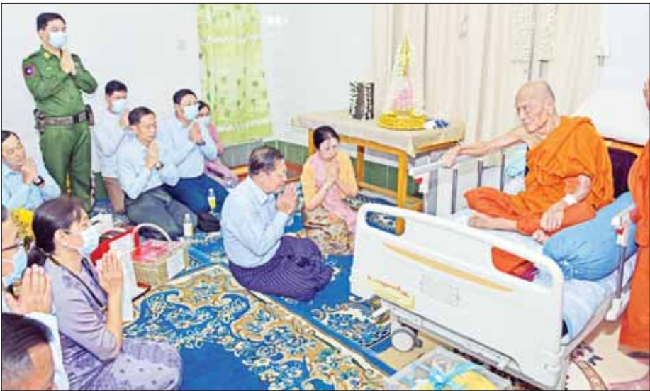
နိုင်ငံတော်စီမံအုပ်ချုပ်ရေးကောင်စီဥက္ကဋ္ဌ နိုင်ငံတော်ဝန်ကြီးချုပ် ဗိုလ်ချုပ်မှူးကြီး မင်းအောင်လှိုင်နှင့် ဧည့်သည်အဖြစ် ဝန်ကြီးချုပ် ဒေါ်ကြူကြူလှတို့က ဗန်းမော်ဆရာတော် ဘုရားကြီးအား ဧပြီ ၂၉ ရက်က သွားရောက်ဖူးမြော်ကြည့်ည့်စဉ်။

အဆောင်ဘာလုပ်တိုးလို့ မေးတယ်။ အဲဒါတော့ ဘုန်းဘုန်းက တရား ဂုဏ်တော် ပုတီးစိပ်တဲ့အကြောင်း၊ ပြီးတော့ကျ ဂုဏ်တော်တွေပွားတဲ့ အကြောင်း၊ တစ်သောင်း နှစ်ထောင်ကုန်သော ဘုရားရှင်တို့ကိုလည်းပဲ တပည့်တော် ရှိခိုးပါ၏။ ပဉ္စသတ သာယာသာနိ၊ ပဉ္စ က ငါး၊ သတ က တစ်ရာ၊ ငါး သတ၊ သာယာသာ ကတစ်ထောင်၊ ငါးရာနဲ့ တစ်ထောင်နဲ့မြောက် ငါးသိန်း။ အဲဒါတော့ ပဉ္စသတ သာယာသာနိ ငါးသိန်းသော ဘုရားရှင်တို့ ကိုလည်း တပည့်တော် ရှိခိုးပါ၏။ ပေါင်းလိုက်တော့ ငါးသိန်း တစ်သောင်းနှစ်ထောင် နှစ်ကျပ်ရှစ်ဆူကုန်သော ဘုရားရှင်တို့ကို တပည့်တော်ရှိခိုးပါ၏။ ဘုရား ငါးသိန်း တစ်သောင်းနှစ်ထောင် နှစ်ကျပ်ရှစ်ဆူကို ရှိခိုးတဲ့ ဂါထာ၊ အဲဒါ ဆရာတော်ကြီးက ပြောတယ်။ သူက ငယ်ငယ်လေးကတည်းက၊ သူ ခုနစ်နှစ်သား အရွယ်ကတည်းက သမ္မုဒ္ဒေါဂါထာ နေ့တိုင်းရှိခိုးတာ၊ ဘာအကျိုးရှိသလဲဆိုတော့ အန္တရာယ် ကင်းတယ်။ ဘေးရင်းတယ်တဲ့။ ဆွမ်းခံသွားရင်လည်း ဘယ်တော့မှ မိုးမခါးဘူးတဲ့။ မိုးရွာနေရင် သမ္မုဒ္ဒေါဂါထာရွတ်လိုက်ရင် မိုးတိတ်သွား တယ်။ အဲဒီလို ကျေးဇူးရှိတဲ့အကြောင်း၊ အဲဒါဘယ်တုန်းက စခဲ့တာတဲ့ ဆိုတော့.. လွန်ခဲ့တဲ့ သင်္ချေနှစ်ဆယ်နဲ့ ကမ္ဘာတစ်သိန်းက ဘုရင်ကြီး တစ်ပါး အုပ်ချုပ်တယ်။ သမီးတော်လေးက ဘုံခုနစ်ဆင့်ရှိတဲ့ ပြာသာဒ်၊ ခုနစ်ထပ်တိုက်ကြီးနဲ့ နေတယ်။ ပြာသာဒ်ဘေးဘက်များဆီကို လှည့်ပတ် ကြည့်တော့ ညနေ ၄ နာရီလောက် ဦးစင်းလေးတစ်ပါး ဆွမ်းခံနေတယ်။ ဟာ.. ဦးစင်းလေးတစ်ပါး ညနေကြီး ဆွမ်းခံနေတယ်။ သွား ကိုယ်တော်ကို ပင့်စမ်းဆိုတော့ ပင့်တယ်။ ရောက်လာတယ်။ ရောက်လာတော့ ဦးစင်းကလေး.. သူများတွေ မနက်ဆွမ်းခံတယ်။ ကိုယ်တော်ညနေကြီး ဆွမ်းခံတယ်။ ည ထမင်းစားသလား။ ဆွမ်းစား သလား။