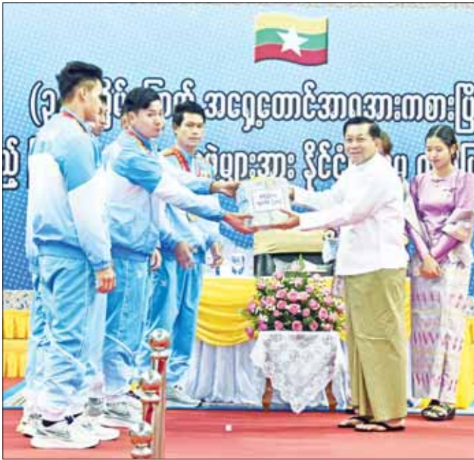
နိုင်ငံတော်စီမံအုပ်ချုပ်ရေးကောင်စီဥက္ကဋ္ဌ နိုင်ငံတော်ဝန်ကြီးချုပ် ဗိုလ်ချုပ်မှူးကြီး မင်းအောင်လှိုင် ရုံးရာလှေအားကစားနည်းတွင် ရွှေတံဆိပ်ဆုရရှိသည့် အားကစားအဖွဲ့အား ဂုဏ်ပြုချီးမြှင့်ငွေပေးအပ်စဉ်။ (၁-၆-၂၀၂၃)

နိုင်ငံတော်ဘက်က ငွေကြေးခန့်ပြည့်စုံနေ၍ လည်းမဟုတ်၊ အားကစားသမားဘက်ကလည်း ငွေကြေးမက်မော၍ ယှဉ်ပြိုင်ခြင်းလည်းမဟုတ်ပါ။ နိုင်ငံအတွက် ကြိုးစားရက်စားခံခဲ့ရသူများဖြစ်၍ ချီးမြှင့်ထိုက်သူကို ချီးမြှင့်ခြင်းသည်ပင် မင်္ဂလာ