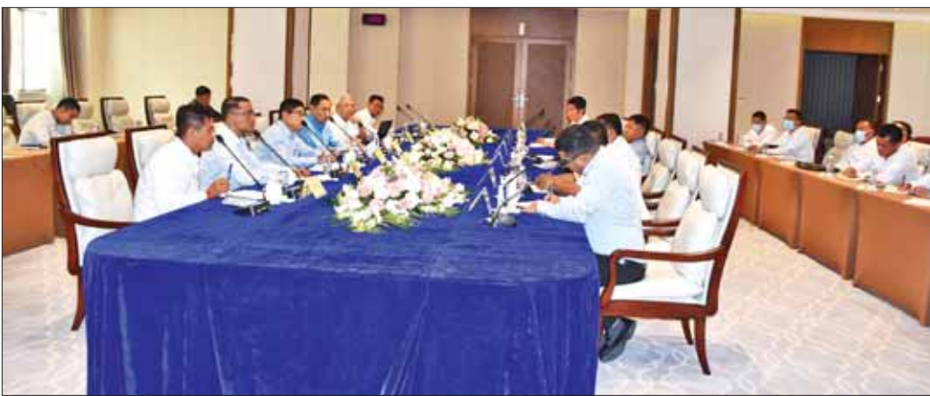
ပြည်နယ်လွှတ်မြောက်ရေးတပ်ဦး (PSLF/TNLA)နှင့် တွေ့ဆုံဆွေးနွေးပွဲတွင် ပထမနေ့၌ မပြီးပြတ် ရက်စွဲအမျိုးသားအဖွဲ့ချုပ် (ULA/AA)တို့မှ ကိုယ်စား သေးသောကိစ္စများကို ဆက်လက်ဆွေးနွေးညှိနှိုင်းခဲ့ကြပြီး နှစ်ဖက်အဆင်ပြေသည့်အချိန်တွင် ပြန်လည် သတင်းစဉ်

မိုင်းလား ဇွန် ၂ အမျိုးသားစည်းလုံးညီညွတ်ရေးနှင့် ငြိမ်းချမ်းရေးဖော်ဆောင်မှုညှိနှိုင်းရေးကော်မတီနှင့် MNDA | TNLA | AA ကိုယ်စားလှယ်အဖွဲ့တို့သည် ယနေ့ နံနက် ၉ နာရီတွင် ရှမ်းပြည်နယ်(အရှေ့ပိုင်း) မိုင်းလားမြို့၊ အရှေ့တိုင်းစဉ်ရိပ်မွန်ဟိုတယ်၌ ဒုတိယနေ့အဖြစ် ဆက်လက်တွေ့ဆုံဆွေးနွေးခဲ့ကြသည်။ (ယာပုံ) တွေ့ဆုံဆွေးနွေးပွဲသို့ နိုင်ငံတော်စီမံအုပ်ချုပ်ရေးကောင်စီအဖွဲ့ဝင်၊ ပြည်ထောင်စုအစိုးရအဖွဲ့ရုံးဝန်ကြီးဌာန ပြည်ထောင်စုဝန်ကြီး၊ အမျိုးသားစည်းလုံးညီညွတ်ရေးနှင့် ငြိမ်းချမ်းရေးဖော်ဆောင်မှုညှိနှိုင်းရေးကော်မတီဥက္ကဋ္ဌ ဒုတိယဗိုလ်ချုပ်ကြီးရာပြည့်၊ ညှိနှိုင်းရေးကော်မတီ အတွင်းရေးမှူး ဒုတိယဗိုလ်ချုပ်ကြီး ဝင်းဗိုလ်ရှိန်၊ လုပ်ငန်းကော်မတီအဖွဲ့ဝင် ဒုတိယဗိုလ်ချုပ်ကြီး ခင်ဇော်ဦး (အငြိမ်းစား)၊ ကြိုတင်ဒေသတိုင်းစစ်ဌာနချုပ် ဒုတိယတိုင်းမှူးဗိုလ်မှူးချုပ် ထွန်းမြတ်ရွှေနှင့် ဌာနဆိုင်ရာတာဝန်ရှိသူများ၊ မြန်မာနိုင်ငံ အမှန်တရားနှင့် တရားမျှတသောအမျိုးသားပါတီ (MNTJ/MNDA) ၊ ဝလောင်