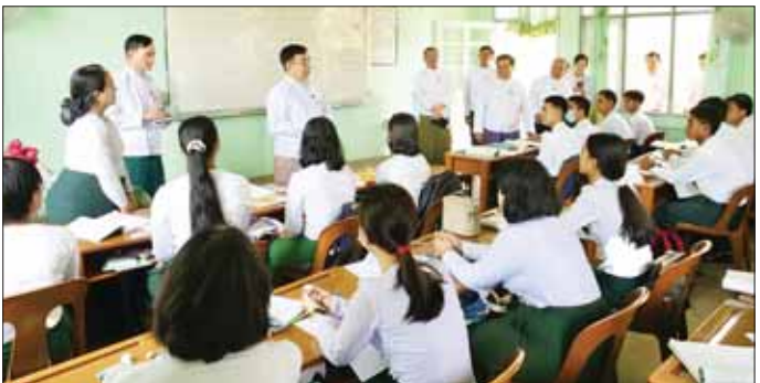
လည်း ဝီရိယထား၍ ကြိုးစားပညာသင်ကြားနေသည့် ကျောင်းသားများအားလုံးကို ဖြည့်ဆည်းဆောင်ရွက်ပေးခဲ့ကြောင်း သိရအားပေးစကားပြောကြားကာ ဆရာ ဆရာမများအား

Grade-12 စာသင်ခန်းမှ ကျောင်းသား ကျောင်းသူများကို စီမံခန့်ခွဲပေးသည့် သင်ကြားသင်ယူရေးနှင့် ပတ်သက်၍ ကျောင်းသင်ခန်းစာပါ Metabolism မှ Catabolism နှင့် Anabolism အကြောင်းကို ရှင်းလင်းပြောကြားကာ ကျောင်းသား ကျောင်းသူများ အနေဖြင့် Grade-12 ကို ထူးချွန်ချွန်အောင်မြင်ရေးအတွက် တစ်နေ့စာ တစ်နေ့ ကျေညက်အောင် ကြိုးစားလေ့လာကြစေလိုပါကြောင်း၊ ပညာရည် မြင့်မားမှုသာ မိမိဘဝ၊ မိမိနိုင်ငံကို တိုးတက်မြှင့်တင် စေမည်ဖြစ်ပါကြောင်း၊ စာတတ်ရုံမျှမက မိမိနိုင်ငံနှင့် လူမျိုးကို တန်ဖိုးထားသည့်စိတ်၊ တိုင်းပြည်နှင့် လူမျိုးကိုချစ်မြတ်နိုးသည့်စိတ်၊ မိမိနိုင်ငံ၏ ယဉ်ကျေးမှုကို တန်ဖိုးထားထိန်းသိမ်းလိုစိတ်များလည်း ရှိကြရန်လိုပါကြောင်း၊ စာသင်ခန်းအတွင်း ကျောင်းသား ကျောင်းသူများအားလုံး ဉာဏ်ရည်မတူနိုင်သော်