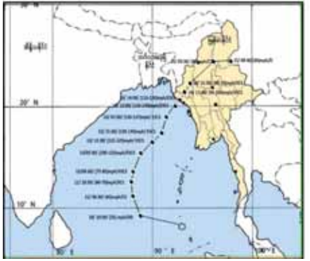
ပုံ ၃။ (က) အမှန်တကယ်ဖြတ်ကျော်ဝင်ရောက်ခဲ့သည့် လမ်းကြောင်း။

ထို့ကြောင့် ပြည်သူလူထုအနေဖြင့် သဘာဝဘေးအန္တရာယ်ဆိုင်ရာ ထုတ်ပြန်ချက်၊ သတင်းချက်များနှင့် ဆက်စပ်၍ ဆိုရှယ်မီဒီယာများမှ အလွတ်သဘော ထုတ်ပြန်ချက်များကို အပြည့်အဝယုံကြည်မှုမပြုကြဘဲ နိုင်ငံ၏တရားဝင်ထုတ်ပြန်ခွင့်ရှိသော မိုးလေဝသနှင့် ဇလဗေဒဌာနကြားမှ ဦးစီးဌာနမှ ထုတ်ပြန်ချက်များကိုသာ ယုံကြည်စွာ စောင့်ကြည့်သင့်ပါသည်။ သို့မှသာ တရားမဝင် ကောလာဟလများကို ရှောင်ရှားနိုင်ပြီး မလိုလားအပ်သော စိုးရိမ်ထိတ်လန့်မှုများကို ရှောင်ရှားနိုင်မည်ဖြစ်ပါသည်။ ထို့ပြင် အမျိုးသားသဘာဝဘေးအန္တရာယ်ဆိုင်ရာစီမံခန့်ခွဲမှုကော်မတီ၏ လမ်းညွှန်မှုနှင့်အညီ သက်ဆိုင်ရာ တိုင်းဒေသကြီး/ပြည်နယ်အစိုးရအလိုက် ဖွဲ့စည်းထားသည့် သဘာဝဘေးအန္တရာယ်ဆိုင်ရာစီမံခန့်ခွဲမှုအဖွဲ့များ၏ ကြိုးကြပ်လမ်းညွှန်မှုများကို လိုက်နာဆောင်ရွက်ခြင်းဖြင့် သဘာဝဘေးအန္တရာယ်အသွယ်သွယ်မှ ဘေးကင်းနိုင်စေရေး အထူးသတိပြုရစေရန် တိုက်တွန်းနှိုးဆော်လိုက်ရပါသည်။