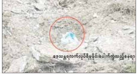
ဒေသန္တရလက်လုပ်ရိုမုမိုင်း နှစ်လုံးပေါက်ကွဲသည့် ဖြစ်စဉ်မှတ်တမ်း ဓာတ်ပုံများ။

ထိုသို့ လုပ်ဆောင်လျက်ရှိရာ ယနေ့နံနက်ပိုင်းတွင် အကြမ်းဖက်သမားများက တီးတိန်မြို့ရှိ အခြေခံပညာ အထက်တန်းကျောင်း(ခွဲ)(မြို့မ)တွင် အေးချမ်းစွာ ပညာသင်ကြားလျက်ရှိသော ကလေးသူငယ်များ အထိတ်တလန့်ဖြစ်စေရန် ကျောင်းဝင်ပေါက်အနီး၌ လက်လုပ်ရိုမုမိုင်း