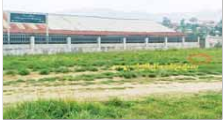
တီးတိန်မြို့ရှိ အခြေခံပညာအထက်တန်းကျောင်း(ခွဲ) (မြို့မ)အနီး ဒေသန္တရလက်လုပ်ရိုမုမိုင်း နှစ်လုံးပေါက်ကွဲသည့် နေရာပြပုံ။

နစ်လုံးဖြင့် ဖောက်ခွဲခဲ့ကြောင်း၊ မိုင်းပေါက်ကွဲမှုကြောင့် ကျောင်းအဆောက်အဦနှင့် ကျောင်းသားကျောင်းသူများ ပျက်စီး/ထိခိုက်ဒဏ်ရာရရှိမှု မရှိကြောင်းနှင့် အဆိုပါကျောင်းတွင် ဆရာ ဆရာမ ၁၆ ဦး၊ ကျောင်းသား ကျောင်းသူ ၁၃၉ ဦး စုစုပေါင်း ၁၇၀ ဖွင့်လှစ်ပညာ သင်ကြားပေးလျက်ရှိကြောင်း သိရှိရသည်။