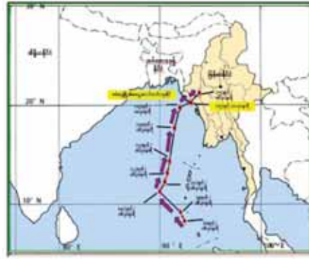
ပုံ ၃။ (ခ) WRF မော်ဒယ်၏ မုန်တိုင်းခန့်မှန်းချက်လမ်းကြောင်းဝင်ရောက်ခဲ့သည့် လမ်းကြောင်း။

သဘာဝဘေးအန္တရာယ်ဆိုင်ရာ စီမံခန့်ခွဲမှုကော်မတီ အရေးပေါ်လုပ်ငန်းညှိနှိုင်းအစည်းအဝေးတွင် အသိပေးဆွေးနွေးတင်ပြခဲ့သည်။ ထိုသို့ခန့်မှန်းရာတွင် တိုင်းထွာသည့် အချိန်၊ အသုံးပြုသည့် Data တို့အပေါ်မှတည်ပြီး လမ်းကြောင်းအမျိုးမျိုးပြောင်းလဲနေခဲ့ရာ ၅-၅-၂၀၂၃ ရက်နေ့ ဝဲ(၁)တွင် ဖော်ပြထားသည့်အတိုင်း ECMWF မော်ဒယ်သည် ရခိုင်ကမ်းရိုးတန်းကို ကျောက်ဖြူမြို့အနီးမှ