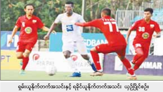
ရှမ်းယူနိုက်တက်အသင်းနှင့် ရခိုင်ယူနိုက်တက်အသင်း ယှဉ်ပြိုင်စဉ်။

ရန်ကုန် ဇွန် ၂ ၂၀၂၃ ရာသီ MNL အမှတ်ပေးပြိုင်ပွဲ ပွဲစဉ် (၇) နောက်ဆုံးနေ့ကို ဇွန် ၂ ရက်က ဆက်လက်ကျင်းပရာ လက်ရှိချန်ပီယံ ရှမ်းယူနိုက်တက်အသင်းနှင့် အား/ကာသိပွဲအသင်း နိုင်ပွဲပြန်လည်ရရှိခဲ့သည်။ YUSC ကွင်း၌ ကျင်းပသည့်ပွဲတွင် ရှမ်းယူနိုက်တက်အသင်းက ရခိုင်ယူနိုက်တက်အသင်းကို သုံးဂိုး-ဂိုးမရှိဖြင့် အနိုင်ရခဲ့သည်။ ရှမ်းယူနိုက်တက်အသင်းသည် ရခိုင်ယူနိုက်တက်ကို ဂိုးပြတ်သွင်းပြီး ဇယားထိပ်ဆုံးတွင် ဆက်လက်ဦးဆောင်နိုင်ခဲ့သည်။ ပြီးခဲ့သည့်ပွဲတွင် စာမျက်နှာ ၁၄ ကော်လံ ၁ ၀