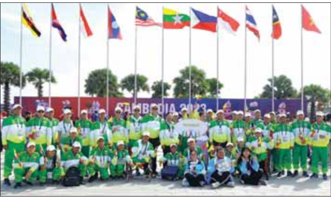
(၁၂) ကြိမ်မြောက် အာဆီယံမသန်စွမ်းအားကစားပြိုင်ပွဲ ဝင်ရောက်ယှဉ်ပြိုင်မည့် ပြိုင်ပွဲဝင်နိုင်ငံများကို ကြိုဆိုနှုတ်ဆက်ခြင်းအခမ်းအနားကျင်းပ

ရောဂါ စည်းကမ်းချက်များအညီ နှင့်အေးချမ်းစွာ တက်ရောက် ပညာသင်ကြားလျက်ရှိရာ ယနေ့ တွင် ကျောင်းသား ကျောင်းသူ စုစုပေါင်း ၆၅၀၇၀၉၇ ဦး တက်ရောက် ပညာသင်ကြား လျက်ရှိကြောင်းနှင့် ၂၀၂၃- ၂၀၂၄ ပညာသင်နှစ်တွင် အခြေခံပညာ မူလတန်း၊ အလယ်တန်းနှင့် အထက်တန်း ကျောင်းသား ကျောင်းသူများကို သင်ရိုးညွှန်း တမ်းစာအုပ်များ အမဲထုတ်ပေး ပြီး ကျောင်းဝတ်စုံနှင့် ဗလာ စာအုပ်များကို အမဲထုတ်ပေးလျက် ရှိကြောင်း သိရသည်။ ကြိုတင်ပြင်ဆင်ပေးထား ယခုကဲ့သို့ အခြေခံပညာ ကျောင်းများ စနစ်တကျ ဖွင့်လှစ် နိုင်ရေးအတွက် ပညာရေးဝန်ကြီး ဌာနနှင့် သက်ဆိုင်ရာအဖွဲ့အစည်း များမှ တာဝန်ရှိသူများက စာသင်ခန်းများတွင် ကိုဗစ်-၁၉ စည်းကမ်းများနှင့်အညီ စာသင်ခုံ များ နေရာချထားခြင်း၊ စာသင် ချိန်များအား စနစ်တကျစီမံထား ခြင်း၊ ကျောင်းကြို/ပိုမိုပညာများ စီစဉ်ထားခြင်း၊ ကျောင်းများ၌ပစ် ရုပ်ကောင်းမွန်စေရေး စသည့် ကြိုတင်ပြင်ဆင်ခြင်း လုပ်ငန်း