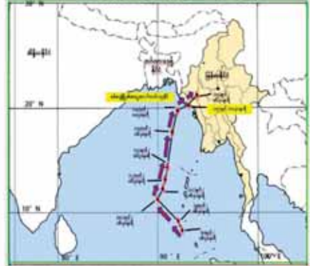
ပုံ ၁။ မုန်တိုင်းစတင်မဖြစ်ပေါ်မီ မော်ဒယ်အသီးသီးမှ မုန်တိုင်းဖြတ်ကျော်ဝင်ရောက်မည့် လမ်းကြောင်းအမျိုးမျိုးအား ခန့်မှန်းတွက်ထုတ်ရရှိပုံ