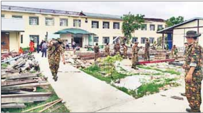
ကူညီကယ်ဆယ်ရေး အဖွဲ့များ သည် အခြေခံပညာအထက်တန်း ကျောင်းဝင်းအတွင်း၌ လဲကျနေ သော သစ်ပင်၊ သစ်ကိုင်းများ ခုတ်ထွင် ရှင်းလင်းခြင်းလုပ်ငန်း များ ဆောင်ရွက်ပေးလျက်ရှိ သည်။(အပေါ်ပုံ) ထိုပြင် ကိုးတန် ကောက်ကျေးရွာ၌ ဒေသခံပြည်သူ များအား ကျန်းမာရေးစောင့်ရှောက်

နေပြည်တော် ဇွန် ၂ သဘာဝဘေးအန္တရာယ်ကျရောက် ခဲ့ရသည့် ဒေသများတွင် လိုအပ် သည့် ကူညီကယ်ဆယ်ရေးနှင့် ပြန်လည်ထူထောင်ရေးလုပ်ငန်း များ ကူညီဆောင်ရွက်ပေးနိုင်ရေး အတွက် တပ်မတော်မှ ကြိုတင် စုဖွဲ့စေလွှတ်ထားသည့် ကူညီ ကယ်ဆယ်ရေး အဖွဲ့များသည် နယ်မြေခံ လုံခြုံရေးတပ်ဖွဲ့ဝင်များ၊ လူမှုကယ်ဆယ်ရေးအဖွဲ့များနှင့် ပူးပေါင်း၍ သက်ဆိုင်ရာဒေသ များတွင် အင်တိုက်အားတိုက် ကူညီဆောင်ရွက်ပေးလျက်ရှိသည်။ ထိုသို့ဆောင်ရွက်ပေးလျက်ရှိ ရာ ယနေ့တွင် ပုဏ္ဏားကျွန်းမြို့၌ ရောက်ရှိ အခြေပြုလျက်ရှိသည့်