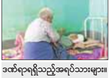
ဒဏ်ရာရရှိသည့်အရပ်သားများ။

မြို့ အမှတ်(၆)ရပ်ကွက်ရှိ ခရိုင်ရဲတပ်ဖွဲ့မှူးရုံးအား ယနေ့နံနက် ၅ နာရီခန့်တွင် KNLA တပ်မဟာ