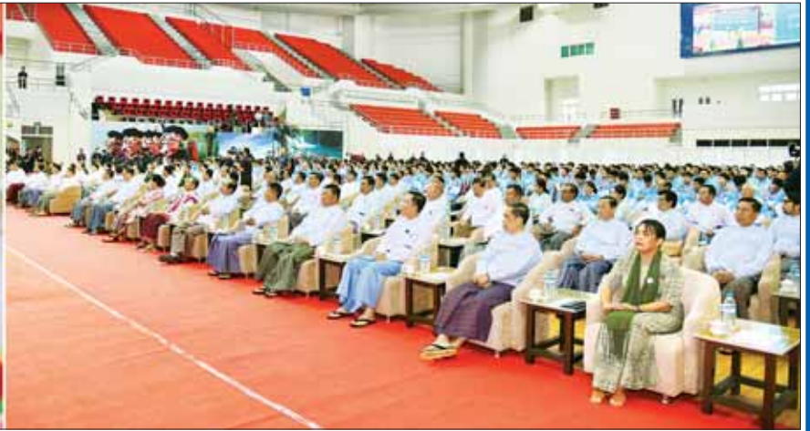
နိုင်ငံတော်စီမံအုပ်ချုပ်ရေးကောင်စီဥက္ကဋ္ဌ နိုင်ငံတော်ဝန်ကြီးချုပ် ဗိုလ်ချုပ်မှူးကြီး မင်းအောင်လှိုင် (၃၂) ကြိမ်မြောက် အရှေ့တောင်အာရှအားကစားပြိုင်ပွဲတွင် ဆုတံဆိပ်ရရှိခဲ့သည့် မြန်မာအားကစားအဖွဲ့များအား နိုင်ငံတော်က ဂုဏ်ပြုဆုချီးမြှင့်ခြင်းအခမ်းအနားတွင် အမှာစကားပြောကြားစဉ်။ (၁-၆-၂၀၂၃)