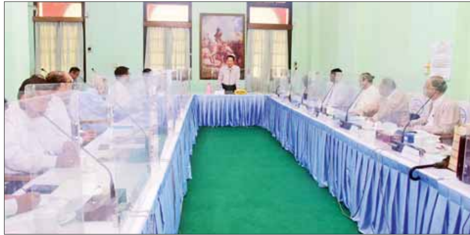
ပြန်ကြားရေးဝန်ကြီးဌာန ပြည်ထောင်စုဝန်ကြီး ဦးမောင်မောင်အုန်း အမျိုးသားစာပေဆု စိစစ်ရွေးချယ်ရေးကော်မတီနှင့် စာပေဗိမာန်စာမူဆု ရွေးချယ်ရေးအဖွဲ့တို့မှ စာပေပညာရှင်များနှင့် တွေ့ဆုံဆွေးနွေးပွဲတွင် အမှာစကားပြောကြားစဉ်။

တေးအော်ပရာဖြင့်လည်းကောင်း၊ မြန်မာနိုင်ငံ ရုပ်ရှင်အစည်းအရုံးမှ မီးနီနှင့် ရဲရင့်အောင်တို့က တေးသံသာကဏ္ဍဖြင့် လည်းကောင်း၊ ကိုမြင့် (သမန်းကျား) အဖွဲ့က တေးသံရုပ်ဖော်ဖြေလည်းကောင်း၊ မီးခွက်စောင့်ကျွန်း၊ ပြဇာတ်တွင် ဝေခါ၊ ရဲလေးမနှင့်အဖွဲ့၊ ချစ်စု၊ မိုးသူခနှင့် ဝေယံဟိန်းတို့ကလည်းကောင်း၊ တေးသံသာဖျော်ဖြေမှုတွင် နီနီခင်စော်နှင့် နေမင်းအိမ်တို့ကလည်းကောင်း ဖျော်ဖြေကြပြီး ယနေ့ရန်ပုံငွေဖျော်ဖြေပွဲကြီး၏ အပိတ်ဖျော်ဖြေမှုအဖြစ် ဒါရိုက်တာ ကျော်ဇောဟိန်း (အတွေးပုံရိပ်) ၏ “ကူညီပေးကြပါ” ပြဇာတ်အား ရုပ်ရှင်၊ ဂီတ၊ သဘင်တို့စုပေါင်းအားဖြင့် အားပါးတရ ဖျော်ဖြေတင်ဆက်ကြသည်။