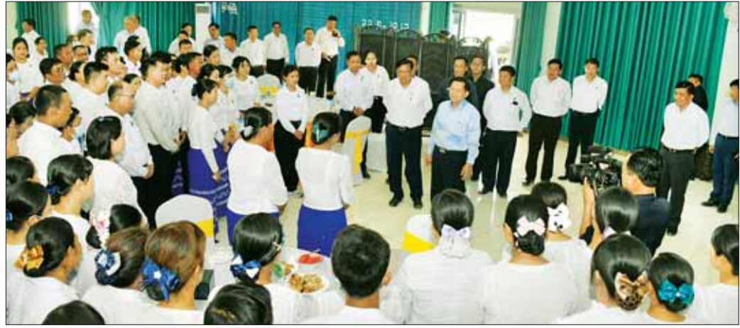
နိုင်ငံတော်စီမံအုပ်ချုပ်ရေးကောင်စီဥက္ကဋ္ဌ နိုင်ငံတော်ဝန်ကြီးချုပ် ဗိုလ်ချုပ်မှူးကြီး မင်းအောင်လှိုင် အမှတ် (၁) သံမဏိစက်ရုံ(မြင်းခြံ)ရှိ ဝန်ထမ်းများအား အားပေးစကားပြောကြားကာ ရင်းရင်းနှီးနှီး နှုတ်ဆက်စဉ်။

ဝန်ကြီးချုပ် လာရောက်စစ်ဆေးစဉ် စက်ရုံစီမံကိန်း များအား စနစ်တကျဖြင့် အပိုင်းလိုက် တည်ဆောက်၍ မှန်မှန်ကန်ကန်ဖြင့် မြန်မြန်ဆန်ဆန်ပြီးစီးစေရေး စနစ်တကျ ကြပ်မတ်ဆောင်ရွက်သွားရန်လိုကြောင်း ဖြင့် မှာကြားခဲ့ပြီး စီမံကိန်းလုပ်ငန်းများကို အကောင် အထည်ဖော်ဆောင်ရွက်လျက်ရှိရာ လက်ရှိအချိန်တွင် သံရည်ကျိုအလုပ်ရုံ၊ Phase-1 (Melt Shop-1) ဆောင်ရွက်ပြီးစီးပြီဖြစ်ပြီး Phase-1 အပြည့်အဝ လုပ်ငန်းလည်ပတ်ချိန်တွင် Phase-2 (Melt Shop-2) အား လုပ်ငန်းလည်ပတ်နိုင်ရေး ဆက်လက် ဆောင်ရွက်သွားမည်ဖြစ်ကြောင်းနှင့် စီမံကိန်းတစ်ခု လုံး အပြည့်အဝလည်ပတ်နိုင်ရေး အဆင့်လိုက် ဆက်လက်အကောင်အထည်ဖော်ဆောင်ရွက်သွား မည်ဖြစ်ကြောင်း၊ မြန်မာနိုင်ငံအတွက် သံနှင့်သံမဏိ လုပ်ငန်း ပြန်လည်နိုးကြားလာစေရေးနှင့် မြန်မာ့ စက်မှုလုပ်ငန်း ယခုထက်ပိုမိုတိုးတက်လာစေရေး အမှတ်(၁) သံမဏိစက်ရုံ(မြင်းခြံ)မှ အဓိက အင်အားစု တစ်ခုအဖြစ် အားဖြည့်လျက်ရှိကြောင်း သတင်းရရှိ သည်။ သတင်းစဉ်