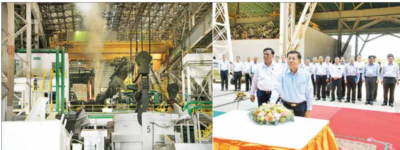
နိုင်ငံတော်စီမံအုပ်ချုပ်ရေးကောင်စီဥက္ကဋ္ဌ နိုင်ငံတော်ဝန်ကြီးချုပ် ဗိုလ်ချုပ်မှူးကြီး မင်းအောင်လှိုင် အမှတ် (၁) သံမဏိစက်ရုံ (မြင်းခြံ)၊ Melt Shop-1 ပြန်လည်စတင်ခြင်း ဖွင့်ပွဲအထိမ်းအမှတ်အဖြစ် Melt Shop-1 သံရည်ကျိုခြင်းနှင့် လေးထောင့်သံမဏိတုံး Billet ထုတ်လုပ်ခြင်းလုပ်ငန်းအား စက်ခလုတ်နှိပ် ဖွင့်လှစ်ပေးစဉ်။