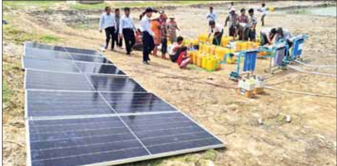
သတင်းစဉ်