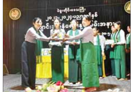
မေ ၃၀ ရက် နံနက်က ပဲခူးမြို့ အ.ထ.က(၁) သီရိပညာခန်းမ၌ ကျောင်းအပ်နှံရေးအခမ်းအနားတွင် ကျောင်းအုပ်ဆရာမကြီးက ကျောင်းသူ ကျောင်းသားများအား ကျောင်းဝတ်စုံ၊ ကျောင်းသုံးပုံနှိပ်နှင့် စာရေးကိရိယာများအား ပေးအပ်စဉ်။ ကိုတွတ်(ပြန်/ဆက်)

ဘုံပိုင်ခေါင်းမှ ရေစက်ကျမနေစေရန် ကျပ်အောင်ပိတ်ပါ။ ဘုံပိုင်ခေါင်းကို မသုံးဘဲ ဖွင့်ထားခြင်းမပြုပါနှင့်။