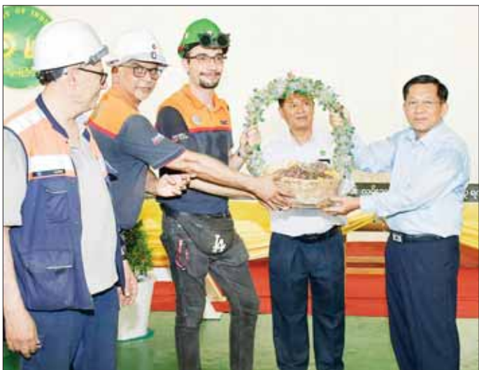
နိုင်ငံတော်စီမံအုပ်ချုပ်ရေးကောင်စီဥက္ကဋ္ဌ နိုင်ငံတော်ဝန်ကြီးချုပ် ဗိုလ်ချုပ်မှူးကြီး မင်းအောင်လှိုင် စက်ရုံတွင် တာဝန်ထမ်းဆောင်လျက်ရှိသည့် ပြည်ပ ပညာရှင်များအား သစ်သီးခြင်း ပေးအပ်စဉ်။

မတ်လ ၁၅ ရက်မှစ၍ စီမံကိန်းရပ်ဆိုင်းခဲ့ရစဉ် ရင်းနှီးမြှုပ်နှံမှုအနေဖြင့် ကျပ်သန်းပေါင်း ၄၀၂၉၃၂ ဒသမ ၈၅၂ သန်းရှိပြီဖြစ်ပြီး စီမံကိန်းပြီးစီးမှု ရာခိုင်နှုန်းအနေဖြင့် ၆၆ ဒသမ ၅၂ ရာခိုင်နှုန်း ရှိပြီ ဖြစ်ကြောင်း၊ ထိုသို့ စီမံကိန်းရပ်တန့်ခဲ့ရမှုကြောင့် နိုင်ငံတော်၏ ဘဏ္ဍာငွေများစွာ ထိခိုက်ဆုံးရှုံးခဲ့ရပြီး စီမံကိန်းချေးငွေများကိုလည်း နိုင်ငံတော်အနေဖြင့် ဆက်လက်ပေးဆပ်ခဲ့ကြောင်း၊ သံမဏိထုတ်လုပ်မှု လုပ်ငန်းသည် နိုင်ငံအတွက် အရေးကြီးလိုအပ်ချက် ပင်ဖြစ်ပြီး သံနှင့်သံမဏိထုတ်လုပ်ရေးစီမံကိန်းများ အောင်မြင်ပြီးစီးပါက ပြည်ပမှ သံနှင့်သံမဏိတင်သွင်း နေရမှုများကို လျော့ချနိုင်မည်ဖြစ်ပြီး ပြည်ပဈေးနှုန်း ထက် သက်သာစွာဖြင့် အသုံးပြုနိုင်မည်ဖြစ်သော ကြောင့် နိုင်ငံတော်စီမံအုပ်ချုပ်ရေးကောင်စီအစိုးရ တာဝန်ယူသည့်အချိန်တွင် ၂၀၂၁ ခုနှစ် ဩဂုတ်လတွင် ကျင်းပပြုလုပ်သည့် အစိုးရအဖွဲ့အစည်းအဝေး အမှတ်စဉ် (၁/ ၂၀၂၁) အစည်းအဝေးဆုံးဖြတ်ချက်အရ သံမဏိစက်ရုံစီမံကိန်းများကို ပြန်လည်စီမံစဉ် လုပ်ငန်းများ ပြန်လည်စတင်လည်ပတ်နိုင်ရေး ဆောင်ရွက်ခဲ့ကြောင်း၊ အမှတ် (၁) သံမဏိစက်ရုံ (မြင်းခြံ)သို့ ၂၀၂၂ ခုနှစ် ဇန်နဝါရီလ ၂၄ ရက်၌ နိုင်ငံတော်စီမံအုပ်ချုပ်ရေးကောင်စီဥက္ကဋ္ဌ နိုင်ငံတော်