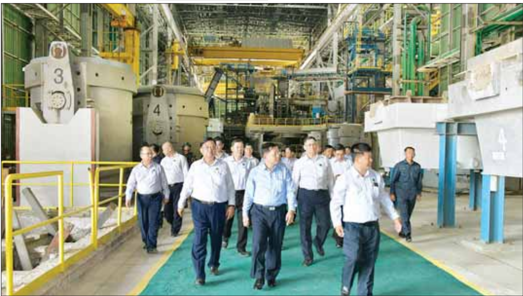
နိုင်ငံတော်စီမံအုပ်ချုပ်ရေးကောင်စီဥက္ကဋ္ဌ နိုင်ငံတော်ဝန်ကြီးချုပ် ဗိုလ်ချုပ်မှူးကြီး မင်းအောင်လှိုင်နှင့်အဖွဲ့ဝင်များ သံမဏိစက်ရုံအတွင်း ကြည့်ရှုစစ်ဆေးစဉ်။

အနေဖြင့် လက်ရှိအချိန်တွင် သံရည်ကျိုအလုပ်ရုံ Melt Shop-1 ဆောင်ရွက်ပြီးစီးပြီဖြစ်ပြီး စီမံကိန်းတစ်ခုလုံး အပြည့်အဝလည်ပတ်နိုင်ရေး အဆင့်လိုက် ဆက်လက်အကောင်အထည်ဖော်ဆောင်ရွက်သွားရန်လိုကြောင်း၊ မိမိတို့နိုင်ငံ၏ သံနှင့်သံမဏိလိုအပ်ချက်ကို ယခုစက်ရုံနှင့် ပင်းပက်စက်ရုံတို့မှ ဖြည့်ဆည်းပေးနိုင်မည်ဖြစ်သဖြင့် အောင်မြင်အောင် ဆောင်ရွက်ရန်လိုကြောင်း၊ သံမဏိထုတ်လုပ်ရေးလုပ်ငန်းအတွက် လိုအပ်သည့် လူသားအရင်းအမြစ်ကောင်းများရရှိရေးအတွက်လည်း ဆောင်ရွက်သွားရန်နှင့် မွေးထုတ်သွားရန်လိုကြောင်း၊ ဝန်ထမ်းများ၏ နေထိုင်စားသောက်မှု အဆင်ပြေစေရေးအတွက်လည်း စီမံဆောင်ရွက်ပေးရန်လိုကြောင်း၊ နောင်အနာဂတ်တွင် စက်ရုံသို့ ပို့ဆောင်မည့်ကုန်ကြမ်းများ၊ စက်ရုံမှထွက်ရှိလာသည့် သံနှင့် သံမဏိပစ္စည်းများကို လျှပ်စစ်ရထားအသုံးပြု၍ သယ်ယူပို့ဆောင်ဖြန့်ဖြူးနိုင်ရေးအတွက်လည်း ရေရှည်ကိုမျှော်တွေး၍