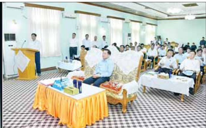
နိုင်ငံတော်စီမံအုပ်ချုပ်ရေးကောင်စီဥက္ကဋ္ဌ နိုင်ငံတော်ဝန်ကြီးချုပ် ဗိုလ်ချုပ်မှူးကြီး မင်းအောင်လှိုင်နှင့် အဖွဲ့ဝင်များအား ပြည်ထောင်စုဝန်ကြီး ဒေါက်တာချာလီသန်းက ရှင်းလင်းတင်ပြစဉ်။