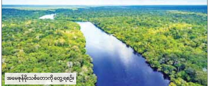
အမေဇွန်ဒေသတိုက်တွင် တွေ့ရစဉ်။

အစ္စဒဘာဘာ မေ ၂၇ ဆူဒန်နိုင်ငံ လက်နက်ကိုင်ပဋိပက္ခအတွင်းမှ အိသီယိုးပီးယားနိုင်ငံ သို့ ထွက်ပြေးလာသူအရေအတွက်မှာ ၃၀၀၀ ကျော်ရှိကြောင်း ရွှေ့ပြောင်းနေထိုင်ခြင်းဆိုင်ရာ နိုင်ငံတကာအဖွဲ့အစည်း (အိုင်အိုအမ်) ကပြောသည်။ ကုလသမဂ္ဂ ရွှေ့ပြောင်းနေထိုင်ရေးအေဂျင်စီ၏ မေ ၂၆ ရက်က ထုတ်ပြန်သည့် နောက်ဆုံးအစီရင်ခံစာတွင် ဆူဒန်နိုင်ငံ၌ လက်နက်ကိုင် ပဋိပက္ခဖြစ်ပွားမှုက လူပေါင်းသိန်းနှင့်ချီ၍ အိမ်နီးချင်းနိုင်ငံများသို့ ထွက်ပြေးတိမ်းရှောင်မှုကို ဖြစ်ပေါ်စေသည်ဟု ဖော်ပြထားသည်။ ဧပြီ ၂၀ ရက် နောက်ပိုင်း အန်ဟာရာ၊ ဘင်းနစ်ရှန်ပူးလ် ဖွမ်းဖိနှင့် ဂမ်ဘရီလာဒေသများရှိ နယ်စပ်ဖြတ်ကျော်ဂိတ်များမှတစ်ဆင့် အိသီယိုး ပီးယားနိုင်ငံသို့ ရောက်ရှိလာသူအရေအတွက်သည် ၃၀၀၀ ကျော် ရှိကြောင်း အိုင်အိုအမ်က ပြောသည်။ ဆူဒန်ဆရာဝန်များ သမဂ္ဂအဖွဲ့၏ ထုတ်ပြန်ချက်အရ တိုက်ပွဲဖြစ်ပွားချိန်မှစ၍ အရပ်သားသေဆုံးမှု အရေ အတွက်သည် ၈၆၃ ဦးအထိ မြင့်တက်လာပြီး ထိခိုက်ဒဏ်ရာရရှိသူများ မှာလည်း ၃၅၃၀ ဦးအထိ ရှိလာကြောင်း သိရသည်။ ပဋိပက္ခစတင်ဖြစ်ပွားချိန် ဧပြီ ၁၅ ရက်နောက်ပိုင်း ဆူဒန်နိုင်ငံ အတွင်းနှင့် နိုင်ငံပြင်ပ ဘေးကင်းလုံခြုံသောနေရာများသို့ အိုးအိမ် စွန့်ခွာသူ တစ်သန်းကျော်ရှိကြောင်း ကုလသမဂ္ဂလူသားချင်း စာနာ ထောက်ထားမှုဆိုင်ရာ ညှိနှိုင်းရေးရုံး၏ မကြာသေးမီက ပြောကြားချက် အရ သိရသည်။ ဆင်ပွာ