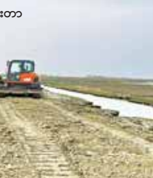
ငမန်းရဲကျွန်း ရေငန်တာတာ ပြုပြင်ဆောင်ရွက်စဉ်။