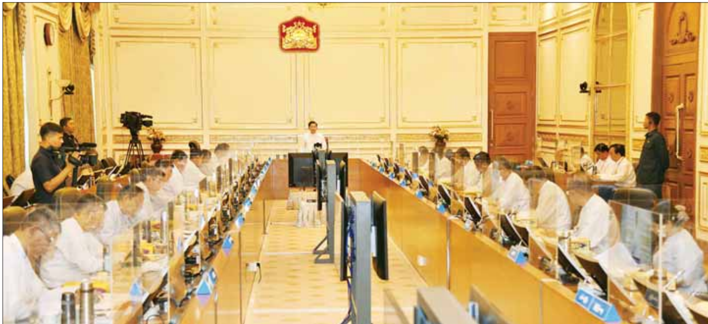
နိုင်ငံတော်စီမံအုပ်ချုပ်ရေးကောင်စီဥက္ကဋ္ဌ နိုင်ငံတော်ဝန်ကြီးချုပ် ဗိုလ်ချုပ်မှူးကြီး မင်းအောင်လှိုင် အသေးစား၊ အငယ်စားနှင့် အလတ်စားစီးပွားရေးလုပ်ငန်းများ ဖွံ့ဖြိုးတိုးတက်ရေး ဗဟိုကော်မတီအစည်းအဝေး အမှတ်စဉ်(၁/၂၀၂၃) တွင် အမှာစကားပြောကြားစဉ်။