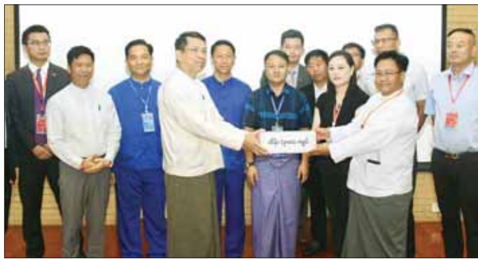
မိုခါဆိုင်ကလုန်းမုန့်တိုင်းဒဏ်သင့် ဒေသများအတွက် အလှူငွေကျပ်သိန်း ၃၀၀ ပေးအပ်လှူဒါန်းစဉ်။

နေပြည်တော် မေ ၂၇ မြန်မာအပြည်ပြည်ဆိုင်ရာ ကုန်စည်ရင်းစီးပွားဌာန(၂) တွင် မေ ၂၅ ရက်မှ ၂၈ ရက် အထိ ကျင်းပလျက်ရှိသည့် မြန်မာ(နေပြည်တော်) - တရုတ်(လင်ချန်း) စီးပွားရေးကုန်စည်ပြပွဲတွင် ပါဝင်ခင်းကျင်းပြသကြသည့် မြန်မာနိုင်ငံနှင့် တရုတ်နိုင်ငံမှ ကုန်သည်လုပ်ငန်းရှင်များနှင့် အသင်းအဖွဲ့များက မိုခါဆိုင်ကလုန်းမုန့်တိုင်းဒဏ်သင့် ဒေသများအတွက် အလှူငွေပေးအပ်ပွဲအခမ်းအနားကို ယနေ့နံနက် ၁၀ နာရီခွဲတွင် အဆိုပါဗဟိုဌာန၌ ကျင်းပသည်။ အလှူငွေများလှူဒါန်း အလှူငွေပေးအပ်ပွဲတွင် ကုန်စည်ပြပွဲ၌ ပါဝင်ပြသကြသည့် မြန်မာ-တရုတ် ကုန်သည်လုပ်ငန်းရှင်များကစုပေါင်း၍ မိုခါဆိုင်ကလုန်းမုန့်တိုင်းဒဏ်သင့် ဒေသများအတွက် အလှူငွေကျပ်သိန်း ၃၀၀ ကို