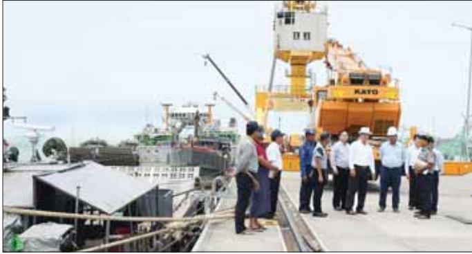
နိုင်ငံတော်စီမံအုပ်ချုပ်ရေးကောင်စီအဖွဲ့ဝင် ဒုတိယဝန်ကြီးချုပ်နှင့် ပြည်ထောင်စုဝန်ကြီး ဗိုလ်ချုပ်ကြီး တင်အောင်စန်း စစ်တွေမြို့ ဘက်စုံသုံးဆိပ်ကမ်းအား ကြည့်ရှုစစ်ဆေးစဉ်။

ဖြင့်သာ ဝန်ဆောင်မှုပေးခဲ့ရာမှ မြေပေါ်မြေအောက် ဖိုင်ဘာကောဘယ်လ်များ ပြုပြင်ခြင်း၊ အချို့သော မိုက်ခရိုဝေ့ဖ် ဆက်ကြောင်းများကို ဖိုင်ဘာဆက်ကြောင်းများဖြင့် ပြောင်းလဲချိတ်ဆက်ခြင်းနှင့် မိုဘိုင်းစခန်း ပြုပြင်ခြင်းများ ဆောင်ရွက်ခဲ့ရာ မေ ၂၇ ရက်အထိ မိုဘိုင်းစခန်း စုစုပေါင်း ၇၆၈ စခန်း ပြန်လည်ပြုပြင်နိုင်ခဲ့သဖြင့် စုစုပေါင်း မိုဘိုင်းစခန်း ၁၀၉၇ စခန်း ရာခိုင်နှုန်းအားဖြင့် ၈၈