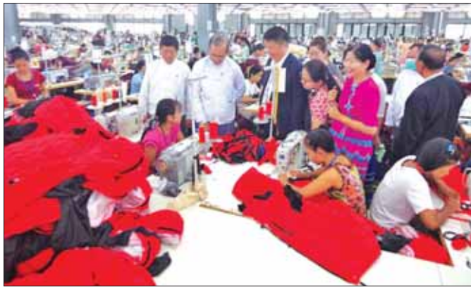
ဒုတိယဝန်ကြီးဦးဝင်းရှိန်နှင့် အဖွဲ့ဝင်များ အထည်ချုပ်စက်ရုံအတွင်း လှည့်လည်ကြည့်ရှုစစ်ဆေးစဉ်။

ရန်ကုန် မေ ၂၇ အလုပ်သမားဝန်ကြီးဌာန ဒုတိယဝန်ကြီး ဦးဝင်းရှိန်သည် အလုပ်သမားညွှန်ကြားရေးဦးစီးဌာန ဒုတိယ ညွှန်ကြားရေးမှူးချုပ် ရန်ကုန်တိုင်းဒေသကြီး အတွင်းရှိ အလုပ်သမားရေးရာဌာနများမှ တာဝန်ရှိသူများနှင့်အတူ ယမန်နေ့နံနက်ပိုင်းက လှိုင်သာယာ မြို့နယ်ရှိ Dishang Group အထည်ချုပ်စက်ရုံနှင့် Delicious Food Co.,Ltd (One Tea) နို့ဆီစက်ရုံသို့ သွားရောက်ကြည့်ရှုအားပေးသည်။