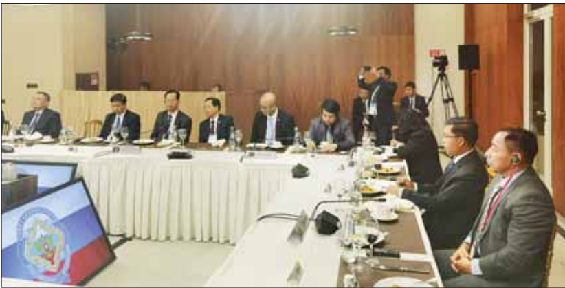
နိုင်ငံတော်စီမံအုပ်ချုပ်ရေးကောင်စီအဖွဲ့ဝင် ပြည်ထောင်စုဝန်ကြီး၊ အမျိုးသားလုံခြုံရေးဆိုင်ရာ အကြံပေးပုဂ္ဂိုလ် ဒုတိယဗိုလ်ချုပ်ကြီး ရာပြည့် တတိယအကြိမ် အာဆီယံ-ရှုရှား လုံခြုံရေးဆိုင်ရာ အဆင့်မြင့်အရာရှိကြီးများ ဆွေးနွေးပွဲ Working Dinner သို့ တက်ရောက်စဉ်။

ရှုရှားဖက်ဒရေရှင်းနိုင်ငံ မော်စကိုမြို့၌ မေ ၂၃ ရက်မှ ၂၅ ရက်အထိ ကျင်းပပြုလုပ်သည့် (၁၁) ကြိမ်မြောက် လုံခြုံရေးကိစ္စရပ်များဆိုင်ရာ အဆင့်မြင့်အရာရှိကြီးများ အစည်းအဝေးသို့ နိုင်ငံတော်စီမံအုပ်ချုပ်ရေးကောင်စီအဖွဲ့ဝင် ပြည်ထောင်စုဝန်ကြီး၊ အမျိုးသားလုံခြုံရေးဆိုင်ရာ အကြံပေးပုဂ္ဂိုလ် ဒုတိယ ဗိုလ်ချုပ်ကြီး ရာပြည့် ဦးဆောင်သော ကိုယ်စားလှယ်အဖွဲ့ တက်ရောက်ခဲ့ပြီး မေ ၂၆ ရက် ဒေသစံတော်ချိန် (၀၈:၁၅) နာရီတွင် ရှုရှားဖက်ဒရေရှင်းနိုင်ငံ မော်စကိုမြို့လေဆိပ်မှ ထွက်ခွာလာခဲ့ရာ မေ ၂၇ ရက် မြန်မာစံတော်ချိန် (၁၁:၃၀) နာရီတွင် ရန်ကုန် အပြည်ပြည်ဆိုင်ရာ လေဆိပ်သို့ ပြန်လည်ရောက်ရှိခဲ့ပြီး ပြည်ထောင်စု