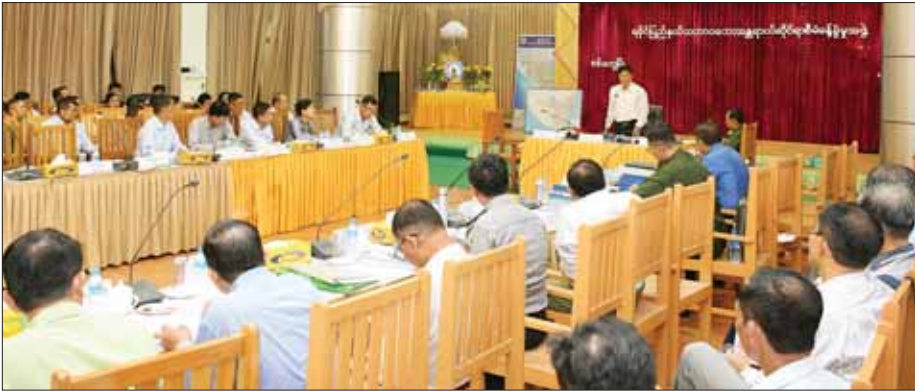
ရခိုင်ပြည်နယ်အစိုးရအဖွဲ့ရုံး၌ သဘာဝဘေးပြန်လည်ထူထောင်ရေးဆိုင်ရာ လုပ်ငန်းညှိနှိုင်းအစည်းအဝေးကျင်းပစဉ်။

စစ်တွေ မေ ၂၇ နိုင်ငံတော် စီမံအုပ်ချုပ်ရေးကောင်စီအဖွဲ့ဝင် ဒုတိယဝန်ကြီးချုပ်နှင့် ပြည်ထောင်စုဝန်ကြီး ဗိုလ်ချုပ်ကြီး တင်အောင်စန်းသည် ယနေ့နံနက်ပိုင်းတွင် စစ်တွေမြို့ ကမ်းနားလမ်း တစ်လျှောက် မုန့်တိုင်းဒဏ်ကြောင့် ထိခိုက်ပျက်စီးခဲ့မှုများ ပြုပြင်ပြီးစီးမှုနှင့် သန့်ရှင်းရေး ဆောင်ရွက်ပြီးစီးမှု အခြေအနေများကို ကြည့်ရှုစစ်ဆေးပြီး စစ်တွေစာတိုက်ကြီးသို့ ဆောက်လုပ်မှု မုန့်တိုင်းဒဏ်ကြောင့် စာတိုက်အဆောက်အအုံ ပျက်စီးထိခိုက်မှုနှင့် ပြန်လည်ပြုပြင်ရန် စီမံဆောင်ရွက်နေမှု ပြန်လည်ထူထောင်ရေးဆိုင်ရာ လုပ်ငန်းညှိနှိုင်း အစည်းအဝေးသို့ တက်ရောက်ကြသည်။ အစည်းအဝေးတွင် လုပ်ငန်းကော်မတီအဖွဲ့ဝင် တာဝန်ရှိသူများက ကူညီထောက်ပံ့ရေးနှင့် ပြန်လည်ထူထောင်ရေး လုပ်ငန်းများ ဆောင်ရွက်ပြီးစီးမှုနှင့် ဆက်လက် ဆောင်ရွက်သွားမည့် အစီအမံများ၊ လုပ်ငန်းတိုးတက်မှု အခြေအနေများနှင့် လိုအပ်ချက်များကို ရှင်းလင်းတင်ပြကြသည်။ ထို့နောက် ဗိုလ်ချုပ်ကြီး တင်အောင်စန်းက ပြန်လည်ထူထောင်ရေးလုပ်ငန်းများ မြန်မြန်ဆန်ဆန် အကောင်အထည်ဖော်