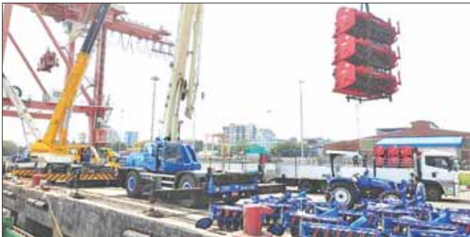
ထွန်စက်များနှင့် ထွန်ထယ်ကိရိယာများကို ရန်ကုန်မြို့၊ ဝိုင်အောင်ကျော်ဆိပ်ကမ်း၌ ရေယာဉ်ပေါ်တင်နေစဉ်။

နေပြည်တော် မေ ၂၇ အလွန်အလွန်အားကောင်းသော ဆိုင်ကလုန်း မုန်တိုင်း မိုခါကြောင့် ထိခိုက်ပျက်စီးခဲ့သည့် ရခိုင်ပြည်နယ်အတွင်းရှိ တောင်သူလယ်သမားများ၏ အသက်မွေးဝမ်းကျောင်းများ ပြန်လည်ထူထောင်ရေး လုပ်ငန်းဖြစ်သည့် မိုးစပါးများအချိန်မီစိုက်ပျိုးနိုင်ရေးအတွက် မြေပြုပြင်ခြင်းလုပ်ငန်းတွင် ပံ့ပိုးကူညီနိုင်ရန် စိုက်ပျိုးရေး၊ မွေးမြူရေးနှင့် ဆည်မြောင်းဝန်ကြီးဌာန စက်မှုလယ်ယာဦးစီးဌာနက မြင်းကောင်ရေးအား ၅၀ ရှိ နယူးဟော်လန်ထွန်စက် ၃၃ စီး၊ မြောက်သွားထယ် ၃၃ လက်၊ ဓားစက်ထွန် ၃၃ လက်တို့ကို ရေယာဉ်ဖြင့် ရခိုင်ပြည်နယ်သို့ ပေးပို့လျက်ရှိကြောင်း သိရသည်။