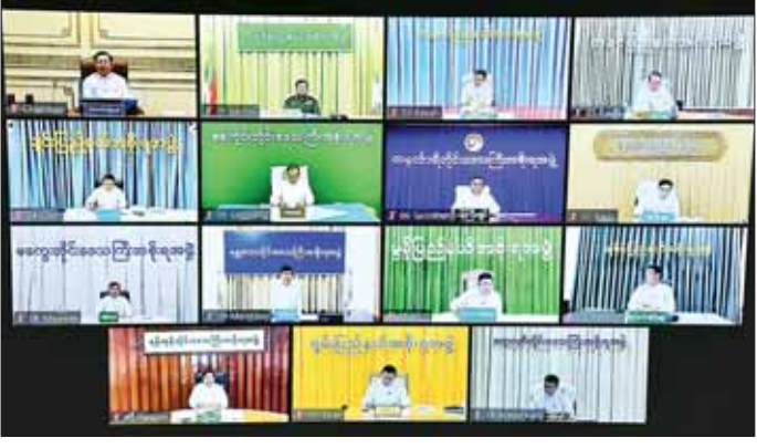
တိုင်းဒေသကြီးနှင့် ပြည်နယ်အစိုးရအဖွဲ့များမှ ဝန်ကြီးချုပ်များက Video Conferencing ဖြင့် တက်ရောက်ကြစဉ်။

စနစ်ကောင်းမွန်ရေး၊ ပြည်သူ့ပို့ဆောင်ရေးစနစ်ဖြစ်သည့် ကုန်လမ်းပို့ဆောင်ရေးစနစ်တွင် အဓိကကျသည့် မီးရထားနှင့် ရေကြောင်းပို့ဆောင်ရေးတွင် အဓိကကျသည့်သင်္ဘောများ လုံခြုံချောမွေ့စွာဖြင့် ကျယ်ကျယ်ပြန့်ပြန့် ပြေးဆွဲနိုင်ရေးနှင့် မီးရထားနှင့် သင်္ဘောများကြိုခိုင်ကောင်းမွန်မှုရှိအောင် ဆောင်ရွက်ရေး၊ ပြည်သူများအား သတင်းအချက်အလက်ဖြန့်ဝေပေးရာတွင်လွယ်ကူစွာဖြင့် အများနားလည်သိရှိနိုင်အောင်ရေးသားဖြန့်ဝေရေး၊ နိုင်ငံစီးပွားရေးတိုးတက်ရန် ပြည်တွင်းကုန်ထုတ်လုပ်မှုကို အားပေးမြှင့်တင်ရေး စသည့်အချက်များနှင့်ပတ်သက်၍ ဆက်စပ်ဝန်ကြီးဌာနများ၊ သက်ဆိုင်ရာတိုင်းဒေသကြီးနှင့် ပြည်နယ်အစိုးရများနှင့် မိတ်ဖက်အဖွဲ့အစည်းများ ပေါင်းစပ်ညှိနှိုင်းပြီး ပိုင်းဝန်းကြိုးပမ်းအကောင်အထည်ဖော်ဆောင်ရွက်ကြရန် မှာကြားသည်။