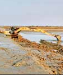
ပေးနိုင်ရန်အတွက် ဆောင်ရွက်ရမည့်လုပ်ငန်းပမာဏမှာ မြေကျင်းစုစုပေါင်း ၃၂၉၃၃ ကျင်းရှိသည့်အတွက် စက်ယန္တရားများ လုပ်ငန်းခွင်များသို့ အချိန်မီ ရောက်ရှိအောင် စီမံဆောင်ရွက်ခဲ့ပြီး ပြန်လည်ပြုပြင်ခြင်းလုပ်ငန်းများကို မေ ၂၁ ရက်မှစ၍ အကောင်အထည်ဖော် ဆောင်ရွက်

ရေငန်တာတာ သုံးခုကို မိုးမကျမီ ပြီးစီးအောင် ပြုပြင်ပေးခြင်းအားဖြင့် စုစုပေါင်းရေဘေးကာကွယ်ရေယာ ၁၄၂၅၅ ဧကအတွင်း ဒေသခံတောင်သူများ၏ မိုးစပါးများအပြည့်အဝ စိုက်ပျိုးနိုင်အောင် ကူညီဆောင်ရွက်ပေးနိုင်မည်ဖြစ်ကြောင်း သတင်းရရှိသည်။