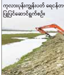
ကုလားပုန်းကျွန်းပတ် ရေငန်တာတာ ပြုပြင်ဆောင်ရွက်စဉ်။

ခဲ့သည်။ မေ ၂၇ ရက်အထိ မြေကျင်းပေါင်း ၁၀၃၅၅ ကျင်းခန့် ပြီးစီးပြီဖြစ်၍ ရာခိုင်နှုန်းအားဖြင့် ၃၁၁၁၄၇ ရာခိုင်နှုန်း ပြီးစီးပြီဖြစ်ပြီး လုပ်ငန်းအားလုံးကို ဇွန် ၃ ရက်တွင် ရာနှုန်းပြည့် ပြီးစီးအောင် ကြိုးပမ်းဆောင်ရွက်လျက်ရှိသည်။ ထိခိုက်ပျက်စီးသွားသော