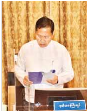
နိုင်ငံတော်စီမံအုပ်ချုပ်ရေးကောင်စီ ဒုတိယဥက္ကဋ္ဌ ဒုတိယဝန်ကြီးချုပ် ဒုတိယဗိုလ်ချုပ်မှူးကြီး စိုးဝင်း ရှင်းလင်းတင်ပြစဉ်။

မိမိအနေဖြင့်ဒေသများသို့ သွားရောက်ဆွေးနွေးစဉ် မြေနေရာရရှိရေးနှင့်ပတ်သက်ပြီး တင်ပြချက်များကို တွေ့ရှိရကြောင်း၊ မြေနေရာအတွက် ဒေသတွင်း ဝမ်းစာပူလုံရေးအတွက် လယ်ယာမြေကို အခြားနည်းနှင့်အသုံးမပြုရန် ညွှန်ကြားထားပြီး ကျန်သည့်နေရာများတွင် သက်ဆိုင်ရာဒေသဆိုင်ရာအုပ်ချုပ်ရေးအာဏာပိုင်များက တင်ပြဆောင်ရွက်မည်ဆိုပါက ခွင့်မပြုပေးနိုင်စရာအကြောင်း မရှိပါကြောင်း၊ မွေးမြူ