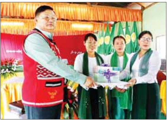
တိုင်း KG+9 ဖြီးဆုံးသည်အထိ အခြေခံပညာသင်ယူခွင့် ရရှိရေးအတွက် ပြည်ထောင်စုသမ္မတ မြန်မာနိုင်ငံတော် ဖွဲ့စည်းပုံအခြေခံဥပဒေ (၂၀၀၈ ခုနှစ်) ပုဒ်မ ၃၆၆ အရ နိုင်ငံသားတိုင်းသည် နိုင်ငံတော်ကချမှတ်ထားသော ပညာရေးဆိုင်ရာမူဝါဒများနှင့်အညီ အခြေခံပညာ

ဟိုပန့် မေ ၂၆ နိုင်ငံတော်စီမံအုပ်ချုပ်ရေးကောင်စီအဖွဲ့ဝင် ဦးရန်ကျော်သည် “ဝ” ကိုယ်ပိုင်အုပ်ချုပ်ခွင့်ရတိုင်း စီမံအုပ်ချုပ်ရေးအဖွဲ့ဝင် ဦးညီနုနှင့်အတူ ယနေ့နံနက် ၉ နာရီခွဲက “ဝ” ကိုယ်ပိုင်အုပ်ချုပ်ခွင့်ရတိုင်း ဟိုပန့်ခရိုင် ပန်လုံမြို့ အခြေခံပညာအထက်တန်းကျောင်းတွင် ပန်လုံမြို့ရှိ ဌာနဆိုင်ရာများ၊ ပညာရေးဌာနဝန်ထမ်းများ၊ မြို့မိမြို့မများ၊ ဒေသခံပြည်သူများနှင့် တွေ့ဆုံသည်။ တွေ့ဆုံပွဲတွင် နိုင်ငံတော်စီမံအုပ်ချုပ်ရေးကောင်စီအဖွဲ့ဝင်က နိုင်ငံတော်စီမံအုပ်ချုပ်ရေးကောင်စီ၏ လူမှုရေးဦးတည်ချက်တွင် “ခေတ်မီဖွံ့ဖြိုးတိုးတက်သော ဒီမိုကရေစီနိုင်ငံတော် တည်ဆောက်ရေးအတွက် လိုအပ်သည့် လူ့စွမ်းအားအရင်းအမြစ်များ မွေးထုတ်နိုင်ရန် ဘက်စုံပညာရေးကဏ္ဍ မြှင့်တင်ရေး” ဆိုသည့် အချက်ကို ထည့်သွင်းဖော်ပြထားပါကြောင်း၊ ပညာရေးဝန်ကြီးဌာနအနေဖြင့်လည်း နိုင်ငံသား