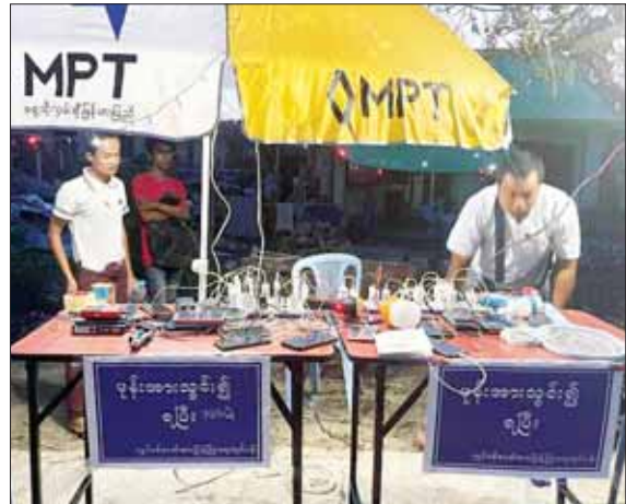
စစ်တွေမြို့အတွင်း အများပြည်သူများ အသုံးပြုနိုင်ရန်အတွက် ဖုန်းအားသွင်းစင်တာများ ဖွင့်လှစ်ပေးမှု။