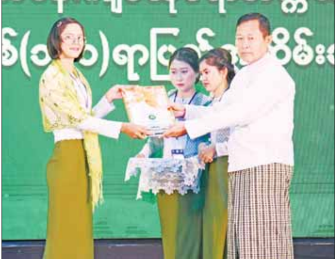
နိုင်ငံတော်စီမံအုပ်ချုပ်ရေးကောင်စီ ဒုတိယဥက္ကဋ္ဌ ဒုတိယဝန်ကြီးချုပ် ဒုတိယဗိုလ်ချုပ်မှူးကြီး စိုးဝင်း ဆုရရှိသူတစ်ဦးအား ဆုပေးအပ်ချီးမြှင့်စဉ်။

စာမျက်နှာ ၃ မှ အပူပိုင်းဒေသခြောက်သွေတော၊ မြောက်ပိုင်း တောင်ပေါ်ဒေသအအေးပိုင်းတောများ စသည့် သစ်တောမျိုးစုံ ပေါက်ရောက်နေသည့်ကိုလည်း တွေ့ရှိရမည်ဖြစ်ပါကြောင်း။