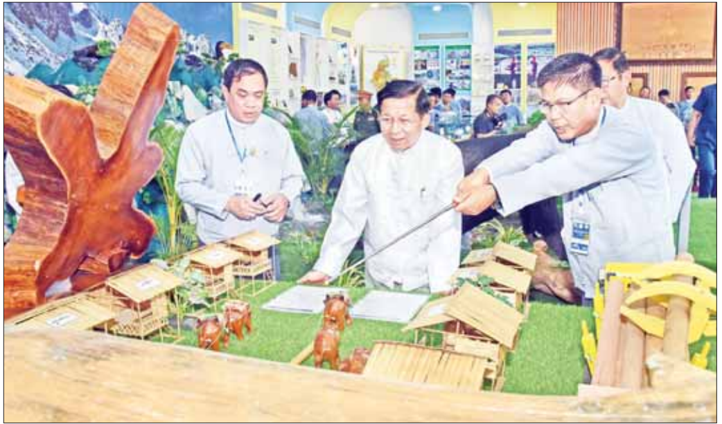
နိုင်ငံတော်စီမံအုပ်ချုပ်ရေးကောင်စီဥက္ကဋ္ဌ နိုင်ငံတော်ဝန်ကြီးချုပ် ဗိုလ်ချုပ်မှူးကြီး မင်းအောင်လှိုင် သယ်ဇာတနှင့်သဘာဝပတ်ဝန်းကျင်ထိန်းသိမ်းရေးဝန်ကြီး ဌာန၏ ပြခန်းများကို ကြည့်ရှုစဉ်။

သက်တမ်း နှစ် (၁၀၀) ပြည့်ခဲ့ပြီဖြစ်သည့် မြန်မာနိုင်ငံ၏ သစ်တောနှင့် ပတ်ဝန်းကျင်ဆိုင်ရာ တက္ကသိုလ်ကြီးမှ နိုင်ငံတော်၏စီးပွားရေး၊ လူမှုရေး နှင့် ပတ်ဝန်းကျင်ကာကွယ်ထိန်းသိမ်းရေးတို့တွင် သစ်တောများ၏အရေးပါမှုကိုသိရှိပြီး မိမိပညာရပ်ကို တန်ဖိုးထား၊ ဂုဏ်ယူတတ်သည့် ပညာတတ်မျိုးဆက် သစ်များ ဆက်လက်မွေးထုတ်ပေးနိုင်ပါစေ အရေးပါ