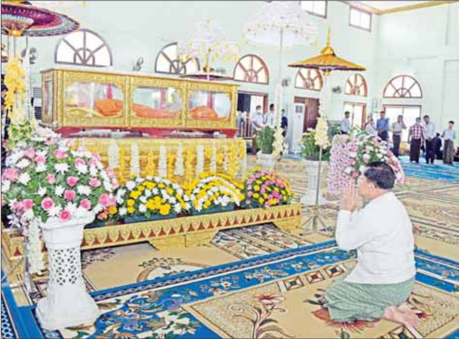
နိုင်ငံတော်စီမံအုပ်ချုပ်ရေးကောင်စီဥက္ကဋ္ဌ နိုင်ငံတော်ဝန်ကြီးချုပ် ဗိုလ်ချုပ်မှူးကြီး မင်းအောင်လှိုင် နိုင်ငံတော်သံဃမဟာနာယကအဖွဲ့ဥက္ကဋ္ဌ ဗန်းမော်ဆရာတော်ဘုရားကြီး၏ ဥတုဇရုပ်ကလာပ်တော်အား ဖူးမြော်ကြည်ညိုစဉ်။

ဖူးမြော်ကြည်ညို ဆရာတော်ဘုရားကြီး၏ ဥတုဇရုပ်ကလာပ်တော်အား ဗန်းမော်ကျောင်းတိုက်၌ ပူဇော်ထားလျက်ရှိရာ နိုင်ငံတော်စီမံအုပ်ချုပ်ရေးကောင်စီဥက္ကဋ္ဌ နိုင်ငံတော်ဝန်ကြီးချုပ် ဗိုလ်ချုပ်မှူးကြီး မင်းအောင်လှိုင်သည် ကောင်စီတွဲဖက်အတွင်းရေးမှူး ဒုတိယဗိုလ်ချုပ်ကြီး ရဲဝင်းဦး၊ သာသနာရေးနှင့် ယဉ်ကျေးမှုဝန်ကြီးဌာန ပြည်ထောင်စုဝန်ကြီး ဦးကိုကို၊ မန္တလေးတိုင်းဒေသကြီး ဝန်ကြီးချုပ် ဦးမျိုးအောင်၊ ကာကွယ်ရေးဦးစီးချုပ် (ခေ) ဗိုလ်ချုပ်ကြီး မိုးအောင်၊ ကာကွယ်ရေးဦးစီးချုပ် (လေ) ဗိုလ်ချုပ်ကြီး ထွန်းအောင်၊ ကာကွယ်ရေးဦးစီးချုပ်မှ တပ်မတော်အရာရှိကြီးများ၊ အလယ်ပိုင်းတိုင်းစစ်ဌာနချုပ် တိုင်းမှူးနှင့် တာဝန်ရှိသူများလိုက်ပါ၍ ယနေ့ မွန်းလွဲပိုင်းတွင် သွားရောက်ဖူးမြော်ကြည်ညိုသည်။