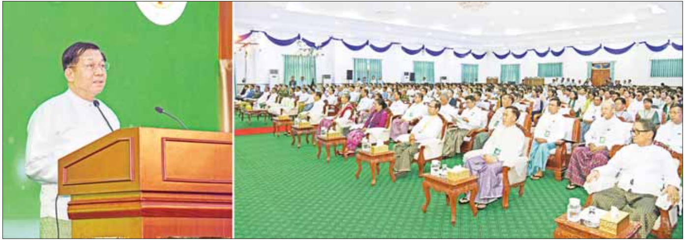
နိုင်ငံတော်စီမံအုပ်ချုပ်ရေးကောင်စီဥက္ကဋ္ဌ နိုင်ငံတော်ဝန်ကြီးချုပ် ဗိုလ်ချုပ်မှူးကြီး မင်းအောင်လှိုင် သစ်တောပညာ နှစ်(၁၀၀) ရာပြည့်အထိမ်းအမှတ် အခမ်းအနားတွင် အမှာစကားပြောကြားစဉ်။