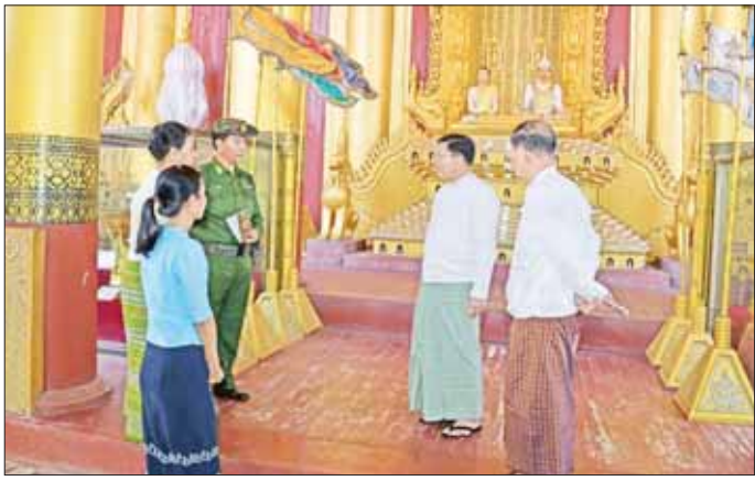
နိုင်ငံတော်စီမံအုပ်ချုပ်ရေးကောင်စီဥက္ကဋ္ဌ နိုင်ငံတော်ဝန်ကြီးချုပ် ဗိုလ်ချုပ်မှူးကြီး မင်းအောင်လှိုင်အား မြန်မာ့စံကော်ပိုရေးရှင်းတော်ကြီး အဝန်းအပိုင်းတစ်ခုလုံးကို ထိန်းသိမ်းထားရှိမှုများနှင့် ပတ်သက်၍ တာဝန် ရှိသူများက ရှင်းလင်းတင်ပြစဉ်။

ဥက္ကဋ္ဌ နိုင်ငံတော်ဝန်ကြီးချုပ်နှင့် အဖွဲ့ဝင်များသည် မှန်နန်းတော်ကြီး၊ ဗောင်းတော်ဆောင်၊ ညီလာခံ ကျင်းပရာ အဆောင်များ၊ မှန်နန်းဆောင်၊ အလယ် နန်းဆောင်တို့အပါအဝင် ရွှေနန်းတော်ကြီးအတွင်း လှည့်လည်ကြည့်ရှုကြရာ မြန်မာ့စံကော်ပိုရေးရှင်းတော်ကြီး အဝန်းအပိုင်းတစ်ခုလုံးကို ထိန်းသိမ်းထား ရှိမှုများနှင့် ပတ်သက်၍ သာသနာရေးနှင့် ယဉ်ကျေးမှု ဝန်ကြီးဌာန ပြည်ထောင်စုဝန်ကြီး ဦးကိုကို၊ သာသနာ ရေးဝန်ကြီးဌာန၊ ရှေးဟောင်းသုတေသနနှင့် အမျိုးသားပြတိုက်ဦးစီးဌာန၊ မန္တလေးဌာနခွဲ လက်ထောက်ညွှန်ကြားရေးမှူး ဒေါ်မျိုးမျိုးသောင်းနှင့် တာဝန်ရှိသူများက ရှင်းလင်းတင်ပြကြသည်။