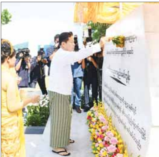
နိုင်ငံတော်စီမံအုပ်ချုပ်ရေးကောင်စီ ဒုတိယဥက္ကဋ္ဌ ဒုတိယဝန်ကြီးချုပ် ဒုတိယဗိုလ်ချုပ်မှူးကြီး ရဲဝင်း သစ်တောပညာ နှစ်(၁၀၀) ရာပြည့် အထိမ်းအမှတ် ကမ္ဘာ့သစ်တောပညာပေးစာတမ်းအစုအဝေးကို ဖွင့်လှစ်ပေးစဉ်။

ဥက္ကဋ္ဌ နိုင်ငံတော်ဝန်ကြီးချုပ်က သစ်တောပညာ နှစ် (၁၀၀) ရာပြည့်အထိမ်းအမှတ် အမှာစကား ပြောကြားရာတွင် လူသားများနှင့် သဘာဝပတ်ဝန်းကျင် ထိန်းသိမ်းရေးကို အကျိုးပြုနေသည့် သစ်တောသစ်ပင်များ ပြုစုထိန်းသိမ်း စောင့်ရှောက်ကာကွယ်ရေးတာဝန်သည် အထူးအရေးကြီးလှပါကြောင်း၊ ထိုသို့ အရေးကြီးသော သစ်တောဆိုင်ရာပညာရပ်များ