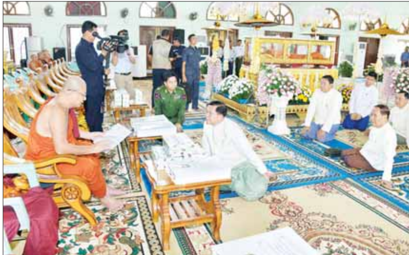
နိုင်ငံတော်စီမံအုပ်ချုပ်ရေးကောင်စီဥက္ကဋ္ဌ နိုင်ငံတော်ဝန်ကြီးချုပ် ဗိုလ်ချုပ်မှူးကြီး မင်းအောင်လှိုင် နိုင်ငံတော်ဩဝါဒါစရိယ မန္တလေးမြို့ မစိုးရိမ်တိုက်သစ် ပဓာနနာယကဆရာတော် အဂ္ဂမဟာပဏ္ဍိတ ဘဒ္ဒန္တဝါသေဋ္ဌာ တိဝံသအား ဗန်းမော်ဆရာတော် ဘုရားကြီး၏ အန္တိမအဂ္ဂိဈာပန ပူဇာသဘင်အခမ်းအနားကျင်းပမည့်အခြေအနေများကို လျှောက်ထားဆွေးနွေးစဉ်။

အကြိမ် ၂၀၁၀ ပြည့်နှစ်၊ မတ်လအထိ နိုင်ငံတော်ဗဟိုသံယာဝန်ဆောင်အဖြစ် လည်းကောင်း၊ ၂၀၁၀ ပြည့်နှစ်၊ မတ်လမှ ဇူလိုင်လအထိ နိုင်ငံတော်သံဃမဟာနာယကအဖွဲ့ အကျိုးတော်ဆောင်အဖြစ် လည်းကောင်း၊ ၂၀၁၀ ပြည့်နှစ်၊ ဇူလိုင်လမှ ယနေ့အထိ နိုင်ငံတော် သံဃမဟာနာယက အဖွဲ့ဥက္ကဋ္ဌနှင့် နိုင်ငံတော်ဗဟိုသံယာဝန်ဆောင်အဖွဲ့ ဥက္ကဋ္ဌအဖြစ်လည်းကောင်း၊ နိုင်ငံတော် ပရိယတ္တိ သာသနာတက္ကသိုလ်မှူး၏ အမိပတိအဖြစ်လည်းကောင်း သာသနာတဝန်များကို ဆောင်ရွက်တော်မူခဲ့ကြောင်း၊ ထိုကဲ့သို့ ဗုဒ္ဓသာသနာအကျိုးကို ထက်သန်သောဝီရိယဖြင့် သယ်ပိုး