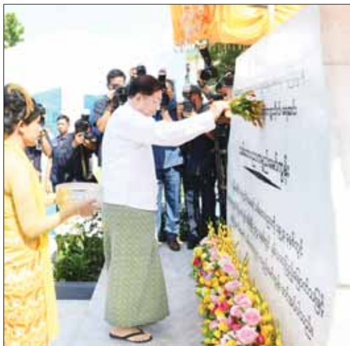
နိုင်ငံတော်စီမံအုပ်ချုပ်ရေးကောင်စီဥက္ကဋ္ဌ နိုင်ငံတော်ဝန်ကြီးချုပ် ဗိုလ်ချုပ်မှူးကြီး မင်းအောင်လှိုင် သစ်တောပညာ နှစ်(၁၀၀) ရာပြည့်အထိမ်းအမှတ် ကမ္ဘာ့သစ်တောပညာပေးစာတမ်းအစုအဝေးကို ဖွင့်လှစ်ပေးစဉ်။

ထို့နောက် နိုင်ငံတော်စီမံအုပ်ချုပ်ရေးကောင်စီ