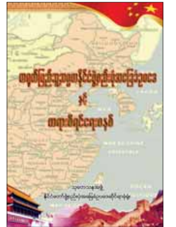
အနှုန်းများအဖြစ် ဖော်ပြထားရာ ဥပဒေပညာကို လေ့လာလိုက်စားသော ဥပဒေပညာရှင်များ၊ ဥပဒေပညာသင်ယူနေသည့် ကျောင်းသား ကျောင်းသူများ၊ ဥပဒေပညာကို စိတ်ပါဝင်စားသူများ၊ ဗဟုသုတရှာဖွေလိုသူများအတွက် အဖိုးတန်သော စာအုပ်ကောင်းတစ်အုပ်ဖြစ်သည့်အပြင် ဥပဒေဘာသာပြန် လေ့လာနေသူများအတွက်လည်း အသုံးဝင်မည့် စာအုပ်ကောင်းတစ်အုပ်ဖြစ်သည်။ နိုင်ငံတော်ဖွဲ့စည်းပုံ အခြေခံဥပဒေဆိုင်ရာ ခုံရုံးက ပြုစုထုတ်ဝေသော အဆိုပါစာအုပ်ကို ဝယ်ယူလိုပါက စာအုပ်တန်ဖိုးငွေကျပ် ၆၀၀၀ ဖြင့် လုပ်ထုံးနှင့် သုတေသနဌာန ဖုန်း- ၀၆၇-၃၃၀၂၄၂၊ ၀၆၇-၃၃၀၂၆၄ သို့ ရုံးချိန်အတွင်း ဆက်သွယ်ဝယ်ယူနိုင်ကြောင်း သိရသည်။ သတင်းစဉ်