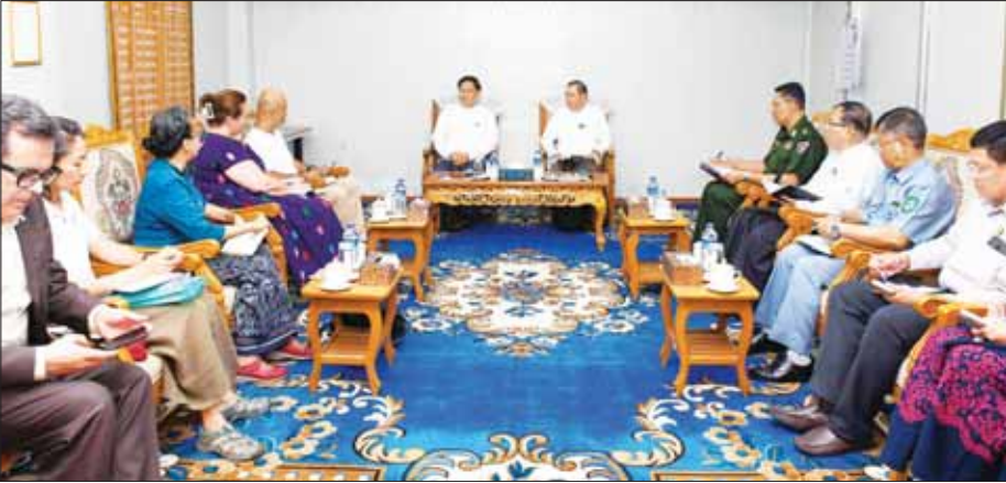
နိုင်ငံတော်စီမံအုပ်ချုပ်ရေးကောင်စီအဖွဲ့ဝင် ဒုတိယဝန်ကြီးချုပ်နှင့် ပြည်ထောင်စုဝန်ကြီး ဗိုလ်ချုပ်ကြီး တင်အောင်စန်းနှင့် ဒုတိယဗိုလ်ချုပ်ကြီး ထွန်းထွန်းနောင် ကုလသမဂ္ဂလူသားချင်းစာနာမှုဆိုင်ရာ ညှိနှိုင်းရေးမှူးရုံးမှ (UNRC) မှ ယာယီညှိနှိုင်းရေးမှူးနှင့်အဖွဲ့အား လက်ခံတွေ့ဆုံစဉ်။

သဘာဝဘေး ပြန်လည်ထူထောင် ရေးနှင့်စပ်လျဉ်းပြီး ဆောင်ရွက် ပြီးစီးမှု အခြေအနေနှင့် ဆက်လက် ဆောင်ရွက်သွားမည့် လုပ်ငန်းအစီအမံများကို ရှင်းလင်း တင်ပြကြရာ ဗိုလ်ချုပ်ကြီး တင်အောင်စန်းက လိုအပ်သည် များကို မှာကြား၍ လုပ်ငန်းလိုအပ် ချက်များကို ပေါင်းစပ်ညှိနှိုင်း ပြည်ဆုံး ဆောင်ရွက်ပေးကာ အစည်းအဝေးကို ရုပ်သိမ်းလိုက် သည်။ မိခါမုန်တိုင်း တိုက်ခတ်မှု ကြောင့် သဘာဝဘေးအန္တရာယ် ကျရောက်ခဲ့သည့် ရခိုင်ပြည်နယ် အတွင်း ပြည်သူလူထုအား ကျန်းမာရေးစောင့်ရှောက်မှုများ ပေးလျက်ရှိရာ ယနေ့အထိ မြို့နယ်အသီးသီးရှိ ပြည်သူ့ဆေးရုံ များ၌ ပြင်ပလူနာ ၄၈၇၆ ဦး၊ အတွင်းလူနာ ၉၀၁၁ ဦးနှင့် ပြင်ပ လူနာဌာနများတွင် ပြသသည့် လူနာ ၁၉၅၄၄ ဦးအား ကုသ စောင့်ရှောက်မှု ပေးခဲ့သည့်အပြင် ရေသန့်ဆေးခန်းခြင်း ၂၁၂၃ ကြိမ် နှင့် ကျန်းမာရေးနည်းပညာ ခြင်း ၁၆၉၄ ကြိမ် ဆောင်ရွက် ကို ဆွေးနွေးကြသည်။