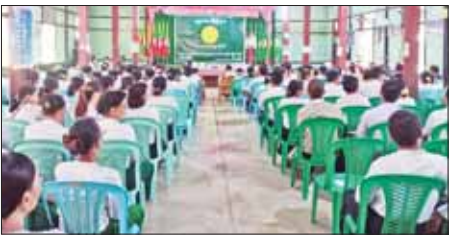
ကျောင်း နှစ်ကျောင်း စုစုပေါင်း ၁၅၅ ကျောင်းတို့တွင် ငါးနှစ်အရွယ် (KG) အတန်းမှ ဒြါးသမတန်း (Grade-12) သင်ရိုးသစ်အထိ ကျောင်းသူ ကျောင်းသားများအား ကျောင်းအပ်နှံမှု ဆက်လက်လက်ခံ ဆောင်ရွက်လျက်ရှိကြောင်း သိရ သည်။ သန့်ဇော်(ပြန်/ဆက်)

သာယာဝတီမြို့နယ်တွင် မေ ၂၃ ရက် နံနက်ပိုင်းမှစ၍ ကျောင်းအပ်နှံ လက်ခံလျက်ရှိ ရာ အထက်တန်းကျောင်းခြောက် ကျောင်း၊ အထက်တန်းကျောင်း(၃) ၁၅ ကျောင်း၊ အလယ်တန်းကျောင်း ၃၃ ကျောင်း၊ အလကခွဲ ခြောက် ကျောင်းနှင့် မူလတန်းလွန် ၂၁ ကျောင်း၊ အမက ၁၅ ကျောင်း၊ အမကခွဲ လေးကျောင်းနှင့် ဘုန်းတော်ကြီးသင် ပညာရေး