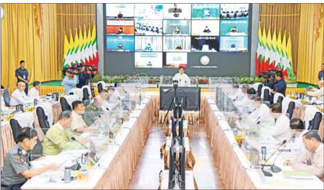
နိုင်ငံတော်စီမံအုပ်ချုပ်ရေးကောင်စီ ဒုတိယဥက္ကဋ္ဌ ဒုတိယဝန်ကြီးချုပ် ဒုတိယဗိုလ်ချုပ်မှူးကြီး စိုးဝင်း တရားမဝင် ကုန်သွယ်မှုတိုက်ဖျက်ရေး ဦးဆောင်ကော်မတီ လုပ်ငန်းညှိနှိုင်းအစည်းအဝေး (၃/၂၀၂၃)တွင် အမှာစကားပြောကြားစဉ်။

နေပြည်တော် မေ ၂၆ တရားမဝင်ကုန်သွယ်မှုတိုက်ဖျက်ရေး ဦးဆောင်ကော်မတီ လုပ်ငန်းညှိနှိုင်းအစည်းအဝေး(၃/၂၀၂၃) ကို ယနေ့မနန်းလွဲ ၂ နာရီတွင် နေပြည်တော်ရှိ စီးပွားရေးနှင့် ကူးသန်းရောင်းဝယ်ရေးဝန်ကြီးဌာန ညီလာခံခန်းမ၌ ကျင်းပရာ တရားမဝင်ကုန်သွယ်မှု တိုက်ဖျက်ရေး ဦးဆောင်ကော်မတီဥက္ကဋ္ဌ နိုင်ငံတော်စီမံအုပ်ချုပ်ရေးကောင်စီ ဒုတိယဥက္ကဋ္ဌ ဒုတိယဝန်ကြီးချုပ် ဒုတိယ ဗိုလ်ချုပ်မှူးကြီး စိုးဝင်း တက်ရောက် အမှာစကားပြောကြားသည်။ အစည်းအဝေးသို့ ပြည်ထောင်စုဝန်ကြီး ဒုတိယဗိုလ်ချုပ်ကြီး စိုးထွဋ်၊ ဦးဝင်းရှိန်နှင့် ဦးအောင်နိုင်ဦး၊ ဒုတိယဝန်ကြီးများ၊ နေပြည်တော်ကောင်စီဝင်၊ အဖွဲ့အယူခံ ခုံအဖွဲ့ဥက္ကဋ္ဌ၊ အမြဲတမ်းအတွင်းဝန်များ၊ ညွှန်ကြားရေးမှူးချုပ်များနှင့် တာဝန်ရှိသူများ တက်ရောက်ကြပြီး တိုင်းဒေသကြီးနှင့် ပြည်နယ် တရားမဝင်ကုန်သွယ်မှု တိုက်ဖျက်ရေးအထူးအဖွဲ့ဥက္ကဋ္ဌများက ဗီဒီယိုကွန်ဖရင့်စနစ်ဖြင့် တက်ရောက်ကြသည်။ အစည်းအဝေးတွင် နိုင်ငံတော်စီမံအုပ်ချုပ်ရေးကောင်စီ ဒုတိယဥက္ကဋ္ဌ ဒုတိယဝန်ကြီးချုပ်က အမှာစကားပြောကြားရာတွင် ယနေ့ကျင်းပသည့် တရားမဝင် ကုန်သွယ်မှုတိုက်ဖျက်ရေး ဦးဆောင်ကော်မတီ စာမျက်နှာ ၈ ကော်ဒ် ၁