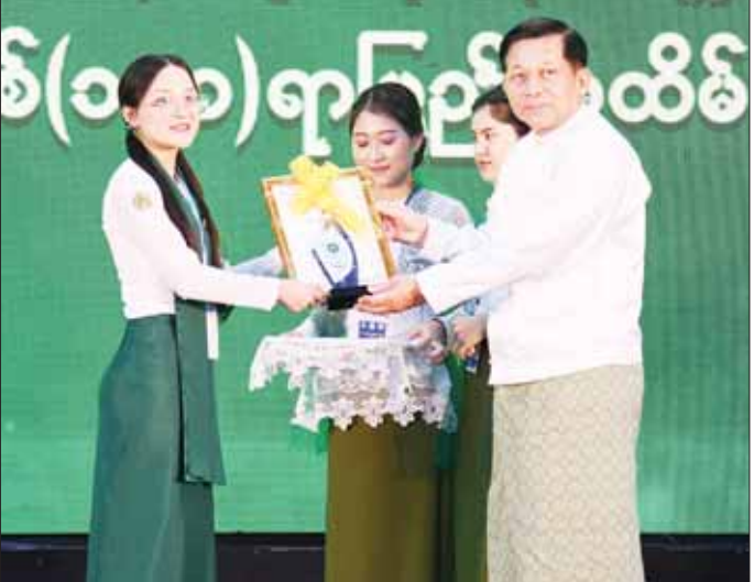
နိုင်ငံတော်စီမံအုပ်ချုပ်ရေးကောင်စီဥက္ကဋ္ဌ နိုင်ငံတော်ဝန်ကြီးချုပ် ဗိုလ်ချုပ်မှူးကြီး မင်းအောင်လှိုင် ဆုရရှိသူတစ်ဦးအား ဆုပေးအပ်ချီးမြှင့်စဉ်။