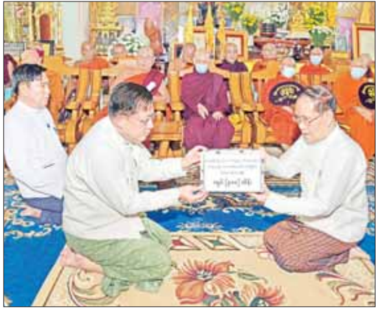
နိုင်ငံတော်စီမံအုပ်ချုပ်ရေးကောင်စီဥက္ကဋ္ဌ နိုင်ငံတော်ဝန်ကြီးချုပ် ဗိုလ်ချုပ်မှူးကြီး မင်းအောင်လှိုင် ဗန်းမော်ဆရာတော်ဘုရားကြီး၏ အန္တိမအဂ္ဂိဈာပနပူဇာသဘင်အခမ်းအနားကျင်းပနိုင်ရေး အလှူငွေများ ပေးအပ်လှူဒါန်းစဉ်။

“ နိုင်ငံတော်သံဃမဟာနာယကအဖွဲ့ဥက္ကဋ္ဌနှင့် နိုင်ငံတော်ဗဟိုသံယာဝန်ဆောင်အဖွဲ့ ဥက္ကဋ္ဌအဖြစ် ၁၃ နှစ်နီးပါး တာဝန်ထမ်းဆောင်ခဲ့သည့် သာသနာဦးညောင် ဆရာတော်ဘုရားကြီး ပျံလွန်တော်မူခဲ့ခြင်းသည် သာသနာတော်နှင့် နိုင်ငံတော်အတွက် ကြီးမားသည့် ဆုံးရှုံးမှုတစ်ခုပင်ဖြစ်ပြီး ဆရာတော်ဘုရားကြီး၏ အန္တိမအဂ္ဂိဈာပနပူဇာသဘင်အခမ်းအနားကို နိုင်ငံတော်အဆင့် ခမ်းနားသိုက်မြိုက်စွာ ကျင်းပပြုလုပ်နိုင်ရေးအတွက် နိုင်ငံတော်စီမံအုပ်ချုပ်ရေးကောင်စီဥက္ကဋ္ဌ နိုင်ငံတော်ဝန်ကြီးချုပ်၏ လမ်းညွှန်မှုဖြင့် စီစဉ်ဆောင်ရွက်လျက်ရှိ ”