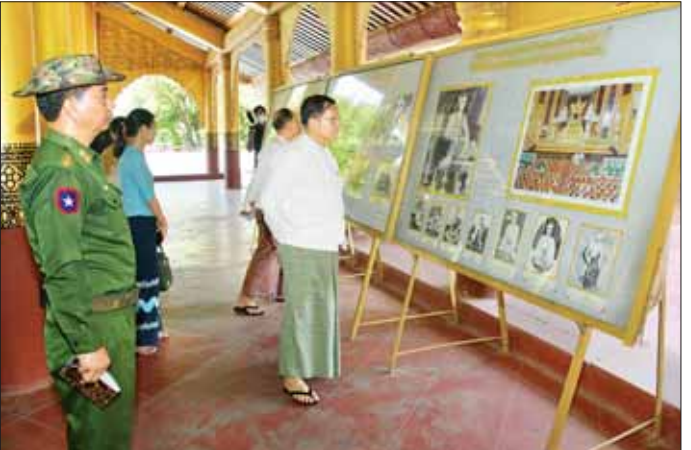
နိုင်ငံတော်စီမံအုပ်ချုပ်ရေးကောင်စီဥက္ကဋ္ဌ နိုင်ငံတော်ဝန်ကြီးချုပ်ဗိုလ်ချုပ်မှူးကြီး မင်းအောင်လှိုင်နှင့်အဖွဲ့ဝင် များ မြန်မာ့စံကော်ပိုရေးရှင်းတော်ကြီး သမိုင်းမှတ်တမ်းဆာတ်ပုံများကို ကြည့်ရှုစဉ်။

ပုံများနှင့်ပတ်သက်၍ မှတ်တမ်းမှတ်ရာများ ပြည့်ပြည့်စုံစုံရှိသည့် နန်းတော်ကြီးဖြစ်ကြောင်း၊ ကိုလိုနီခေတ်ကတည်းက ပြည်တွင်း၊ ပြည်ပ မှတ်တမ်းမှတ်ရာ၊ အကိုးအကားများ စုံစုံလင်လင် ရှိပြီးဖြစ်သည့်အတွက် ခိုင်မာသည့် သမိုင်းအထောက် အထားများ၊ မှတ်တမ်းမှတ်ရာများနှင့် ကိုက်ညီအောင် အတတ်နိုင်ဆုံး ဆောင်ရွက်သွားရန်လိုကြောင်း၊ နန်းတော်ကြီးအတွင်းရှိ အဆောင်များအလိုက် အခန်း များအတွင်း ရှေးခေတ်အသုံးအဆောင်များနှင့် ပုံစံတူ များထားရှိနိုင်ရေး မှတ်တမ်းများ ပြန်လည်ကြည့်ရှု ဆောင်ရွက်သွားရန်လိုကြောင်း၊ မှန်နန်းဆောင် အတွင်းရှိ တိုင်လုံးများအပေါ်တွင် မှန်စီရွှေချခြင်း များကို သပ်ရပ်မှုရှိအောင် ပြန်လည်ဆောင်ရွက်သွား ရန်လိုကြောင်း၊ ပလ္လင်တော်အပါအဝင် အချို့သော အသုံးအဆောင်ပစ္စည်းများကို ရေရှည်တည်တံ့ ခိုင်မြဲစေရေးအတွက် မှန်ကာခြင်းများကို ဆောင်ရွက်