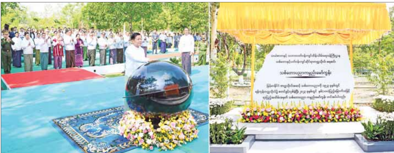
နိုင်ငံတော်စီမံအုပ်ချုပ်ရေးကောင်စီဥက္ကဋ္ဌ နိုင်ငံတော်ဝန်ကြီးချုပ် ဗိုလ်ချုပ်မှူးကြီး မင်းအောင်လှိုင် သစ်တောပညာ နှစ် (၁၀၀) ရာပြည့်အထိမ်းအမှတ် အခမ်းအနားအား စက်ဝလက်နှိပ်ဖွင့်လှစ်ပေးစဉ်။

နိုင်ငံတော်စီမံအုပ်ချုပ်ရေးကောင်စီဥက္ကဋ္ဌ နိုင်ငံတော်ဝန်ကြီးချုပ် ဗိုလ်ချုပ်မှူးကြီး မင်းအောင်လှိုင် တက်ရောက်အမှာစကားပြောကြား