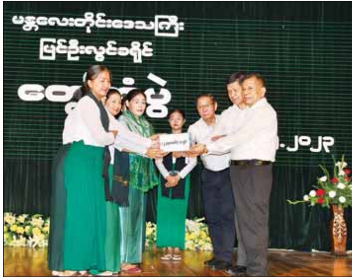
နိုင်ငံတော်စီမံအုပ်ချုပ်ရေးကောင်စီအဖွဲ့ဝင် ဦးမောင်ကို တက္ကသိုလ်နှင့် အခြေခံပညာအထက်တန်း ကျောင်းများ၌ Grade-9 ၊ Grade-12 သင်ရိုးသစ် ဆင့်ပွားသင်တန်းများတွင် တက်ရောက်နေကြသည့် အခြေခံပညာဆရာ ဆရာမများအတွက် ဂုဏ်ပြုချီးမြှင့်ငွေပေးအပ်စဉ်။

မြို့နယ်ရှိ မန္တလေးတက္ကသိုလ်၊ အမရပူရမြို့နယ်ရှိ မန္တလေးတက္ကသိုလ်နှင့် ရတနာပုံတက္ကသိုလ်များသို့ လည်းကောင်း၊ မေ ၂၄ ရက်က ချမ်းအေးသာစံမြို့နယ်ရှိ အမှတ်(၁၄)အခြေခံပညာ အထက်တန်းကျောင်း၊ အောင်မြေသာစံမြို့နယ်ရှိ အမှတ်(၁) အခြေခံ ပညာအထက်တန်းကျောင်းနှင့် အမရပူရမြို့နယ်ရှိ အမှတ်(၁) အခြေခံပညာအထက်တန်းကျောင်းများ သို့လည်းကောင်း၊ မေ ၂၄ ရက်က ပြင်ဦးလွင်မြို့နယ်ရှိ အမှတ်(၁) အခြေခံပညာအထက်တန်းကျောင်းနှင့် မြို့တော်ခန်းမသို့လည်းကောင်း သွားရောက်ပြီး ပါမောက္ခချုပ်များ၊ ပါမောက္ခ (ဌာနမှူး)များ၊ နည်းပြ များ၊ တိုင်းဒေသကြီးပညာရေးမှူးရုံးမှ ဒုတိယ ညွှန်ကြားရေးမှူးချုပ်နှင့် တာဝန်ရှိသူများ၊ ခရိုင်/ မြို့နယ်စီမံအုပ်ချုပ်ရေးအဖွဲ့ဥက္ကဋ္ဌနှင့် အဖွဲ့ဝင်များ၊ ကျောင်းအုပ်ကြီးများ၊ Grade-9 ၊ Grade-12 ဆင့် သင်ရိုးသစ်ဆင့်ပွားသင်တန်းများမှ အခြေခံဆရာ ဆရာမများ၊ အခြေခံပညာအထက်တန်း၊ အလယ် တန်း၊ မူလတန်းကျောင်းများမှ ဆရာ ဆရာမများ၊ ကျောင်းသား ကျောင်းသူများ၏ မိဘများ၊ ကျောင်း အကျိုးဆောင်များနှင့် တွေ့ဆုံခဲ့သည်။ လက်တွေ့ညီညွတ် လျှောက်လှမ်း ထိုသို့တွေ့ဆုံစဉ် နိုင်ငံတော်စီမံအုပ်ချုပ်ရေး