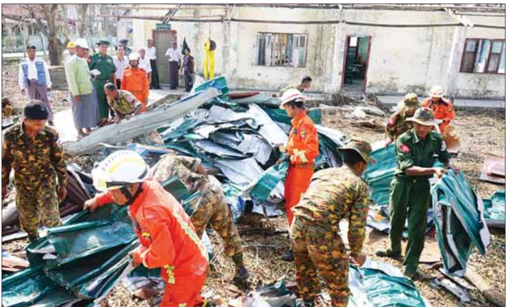
မောင်တောမြို့နယ်ရှိ မုန်တိုင်းဒဏ်သင့် စာသင်ကျောင်းတစ်ကျောင်းကို ရှင်းလင်းနေသော တပ်မတော်သားများနှင့် မီးသတ်တပ်ဖွဲ့ဝင်များ။

မုန်တိုင်းကြိုတင်ပြင်ဆင်မှုများ ဆောင်ရွက် သည့်ဆိုရာတွင် ကမ္ဘာပေါ်ရှိ ဖြစ်ပွားပေါ်ပေါက် ခဲ့သော သဘာဝဘေးအန္တရာယ်များတွေ့ကြုံခံစားခဲ့ ရသည့် အတွေ့အကြုံမှတ်တမ်းများကို သုံးသပ် လေ့လာပြီး လက်တွေ့ကျသော ကြိုတင်ကာကွယ် ရေးဆိုင်ရာ စီမံချက်များ၊ ဘေးအန္တရာယ်ကျရောက် ချိန်တွင် ဆောင်ရွက်ရမည့် ရှာဖွေကယ်ဆယ်ရေး လုပ်ငန်းစီမံချက်များ၊ ဘေးအန္တရာယ်ကျရောက် ပြီးနောက် ကူညီကယ်ဆယ်ရေး၊ ပြန်လည် ထူထောင်ရေးနှင့် ပြန်လည်တည်ဆောက်ရေးတို့ အတွက် စီမံချက်များ စသည့်စီမံချက်အမျိုးအစား သုံးမျိုးကို နှစ်စဉ် မိုးကြိုကာလတွင် မုန်တိုင်း တိုက်ခတ်မှု၊ ရေကြီးရေလျှံမှု၊ တောင်ပြိုမှုများ၊ မိုးအကျန် ဆောင်းအကူး ပွင့်လင်းရာသီတွင် မီးဘေးလုံခြုံရေးဆိုင်ရာများ၊ မိုးခေါင်ရေရှား