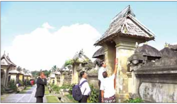
ပြည်ထောင်စုဝန်ကြီး ဦးမောင်မောင်အုန်း အင်ဒိုနီးရှားနိုင်ငံ ဘာလီရှိ ပန်လီပူရမ်ကျေးရွာအတွင်း လေ့လာ ကြည့်ရှုစဉ်။

(၁၈)ကြိမ်မြောက် အာရှမီဒီယာ ထိပ်သီးညီလာခံ (18th Asia Media Summit) တက်ရောက် လျက်ရှိသည့် ပြန်ကြားရေးဝန်ကြီး ဌာန ပြည်ထောင်စုဝန်ကြီး ဦးမောင်မောင်အုန်း ဦးဆောင် သည့် မြန်မာကိုယ်စားလှယ်အဖွဲ့ သည် အာရှပစိဖိတ် ရုပ်သံလွှင့် လုပ်ငန်းများ ဖွံ့ဖြိုးရေးအဖွဲ့ (AIBD) အဖွဲ့ဝင်နိုင်ငံများမှ ညီလာခံ တက်ရောက်လျက်ရှိသည့် နိုင်ငံ များမှ ပြန်ကြားရေးကဏ္ဍဆိုင်ရာ ဝန်ကြီးများနှင့် ကိုယ်စားလှယ်များ နှင့်အတူ ယနေ့နံနက်ပိုင်းက အင်ဒိုနီးရှားနိုင်ငံ ဘာလီကျွန်းရှိ ဘန်လီခရိုင် (Bangli Regency) ကုဘူ (Kubub) မြို့မှ ပန်လီပူရမ် ကျေးရွာ၊ Bamboo Forest နှင့် ကင်တန်မနီ (Kintamani) ကျေးရွာတို့သို့ သွားရောက် လေ့လာကြသည်။