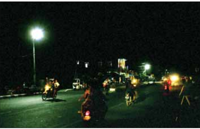
မေ ၂၅ ရက် ည ၇ နာရီမှစတင်၍ စစ်တွေမြို့တွင် လမ်းမီးများ ထွန်းညှိထားသည်ကို တွေ့ရစဉ်။