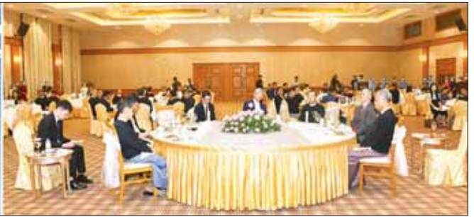
တရုတ်ပြည်သူ့သမ္မတနိုင်ငံ သံအမတ်ကြီးတို့သည် အခမ်းအနားသို့ တက်ရောက်လာကြသူများနှင့်အတူ ဂုဏ်ပြုညစာစားပွဲ အတူတကွ သုံးဆောင်ကြသည်။