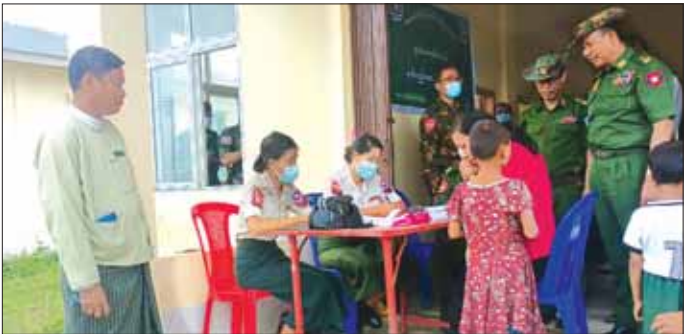
လိုအပ်သည်များ မှာကြားသည်။ ဘူးသီးတောင်မြို့နယ် ကင်းချောင်းကျေးရွာအုပ်စု၊ သပိတ်တောင်ကျေးရွာအုပ်စုနှင့် မြောင်းနားကျေးရွာအုပ်စုတို့၌ မိုးခါမုန်တိုင်း တိုက်ခတ်မှုကြောင့် နေအိမ်များ အမိုးလန့်၊ ပြိုကျ၊ ပျက်စီးခဲ့သည့် လေဘေးသင့်အိမ်ထောင်စု ၃၆၅ စုတို့အတွက်

ဘူးသီးတောင် မေ ၂၅ ရခိုင်ပြည်နယ် ဘူးသီးတောင်မြို့နယ်အတွင်း မိုးခါ မုန်တိုင်းကြောင့် ပြန်လည်ထူထောင်ရေးလုပ်ငန်းများ ဆောင်ရွက်နိုင်ရန်အတွက် ဒုတိယဗိုလ်ချုပ်ကြီး အေးဝင်းနှင့် တာဝန်ရှိသူများ မေ ၂၄ ရက်က ဘူးသီးတောင်မြို့ အမှတ်(၁)အခြေခံပညာအထက်တန်းကျောင်းရှေ့နှင့် သမဝါယမရုံးရှေ့တို့၌ တပ်မတော် သားများ၊ မြန်မာနိုင်ငံရဲတပ်ဖွဲ့ဝင်များ၊ မီးသတ်တပ်ဖွဲ့ဝင်များနှင့် မြို့နယ်အထွေထွေအုပ်ချုပ်ရေးဦးစီးဌာနမှ ဝန်ထမ်းများ စုပေါင်းသန့်ရှင်းရေး ဆောင်ရွက်နေမှုများကို လှည့်လည်ကြည့်ရှုသည်။ ထို့နောက် အခြေခံပညာအလယ်တန်းကျောင်းခွဲ(မြို့သစ်)၌ မိုးခါမုန်တိုင်းဒဏ်ကြောင့် ပျက်စီးနေသည့် ကျောင်းအဆောက်အအုံ ပျက်စီးနေမှုကို လှည့်လည်ကြည့်ရှုကာ တာဝန်ရှိသူများအား