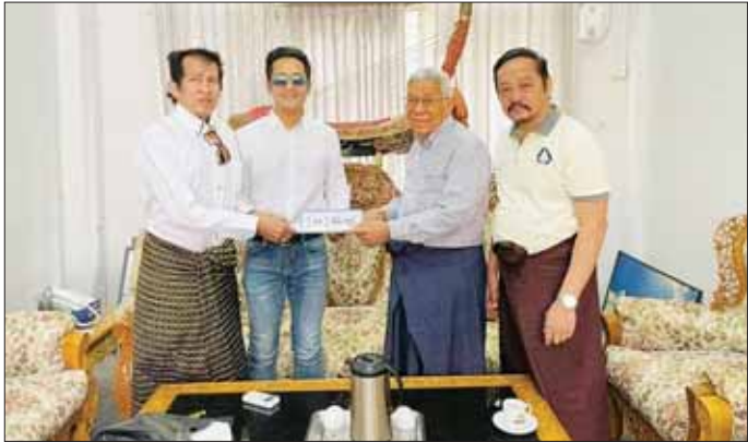
မုန်တိုင်းသင့်ဒေသရှိ ပြည်သူများအတွက် သရုပ်ဆောင် နေ့ဈေး အလှူငွေပေးအပ်လှူဒါန်းစဉ်။