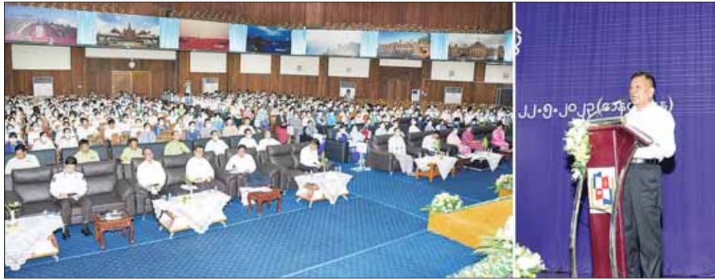
နိုင်ငံတော်စီမံအုပ်ချုပ်ရေးကောင်စီအဖွဲ့ဝင် ဦးမောင်ကို ပါမောက္ခချုပ်များ၊ ကျောင်းအုပ်ကြီးများ၊ နည်းပြများ၊ ဆရာ ဆရာမများအား တွေ့ဆုံအမှာစကား ပြောကြားစဉ်။

မန္တလေး မေ ၂၅ မြန်မာနိုင်ငံလုံးဆိုင်ရာပညာရေးညီလာခံ(၂၀၂၃)တွင် နိုင်ငံတော်စီမံအုပ်ချုပ်ရေးကောင်စီဥက္ကဋ္ဌ နိုင်ငံတော် ဝန်ကြီးချုပ် ဗိုလ်ချုပ်မှူးကြီး မင်းအောင်လှိုင် ပြောကြားခဲ့သည့် အမှာစကားများမှ ကျောင်းတက် သူဦးရေတိုးတက်ရေး၊ အတန်းကျားပြောင်းမှုနှုန်း မြှင့်တင်ရေးတို့နှင့်စပ်လျဉ်း၍ နိုင်ငံတော်စီမံအုပ်ချုပ် ရေး ကောင်စီအဖွဲ့ဝင် ဦးမောင်ကိုက မန္တလေးတိုင်း ဒေသကြီး အောင်မြေသာစံခရိုင်၊ မဟာအောင်မြေ ခရိုင်၊ အမရပူရခရိုင်၊ ပြင်ဦးလွင်ခရိုင်အတွင်းရှိ တက္ကသိုလ်များ၊ အခြေခံပညာ အထက်တန်း ကျောင်းများတွင် ပြန်လည်ဆွေးနွေး ပြောကြား ခဲ့သည်။ နိုင်ငံတော်စီမံအုပ်ချုပ်ရေး ကောင်စီအဖွဲ့ဝင် ဦးမောင်ကိုသည် မန္တလေးတိုင်းဒေသကြီး ဝန်ကြီးချုပ် ဦးမျိုးအောင်၊ တိုင်းဒေသကြီးဝန်ကြီးများနှင့် တာဝန် ရှိသူများလိုက်ပါပြီး မေ ၂၅ ရက်က မဟာအောင်မြေ