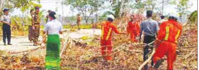
သွားရောက်ကာ ကျောင်းအုပ်ဆရာမကြီးအား ကျောင်းဖွင့်ချိန်တွင် ကျောင်းသားများ အမိုးအကာလုံခြုံစွာ ပညာသင်ကြားနိုင်ရေးအတွက် ပျက်စီးမှုကို အချိန်မီပြုပြင်နိုင်ရန် မှာကြားခဲ့ကြောင်း သိရသည်။