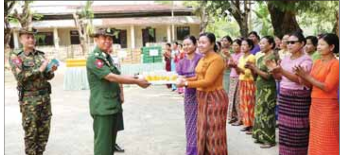
ဒုတိယဗိုလ်ချုပ်ကြီး ဖုန်းမြတ် ချင်းပြည်နယ် ပလက်ဝမြို့ရှိ နယ်မြေခံတပ်ရင်းမှ တပ်မိသားစုဝင်များအား အခြေခံစားကုန်နှင့် စားသောက်ဖွယ်ရာများ ထောက်ပံ့ပေးအပ်စဉ်။

အမှတ်(၇) အခြေခံပညာ အထက်တန်းကျောင်းတို့ရှိ ကျောင်းဆောင်များ ပျက်စီးနေမှုများအား ပြုပြင် တည်ဆောက်နေမှုတို့ကို ကြည့်ရှုစစ်ဆေးပြီး လုပ်ငန်းများ ပြန်လည်အချိန်မီ ပြီးစီးနိုင်ရေးအတွက် လိုအပ်သည့်အဖွဲ့ဝင်များနှင့် အဖွဲ့ဝင်များအား အပေါ်ပိုင်းမှ ညှိနှိုင်းဖြည့်ဆည်းပေးကာ (အပေါ်ပို) ၂၀၂၃-၂၀၂၄ ပညာသင်နှစ်အတွက် ကျောင်းအပ်လက်ခံနေမှုကို ကြည့်ရှုအားပေးပြီး ကျောင်းအပ်နှံရန် လာရောက်ကြသည့် မိဘအုပ်ထိန်းသူများနှင့် ကျောင်းသား ကျောင်းသူများအား ရင်းရင်းနှီးနှီး လိုက်လံနှုတ်ဆက်သည်။ ယင်းနောက် ဒုတိယဗိုလ်ချုပ်ကြီး ဖုန်းမြတ်နှင့် အဖွဲ့ဝင်များသည် ချင်းပြည်နယ် ပလက်ဝမြို့ရှိ နယ်မြေခံတပ်ရင်းမှ တပ်မိသားစုဝင်များအား ရင်းရင်းနှီးနှီးတွေ့ဆုံနှုတ်ဆက် အားပေးစကားပြောကြားပြီး အခြေခံစားကုန်နှင့် စားသောက်ဖွယ်ရာများ ထောက်ပံ့ပေးအပ်ကာ တပ်ရင်းတွင် ဆောင်ရွက်ထားသော စိုက်ပျိုး/ မွေးမြူရေးလုပ်ငန်းများအား ကြည့်ရှုစစ်ဆေး၍ လိုအပ်သည်များ မှာကြားခဲ့ကြောင်း သတင်းရရှိသည်။ သတင်းစဉ်