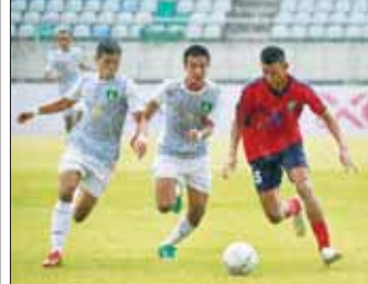
GFA အသင်းနှင့် မြဝတီအသင်း ယှဉ်ပြိုင်နေစဉ်။

ရန်ကုန် မေ ၂၅ ၂၀၂၃ ခုသီ MNL အမှတ်ပေးပြိုင်ပွဲပွဲစဉ် (၆) ပထမနေ့ကို မေ ၂၅ ရက်က ပြန်လည်ကျင်းပရာ ရတနာပုံအသင်း နိုင်ပွဲရရှိပြီး GFA နှင့် မြဝတီ သရေကျခဲ့သည်။ သုဝဏ္ဏကွင်း၌ ကျင်းပသည့်ပွဲတွင် GFA အသင်းနှင့် မြဝတီအသင်း တစ်ဂိုးစီသရေကျခဲ့သည်။ GFA အသင်းသည် မိနစ် ၉၀ ပြည့်သည်အထိ တစ်ဂိုးအသာဖြင့် ဦးဆောင်နိုင်ခဲ့သော်လည်း ပွဲပြီးခါနီး နာကျင်အချိန်ပိုတွင် ချေပဂိုးပြန်ပေးလိုက်ရသဖြင့် သရေရလဒ်ဖြင့် ကျေနပ်ခဲ့ခြင်းဖြစ်သည်။ စာမျက်နှာ ၁၄ ကော်လံ ၅ ❖