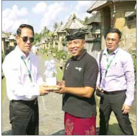
ပြည်ထောင်စုဝန်ကြီး ဦးမောင်မောင်အုန်း ပန်လီပူရမ်ကျေးရွာ အုပ်ချုပ်ရေးမှူးအား အမှတ်တရ လက်ဆောင်ပစ္စည်းပေးအပ်စဉ်။