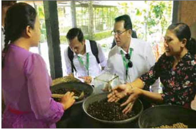
ပြည်ထောင်စုဝန်ကြီး ဦးမောင်မောင်အုန်းနှင့် လေ့လာရေးအဖွဲ့ ကင်တန်မနီကျေးရွာရှိ BAS De ATAYANA (I I Love BAS Agrotourism)ကော်ဖီဖိခြံသို့ သွားရောက်လေ့လာစဉ်။