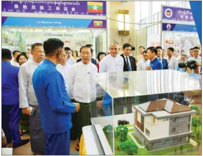
ဒုတိယဝန်ကြီးချုပ်နှင့် ပြည်ထောင်စုဝန်ကြီး ဦးဝင်းရှိန်နှင့်တာဝန်ရှိသူများ မြန်မာ(နေပြည်တော်)-တရုတ် (လင်ချန်း) စီးပွားရေး ကုန်စည်ပြပွဲတွင် ခင်းကျင်းပြသထားသည့် ပြခန်းအား ကြည့်ရှုအားပေးစဉ်။