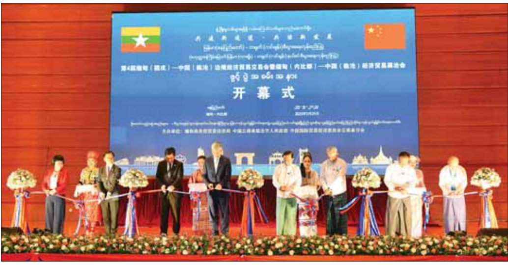
ဒုတိယဝန်ကြီးချုပ်နှင့် ပြည်ထောင်စုဝန်ကြီး ဦးဝင်းရှိန်၊ ပြည်ထောင်စုဝန်ကြီး ဦးအောင်နိုင်ဦး၊ ရှမ်းပြည်နယ်အစိုးရအဖွဲ့ စီးပွားရေးရာဝန်ကြီး၊ UMFCCI ဒုတိယ ဥက္ကဋ္ဌနှင့် မြန်မာနိုင်ငံဆိုင်ရာ တရုတ်ပြည်သူ့သမ္မတနိုင်ငံဆိုင်ရာ သံအမတ်ကြီးနှင့် တာဝန်ရှိသူများက မြန်မာ (နေပြည်တော်)-တရုတ်(လင်ချန်း) စီးပွားရေး ကုန်စည်ပြပွဲကို ဖဲကြီးဖြတ်ဖွင့်လှစ်ပေးစဉ်။

မုန့်တိုင်းသင့်ဒေသတွင် ကူညီကယ်ဆယ်ရေးလုပ်ငန်းများ အားသွန်ခွန်စိုက်ကြိုးပမ်း ဆောင်ရွက်နေကြသည့်တပ်ဖွဲ့ဝင်များအား လေးစားဂုဏ်ယူ ဆောင်ရွက်ပေးပါ။ ဆာဘားအန္တရာယ်ကျရောက်သောဒေသများတွင် တပ်မတော်မှကူညီကယ်ဆယ်ရေးအဖွဲ့များက ကူညီကယ်ဆယ်ရေးနှင့် ပြန်လည်ထူထောင်ရေးလုပ်ငန်းများ ပူးပေါင်းပါဝင်ဆောင်ရွက်ပေးလျက်ရှိ