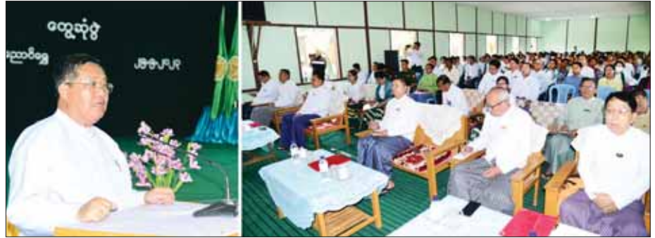
နိုင်ငံတော်စီမံအုပ်ချုပ်ရေးကောင်စီအဖွဲ့ဝင် ဒေါက်တာကျော်ထွန်း၊ ညောင်ရွှေမြို့နယ် အမှတ်(၂) အခြေခံပညာအထက်တန်းကျောင်း၌ ဆရာ ဆရာမများ၊ ရပ်မိရပ်ဖများ၊ ကျောင်းသား ကျောင်းသူများနှင့် တွေ့ဆုံပွဲတွင် အမှာစကားပြောကြားစဉ်။

နိုင်ငံတော်စီမံအုပ်ချုပ်ရေးကောင်စီအဖွဲ့ဝင် ဒေါက်တာကျော်ထွန်းသည် ရှမ်းပြည်နယ်ဝန်ကြီးချုပ် ဦးအောင်ဇော်အေး၊ ပြည်နယ်ဝန်ကြီးများ၊ ပြည်နယ်ဥပဒေချုပ်နှင့် တာဝန်ရှိသူများနှင့်အတူ ယနေ့နံနက်ပိုင်းက တောင်ကြီးခရိုင် ရပ်စောက်မြို့နယ် ပင်ဖြစ်ကျေးရွာ အခြေခံပညာ အထက်တန်းကျောင်းရှိ တောင်ငူဆောင်၌ ဆရာ ဆရာမများ၊ ရပ်မိရပ်ဖများ၊ ကျောင်းသား ကျောင်းသူများနှင့် တွေ့ဆုံသည့်။