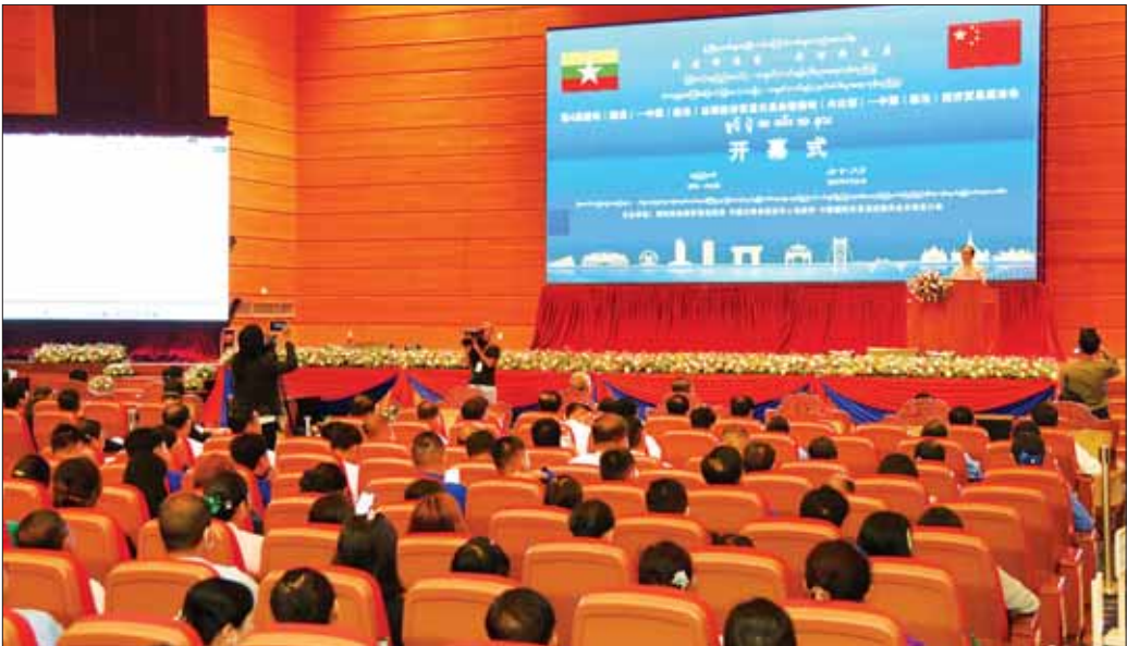
ဒုတိယဝန်ကြီးချုပ်နှင့် ပြည်ထောင်စုဝန်ကြီး ဦးဝင်းရှိန် မြန်မာ (နေပြည်တော်) - တရုတ် (လင်ချန်း) စီးပွားရေးကုန်စည်ပြပွဲ (စတုတ္ထအကြိမ် မြန်မာ (လားရှိုး)- တရုတ်(လင်ချန်း) နယ်စပ်စီးပွားရေးကုန်စည်ပြပွဲ) ဖွင့်ပွဲအခမ်းအနားတွင် အမှာစကားပြောကြားစဉ်။

နှစ်ဖက်ပူးပေါင်းဆောင်ရွက် နှစ်နိုင်ငံကြား ကုန်သွယ်မှုလုပ်ငန်းများ အဆင်ပြေ ချောမွေ့စေရေးအတွက် အစိုးရအချင်းချင်းသာမက ပုဂ္ဂလိကလုပ်ငန်းရှင်များအချင်းချင်း ပူးပေါင်း ဆောင်ရွက်မှုကို တိုးမြှင့်ဆောင်ရွက်ကြရမည်ဖြစ်ပါ ကြောင်း၊ နှစ်နိုင်ငံကုန်သွယ်မှု မြှင့်တင်ရေးတွင် မြန်မာနိုင်ငံက အဓိကတင်ပို့လျက်ရှိသည့် ထွက်ကုန် ပစ္စည်းများ တရုတ်နိုင်ငံဈေးကွက်အတွင်း ကျယ်ပြန့်