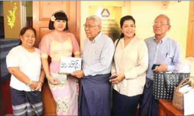
မုန်တိုင်းသင့်ဒေသရှိ ပြည်သူများအတွက် သရုပ်ဆောင် မမဆောင်း အလှူငွေပေးအပ်လှူဒါန်းစဉ်။