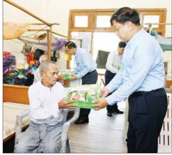
နိုင်ငံတော်စီမံအုပ်ချုပ်ရေးကောင်စီအဖွဲ့ဝင် ဒုတိယဝန်ကြီးချုပ်နှင့် ပြည်ထောင်စုဝန်ကြီး ဗိုလ်ချုပ်ကြီး တင်အောင်စန်းနှင့်အဖွဲ့ စစ်တွေမြို့ ဘိုးဘွားရိပ်သာရှိ အဘိုးအဘွားများအား ဆေးဝါးနှင့်စားသောက်ဖွယ်ရာများ ပေးအပ်လှူဒါန်းစဉ်။

စစ်သည် ၄၆၉ ဦး စုစုပေါင်းအင်အား ၂၈၈၈ ဦးဖြင့် အပျက်အစီးများ ရှင်းလင်းရေးလုပ်ငန်းကို နေ့စဉ်ဆောင်ရွက်ပေးလျက်ရှိသည်။