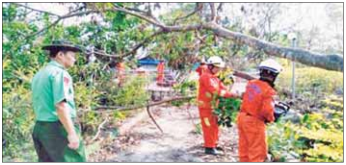
ဦးဥက္ကဋ္ဌမပန်းခြံကို သန့်ရှင်း သာယာလှပရေး တပ်ဖွဲ့ဝင်များအား ကြည့်ရှုစစ်ဆေးခဲ့ကြောင်း ဆောင်ရွက်နေသည့် နယ်မြေခံတပ်မတော်သား သိရသည်။ များ၊ မြို့နယ်ရဲတပ်ဖွဲ့ဝင်များ၊ မြို့နယ်စီးသတ် သောင်းရွှေ(ပြန်/ဆက်)

များ၊ မြို့နယ်ရဲတပ်ဖွဲ့ဝင်များ၊ စီးသတ်တပ်ဖွဲ့ဝင် များ၏ သန့်ရှင်းရေးဆောင်ရွက်နေမှုများ၊ စာသင် ခန်းများ၏ မျက်နှာကြက်နှင့် ခေါင်းမိုးလန် ပျက်စီး နေမှုကို လှည့်လည်ကြည့်ရှုခဲ့ပြီး ကျောင်းဖွင့် ကာလအတွင်း ကျောင်းများအချိန်မီဖွင့်လှစ်နိုင်ရေး အမြန်ဆုံး ဆောင်ရွက်ပေးရန် လိုအပ်ကြောင်း တာဝန်ရှိသူများအား မှာကြားသည်။ ဆက်လက်ပြီး ကျေးလက်ဒေသဖွံ့ဖြိုးတိုးတက် ရေးဦးစီးဌာနက မိုခါမုန်တိုင်းကြောင့် သောက်သုံးရေ ခက်ခဲနေသည့် ပြည်သူများအား သန့်ရှင်းသော သောက်သုံးရေရရှိနိုင်ရန် ပြည်တော်သာရပ်ကွက်ရှိ ရေနေောက်ကန်မှ ရေကို ရေသန့်စင်ကားဖြင့် သောက်သုံးရေသန့် ဖြန့်ဝေပေးနေမှုအား ကြည့်ရှု ကာ ပြည်သူများနှင့် ရင်းရင်းနှီးနှီး တွေ့ဆုံ၍ အားပေးစကား ပြောကြားသည်။ ဆက်လက်၍