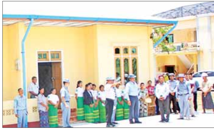
စစ်တွေကံ့ကော်ကျွန်း တာဝန်ရှိသူများကို နယ်စပ်ဒေသဖွံ့ဖြိုးမှုကြီးကြပ်ရေးရုံး ဝန်ထမ်းအိမ်ရာနှင့် ရုံးသုံးရောက်ရှိခဲ့ပြီး မုန်တိုင်းဒဏ်ကြောင့် ပျက်စီးခဲ့သည့် ဝန်ထမ်းအိမ်ရာများ၊ ရုံးအဆောက်အအုံများ

စစ်တွေ မေ ၂၂ နယ်စပ်ရေးရာဝန်ကြီးဌာန ပြည်ထောင်စုဝန်ကြီး ဒုတိယဗိုလ်ချုပ်ကြီး ထွန်းထွန်းနောင်သည် တာဝန်ရှိသူများနှင့်အတူ စစ်တွေမြို့နယ်ရှိ ကံ့ကော်ကျွန်း-ဇော်မတက်-ချောင်းနွယ် ကျေးရွာချင်းဆက်လမ်း ၅/၇မိုင် လမ်းပေါ်တွင် နယ်စပ်ရေးရာဝန်ကြီးဌာနမှ ၂၀၂၂-၂၀၂၃ ဘဏ္ဍာနှစ် ခွင့်ပြုကျပ် ၂၆၀ ဒသမဇွန် ၁၀ နှစ်ဖြင့် ကွန်ကရစ်လမ်း တစ်မိုင် ဆောင်ရွက်ပြီးစီးမှု၊ ၂၀၂၀-၂၀၂၁ ဘဏ္ဍာနှစ်တွင် ခွင့်ပြုကျပ် ၂၉၄ ဒသမ ၇၇၈ သန်းဖြင့် တည်ဆောက်ခဲ့သည့် ဇော်မတက်ချောင်းကူးတံတား ပေ ၁၅၀ ၏ ကြံ့ခိုင်မှုအခြေအနေများကိုလည်းကောင်း၊ ၂၀၂၃-၂၀၂၄ ဘဏ္ဍာနှစ်တွင် ခွင့်ပြုကျပ် ၃၀၇ ဒသမ ၈၇၅ သန်းဖြင့် ဆက်လက်အကောင်အထည်ဖော်မည့် ကွန်ကရစ်လမ်း အကြောင်းအခြေအနေကိုလည်းကောင်း အသေးစိတ်ကြည့်ရှုစစ်ဆေးခဲ့ပြီး အဆိုပါလမ်းအား ၁၈ ပေအကျယ် ကွန်ကရစ်လမ်းအဖြစ် အဆင့်မြှင့်တင်နိုင်ရေးအတွက် စနစ်တကျ ကွင်းဆင်း