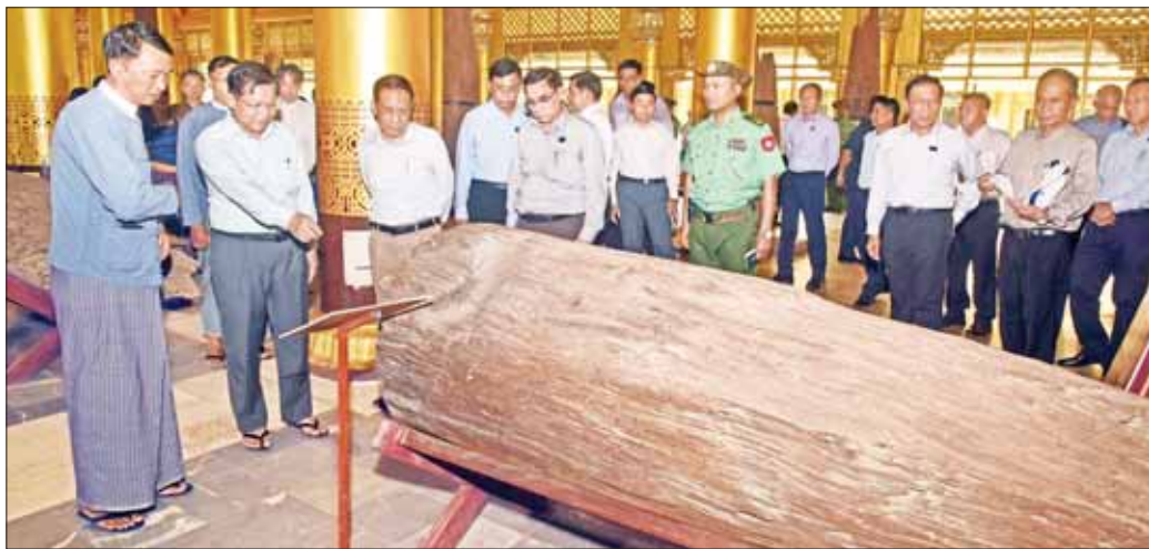
နိုင်ငံတော်စီမံအုပ်ချုပ်ရေးကောင်စီဥက္ကဋ္ဌ နိုင်ငံတော်ဝန်ကြီးချုပ် ဗိုလ်ချုပ်မှူးကြီး မင်းအောင်လှိုင်နှင့်အဖွဲ့ဝင်များ ကမ္ဘောဇသောဒိ ရွှေနန်းတော်အတွင်း ယခင်မြေနှိပ်ပြာသာဒ်ဆောင်နေရာမှ တူးဖော်ရရှိသည့် ကျွန်းတိုင်ကို ကြည့်ရှုစစ်ဆေးစဉ်။