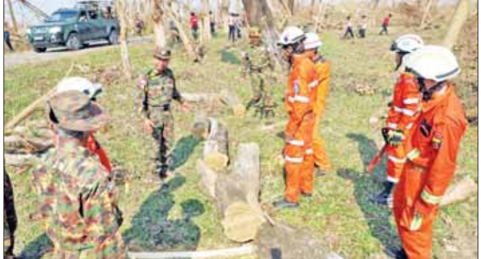
သာဘဝလေဘေး တိုက်ခတ်မှုကြောင့် စစ်တွေတပ်နယ်ရှိ ပျက်စီးမှုများဖြစ်ပေါ်ခဲ့သော စာသင်ကျောင်းများ၊ ဆေးရုံများ ပြန်လည်ပြုပြင်နေမှုများကို ကြည့်ရှုစစ်ဆေး

◆ ကျော့ဖုံးမှ အဆိုပါ ဆင်ဖြူတော်လေးမှာ မွေးဖွားစတွင် အရပ်အမြင့် ၂ ပေ ၅ လက်မ၊ ကိုယ်လုံး လုံးပတ် ၃ ပေ ၁ လက်မ၊ ကိုယ်အလေးချိန် ပေါင် ၁၈၀ ခန့်ရှိပြီး ရတနာဆင်ဖြူတော်များ၏ ကြန့်အင်လက္ခဏာ ရှစ် ချက်အနက် မျက်လုံးပုလဲရောင်ဖြစ်ခြင်း၊ ကျော့ကုန်းမှာ ငှက်ပျော့ကိုင်း သဏ္ဍာန်ဖြစ်ခြင်း၊ အမွေးအဖြူရောင်ဖြစ်ခြင်း၊ အဖိုးတံခါးပိတ်ဖြစ်ခြင်း၊ အရေပြားမှာ ဩဇာကွက်ဖြစ်ခြင်း၊ အသားအရေ ဝန်းရောင်ဖြစ်ခြင်း၊ ခြေဖဝါးတွင် ရှေ့ခြေသည်း ငါး ခုစီနှင့် နောက်ခြေသည်း လေး ခုစီပါရှိခြင်း၊ နားကြီးခြင်း စသည့်ရတနာဆင်ဖြူတော်များ၏ ကြန့်အင်လက္ခဏာ ခုနစ်ချက် ကိုက်ညီသော ဆင်ဖြူတော်လေး ဖြစ်သည်။ ဆင်ဖြူတော်လေးသည် ယခုအချိန်တွင် အသက် ၁၀ လသား အရွယ် ဖြစ်ပြီး အရပ်အမြင့် ၃ ပေ ၇ လက်မ၊ ကိုယ်လုံးလုံးပတ် ၆ ပေ ၃ လက်မ၊ ကိုယ်အလေးချိန် ပေါင် ၅၅၀ ရှိလာပြီဖြစ်ကာ ရတနာဆင်ဖြူတော် ထိန်းသိမ်းစောင့်ရှောက်ရေးဥယျာဉ် (နေပြည်တော်) ရှိ ရတနာဆင်ဖြူတော်ဆောင်တွင် မိခင်ဆင်မကြီးနှင့်အတူ ရှိနေကြောင်း၊ ဆင်ဖြူတော်လေး “ရန္တနန္ဒက” မှာ ဝယ်စဉ်ကပင် လူနှင့်ယဉ်ပါးသည့် ဆင်ဖြူတော်လေး ဖြစ်ပြီး ပိုမိုယဉ်ပါးစေရန်၊ ဆင်နှင့်လူသားတို့အကြား ကောင်းမွန်စွာ ဆက်ဆံတတ်စေရန် လေ့ကျင့်သင်ကြားခြင်းစနစ် “Peace Human and Elephant Interaction Training” ဖြင့် လေ့ကျင့်သင်ကြားပေးလျက်ရှိကြောင်း သိရသည်။