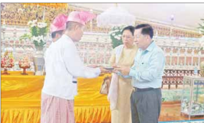
နိုင်ငံတော်စီမံအုပ်ချုပ်ရေးကောင်စီဥက္ကဋ္ဌ နိုင်ငံတော်ဝန်ကြီးချုပ် ဗိုလ်ချုပ်မှူးကြီး မင်းအောင်လှိုင်နှင့် ဇနီး ဒေါ်ကြူကြူလှတို့ ရွှေသာလျောင်းရုပ်ပွားတော်မြတ်ကြီး၌ ဘက်စုံအလှူငွေများ ပေးအပ်လှူဒါန်းစဉ်။

ယင်းနောက် နိုင်ငံတော်စီမံအုပ်ချုပ်ရေး ကောင်စီဥက္ကဋ္ဌ နိုင်ငံတော်ဝန်ကြီးချုပ်နှင့် အဖွဲ့ဝင် များသည် ရုပ်ပွားတော်မြတ်ကြီးအား လက်ယာရစ် လှည့်လည်ဖူးမြော်ကြည့်ညိပြီး ရုပ်ပွားတော်မြတ်ကြီး ရေရှည်တည်တံ့ခိုင်မြဲရေးနှင့် သန့်ရှင်းသာယာလှပပြီး လာရောက်ဖူးမြော်သူများ ကြည့်ညိသပ္ပာယ်ဖွယ် ဖြစ်စေရေး လိုအပ်သည့် ပြုပြင်ထိန်းသိမ်းမှုများကို