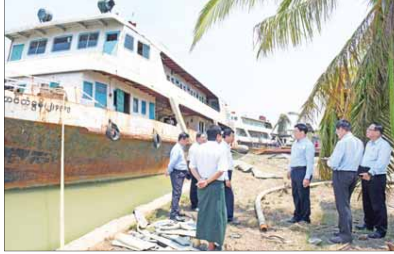
နိုင်ငံတော်စီမံအုပ်ချုပ်ရေးကောင်စီအဖွဲ့ဝင် ဒုတိယဝန်ကြီးချုပ်နှင့် ပြည်ထောင်စုဝန်ကြီး ဗိုလ်ချုပ်ကြီး တင်အောင်စန်းနှင့်အဖွဲ့ သင်္ဘောကျင်းများသို့ သွားရောက်၍ သဘာဝဘေးဒဏ်ကြောင့် ထိခိုက်ပျက်စီးမှုများကို ပြင်ဆင်ဆောင်ရွက်ရေး တာဝန်ရှိသူများအား မှာကြားစဉ်။

ပြည့်ဆည်းဆောင်ရွက်ပေးသည်။ ပေးအပ်လှူဒါန်း ယင်းနောက် အဘိုးအဘွားများအတွက် ဆန်၊ ဆီနှင့် အလှူငွေကျပ် သိန်း ၄၀ ကို ဘိုးဘွားရိပ်သာအသင်းဥက္ကဋ္ဌထံ ထောက်ပံ့ပေးအပ်ပြီး ဆေးဝါးနှင့် စားသောက်ဖွယ်ရာများကို အဘိုးအဘွား