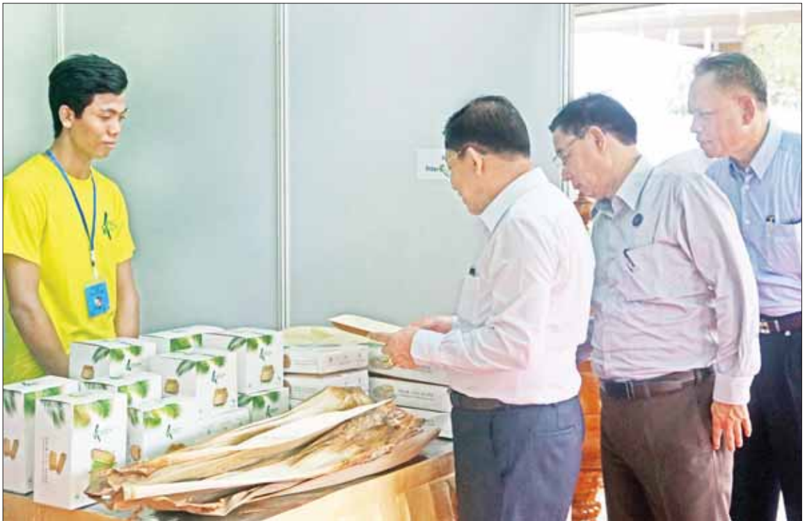
နိုင်ငံတော်စီမံအုပ်ချုပ်ရေးကောင်စီဥက္ကဋ္ဌ နိုင်ငံတော်ဝန်ကြီးချုပ် ဗိုလ်ချုပ်မှူးကြီး မင်းအောင်လှိုင်နှင့် အဖွဲ့ဝင်များ ခင်းကျင်းပြသထားသည့် ဒေသထွက်ကုန်ပစ္စည်းများကို စိတ်ဝင်တစား ကြည့်ရှုလေ့လာစဉ်။

အဆိုပါတွေ့ဆုံပွဲသို့ နိုင်ငံတော် စီမံအုပ်ချုပ်ရေးကောင်စီ ဥက္ကဋ္ဌ နိုင်ငံတော်ဝန်ကြီးချုပ်နှင့် အတူ ကောင်စီတွဲဖက် အတွင်းရေးမှူး ဒုတိယဗိုလ်ချုပ်ကြီး ရဲဝင်းဦး၊ ပြည်ထောင်စုဝန်ကြီးများ၊ ပဲခူး တိုင်းဒေသကြီး ဝန်ကြီးချုပ် ဦးမျိုးဆွေဝင်း၊ ကာကွယ်ရေးဦးစီး ချုပ်ရုံးမှ တပ်မတော်အရာရှိကြီး များ၊ တောင်ပိုင်းတိုင်းစစ်ဌာနချုပ် တိုင်းမှူး ဗိုလ်ချုပ်ထိန်ဝင်း၊ စာမျက်နှာ ၃ ကော်လံ ၁