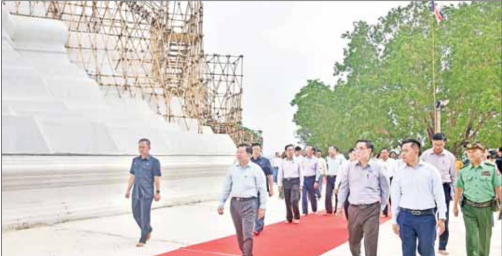
နိုင်ငံတော်စီမံအုပ်ချုပ်ရေးကောင်စီဥက္ကဋ္ဌ နိုင်ငံတော်ဝန်ကြီးချုပ် ဗိုလ်ချုပ်မှူးကြီး မင်းအောင်လှိုင်နှင့် အဖွဲ့ဝင်များ နှစ်ပေါင်း ၁၀၀၀ ကျော်သက်တမ်းရှိ သမိုင်းဝင် ကျောက်ပညာယုစေတီတော်မြတ်ကြီးအား ဖူးမြော်ကြည့်ပါစဉ် ပြုပြင်မွမ်းမံခြင်းလုပ်ငန်းများ ဆောင်ရွက်ပြီးစီးမှုကို ကြည့်ရှုစဉ်။

ဦးစွာ နိုင်ငံတော်စီမံအုပ်ချုပ်ရေးကောင်စီဥက္ကဋ္ဌ နိုင်ငံတော်ဝန်ကြီးချုပ်နှင့် အဖွဲ့ဝင်များသည် ပဲခူးမြို့ နယ် ဥဒယမြို့သစ် ပဲခူးတက္ကသိုလ်အနီးတွင် တည်ထားကိုးကွယ်သည့် နှစ်ပေါင်း ၁၀၀၀ ကျော် သက်တမ်းရှိဖြစ်သော သမိုင်းဝင် ကျောက်ပညာယု စေတီတော်မြတ်ကြီး ပြုပြင်မွမ်းမံခြင်းလုပ်ငန်း ဆောင်ရွက်ထားရှိမှုအခြေအနေများကို ကြည့်ရှုကာ စေတီတော်မြတ်ကြီးအား ပန်း၊ ရေချမ်း၊ ဆီမီးကပ်လှူပူဇော်သည်။ ယင်းနောက် နိုင်ငံတော်စီမံအုပ်ချုပ်ရေးကောင်စီဥက္ကဋ္ဌ နိုင်ငံတော်ဝန်ကြီးချုပ်နှင့် ဇနီးတို့က စေတီတော်ကြီးအတွက် ဘက်စုံအလှူငွေများကို ပေးအပ်လှူဒါန်းရာတွင်ဒေသကြီးဝန်ကြီးချုပ်က လက်ခံရယူသည်။