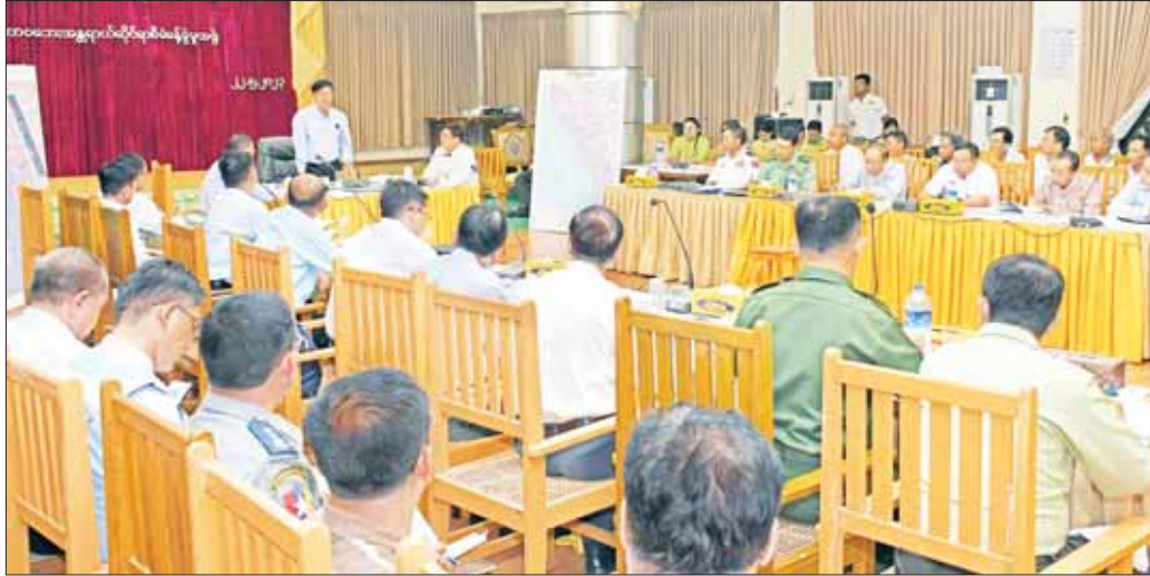
နိုင်ငံတော်စီမံအုပ်ချုပ်ရေးကောင်စီအဖွဲ့ဝင် ဒုတိယဗိုလ်ချုပ်ကြီး ဦးကျော်စွာနှင့် ပြည်ထောင်စုဝန်ကြီး ဗိုလ်ချုပ်ကြီး တင်အောင်စန်း ရခိုင်ပြည်နယ် သဘာဝဘေး ပြန်လည်ထူထောင်ရေးဆိုင်ရာ လုပ်ငန်းညှိနှိုင်းအစည်းအဝေးတွင် လမ်းညွှန်မှာကြားစဉ်။