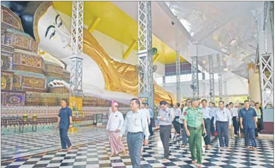
နိုင်ငံတော်စီမံအုပ်ချုပ်ရေးကောင်စီဥက္ကဋ္ဌ နိုင်ငံတော်ဝန်ကြီးချုပ် ဝိုလ်ချုပ်မျိုးကြီး မင်းအောင်လှိုင်နှင့်အဖွဲ့ဝင်များ ရွှေသာလောင်းရုပ်ပွားတော်မြတ်ကြီးအား လှည့်လည်ဖူးမြော်ကြည့်ညှိစဉ်။

မြန်မာသက္ကရာဇ် ၉၅၅ (အေဒီ ၁၅၁၅) ခုနှစ်တွင် ဘုရင့်နောင်မင်းတရားကြီးသည် ဟံသာဝတီဒေသ၌ အကျယ်အဝန်း ၃၄၀၀ စတုရန်းမီတာရှိကာ မြို့ရိုးပတ်လည် တစ်ဖက်တစ်ချက်စီတွင် မြို့တံခါး ငါးပေါက်ပါရှိပြီး စုစုပေါင်း မြို့တံခါး ၂၀ ဖြင့် တည်ဆောက်ထားသည့် ကြီးကျယ်ခမ်းနားသည့် နန်းတော်သစ်တစ်ခုကို တည်ဆောက်ခဲ့ပြီး "ကမ္ဘောဇသောဒီ" ဟု ခေါ်တွင်စေခဲ့ကြောင်း၊ မြန်မာသက္ကရာဇ်