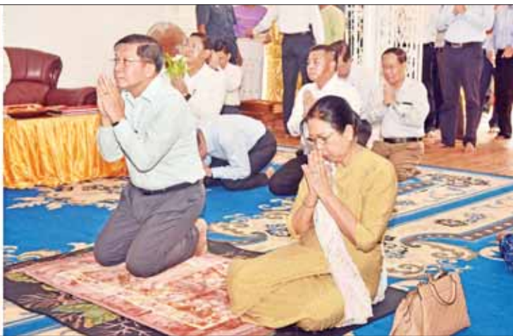
နိုင်ငံတော်စီမံအုပ်ချုပ်ရေးကောင်စီဥက္ကဋ္ဌ နိုင်ငံတော်ဝန်ကြီးချုပ် ဗိုလ်ချုပ်မှူးကြီး မင်းအောင်လှိုင်နှင့် ဇနီး ဒေါ်ကြူကြူလှ ဆုတောင်းပြည့်စွယ်တော်ရှင် မဟာစေတီမြတ်ကြီးအား ဖူးမြော်ကြည့်ညိစဉ်။