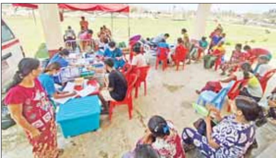
ရသေ့တောင်မြို့နယ် ကူတောင်တိုက်နယ်ဆေးရုံ ဆင်ဝင်အမိုးအောက်တွင် ဆေးခန်း ဖွင့်လှစ်ကုသပေးနေစဉ်။

နေပြည်တော် မေ ၂၂ ကျန်းမာရေးဝန်ကြီးဌာနသည် ဆိုင်ကလုန်း မုန့်တိုင်း မို့ခါဘေးအန္တရာယ် ကျရောက် သည့် ဒေသများတွင် မေ ၁၅ ရက်မှစတင်၍ ကျန်းမာရေး စောင့်ရှောက်မှုများကို ဆောင်ရွက်ပေးလျက်ရှိရာ ကျန်းမာရေး ဝန်ကြီးဌာနအောက်ရှိ နယ်လှည့်အထူးကု ဆေးအဖွဲ့များ၊ အရေးပေါ်တုံ့ပြန်ဆောင် ရွက်ရေးအဖွဲ့များနှင့် ဆေးအဖွဲ့များက တိုက်နယ်ဆေးရုံ၊ ကျေးလက်ကျန်းမာရေး ဌာန၊ ကျေးလက်ကျန်းမာရေးဌာနခွဲများ မှသည် ကျေးလက်ဒေသများသို့ ရောက်ရှိ သည့်အထိ ကွင်းဆင်းဆောင်ရွက်ခြင်း၊ ပြည်သူ့ဆေးရုံများတွင် ပြင်ပလူနာများ ကြည့်ရှုကုသခြင်း၊ အတွင်းလူနာများအား ကုသပေးခြင်းနှင့် ခွဲစိတ်ရန်လိုအပ်သည့် လူနာများအား ယာယီခွဲစိတ်ခန်းများ ဖွင့်လှစ်၍ ကုသပေးခြင်းများ ဆောင်ရွက် လျက်ရှိပါသည်။ ယင်းအပြင် နိုင်ငံတော် အကြီးအကဲ၏ လမ်းညွှန်ချက်နှင့်အညီ ကျန်းမာရေးကဏ္ဍ အခြေခံအဆောက် အအုံများ ပြန်လည်တည်ဆောက်ရေး လုပ်ငန်းများကို မိုးမကျမီကာလအတွင်း အထူးကြိုးစားဆောင်ရွက်လျက်ရှိပါသည်။