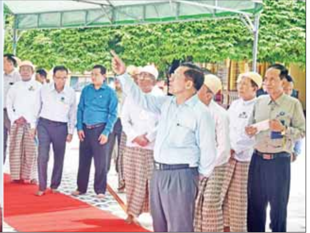
နိုင်ငံတော်စီမံအုပ်ချုပ်ရေးကောင်စီဥက္ကဋ္ဌ နိုင်ငံတော်ဝန်ကြီးချုပ် ဗိုလ်ချုပ်မှူးကြီး မင်းအောင်လှိုင်နှင့်အဖွဲ့ဝင်များ ရွှေမော်ဓောစေတီတော်မြတ်ကြီးအား လှည့်လည်ဖူးမြော်ကြည့်ပါစဉ်။