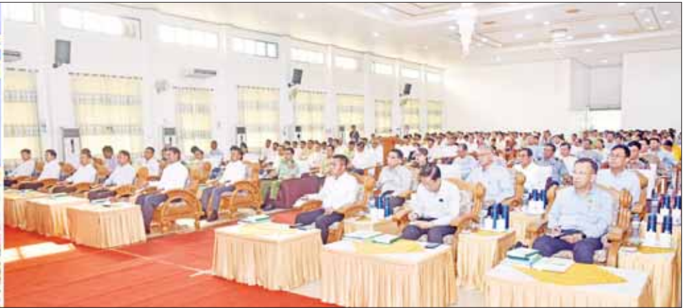
နိုင်ငံတော်စီမံအုပ်ချုပ်ရေးကောင်စီဥက္ကဋ္ဌ နိုင်ငံတော်ဝန်ကြီးချုပ် ဗိုလ်ချုပ်မှူးကြီး မင်းအောင်လှိုင် ပဲခူးတိုင်းဒေသကြီးအတွင်းရှိ အသေးစား၊ အငယ်စားနှင့် အလတ်စားစီးပွားရေး (MSME) လုပ်ငန်းရှင်များအား တွေ့ဆုံ၍ ဒေသဖွံ့ဖြိုးတိုးတက်ရေးဆိုင်ရာများနှင့် စီးပွားရေးလုပ်ငန်း ဖွံ့ဖြိုးတိုးတက်ရေးဆိုင်ရာများကို ဆွေးနွေးပြောကြားစဉ်။