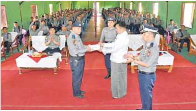
လေဘေးကယ်ဆယ်ရေးသို့ သွား ရောက်ကူညီမည့် မြန်မာနိုင်ငံ ရဲတပ်ဖွဲ့ အမှတ်(၄)ရဲလေ့ကျင့်ရေး သင်တန်းကျောင်းမှ ရဲတပ်ဖွဲ့ ၄၀၀

တောင်ကြီး မေ ၂၂ ရဲတပ်ဖွဲ့ဝင်များ တွေ့ဆုံ၍ အားကောင်းသော ဆိုင်ကလုနန်း ထောက်ပံ့ငွေများ ပေးအပ်ခဲ့ မှန်တိုင်း "မိုခါ" ဒဏ်ကြောင့် ကြောင်း သိရသည်။ မြန်မာနိုင်ငံ တိုင်းဒေသကြီးနှင့် ရှမ်းပြည်နယ် ဝန်ကြီးချုပ် ပြည်နယ်အချို့ ဒေသများတွင် ဦးအောင်ဇော်အေးက မှန်တိုင်း ပျက်စီးဆုံးရှုံးမှုများနှင့် ရင်ဆိုင်ခဲ့ ဒဏ်သင့်ခဲ့သည့် ဒေသများတွင် ရပြီး ကယ်ဆယ်ရေးနှင့် ပြန်လည် ထူထောင်ရေး လုပ်ငန်းများ ဆောင်ရွက်လျက်ရှိရာ ယနေ့ ရွက်ရာတွင် အင်အားများ လိုအပ် နံနက် ၇ နာရီက ရခိုင်ပြည်နယ် သောကြောင့် ရဲတပ်ဖွဲ့အနေဖြင့် လေဘေးကယ်ဆယ်ရေး အတွက် ကိုယ်စားပြု ပြန်လည် သွားရောက်မည့်ဖြစ်သည့်အတွက် ထူထောင်ရေး လုပ်ငန်းများတွင် လုပ်ငန်းတာဝန်ပြီးဆုံးသည်အထိ ပါဝင်ဆောင်ရွက်မည့် မြန်မာနိုင်ငံ ထိခိုက်မှုမရှိဘဲ အန္တရာယ်မရှိ ရဲတပ်ဖွဲ့ အမှတ်(၄)ရဲလေ့ကျင့်ရေး အောင်ဂရုစိုက်ဆောင်ရွက်ကြရန်၊ သင်တန်းကျောင်း တောင်လေး ကျန်းမာရေး ဂရုစိုက်ကြရန် လုံးကမ္ဘောဇခန်းမ၌ ရှမ်းပြည်နယ် ပြောကြားသည်။ ဝန်ကြီးချုပ် ဦးအောင်ဇော်အေးနှင့် ဆက်လက်၍ ရခိုင်ပြည်နယ်