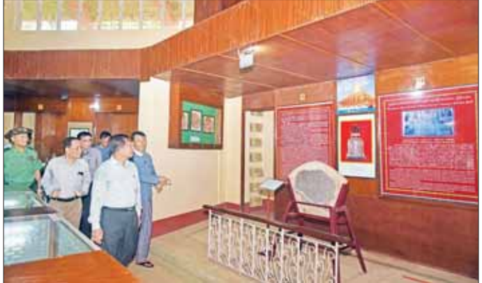
နိုင်ငံတော်စီမံအုပ်ချုပ်ရေးကောင်စီဥက္ကဋ္ဌ နိုင်ငံတော်ဝန်ကြီးချုပ် ဗိုလ်ချုပ်မှူးကြီး မင်းအောင်လှိုင် ရွှေမော်ဓောစေတီတော်သမိုင်းပြတိုက်အတွင်း ရှေးဟောင်းလက်ရာပစ္စည်းများကို ကြည့်ရှုစဉ်။

ယင်းနောက် နိုင်ငံတော်စီမံအုပ်ချုပ်ရေးကောင်စီဥက္ကဋ္ဌ နိုင်ငံတော်ဝန်ကြီးချုပ်နှင့် အဖွဲ့ဝင်များသည် ပဲခူးမြို့ မင်းရပ်ကွက်ရှိ ဒုတိယမြန်မာနိုင်ငံတော်ကြီးကို တည်ထောင်တော်မူခဲ့သော ဟံသာဝတီဆင်ဖြူများရှင် ဘုရင့်နောင်မင်းတရားကြီး ကိုယ်တော်တိုင် တည်ထားကိုးကွယ်ခဲ့သည့် ဆုတောင်းပြည့်စွယ်တော်ရှင် မဟာစေတီတော်မြတ်ကြီးသို့ ရောက်ရှိကြပြီး စေတီတော်မြတ်ကြီးအား ဖူးမြော်ကြည့်ပါကာ ပန်း၊ ရေချမ်း၊ ဆီမီး ကပ်လှူပူဇော်သည်။ ထို့နောက် စေတီတော်မြတ်ကြီးအတွက် ဘက်စုံအလှူငွေများကို ပေးအပ်လှူဒါန်းရာ ဂေါပကအဖွဲ့က လက်ခံရယူပြီး မွေလက်ဆောင်များပြန်လည်ပေးအပ်သည်။ ယင်းနောက် နိုင်ငံတော်စီမံအုပ်ချုပ်ရေးကောင်စီဥက္ကဋ္ဌ နိုင်ငံတော်ဝန်ကြီးချုပ်က စေတီတော်မြတ်ကြီး ဧည့်သည်တော်မှတ်တမ်း စာအုပ်တွင် လက်မှတ်ရေးထိုးပူဇော်သည်။