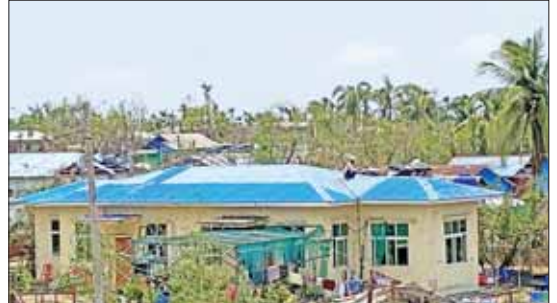
ရခိုင်ပြည်နယ် ပုဏ္ဏားကျွန်းမြို့နယ်ပြည်သူ့ဆေးရုံ နှစ်ခန်းတွဲ ဝန်ထမ်းအိမ်ရာ အမိုးပျက်စီးခြင်း ပြုပြင်ပြီးစဉ်။