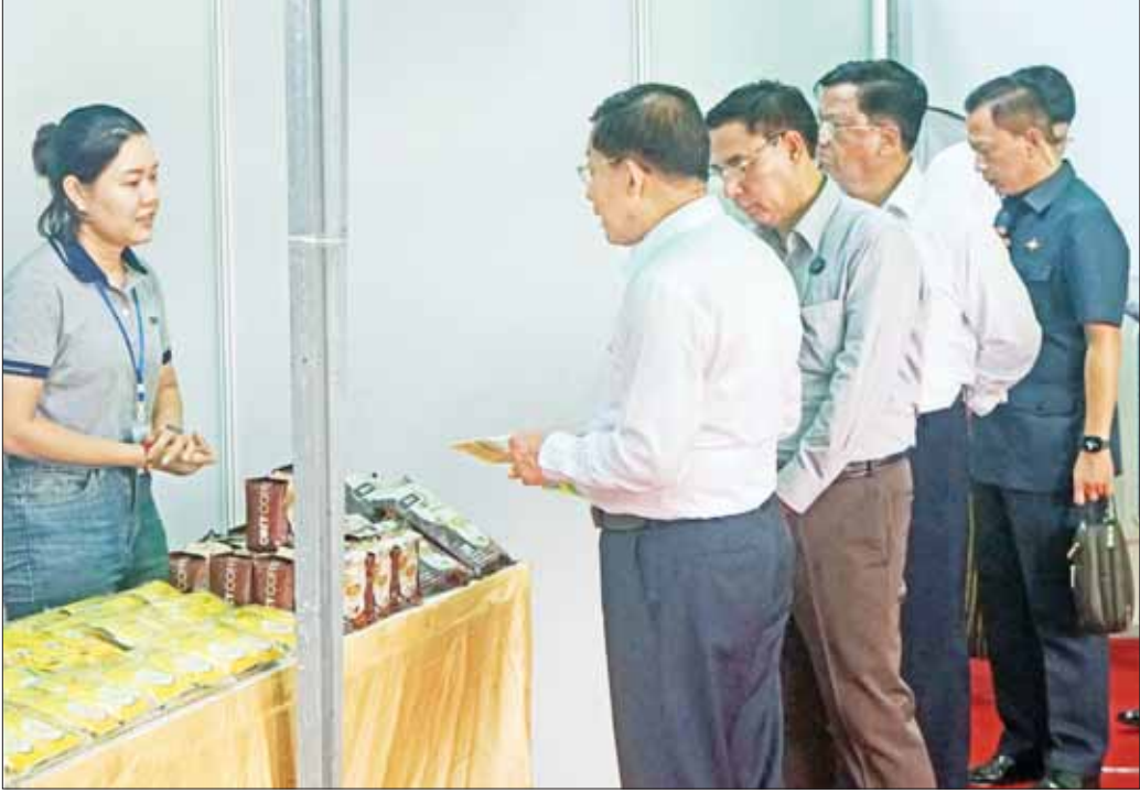
နိုင်ငံတော်စီမံအုပ်ချုပ်ရေးကောင်စီဥက္ကဋ္ဌ နိုင်ငံတော်ဝန်ကြီးချုပ် ဗိုလ်ချုပ်မှူးကြီး မင်းအောင်လှိုင်နှင့် အဖွဲ့ဝင်များ ခင်းကျင်းပြသထားသည့် ဒေသထွက်ကုန်ပစ္စည်းများကို စိတ်ဝင်တစား ကြည့်ရှုလေ့လာသည်။

MSME လုပ်ငန်းများအတွက် လိုအပ်သည့်ရင်းနှီးမတည်ငွေများကို မိမိတို့အနေဖြင့် သတ်မှတ်ချက်များနှင့်အညီ ထုတ်ချေးပေးလျက်ရှိကြောင်း၊ အလားတူ စိုက်ပျိုးမွေးမြူရေးလုပ်ငန်းများအတွက် လိုအပ်သည့် လူသားအရင်းအမြစ်များ လုံလောက်စွာ ရရှိစေရေး စိုက်ပျိုးမွေးမြူရေးနှင့် စက်မှုအထက်တန်းကျောင်း