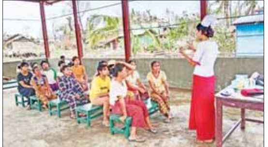
ကျောက်တော်မြို့နယ်တွင် ပတ်ဝန်းကျင်သန့်ရှင်းရေးနှင့် ကူးစက်ရောဂါ ကာကွယ် ရေးဆိုင်ရာ ကျန်းမာရေးပညာပေးခြင်းလုပ်ငန်းများ ဆောင်ရွက်စဉ်။

ကို အမြန်ဆုံး ပြင်ဆင်ဆောင်ရွက်ပြီးစီးခဲ့ ပါသည်။ ရခိုင်ပြည်နယ် ပေါက်တောမြို့နယ် ပေါက်တောမြို့နယ် ကျန်းမာရေး ဦးစီးဌာနမှ ဦးဆောင်သော အရေးပေါ် တုံ့ပြန်ရေး ဆေးအဖွဲ့များသည် ယမန် နေ့က အိမ်ခြေ ၆၃၀ခန့်ရှိသော ပေါက်တော မြို့နယ် သန်ချောင်းကျေးရွာသို့ ကွင်းဆင်းသွားရောက်ကာ ရေအရင်း အမြစ်များ၏ သန့်ရှင်းမှုအခြေအနေကို စိစစ်ခဲ့ပြီး အိမ်ခြေ ၃၀၀ စာ ရေသန့် ဆေးပြား ၃၀၀၀ ကို အိမ်တိုင်ရာရောက် လိုက်လံဝေငှခဲ့ပြီး ရွာလယ်ဇရပ်တွင် ရွာသူ/ရွာသား ၆၇ ဦးကို ကျန်းမာရေး ပညာပေးလုပ်ငန်းများ ဆောင်ရွက်ခဲ့ပါသည်။ ဆက်လက်၍ အိမ်ခြေ ၃၅၅ အိမ်ခန့် ရှိသော ပေါက်တောမြို့နယ် တောင်းဖူး ကျေးရွာသို့ ကွင်းဆင်းသွားရောက်ကာ ရေအရင်းအမြစ်များ၏ သန့်ရှင်းမှုအခြေ အနေကို စိစစ်ခဲ့ပြီး အိမ်ခြေ ၁၀၀ စာ ရေသန့်ဆေးပြား ၁၀၀၀ ကို အိမ်တိုင် ရာရောက် လိုက်လံဝေငှခဲ့ပြီး ကျေးရွာ စာကြည့်တိုက်တွင် ရွာသူ/ရွာသား ၆၅ ဦးကို ကျန်းမာရေးပညာပေးလုပ်ငန်း များ ဆောင်ရွက်ခဲ့ပါသည်။