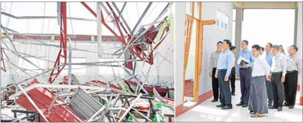
နိုင်ငံတော်စီမံအုပ်ချုပ်ရေးကောင်စီအဖွဲ့ဝင် ဒုတိယဝန်ကြီးချုပ်နှင့် ပြည်ထောင်စုဝန်ကြီး ဗိုလ်ချုပ်ကြီး တင်အောင်စန်းနှင့်အဖွဲ့ နည်းပညာတက္ကသိုလ်(စစ်တွေ) တွင် မုန်တိုင်းဒဏ်ကြောင့် ပျက်စီးသွားသည့် အဆောက်အအုံများကို ကြည့်ရှုစစ်ဆေးစဉ်။

မုန်တိုင်းဒဏ်ကြောင့်ပျက်စီးပျက်စီးနေသည့် စစ်တွေမြို့တွင် ပြည်နယ်၊ ခရိုင်၊ မြို့နယ်အဆင့် ဋ္ဌာနဆိုင်ရာဝန်ထမ်း ၃၃၀၊ မြန်မာနိုင်ငံ ရဲတပ်ဖွဲ့ဝင် ၁၀၀၀ ဦး၊ မြန်မာနိုင်ငံ မီးသတ်တပ်ဖွဲ့ဝင် ၃၇၈ ဦး၊ တပ်မတော်ကြည်းနှင့် ရေတိုမှ