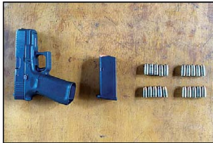
၁၂-၅-၂၀၂၃ ရက်တွင် စမ်းချောင်းမြို့နယ် လင်းလွန်းမြောက်ရပ်ကွက် ဇလွန်လမ်း ငါးလွှာ(A) အိမ်အမှတ် ၃၅ ဌာန သိမ်းဆည်းရမိသည့် လက်နက် /ခဲယမ်းများ။