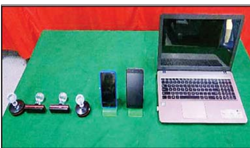
၁၂-၅-၂၀၂၃ရက်တွင် ဒဂုံမြို့သစ်(တောင်ပိုင်း)မြို့နယ် အမှတ်(၆၃)ရပ်ကွက် ရွှေတောင်ကြား ၅ လမ်း အိမ်အမှတ် ၉၆၄၀ ဌာန သိမ်းဆည်းရမိခဲ့သည့် ပစ္စည်းများ