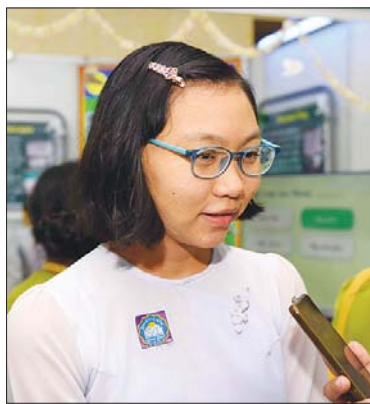
မဖြူဖြူစိုး

ထူးခြားချက်က ဒီညီလာခံကို တက် ရောက်လာတဲ့ ကိုယ်စားလှယ်တွေက အောက်ခြေအဆင့်ထိ ပါပါတယ်။ အပေါ် မှာ လုပ်နေရတဲ့ မူဝါဒချမှတ်သူတွေက အောက်ခြေမှာ ဘာဖြစ်နေတယ်ဆိုတာကို တစ်ခါတစ်ရံမှာ မသိကြပါဘူး။ ဒီမှာ အောက်ခြေဝန်ထမ်းက တင်ပြကြတော့ လူကြီးတွေကိုလည်း အသိပေးရာရောက် ပါတယ်။ တကယ်အကောင်အထည်ဖော် နေတဲ့သူက ဘယ်လိုဖြေရှင်းကြရင် ကောင်းမလဲဆိုပြီး လက်တွေ့ပိုဆန်လာပါ တယ်။ လက်တွေ့ဆန်လာရင် ပိုပြီး အကောင်အထည်ဖော်လို့ ရပါတယ်။ ဒီညီလာခံမှာ အခြေခံပညာနဲ့ ပတ်သက်