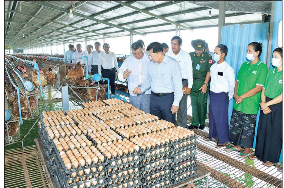
နိုင်ငံတော်စီမံအုပ်ချုပ်ရေးကောင်စီဥက္ကဋ္ဌ နိုင်ငံတော်ဝန်ကြီးချုပ် ဗိုလ်ချုပ်မှူးကြီး မင်းအောင်လှိုင် ညောင်နှစ်ပင် စိုက်ပျိုးမွေးမြူရေး အထူးဇုန်အတွင်း ကြည့်ရှုစစ်ဆေးစဉ်။