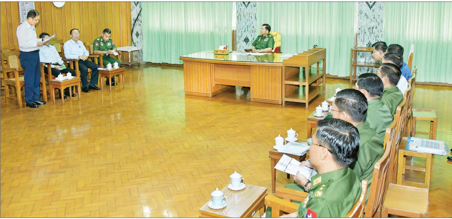
သဘာဝဘေးဒဏ်သင့်ခဲ့ရသည့် ဒေသများ၌ ကူညီကယ်ဆယ်ရေးနှင့် ပြန်လည်ထူထောင်ရေးလုပ်ငန်းများ ပိုမိုထိရောက်မြန်ဆန်စွာ ဆောင်ရွက်နိုင်ရေး ညှိနှိုင်းအစည်းအဝေးကျင်းပစဉ်။

ထို့နောက် ပြည်ထောင်စုဝန်ကြီးများ၊ ရန်ကုန်တိုင်းဒေသကြီး ဝန်ကြီးချုပ်၊ ကာကွယ်ရေးဦးစီးချုပ်ရုံးမှ တပ်မတော်အရာရှိကြီးများ၊ ရန်ကုန်တိုင်းစစ်ဌာနချုပ်တိုင်းမှူးတို့က ဘင်္ဂလားပင်လယ်အော်အတွင်း၌ ဖြစ်ပေါ်လျက်ရှိသည့် မုတ်သုံ (Monsoon) သည် မေလအတွင်း ရန်ကုန်တိုင်းဒေသကြီးနှင့် မြန်မာနိုင်ငံအလယ်ပိုင်းတို့သို့ ဆက်လက်ဝင်ရောက်လာနိုင်မည့်အခြေအနေများ၊ တပ်မတော်(ကြည်း၊ ရေ၊ လေ) မိသားစုများ၊ စေတနာရှင် အလှူရှင်များက လှူဒါန်းသည့် စားသောက်ဖွယ်ရာများ၊ ကူညီထောက်ပံ့ရေးပစ္စည်းများ၊ အမျိုးသားသဘာဝဘေးအန္တရာယ်