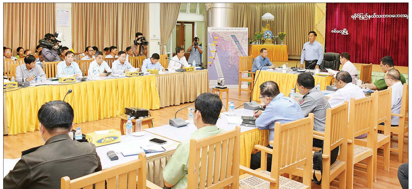
နိုင်ငံတော်စီမံအုပ်ချုပ်ရေးကောင်စီအဖွဲ့ဝင် ဒုတိယဝန်ကြီးချုပ်နှင့် ပြည်ထောင်စုဝန်ကြီး ဗိုလ်ချုပ်ကြီး တင်အောင်စန်း သဘာဝဘေးပြန်လည် ထူထောင်ရေးဆိုင်ရာ လုပ်ငန်းညှိနှိုင်းအစည်းအဝေးတွင် အမှာစကားပြောကြားစဉ်။

ကျေးရွာများသို့ အမြန်ပေးပို့ ထောက်ပံ့ရေးညှိနှိုင်း မှာကြား သည်။ ထို့နောက် စစ်တွေမြို့ ဆိပ်ကမ်းသို့ ရောက်ရှိနေသည့် စစ်ရေယာဉ်(မုတ္တမ) ပေါ်မှ ထောက်ပံ့ရေး ပစ္စည်းများအား သက်ဆိုင်ရာမြို့နယ်များသို့ ပေးပို့ ရန် သယ်ယူပို့ဆောင်နေမှုကို ကြည့်ရှုစစ်ဆေးကာ ပစ္စည်း သယ်ချမှုပိုမိုမြန်ဆန်ရေး လိုအပ် သောအင်အား ထပ်မံဖြည့်တင်း ဆောင်ရွက်ရန် စီစဉ်မှာကြားခဲ့ သည်။ ထို့နောက် ဗိုလ်ချုပ်ကြီး တင်အောင်စန်းနှင့် အဖွဲ့သည်