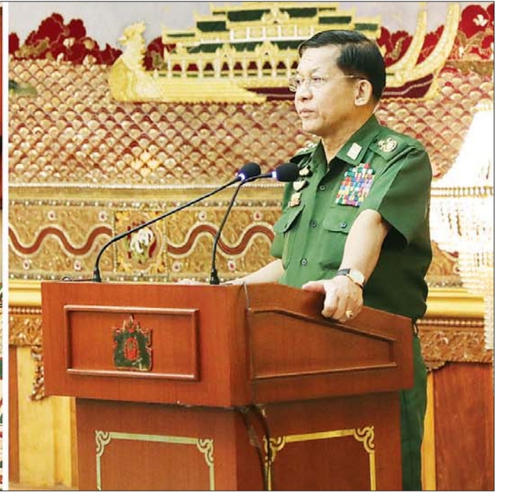
နိုင်ငံတော်စီမံအုပ်ချုပ်ရေးကောင်စီဥက္ကဋ္ဌ နိုင်ငံတော်ဝန်ကြီးချုပ် ဗိုလ်ချုပ်မှူးကြီး မင်းအောင်လှိုင် သဘာဝဘေးဒဏ်သင့်ခဲ့ရသည့် ဒေသများ၌ ကူညီကယ်ဆယ်ရေးနှင့် ပြန်လည်ထူထောင်ရေးလုပ်ငန်းများ ဆောင်ရွက်ရာတွင် အသုံးပြုနိုင်ရေး အလှူငွေများ ပေးအပ်လှူဒါန်းပွဲတွင် အမှာစကားပြောကြားစဉ်။