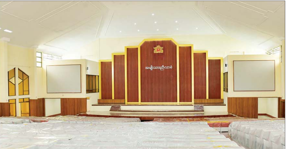
နိုင်ငံတော်စီမံအုပ်ချုပ်ရေးကောင်စီဥက္ကဋ္ဌ နိုင်ငံတော်ဝန်ကြီးချုပ် ဗိုလ်ချုပ်မှူးကြီး မင်းအောင်လှိုင် အမျိုးသားညီလာခံကျင်းပခဲ့သည့် ပြည်ထောင်စုခန်းမအဆောက်အဦအတွင်း ပြုပြင်ထိန်းသိမ်းထားမှုများ လှည့်လည်ကြည့်ရှုစစ်ဆေးစဉ်။