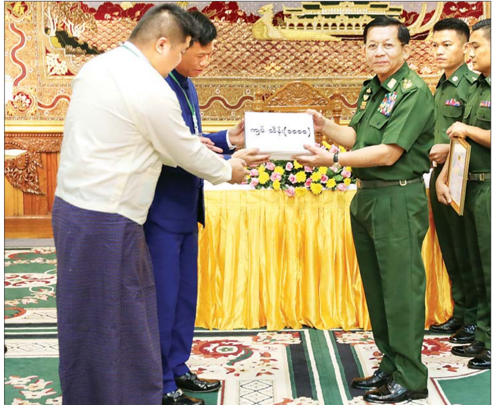
နိုင်ငံတော်စီမံအုပ်ချုပ်ရေးကောင်စီဥက္ကဋ္ဌ နိုင်ငံတော်ဝန်ကြီးချုပ် ဗိုလ်ချုပ်မှူးကြီး မင်းအောင်လှိုင် သဘာဝဘေးဒဏ်သင့်ခဲ့ရသည့်ဒေသများ၌ ကူညီကယ်ဆယ်ရေးနှင့် ပြန်လည်ထူထောင်ရေးလုပ်ငန်းများ ဆောင်ရွက်ရာတွင် အသုံးပြုနိုင်ရေးအတွက် စေတနာရှင်၊ အလှူရှင်များက လှူဒါန်းသည့် အလှူငွေများကို လက်ခံရယူစဉ်။