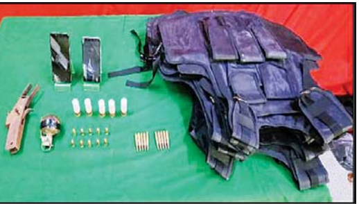
၁၂-၅-၂၀၂၃ ရက်တွင် မြောက်ဥက္ကလာပမြို့နယ် အမှတ်(၁)ရပ်ကွက် သုမိတ္တာ ၁၀ လမ်း အိမ်အမှတ် ၄၀၇ ဌာန သိမ်းဆည်းရမိခဲ့သည့် လက်နက်/ခဲယမ်း နှင့် ဆက်စပ်ပစ္စည်းများ ။