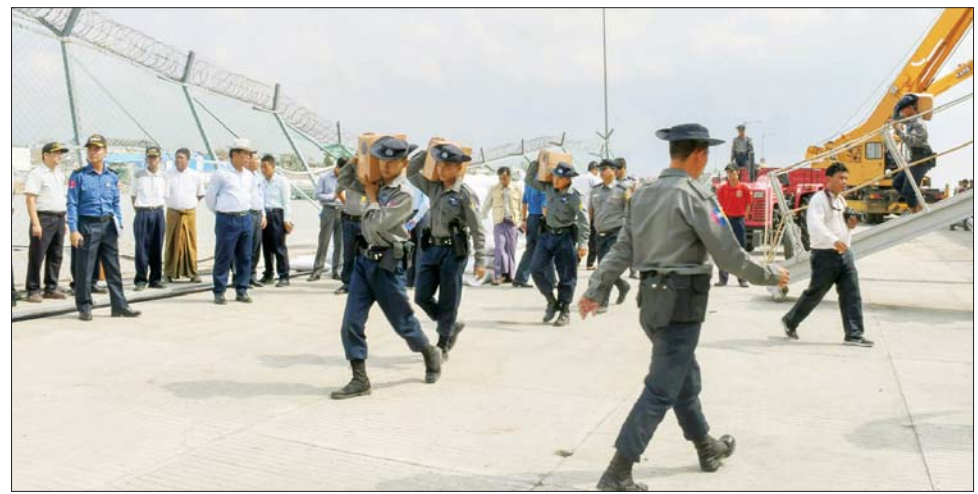
နိုင်ငံတော်စီမံအုပ်ချုပ်ရေးကောင်စီအဖွဲ့ဝင် ဒုတိယဝန်ကြီးချုပ်နှင့် ပြည်ထောင်စုဝန်ကြီး ဗိုလ်ချုပ်ကြီး တင်အောင်စန်း စစ်ရေယာဉ်(မုတ္တမ)ပေါ်မှ ထောက်ပံ့ရေးပစ္စည်းများ သက်ဆိုင်ရာမြို့နယ်များသို့ ပေးပို့ရန် သယ်ယူပို့ဆောင်နေမှုကို ကြည့်ရှုစစ်ဆေးစဉ်။