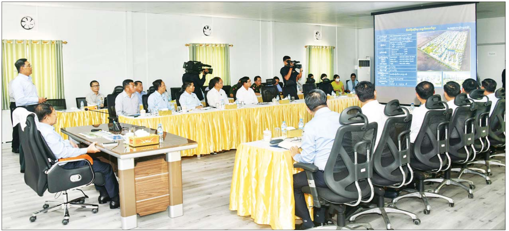
နိုင်ငံတော်စီမံအုပ်ချုပ်ရေးကောင်စီဥက္ကဋ္ဌ နိုင်ငံတော်ဝန်ကြီးချုပ် ဗိုလ်ချုပ်မှူးကြီး မင်းအောင်လှိုင် အား ပြည်ထောင်စုဝန်ကြီး ဦးမျိုးသန့်က လှည်းကူးမြို့နယ် ညောင်နှစ်ပင်ကျေးရွာအနီးရှိ Korea- Myanmar Industrial Complex(KMIC) စီမံကိန်းဆောင်ရွက်မှု အခြေအနေများ ရှင်းလင်းတင်ပြစဉ်။

နေပြည်တော် မေ ၂၀ နိုင်ငံတော် စီမံအုပ်ချုပ်ရေးကောင်စီဥက္ကဋ္ဌ နိုင်ငံတော်ဝန်ကြီးချုပ် ဗိုလ်ချုပ်မှူးကြီး မင်းအောင်လှိုင်သည် ခရီးစဉ်တွင် လိုက်ပါလာသည့် အဖွဲ့ဝင်များ၊ ရန်ကုန်တိုင်းဒေသကြီး ဝန်ကြီးချုပ် ဦးစိုးသိန်း၊ ရန်ကုန်တိုင်းစစ်ဌာနချုပ် တိုင်းမှူးနှင့် တာဝန်ရှိသူများလိုက်ပါ၍ ယနေ့မွန်းလွဲပိုင်းတွင် ရန်ကုန်တိုင်းဒေသကြီးလှည်းကူးမြို့နယ် ညောင်နှစ်ပင်ကျေးရွာအနီးရှိ Korea-Myanmar Industrial Complex(KMIC) စီမံကိန်း ဆောင်ရွက်ရန်လျာထားမှု အခြေအနေများကို သွားရောက်ကြည့်ရှုစစ်ဆေးသည်။