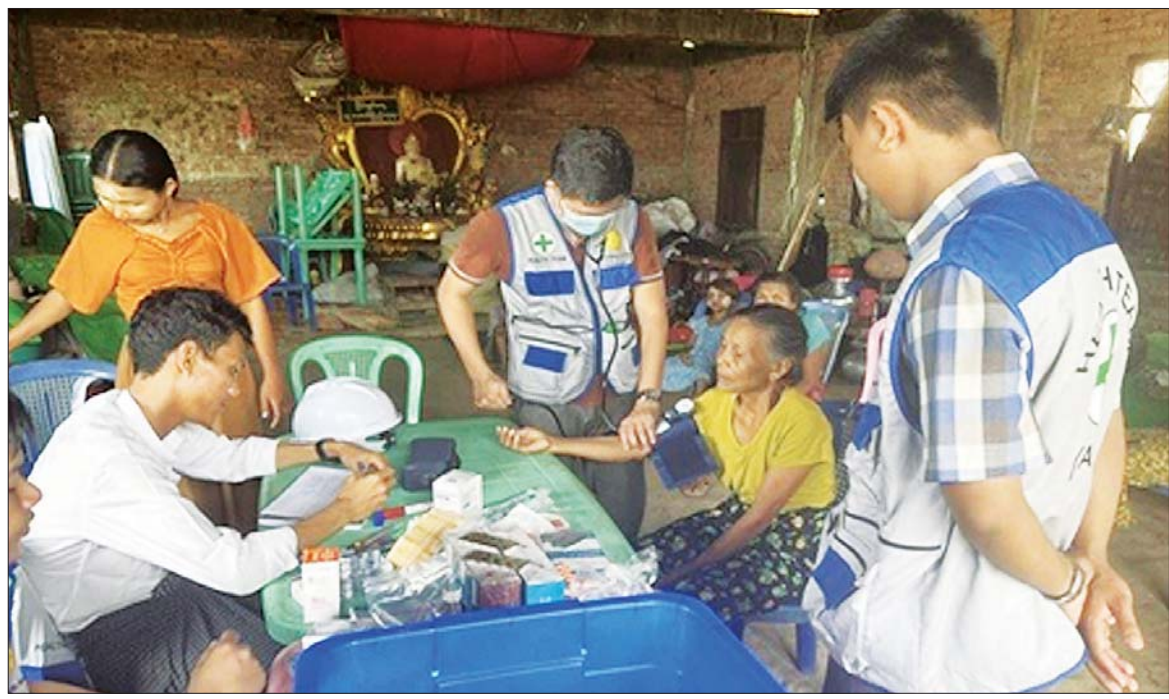
ရခိုင်ပြည်နယ် ရသေ့တောင်မြို့နယ်ရှိ လေဘေးသင့်ပြည်သူများအား မေ ၁၇ ရက်က ကျန်းမာရေးစောင့်ရှောက်မှုလုပ်ငန်းများ ဆောင်ရွက်ပေးစဉ်။

စစ်တွေ မေ ၂၀ ကျန်းမာရေးဝန်ကြီးဌာနသည် မိုခါမုန်တိုင်း ဘေးအန္တရာယ်ကျရောက်မှုနှင့် စပ်လျဉ်း၍ ဘင်္ဂလားပင်လယ်အော်အတွင်း၌ မုန်တိုင်းသတင်းရရှိသည့် အချိန်ကပင်စတင်၍ တိုင်းဒေသကြီး/ပြည်နယ်/ခရိုင်/မြို့နယ် ပြည်သူ့ကျန်းမာရေးနှင့် ကုသရေးဦးစီးဌာနမှူးများ၊ ဆေးရုံအုပ်ကြီးများနှင့် လုပ်ငန်းညှိနှိုင်းအစည်းအဝေးများကို နေ့စဉ်ကျင်းပ ဆောင်ရွက်ခဲ့ပြီး ကြိုတင်ပြင်ဆင်မှုများအား တိုင်းဒေသကြီး/ပြည်နယ်အဆင့်၊ ခရိုင်အဆင့်၊ မြို့နယ်အဆင့်မှ ကျေးလက်ဒေသအဆင့်အထိ ရောက်ရှိစေ၍ ဖြစ်ပေါ်လာမည့် ဘေးအန္တရာယ်ကိုကြိုကြိုခိုင်ကာ ကျန်းမာရေးဝန်ထမ်းများနှင့် လူနာများ ဘေးအန္တရာယ်ကင်းရေး၊ နိုင်ငံတော်ပိုင်ပစ္စည်းများ ပျက်စီးဆုံးရှုံးမှုအနည်းဆုံးဖြစ်ရေး၊ ဘေးအန္တရာယ် ကျရောက်