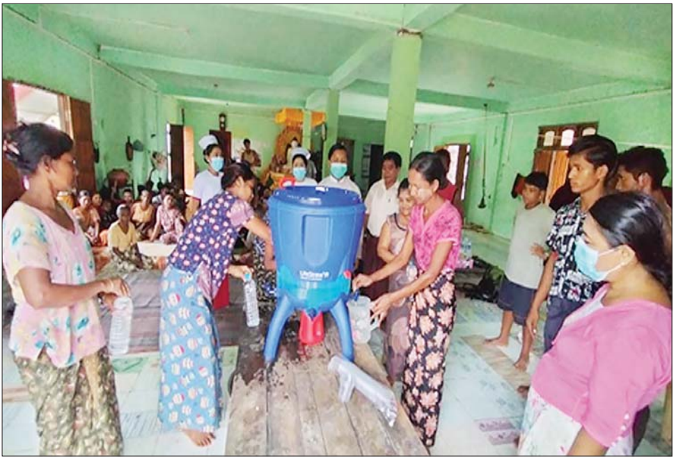
မေ ၂၀ ရက်က ရခိုင်ပြည်နယ် မင်းပြားမြို့နယ်ရှိ လေဘေးသင့်ပြည်သူများ ရေစစ်ပုံး အသုံးပြုနေစဉ်။

ရေကောင်းရေသန့်များ စဉ်ဆက်မပြတ်ရရှိစေရေး အတွက် ရေစစ်ပုံးများကို တပ်ဆင်ခြင်းနှင့် အသုံးပြုပုံ ကို ပညာပေးခြင်း၊ ရပ်ရွာများတွင် လှည့်လည်၍ လက်ကိုင်စစ်ကာများဖြင့် ကျန်းမာရေးအသိပညာ မြှင့်တင်ခြင်း၊ သွေးလွန်တုပ်ကွေး အပါအဝင် ကူးစက် ရောဂါများမဖြစ်ပွားစေရေးအတွက် ရောဂါကာကွယ် ရေးလုပ်ငန်းများ ဆောင်ရွက်ခြင်း၊ ထိခိုက်ဒဏ်ရာများ ကို ကုသမှုပေးခြင်း၊ အထွေထွေရောဂါများအတွက် ဆေးကုသမှုပေးခြင်းနှင့် လိုအပ်ပါက ပြည်သူ့ဆေးရုံ များသို့ ညွှန်ပို့၍ ကုသမှုပေးခြင်းတို့ကို ဆောင်ရွက် ပေးလျက် ရှိပါသည်။