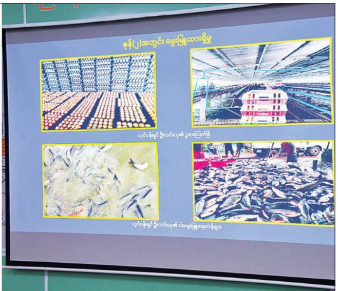
နိုင်ငံတော်စီမံအုပ်ချုပ်ရေးကောင်စီဥက္ကဋ္ဌ နိုင်ငံတော်ဝန်ကြီးချုပ် ဗိုလ်ချုပ်မှူးကြီး မင်းအောင်လှိုင် အား ရန်ကုန်တိုင်းဒေသကြီး ဝန်ကြီးချုပ် ဦးစိုးသိန်းက ညောင်နှစ်ပင် စိုက်ပျိုး မွေးမြူရေး အထူးဇုန်အတွင်း စိုက်ပျိုးမွေးမြူရေး ဆောင်ရွက်ထားရှိမှု အခြေအနေများ ရှင်းလင်းတင်ပြစဉ်။

ရှင်းလင်းတင်ပြ ဦးစွာ နိုင်ငံတော်စီမံအုပ်ချုပ် ရေးကောင်စီဥက္ကဋ္ဌ နိုင်ငံတော် ဝန်ကြီးချုပ်အား ညောင်နှစ်ပင် စိုက်ပျိုးမွေးမြူရေး အထူးဇုန် အစည်းအဝေးခန်းမတွင် ရန်ကုန် တိုင်းဒေသကြီး ဝန်ကြီးချုပ် ဦးစိုးသိန်းနှင့် တာဝန်ရှိသူများက ညောင်နှစ်ပင် စိုက်ပျိုးမွေးမြူရေး အထူးဇုန် သမိုင်းအကျဉ်း၊ ဇုန် အတွင်း စိုက်ပျိုးရေးနှင့် မွေးမြူရေး လုပ်ငန်းများကို အပိုင်းလိုက်ခွဲခြား ဆောင်ရွက်ထားရှိမှု၊ ဇုန်အလိုက် စိုက်ပျိုးရေးနှင့် မွေးမြူရေး လုပ်ငန်းများ ဆောင်ရွက်လျက် ရှိမှုနှင့် အသီးအနှံများ၊ အသား၊ နွားနို့နှင့် ဥများ ထုတ်လုပ်ရောင်းချ ပေးနိုင်မှု၊ ၂၀၂၂ ခုနှစ် ဇွန်လတွင် လာရောက်ခဲ့သည့် နိုင်ငံတော်စီမံ အုပ်ချုပ်ရေးကောင်စီ ဥက္ကဋ္ဌ နိုင်ငံတော် ဝန်ကြီးချုပ်၏ လမ်းညွှန်မှာကြားချက်များအပေါ် အကောင်အထည်ဖော်ဆောင်ရွက် လျက်ရှိမှု၊ ရန်ကုန်တိုင်းဒေသကြီး အတွင်း တစ်လအတွင်းနှင့် တစ်နှစ် အတွင်း အသား၊ ငါး ထုတ်လုပ်နိုင် မှုနှင့် စားသုံးနိုင်မှု ပျမ်းမျှစစ်တမ်း အရ တွက်ချက်ထားရှိမှု၊ စိုက်ပျိုး