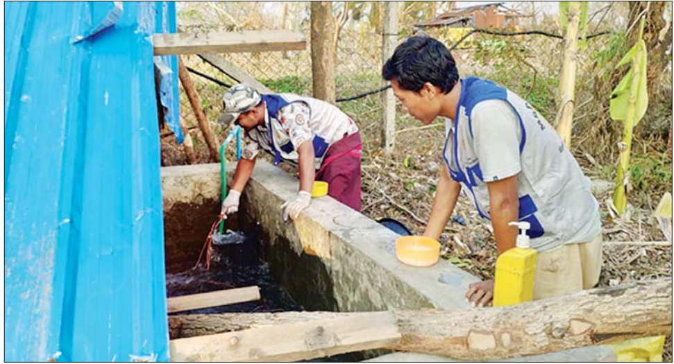
မေ ၁၉ ရက်က ရခိုင်ပြည်နယ် ပုဏ္ဏားကျွန်းမြို့နယ်တွင် ကျန်းမာရေးဝန်ထမ်းများက ရေကန်အတွင်း ကလိုရင်းဆေးခတ်ပေးစဉ်။

ဆေးအဖွဲ့များအနေဖြင့် မင်းပြားမြို့နယ်တွင် ဆေးအဖွဲ့ ရှစ်ဖွဲ့၊ ရသေ့တောင်မြို့နယ်တွင် ဆေးအဖွဲ့ နှစ်ဖွဲ့၊ ပုဏ္ဏားကျွန်းမြို့နယ်တွင် ဆေးအဖွဲ့ ခုနစ်ဖွဲ့၊ ပေါက်တောမြို့နယ်တွင် ဆေးအဖွဲ့ နှစ်ဖွဲ့၊ မာန်အောင် မြို့နယ်တွင် ဆေးအဖွဲ့ ရှစ်ဖွဲ့၊ မြေပုံမြို့နယ်တွင် ဆေး အဖွဲ့ ၁၁ ဖွဲ့၊ ကျောက်ဖြူမြို့နယ်တွင် ဆေးအဖွဲ့ ကိုးဖွဲ့၊ ရမ်းဗြဲမြို့နယ်တွင် ဆေးအဖွဲ့ သုံးဖွဲ့တို့သည် သက်ဆိုင်ရာမြို့နယ် ကျန်းမာရေးဦးစီးဌာနမှူးများ ဦးဆောင်သည့် မြို့နယ်ပြည်သူ့ကျန်းမာရေးဝန်ထမ်း များနှင့်အတူ ပူးပေါင်း၍ ပြည်သူ့လူထုအတွင်း ဝမ်းပျက်ဝမ်းလျှောရောဂါများ မဖြစ်ပွားစေရေး အတွက် သောက်ရေကန်၊ သုံးရေကန်များနှင့် ရေတွင်းရေကန်များအား ကလိုရင်းဆေးခတ်ခြင်း၊ မှန်တိုင်းဘေးအန္တရာယ် ကျရောက်ပြီးနောက်