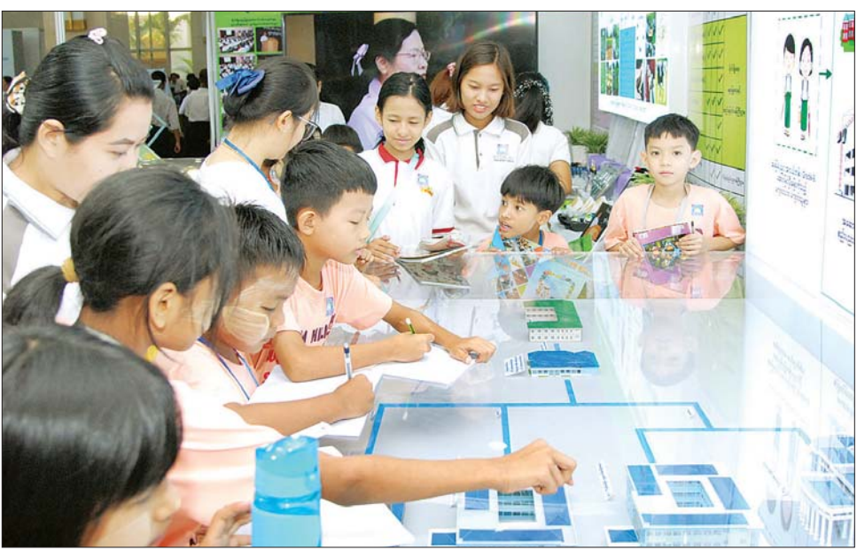
ကျောင်းသား ကျောင်းသူလေးများ ခင်းကျင်းပြသထားသည့် ပြခန်းများအား စိတ်ပါဝင်စားစွာ ကြည့်ရှုလေ့လာကြစဉ်။

မြန်မာနိုင်ငံလုံးဆိုင်ရာ ပညာရေးညီလာခံ (၂၀၂၃) တွင် ခင်းကျင်းပြသထားသည့် ပြခန်းများအား စိတ်ပါဝင်စားစွာ လာရောက်လေ့လာကြစဉ်။